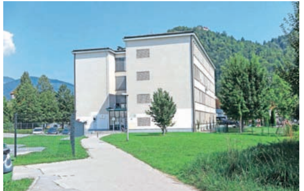
Osnovna šola Frana Albrehta je že več kot desetletje požarno, potresno in prostorsko neprimerna za pouk.

»S soglasjem svetnikov je občina postavila vse temelje za objavo javnega razpisa za izvajalca gradbenih del in nadzor, tako da se zdaj resnično lahko veselimo začetka gradnje,« nam je povedal podžupan, ki je svetnikom na seji predstavil dolgo zgodovino tega projekta in tudi kriterije, po katerih so se lotili racionalizacije, ki je stroške gradnje znižala na slabih 18 milijonov evrov, kar pa že vključuje omenjene stroške za projekte. »Ključni dve zahtevi racionalizacije z naše strani sta bili, da ohranimo obstoječe gradbeno dovoljenje in da ne poslabšamo bistveno pogojev izobraževalnega procesa. Ocenov stroškov smo tako znižali z izbiro materialov za stavbno pohištvo, racionalizacijo elementov akustike, elektro inštalacij in strojnih inštalacij,