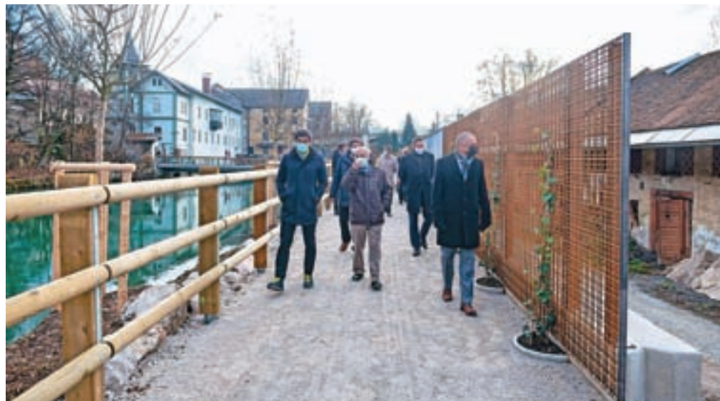
V Majdičevem logu je nova kranjska sprehajalna pot, ki je hkrati tudi kolesarska povezava med starim mestom ter zelenimi površinami ob Savi in nakupovalnim središčem. Prejšnji teden si je pridobitev ogledal tudi kranjski župan Matjaž Rakovec.

V pravkar odprtem Majdičevem logu, novi sprehajalni in kolesarski povezavi med starim mestom ter zelenimi površinami ob Savi in nakupovalnim središčem, so obrežje zasadili z avtohtonim obvodnim