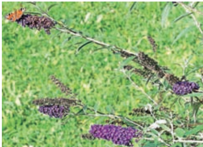
Socvetja metuljnika z dnevnim pavlinčkom

belini. Privlačni so cvetovi še drugih vrtnih rastlin, kot so cinija, homulica, grobeljnik, pečnik, posončnica, sporiš ali verbena, špajka. Ta čas seveda ne bomo mogli posajati na naših vrtovih omenjenih