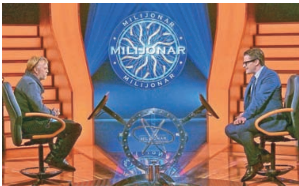
Danes zvečer bomo na vročem stolu lahko spremljali znane obraze, med njimi tudi Matjaža Javšnika.