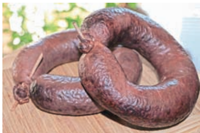
Krvavica je vrsta sveže klobase, ki je enim ljuba, drugi pa je nikakor ne marajo. Stvar okusa pač.

ponovno »zaživeli«, se bo delavnico tudi za splošno javnost, saj o divjačini večičil za tako izobraževalno na ve bore malo. (Konec)