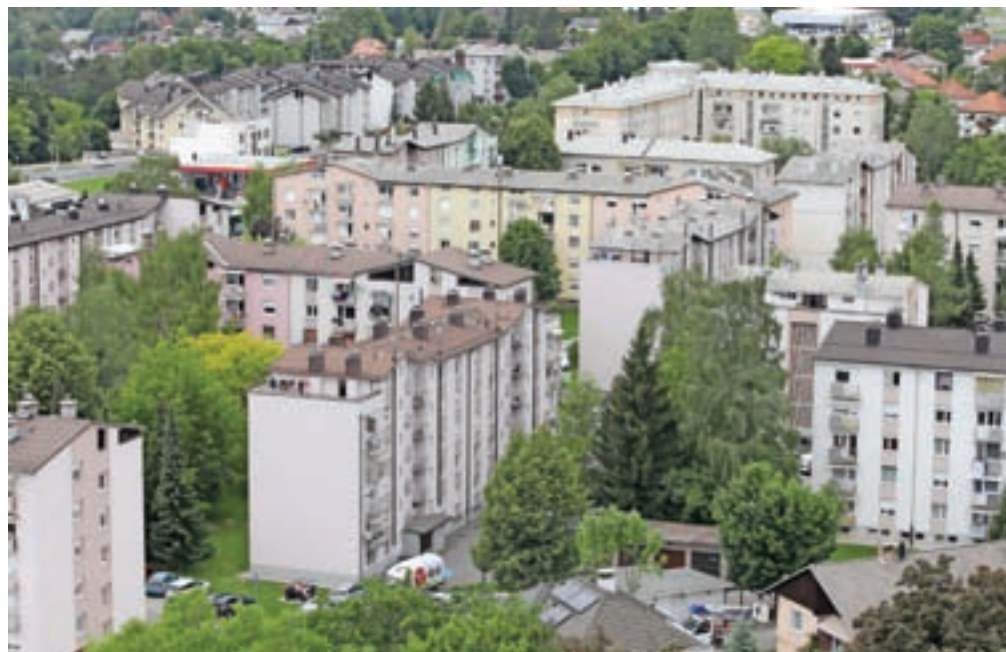
Kako bo na nepremičninski trg vplival drugi val epidemije, je težko napovedati, na Gursu pa menijo, da hitrega padca cen stanovanj ni pričakovati.

Največji upad transakcij je bil aprila, ko je bilo gospodarstvo vključno z nepremičninsko dejavnostjo oz. ogledi nepremičnin ves mesec ustavljeno. V primerjavi s »predkoronskim« februarjem je bilo število sklenjenih kupoprodaj manjše kar za 57 odstotkov in za skoraj toliko tudi njihova skupna vrednost, v primerjavi z lanskim aprilom lani pa je bilo število poslov manjše za skoraj 65 odstotkov, njihova vrednost pa za skoraj 60. A že junija je število sklenjenih pogodb znova doseglo februarско raven oz. je bilo povsem primerljivo z junijem 2019. »Še nepopolni podatki za letošnje tretje četrtletje kažejo, da se je rast števila nepremičninskih poslov nadaljevala, tako da je bil nepremičninski trg razmeroma dejaven oz. je