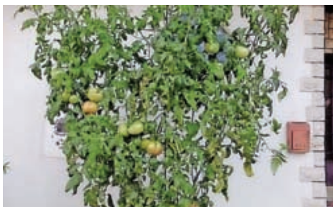
Paradižnik, ki ga ima Cveto Stanonik pred svojo hišo, zori tudi v teh hladnih novembrskih dneh.

znanjem kot pomembno kulturno dediščino,« je povedal Cveto Stanonik, ki nam je pred kratkim poslal tudi fotografijo svojega paradižnika. »V teh hladnih novembrskih dneh še vedno zori, a rdečih plodov si ne obetam več veliko,« je sklenil sogovornik.