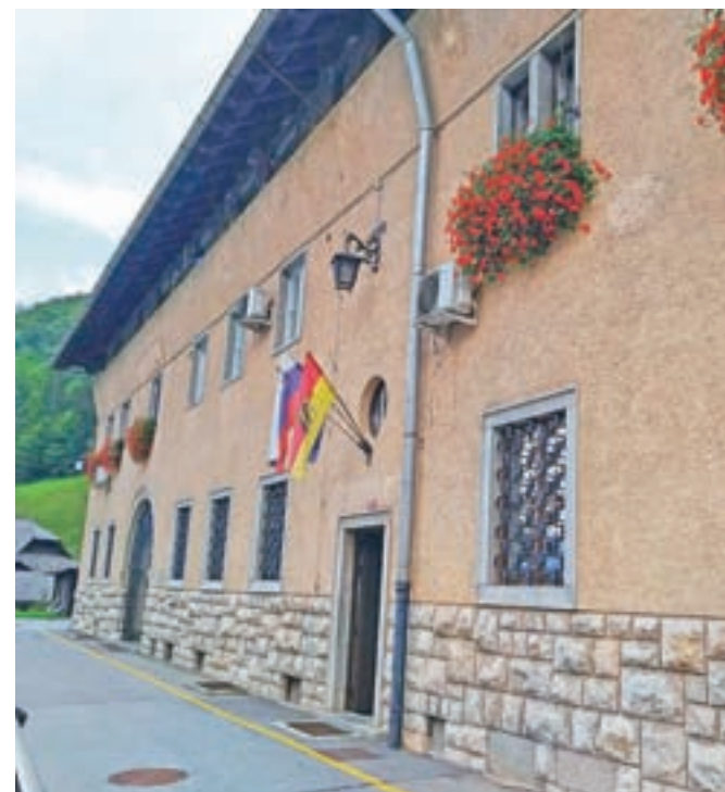
Kulturni dom v Kropi je tudi po sedmih desetletjih še vedno središče družabnega dogajanja v kraju.