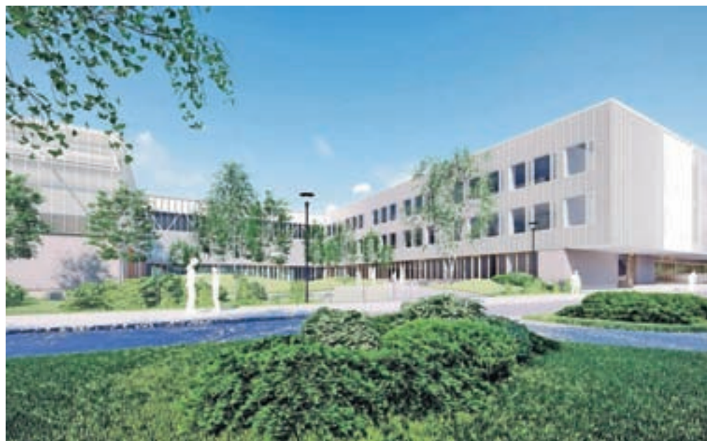
► 10. stran Novo Osnovno šolo Frana Albrehta bodo začeli graditi prihodnje leto.

Občinski svetniki so namreč soglasno potrdili investicijski program za prvo fazo gradnje novega šolskega objekta s športno dvorano in zunanjo ureditvijo.