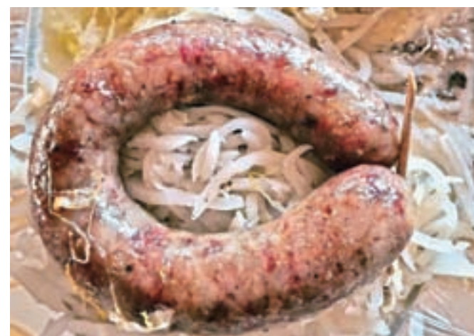
H kožarici se lepo podata tako repa kot zelje.

Udeležencem so zastavili tudi uganko: ločiti so morali meso navadne ovce od divje, ki jo poznamo pod imenom muflon, se hudomušno nasmehe Peljhanova in še doda: »Ni bilo lahko!« Upa, da ko se bo življenje vrnilo v stare tirnice ali se vsaj približno normaliziralo in bomo