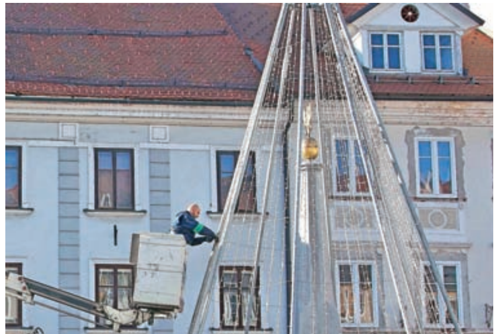
V Kranju so za postavitve praznične razsvetljave in božično-novoletnih dreves poskrbeli že prejšnji teden, lučke pa bodo prižgali v četrtek.

V Radovljici obljublajo, da bodo tudi letos kljub omejitvam poskrbeli za čarobni december. Mesto je že okrašeno, lučke pa bodo prižgali danes popoldan, ko si bo na spletu mogoče ogledati tudi kratek, vnaprej pripravljen posnetek dogodka. Tudi letos so staro mestno jedro okrasili na temo ene od starih radovljiških obrti; lani so se posvetili kolesom in kolarstvu, letos pa pletarski obrti. Naravnemu smrečju, ki je osnova celotne okrasitve mesta, so namreč dodali pletenje iz vrbja. Pletarstvo ima v Radovljici močne korenine, saj je bila državna pletarska šola leta 1908