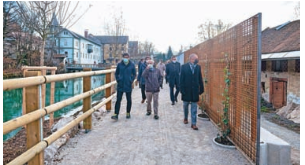
V Majdičevem logu je nova kranjska sprehajalna pot, ki je hkrati tudi kolesarska povezava med starim mestom ter zelenimi površinami ob Savi in nakupovalnim središčem. Prejšnji teden si je pridobitev ogledal tudi kranjski župan Matjaž Rakovec.

V pravkar odprtem Majdičevem logu, novi sprehajalni in kolesarski povezavi med starim mestom ter zelenimi površinami ob Savi in nakupovalnim središčem, so obrežje zasadili z avtohtonim obvodnim