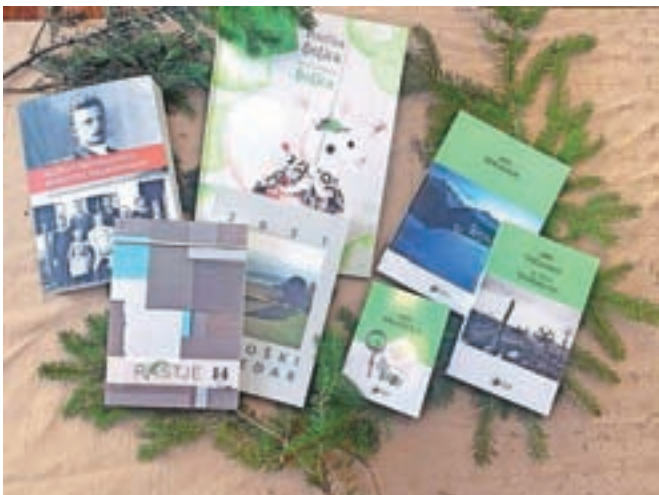
Knjige, ki sta jih novembra izdali Mohorjeva založba in Slovenska prosvetna zveza iz Celovca

Celovec – Pred skoraj sto petdeset leti so pred božičnimi prazniki na slovenske domove v Sloveniji in v slovensko govorečem delu Koroške prihajale »mohorjank«, knjige, ki jih je izdajala najstarejša in danes še delujoča slovenska založba Mohorjeva družba oziroma Mohorjeva založba iz Celovca, kasneje pa njene sestrške družbe v Celju in Gorici. V začetku dvajsetega stoletja je bilo prejemnikov celovških »mohorjank« bližju 100.000. Najbolj slavne knjige so bile tradicionalni Koledarji, Pratique in Slovenske večernice, v katerih so bile običajno objavljene med ljudmi najbolj iskane zgodbe slovenskih pisateljev. Po drugi svetovni vojni so se Mohorjevim knjigam pridružile še knjige, ki jih je kot