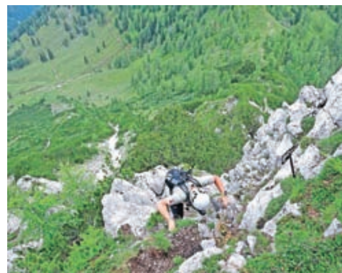
Z grebena proti Hajnževemu sedlu pogled na planino Korošica

Ljubeljska Baba postreže z enkratnim razgledom: v vsej svoji divjosti se pokaže severno ostenje grebena Košute; Tolsta Košuta, Košutnikov turn, Ostrv, Tegoška gora, Kladivo in Veliki vrh. Vmes je le Hajnževo sedlo, na katero bomo sestopili. Pogled