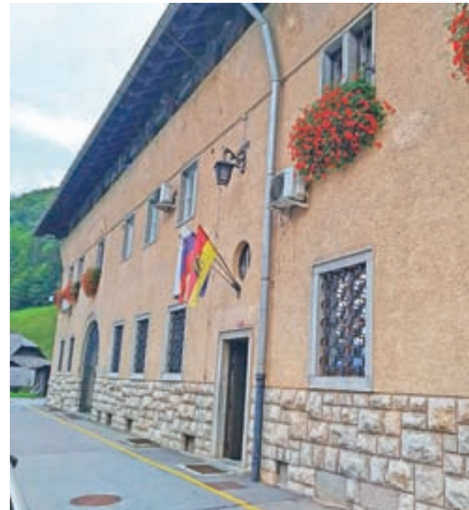
Kulturni dom v Kropi je tudi po sedmih desetletjih še vedno središče družabnega dogajanja v kraju.