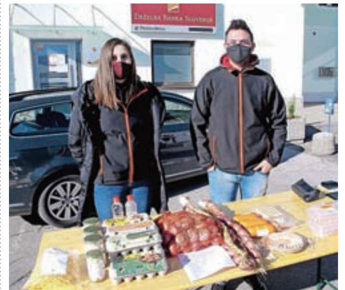
Kmetija Galjot, po domače Pr' Tomažič iz Lahovč, je ponudila domači krompir, čebulo, jajca, izdelke iz piščančereje ...