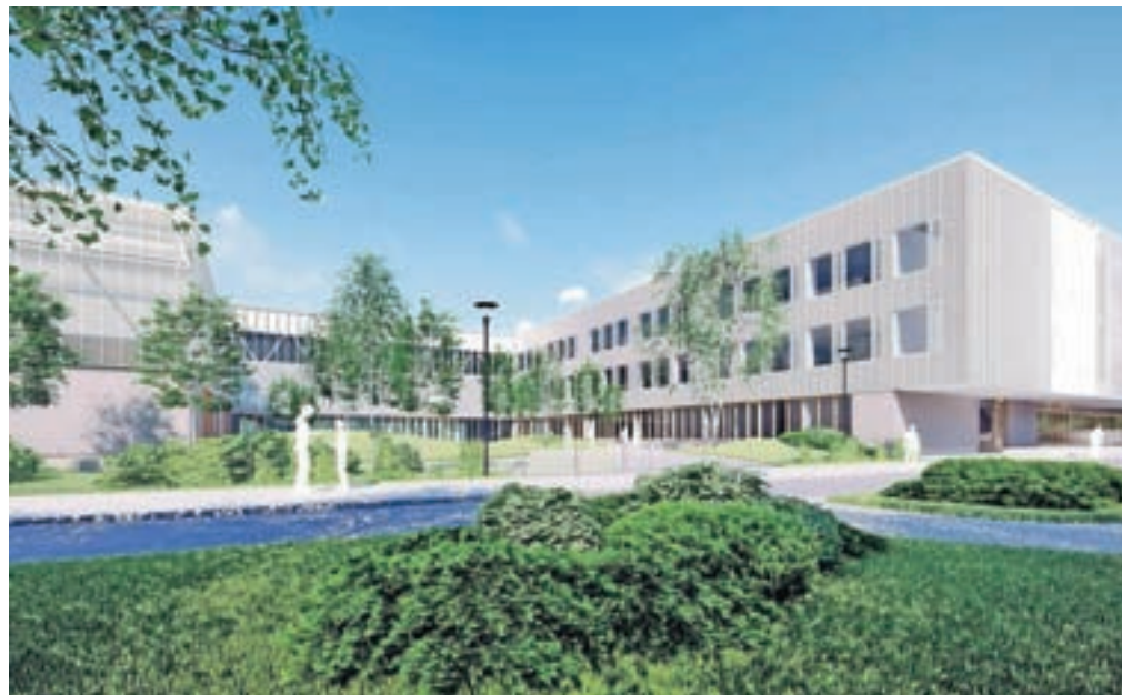
► 10. stran Novo Osnovno šolo Frana Albrehta bodo začeli graditi prihodnje leto.

Občinski svetniki so namreč soglasno potrdili investicijski program za prvo fazo gradnje novega šolskega objekta s športno dvorano in zunanjo ureditvijo.