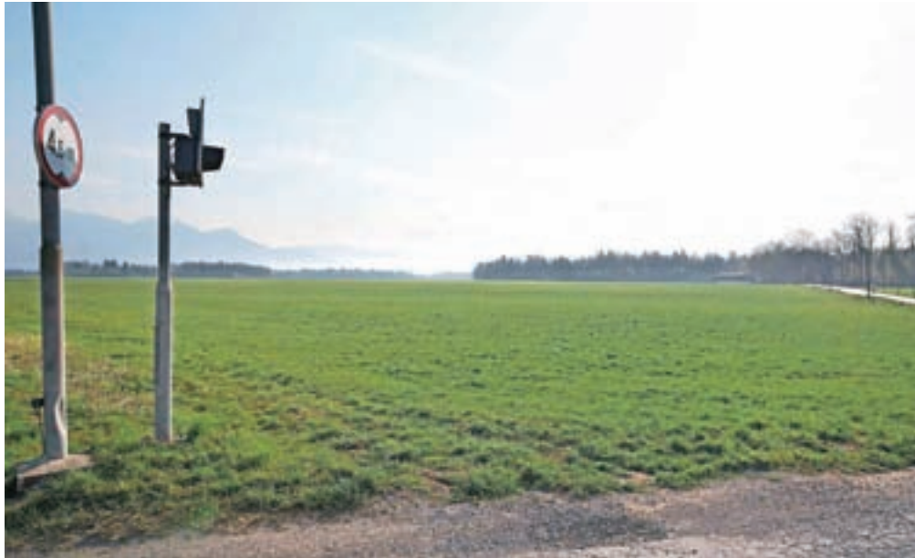
Predlagani zakon bo med drugim omogočil združitev solastnine kmetijskih zemljišč, ki je nastala v denacionalizacijskih postopkih.

Po novem odobritev pravnega posla ne bo potrebna tudi v primeru prodaje manj kot 200 kvadratnih metrov velikega kmetijskega zemljišča ali gozda. Pri prometu z zaščitnimi kmetijami (med živimi) ne bo več omejitev, sodišče bo preverjalo status zaščitene kmetije le še v postopku dedovanja. Ker naj bi v zakonu črtali določbo o statusu kmeta, bodo za dajanje kmetijskih zemljišč v zakup kmetom uporabljali definicijo kmeta, ki določa, da je kmet tisti, ki ima v upravljanju najmanj