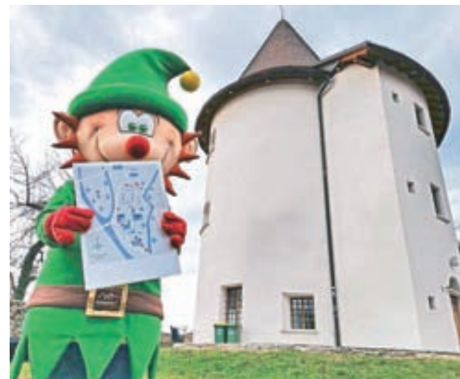
Škrat Kranček z zemljevidom z namigi, ki lahko pripeljejo do nagrade