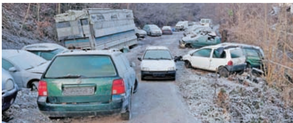
Izvršba se je v petek začela, vendar je bila prekinjena, ker je kršitelj izvajalcem fizično onemogočil dostop, so pojasnili na občinski upravi.

Kot še opozarjajo krajanje, nakopičena odslužena vozila niso nevarna samo zaradi struge vodotoka. »Še bolj je ogroženo okolje zaradi nevarnih odpadkov, kot so akumulatorji, odpadno olje, druge tekočine, gume in podobno,« še opozarjajo v Kamni Gorici, kjer se bojijo, da bo tudi potem, ko se bodo vozila odstranila, obstajala možnost, da se enaka situacija ponovi na kakšnem drugem delu radovljiške ali kakšne druge občine.