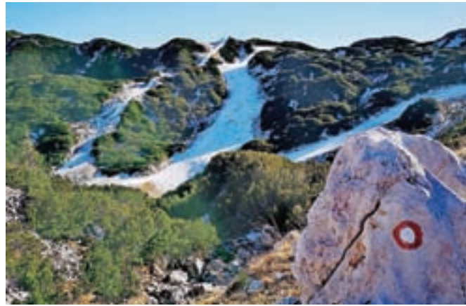
Na Voglu so odvisni od naravnega snega, zato nestrno pričakujejo tudi obilnejše padavine.

Kot pravi, glede na finančno zahtevno leto in dejstvo, da je situacija zaradi ukrepov