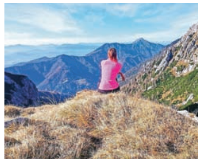
Uživanje malo nad Kokrškim sedlom – na soncu s pogledom na Storžič in Julijce nekje v daljavi

užila večerne obrise Skute in Štruce, zjutraj pa se bosta prebudila ob razgledih na Veliko Planino in dolino Kamniške Bistrice. Pa drugič, sem si trdno obljubila in v koledarju že označila