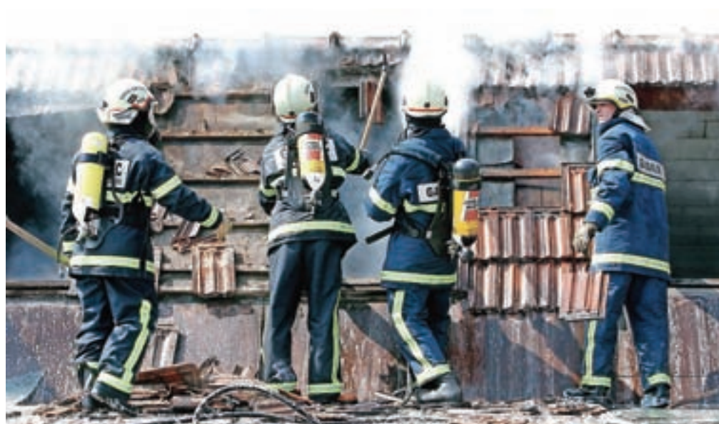
Gasilci se na naš klic v sili odzovejo v nekaj minutah, zdaj prosijo nas, da si vzamemo od dve do tri minute časa za donacijo dohodnine gasilskim društvom.

Odpovedana so bila tudi vsa tradicionalna tekmovanja, druženja in prireditve, s katerimi gasilska društva zbirajo denar za nakup