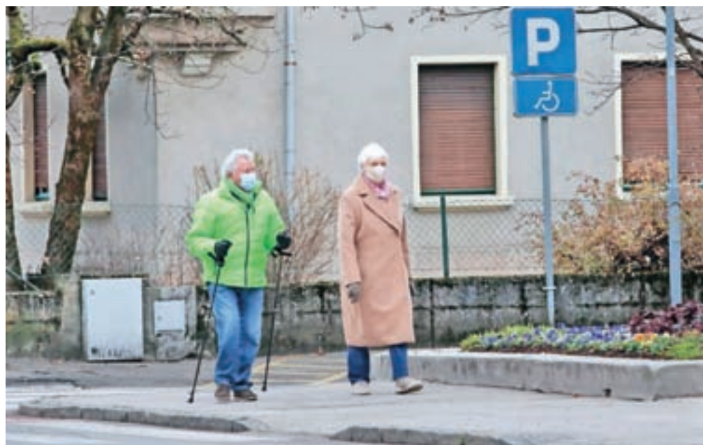
Gorenjska statistična regija je število okužb več kot prepolovila. Vredno je upoštevati že osnovne preventivne ukrepe, kot so nošenje zaščitnih mask, higiena rok in medosebna varnostna razdalja. Slika je simbolična.