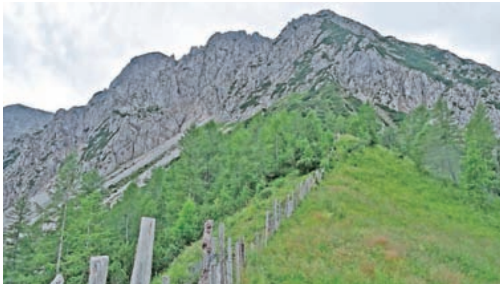
Pogled na Ljubeljsko Babo z Dovjakovega sedla

do planine. No, do kočje je še približno 20 minut pretežno zložne hoje. Malce pred kočjo zavijemo levo in po markirani poti nadaljujemo proti grebenu oz. meji z Avstrijo. Dosežemo ograjo. Markirana pot se začne vzpenjati na Ljubeljsko Babo, mi pa ograjo prečimo in na drugi strani nadaljujemo po markirani poti proti izrazitemu Dovjakovemu sedlu, ki ga vidimo v daljavi. Še enkrat prečimo ograjo in sledimo markacijam vse do sedla. Vrh, ki ga vidimo na levo strani, je Lokovnikov Grintovec. Na glavo si damo čelado, saj se podajamo v svet, ki je krušljiv in