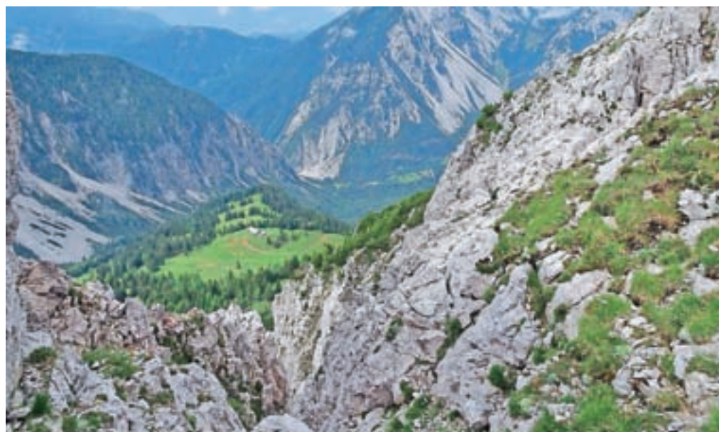
Detajl s poti. Izpostavljeno, a v pomoč je tudi klin. Na celi poti sta dva.

Nadmorska višina: 1968 m Višinska razlika: 1000 m Trajanje: 6 ur Zahtevnost: ★★★★★