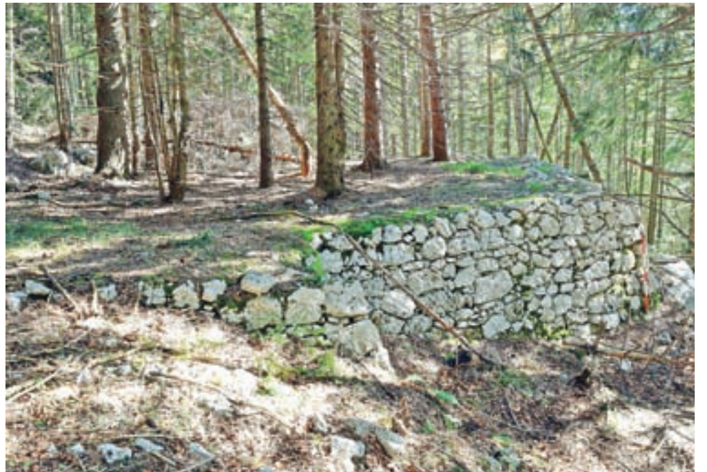
Ena izmed postaj žičnice čez Vršič

kultur, narodov in verstev, ki je bil nato izbran na razpisu republiške Javne agencije za raziskovalno dejavnost, ki projekt prav tako sofinancira. Vodja projekta je dr. Košir, ki opravlja tudi vsa strokovna raziskovanja. Ob tem poziva vse, ki imate