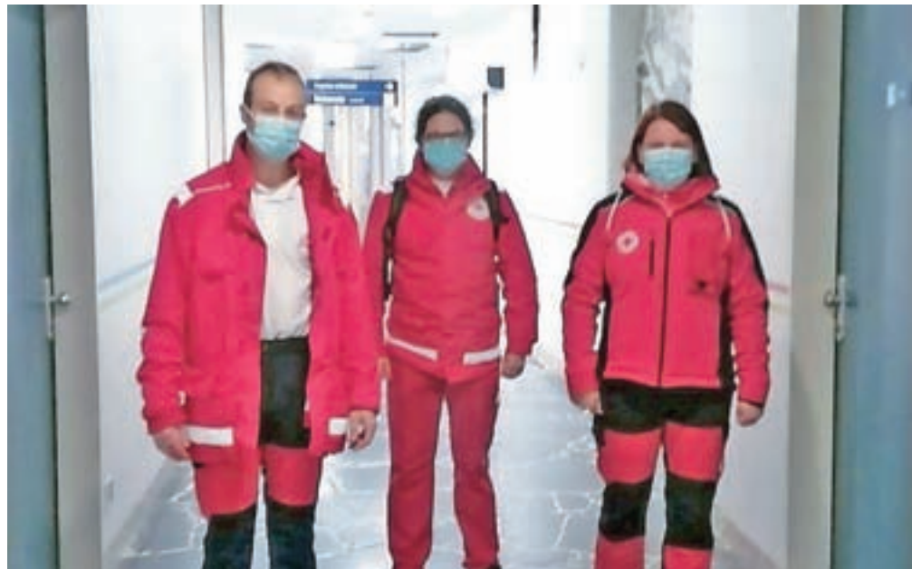
Bolničarji Rdečega križa Gorenjske regije so dobili poziv za pomoč na covidskih oddelkih v Kliniki Golnik.