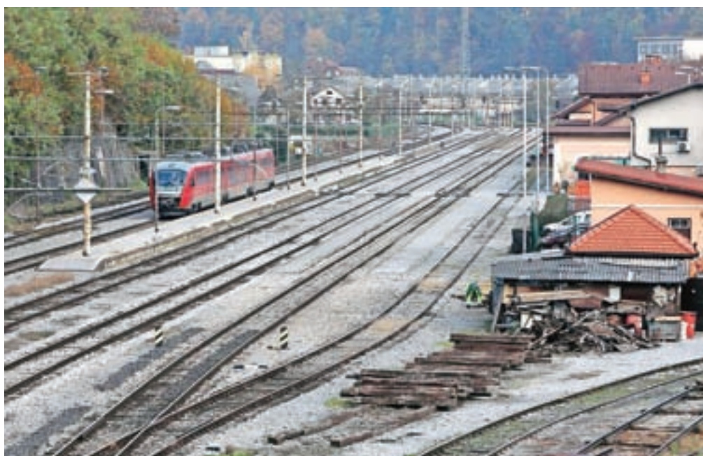
► 6. stran Vlaki med Kranjem in Jesenicami kar sedem mesecev ne bodo vozili.

Investitor del je Direkcija za infrastrukturo, dela v skupni vrednosti skoraj 96 milijonov evrov z DDV pa bo izvedla vrsta slovenskih gradbincev.