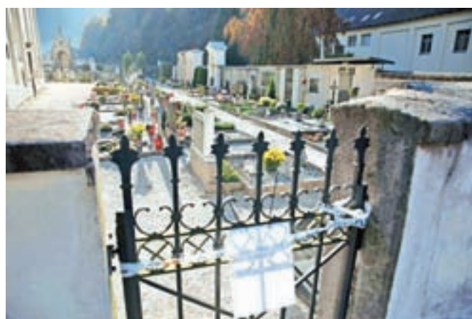
Zaprto pokopališče v Železnikih, ki je samevalo tudi ob 1. novembru 1990, a tedaj zaradi velikih poplav.