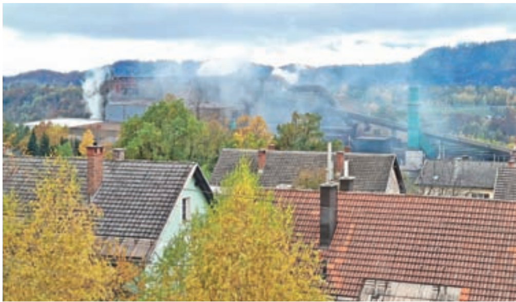
Krajani so fotografirali enega od nenadzorovanih izpustov prahu iz podjetja SIJ Acroni.

»Težava je v tem, da se v teh oblakih prahu nahajajo težke kovine, ki so rakotvorne,« pravi ena od krajanek.