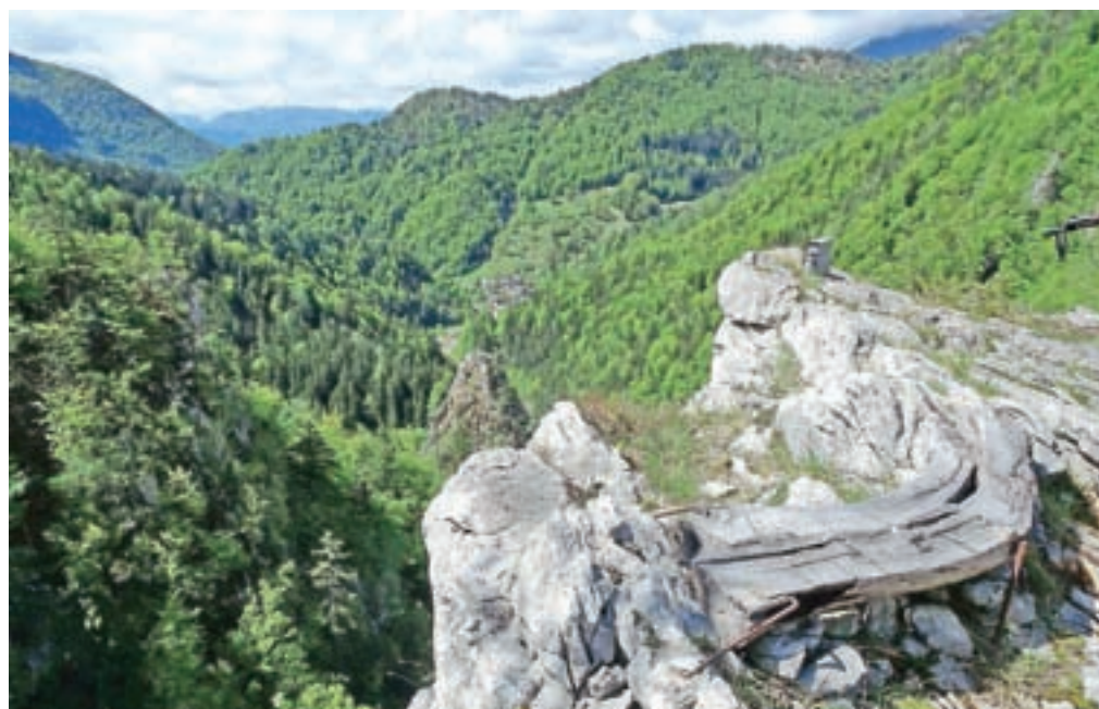
Vrh Kušpergarjevega turna; spodaj levo pa vidimo Turn, ki ima križ in smo ga dobro videli z razpotja kolovozov.

Nadmorska višina: 750 m Višinska razlika: 250 m Trajanje: 1 ura in 30 min Zahtevnost: ★★★★★ (orientacija)