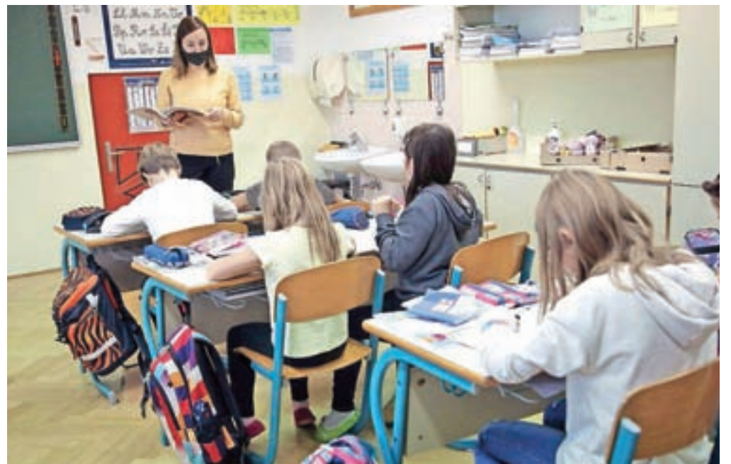
Šolska ministrica dr. Simona Kustec je povedala, da podaljšanje počitnic za osnovnošolce za en teden ne pomeni, da bo podaljšano šolsko leto, ampak bodo te dneve nadomestili znotraj šolskega leta. Slika je simbolična.

ponujanja in prodajanja blaga in storitev potrošnikom dodala še nekaj izjem. Delujejo lahko knjižnice in družbe za upravljanje, dovoljena so gradbena, vzdrževalna in montažna dela, dimnikarske storitve ter določene storitve na prostem, kot so vrtnarske. Odprte so lahko servisne delavnice, v katerih opravljajo popravila in vzdrževanje tehničnega blaga. Pri vseh je treba upoštevati strokovna priporočila NIJZ.