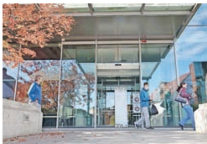
V Mestni knjižnici Kranj je možen osebni prevzem vnaprej naročenega gradiva: v njenih krajevnih knjižnicah po običajnem obratovalnem času, v Knjižnici Globus pa od ponedeljka do petka med 10. in 18. uro.