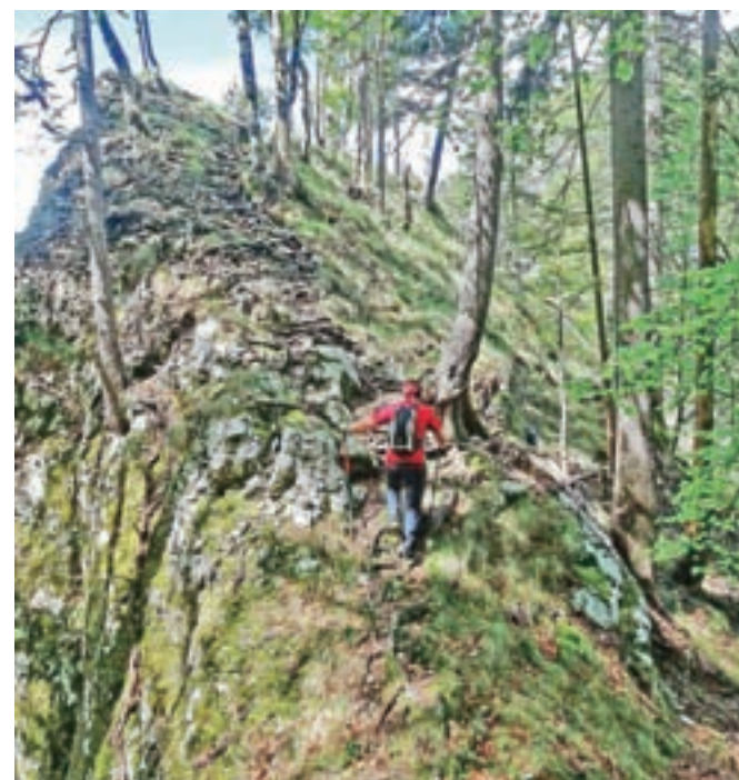
Strm vzpon do ozkega in izpostavljenega grebenčka, ki popelje na vrh

Ko premagamo strmino, nas do vrha s klopjo in vpišno skrinjico loči le še nekaj korakov po ozkem in izpostavljenem grebenu.