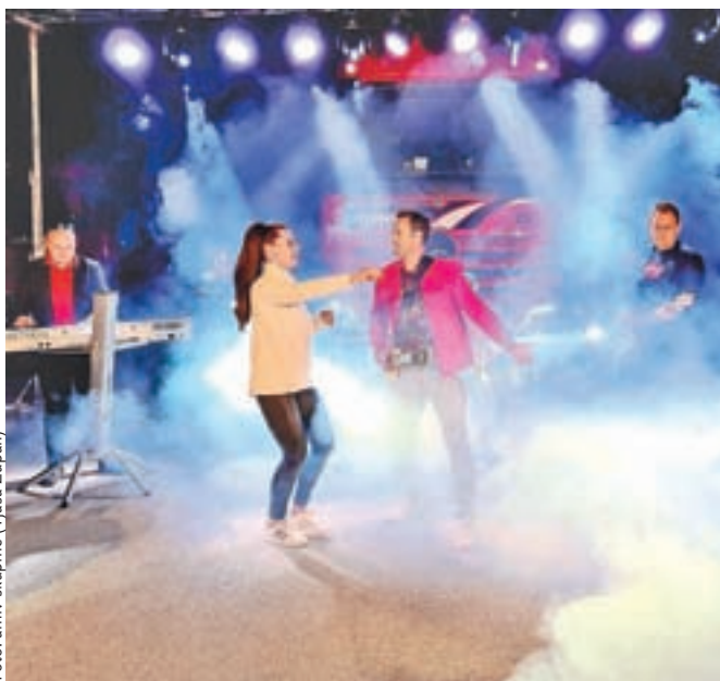
Pesem je energična, živahna in pritegne.