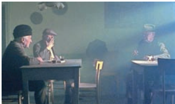
Zgodbe iz kostanjevih gozdov je najbolj nagrajevani in kritično pozitivno ocenjeni film preteklega leta. / Foto: Nosorogi

Film v slovensko-italijanski koprodukciji je bil sicer veliki zmagovalec lanskega Festivala slovenskega filma