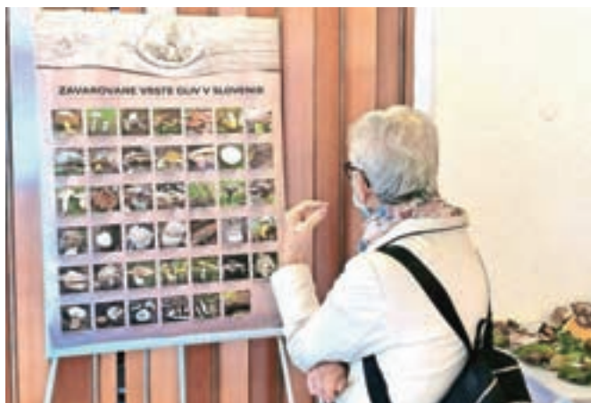
Obiskovalci razstave so zavarovane vrste gliv v Sloveniji lahko spoznali tudi s pomočjo fotografij na enotnem plakatu.