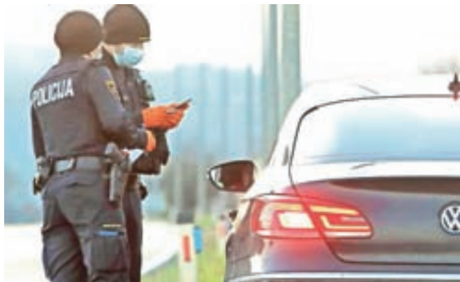
Policisti ugotavljajo, da občani večinoma spoštujejo prepoved gibanja med občinami.

Nadzor nad spoštovanjem prepovedi prehajanja občinskih mej in tudi ostalih določb vladnih odlokov gorenjski policisti izvajajo ob rednih nalogah, kot sta opazovanje in patroliranje (tako z vozili kot peš), pa tudi z občasnimi poostrenimi nadzori, kjer se nadzirajo različna delovna področja policije, in na podlagi prijav občanov. Dinamika in vrsta nadzorov bosta tudi v prihodnje odvisni od stanja na terenu, so še pojasnili na Policijski upravi Kranj.