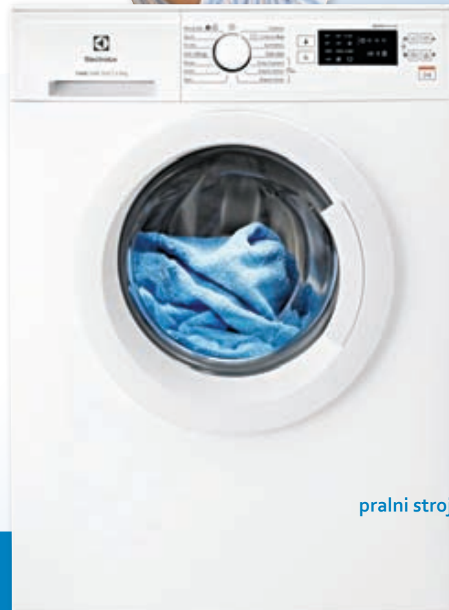
pralni stroj Electrolux