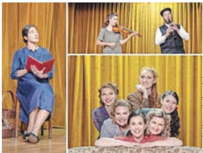
Nove novice so še tretjič zaokrožile po tržiški občini.