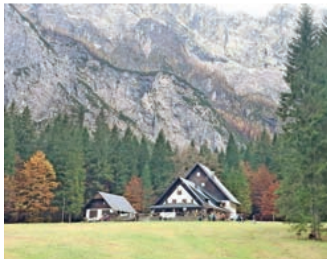
Planinski dom v Tamarju – odlični razgledi in še boljše hrana

Potep sva torej začeli v Planici, od koder sva v uri počasne hoje prispeli do planinskega doma v Tamarju. Malo nad domom so naju rdeči smerokazi usmerili naravnost proti koncu doline, kjer se tik ob planinski poti na Slemenovo špico iz črnkastega skalnega praga izliva sedemdeset metrov visok slap Črne vode, ki je imel takrat, dan po obilnem deževju, družbo še treh drugih, malo manjših slapov. Medve pa sva nadaljevali pot mimo slapa in se povzpeli še višje nad dolino, do začetka