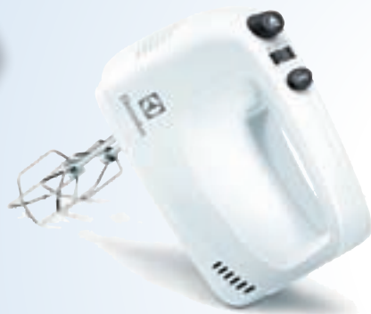
ročni mešalnik Electrolux