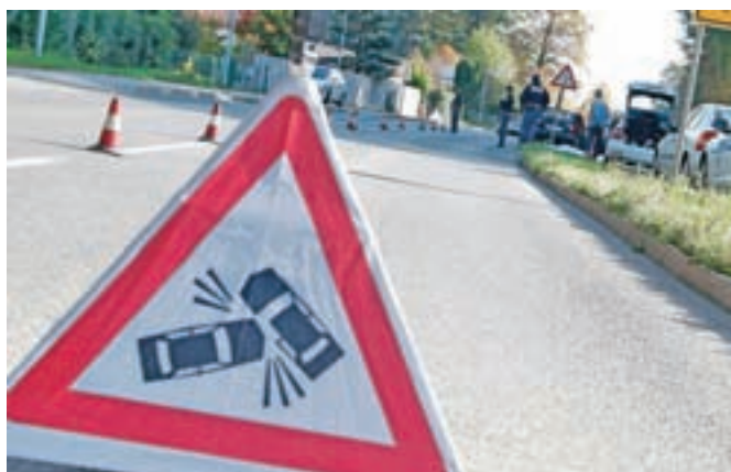
Na gorenjskih cestah je letos umrlo že enajst oseb.