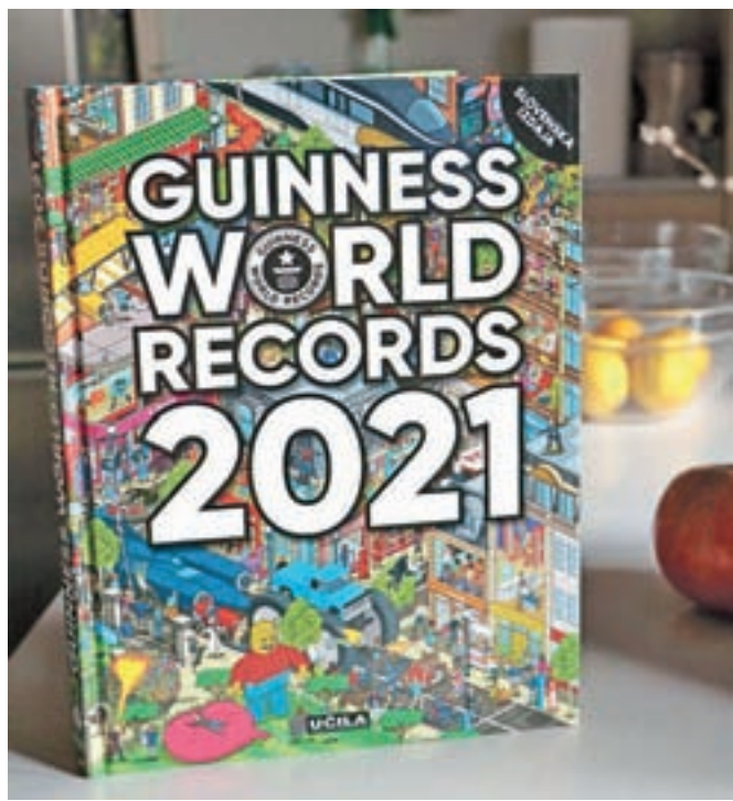
Tudi naslovnico slovenske izdaje Guinnessove knjige rekordov 2021 krasi zanimiva ilustracija.

Vodilo pri izboru letošnjih rekordov je Odkrij svoj svet, ki se začne, še preden knjigo sploh odpremo. Že naslovnica je drugačna, posebna – je namreč ilustracija. Njen avtor je nagrajeni ilustrator