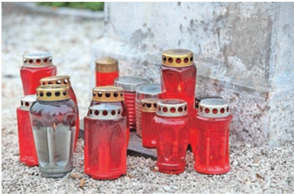
Ko sveče dogorijo, postanejo odpadki.

Kot so pojasnili na MOP, skrb za predelavo sveč prevzemajo tisti, ki so jih dali na trg: proizvajalci, uvozniki, trgovci. »Ti so združeni v štiri skupne načrte ravnanja s svečami, tako