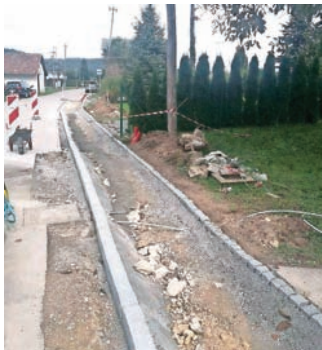
Za večjo varnost pešcev v Vodica skrbijo tudi z gradnjo pločnikov.

Že v minulem letu so uredili 150 metrov dolg odsek v Vesci, letos pa dela v vasi nadaljujejo še z urejanjem odseka poti v smeri proti lokalni cesti v dolžini okoli 140 metrov.