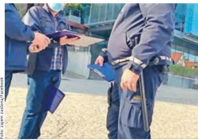
Inšpektor je zakoncema iz Kranja napovedal, da ju zaradi nenošenja maske na javni površini čaka globa 800 evrov.

Na zdravstvenem inšpektoratu so razložili, da je minuli četrtek v središču Kranja potekal skupen nadzor javnih površin s kontrolo nošenja zaščitnih mask. Konkreten postopek zoper Bizjakova sta zdravstvena inšpektorja vodila na podlagi neposredne zaznave kršitve. »Med nadzorom sta inšpektorja ustavila par z dvema otrokoma, pri čemer odrasli osebi nista nosili zaščitnih mask. Inšpektor jima je pojasnil, da gre za