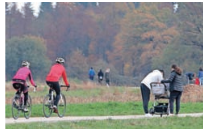
Pred strahom in tesnobnim počutjem se mnogi zatekajo v naravo, kjer se sprostijo in si krepijo telo.

Domačini so se sicer ob ukrepu zaprtja pokopališč spomnili tudi na dejstvo, da je v Železnikih samevalo tudi pred tridesetimi leti – ob 1. novembru 1990, ko so jih prizadele velike poplave.