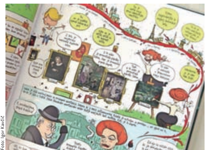
Zgodbe znamenitih Slovencev in Slovenk v besedi in risbi

Skozi zgodbe nas na iskrič stripovski način popeljeta blazno radoveden »mulc«