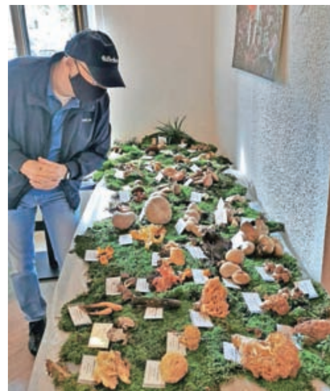
Razstavo so letos organizirali že triindvajsetič.

Na letošnji razstavi je bilo mogoče videti precej koprrenk, mlečnic in kolobarnic, so razložili. Na razstavi je bil predstavljen zelo lep primer črneče velezraščenske, ki je sicer užitna goba, a