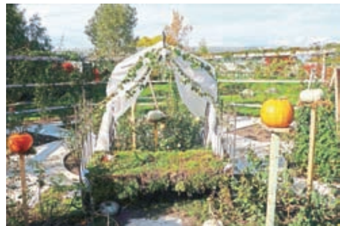
Arboretumov Rozarij je tokrat postal Trnuljčičina postelja.