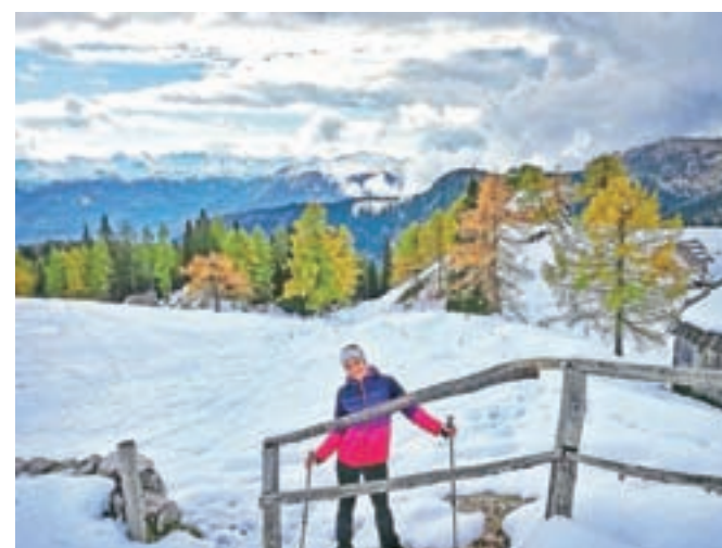
Zasnežena planina Krstenica in pogled na vrhove Spodnjih Bohinjskih gora

drugem bregu potoka ali pa odvijete na glavno cesto ter se sprehodite mimo Planinske kočice na Vojah do konca doline, kjer so trije prekrasni slapovi Mostnice.