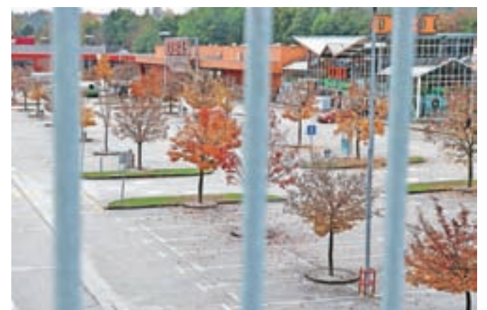
Savski otok, obarvan v nedeljo

Tema fotografij je Savski otok, k sodelovanju pa so vabljeni vsi ljubitelji dobre fotografije. Kot sporočajo v Layerjevi hiši, s pozivom želijo predstaviti različne poglede na prav posebni del mesta – Savski otok. Pri tem bodo upoštevali tako fotografije starejšega datuma, lahko bi rekli spomine na preteklost, kot motive otoka, ki vam jih je namenila ta jesen. Za pomoč navajajo dimenzije panojev, ki so 136 krat 199 centimetrov. Največ tri fotografije