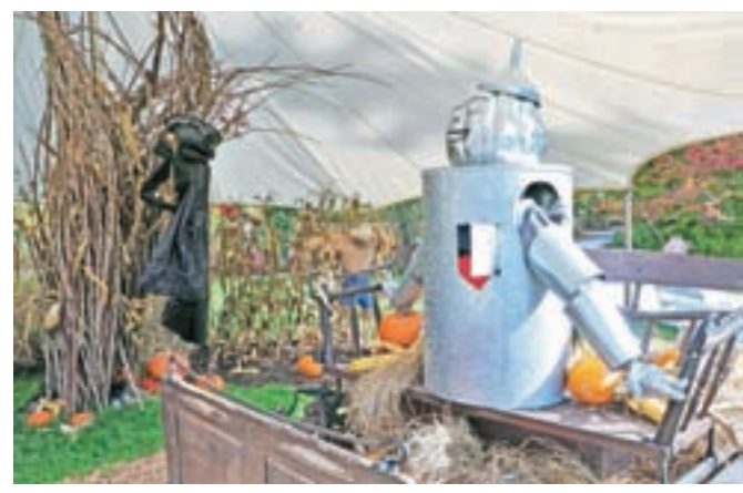
Prizor iz Čarovnika iz Oza