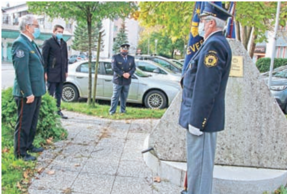
Položitev venca k spomeniku v Kamniku

Ob spomeniku v Kamniku so se že dva dni pred