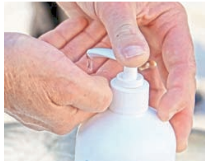
Vsa sodišča imajo vstopno točko za stranke, na kateri se izvajajo vsi potrebni preventivni ukrepi, vključno z razkuževanjem rok.

Naroki, seje in zaslišanja se, če so izpolnjeni tehnični