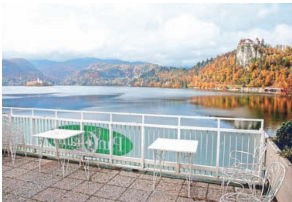
Od danes je v državi začasno omejeno prehajanje med občinami.