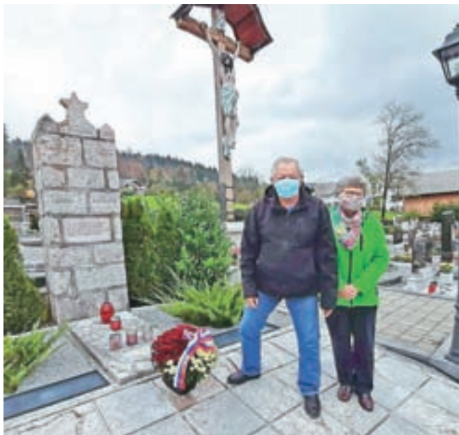
Ob spomeniku neznanim junakom na pokopališču Dobračeva

Tako so tudi letos obudili spomin na 23. oktober 1943, ko je bila nemška vojska prisiljena zapustiti Žiri. »Partizanske enote so se nahajale