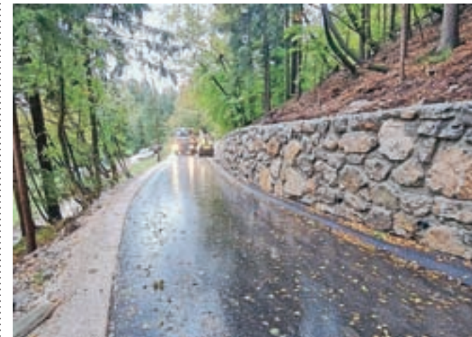
Dela na odseku ceste Markovo–Studenca–Podlom so zaključena.

Izvajalci so ob gradnji utrdili tudi bankine, brežine in jaške in zarisali talne oznake.