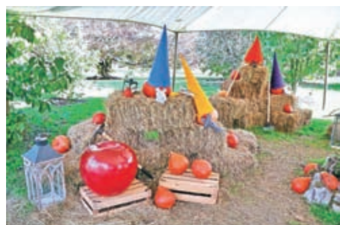
Znamenito jabolko in palčki iz pravljice Sneguljčica