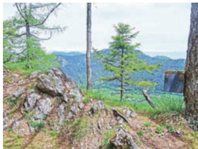
Turni, pod katerimi leži Planšarsko jezero

vrhu, 1459 m n. m. Razgled z vrha delno zakrivajo drevesa, a kljub temu se Kočna pokaže v vsej svoji veličini. Z vrha sestopimo skozi smrekov gozd strmo navzdol, kjer dosežemo markirano pot, ki vodi iz Makekove Kočne proti Češki koči. Markirano pot dosežemo ravno na Kačjem