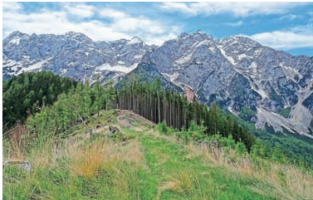
Javornik postreže s čudovitim razgledom v osrčje Kamniško-Savinjskih Alp. Je komentar sploh potreben?

Z Javornika sestopimo po grebenu, ki se spusti proti jugu in nas pripelje do večje poseke. Prečimo poseko in na drugi strani zavijemo levo v gozd. Strmo se začnemo vzpenjati proti Visokemu