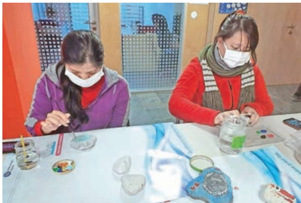
Marriel in May s Filipinov sta udeleženki projekta, ki je namenjen socialni aktivaciji žensk iz drugih kulturnih okolij, ki živijo na Gorenjskem.

Kot je povedala, so spominski kamni izvorni in zelo obstojni, lepo pa se vklaplja tudi v njihov delovno-učni projekt, katerega namen je tudi zmanjšanje porabe plastike. Tako so udeleženske v preteklosti že šivale pralne vrečke za sadje in zelenjavo iz odpadnih materialov, zdaj pa že nekaj dni poslikavajo kamne. Nabrale so jih