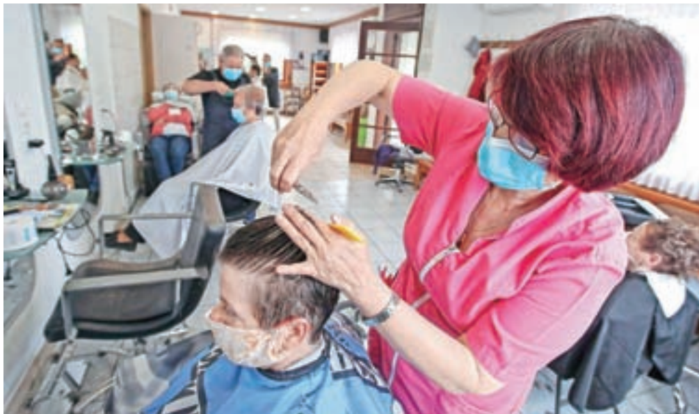
Frizerji in kozmetiki zaradi zaprtja njihovih salonov svarijo pred delom na črno v zasebnih prostorih, kjer ne bo nikakršnega nadzora in ustrezne zaščite.

Prav tako v soboto je začel veljati peti protikoronski zakon, ki med drugim vsebuje že uveljavljene in tudi nove ukrepe za pomoč gospodarstvu zaradi koronakrize (subvencioniranje čakanja na delo in skrajšane delovnega časa, mesečni temeljni dohodek za samozaposlene ...). A ti ne bodo zadoščali, ugotavljajo v Obrtno-podjetniški zbornici Slovenije (OZS), ki vlado poziva, naj čim prej pripravi še šesti protikoronski paket. OZS predlaga, da država podjetjem povrne celoten strošek (ne le 80 odstotkov) nadomestil plač delavcem za čakanje na delo in nadomestil plač delavcem,