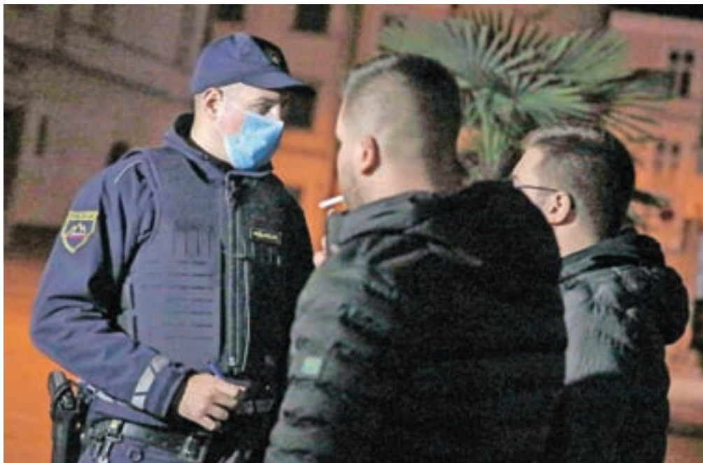
Policisti za zdaj spoštovanje »policijske ure« in ostalih vladnih odlokov nadzirajo v okviru rednih nalog.

Gorenjski policisti so oktobra kljub temu opravili več tisoč kontrol javnih krajev. »Obravnavali smo okoli trideset prijav, 35 kršitev pa smo zaznali ob rednem delu. V posamezni kršitvi je bilo lahko udeleženih tudi po več oseb,« je pojasnil Bojan Kos s Policijske uprave Kranj. Znan je primer z Jesenic, kjer so policisti pred slabim tednom dni po 21. uri obravnavali kršitev javnega