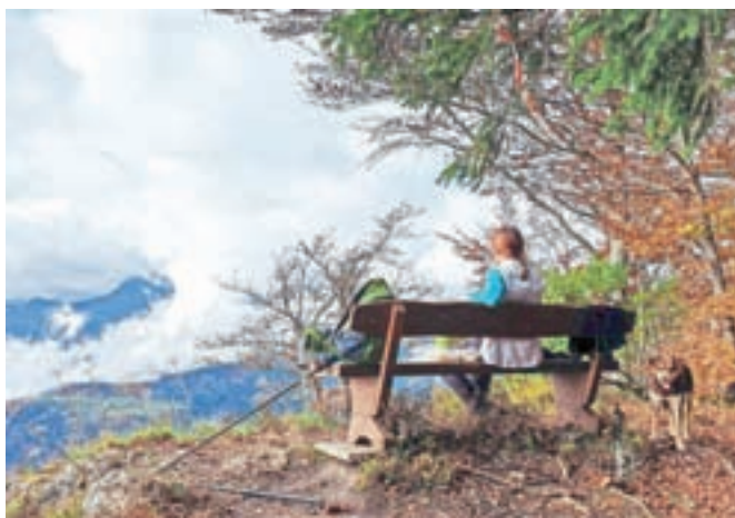
Jamnik trail je privabil in navdušil številne ljubitelje rekreacije in narave. Trasa je vodila tudi mimo razgledne točke na Britmanci, od koder se spuščamo do Dražgoške gore ter naprej proti vasi Dražgoše.

Jamnik trail je krožni orientacijski trail tek po obrobju jugovzhodne Jelovice, ki obkroža vas Podblica pri Kranju. Trasa poteka po planinskih in gozdnih poteh, utrjenih makadamskih