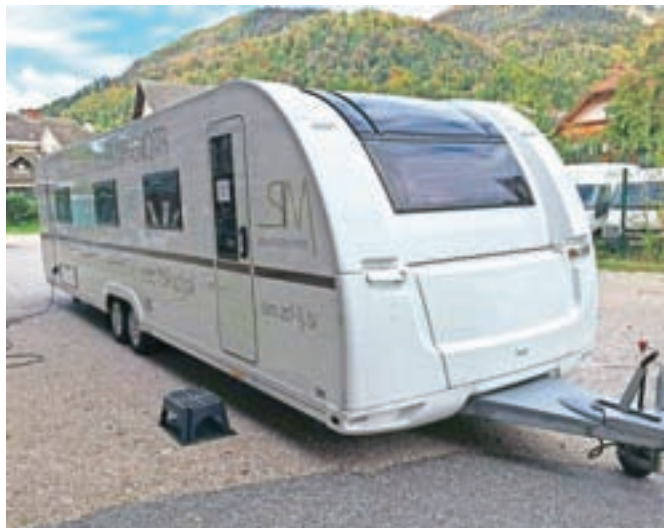
Mobilna simulacijska enota je 16 metrov dolga prikolica, opremljena z najsodobnejšo opremo za izvajanje simulacij v zdravstvu.

šolskih kabinetih ali virtualno ne more odtehtati realnega stika s pacienti. Simulacijska mobilna enota pa to omogoča, dijaki so pod vodstvom izkušenih inštruktorjev dobili priložnost, da pridobijo znanje in izkušnje in obenem izgubijo strah pred temeljnimi postopki oživljanja,« je dejala Petrovčičeva.