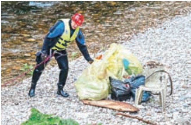
Maja je čistilna akcija v Kranju potekala v omejen obsegu, jesensko pa so odpovedali.

Večja težava je na Gorenji Savi pred nekdanjo vratarnico v Tekstilindus, kjer se kopičijo odpadki za ekološkim otokom. Tam je parkirano tudi vozilo, polno odpadkov. Ob cesti z Mlake proti Bobovku so pred in za mostom odloženi odpadki. Vsi udeleženci popisa so opozarjali,