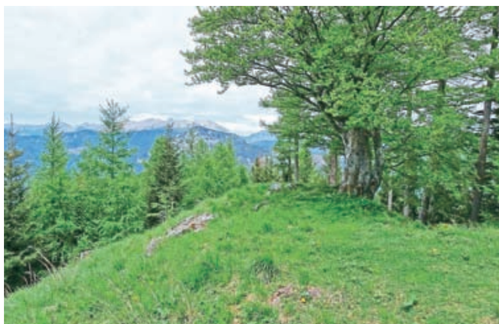
Pogled nazaj, proti severu z Visokega vrha. V ozadju greben Košute.