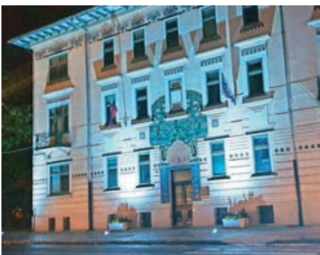
Stavba Čebelica, ki je razglašena za kulturni in zgodovinski spomenik lokalnega pomena, v njej pa ima prostore Upravna enota Radovljica, je bila v petek osvetljena modro.

Radovljica – Ob 75. obletnici ustanovitve Organizacije združenih narodov so tudi stavbo Občine Radovljica in radovljiške upravne enote osvetlili z modro svetlobo. Ustanovitvena listina OZN je začela veljati 24. oktobra 1945, slovensko ministrstvo za zunanje zadeve pa je občine pozvalo, naj 24. oktobra, na dan OZN, v večernih urah zgradbe, spomenike ali druge znamenitosti osvetlijo v modri barvi. V Radovljici so se na pobudo odzvali in tako sta bili v petek zvečer v središču mesta modro osvetljeni stavba Občine Radovljica in secesijska stavba Čebelica, ki je razglašena za kulturni in zgodovinski spomenik lokalnega pomena.