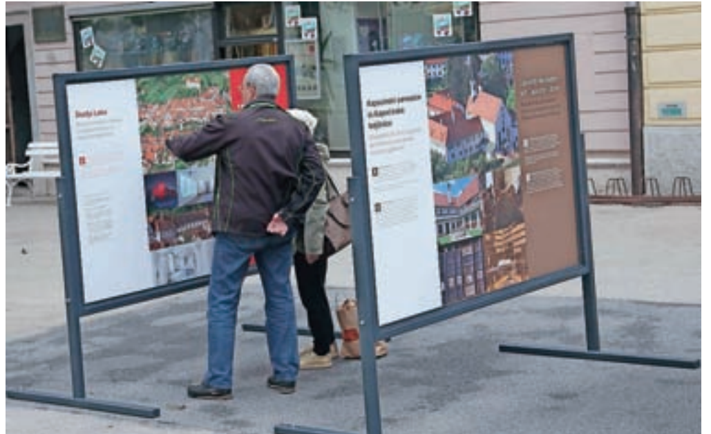
Razstava o Škofjeloškemu pasijonu na prostem