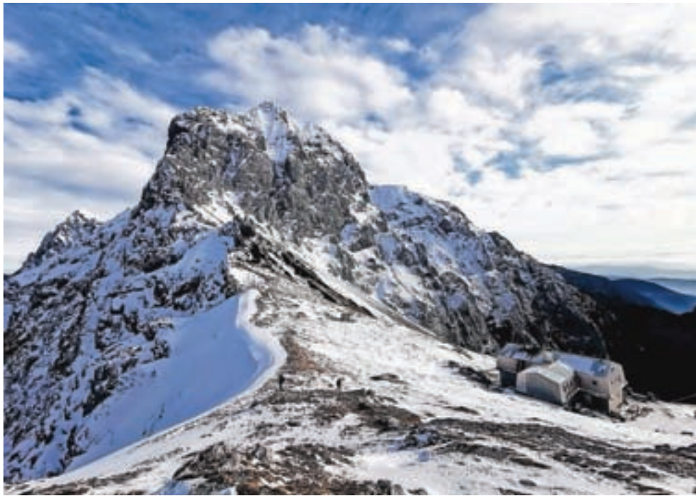
V gore počasi že prihaja zima – sneg je pobelil tudi Kamniško sedlo.

Po podatkih Sursa je do vključno avgusta v planinskih kočah prespalo približno 52 tisoč Slovencev, kar predstavlja 75 odstotkov nočitev v planinskih kočah, in približno 18 tisoč tujcev. Na zmanjšanje nočitev je vplivalo predvsem manjše število tujih gostov, kot tudi ukrepi NIJZ, zaradi katerih so koč sprejele manjše število go-