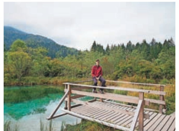
Na enem izmed lesenih pomolov pri jezeru Zelenci

v celoti zajamete mogočen petdesetmetrski slap, ki glasno buči čez bele previsne stene in pošilja vodni prš daleč naokoli.