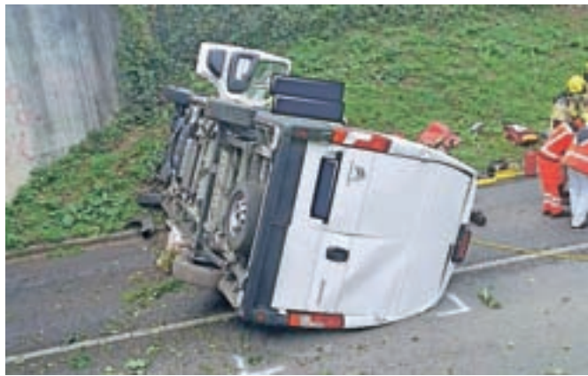
Voznik kombija se je z avtoceste prevrnil na lokalno cesto Senčur–Voklo.

Gorenjski policisti so minuli konec tedna obravnavali še tri nesreče (v Praprotnem, Škofji Loki in Žireh), katerih so se povzročitelji prevrnili z vozilom. Pri Brniku je voznica zapeljala s ceste, na Jesenicah pa je vinjenega voznika z vozišča zaneslo na parkirišče.