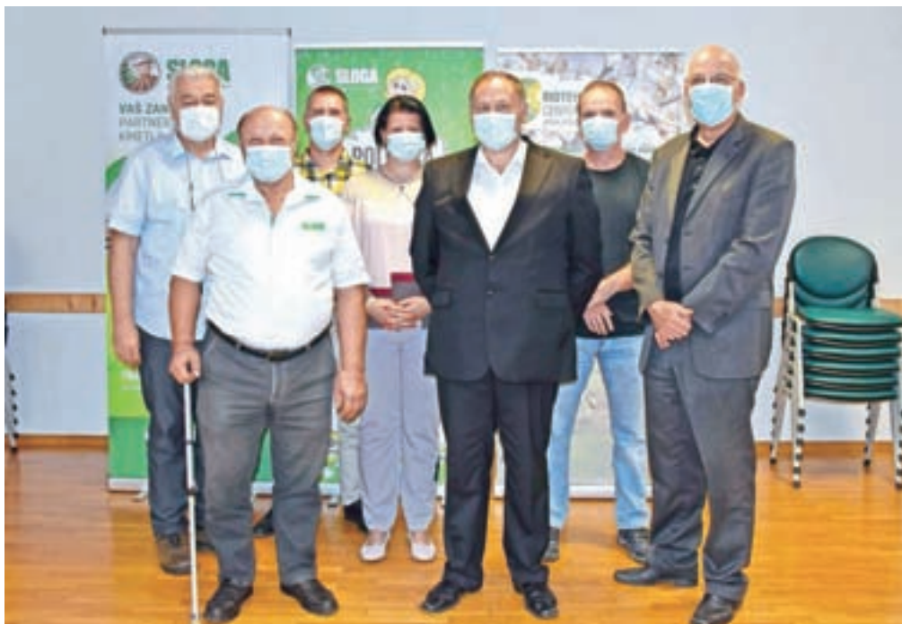
Ob podpisu pogodbe o poslovnem sodelovanju med Kmetijsko gozdarsko zadrugo Sloga Kranj in Biotehničkim centrom Naklo

Zadrugi pravijo, da bi lahko zagotovili trgu še več lokalno pridelane hrane, če bi le vedeli, da bi jo lahko tudi prodali. Številni potrošniki namreč raje kot po lokalno pridelani hrani posegajo po ceni iz uvoza.