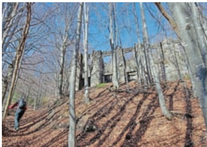
Ostaline preteklosti. V spomin in opomin.

Cuel de la Baretta je izjemen razglednik, kar nudi tudi odgovor na vprašanje, ki se mi vedno znova zastavlja, ko v gorah naletim na ostaline vojaške preteklosti: Pa kaj za vraga ste počeli tukaj gor? Z ene strani »Baretko« gleda Kugyjev orjaški zmaj, Montaž, z druge strani brega Železne doline pa težje dostopni karnijski mogočnej Zuc dal Bor. Severno leži zahodni del Naborjetskih gora, na jugovzhodu so divji in nedostopni Joveti, na jugu pa razgled zaključujejo Julijske Predalpe, predvsem Javor in Lopič. Ne toliko razgled z vrha, kot strateška točka gore je bil razlog, da so si na vrhu Italijani med prvo svetovno vojno uredili topniško trdnjavo in z nje obstreljevali avstrijske položaje v Kanalski dolini. Razsežnost ohranjenih utrdb je izjemna, saj je bila zvrtna pod celo dolžino vršnega dela gora, s samostojnimi kavernami za topniške položaje. Predlagam, da si na vrhu ogledamo ostaline stavb in sistem