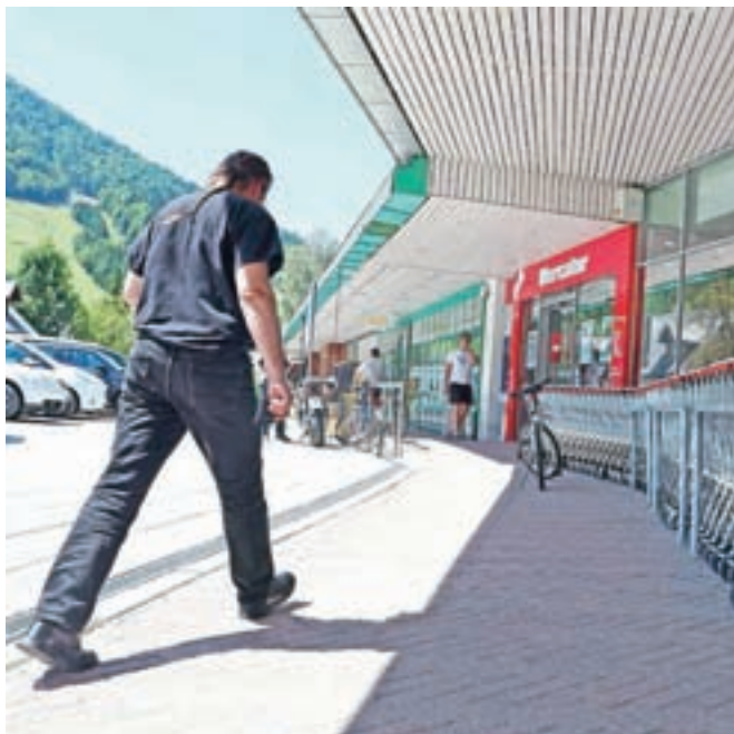
Trgovine bodo, z določenimi izjemami, ob nedeljah in praznikih zaprte.

Mnenja med kupci so deljena. Samo Cof z Brega ob Savi sprejeto novelo zakona o trgovini podpira. »Trgovine morajo biti ob nedeljah zaprte in skrajni čas je bil, da so novelo sprejeli, saj se je o tem razpravljalo že