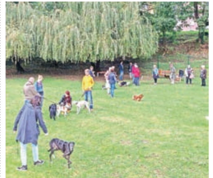
Pasji park v Medvodah se razprostira na površini dobrih šeststo kvadratnih metrov in nudi možnost izpusta psov tudi lastnikom, ki živijo v bloku ali pa nimajo ograjenega vrta, kjer bi psa lahko izpustili in se z njim brezskrbno ukvarjali.

Pasji park je ob Medvoški cesti v neposredni bližini nogometnega igrišča, in sicer na velikosti dobrih šeststo kvadratnih metrov. Krajevna skupnost Medvode – center je poskrbela za njegovo ograditev, Občina Medvode pa je vanj namestila klopi, pitnik, koš za odpadke in koš za pasje iztrebke ter prevzela skrb za vzdrževanje.