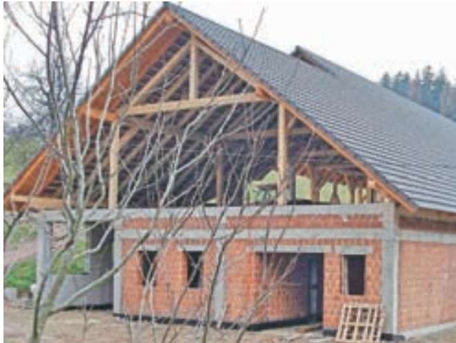
V kranjski občini so za gradnjo nestanovanjskih kmetijskih stavb znižali komunalni prispevek. Slika je simbolična.

Kranj – Kranjski mestni svet je na seji prejšnji teden po skrajšanem postopku na predlog župana Matjaža Rakovca sprejel odlok o podlagah za odmero komunalnega prispevka za obstoječo komunalno opremo na območju mestne občine, s katerim je veljavno ureditev na tem področju uskladi z novimi državnimi predpisi, hkrati pa je znižal komunalni prispevek za gradnjo nestanovanjskih kmetijskih stavb ter industrijskih in skladiščnih stavb. Občina je namreč zaradi spodbujanja razvoja kmetijstva in krepitev lokalne samooskrbe s hrano ter spodbujanja gospodarstva z odlokom določila za gradnjo nestanovanjskih kmetijskih stavb 50-odstotno oprostitev plačila komunalnega prispevka ter za gradnjo industrijskih in skladiščnih stavb 10-odstotno oprostitev, na