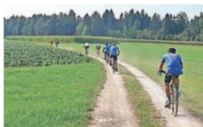
Glasovi kolesarji na makadamski trasi v Velesovem

in je sicer priljubljena tekaška pot. Brdo smo skoraj obkrožili in po osmih kilometrih zavili proti Suhi pri Predosljah. Vas smo prečkali, se odpeljali na Visoko ter ob reki Kokri navzgor proti Bregu, kjer smo zavili desno v Tupaliče in naprej na Olševke. Sredi Olševka smo nato zavili levo in se po gozdni poti spustili v Velesovo, nato pa mimo Praprotne Police in Šenčurja na pot, ki vodi