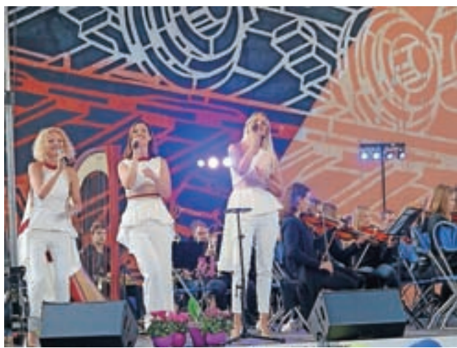
Zasedba Katrinas je ob spremljavi Simfoničnega orkestra Glasbene šole Jesenice navdušila s slovenskimi popevkami.