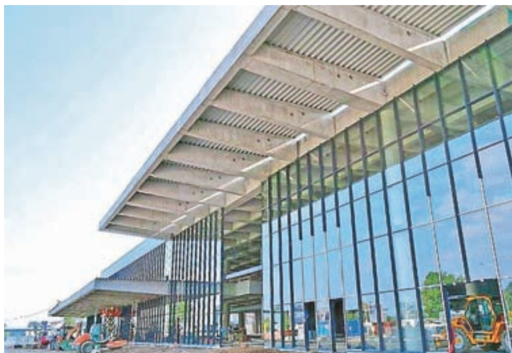
Zunanost terminala že dobiva končno podobo.

Kot pravijo v Fraportu, je gradnja terminala v polnem teku, zunanost objekta pa že dobiva končno podobo. Trenutno namreč zaključujejo nameščanje steklenih in panelnih fasad, v zaključni fazi so tudi elektro in strojne inštalacije ter odvodnjevanje objekta.