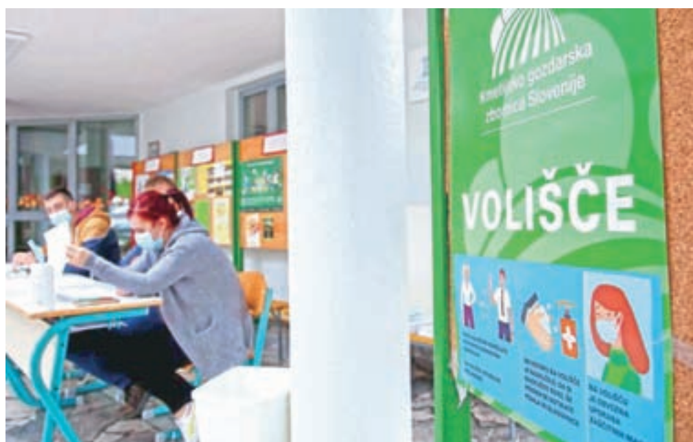
Kmetje so v nedeljo volili organe zbornice. Eno od volišč je bilo v Cerkljah, od koder je tudi naš posnetek.

Na Gorenjskem je na nedeljskih volitvah v organe Kmetijsko gozdarske zbornice Slovenije največ mandatov dobila lista Društva slovenski kmet.