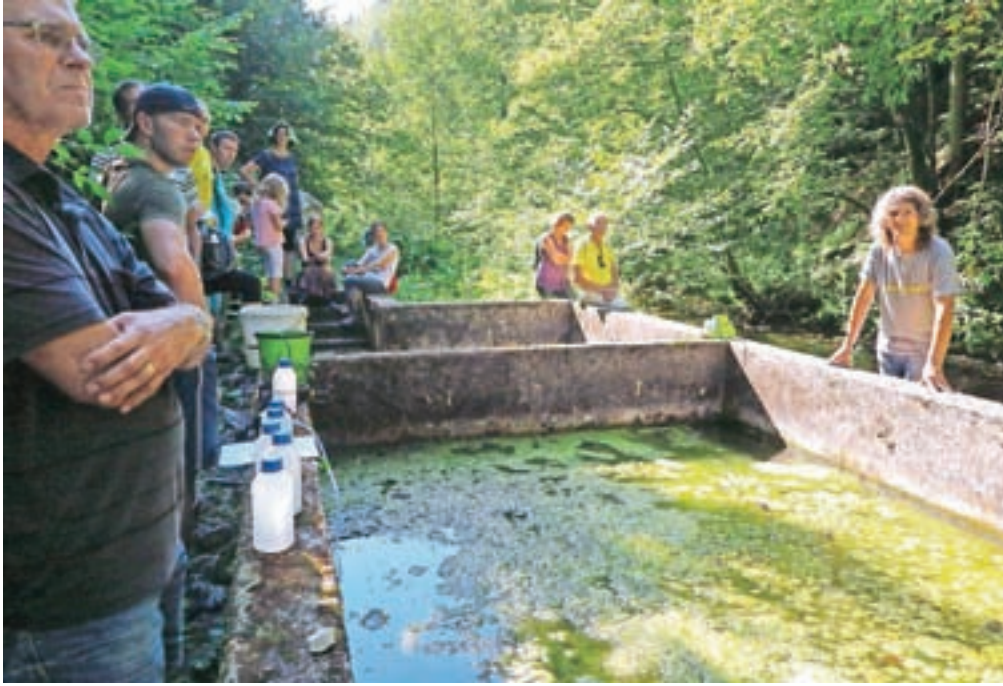
Ob potoku Nemiljščica je več naravnih izvirov tople vode, ob najtoplejšem pa so sredi prejšnjega stoletja postavili betonski bazen. Letos poleti so strokovnjaki vzeli vzorce vode in jih raziskali.

Že ob poletu so strokovnjaki iz Geološkega zavoda Slovenije obljubili, da bodo po