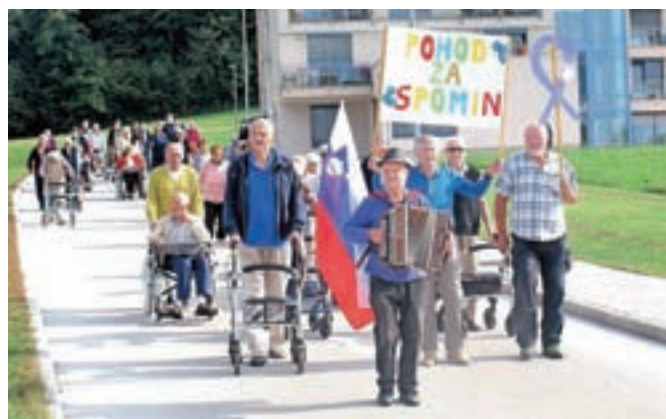
Starejši na pohodu za spomin ob svetovnem dnevu Alzheimerjeve bolezni

Šmartno – Leta 2012 je Mednarodna organizacija za Alzheimerjevo bolezen (ADI) razglasila mesec september kot mesec intenzivnega ozaveščanja javnosti o Alzheimerjevi bolezni. Društvo Spominčica spodbuja domove za starejše po Sloveniji, da se ob 21. septembru, svetovnem dnevu Alzheimerjeve bolezni, pridružijo akciji Sprehod za spomin. V Domu Taber v Šmartnem pri Cerkljah so takšen sprehod organizirali že drugič. Udeleženci so bili glede na sposobnosti razdeljeni v dve težavnostni skupini. Pohoda so se poleg stanovalcev doma udeležili tudi zaposleni, ki so pomagali stanovalcem. Alzheimerjeva bolezen je najpogostejši vzrok demence.