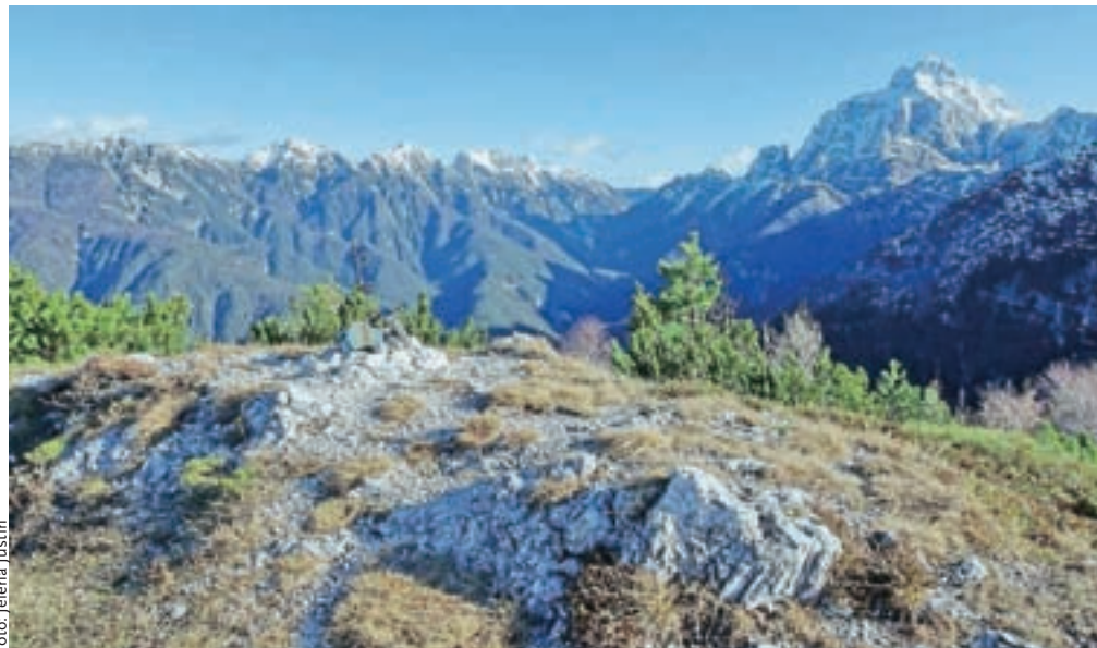
Pogled z vrha proti vzhodu: na levi Naborjetske gore, nasproti pa mogočni Montaž