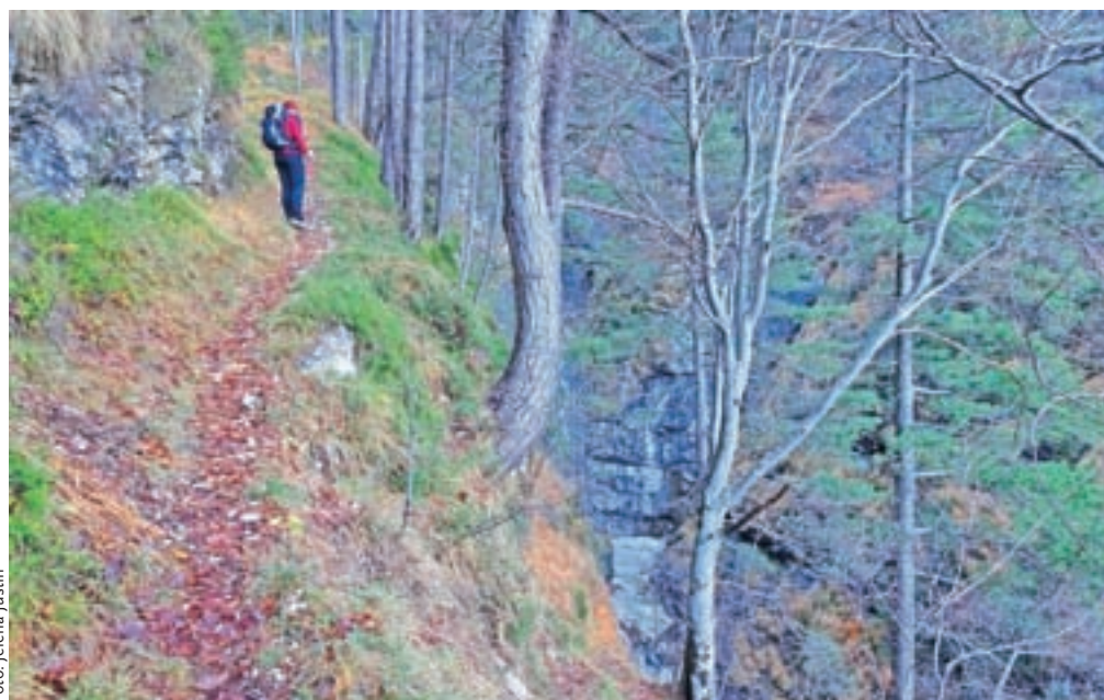
Prijetna, ponekod ozka in izpostavljena mulatjera poteka nad reko Cadramazzo.

rovov. Mrkobni in temni so podzemni prostori, ki so bili namenjeni tako topništvu kot tudi vojaški posadki. Nedoumljivo in težko predstavljivo!