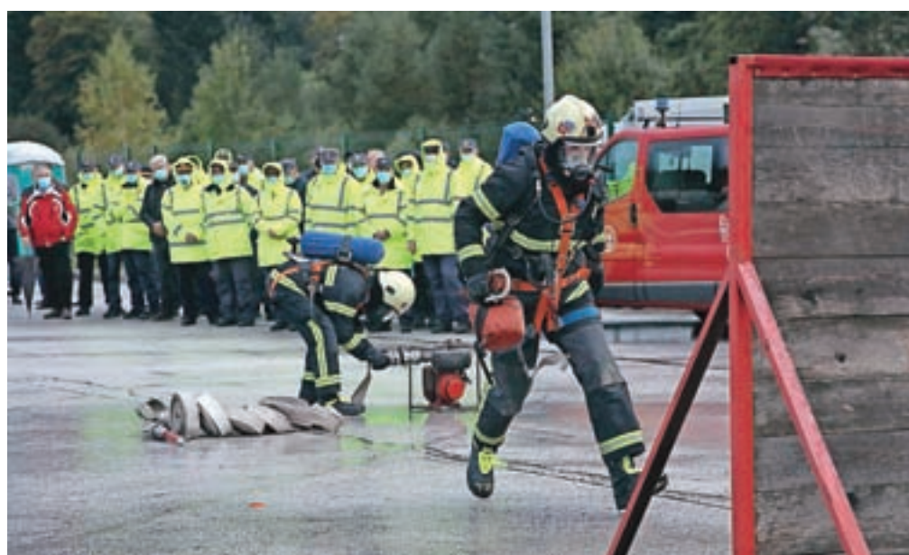
Na slovesnosti ob odprtju so se z izvedbo devetih različnih vaj predstavile tudi številne gasilske enote iz Gasilske zveze Jesenice – od pionirjev do veteranov.

intervencije v vseh vrstah nesreč,« je dejal. »Na ministrstvu za obrambo se zavedamo pomena slovenskega gasilstva, zato je njegov nadaljnji razvoj prioriteta pri našem delu. V zelo kratkem