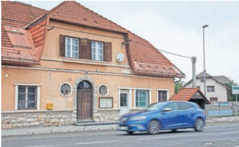
Krajani Žabnice se morajo od zaprtja njihove pošte 1. februarja lani voziti na pošto v Stražišče.

»Državlani se vse glasneje pritožujejo zaradi zapiranja pošt in vse slabše kakovosti poštne storitve, obe