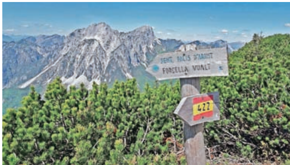
Z razgledne klopi pred bivačkom Cjasut dal Scior sta Creta Grauzaria in Monte Sernio na dosegu roke.

Bianchi, kar smo pred leti že prehodili). Zavijemo levo na lokalno potko, označeno z lesenimi tablicami in modrimi črkami – »La Lope«, ki pelje v smeri bivaka Cjasut dal Scior. Ta pot se strmo vzpenja skozi gozd. Kratki in strmi okljuki hitro pridobivajo višino. Menjavata se smrekov in bukov gozd, občasno je celo nekaj skal. Za našim hrbtom se pokažeta Monticello nad Mužcem in Lipnik v daljavi. Dosežemo ostaline nekakšnega kamnitega objekta. Smo na poti št. 422. Zavijemo desno in v nadaljnjih 30 minutah dosežemo bivač Cjasut dal Scior, 1742 m n. m. Nad bivačkom je severni Monte Vualt, 1752 m n. m., ki ga imenujejo tudi Belvedere. Pogled na jug se ustavi na južnem Monte Vualtu, 1726 m n. m. Najprej se povzpemo na severnega, do katerega je pet minut. Vrh postreže s čudovitim razgledom v krogu 360 stopinj. Pa če začnemo na zahodni strani: Monticello, Cimadors Alto, Grauzaria, Sernio, Creta di Mezzodi, Tersadia, Monte Flop, v daljavi najvišji vrh Karnijcev Monte Coglians. Če pogledamo bolj na sever, vidimo Monte Lodin, Zermulo, Veliki Koritnik, Konjski špik, Krniške skale, Creta dal Cronz. Proti zahodu se razprostira pogled od