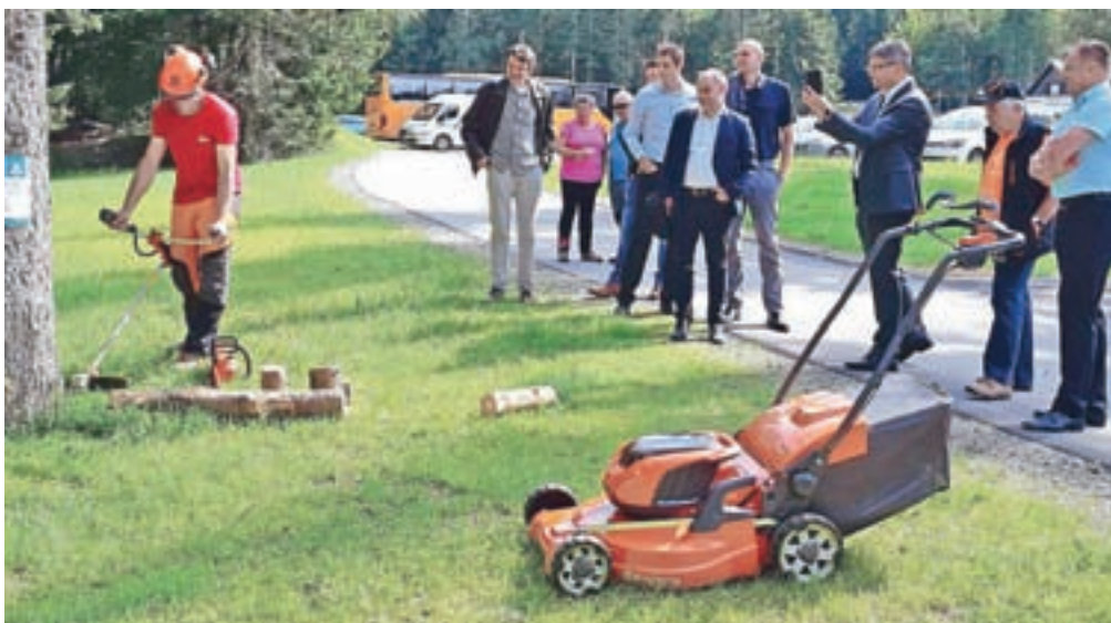
Prikaz uporabe baterijskega vrtnega orodja

Navzoči so električna vozila z veseljem preizkusili,