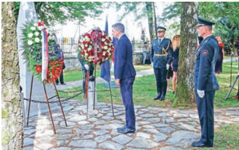
Predsednik Borut Pahor je k spomeniku bazoviških junakov v Prešernovem gaju položil venec.