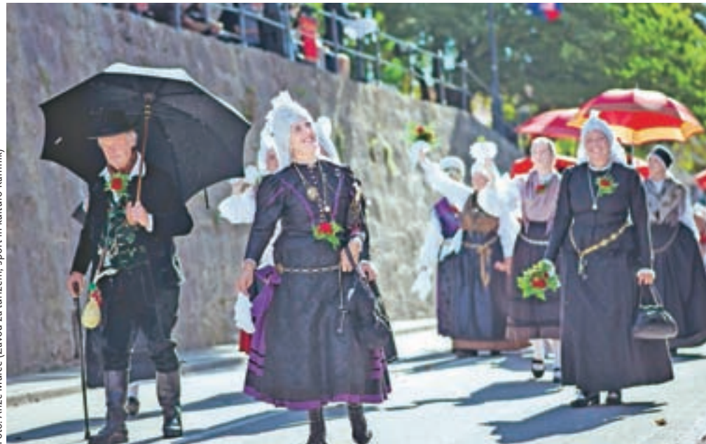
Slavnostne povorke se vsako leto v »črni noši« udeleži skupaj s svojim možem.