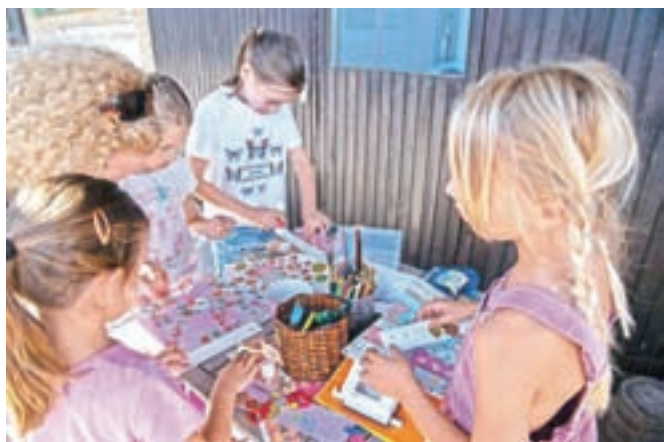
Vsak si je lahko izdelal svojo knjižno kazalko.