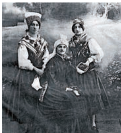
Trije tipi gorenjskih ženskih narodnih noš, kakršne so se izoblikovale na podlagi kmečkega prazničnega oblačilnega videza 19. stoletja na alpskem območju, Ilustrirani Slovenec, 1926, str. 229