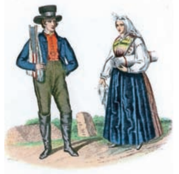
Narodna noša okoli Škofje Loke, kakor jo je upodobil slikar Franz Kurz zum Thurn und Goldenstein v letih 1837 ali 1838