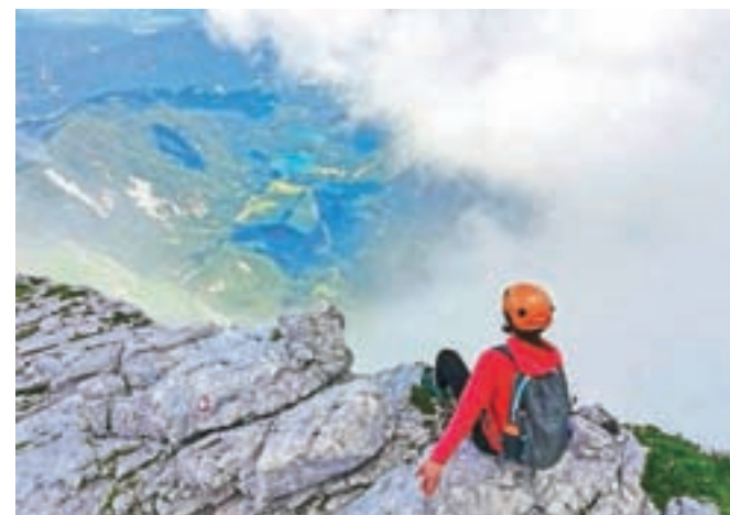
Oblaki počasi razkrivajo pogled na Belopeška jezera

Jalovcu, Poncam in smaragdnam Belopeškim jezerom globoko v dolini.