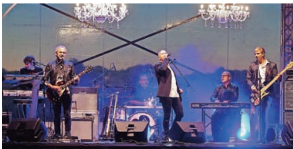
Pop Design