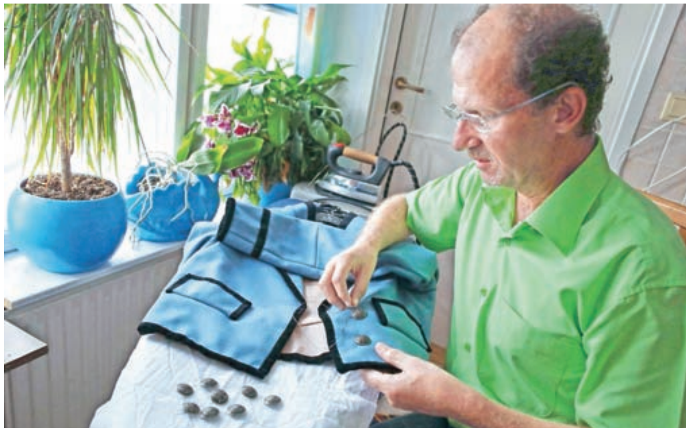
»Ročno delo je tisto, ki žlahtni podobo, brez njega izdelki nimajo prave vrednosti.«

Pridem, če se le ne zgodi kaj nepredvidljivega. Brez pričakovanih, le z željo, da se srečam z ljudmi, ki jih vidim v Kamniku, in morda spet odkrijem kaj novega.