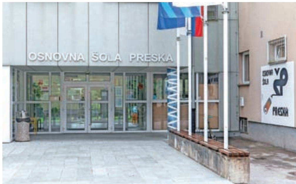
Na OŠ Preska so bili v nedeljo obveščeni, da je z virusom okužen učenec na matični šoli v Preski, v karanteni sta dva razreda četrtošolcev.

Minister za zdravje je do 6. septembra odredil skoraj 65 tisoč odločb o karanteni (podatkov ne vodijo ločeno po regijah). Zdravstveni inšpektorji nadzirajo, ali osebe spoštujejo karanteno. »Inšpektorji še vedno vsak dan najdejo primere, ko oseb ni na mestih, ki so v odločbah navedena za preživljanje karantene (kar ni nujno domači naslov), prav