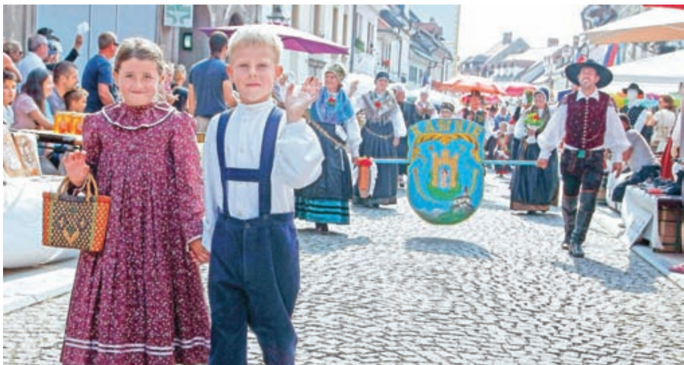
V Kamniku so narodne noše doma že pol stoletja, ta slika pa priča, da bodo še vsaj naslednjih petdeset let.

Klic, ki smo ga postavili v naslov, je slej ko prej enak: »Gorenc, obleka tvoja ni – domača več!« A to ni nič hudega. Je, kakršna je, gorenjska narodna noša pa je našla svoj trajni dom v Kamniku, kjer se prav dobro počuti.