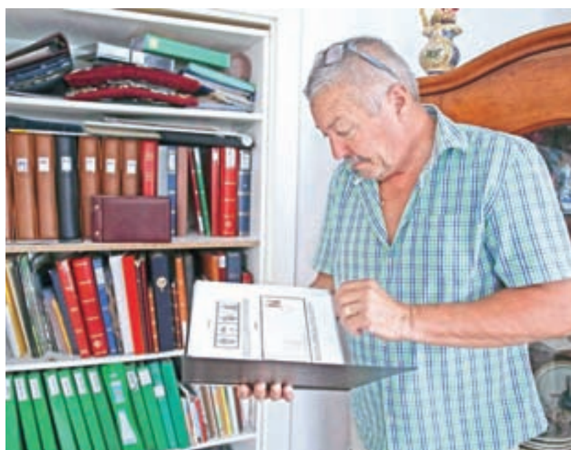
V svoji zbirki ima skrbno urejene različne tiskovine od prve prireditve iz leta 1966 do danes.

»Danes je že vse digitalizirano in dostopno preko računalnikov in pametnih telefonov, a sam menim, da imajo pravo vrednost tiskani arhivi. Ne vemo niti, ali bomo vse računalniške diske čez desetletja sploh še lahko brali, znano pa je, da tiskane stvari – če jih hranimo pravilno – obstanejo tudi stoletja.«