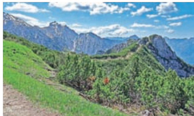
Pomol, ki vodi na južni Monte Vualt, zasnežena gora levo je Zuc Dal Bor.

Glerijskih špic, Monte Chivala, Zuc dal Bora, Crostisa in Pisimonija. Pogled na jug se ustavi na Lopiču in Javorju ter vrhovih nad Reziro. Z malce sreče bomo videli tudi Dolomite in Visoke Ture. Razgled, ki mu ni prav nič oporekat. Z enakim razgledom postreže tudi južni Monte Vualt. Vrnemo se do bivaka Cjasut dal Scior, kjer začnemo sestop do stika s potjo »La Lope«, kjer smo prej dosegli pot št. 422,