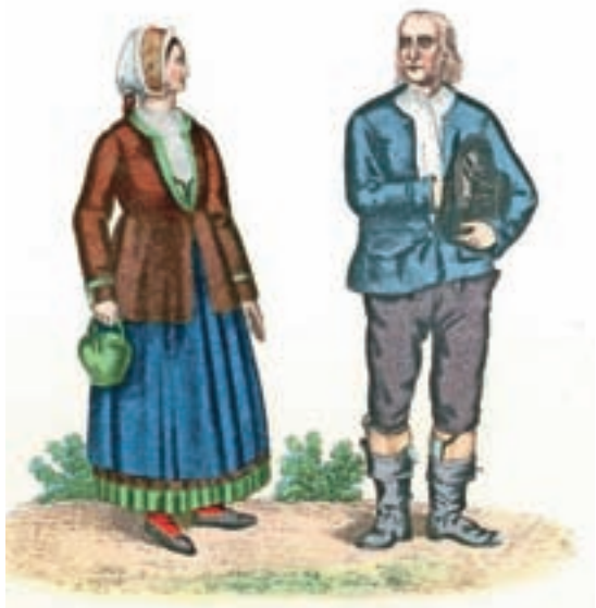
Narodna noša iz Bohinja, kakor jo je upodobil slikar Franz Kurz zum Thurn und Goldenstein v letih 1837 ali 1838

»Obleka jim je večinoma povsod ista. Povsod nosijo črne, zgoraj nekoliko zožajoče se klobuke, samci pa, zlasti pri Radovljici in v okolici, imajo navzgor privihane okrajce.« (Valvasor)