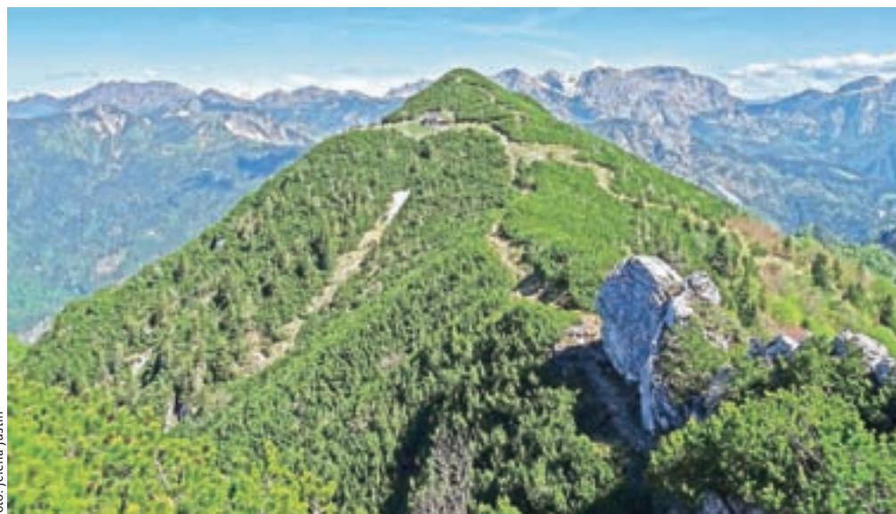
Pogled z južnega Monte Vualta na bivač Cjasut dal Scior in severni Monte Vualt