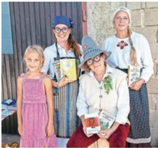
Junake iz Vandotovih povesti je bilo mogoče srečati tudi v živo. / Foto: Primož Pičulin

Prireditev so v KUD Bitnje pripravili v sklopu nacionalnega meseca skupnega branja. »V okviru društva deluje tudi bralni krožek Sorško polje, zato smo z