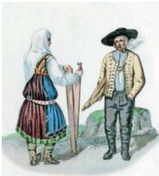
Narodna noša okoli Smlednika, kakor jo je upodobil slikar Franz Kurz zum Thurn und Goldenstein v letih 1837 ali 1838