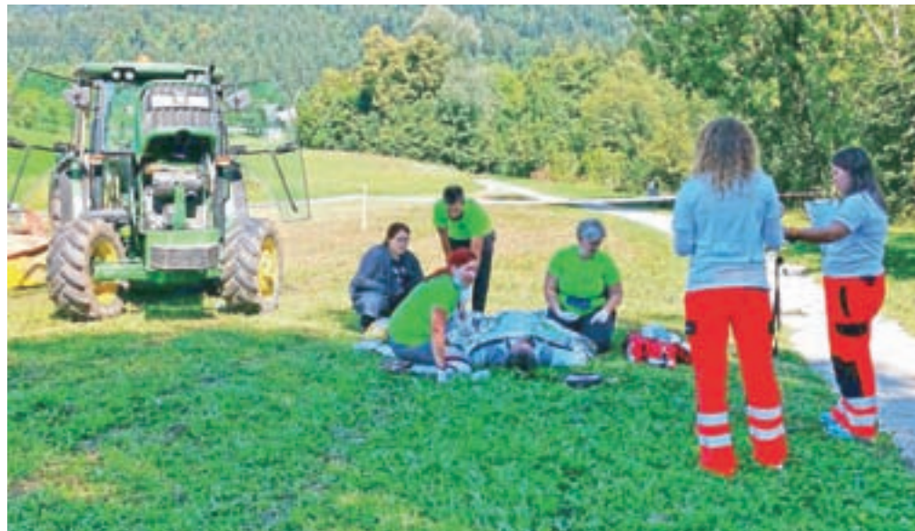
Eden od scenarijev je predvideval ukrepanje prvih posredovalcev zaradi hudih opeklin kmeta.

Bosne in Hercegovine ter iz Hrvaške, a sta obe ekipi zaradi protikoronskih ukrepov morali sodelovanje odpovedati. Upamo, da ju bomo lahko gostili že na naslednjem srečanju,« je dodal.