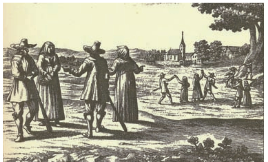
Takšna naj bi bila noša Gorenjcev v Valvasorjevih časih, slika je iz Slave Vojvodine Kranjske, 1689.

grobega sukna, navadno pa nosijo dolge jopiče iz črnega blaga, ki se imenuje loden. To je zelo navadno, grobo in debelo sukno, ki se povsod na Kranjskem izdeluje na kmetih. Vendar uporabljajo včasih za hlače in suknjiče tudi zelo fino sukno in si natikajo čedne nogavice in čevlje. Tovorniki hodijo v črnih škornjih s črnim usnjenim, za ped širokim pasom, ki si z njim opasujejo telo ne nad sukno, ampak pod njo, torej le preko srajce. Drugim pa rabi za pas širok rob ali konec kakega blaga. V rokah imajo po navadi palico, na popotovanju pa velike in debele gorjače, zlasti nosači, ki na rami prenašajo blago v tuje dežele.« Današnji Gorenjci se torej od tistih pred 300 in več leti ne razločujejo le po govorici, ampak še bolj po noši. Zdaj pogledmo še njihovo poletno opravo. »Poleti nosijo ali bele ali črne platnene hlače in hodijo večinoma brez kamižole v srajci, ki ima okrogel ovratnik. Ponekod uporabljajo v poletnem času cokle namesto usnjenih čevljev. Pozimi hodijo s čisto razgaljenimi in golimi prsmi, kakor je po vsej deželi navada med kmeti.« Striženje in britje nista bila redna praksa. »Večina moških si pusti rasti dolge lase, nekateri pa si jih dajo s škarjami docela vzeti. Povečini nosijo kmetje tudi dolge brade, kajti le