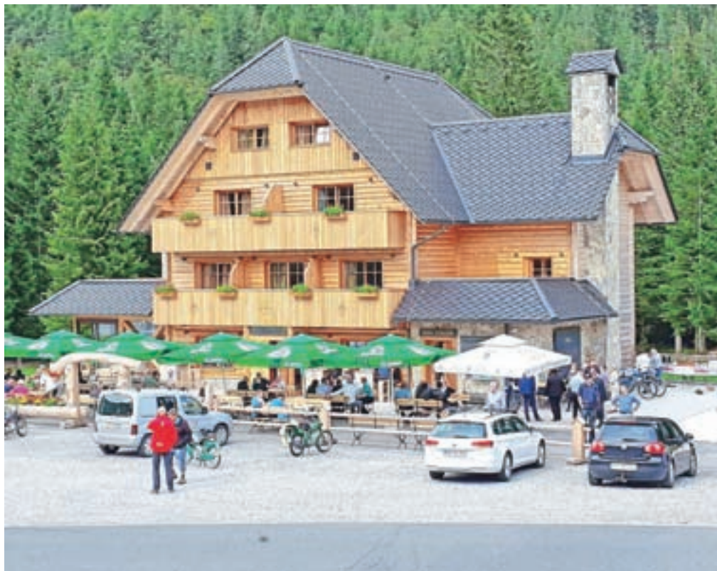
Penzion Lajnar, nova pridobitev na Soriški planini

sva tudi ostanke bunkerjev. Privoščila sva si enolončnico, bila je odlična. Še bova prišla,« sta obljubila.