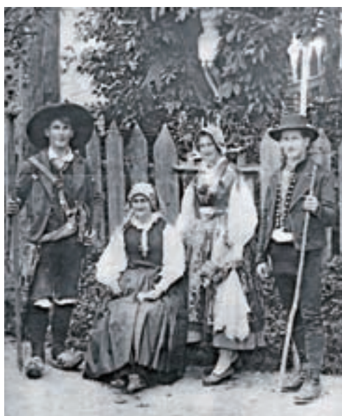
»Naše slovenske narodne noše: Gorenjka in Gorenjki iz Podkorena«, Ilustrirani Slovenec, 1928, str. 41.