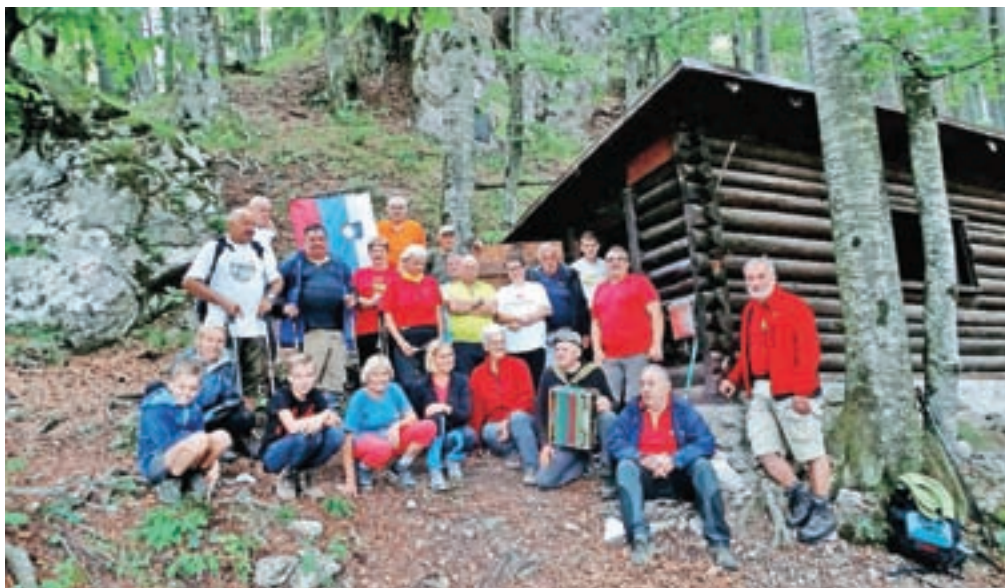
Obisk partizanske bolnišnice Košuta

Bašelj – Občinska organizacija Zveze borcev Preddvor je pred nedavnim organizirala obisk partizanske bolnišnice Košuta ob vznožju Storžiča. Udeleženci so se poklonili spominu umrlih ranjencev v bolnišnici, ki je delovala od aprila 1944 do konca vojne. V tem obdobju je v bolnišnici Košuta umrlo šest ranjencev. Bolnišnica se je s sanitetnim materialom oskrbovala tudi iz bolnišnice na Golniku. Občinska organizacija Zveze borcev Preddvor z obiskovanji partizanskih grobišč ohranja vrednote odporiškega partizanskega boja proti okupatorju, ki je hotel izkoreniniti slovenstvo, s spominskim pohodom pa so počastili tudi zmago nad nacizmom