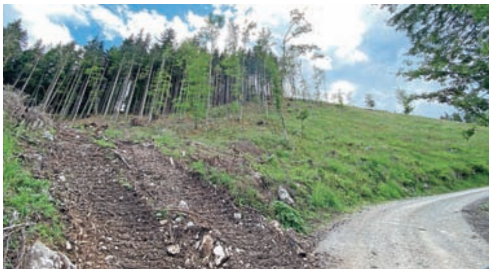
Ceste na Jelovici so zaradi velikih obremenitev v slabem stanju. Uporabljajo jih tako obiskovalci kot v gozdarske namene.

»Že v normalnih razmerah je ta cesta izredno obremenjena, torej predvsem z javnim prometom. V gravi-