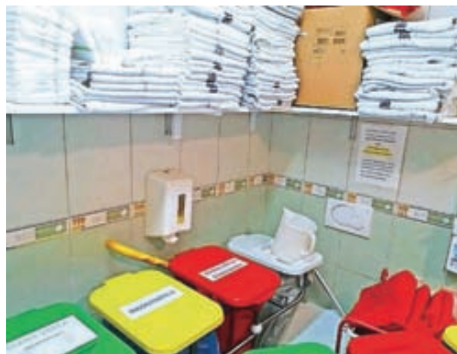
Higienski standardi so se znižali: čisto perilo in smeti v istem prostoru.