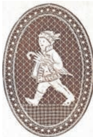
Kranjec s polhovko, čipka izdelana po osnutku Maksima Gasparija, Ilustrirani Slovenec, 1929, str. 180–181