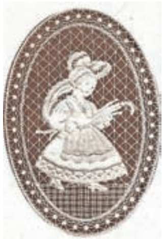
Kranjica s pečo, čipka izdelana po osnutku Maksima Gasparija, Ilustrirani Slovenec, 1929, str. 180–181