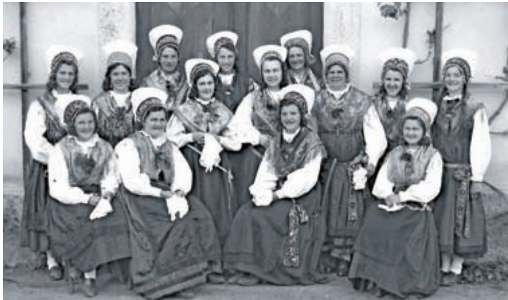
Udeleženske tečaja za izdelavo avb, ki je potekal v Podnartu v letih pred 1940, fotografija je iz arhiva dr. B. Knifica.

različnih interesov. Poleg izražanja narodne zavesti, kar je bila njena primarna funkcija v štiridesetih in petdesetih letih 19. stoletja, je bila ob koncu 19. stoletja v funkciji preobleke za pevске zборе, deloma pa so bili njeni elementi vidni na gledaliških odrih. Po predstavitvi dežele Kranjske na Dunaju leta 1908 je narodna noša poleg nacionalne pripadnosti njenih nosilcev ponekod izkazovala tudi pripadnost lokalni skupnosti. Ljudje so zaradi te spremembe v funkciji narodne noše iskali posebnosti v dediščini lokalnega oblačilnega videza in jih vnašali v lastno, stalno spreminjajočo in razvijajočo se narodno nošo. Vzrokov za oblikovne spremembe, do katerih je v narodni noši prihajalo, je bilo več. Poleg sprememb v funkciji narodne noše napram funkciji kmečke praznične obleke prve polovice 19. stoletja, v kateri je narodna noša iskala vzore, je svoje doprinesel tudi gospodarski in družbeni razvoj. Trg so preplavile industrijske tkanine, ki so izpodrinile uporabo domačih, spremenile so se higienske in zdravstvene zahteve ljudi, hkrati pa standard kmetov ni več tako močno