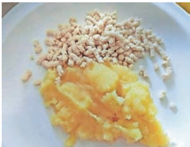
Pičli obrok, kakršnih so po oddaji kuhinje zunanjemu izvajalcu deležni stanovalci doma