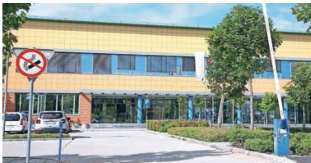
V prvem tednu pouka so okužbe potrdili v več vrtcih in šolah po Sloveniji, eno tudi v Gimnaziji Franceta Prešerna Kranj. Za razred, ki je v karanteni, je pouk organiziran na daljavo.