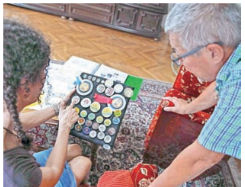
Posebno mesto imajo tudi značke in priponke, ki jih organizatorji izdajo vsako leto.