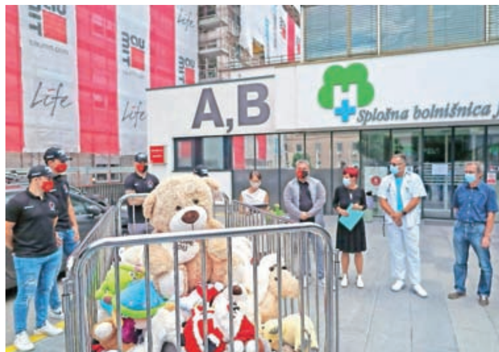
Hokejisti so malim bolnikom pediatričnega oddelka jeseniške bolnišnice prinesli več kot osemsto plišastih igrač. Dogodek je potekal na prostem, brez otrok, del igrač so nasuli v bolnišnično posteljico.

tje SIJ Acroni, ki je glavni sponzor hokejistov. Kot so poudarili na dogodku, hokejiste in male paciente povezuje jeklena volja, saj so vsi veliki borci – pacienti za zdravje, hokejisti pa za čim več golov in zmag.