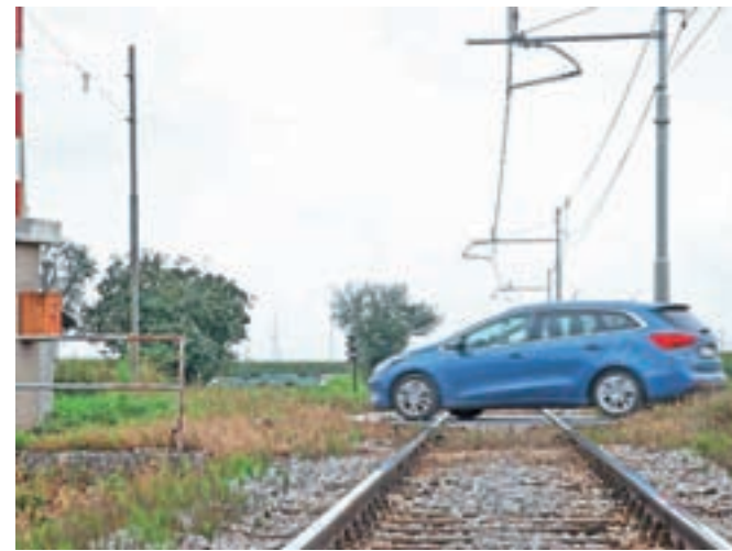
V Sloveniji je 721 nivojskih prehodov ceste čez železniško progo.

začne približevati v trenutku, ko boste z vozilom ravno na tirih in se ne boste imeli kam umakniti. Čez prehod zapeljite šele, ko ga boste lahko v celoti, hitro in varno tudi prečili. Nikoli tudi ne vozite mimo spuščeni zapornic ali polzapornic. Še posebej nevarni so prehodi brez zapornic ali brez svetlobnih znakov, zlasti ob zmanjšani vidljivosti, zato policija tam svetuje še dodatno previdnost in pozornost. Pomembno je tudi vedeti,