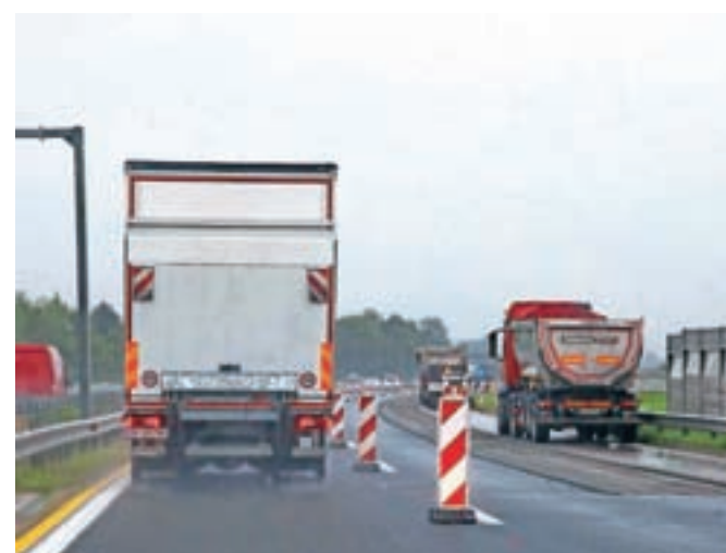
Promet med priključkoma Kranj zahod in Brezje poteka po dveh zoženih pasovih v obe smeri.

Promet na tem odseku začasno poteka po dveh zoženih pasovih v vsako smer vožnje. Promet proti Karavankam bo več ali manj nemoten z dvema zoženima pasovoma, proti Ljubljani pa bo en pas potekal na drugi polovici avtoceste, zato je pomembna pravočasna razvrstitev na prometni pas. Če voznik izbere levi prometni pas, se do izvoza Kranj zahod ne more izključiti na razcepu Podtabor ter priključku Naklo. Na levem prometnem pasu je sicer širina začasnega vozišča 2,2 metra. Med gradnjo so predvidene tudi zapore posameznih uvozov in izvozov na avtocesto.