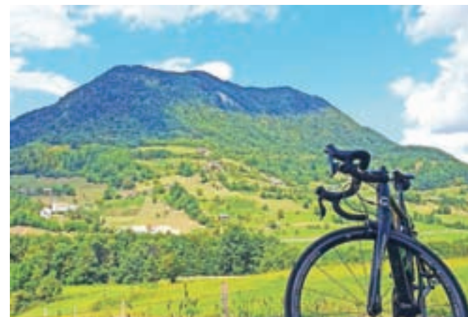
Večji del poti boste kolesarili pod Donačko goro.

na vrh. Predlagam, da se od doma po asfaltirani cesti spustite naprej do Zgornjih Poljčan na drugi strani. Od tu pa ostro levo proti Lovniku in naprej proti naselju Podplat, ki leži na precej prometni cesti iz Celja proti Rogaški. Zato predlagam, da