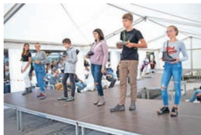
Modna revija nekoliko drugače: nekdanji in današnji sloves tržiških čevljarjev