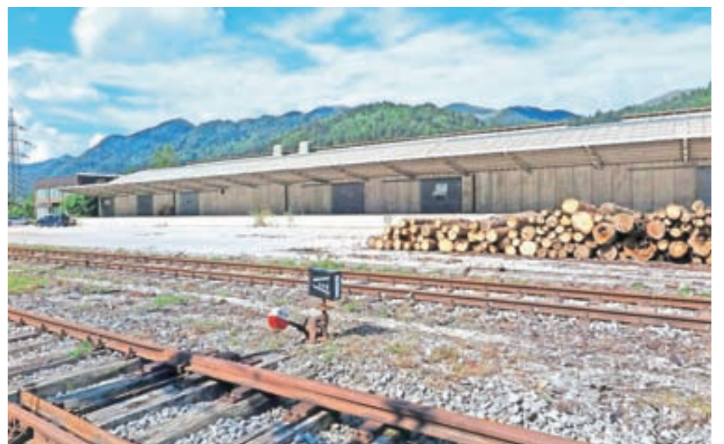
Upravna stavba, skladišča in zemljišča na Kurilniški ulici so na prodaj.

proizvodnih dejavnosti, zemljišča pa so hkrati opredeljena kot stavbna.