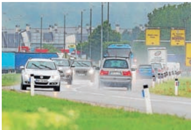
K rasti toplogrednih plinov je letos največ prispeval promet.