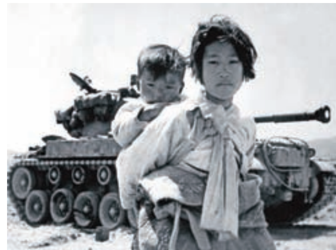
Tudi med korejsko vojno je bilo veliko beguncev. Na sliki deklica z bratcem, za njima ameriški tank M26 Pershing, 9. 6. 1951.

prosilcev za azil, dodatno pa je tu še 3,6 milijona Venezuelcev, razseljenih v tujini. Ti Venezuelci večinoma niso zaprosili za status begunca, ko so prišli v tujino. Pandemija covid-19 in s tem povezana revščina nekaterih držav pa bosta verjetno še spodbudili beg v smeri Evrope. Največ beguncev gosti Turčija, in sicer 3,6 milijona. Sledijo Kolumbija z 1,8 milijona ter Pakistan in Uganda s po 1,4 milijona beguncev. Na petem mestu je Nemčija, kjer živi 1,1 milijona beguncev. Glede na izvor je na begu največ Sircev, 6,6 milijona. Svoje domove je med drugim zapustilo še 3,7 milijona Venezuelcev in 2,7 milijona Afganistanc. Med vsemi begunci jih je po ocenah med 30 in 34 milijonov starih manj kot 18 let. Vse večje število beguncev gre pripisati tudi temu, da domovine ne iščejo možnosti, kako bi državljane privabile nazaj. Pred tridesetimi leti se je v povprečju v enem letu v domovine vrnilo po 1,5 milijona beguncev, v zadnjih letih pa v povprečju po manj kot štiristo tisoč. V Sloveniji je bilo po podatkih UNHCR konec lanskega leta samo 751 ljudi s statusom begunca, 329 ljudi pa je še čakalo na odločitev oblasti glede vlozene prošnje. (Vir: MMC RTV SLO)