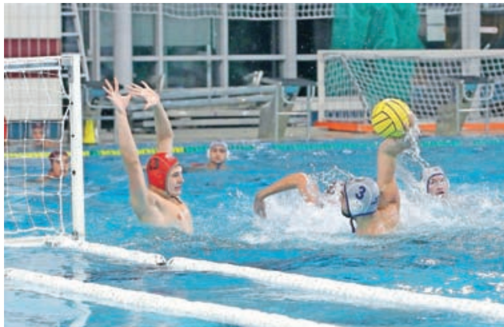
Vaterpolisti Triglava so v tej sezoni že osvojili naslov pokalnih prvakov, zdaj pa upajo, da se bodo lahko borili tudi za naslov državnih prvakov.