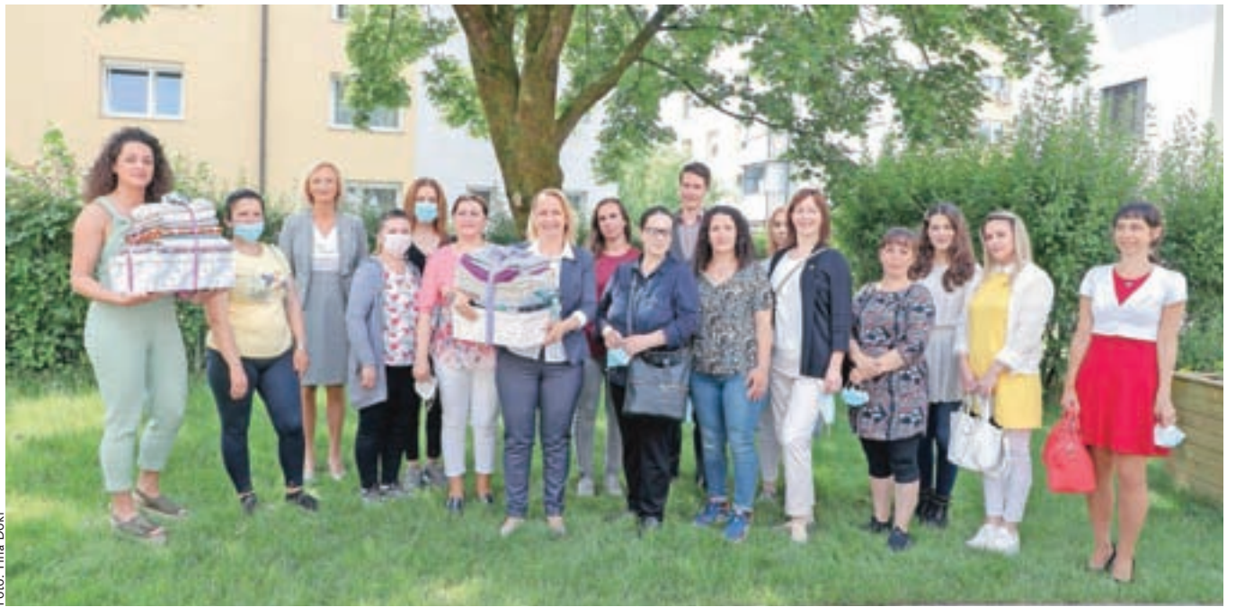
Udeleženke projekta Socialna aktivacija Gorenjske so prejšnji teden v Dom upokojencev Kranj prinesle terapevtske odeje.