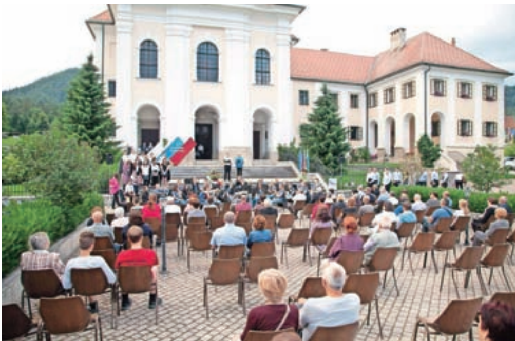
V Adergasu so pripravili pester kulturni program z domovinsko tematiko.