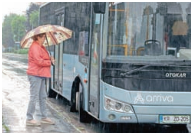
Upokojenci, imetniki evropske invalidske kartice, vojni veterani in vsi, starejši od 65 let, bodo lahko medkrajevni potniški promet od 1. julija dalje uporabljali brezplačno.