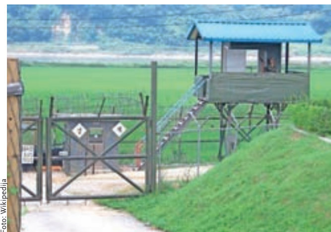
Kontrolna točka na najbolj zastraženi meji na svetu, med obema Korejama, za njo demilitarizirana in smrtna cona.