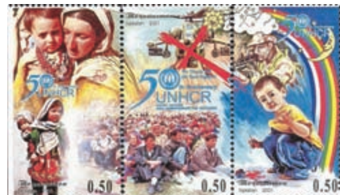
Komplet poštne znamke, ki jih je leta 2001, ob 50-letnici Visokega komisariata ZN za begunce (UNHCR), izdal Tadžikistan. / Foto: Wikipedija