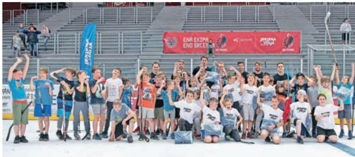
V Dvorani Podmežakla so se mladi minuli petek pomerili na hokejskem turnirju.

jim je pridružilo tudi veliko navijačev. Na koncu sta najboljši ekipi v obeh kategorijah sestavili skupno moštvo, ki se je za glavno nagrado in ime zmagovalca turnirja pomerilo z igralci ekipe SIJ Acroni Jesenice. Na koncu je jekleno hokejsko palico, ki so jo posebej za to priložnost izdelali v družbi SIJ Acroni Jesenice, dvignila ekipa mladih izzivalcev, ki je v dramatičnem obračunu do zmage prišla šele po izvajanju kazenskih strelav.