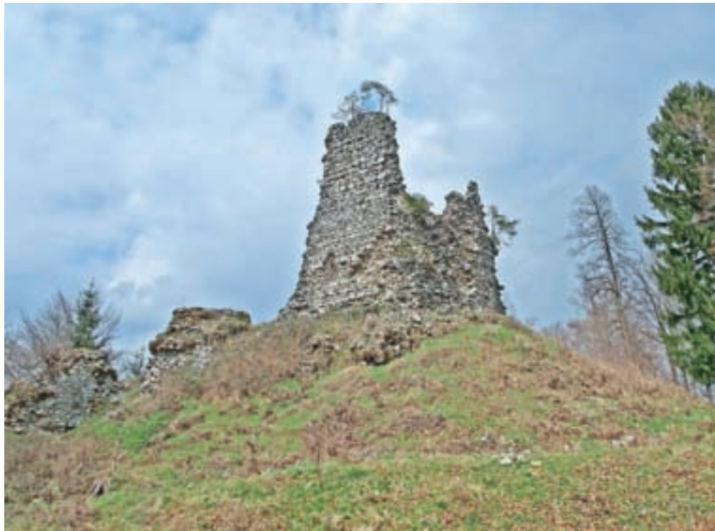
Lipniški grad ali Pusti grad oz. Waldenberg v pisnih virih

ki se začne zmerno strmo vzpenjati in se oddalji od reke. Kratek vzpon se pridruži stezi, ki pripelje s Šobca oziroma iz Radovljice čez Fuxovo brv. Dosežemo križišče poti, kjer zavijemo ostro levo. Naravnost gre pot v Kamno Gorico, desno pa proti Pustemu gradu, kamor bomo tudi še šli. Ko zavijemo levo, se pot kmalu spet razcepi. Sledimo spodnji poti in na občasnih razcepah se tudi držimo desne poti. Hodimo nad Kamno Gorico oziroma Lipniško dolino. Zmerno strma pot nas pripelje do razgledne Zjavke, kjer so klopi in nekakšna lopa. Za lopo