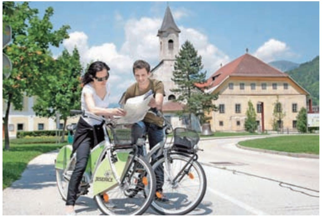
Gorenjsko kolesarsko omrežje je dolgo 450 kilometrov, prihodnje leto ga bodo označili in izdali tudi turistični zemljevid.

Imajo pa kar nekaj težav pri projektiranju na nekaterih odsekih, na Gorenjskem je problematičen zlasti odsek od Bleda do Bohinja