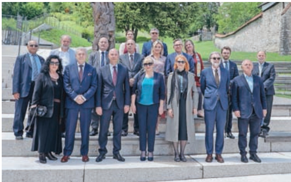
Obisk v Škofji Loki so veleposlaniki držav, akreditirani v Sloveniji, začeli na Trgu pod gradom.