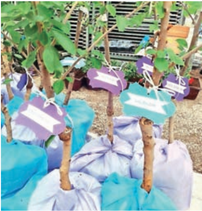
Letos so podarili 37 sadik češenj malčkom, ki so se rodili v lanskem letu.

Lani so izbrali sadike jablan sorte carjevič, prejelo jih je 47 malčkov, predlani sadiko češplje, ki jo je prejelo rekordnih 56 otrok, leto predtem je 47 malčkov prejelo sadiko hruške, prvo leto pa 45 otrok sadiko češnje.