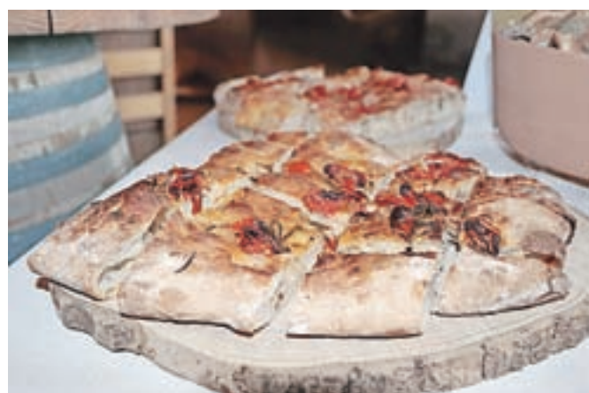
Pogača s češnjevimi paradižniki in rožmarinom

Anita je predstavila še Klub Drožomanija. »Zamisel za ustanovitev kluba drožomanov in drožomank se mi je porodila med karanteno, ko so ljudje začeli kruh z drožmi množično pečiti doma,« pravi. In zamisel se je prijala.