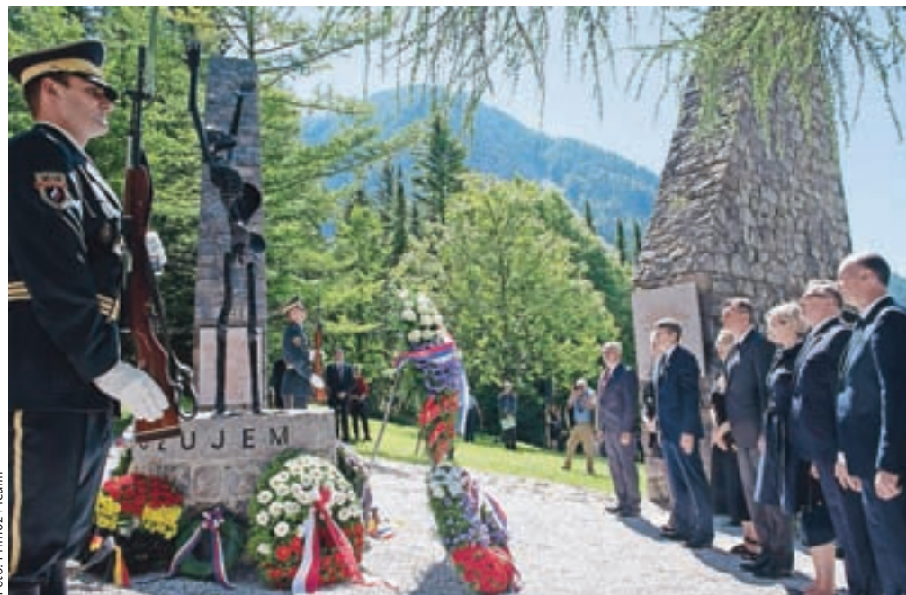
Poklonili so se spominu s položitvijo vencev pri spomeniku Obtožujem – J'accuse.

Podlublje – Spominsko slovesnost je v soboto pripravila Občina Tržič v sodelovanju s Koordinacijskim odborom žrtev vojnega nasilja pri Zvezi borcev za vrednote NOB Slovenije in Združenjem borcev za vrednote NOB Tržič. Koncentracijsko taborišče na Ljubelju je bilo zunanje taborišče enega najbolj uničujočih taborišč – Mauthausna. Med letoma 1943 in 1945 je bilo na Ljubelju privedenih 1800 političnih internirancev. Po narodnosti je bilo največ Francozov, zatem Poljakov, državljani Sovjetske zveze, Jugoslovanov oz. Slovencev. Drugi jetniki so bili iz Španije, Češke, Norveške, Luksemburga, Grčije, Belgije, Nizozemske ... Njihovo trpljenje je bila cena za gradnjo predora, ki naj bi izboljšala prometne poti nemške vojske do Jugoslavije. »Kot v vseh nacističnih koncentracijskih taboriščih je tudi na Ljubelju veljal hud sistem terorja: neprestano nasilje in grožnja s smrtjo, podhranjenost, neprimerne bivanjske razmere in neprimerna oblačila in obuvala, odvzem svobode in identitete. Koliko ljudi je umrlo na Ljubelju, ne vemo, vse kaznovane, onemogle in bolne jetnike so vračali v matični Mauthausen, kjer jih je večina umrla. Na Ljubelju je bilo žrtev štirideset,« je spomnila