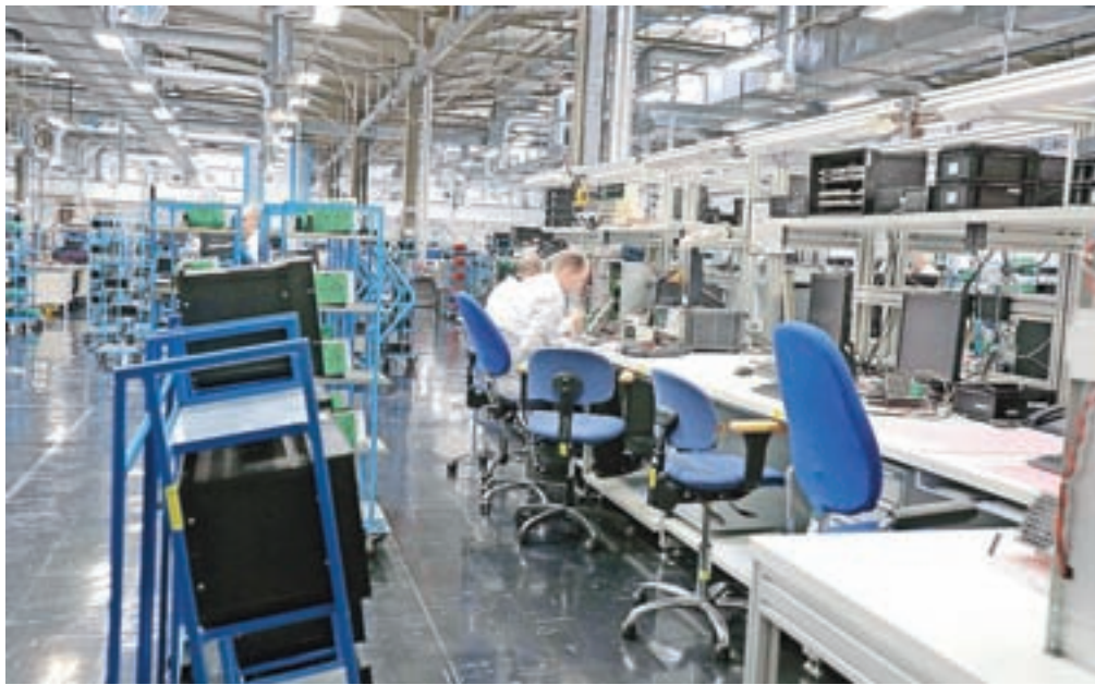
V več podjetjih so izrazili željo, da bi lahko kombinacijo ukrepov skrajšane delovnega časa in čakanja na domu koristili dlje časa.

V Sumidi z Blejske Dobrave pravijo, da zaradi nejasnosti v zvezi s sprejemom tretjega interventnega