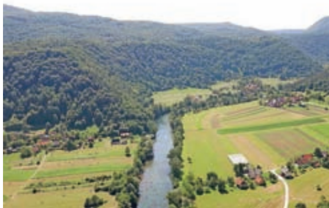
Vzpon na Sodevsko steno nam pričara lep razgled na dolino Kolpe ob Starem trgu.