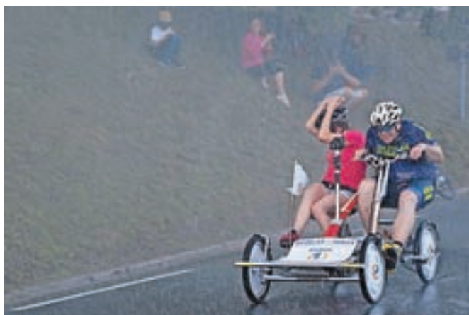
Moker prihod v Škofjo Loko, za kar so poskrbeli gasilci PGD Škofja Loka

Pot Deželaka junaka se bo po osmih etapah končala v petek na Debelem rtiču. Na Gorenjskem ga bomo znova lahko pozdravili jutri. Šesto etapo bo začel ob 7. uri zjutraj v Žagi, na Gorenjsko se bo pripeljal čez prelaz Vršič (12.00), pot nadaljeval skozi Kranjsko Goro (13.00), Gozd - Martuljek (14.15), Golnik (17.00), cilj pa je predviden ob 19. uri v Kranju, kjer bo v četrtek ob 7. uri začel sedmo etapo. Kot še pravi Deželak, je junak lahko vsak in pomaga s poslanim SMS-sporočilom na POMAGAM1 ali POMAGAM5 na 1919. Na ta način boste donirali 1 evro ali 5 evrov, če pa bi želeli donirati več, pošljite e-pošto na: fundacija@radio1.si.