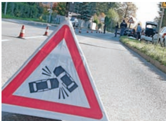
V petkovi nesreči je umrl 33-letni voznik, voznica se je hujše poškodovala, otrok v njenem vozilu pa lažje. (Slika je simbolična.)

Voznik osebnega vozila VW Passat, ki je bilo poškodovano po levi strani, je po nesreči odpeljal naprej v smeri Kranja, zato ga je policija zaradi razjasnitve okoliščin prometne nesreče iskala tudi z javnimi objavami. »Na podlagi zbiranja obvestil in informacij občanov so policisti pridobili podatek o vozilu znamke VW Passat, ki bi lahko bilo udeleženo v prometni nesreči na območju Medvod. Trenutno policisti še intenzivno zbirajo obvestila in preverjajo okoliščine, o vsem pa bodo obveščali pristojno državno tožilstvo,« so v soboto sporočili s Policijske uprave Ljubljana.