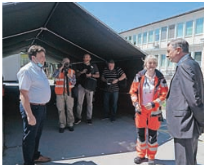
Predsednik si je ogledal tudi Zdravstveni dom Domžale.

da je virus še med nami, zato je zelo pomembno, da občine ekipe Civilne zaščite ohranjajo skupaj – tudi med počitnicami in poletjem.