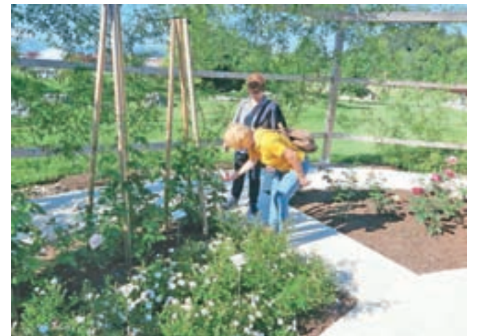
Ljubitelji vrtnic so se letos še posebno pozorno posvetili vonju.

Na vseh treh vodenih ogledih so imeli obiskovalci pomembno vlogo – oceniti so namreč morali vrtnice, ki jim najlepše diši, in izbranko zapisati na list papirja. Zbir vseh je pokazal, da je zmagovalka z najlepšim vonjem sorta rožnate barve MME Isaac Pereire. V čudovitem okolju rozarija sta pod jasnim nebom sledila še koncert in druženje.