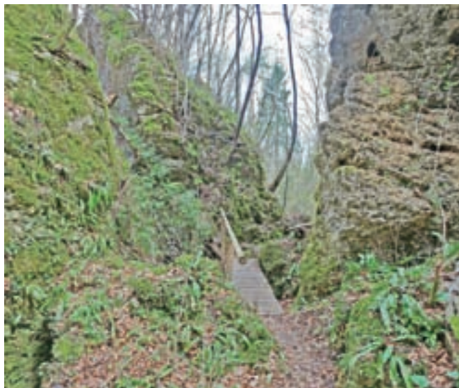
Mostiček na poti skozi Galerije