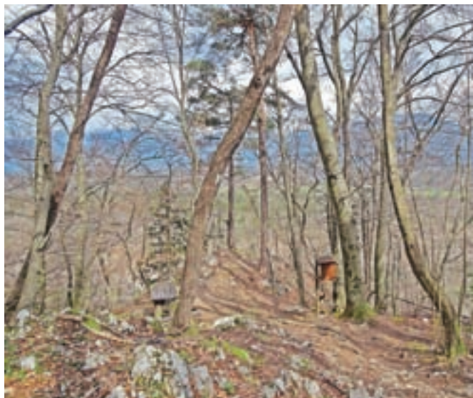
Pomol Ojstre peči

Nadmorska višina: 590 m Višinska razlika: 250 m Trajanje: 3 ure Zahtevnost: ★★★★★