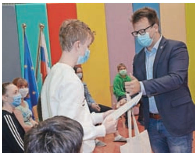
Skupne prireditve za najuspešnejše učence medvoških šol letos ni bilo. Župan Nejc Smole jim je priznanja izročil na vsaki šoli posebej.

podružnični osnovni šoli izobraževanje zaključuje 143 devetošolcev, z odličnim uspehom vseh devet let se jih lahko pohvali 46, kar je dobrih 32 odstotkov. Kriterij za priznanje je ostal enak kot lansko leto, in sicer odličen uspeh vseh devet let (povprečje nad 4,6) ali zlato priznanje na tekmovanju iz znanja ali uvrstitev med tri najboljše na državnih športnih tekmovanjih ali šest najboljših ekip v državi.