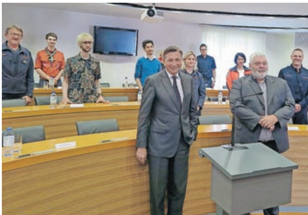
Borut Pahor z županom in predstavniki Civilne zaščite na Občini Domžale

Borut Pahor je uvodoma izrazil zadovoljstvo, da lahko znova obiskuje kraje in ljudi, saj so prav pogovori z njimi zanj izreden vir informacij o tem, kako državljani doživljajo probleme in rešitve, ki jih zanje uvaja država. »Domžalčanom se zahvaljujem v imenu države, čestitam vam za opravljeno delo, več kot očitno ste dokazali, da smo se lahko zanesli na občine, na ljudi, ki so spoštovali ukrepe in delovali povezano. Brez takšne lokalne samouprave nam ne bi uspelo. Vaši rezultati v tej epidemiji so res osupljivi v najbolj pozitivnem smislu, zato vam izražam veliko občudovanje,« je med drugim dejal zelo dobro razpoloženi predsednik, a v resnejšem tonu poudaril,