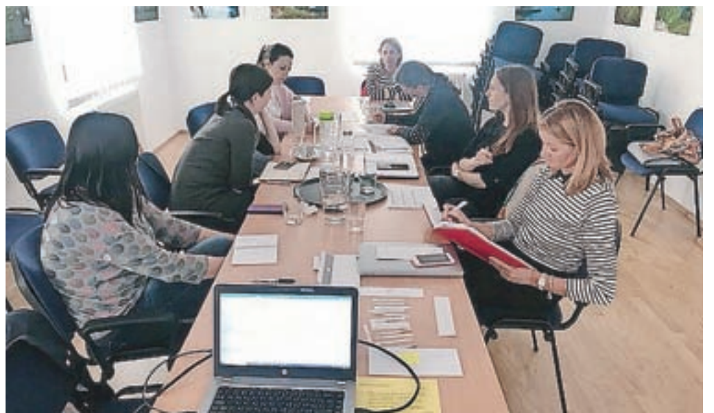
Z nedavne priprave programa počitniških aktivnosti v medgeneracijskem centru

tako da je na vsaki lokaciji v skoraj vsakem terminu še nekaj prostih mest. Prijavni obrazec je na spletni strani LUK. Program sofinancirata MOK, prispevek staršev pa znaša petdeset evrov na teden.