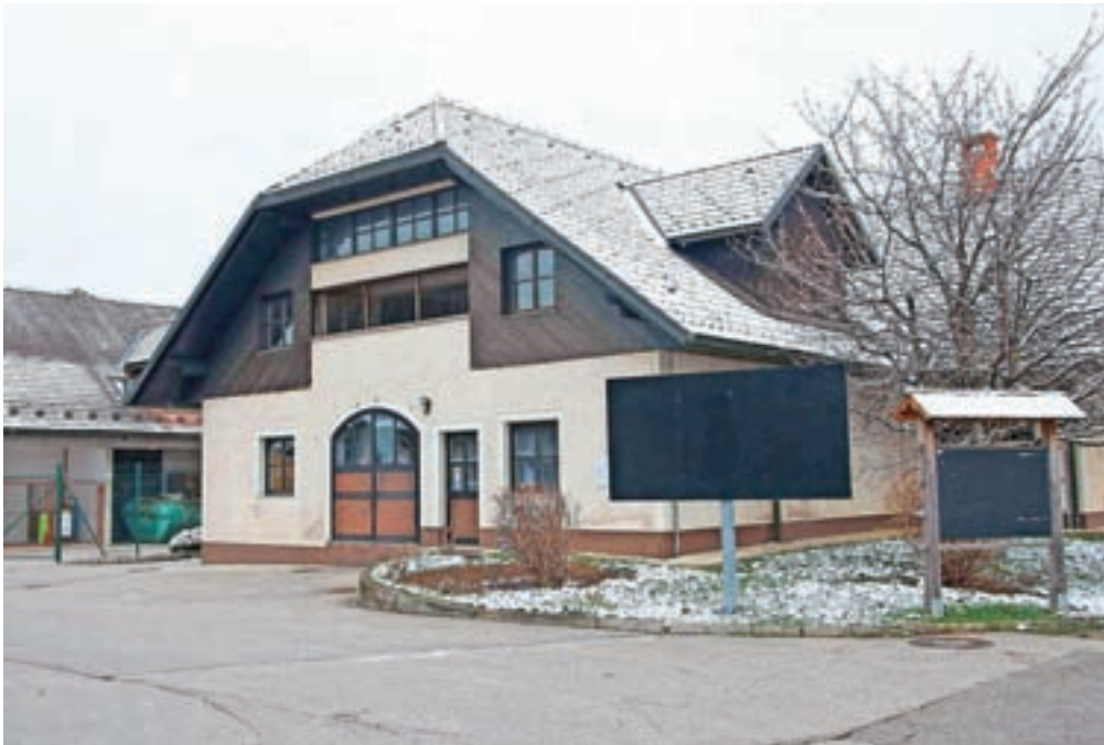
Medtem ko je KGZ Tržič po stečaju SHP-ja poslovno usahnila, je na isti lokaciji v Križah poslovno zaživela KZ Križe.

Kot je »stečajnik« zapisal v otvoritveno poročilo, je zadruga pravna naslednica nekdanje Kmetijske temeljne zadrugne organizacije Tržič, ki je nastala z združitvijo Gorenjske kmetijske zadruge in je bila vpisana v sodni register leta 1993. Sedež zadruge je na naslovu Cesta Kokrškega odreda 24,