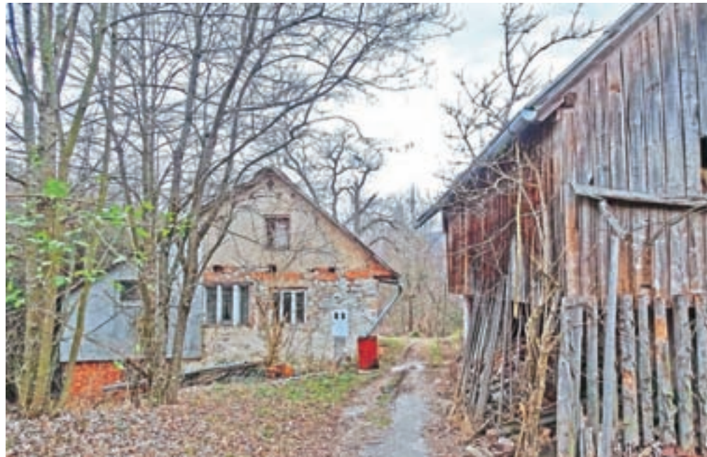
Hiša z markacijo v vasi Gozd