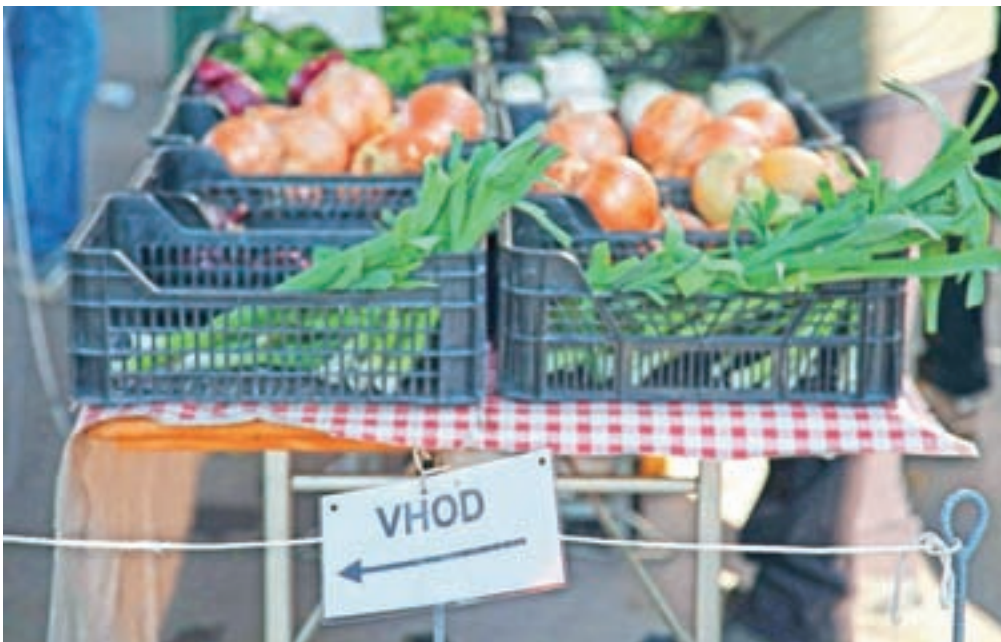
Po domače pridelke in izdelke se je sedaj znova možno odpraviti na nekatere tržnice, kupiti jih je možno pri pridelovalcih samih, ponujati pa so jih začele tudi različne spletne platforme.

Na seznamu, ki ga na občini sproti dopolnjujejo, je več kot 25 ponudnikov, med njimi je tudi Poličarjeva kmetija s Police pri Naklem. Kot nam je zaupala nosilka dopolnilne dejavnosti na kmetiji Andreja Jagodic, se je prodaja na domu pri njih povečala za približno trideset odstotkov. Zaradi koronavirusa