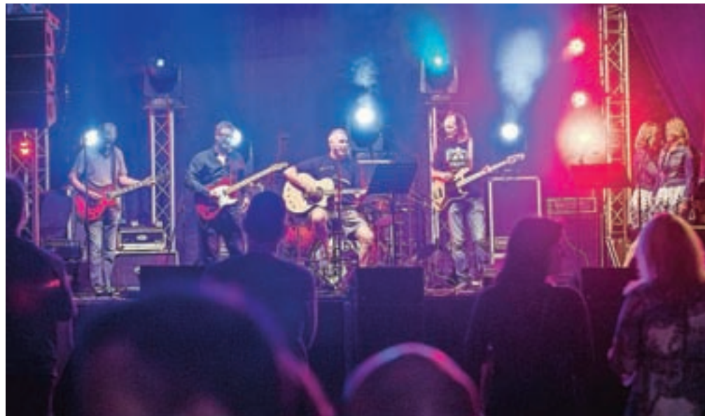
Mal'prepozn so nastopili tudi že v domači Škofji Loki

Za rojstni kraj skupine Mal'prepozn bi lahko izbrali Škofjo Loko, saj vse njene