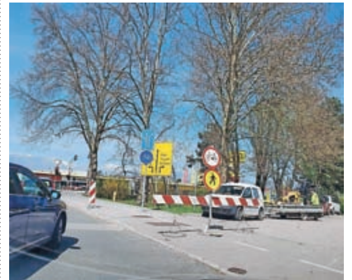
Mogočne platane v križišču Ljubljanske in Šaranovičeve ni več.

Domžale – Občina Domžale se je te dni po posvetovanju s strokovnjaki s področja agronomije, gozdarstva in krajinske arhitekture iz Arboretuma odločila posekati znamenito platano na križišču Ljubljanske in Šaranovičeve ceste. »Zavedamo se, da je platana s svojo dolgoletno prisotnostjo postala del našega mesta, a upoštevati moramo dejstvo, da je ovirala promet, prav tako je rasla na sami kolesarski stezi in pločniku neposredno v križišču. Zato smo nevarno drevo odstranili,« so povedali na občini. So pa že pred tem v parku v neposredni bližini zasadili novo platano, te dni pa so uredili še del kolesarske steze in pločnika, ki ju bodo na novo asfaltirali.