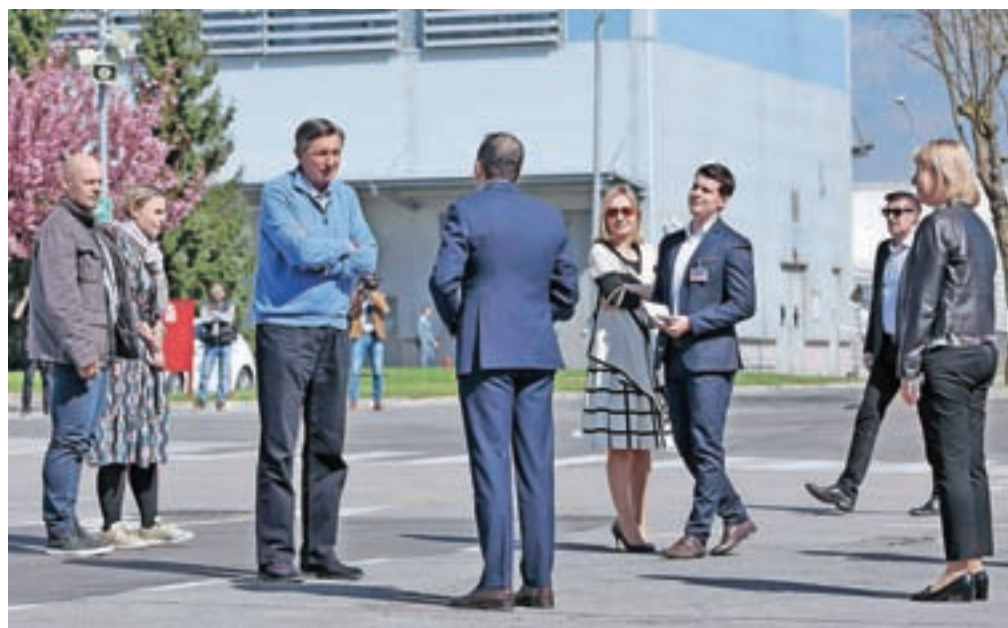
Kot je ob obisku Leka poudaril Pahor, so trenutno oči javnosti uprte v farmacevtsko industrijo.

Mengeš – Na mengeški lokaciji Novartisa so po začetku pandemije začeli poleg rednega dela proizvajati tudi razkuževalno sredstvo. V zelo kratkem času so vzpostavili proizvodnjo, zagotovili primerno embalažo in poskrbeli za polnjenje in distribucijo razkužil. Tako je Novartis v Sloveniji poleg varovalne opreme do petka več kot 35 zdravstvenim domovom, bolnišnicam in domovom za starejše ter lokalnim skupnostim po državi podaril 8300 litrov dezinfekcijskega sredstva.