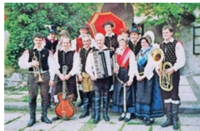
S snemanja oddaje o življenju in delu Slaka Avsenika na Bledu leta 1992