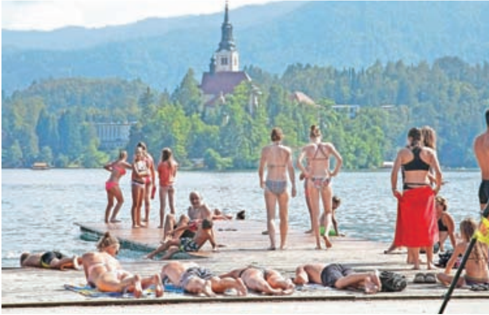
Izpad tujih gostov bi bil za slovenski turizem velik udarec.

O morebitnih prepovedih je trenutno zelo nevhvaležno govoriti, saj se situacija spreminja iz dneva v dan, pravijo na Turizmu Kranjska Gora. »Prepoved dopustovanja v tujini za naš turizem obenem pomeni priložnost, da se s promocijskimi aktivnostmi še bolj izrazito usmerimo na domači trg,« so pojasnili. Slovenija je zelo raznolika država in na površini dvajset tisoč kvadratnih kilometrov je mogoče hribolaziti, plavati v morju, se sprehajati med vinogradi, kolesariti ..., zato bo po njihovem vsak Slovenec lahko našel svoj kraj za aktivno preživljanje dopusta. »Za nas, turistične organizacije, je to enkratna priložnost za razvijanje novih produktov