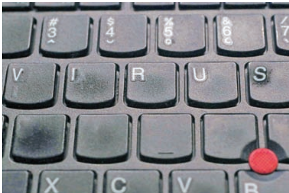
Na družbenih omrežjih se pojavlja zelo veliko informacij o bolezni covid-19 in o zaščiti pred koronavirusom, ki so močno dvomljive, ugotavljajo v Safe.si.

Lancovo – Radovljiški policisti so v nedeljo obravnavali voznika, ki je z večjo hitrostjo peljal proti Lancovemu in jim ni ustavil, med vožnjo pa je storil še več drugih prometnih prekrškov. Policisti so ga po dogodku izsledili in ga obravnavajo zaradi neupoštevanja znakov za ustavljanje, neprilagojene hitrosti vožnje, neupoštevanja prometne signalizacije, nepravilne vožnje po cesti in nepravilnih premikov z vozilom. Proti vozniku poteka prekrškovni postopek.