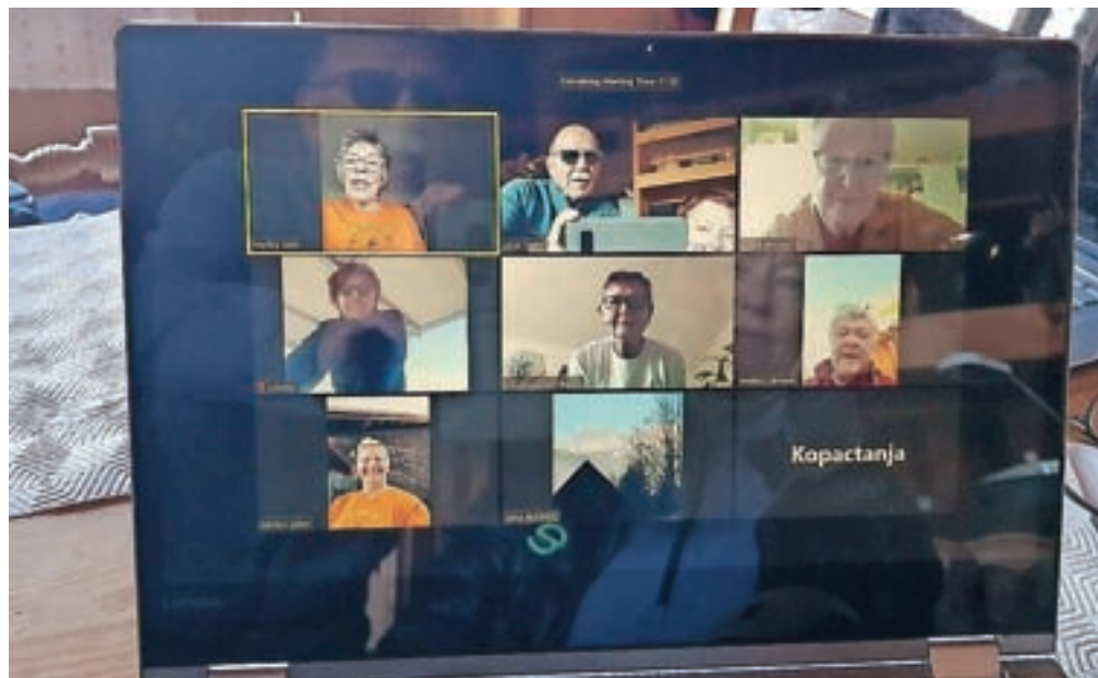
Prvo uspešno snidenje telovadcev iz Prešernovega gaja