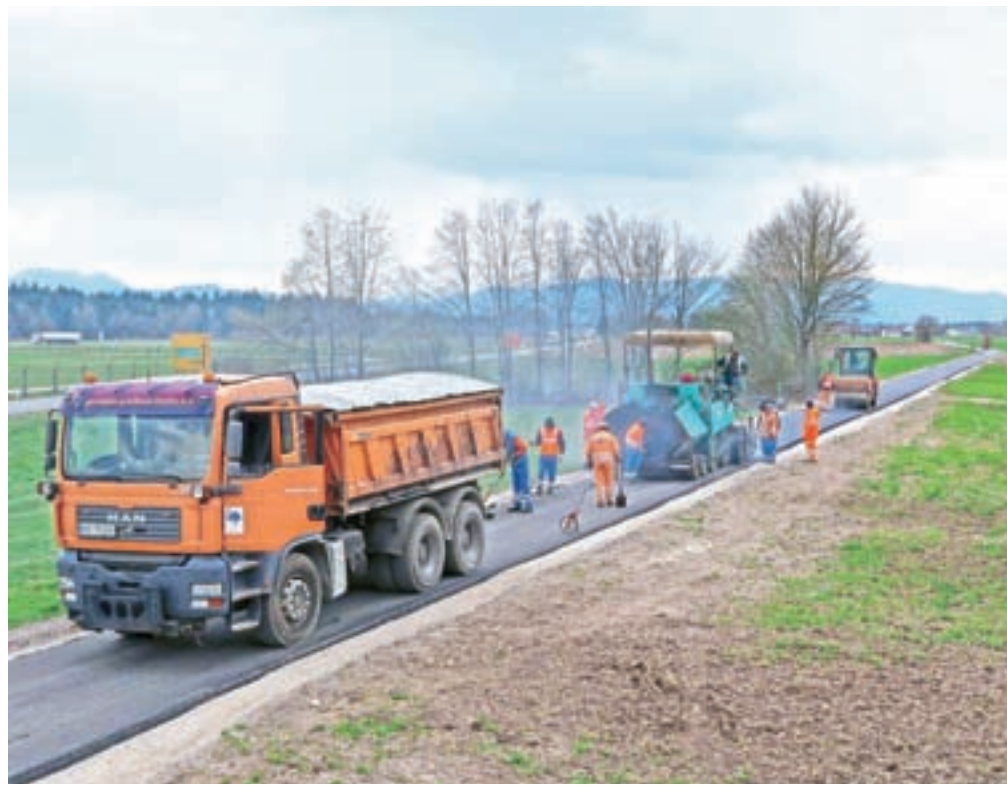
Asfaltiranje Beleharjeve ceste

Šenčur – Medtem ko je zaradi koronavirusa življenje ohromljeno, nas je zanimalo, kako je s potekom naložb v občini Šenčur. Župan Ciril Kozjek je povedal: »Vse investicije se, skladno s sprejetim proračunom, za zdaj odvijajo, kot je bilo predvideno. Izvajali smo določena vzdrževalna dela, pred kratkim smo asfaltirali povezovalno Beleharjeva ulica–državna cesta G2-104. Postavili smo tudi prometno signalizacijo, ki omejuje promet na tem odseku, promet je dovoljen pešcem in kolesarjem ter lastnikom kmetijskih zemljišč. Predvidena dela pri gradnji kanalizacije na odseku Krožne poti v Vogljah se še niso začela. Objavili smo vse javne razpise za izbiro izvajalcev pri predvidenih investicijah, kakšen razpis je malo kasneje, kot smo upali, vendar stvari tečejo v pravi smeri. Objavljeni so razpisi za gradnjo pločnika Luže-Srednja vas, gradnjo komunalne infrastrukture naselij Prebačevo in Voklo in rekonstrukcijo Kranjske ceste–AC Kranj vzhod. Objavili bomo še razpisa za ureditev komunalne infrastrukture za območje ŠE-32 (stanovanjsko naselje blizu gostilne Ančka) ter za spremembe