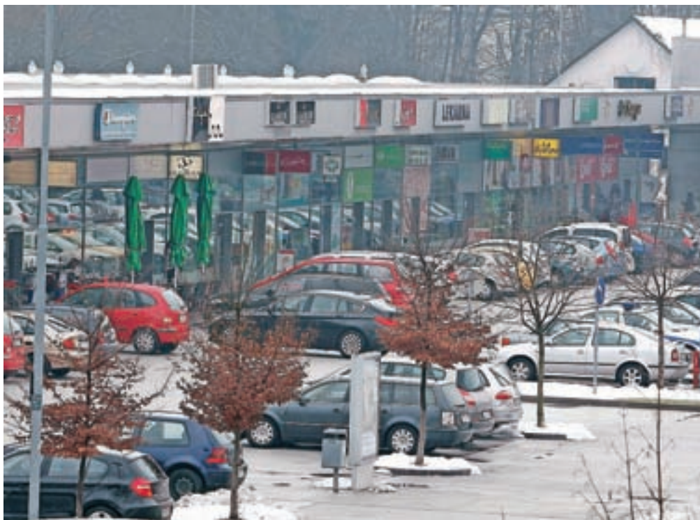
Število sklenjenih najemnih pogodb in aneksov k pogodbam za lokale je lani ostalo na podobni ravni kot leto prej.

Na ravni države je povprečna mesečna najemnina za pisarno znašala 8,90 evra na kvadratni meter (brez DDV)