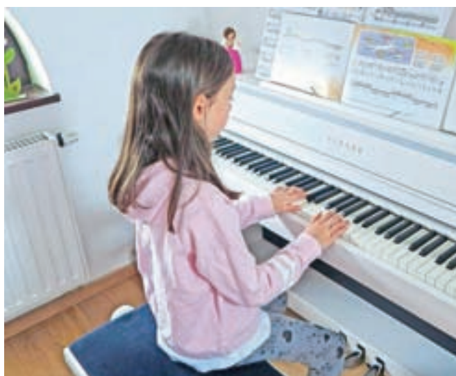
Tudi pouk v glasbenih šolah ta čas poteka na daljavo, a učenci v letošnjem šolskem letu ne bodo opravljali letnih izpitov.

Strokovnjaki z zavoda za šolstvo ravnateljem oziroma učiteljem svetujejo, naj bo presoja pri ocenjevanju odvisna od dejanskih možnosti za doseganje učnih ciljev učencev, v času izobraževanja na daljavo pa naj učitelji ocenjujejo znanje, ki je bilo ustrezno obravnavano ter utrjeno z različnimi oblikami in metodami. Učencem morajo učitelji zagotoviti možnost, da izdelek oziroma dokaz o naučenem na podlagi povratnih informacij tudi izboljšajo. Pri določanju zaključne ocene naj izhajajo iz ocen, pridobljenih do 16. marca letos, ob tem pa naj upoštevajo tudi izkazani napredek učenca v obdobju izobraževanja na daljavo in