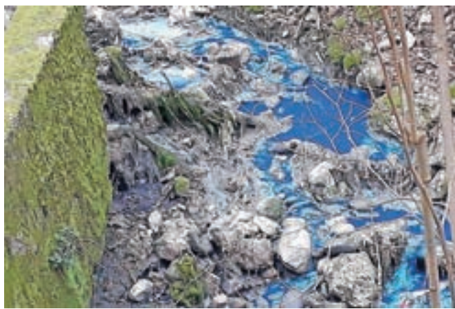
V soboto je v Hrastju v Savo spet odtekala neznana modra snov.

okoljsko inšpekcijo in ribiškega čuvaja. Dogodek so si ogledali tudi kranjski policisti. Na Policijski upravi Kranj so pojasnili, da je bil na kraju zavarovan vzorec vode, v času obravnave dogodka pa do pogina živali ni prišlo. Tudi včeraj, po vnovičnem preverjanju, so sporočili, da posledice v naravnem okolju niso nastale. Vzrok onesnaženja še ni znan.