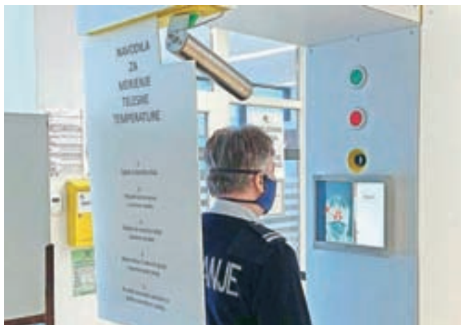
Merjenje telesne temperature je brezkontaktno, oseba lahko nosi zaščitno masko, saj naprava meri temperaturo v očesni jamici.

brezkontaktnim merilcem temperature, ki ima vgrajeno infrardečo kamero in posebno referenčno temperaturno sondo. »Kamera vsako sekundo opravi več deset meritev in povprečje izmerjenih temperatur prikazuje kot meritev. Tako za zelo natančno meritev zadošča že enosekundni pogled v objektiv. Meritev je mnogo natančnejša zaradi stal-