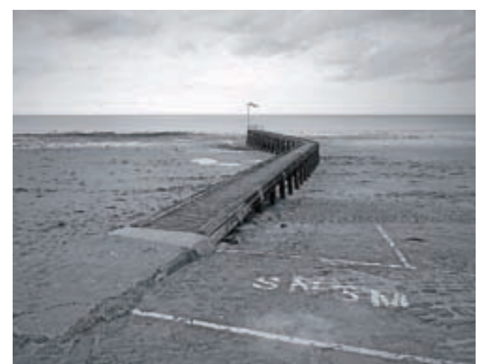
Pomol rešitve, Obala Omaha

Na spletnem naslovu http://www.drustvo-pungert-kranj.si/ boste našli povezavo do virtualne galerije. S klikom na fotografijo se ta »odpre«, izpišeta se naslov in kratek zapis o njej. »Normandija je s svojo razgibano obalo čudovit iziziv za fotografe. Nivo morja se dviguje v ritmu plime in