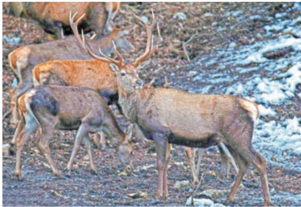
Odstrel jelenjadi je vsako leto pomembna tema razprav o letnem lovsko-upravljavskem načrtu.