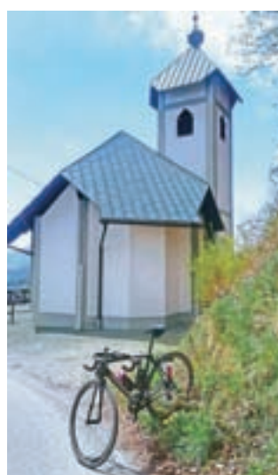
Cerkev svete Jedrt v Lajšah, ki leži osemsto metrov od meje s kranjsko občino

kjer se začne planota Jelovica. Ta vzpon je med najbolj strmimi asfaltiranimi vzponi na Gorenjskem. Lahko pa se v