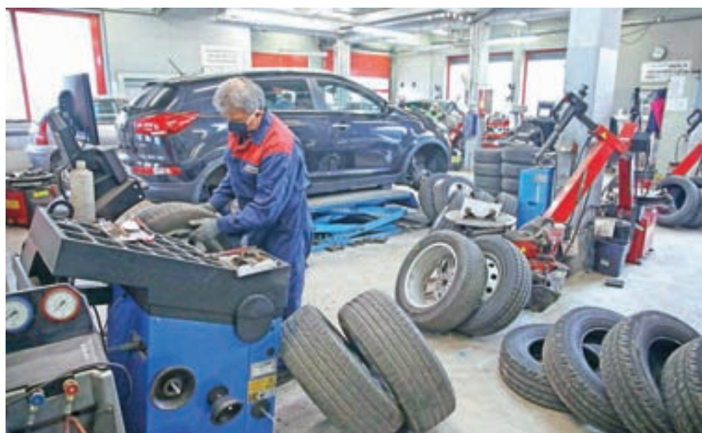
Vlada rahlja protikoronske ukrepe, odprte so že lahko vulkanizerske delavnice (na sliki) pa tudi prodajalne z gradbeno-inštalaterskim materialom, tehničnim blagom in pohištvo, kemične čistilnice, dovoljene so storitve, kot so tehnični pregledi vozil, krovsko dela, osebni prevzem blaga ali hrane ...