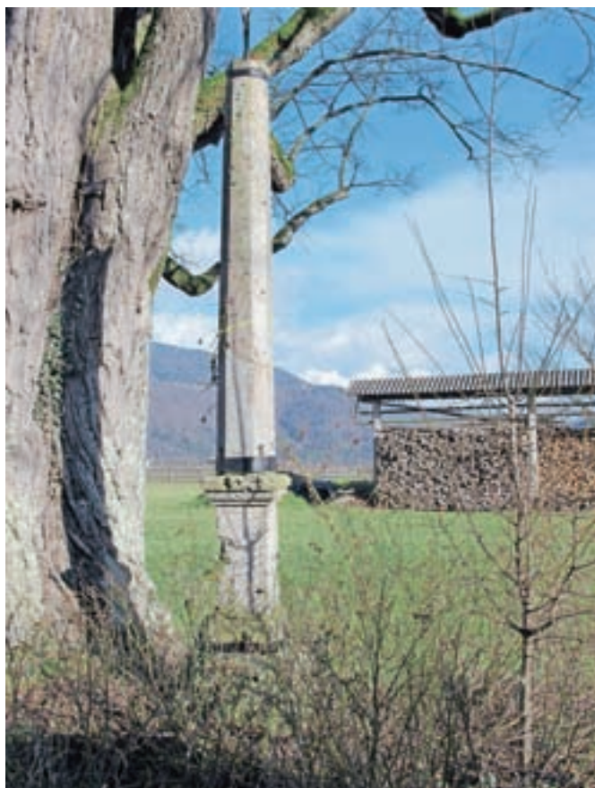
Kužno znamenje pod »farovško« lipo v Cerkljah iz leta 1645

za preživetje in v spomin na kugo, ki je v tistem času morila v Cerkljah in okolici. V vaseh Spodnji Brnik in Vopovlje so tistega leta imeli vsak dan do pet mrličev, ki so umrli za kugo. Zato so jih začeli pokopavati na novo pokopališče na Spodnjem Brniku, ob podružnični cerkvi sv. Simona in Juda Tadeja. Kuga je leta 1645 morila tudi v okolici Ljubljane, največ v Dravljah, kjer so postavili tudi cerkev, posvečeno sv. Roku, zavetniku proti kugi.