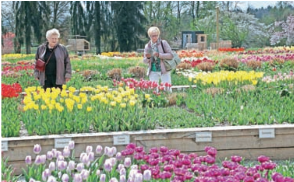
Gredice v Arboretumu so že v polnem cvetju, a za sprehod po parku veljajo posebna pravila.

»Za letošnjo sezono smo se zaradi posebnih razmer pripravili malo drugače. Da bi minimalizirali možnosti za okužbo s koronavirusom pri obiskovalcih in zaposlenih, smo prilagodili pravila vstopanja in obnašanja v parku. Ločili smo pot vstopa in izhoda iz parka. Izhod bo skozi vrata v drevoredu. Da ne bi prihajalo do neposrednega srečavanja, bomo obiskovalce ob vstopu usmerili na levo in jih po glavnih poteh usmerjali z rumenimi puščicami 'Priporočena pot',« je o novem režimu na vhodu povedal direktor