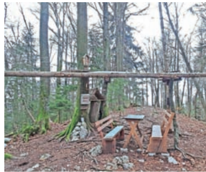
Vrh Vovarja nudi prijeten počitek.

prečimo nekaj skal. Po grebenu poteka Pot razgleda. Precej strmo se spustimo, nato pa dosežemo kolovoz. Zavijemo levo in sledimo kolovozu vse do vasi Gozd. Pred vasjo Gozd se pred nami pokaže Rogatec, pokaže se tudi Velika planina, če pa pogledamo proti zahodu, pa dominira Grintovčeva streha. Ko dosežemo vas, se sprehodimo skozi vas, nato pa bodimo pozorni na staro hišo na levi strani. Na njej bomo zagledali markacijo. Pred to staro hišo stoji na desni strani lesen senik. Gremo tod mimo in na drugi strani najdemo stezico, ki poteka po nekakšni polički.