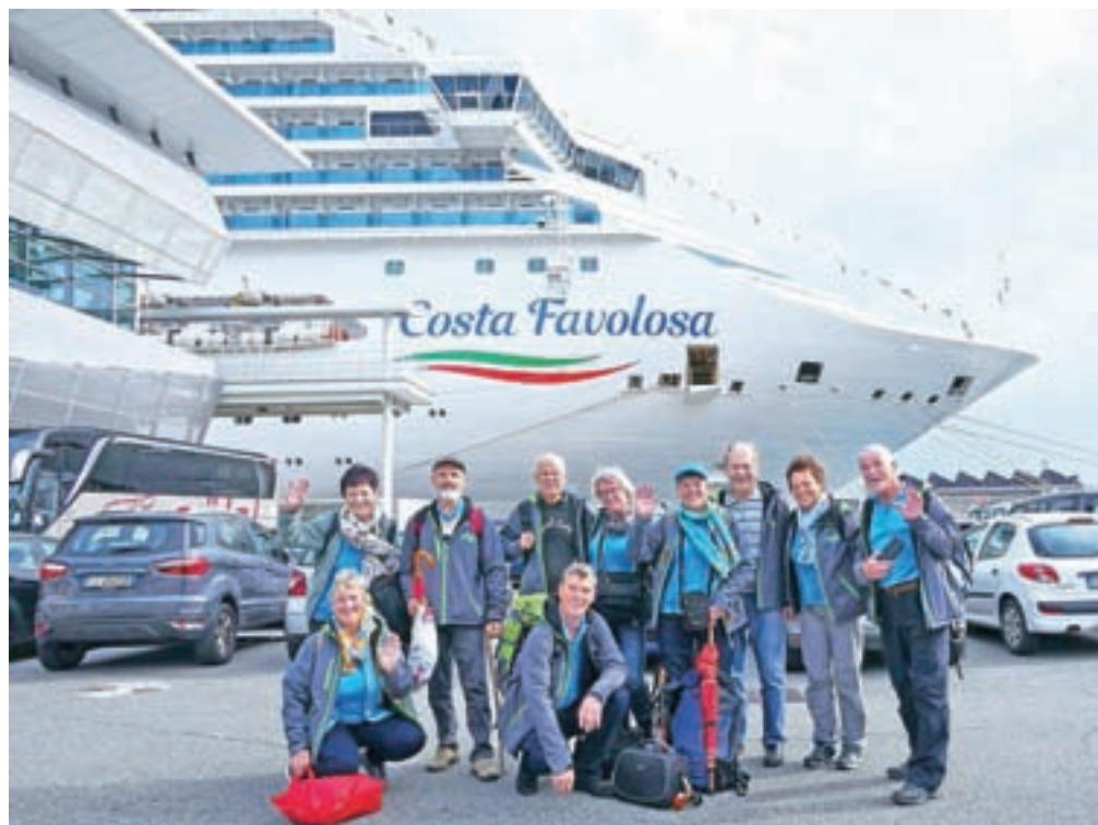
Člani folklorne skupine v pristanišču v Savoni

sedemdesetletnici, snemali novoletno oddajo, plesali tudi ob petdesetletnici Avsenikove glasbe in še bi lahko našteval. Zadnjič v živo pa smo bili s Slavkom Avsenikom ob odprtju spomenika