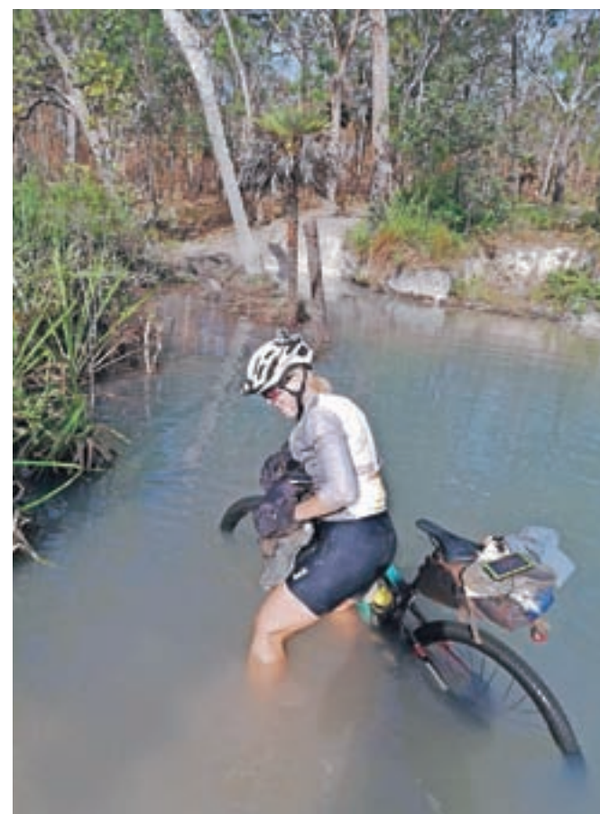
Prečkanje enega od številnih vodotokov med Cape Yorkom in Cairnsom

Po njenem mnenju morajo biti kolesarke hvaležne Susan B. Anthony, ameriški borki za pravice žensk v tej panogi: »Po njeni zaslugi in zaslugi drugih pogumnih pripadnic nežnejšega spola kolesarjenje tako v večini držav ni greh. Razmerje med moškim in ženskim kolesarstvom je razmerje dneva in noči, tudi kar zadeva denarne nagrade. Lani je zmagovalka skupne razvrstitve na Giru Rosa dobila