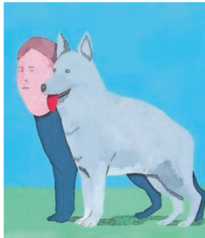
Tereza Prepadnik: Good boy, akrl na papirju, 2020

Pripravili sta izbor mladih umetnikov, ki ustvarjajo v najrazličnejših likovnih tehnikah, od risbe, ki ostaja temelj marsikatere ilustracije, preko raznovrstnih kolažev, do sodobnih pristopov povsem digitalne ilustracije in 3D-modeliranja podob. »Pestrost izraznih načinov avtorjem omogoča neskončno domiselnost in pomensko večplastnost, ki dane podobe povezuje z brezčasnim poljem referenc,« dodajata kuratorki