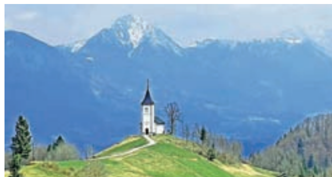
Z Jamnika je lep razgled proti Storžiču

Predoslje in naredimo še ovinek v lepo vas Suha ter nazaj v Predoslje, nato mimo posesti Brdo na začetek Kokrice ter pri Kolesarskem servisu Žagar zavijemo desno skozi Bobovek proti Beli, zavijemo levo proti Tatincu in naprej v Čadovlje in Žablje ter levo proti Trsteniku. Ko pridemo skozi Trstenik po približno petsto metrih zavijemo desno proti Goričam in nato levo nazaj po cesti Golnik-Kranj