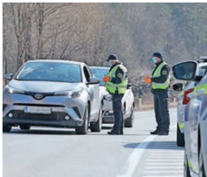
Gorenjski policisti kontrole opravljajo v rednem prometu, na kontrolnih točkah in javnih krajih znotraj občin. Na sliki: sobotna kontrola na Hrušiči.

V nadzoru na slovenskem avtocestnem omrežju je od petka do nedelje sodelovalo 139 policistov. Kontrolirali so 3.348 voznikov in pri tem ugotovili 103 kršitve odloka. Od tega so v 69 primerih izrekli opozorilo, za 34 kršitev pa bodo podali predlog zdravstvenemu inšpektoratu, so razložili na generalni policijski upravi. »Najpogostejši