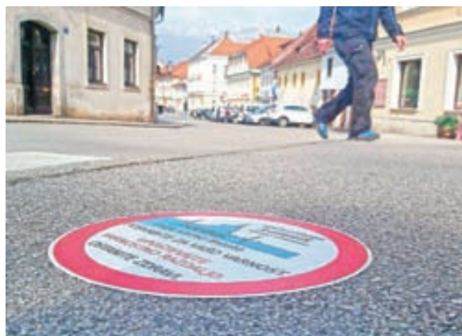
Talne nalepke so nameščene po vsem ožjem središču Kamnika.

Kamnik – Predstavniki Občine Kamnik so skupaj z Občinskim štabom Civilne zaščite in ob pomoči prostovoljk Študentskega kluba Kamnik ta konec tedna ožje mestno središče opremili z opozorilnimi talnimi nalepkami o varnostni razdalji z željo, da občani ostanejo zdravi. Nalepke, s katerimi opozarjajo, da je previdnost potrebna prav na vsakem koraku, so namestili pred lekarno, pošto, bančne poslovalnice, pekarno, trafiko in druge še delujoče trgovine in ustanove, na pločnike in prehode za pešce ter drugje, kjer se gibljejo občani.