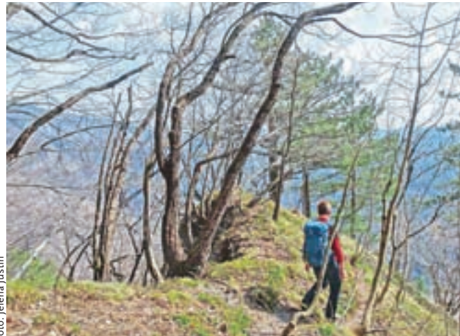
Lep, a ponekod izredno strm je sestop do Vrbice.