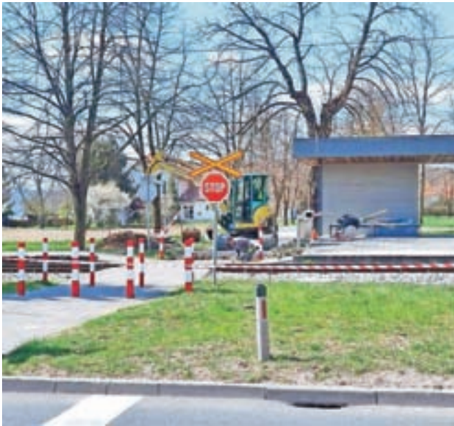
Železniški prehod so zavarovali z dodatnimi preprekami za pešce in kolesarje.

Prehod dnevno prečka veliko ljudi, predvsem otrok in mladostnikov, saj je to glavna in edina povezava za učence OŠ Rodica ter študente Oddelka za zootehniko Biotehniške fakultete v Ljubljani na poti v šolo oziroma domov. Z dodatnimi tehničnimi rešitvami je prehod odslej bolj zavarovan in posledično bolj varen, so prepričani na občini. »Železniški prehod smo dodatno zavarovali z zaporo, ki bo fizično onemogočala neposreden dostop do železniških tirov. To smo izvedli s