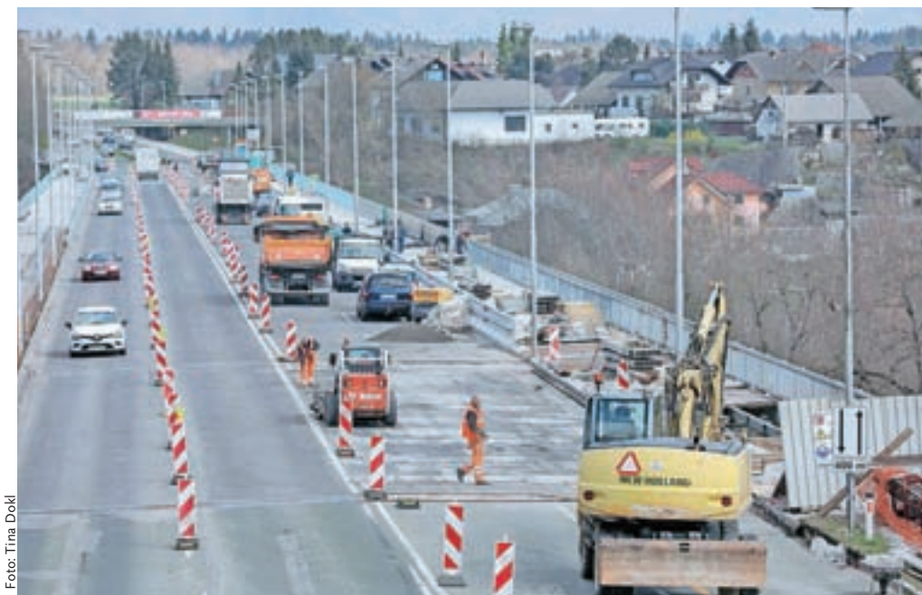
Prenova Delavskega mostu v Kranju se bo po pričakovanjih zavlekla do konca julija.

»Trenutno je na gorvodni strani objekta že izvedena