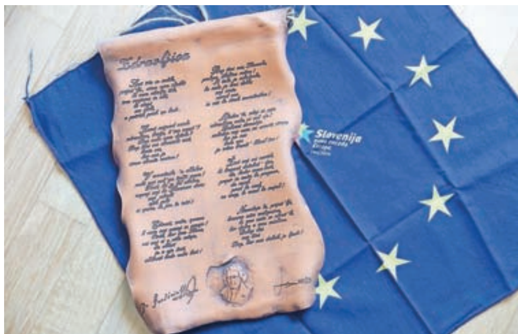
Vrednote, ki jih je Prešeren zapisal v Zdravljico, so tudi temeljne vrednote Evropske skupnosti. Fotografija je simbolična.