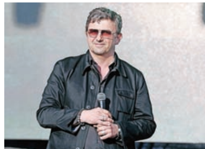
Petdesetletni avstrijski igralec Hans Sigl se pred slovensko televizijsko publiko ponovno vrača v vlogi dr. Gruberja. Že trinajsto sezono priljubljene nemško-avstrijske serije Gorski zdravnik si lahko premierno ogledate na Pop TV. V preteklosti je obiskal tudi Ljubljano, kjer je v živo nagovoril svoje gledalce in gledalke pod odrom. Tam je nastala tudi zgornja fotografija.

Serija Najini mostovi pa se je s prvim aprilom z zadnjim delom spomladanskih epizod poslovila z malih ekranov in se z nadaljevanjem prigrad v očarljivi Vipavi spet vrača na male zaslone jeseni.