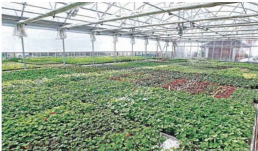
Dopolnjeni vladni odlok dovoljuje odprtje vrtnarij, drevesnic in cvetličarn.

V prodajalnah z živili lahko nakup od 8. do 10. ure opravi izključno ranljive skupine (invalidi, upokojenci, nosečnice). Na novo je dodan še nakup v zadnji uri delovnega