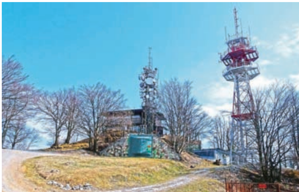
Najvišji vrh Pentlje je Krim, ena od trigonometričnih točk Slovenije.

Z vrha Krima nadaljujemo v smeri Pentlje, proti Kavcu, a le do makadamske ceste, ki pelje na Krim iz Rakitne. Zavijemo levo in sledimo cesti ter markacijam Pentlje. V t. i. Lepi dolini zavijemo s ceste levo v gozd, na planinsko pot, ki nas pripelje pod Rotovc, 964 m n. m. Povzpne se na vrh, kjer dobimo sedmi žig. Pod nami je Rakitna, kjer bomo današnjo etapo zaključili, a do tja nas čaka še dobre štiri ure hoje. Z vrha sestopimo nazaj do planinske poti in sestopimo skoraj do