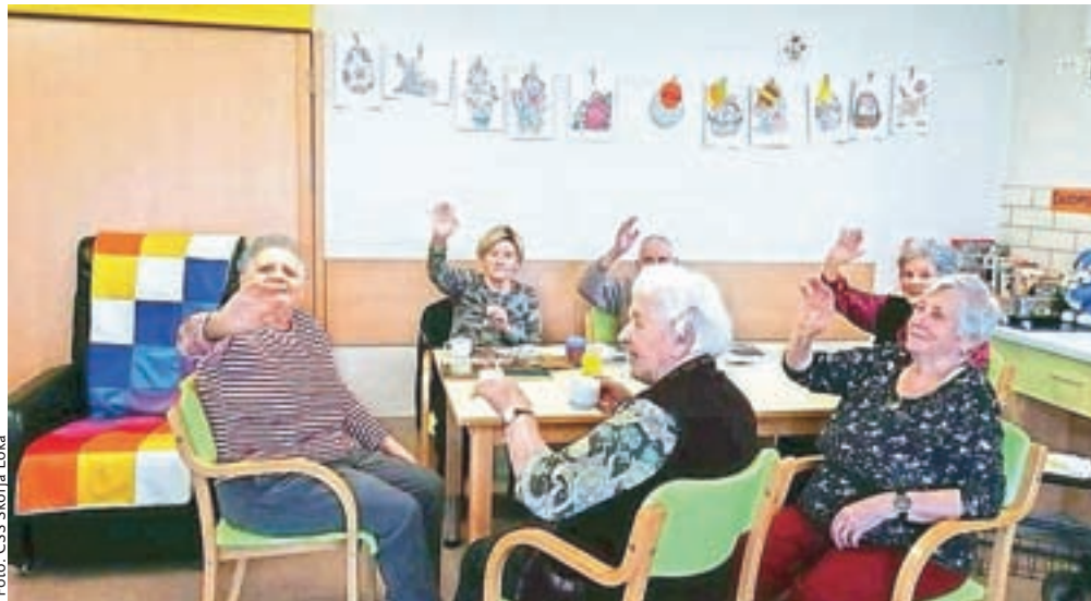
V domovih starostnikov ljudje stanujejo in »domujejo«. Fotografija je simbolična in so nam jo 23. marca poslali iz Centra slepih, slabovidnih in starejših v Škofji Loki.