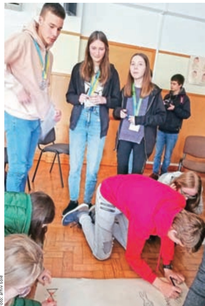
Učenci so izdelali tudi plakat o porabi in pojmovanju časa.

Učenci so na izmenjavi pridobili veliko novih izkušenj in spleti prijateljske vezi s tamkajšnjimi vrstniki. V spominu so jim ostali kot zelo zelo topli in prijazni, saj jih je marsikdo presenetil s pristrčnim objemom in poljubom že ob prvem stiku.