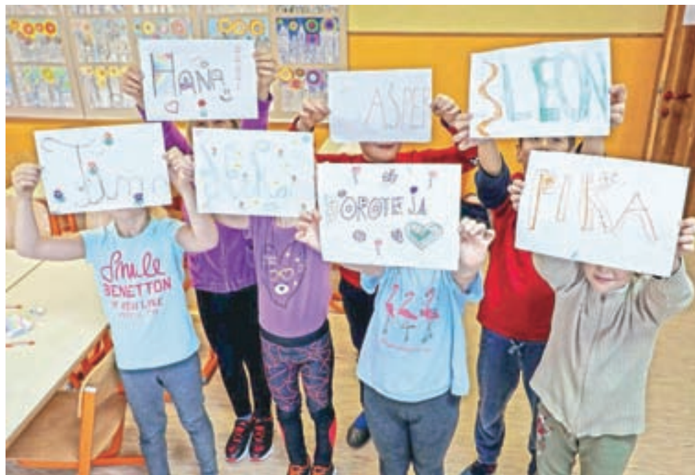
Prebivalci Slovenije smo poimenovani s skoraj 57.000 različnimi imeni.

Na lestvici najpogostejših ženskih imen se zaporedje prvih petih v zadnjem