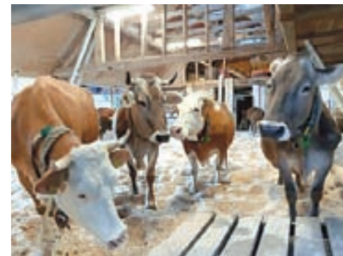
Ekološka kmetija Pr' Demšari

Na okrogli mizi, ki bo potekala 9. marca v Škofji Loki , bodo predstavljene velike in še