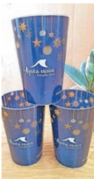
Novi kozarci za večkratno uporabo

Kranjska Gora – Občina Kranjska Gora se kot prejemnica zlatega znaka Slovenia Green v oktobru 2019, ki ga podeljuje Slovenska turistična organizacija, trudi hoditi po poti trajnostnega razvoja turizma in pisati »zeleno zgodbo Slovenije«. Tudi zato so se odločili za uvedbo kozarcev za večkratno uporabo na vseh večjih prireditvah, ki jih organizirajo, k uporabi pa so se zavezali vsi ponudniki v Alpški vasi v Kranjski Gori. Kot so sporočili iz Turizma Kranjska Gora, so novi kozarci ekološki, izdelani iz reciklirane plastike in okolju ter uporabniku prijazni (saj ne vsebujejo BPA) in pri stiku s tekočino nimajo škodljivih učinkov na zdravje ljudi. Z uvedbo kozarcev za večkratno uporabo v splošnem želijo spodbuditi gospodarstvo