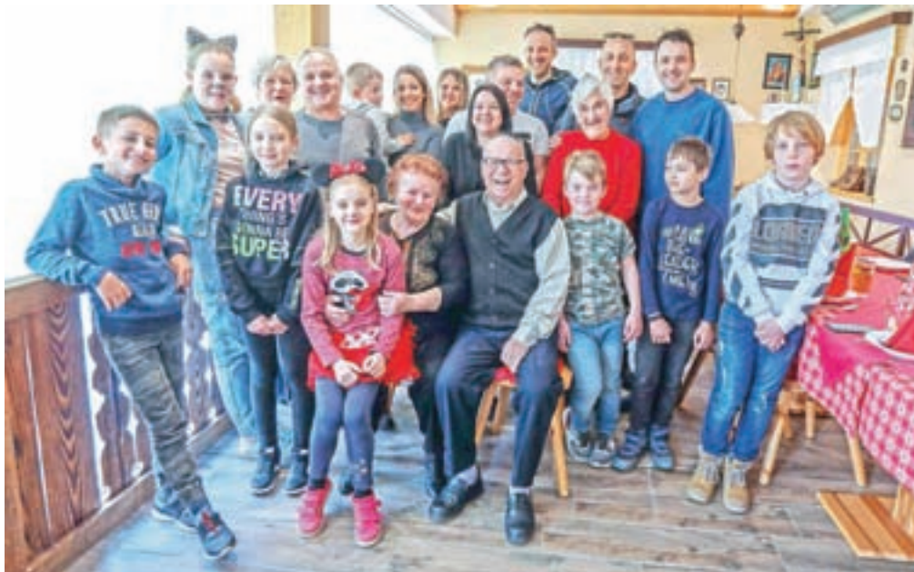
V krogu najbližjih sta 65. obletnico poroke proslavila v Gostilni Marinšek.

Med obujanjem spominov sta nam zaupala, da sta v mladih letih zelo rada plesala. »Bila sva tako dobra, da so naju na plesišču pogosto