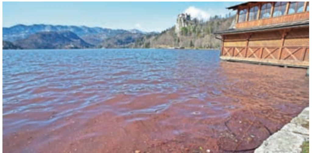
Pogled na rdečo sluz na gladini jezera ni prav nič prijeten.

Razrast cianobakterij je posledica prevelike obremenjenosti z organskimi snovmi in anorganskimi hranili, pojasnjuje Špela Remec Rekar. Tako drastično poslabšanje, kot so ga zaznali ob februarjskih meritvah, pripisuje delom, ki jih izvajajo ob urejanju kanalizacije in ribogojnice v bližini regatnega centra. »Zemljina, ki jo ob tem izkopavajo in se spira v Mišco, že od lanskega avgusta v jezero vnaša