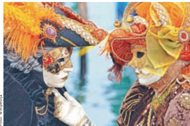
Ljubimca – maski, posneti na beneškem pustnem karnevalu v začetku februarja 2010. Letos so karneval zaradi epidemije koronavirusa tik pred vrhuncem prekinili.