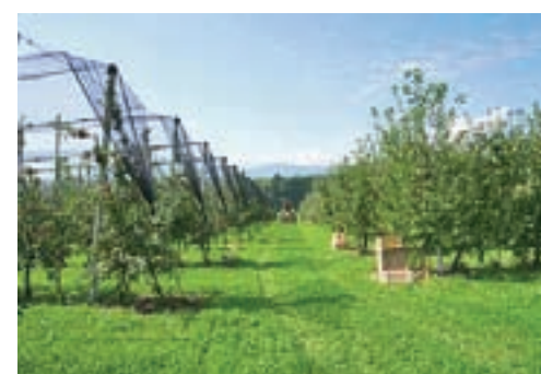
Drevesnica Zakotnik

vedno ne dovolj izkoriščene možnosti, ki jih ponuja slovensko podeželje s kakovostnimi prehranskimi pridelki in izdelki ter vabijo k sodelovanju nove kmetovalce oziroma potencialne pridelovalce senenega mleka ter sadja. Predstavniki vrtcev, šol in drugih ustanov z organizirano prehrano, strokovni kader in drugi zainteresirani pa boste izvedeli, kakšne so možnosti sodelovanja, povezovanja in vključevanja v kratke prehranske oskrbovalne verige.