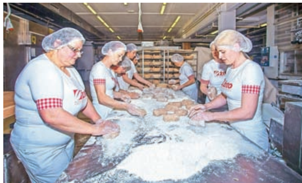
Nekatere vrste nagrajenega kruha pečejo tudi v Žitovi pekarni (Gorenjka) v Lescah.

Odličja podeljuje neodvisna komisija, v kateri strokovnjaki s pekarskega področja ocenijo zunanji videz izdelka, lastnosti skorje in sredice ter vonj in okus, so pojasnili v Žitu. »Teh 61 odličij je odraz naše zaveze kakovosti ter rezultat celoletnega truda in skupnega dela vseh, ki so vključeni v