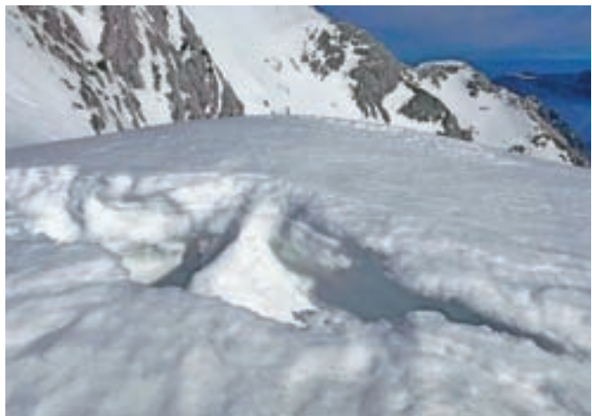
Snežna razpoka nad Pripraviško grapo pred zadnjim sneženjem

Kranjska Gora – Gorenjski policisti so v torek opozorili, da je na Mali Mojstrovki nastala smrtno nevarna snežna razpoka. Opast nad Pripraviško grapo je zaradi zadnjega sneženja postala še bolj nevarna. Kranjskogorski gorski reševalci in policisti zato opozarjamo na veliko previdnost, vzpone in gibanje na tem območju pa odsvetujejo.