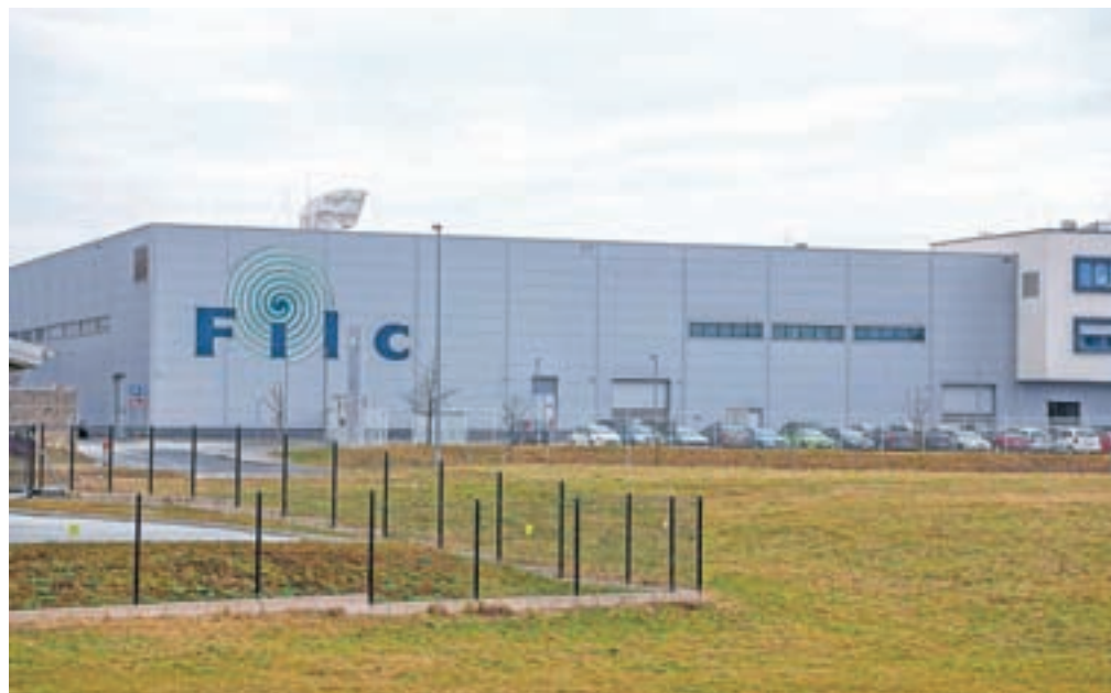
Škofjeloški Filc odslej v nemških rokah

Podjetje Filc s sedežem v Škofji Loki, enoti pa ima tudi v Mengšu in Lendavi, je bilo ustanovljeno leta 1937, zaposluje okoli 360 delavcev, z netkanimi tekstilijami pa posluje od leta 1963. Doslej je bilo v zasebni lasti slovenske družbe Nelinta. V Filcu v zvezi s spremembo lastništva podjetja ne dajejo izjav, niti ne razkrivajo rezultatov