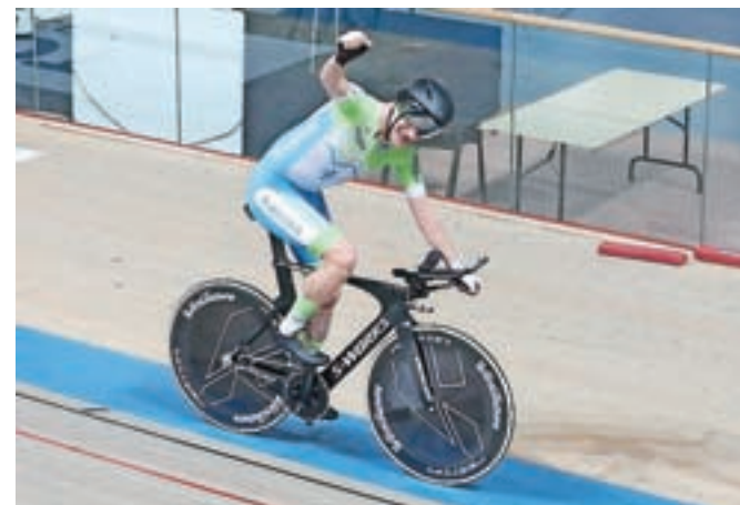
Svetovni rekord je postavil na velodromu v Varšavi na Poljskem.

je sicer bila, da bi v okviru Kolesarske zveze Slovenije rekord postavil v Novem mestu, a ker še niso imeli popolne opreme, od startnih blokov do timinga ter certifikatov, ki so potrebni za postavljanje svetovnega rekorda, sem se odločil za Poljsko,« je dejal kolesar iz Zbilje, ki je bil dosežka seveda zelo vesel. »Priprave so potekale večinoma na trenažerju. Ko je bilo lepo vreme, sem treniral tudi v Kranju, ko sem imel priložnost, pa tudi v Novem mestu. Tam sem opravil tudi generalko, ki je bila uspešna. Gre pa lahko vedno kaj narobe, tako da ne moreš biti