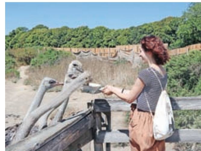
Dvajset sekund in skleda s hrano je prazna ...

Majhno mesto Solvang ima za Severno Ameriko nekoliko nenavadno ime. V danskem jeziku namreč pomeni »sončno polje«. Leta 1910 je skupina