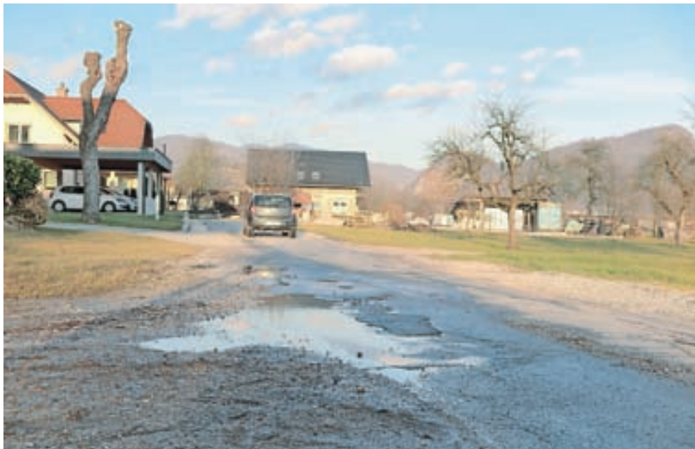
Cesta skozi Podgorje je precej dotrajana, a žal še zdaleč ne edina takšna v občini Kamnik.