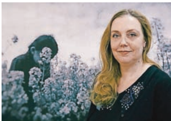
Arven Šakti Kralj Szomi

Ljubljana – Arven Šakti Kralj Szomi je vizualna umetnica, ki deluje v polju fotografije in sorodnih umetnostnih praks. Z njeno prepoznavno likovno govorico se srečujemo že od leta 2002, ko se je slovenski javnosti prvič predstavila s fotografsko razstavo. Redno razstavlja doma in v tujini. Tematsko se v svojem fotografskem delu zadnjega obdobja osredotoča na lik deklice in dekleta, ki ga raziskuje v sklopu projekta Dekle jesenske nebine, za katerega je bila nagrajena z delovno štipendijo Ministrstva za kulturo RS. Lani je za svoj opus prejela tudi najvišje priznanje Akademije za likovno umetnost in oblikovanje Univerze v Ljubljani.