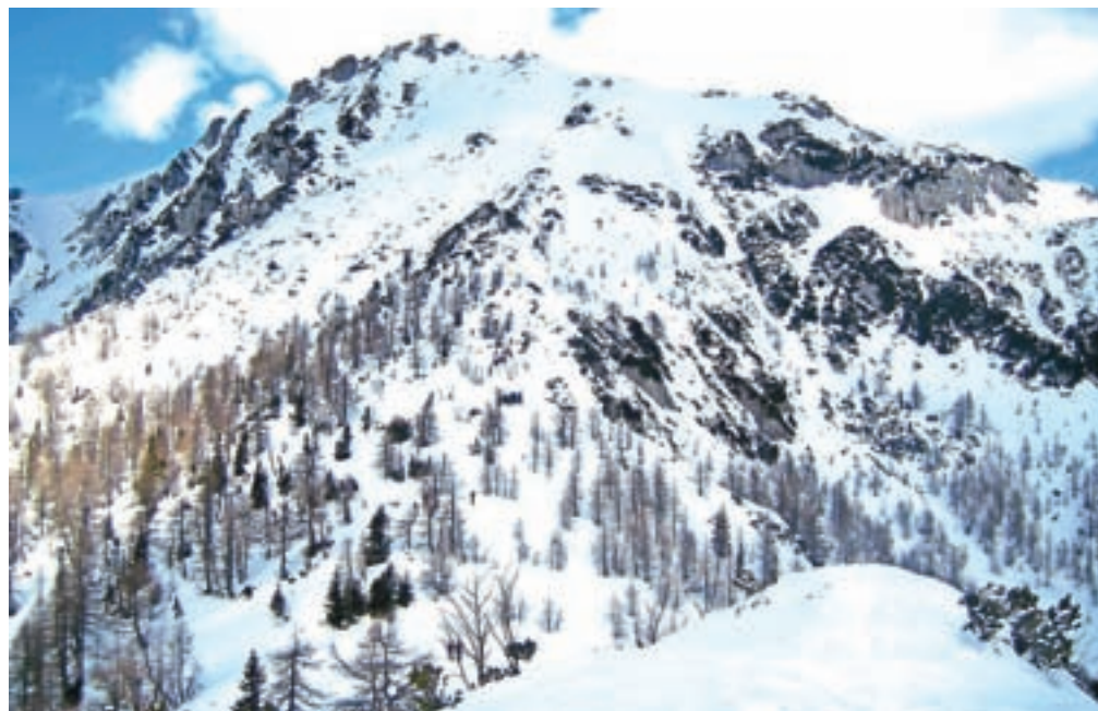
Pogled proti vrhu Viševnika

Če pa se nismo odločili še za Mali Draški vrh, pa vseeno sestopimo na Srenjski