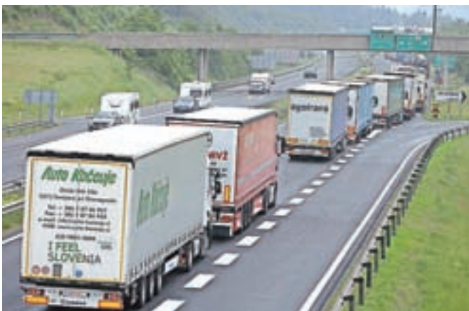
Zaradi zaprtja predora Karavanke so včeraj na avtocesti mimo Jesenic znova stali tovornjaki.

Karavanški predor pa so v obeh smereh zaprli včeraj okoli osme ure zjutraj. Znova je zagorelo na avstrijski strani predora, ki so ga znova odprli nekaj pred 10. uro.