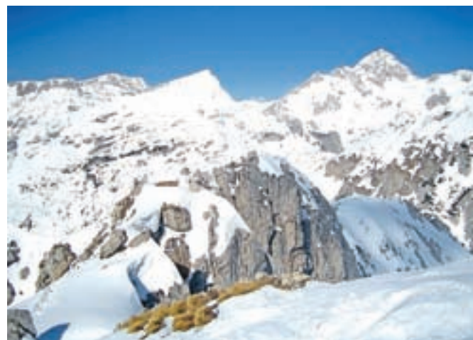
Triglavsko kraljestvo

preval, od koder sestopimo do Jezerc, tiste znane dolinice pod Studorskim prevalom. Od tam sestopimo do planine Konjščice, kjer nas čaka krajši vzpon, nato pa sestop nazaj na Rudno polje.