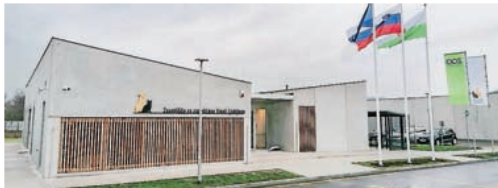
Javno službo zagotavljanja zavetišča za zapuščene živali na območju Mestne občine Kranj od začetka tega meseca izvaja Zavetišče Gmajnice.

»V Društvu za zaščito živali Kranj pozdravljamo odločitev Mestne občine Kranj, da sklene pogodbo za oskrbo brezdomnih in zapuščenih živali z Zavetiščem Gmajnice. Ob svoji desetletnici, ki smo jo zabeležili 1. februarja, pa poudarjamo, da smo v vseh letih svojega delovanja vedno poskušali delovati konstruktivno z vsemi vpletenimi za končno dobrobit živali, ne glede na težavne okoliščine, s katerimi smo se redno srečevali,« poudarjajo v Društvu za zaščito živali Kranj.