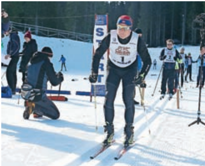
Minister za izobraževanje, znanost in šport Jernej Pikalo je progo premagal v dobrih petnajstih minutah.

Letos sta se na štiri in pol kilometra dolgo progo podala že tradicionalno tržiški župan Borut Sajovic in radovljiški župan Ciril Globočnik, po dvajsetih letih pa