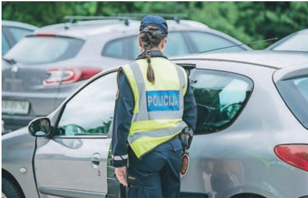
Zaradi neodgovorne politike policisti morda kmalu ne bodo več prisotni na terenu, opozarjajo v Sindikatu policistov Slovenije.

Policisti so bili sicer včeraj med 8. in 12. uro v notranjosti države bolj kot običajno prisotni na kritičnih cestnih odsekih in na območjih z