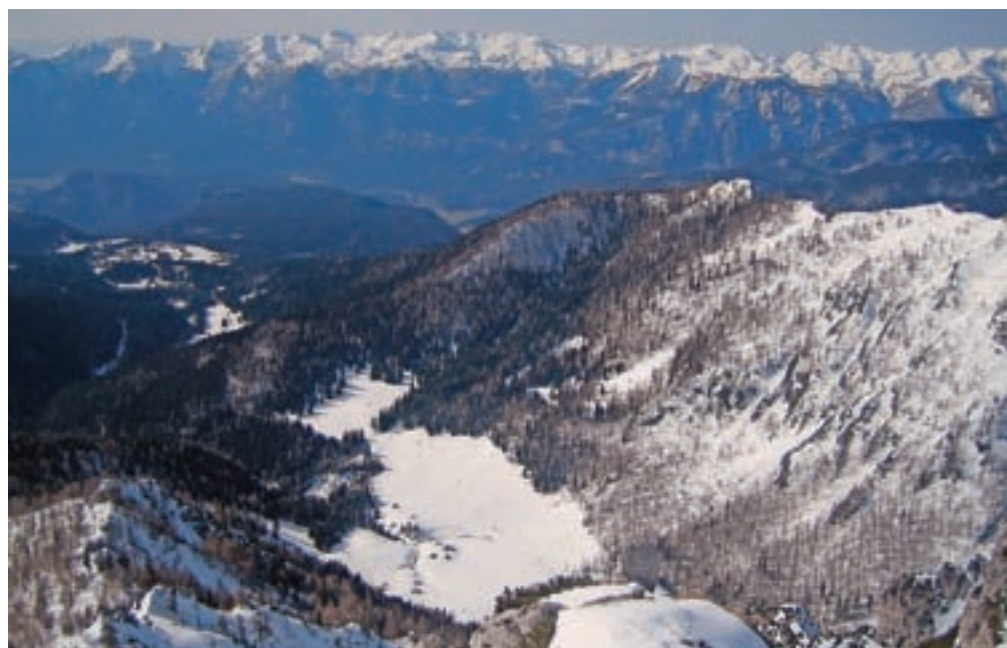
Pogled na planino Konjščico in greben Bohinjsko-Tolminskih gora