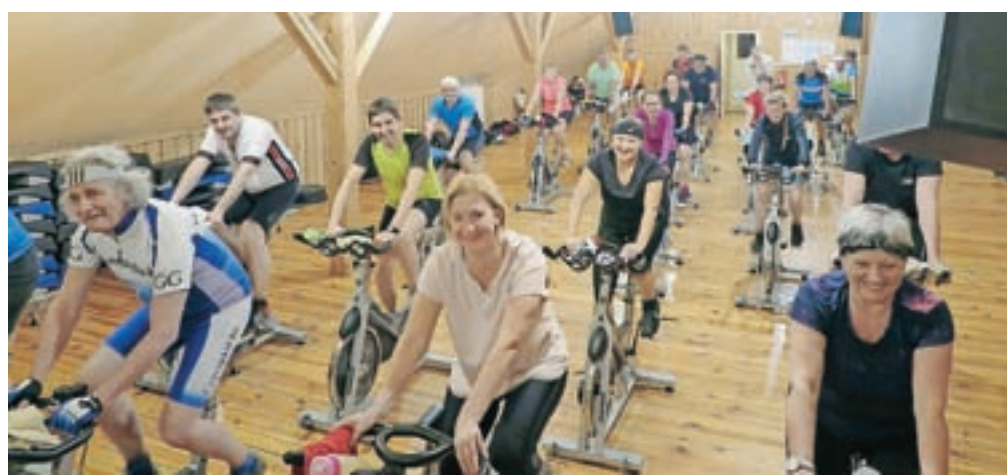
Glasovi kolesarji se dobivamo v športnem centru Vogu v Besnici, kjer imajo veliko dvorano in je na voljo dovolj koles.

Prednost kolesarjenja v dvorani je, da lahko odmislimo zunanje vplive in se lahko osredotočimo samo na pritiskanje na pedale. Tako lahko izboljšamo hitrost oziroma kadenco, ki se navadno meri kot število obratov v minuti. Na kolesu si nastavimo rahlo obremenitev in vrtimo pedale tako hitro, kolikor zmoremo. Tako lahko vztrajamo kratek čas, največ pol minute, nato intenzivnost zmanjšamo in pustimo, da se nekaj časa noge same vrtijo, nato zopet pritiskamo do maksimuma. Na statičnem kolesu lahko dosežemo hitrost tudi do 120 obratov v minuti. V dvorani