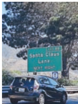
Pa naj še kdo reče, da je Božiček doma na Finskem.