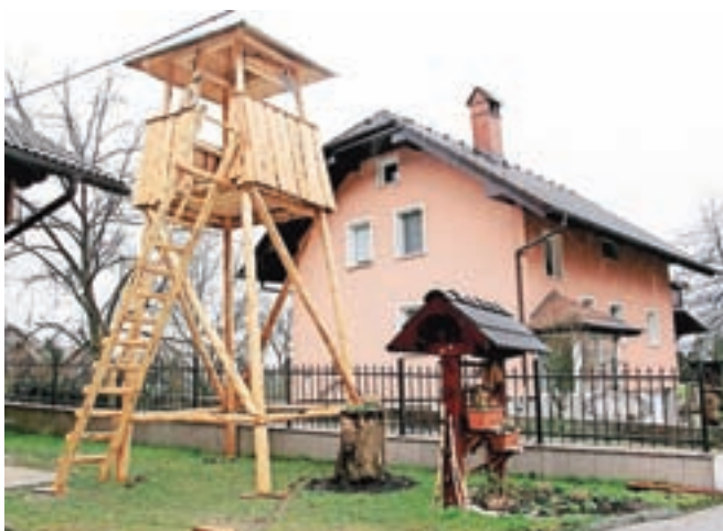
Namesto mlaja so postavili lovsko prežo.

Zdravje mu kar dobro služi, edino za branje uporablja očala. Še vedno vozi avtomobil in rad prebira časopise, med njimi tudi Gorenjski glas.