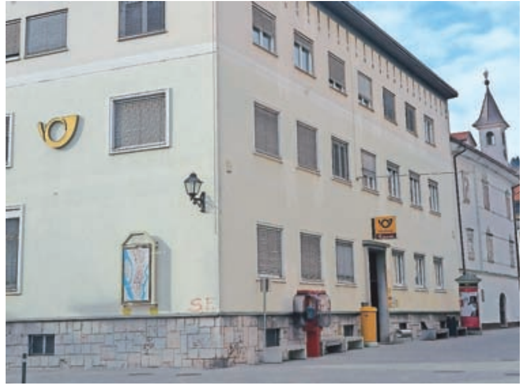
Stavbo v starem Kranju, ki jo prodaja Pošta Slovenije, bo kupila kranjska občina.