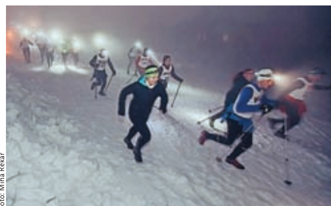
Nočni napad na Zvoh je letos zaznamovala tudi megla. Gorskih tekačev in turnih smučarjev to ni preveč motilo.

Kovačiča (Dynafit – Hranilnica Lon). »To je edinstvena preizkušnja, zato se je z veseljem udeležim, tudi v zahvalo in podporo organizatorjem, ki nam preko celotne zime na prostovoljni bazi organizirajo več tekaških druženj. Mraza letos zares ni bilo, so bili pa pogoji vseeno kar zahtevni, saj se megla nikakor ni hotela razkaditi, poleg tega pa je pihal še precej