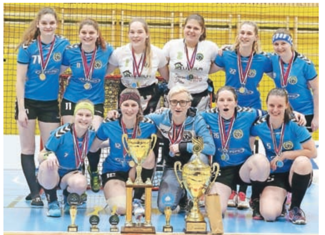
Ekipa Polanske bande je po naslovu državnih prvakinj minulo soboto v domači dvorani osvojila še naslov pokalnih zmagovalk.