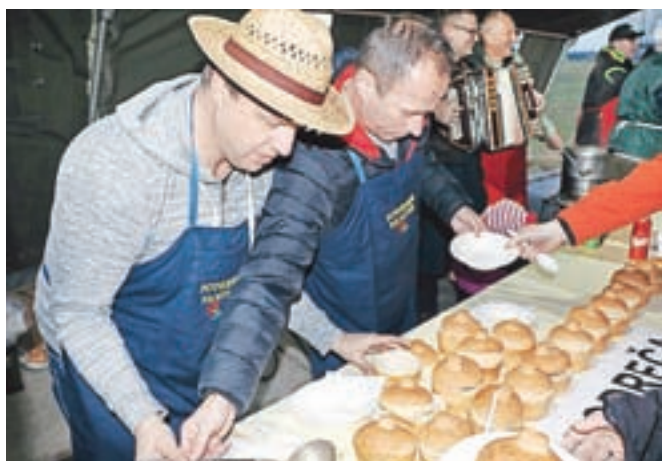
Fantje oziroma kuharji iz Podreče so s seboj pripeljali harmoniko, navdušili pa tudi z zanimivo postrežbo.