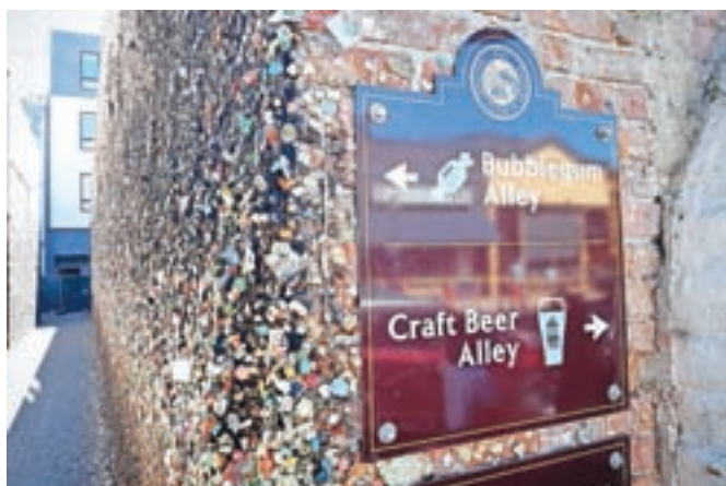
Samo »žvečko« pritisnem na zid, potem pa na pivo.

Cestne oznake SLO sicer spominjajo na našo ljubo Slovenijo, v Kaliforniji pa te veljajo za kraj San Luis Obispo. Tu najdemo tako imenovano Alejo žvečilnk (Bubblegum Alley). V kakih dvajsetih metrov dolgem prehodu je na obeh straneh zidu menda nalepljenih več kot dva milijona žvečilnih gumijev. Zgodba sega v petdeseta leta prejšnjega stoletja, ko so jih začeli na zid lepiti tamkajšnji študenti. Stena še vedno obstaja, vsakih nekaj let pa jo menda očistijo in naredijo prostor za nove žvečilne gumije.