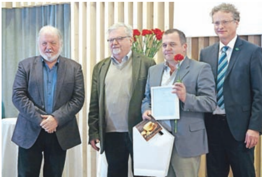
Certifikat za Blejski sir, s katerim se je pred dvema letoma začel projekt Blejski lokalni izbor, je prejela tudi zadruga Gozd Bled.