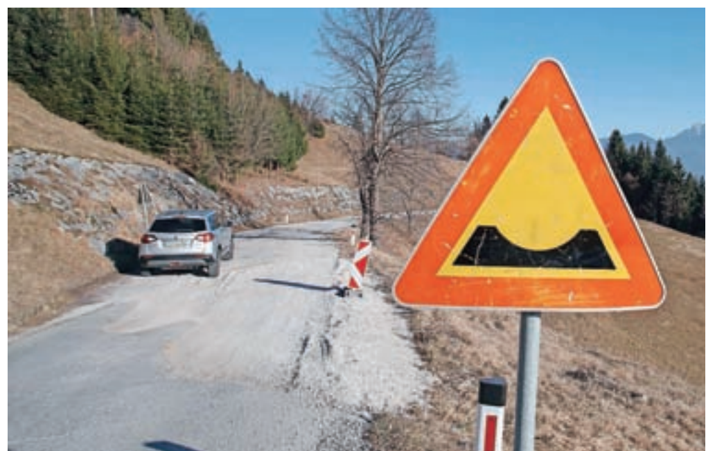
Sanacija plazu na regionalni cesti blizu Lajš je ocenjena na 580 tisoč evrov.

Železniki – Občina Železniki in Krajevna skupnost Dražgoše - Rudno še dlje časa opozarjata na slabo stanje regionalne ceste od Rudnega skozi Dražgoše proti Kropi. Na cesti, ki je vse bolj prometna, še zlasti opozarjajo na plaz, ki je nastal okoli 300 metrov naprej od cerkve v Lajšah v smeri proti Podblici. Na direkciji za infrastrukturo so razložili, da je izvedbeni načrt za sanacijo plazu in nasipne brežine izdelan in v postopku recenzije. »Načrt zajema izvedbo sidrane pilotne stene v dolžini 90 metrov ter izvedbo dreznatih reber in zbirnih jaškov nad cesto za odvodnjavanje zaledenelih voda,« so pojasnili in dodali, da bodo po končani recenziji začeli pripraviti razpisne dokumentacije za izvedbo gradbenih del. Če bodo nadaljnje aktivnosti potekale brez večjih težav, bi