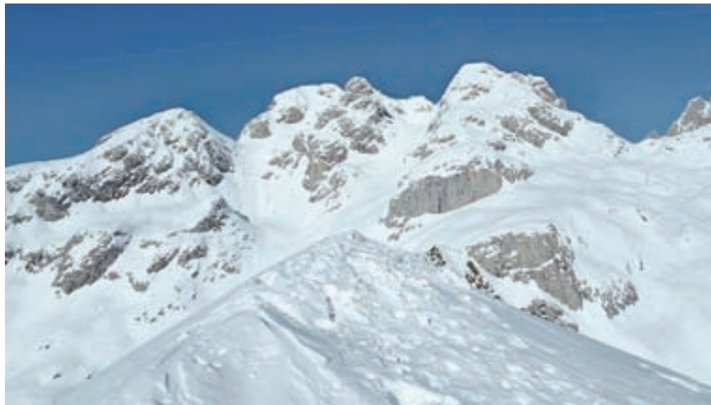
Razgled z vrha Pic Chiadina na Monte Coglians, najvišji vrh Karnijskih Alp

Nadmorska višina: 2302 m Višinska razlika: 952 m Trajanje: 5 ur Zahtevnost: ★★★★★