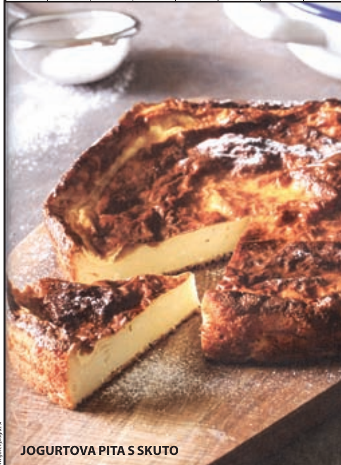
JOGURTOVA PITA S SKUTO