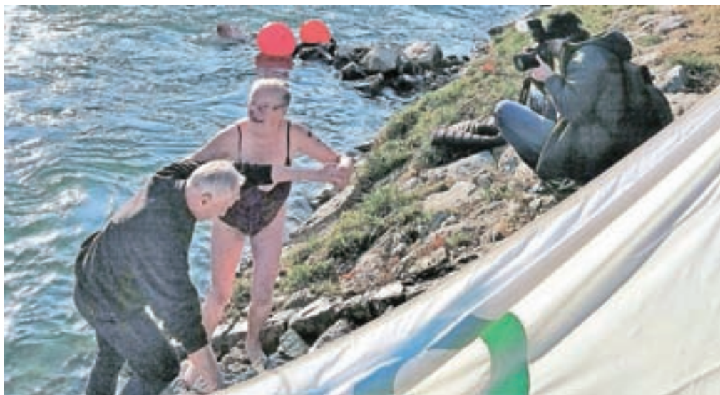
Takoj po plavanju jo je v objektiv ujela snaha.

sinovi,« pripoveduje. Zebe je nikoli, niti ko pride iz ledene vode. »Celo zimo sem v kratkih rokavkih! Zjutraj, ko vstanem, si nadenem samo tanko haljo brez rokavov, da grem ven do psičke Kale in kokošk ...« Tudi v hiši ima samo 19 stopinj Celzija, je pa res, da je ves čas aktivna. Čeprav je že