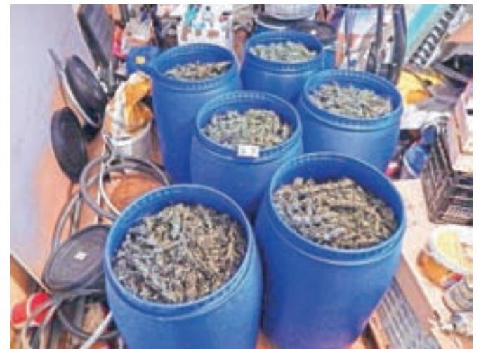
V eni od hišnih preiskav so policisti odkrili tudi pet sodov posušene konoplje.