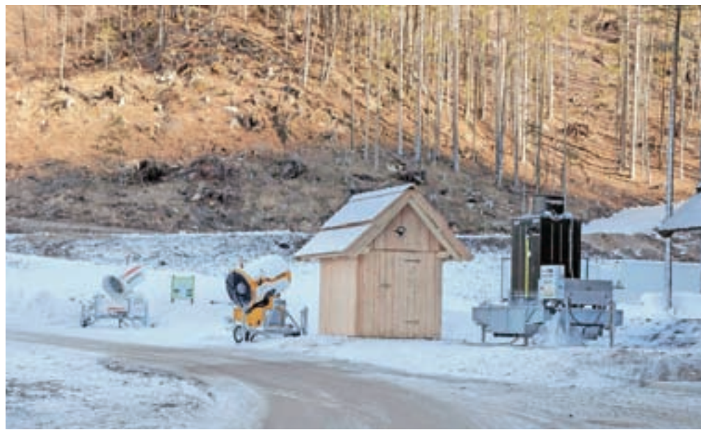
Za lansko leto je bila značilna tudi izredno skromna snežna odeja po nižinah, umetno zasneževanje pa je potrebno tudi v tej zimi.