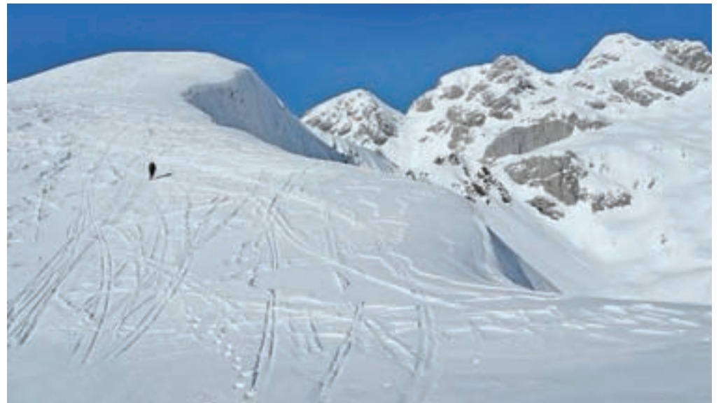
Vzpon na Pic Chiadin. Čudoviti vrh za zimski vzpon.