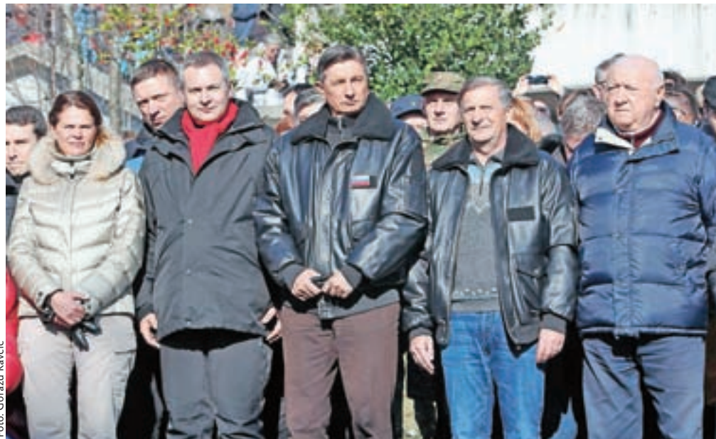
Slovenski politiki s predsednikom republike Borutom Pahorjem na slovesnosti v Dražgošah