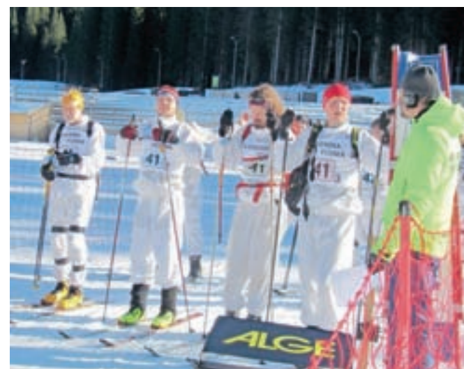
Zmagovalna patrolja gorskih reševalcev z Jezerskega na startu tekme na Pokljuki

Na zmagovalni oder so stopile tudi patrolje z Gorenjske. Med moškimi patroljami je absolutno zmaga patrolja Natovega centra