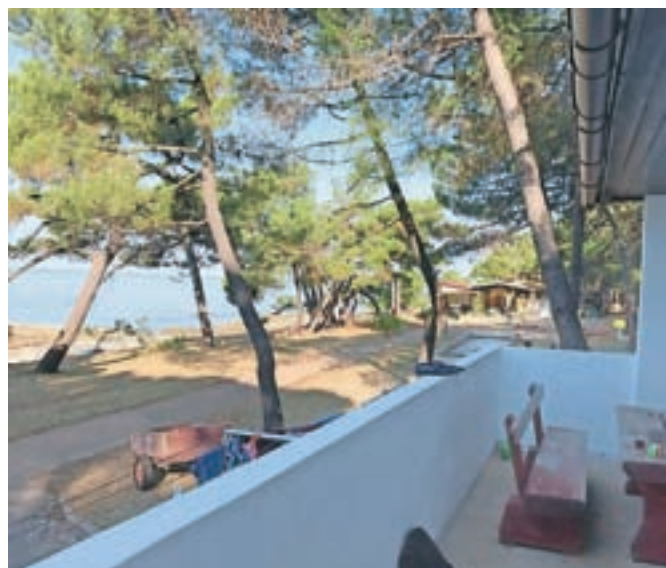
Otroško letovišče Pinea pri Novigradu je priljubljeno zlasti med otroki in mladimi družinami.