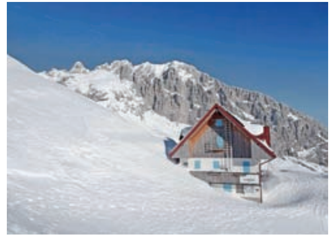
Kočica Marinelli, zadaj je Kellerspitzen.

Od kočice zagrizemo v strmino. Poleti je to travnat vzpon in tukaj bi bil razcep, kjer se levo odcepi zahtevna pot do kočice Lambertenghi-Romanin, ena bi se nadaljevala tudi proti Monte Cogliansu. A vendar, zima je drugačna. Zagrizemo v strmino na Pic Chiadin. Strmina je precejšnja, a s pravim tempom in smerjo vzpona hitro dosežemo vrh. Razgled je