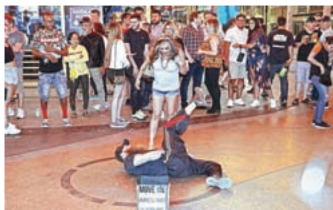
Za dolar me postavi, kakor ti drago.