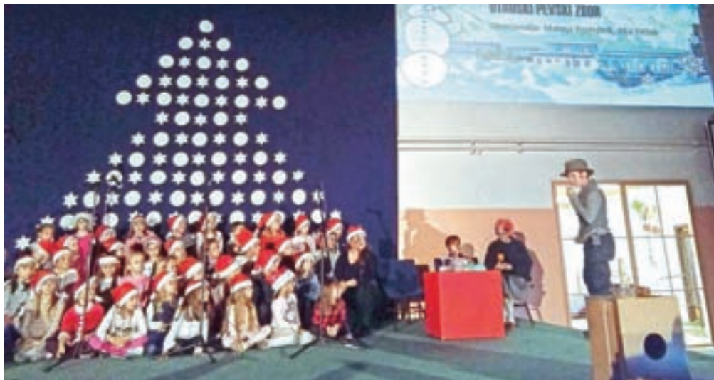
Organizacijo prireditve Veseli december so tokrat prepustili učencem.

S tem velikim izzivom se je pod vodstvom mentorjev že oktobra spopadla skupina nadarjenih osmošolcev in devetošolcev. Zamislili so si pripravo in izvedbo sejma, delavnic ter glasbene in dramske prireditve, ki se je