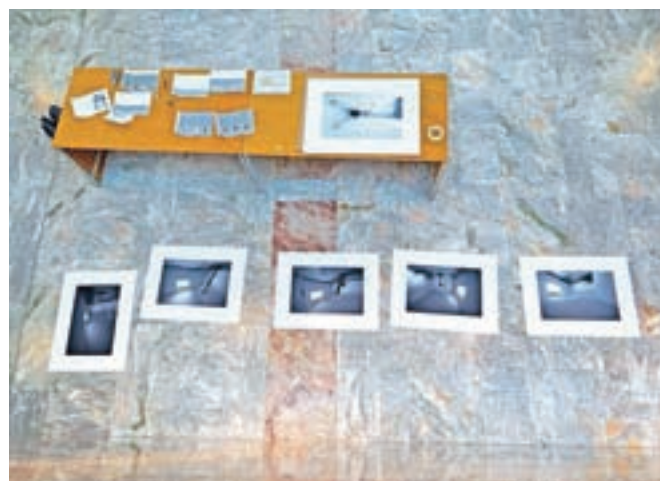
Fotografije so pripravljene.