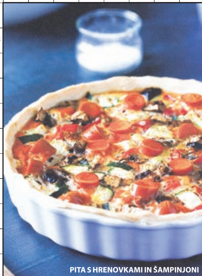
PITA S HRENOVKAMI IN ŠAMPINJONI

Nagrade: 3-krat darilni bon trgovine Baldrijan Kranj v vrednosti 20 evrov