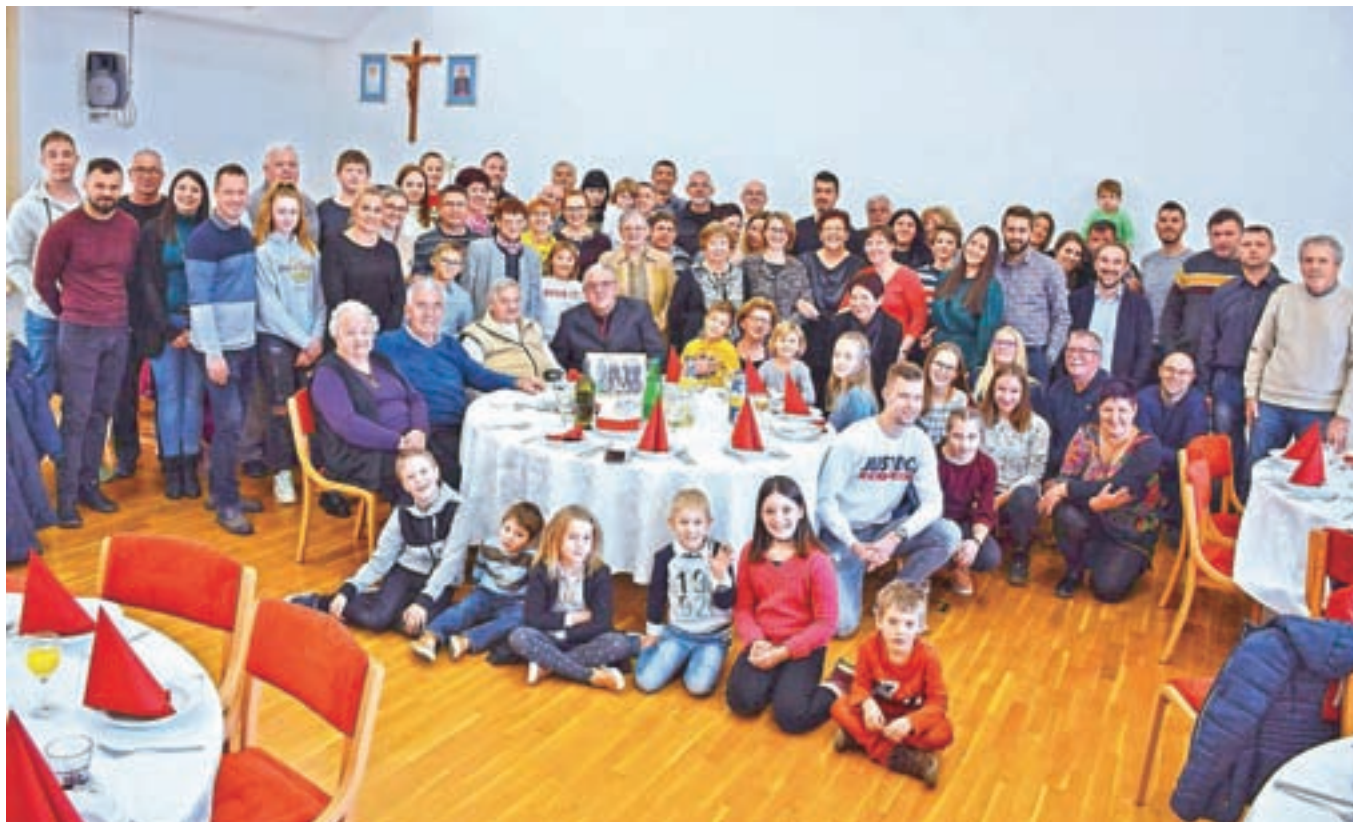
Jožefovčevi se redno srečujejo. Na začetku januarja se jih je zbralo okrog osemdeset, skoraj vsi.

Srečanje so začeli s kosilom, nadaljevali pa v sproščenem druženju, ki ga je popestril program.