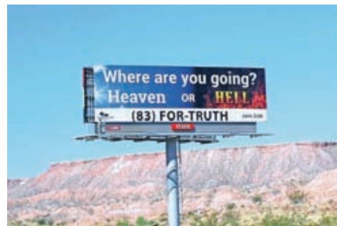
Kam greste – v nebesa ali pekel? Le v Las Vegas.

Prava posebnost pa je takoj ob vstopu v Fremont Street restavracija z nekoliko čudnim imenom Heart Attack Grill, kar bi lahko prevedli Žar, da te kap. Osnovna poanta restavracije je