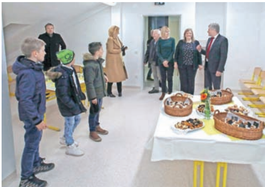
Novo, dodatno učilnico so uredili v mansardnih prostorih podružnične šole v Begunjah. Da se tja lahko povzpnejo tudi gibalno ovirani, je na voljo stopnišni vzpenjalec.

Prostor, ki so ga uredili v mansardi, je za zdaj namenjen dodatnim dejavnostim šole, lahko pa se bo uporabljal tudi kot učilnica, so pojasnili na radovljiški občinski upravi. Zraven novega prostora sta urejena še manjša garderoba ter servisni prostor, v katerega so vgradili bojler in zagovnik tople vode. Nova in za šolo pomembna pridobitev je tudi samostojni stopnišni vzpenjalec, ki dostop v