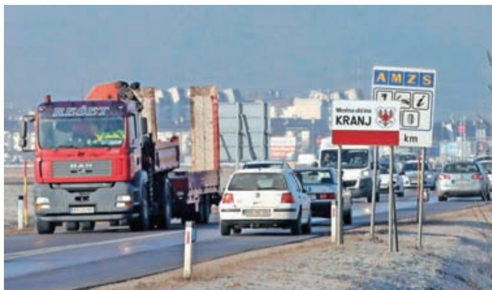
Na ministrstvu za infrastrukturo prometne problematike na glavni cesti med Kranjem in Šenčurjem ne nameravajo reševati z gradnjo dodatnega avtocestnega priključka Kranj sever.

Kranj – Ministrstvo za infrastrukturo in Družba za avtoceste v RS (Dars) sta zavrnila predlog Mestne občine Kranj za gradnjo novega avtocestnega priključka Kranj sever med avtocestnim priključkom Kranj vzhod in krožiščem na Primskovem. Ministrstvo je na kranjsko pobudo pred kratkim odgovorilo, da je Dars že v preteklosti podal negativno mnenje k predlogu za gradnjo novega priključka zaradi premajhne razdalje med predlaganim in obstoječim priključkom Kranj vzhod.