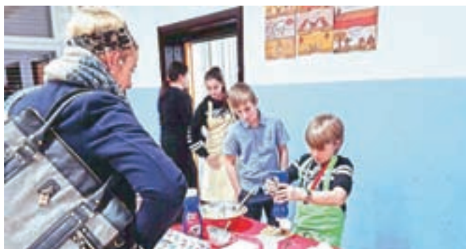
Na prireditve je že ob vходу vabil prijeten vonj po sveže pečeni vaflih izpod rok mladih kuharjev.