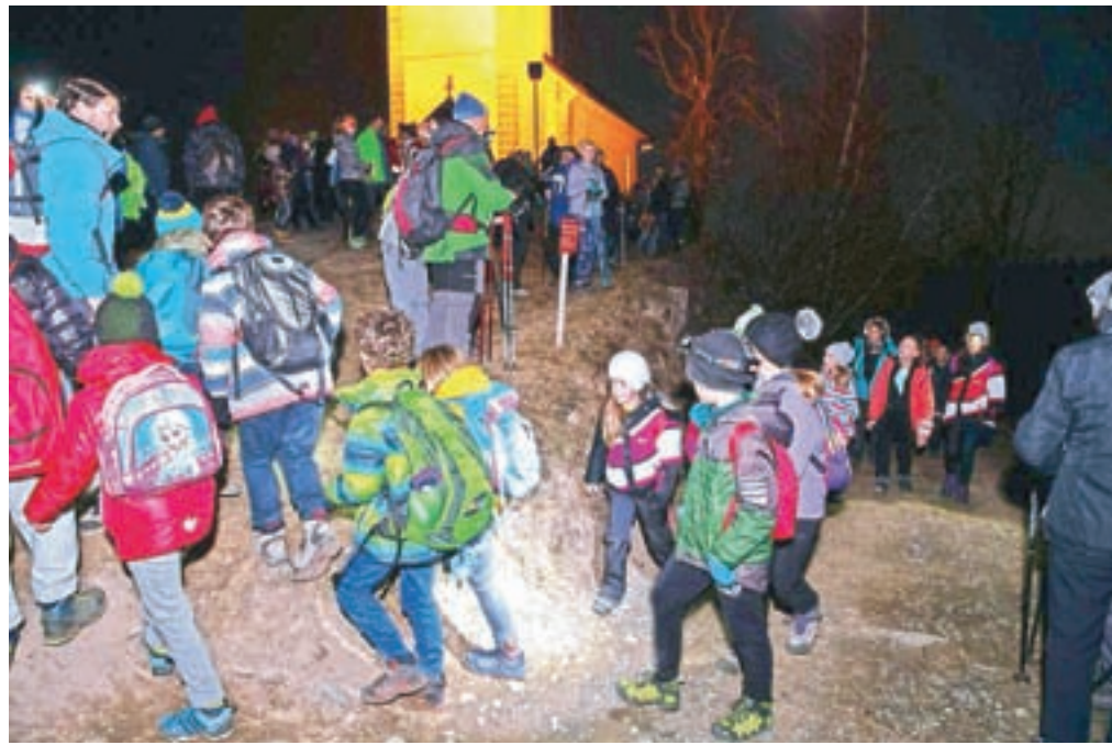
Druga uspešna izvedba Nočnega pohoda na Jamnik je privabila kar petsto pohodnikov iz vse Slovenije.

Jamnik – Po lanskoletni prvi in uspešni poletni izvedbi Nočnega pohoda na Jamnik je tokrat Zavod za kulturo in turizem Kranj (ZTKK) v sodelovanju s Planinskim društvom Kranj in Krajevno skupnostjo Podblica organiziral drugo zimsko inačico pohoda. Vzpon na razgledno točko z gorenjskega balkona ob polni luni nedvomno kaže zametke tradicije, saj se pohoda udeležuje vedno več pohodnikov, ki na pobočje Jelovice pridejo iz cele Slovenije. Ko se je spustil mrak, se je v sicer neizrazitih zimskih razmerah z izhodiščne točke pri gostilni Na Razpokah v Nemiljah na štiri kilometre dolg pohod v obe smeri z dvesto metri višinske razlike v spremstvu vodnikov in gorskega reševalca podalo okoli petsto udeležencev. Med njimi je bila tudi skupina 120 otrok iz Mladinskega odseka Planinskega društva Kranj. Gozdno pot, ki je bila lansko leto markirana, urejena in očiščena in je po pričevanju pohodnikov nezahtevna, so udeleženci premagali v slabi uri. Opremljeni