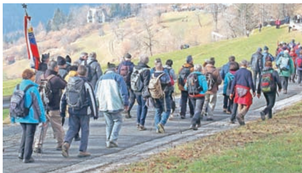
Veliko ljudi pride v Dražgoše peš, organizirani so številni pohodi.

Letos se je, tudi zaradi lepega vremena, organiziranih pohodov v Dražgoše udeležilo blizu tisoč ljudi. Že 41. pohoda Po poti Cankarjevega bataljona s Pasje Ravni se je udeležilo 297 pohodnikov, skupno pa že 11.399. Na pohod iz Železnikov preko Ratitovca v Dražgoše je šlo 116 pohodnikov in devet gorskih reševalcev.