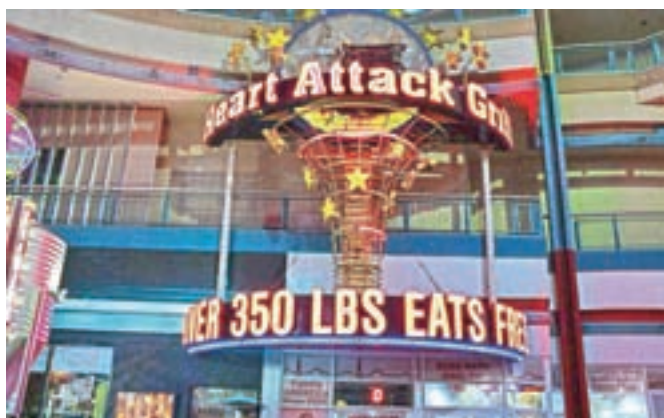
Restavracija Žar, da te kap – za pregrešno lačne