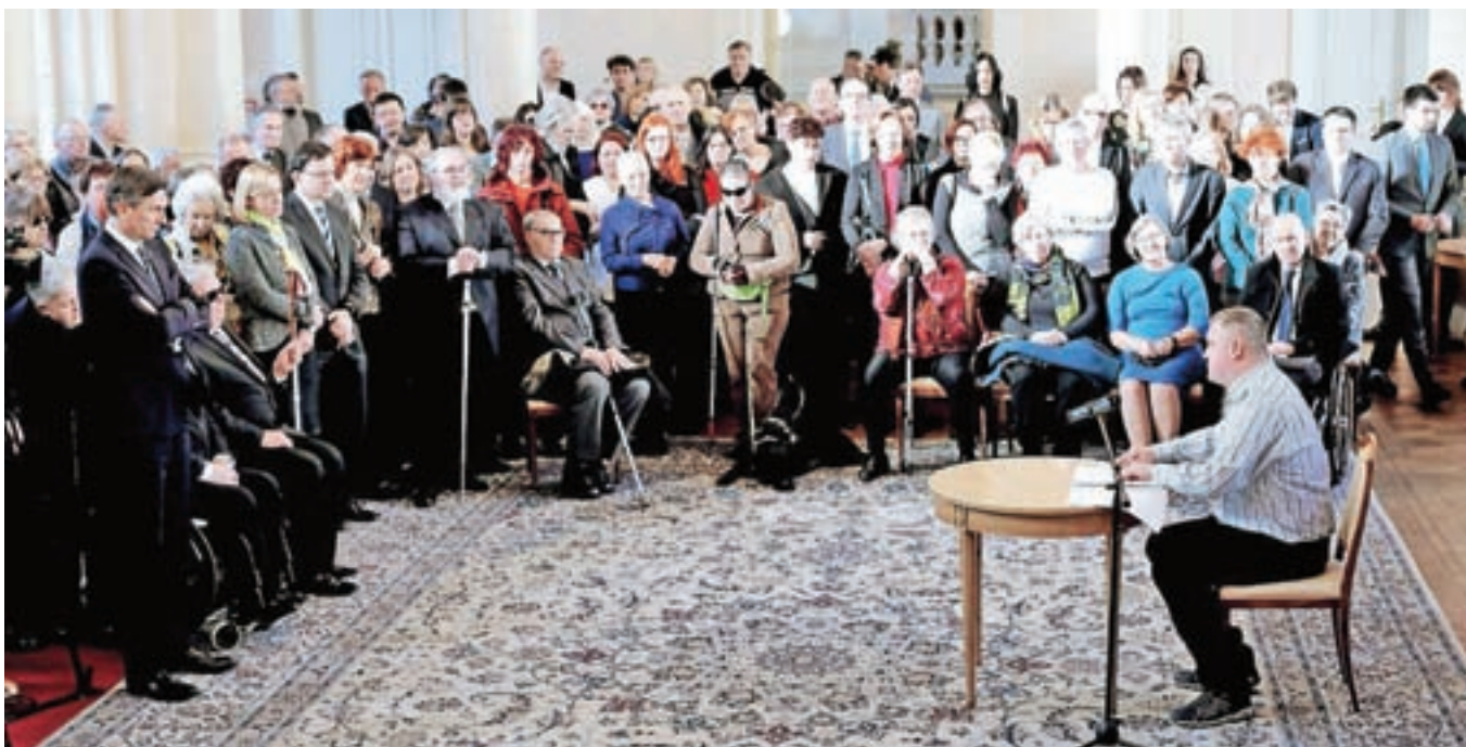
S sprejema pri predsedniku Borutu Pahorju

Ne le osrednji dogodek na Brdu, tudi junijsko vseslovensko srečanje slepih in slabovidnih bo na Gorenjskem, in sicer na Okroglem. Tu pričakujejo okoli tisoč ljudi (v zvezo je sicer vključenih okoli 3700 članov), s prireditvijo pa želijo med