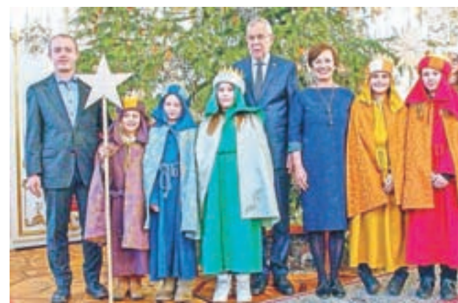
Sveti trije kralji iz dvojezične župnije Šentpeter na Vašinjah pri Velikovcu so pretekli teden v dunajskem Hofburgu obiskali avstrijskega predsednika Aleksandra Van der Bellena. V slovenščini so mu zapeli pesem Učakali smo novega leta dan.

Med napovedmi pomembnejših dogodkov, ki jih konec tedna in v prihodnjem tednu organizirajo slovenske organizacije in društva na Koroškem, prevladujeta družabnost in kultura. Jutri, 11. januarja, ob osmih zvečer se bosta v Kulturnem domu na Radišah in v gostilni Hudl v Globasnici