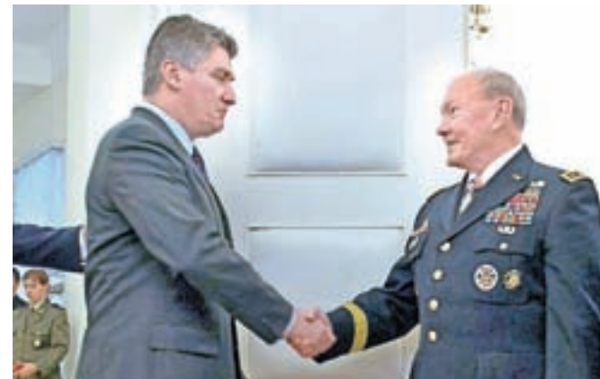
Zoran Milanović, ko je kot hrvaški premier sprejel ameriškega generala Martina E. Dempseyja, Zagreb, 22. 9. 2014.