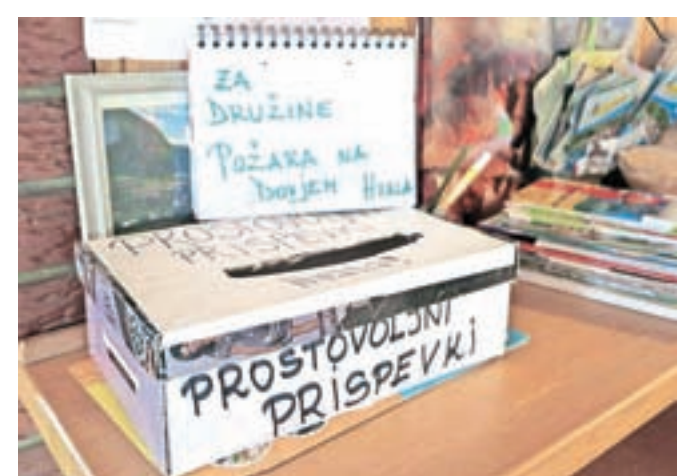
Denarno pomoč za oškodovane v požaru na Dovjem zbirajo preko posebnega računa, ki ga je odprla Župnijska karitas Dovje, možno pa jo je oddati tudi osebno.

Denarna sredstva bodo zbirali tudi na dobrodelnem koncertu, ki ga bodo organizirali v soboto, 24. januarja,