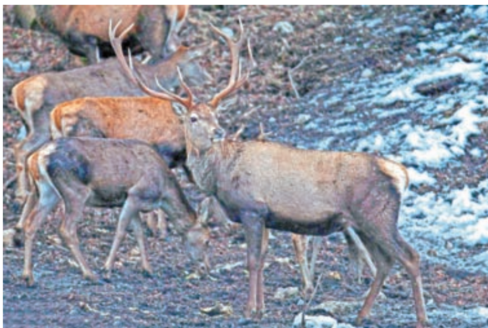
Jelenjad povzroča škodo v gozdovih.

Upravljavci lovišč so v zadnjih petih letih trikrat izpolnili načrt odstrela jelenjadi tik nad še dopustno mejo odstopanja, v letu 2017 je bila realizacija dobra, predlani med najslabšimi v zadnjem desetletju, težave pri izpolnjevanju načrta pa so imeli tudi lani. Kot poudarjajo