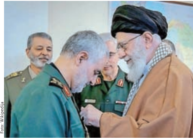
V ameriškem letalskem napadu ubiti iranski general Kasim Sulejmani in iranski vrhovni verski voditelj Ali Hamenei, fotografirana 11. 3. 2019. Iran grozi z maščevanjem.