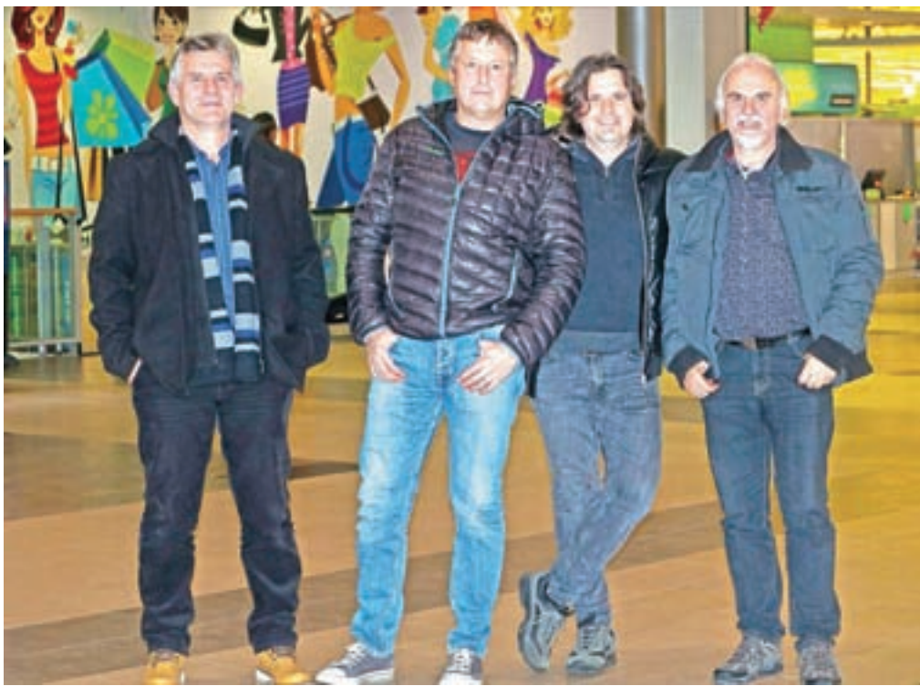
Zametki Zahod Banda segajo v leto 1981, prvi nastop pa so fantje imeli junija 1982 v Ratečah. Od takrat do danes je zasedba doživela tudi nekaj članskih sprememb.

Igrajo vse od roka in komerciale do narodnozabavne glasbe. Imajo tudi svoje pesmi. Leta 2002 so posneli prvo pesem, dve leti kasneje zgoščenko. »Predvsem smo pop-rok bend, ki igra po nočnih lokalih, a se ne boji igrati niti na poroki, veselici, novoletnih zabavah niti na Tromeji,« se fantje hudomušno opišejo.