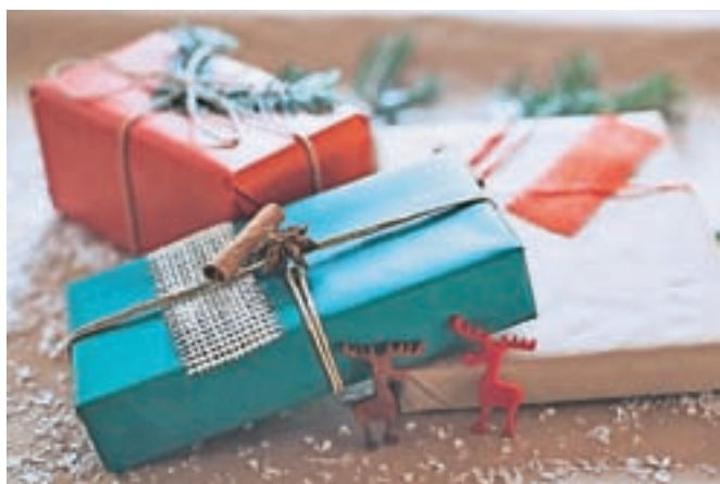
V zadnjih trinajstih dneh 2019 smo Slovenci v trgovinah (večinoma za hrano in darila) pustili 941 milijonov evrov.