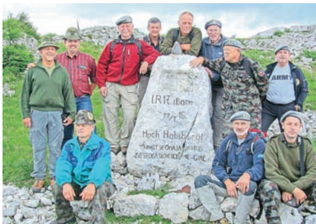
V skalo vklesan spomenik 17. pešpolku kranjskih Janezov v Slovenski dolini pod goro Ortigaro. Ob njem skupina slovenskih vojaških gornikov.

Knjiga o Ortigari je bila napisana zato, ker je ta del tirolske fronte povezan s Slovenci. Jedro avstro-ogrske obrambe na tem delu fronte so predstavljali vojaki 17. pešpolka, v katerem je bilo od ustanovitve leta 1674 naprej stalno okrog osemdeset odstotkov vojakov iz nabornega območja Gorenjske, Dolenjske, Notranjske in Bele krajine, občasno pa tudi Goriške. Vojakom polka so rekli tudi »cesarjeviči«, saj je bil zaradi zvestobe, borbenosti in uspešnosti njegov pokrovitelj Otto von Habsburg, sin zadnjega cesarja Karla I. Drugi steber obrambe pa je bil 7. lovski bataljon, v katerem je bilo