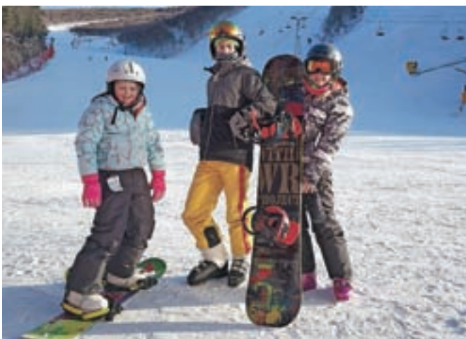
Na smučišču v mestu Chongli, ki bo eno prizorišč olimpijskih iger leta 2022 / Foto: osebnih arhiv

Medtem ko Urša na omenjeni mednarodni šoli uči likovni pouk, njen mož že 18. leto vodi podjetje, ki danes zaposluje 20 ljudi ter se ukvarja s proizvodnjo telekomunikacijskih komponent in prodajo uličnih svetilk v Aziji. Lemutova sta pomagala tudi pri ustanavljanju drugih slovenskih podjetij na Kitajskem. »Slovenec na Kitajskem je kar precej, vsako leto se srečamo na pikniku, ki se ga udeležijo tudi aktualni veleposlaniki iz Pekinga,« sta še povedala.