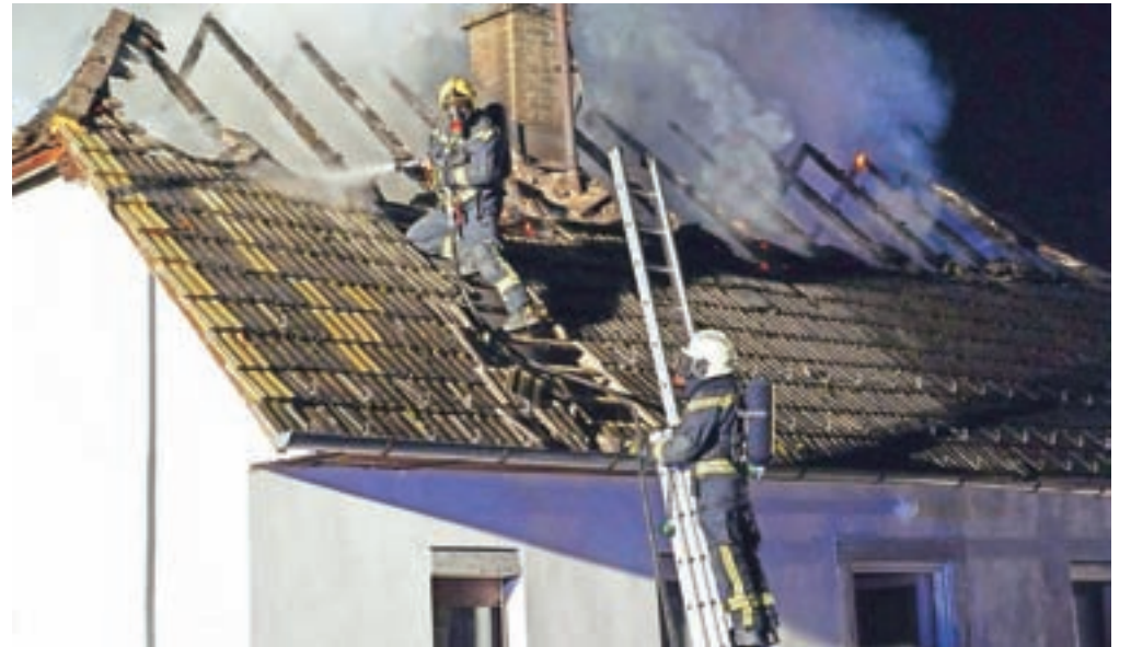
V nočnem požaru sta zgoreli streha in mansarda starejše stanovanjske hiše na Lazah v Tuhinju.

»Poziv smo prejeli kmalu po pol tretji uri zjutraj, na kraj pa smo prispeli okoli tretje ure. Ob našem prihodu je bil požar že povsem razvit, ostršeje in mansarda sta bila že v plamenih. Takoj smo začeli ščititi sosednje