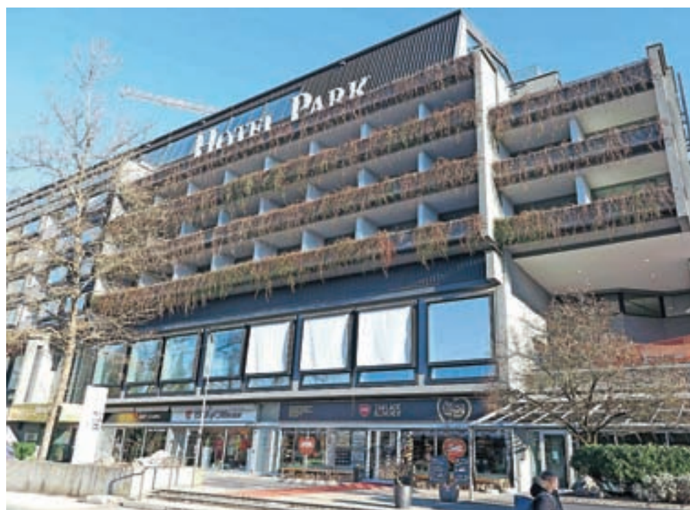
V Hotelu Park ta čas poteka osem milijonov evrov vredna celovita obnova.

priljubljen zlasti med gosti, ki so radi v središču dogajanja, saj ga le nekaj korakov loči od blejske promenade. Priljubljen pa je tudi med poslovniki ter med kolesarji in pohodniki – zadnjim so prilagodili del hotelske ponudbe, ki vključuje kolesarske programe in možnost najema vodnikov. V zgornjem nadstropju hotela imajo gostje na voljo tudi notranji termalni bazen z razgledom na jezero, ki ga bodo prav tako povsem prenovili. Posebnost hotela predstavlja originalna blejska kremna rezina, ki je nastala prav v hotelski restavraciji.