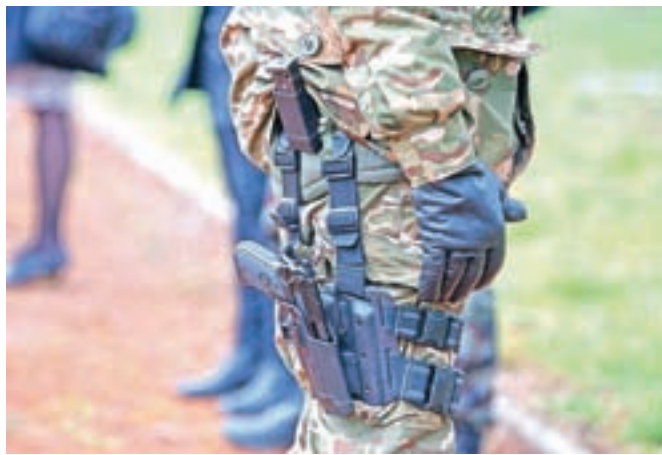
Po iranskem raketnem napadu na vojaški oporišči v Iraku se je Slovenija odločila za evakuacijo šestih slovenskih vojakov iz napadenega oporišča v Erbilu.