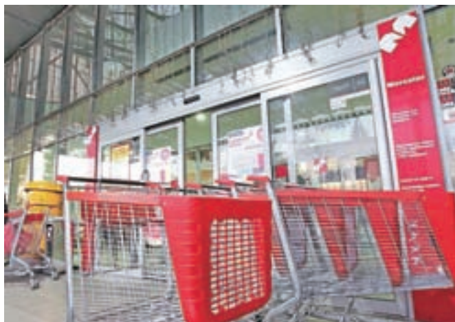
Ljubljansko okrajno sodišče je potrdilo odločitev Agencije za varstvo konkurence o začasnem zasegu delnic Mercatorja, na katero se je pritožil Agrokor.