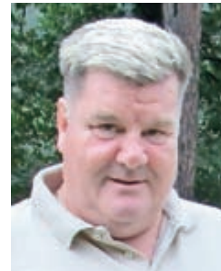
Branko Pirc / Foto: arhiv

Eden od očitkov se je nanašal tudi na dejstvo, da naj bi mačke spuščali nazaj v naravo in naj zanje ne bi iskali