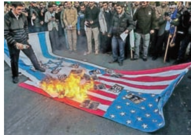
Z zažiganjem zastav so v Teheranu protestirali proti ameriški priznanju Jeruzalema za glavno mesto Izraela, 11. 12. 2017. Zdaj bo gorelo še kaj drugega...