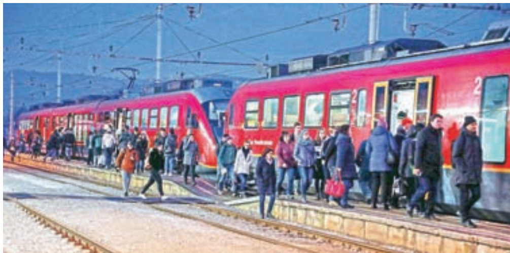
Jutranja gneča na železniški postaji v Škofji Loki

Tudi na popoldanskih vlakih, pravi, ni nič bolje: »Tudi vrnitve domov med 16. in 17. uro (ko je en sam vlak) niso prijetne. Že vrsto let je npr. vlak iz Ljubljane za Jesenice ob 16.22, naslednji pa je ob 17.18. Kot da večina ljudi konča službo že ob 16. uri. Vse skupaj je videti tako, kot da bi ljudi želeli odgnati z vlakov, ne pa spraviti nanje in s tem tudi razbremeniti ceste in nekaj malega narediti za okolje. Povsod se bere