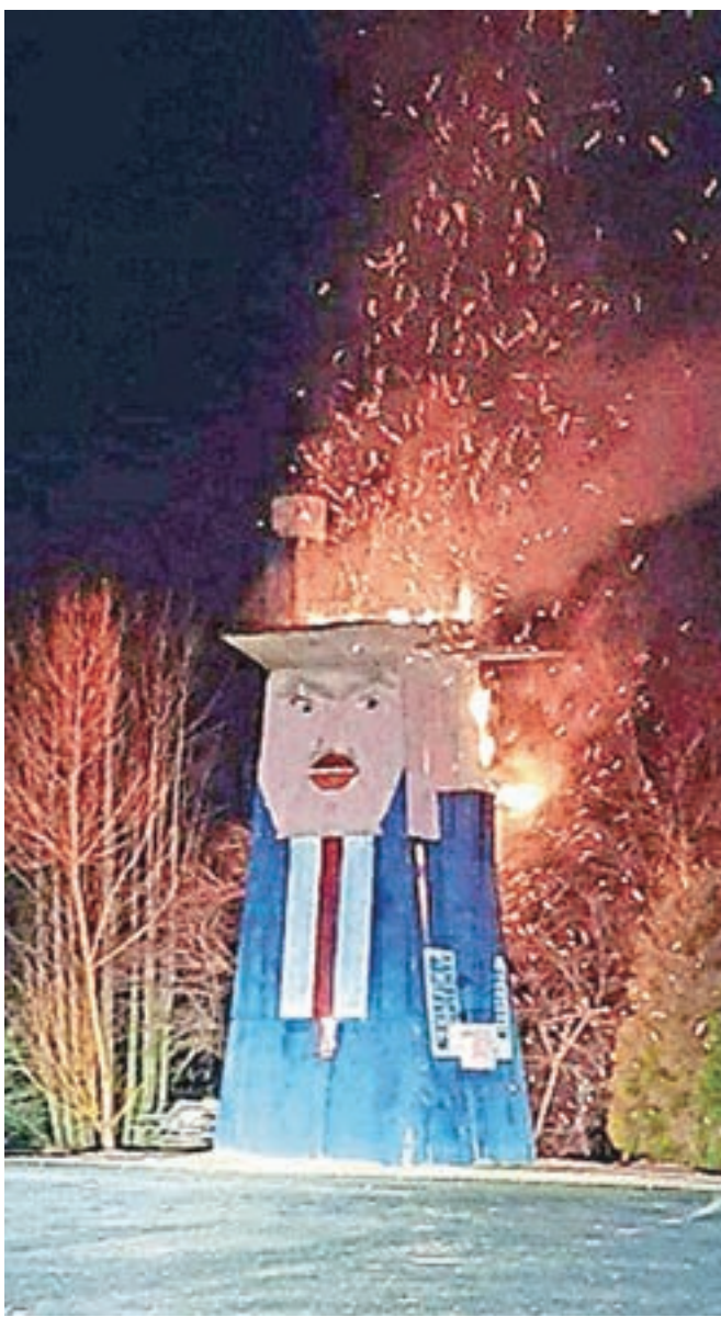
Goreči Kip svobode v Moravčah

Kip, ki je pred meseci Sela postavil na strani svetovnih medijev, je bil v preteklosti že tarča napadov. Prah je dvigal med vaščani na Selih, čeprav skulpture tam niso bistveno okrnili. So pa jo poškodovali že v prvih dneh na lokaciji v Moravčah, kjer so ji pred uradnim odprtjem neznanci narisali brke. Kip so že pred dnevi neznanci želeli požgati, a jim to po besedah Balažiča ni uspelo, ker so uporabili premalo goriva.