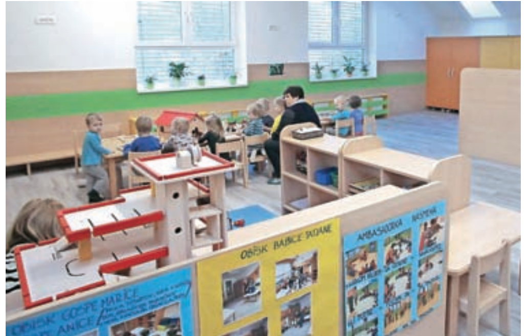
Občina je uredila še nadstropje stavbe ob Vrtcu Železniki, namenjene njegovi širitvi, in tako pridobila prostore za dodatno skupino otrok.