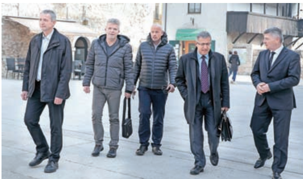
Župani štirih občin na Škofjeloškem, nastalih iz prejšnje velike občine Škofja Loka, ki so vsaka posebej uspešne v razvoju. Na sliki z ministrom Rudijem Medvedom lani v Škofji Loki.

Kranj – Temelje lokalne samouprave v Sloveniji je postavila že ustava leta 1991, v prihodnjih letih je bila sprejeta zakonodaja, ki je urejala lokalno samoupravo. Oktobra leta 1994 je bil sprejet zakon o ustanovitvi občin ter o določitvi njihovih območij. Z njim je bilo ustanovljenih 147 občin, sprejetje zakona pa je bilo pogoj, da je lahko predsednik državnega zbora razpisal prve lokalne volitve. Prvi krog za izvolitev županov in občinskih svetov je bil 4. decembra, drugi 18. decembra.