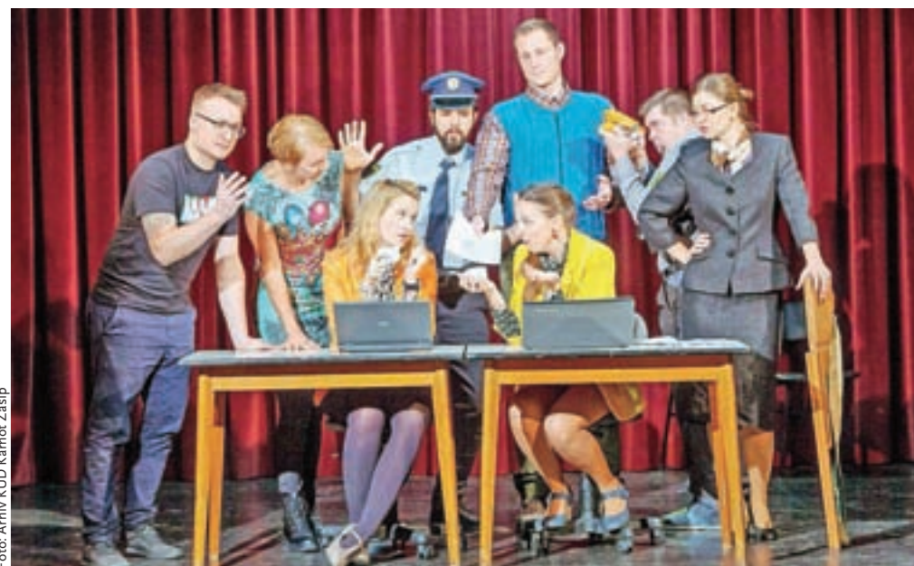
Igralci Kulturno umetniškega društva Kamot Zasip v veseloigri Upravna enota