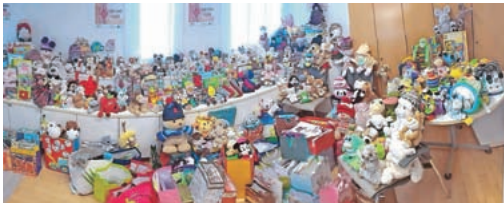
Odziv zaposlenih na Finančnem uradu Kranj je bil izjemen.

Republiška finančna uprava je konec avgusta