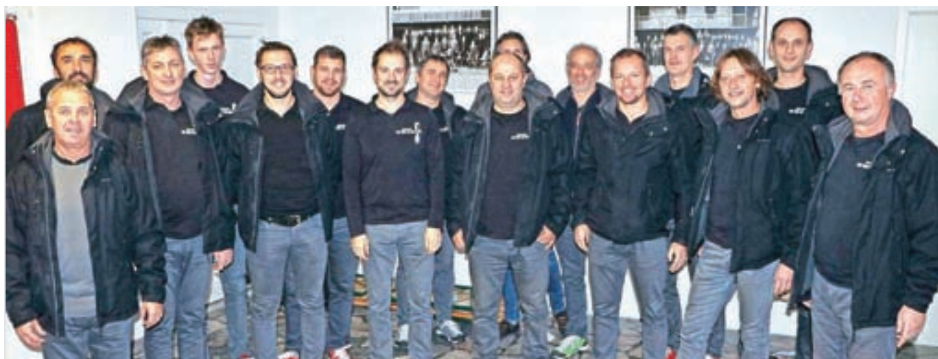
Moški pevski zbor Alpina iz Žirov je nedavno na regijskem tekmovanju Gorenjske v Škofji Loki dobil zlato priznanje in še posebno priznanje za najboljšo izvedbo sodobne slovenske skladbe, napisane po letu 1989.