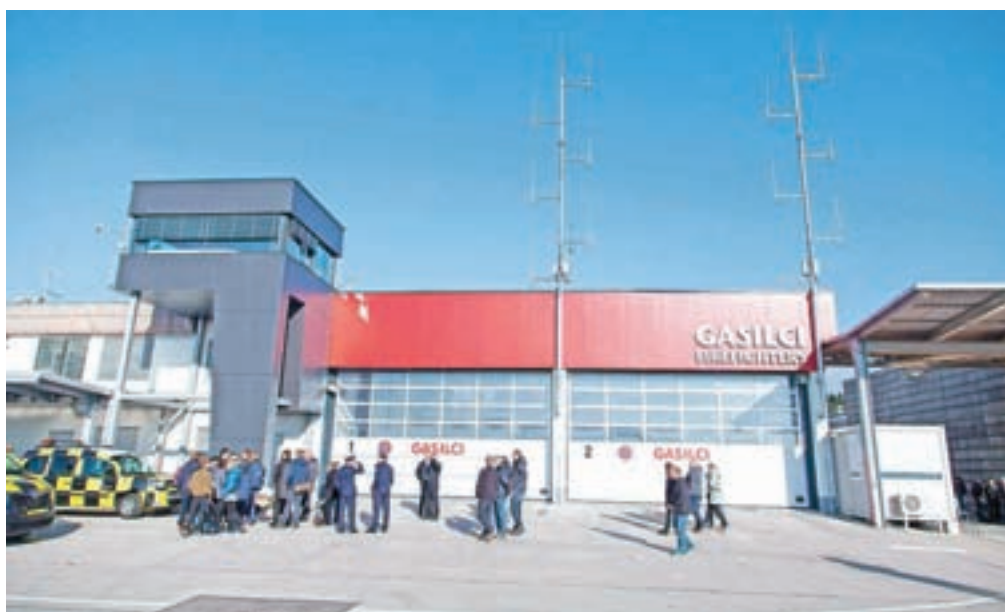
Investicija v prenovo prostorov gasilsko-reševalne službe na letališču je znašala milijon evrov.

Z investicijo v prenovljene prostore gasilcev so na Fraportu zaključili naložbeno bogato leto, v katerem so junija začeli tudi gradnjo novega potniškega terminala. »Marca smo odprli Fraportovo letalsko akademijo, prenovili poslovno-informacijski sistem, nadaljevali gradnjo in posodobitev notranjega cestnega omrežja, zgradili hangar za sredstva za oskrbo letal in centralni energetski objekt,« je strnil Skobir. Letos in v prihodnjih štirih letih bodo v Fraportu za posodobitev in opremo namenili več kot štirideset milijonov evrov, od tega dobro polovico za nov potniški terminal, ki bo odprt do poletja 2021.