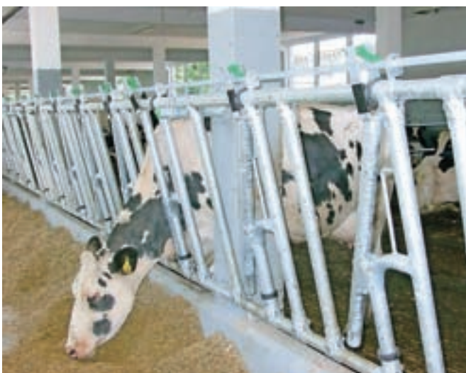
Najpomembnejša dejavnost družbe KŽK Kmetijstvo je živinoreja.