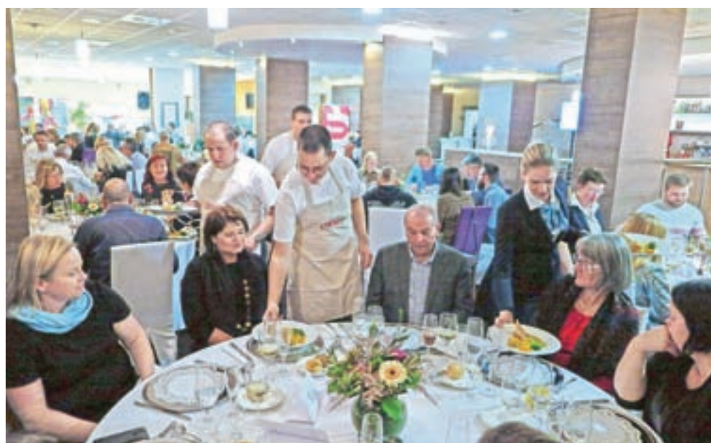
Večerjo so skupaj postregli študenti višje strokovne šole in uporabniki CUDV.