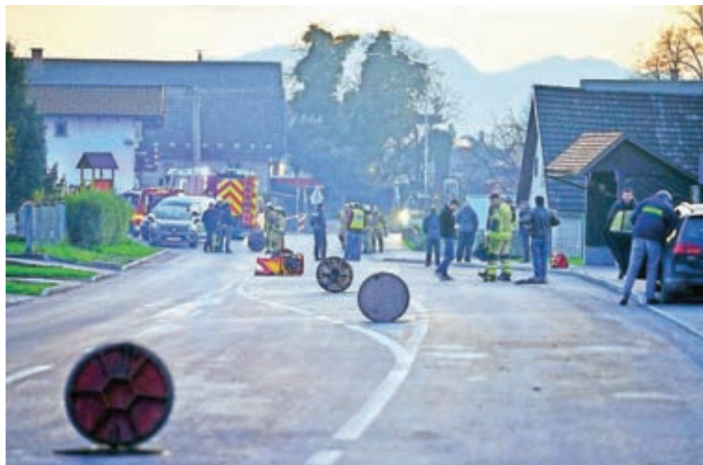
Po eksploziji so prisotnost plina izmerili v celotnem kanalizacijskem sistemu, zato so gasilci takoj pristopili k odzračevanju vseh jaškov.