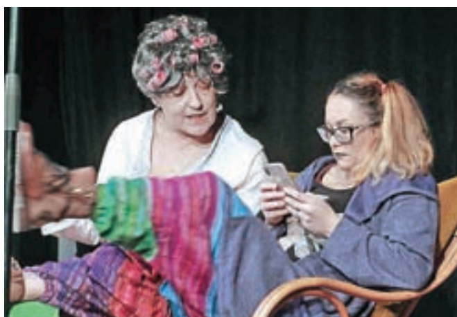
Publiko je nasmejäl skeč, ki je pripovedoval zgodbo o obletnici poroke oziroma ženinih željah ob njej.