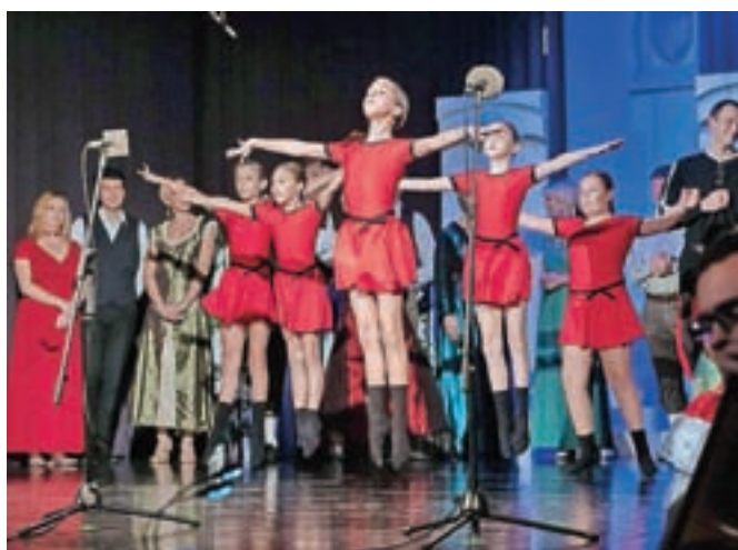
V opereti Hmeljska princesa so nastopile tudi plesalke Plesnega kluba Tržič.