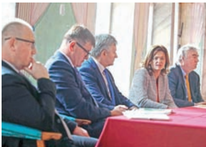
Srečanje predstavnikov in županov občin članic Združenja zgodovinskih mest Slovenije s slovenskimi evropskimi poslanci v Tržiču