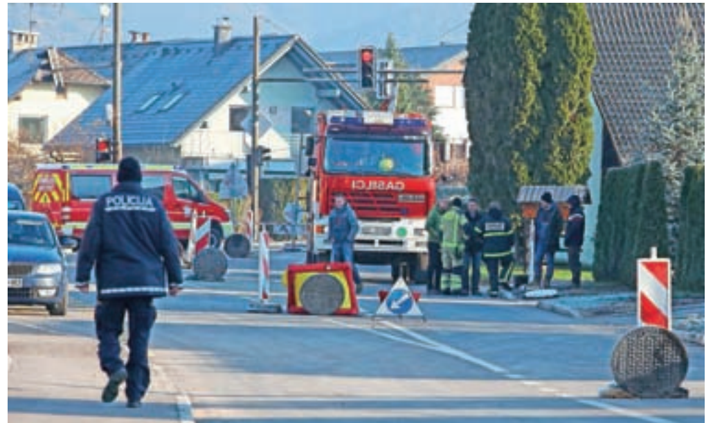
Kriminalisti so v sredo zasegli kos napeljave, ki bo predmet nadaljnje preiskave. Končne ugotovitve o vzroku za nesrečo v naslednjih dneh še ne bodo znane, so razložili na policiji.