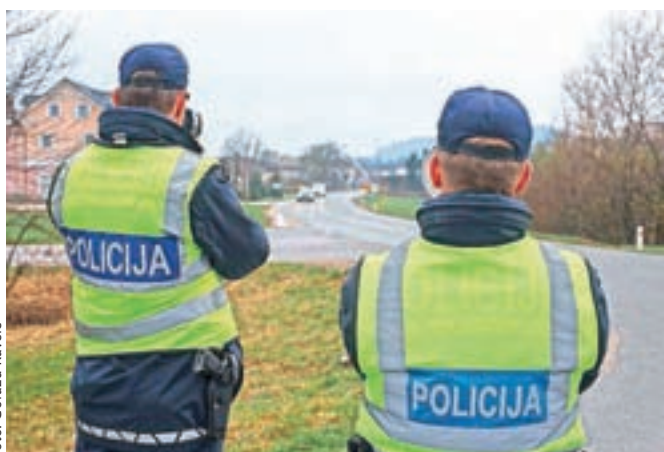
Ustavno sodišče je ugotovilo neustavnost zakona o prekrških, ki jo mora državni zbor odpraviti v letu dni.