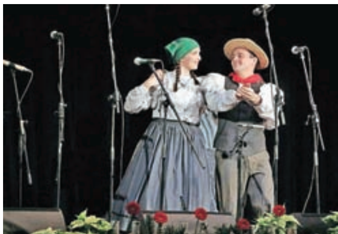
Folklorna skupina Ajda iz Besnice se je predstavila z dvema plesnima postavitvama.