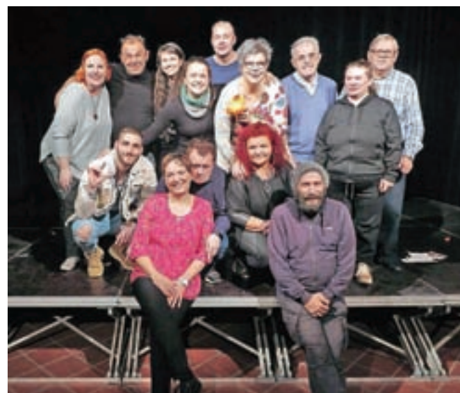
Skupina nastopajočih ob obeh avtorjih predstave Konflikt dokazuje, da brez bliska ni groma.