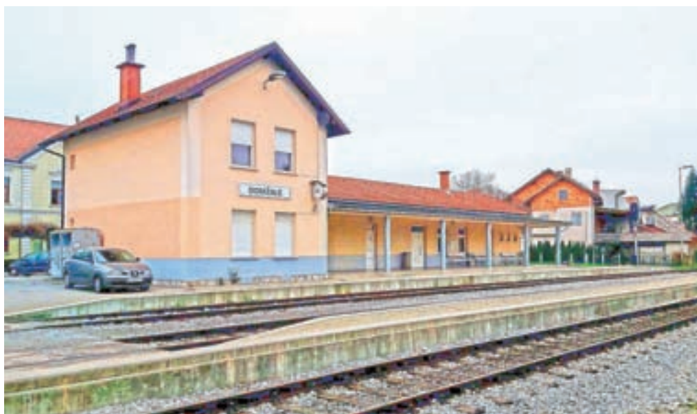
Železniško postajo v Domžalah bodo prenovili in posodobili.

V sklopu rekonstrukcije železniške postaje namerava Direkcija za infrastrukturo predstaviti železniške tise ter peron dvigniti na nivo novih vlakov, da bo potnikom bolj prijazen pri vstopanju in izstopanju z vlakov. Slovenske železnice bodo v drugi polovici decembra dobile nove vlake. Del naročila 52 vlakov Stadler je tudi 21 enopodnih dizelskih (DMV) Stadler FLIRT potniških garnitur. Ti bodo imeli skupno kapaciteto 338 potnikov: 12 sedišč bo v 1. razredu, 159 sedišč v 2. razredu, stojišč pa bo 167. Na voljo bosta dve mesti za gibalno ovirane osebe ter deset mest za kolesa. Pri Slovenskih železnicah pojasnjujejo, da bodo iz tehnoloških razlogov najprej začeli voziti na progah, ki niso elektrificirane. To pomeni, da se bodo novi vlakov najprej razveselili potniki na progah Ljubljana–Kamnik in Ljubljana–Novo mesto. Novi vlaki bodo v vozni red vključeni do aprila 2020.