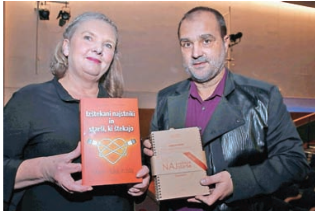
Leonida in Albert Mrgole

Pomembno se jima zdi, da na vprašanja odgovarjamo premišljeno, vsak zase (ne v paru) in da pišemo na roke. »Misli tako ne moreš kar izbrisati, kot jo lahko na računalniku. In kar zapišemo, je v nas, zato ni nič neumno ali nepotrebno. Prava vprašanja prinesejo prave odgovore. Poleg tega pa je pisanje na roko dobro za naše možgane. Povsem drugače izpade, če pomenljive stavke, kot denimo 'rad te imam', natisnemo na tipkovnico, ali pa zapišemo s svinčnikom,« pravita in poudarita, da je knjiga pravzaprav ogledalo, s katerim bralec raziskuje samega sebe. Terapevta, ki se pri svojem delu držita načela, da nikogar ne obsojata,