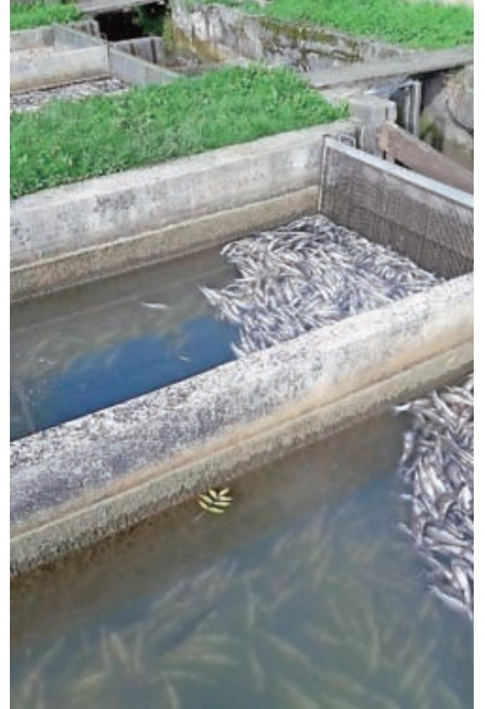
Del poginjenih rib v ribogojnici v Zalogu pri Cerkljah