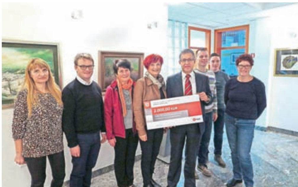
Občini Žiri so v ponedeljek izročili simbolični donatorski ček za projekt Prostofer.