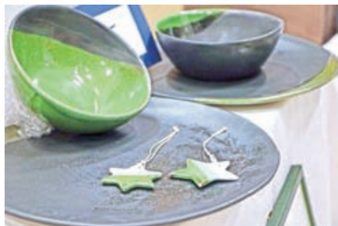
Izbrane umetnine iz zbirke Biseri so šle na dražbo, s katero so zbirali sredstva za nakup nove peči za glino.

Sredstva, ki so jih zbrali na letošnji dobrodelni večerji in dražbi, bodo namenjena nakupu peči za glino in nadaljnjemu usposabljanju in zaposlovanju uporabnikov CUDV Radovljica.