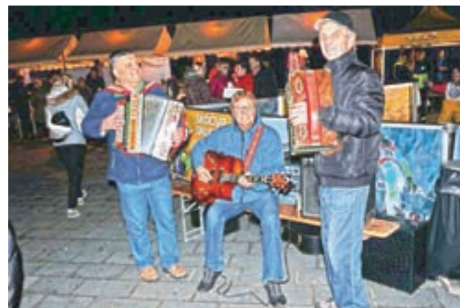
Za glasbeno spremljavo so skrbeli domači godci.

doline Železne niti, in kdor je želel, ga je lahko kupil. Osnovnošolci so imeli svojo stojnico, na kateri so prodajali palačinke, posladkali smo se lahko tudi pri skavtih. Organizatorji sejma so poskrbeli za delavnico izdelovanja adventnih venčkov, otroci so se z največjim veseljem preizkusili na mobilni skakalnici Mini Planica. Za