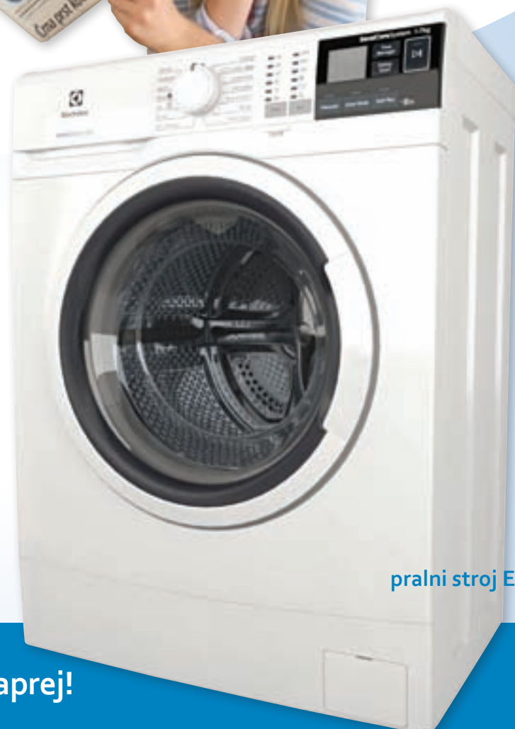
pralni stroj Electrolux

Splača se biti del naše velike družine naročnikov, povej naprej!