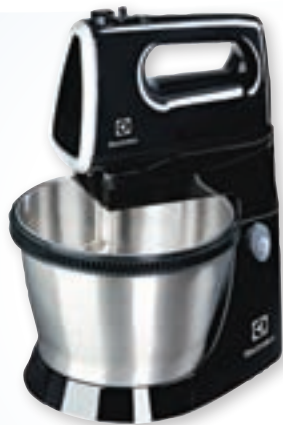
ročni mešalnik Electrolux

Žrebanje bo potekalo v uredništvu Gorenjskega glasa v sredo, 18. 12. 2019.