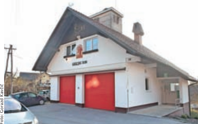
Gradbena inšpektorica je sredi novembra zaprla gasilski dom v Zasipu, ker objekt nima uporabnega dovoljenja.