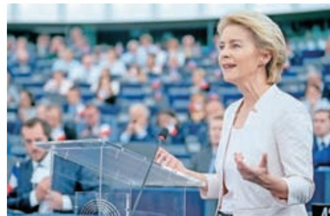
Tako je Ursula von der Leyen nagovorila poslance Evropskega parlamenta, preden so jo ti izvolili za novo predsednico Evropske komisije, 16. 7. 2019.