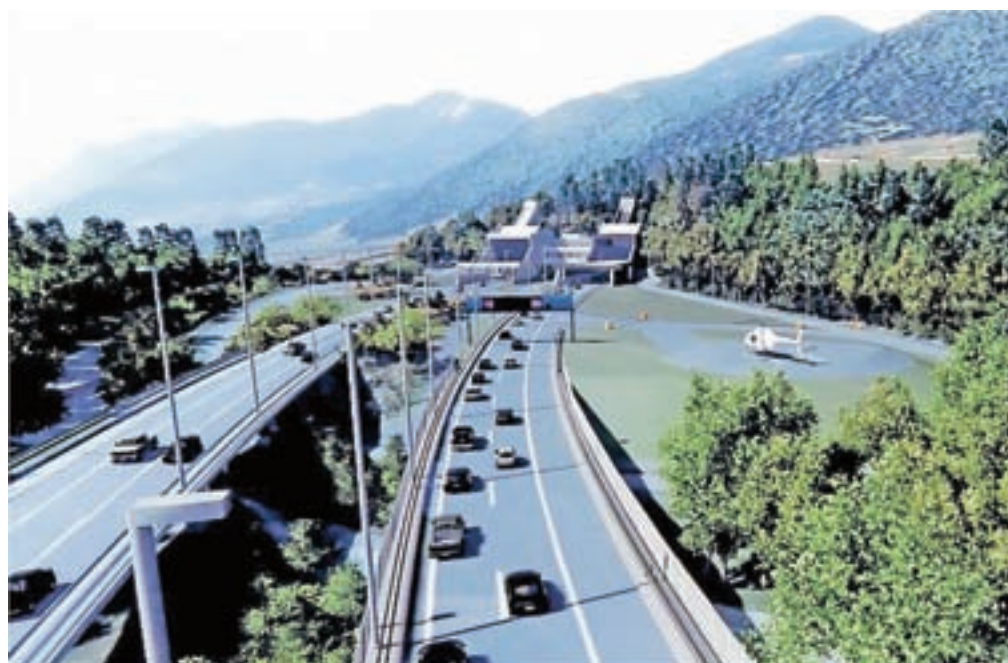
Tako naj bi bil videti predor Karavanke po izgradnji vzhodne cevi.