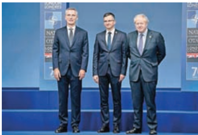
Premier Marjan Šarec na vrhu Nata z britanskim premierjem Borisom Johnsonom (desno) in generalnim sekretarjem Nata Jensom Stoltenbergom (levo)