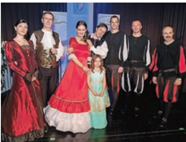
Glavni igralci operete Hmeljska princesa

V opereti Hmeljska princesa je Radovan Gobec kritično spregovoril o izkoriščanju kmečkega človeka, kar poudarja na primeru prekupevalcev s hmeljem. Zgodba je osredotočena na satirično in ljubezensko obarvano vsebino s številnimi