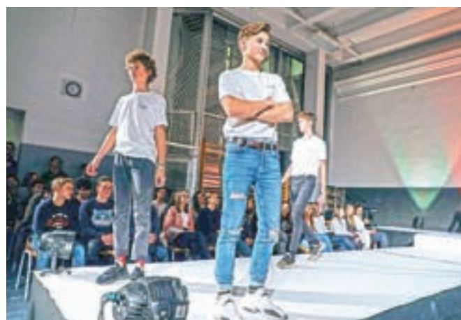
Po modni brvi so se sprehodili gimnazijci.