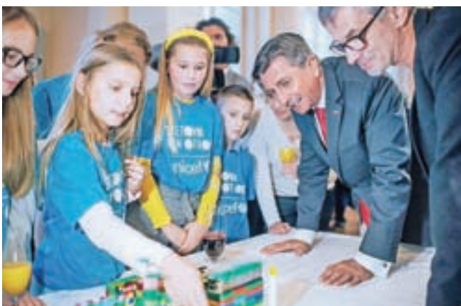
Ob svetovnem dnevu otroka je predsednik države Borut Pahor pripravil sprejem za mlade ambasadorje Unicefa.