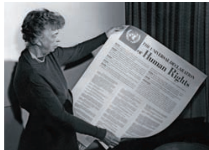
Eleanor Roosevelt, prva dama ZDA v letih 1933–1945, v rokah drži Splošno deklaracijo človekovih pravic, fotografirana novembra 1949

»Ljudje, ki sem jih v taborišču videl umreti na vešilih – prisostvovanja usmrtitvam so bila obvezna – so nam naročili, naj resnico o njihovih smrtih prenesemo svetu, naj jih ne pozabimo. To je v meni pustilo globoko sled in s filmom sem se začel ukvarjati tudi zato, da bi lahko pripovedoval zgodbe o holokavstvu.« To je povedal hrvaški filmski producent Branko Lustig (1932–2019). Na dolgem seznamu filmov, ki jih je produciral, sta tudi Schindlerjev seznam in Gladiator. Za oba je dobil oskarja. Umril je 14. novembra v Zagrebu.