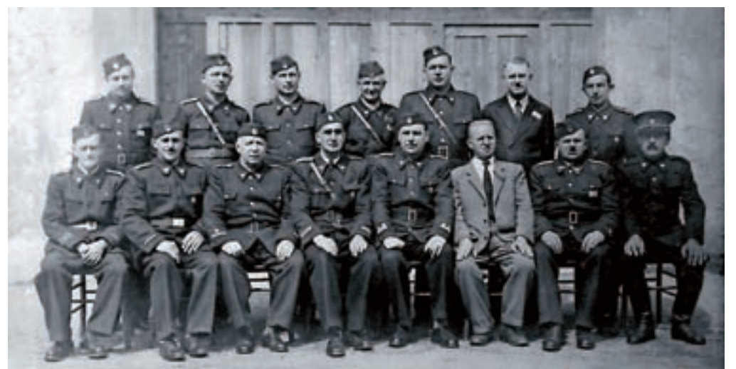
Poveljstvo Prostovoljnega gasilskega društva Kranj, leto 1952

v gasilnem društvu Ljubljana,« izpostavlja Tomat.