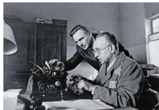
Prizor iz filma Schindlerjev seznam (1993), pri katerem je bil Branko Lustig eden od producentov in je za svoje delo dobil oskarja