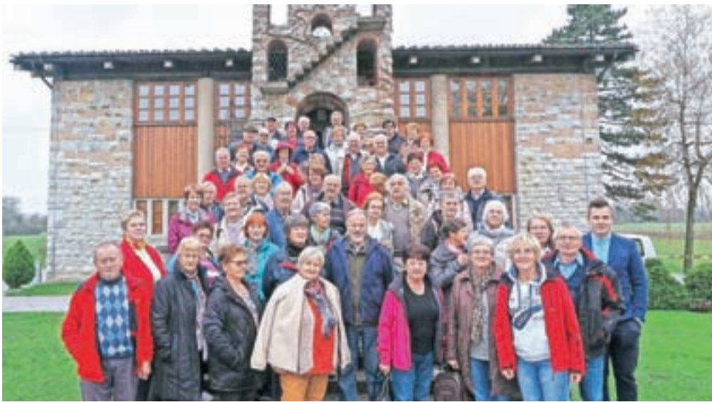
Naša skupina na prvem izletu pred cerkvijo sv. Mihaela na Barju