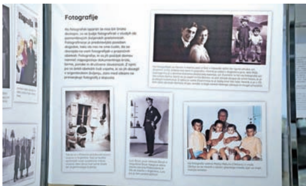
Razstava Od pisem do Facebooka v Mestni knjižnici Kranj

Sledijo obsežne spremembe, ki jih je prinesla revolucija tehnologije. Vlogo, ki so jo včasih v sporazumevanju imela pisma, so danes prevzeli elektronski mediji. Novi načini sporazumevanja so prekinili mučno čakanje na sporočilo, a vseeno niso ukinili razdalje, vmesnega prostora, ki onemogoča pristne stike. »Vprašanje je, kakšni sledovi bodo ostali za sporočili novodobne komunikacije, ki jo je prinesla digitalna tehnologija,« se je vprašal Zobec. Avtorja sta za konec še pojasnila, da sicer zelo grobe in površne ocene pravijo, da se je iz slovenskega območja v Argentino izselilo okoli trideset tisoč ljudi.