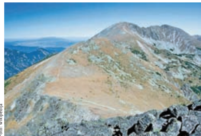
Pogled na goro Musala (2925 m n. m.) v pogorju Rila v Bolgariji, ki je najvišji vrh Balkana in je že v Evropski uniji