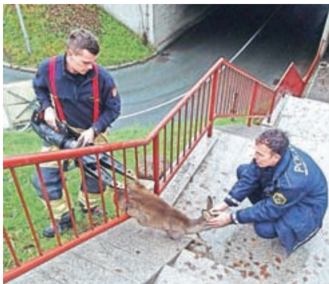
Ubogo srno so s pomočjo hidravličnih klešč uspešno rešili iz ograje.

Na kraj sta kmalu prispela kranjska poklicna gasilca. »S kleščami sta toliko razširila