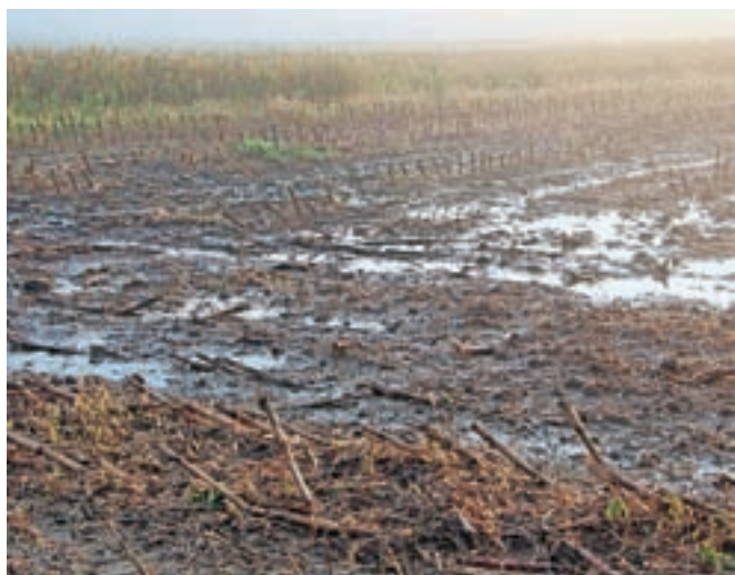
Travniki in njive so razmočeni, tako da tudi v teh dneh razvoz gnojivke ne bi bil možen.

ta, kmet Zvonko Dolinar iz Stare Oselice. V razpravi je bilo slišati, da sobivanje velikih zverí in prebivalstva, kot si ga nekateri predstavljajo, v praksi ni možno in da ograevanje kmetijskih (pašnih) površin za zaščito živali pred divjadjo in zvermi ni smiselna rešitev. »Državne gozdo-