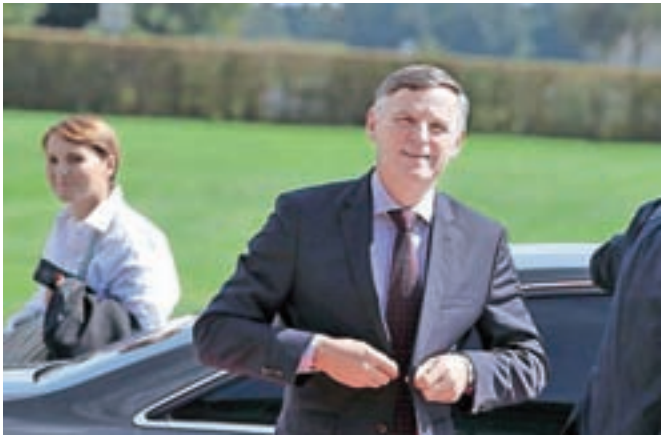
Minister za finance Andrej Bertoncelj je pred razpravo o prihodnjih proračunih in zakonu o izvrševanju proračunov zagrozil z odstopom, če bi bili potrjeni višji povprečniki za občine, kot je predlagala vlada.