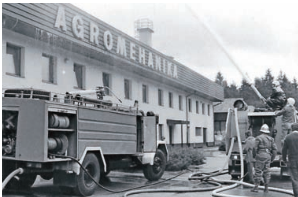
Gašenje požara v Agromehaniki leta 1986