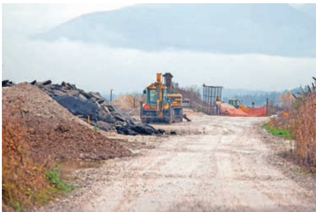
Večji del zemljišč, na katerih je v Suhadolah odlagališče, ki ga je treba zapreti, je v zasebni lasti treh podjetij, del pa v lasti Občine Komenda.