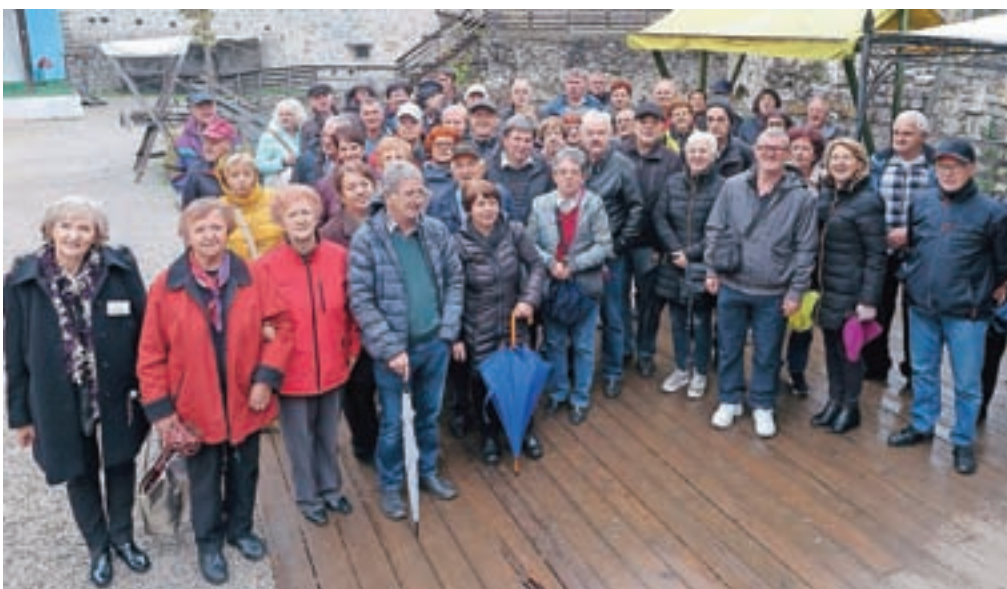
Druga skupina na dvorišču gradu v Žužemberku