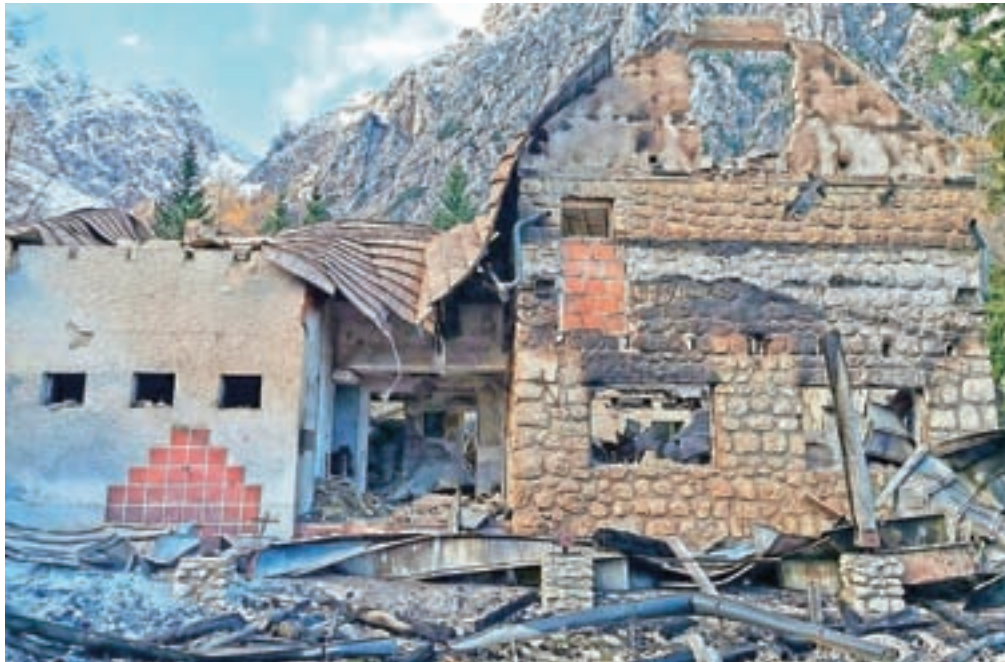
Od Frischaufovega doma na Okrešlju so po požaru ostali le še zidovi.

Ker so prihodki iz poslovanja planinskih koč za planinska društva zelo pomembni, nesreče pa kar pogoste, smo preverili, kdo je odgovoren za njihovo zavarovanje in kako za to področje skrbijo na Planinski zvezi Slovenije (PZS). »Zavarovanje je odgovornost vsakega lastnika planinske kočice, ki so v večini primerov v lasti planinskih društev. Zavarovanje planinskih koč tako ureja vsako društvo zase, na ravni PZS nimamo dodatno ali vzporedno nobene skupne police. Pred leti je bila podana pobuda za skupno zavarovanje, vendar zaradi velike navezanosti na posamezno zavarovalnico, s katero društvo že dlje sodeluje,