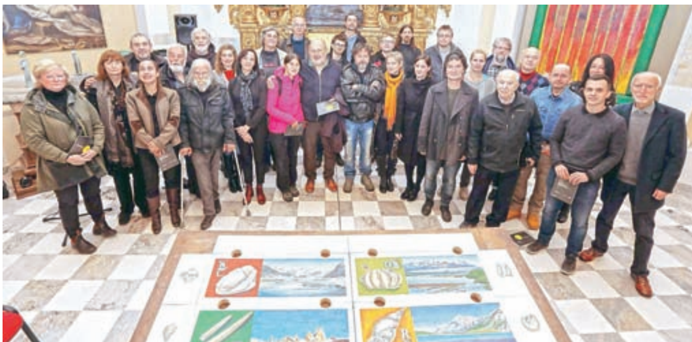
Večina članov se je udeležila odprtja razstave, kjer preprosto ni mogla ubežati skupinski fotografiji.

tako kar 140 del 72 sodelujočih avtorjev, ki sta jih odbirala zadnja dva meseca, ko