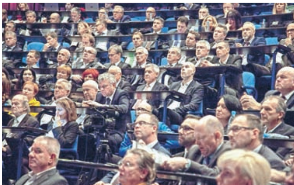
Na Vrh so udeleženci sprejeli več ukrepov za nadaljnji razvoj slovenskega gospodarstva, ki dosega rekordne številke.

Ljubljana – V sredo je pod geslom Slovenija gre naprej v Ljubljani potekal 14. Vrh slovenskega gospodarstva, na katerem se je zbralo okoli 450 predstavnikov vodilnih slovenskih podjetij ter tudi politike in drugih javnosti. Na Vrh, ki ga je organizirala Gospodarska zbornica Slovenije, so gospodarstveniki z vlado in znanostjo podpisali tudi Izjavo za Slovenijo 5.0. Z izjavo so se zavezali, da bodo v gospodarstvu povečali vlaganja v razvoj in inovativnost, v posodobitve procesov ter skrb za okolje.