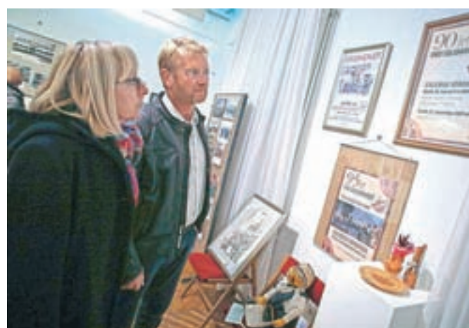
Stoletnico društva so člani predstavili s starimi fotografijami, vabili, plakati ...

Razstavo so v dvorani nad kavarno Veronika odprli 15. novembra, na ogled pa bo še danes, v petek, med 16. in 18. uro. Danes bo ob stoletnici tudi slavnostni koncert, ki se bo v Domu kulture Kamnik začel ob 19. uri.