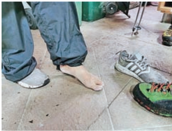
Nespametni turist se je proti Triglavu podal v navadnih športnih copatih in ga nista ustavila ne povišan vodostaj ne visok sneg.