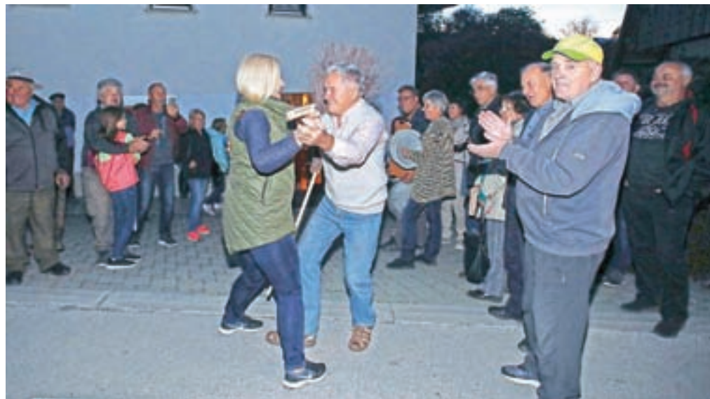
Na predvečer rojstnega dne so ga domači, sosede, prijatelji in kolegi čebelarji presenetili z »ofiranjem«, slavljenec pa se je ob zvokih Pihalnega orkestra Lesce z veseljem celo zavrtel.

strie, ki je odšel v partizane, komaj 15-letnemu prepuštil skrb za čebelje družine. Takoj po vojni se je vključil v čebelarstvo društvo Radovljica ter kupil dva kranjčiča in svoj prvi AŽ-panj; oba ima v svojem čebelnjaku še danes. Prva teoretična znanja je pridobil od izkušenih čebelarjev in radovljiških učiteljev Beblerja in Pıklja, pozneje pa je svoje znanje širil predvsem s pogovori s kolegi čebelarji in branjem Slovenskega čebelarja, ki je bil takrat edina dostopna literatura s področja čebelarstva.