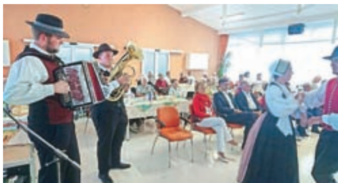
Prijetno druženje v Domu upokojencev Kranj