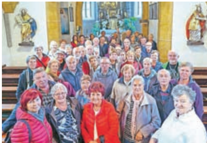
Tretja skupina izletnikov v cerkvi v Svečah