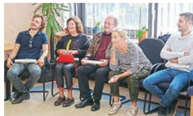
Ekipo priljubljene serije Reka ljubezni je z veseljem prišla v Kranj.

igralcev uporabnikom VDC Kranj, odraslim osebam z motnjami v duševnem razvoju, uresničila srčna želja. V zavodu namreč poleg vključevanja v delovno okolje nenehno iščejo tudi možnosti in priložnosti za čim bolj aktivno vključevanje uporabnikov v družbeno življenje. Tako so na njihovo pobudo in željo že drugo leto pripravili tudi izlet po poti priljubljene slovenske televizijske serije Reka ljubezni. Ogleдали so si idilično vas Krka in druge kraje iz serije, imeli pa so tudi veliko željo, da spoznajo še igralce. V VDC so pripravili video posnetek, v katerem so uporabniki doživeto nagoovorili igralce serije in jih povabili v zavod.