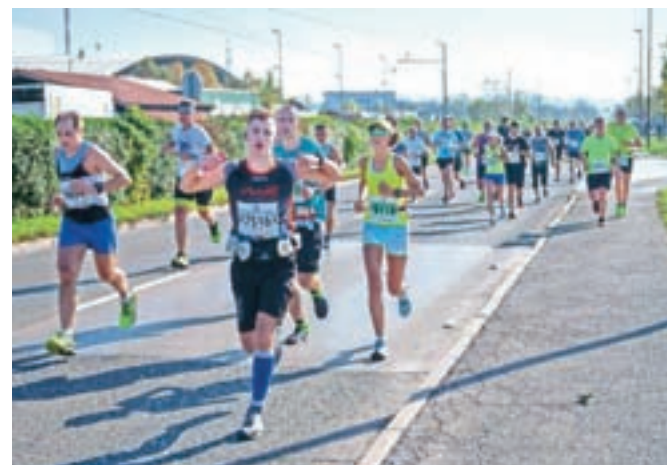
Ljubljanski maraton je letos potekal v lepem vremenu, tekači in tekačice pa so poskrbeli tudi za rekorde.

Skupaj je bilo v dveh dneh 19.612 aktivnih udeležencev. V soboto je bilo na tekih otrok ter osnovnošolcev in dijakov 7172 udeležencev, v nedeljo pa je na 10, 21 in 42 kilometrov startalo 12.440 tekačev.