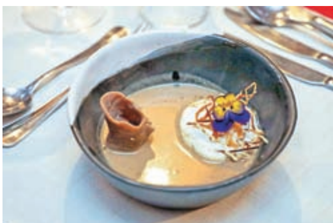
Želodova juha z raviolom iz želodove moke, polnjenim s skuto, in espumo kisle smetane, kot so si jo zamislili v restavraciji Center iz Lesc, ki letos prvič sodeluje v Okusih Radol'ce