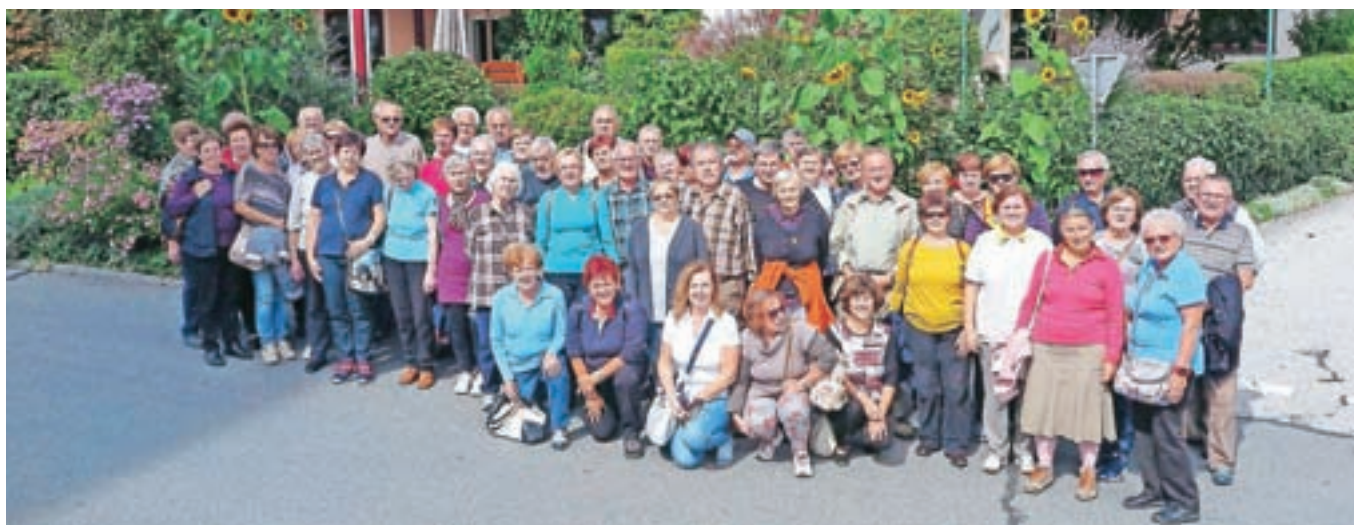
Izletniki Gorenjskega glasa (druga skupina) pred gostilno Ogris v Bilčovsu