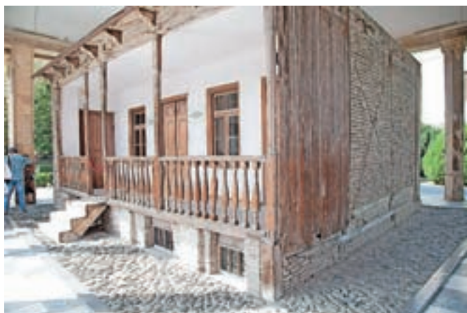
Stalinova rojstna hiša v Goriju