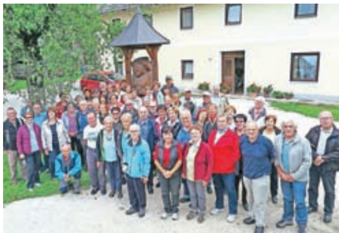
Prva skupina izletnikov pred Kernjakovim domom v Trebinji