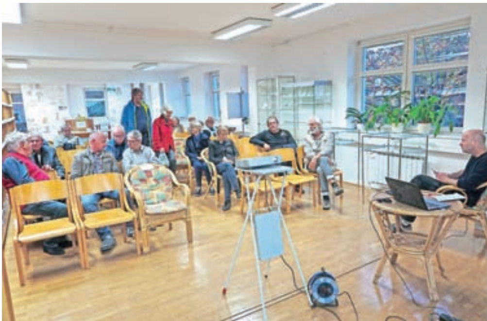
V blejski knjižnici so minuli četrtek pripravili pogovor na temo, kakšno obvoznico proti Bohinju si zasluži Bled.