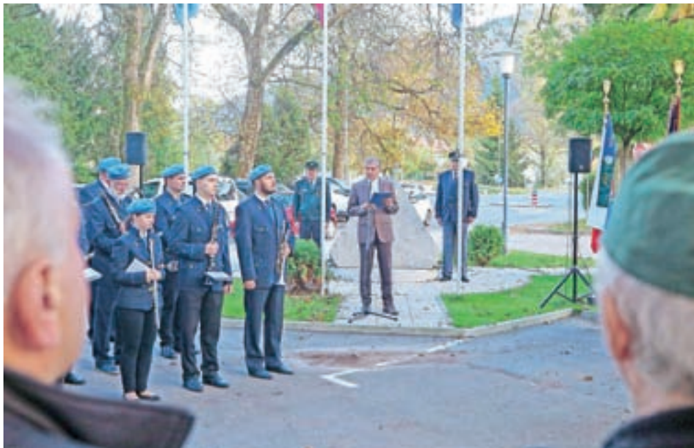
Slovesnost ob dnevu suverenost so v Kamniku pripravili pred spomenikom, ki so ga v spomin na odhod zadnjega vojaka JLA postavili pred Domom kulture Kamnik.

»Ko so zadnje enote jugoslovanske armade dvignile rampe in sidra, smo si globoko oddahnili. Zares globoko!