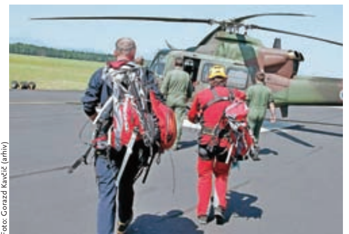
Združena ekipa Gorske reševalne službe in Helikopterske nujne medicinske pomoči na Brniku je minuli konec tedna s helikopterjem Slovenske vojske petkrat odletela v hribe.

V soboto kmalu po 13. uri si je pod vrhom Storžiča