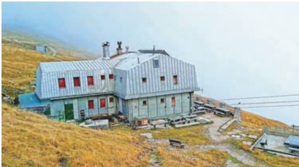
Kamniška koča na Kamniškem sedlu je za letos že zaprla svoja vrata.

Kranj – Poletna sezona v planinskih kočah je bila ena boljših v zadnjih desetih letih, k čemur sta botrovala tako vreme kot porast števil tujih obiskovalcev v Sloveniji, a oskrbniki planinskih koč in planinska društva so že potegnili črto pod sezono, saj je večina koč svoja vrata že zaprla. Visokogorske kočje v Julijskih Alpah so z izjemo oskrbovanega Doma na Komni, ki je odprt vse leto, že vse zaprle svoja vrata, planinci lahko na zavetje in prenočišče računajo še pri meteorologih v Triglavskem domu na Kredarici ter na možnost zatočišča v neoskrbovanih zimskih sobah in bivakih. Stalno odprti tudi jeseni in pozimi ostajajo Planinski dom Tamar v Julijcih, Domžalski dom na Mali planini v Kamniško-Savinjskih Alpah in Valvasorjev dom pod Stolom v Karavankah ter številne nižje ležeče kočje po Sloveniji, medtem ko so preostale prešle na jesensko-zimski delovni čas in planince odprtih vrat pričakajo le ob koncu tedna in praznikih. Zaradi obnovitvenih del bosta novembra