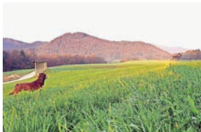
Nedeljsko jutro na besniških dobravah, ko še ni bilo nikogar

V nedeljo je bila v Ljubljani največja tekaška prireditelja v Sloveniji. Sam sem se tega dogodka udeležil že večkrat na vseh možnih razdaljah in bil precej tekmovalno razpoložen. Kako ne, saj sem se pripravljaval nekaj mesecev, s prijatelji tekači veliko govoril o prehrani, tempo teku, tekaški obutvi, zaščiti pred žulji. Znan mi je občutek, ko stojiš na startu in se po glavi vozi veliko misli in strahov: ali sem dovolj jedel, ali sem si zavezal vezalke ... Sledita odštevanje starterja in strel za začetek maratona. Takrat se vse misli spremenijo v eno samo – kako čim prej priti v cilj. Med tekom pogledujem na uro in se sprašujem, ali imam pravi tempo, spremeljam ostale tekače, bolečine v nogah odmislim. Na srečo težav s poškodbami nisem