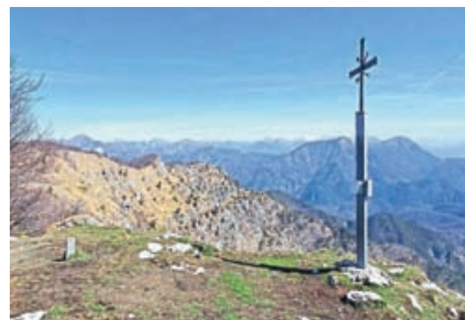
Monte Taïet s čudovitim razgledom na Karnijske Alpe in Julijsko predgorje