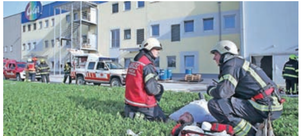
Če bi v Heliosovem obratu Color v Preski resnično zagorelo, bi se lokalne gasilske enote zelo hitro odzvale, so ugotovili na petkovi vaji.