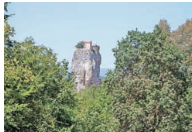
Steber Katskhi, na katerem stoji manjša cerkev

ima tudi osrednji del Gruzije precej ponuditi. Številni, predvsem pa turisti iz nekdanjih sovjetskih republik, ne bodo izpustili mesta Gori, kjer se je rodil brez dvoma najznamenitejši Gruzijec Josif Visarionovič Džugašvili, kot se glasi Stalinovo polno ime. V mestu se je ohranila njegova rojstna hiša, kjer je sovjetski voditelj prebil prva štiri leta svojega življenja. Ndaleč stran pa stoji tudi precej velik muzej, posvečen njegovemu življenju in delu. Muzej je še vedno prežet s