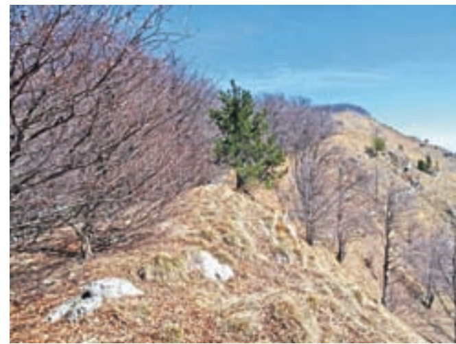
Pot po grebenu poteka po robu. Ponekod malce izpostavljeno.

pa preči, skoraj po ravnem, vmes se malce spusti, in spet dvigne. Ponekod je pot precej izpostavljena, zato previdno, sploh ko nad seboj občudujemo mogočne skalne stolpe. Ko je prečenje v nedrje zahodnega dela končano, se pot strmo dvigne na greben. Nad seboj zagledamo naš prvi vrh, Monte Rosso, Monte Dagn pod nami pa je videti kot skromna kratina. Pot se obrne proti vzhodu. Dosežemo še eno razpotje, kjer nadaljujemo desno po grebenu, ki ga vidimo pred seboj. Levo gre pot 820, ki jo bomo dosegli na drugi strani grebena. Prečenje grebena do nedavnega ni bilo označeno, zdaj pa nas občasno spremljajo markacije in možici. Pot je speljana povsem po robu, a zaradi izjemno strmega travnatega pobočja in neobsekanih vej dreves predlagam, da hodimo bolj po notranji strani grebena, da se ne bi zgodilo kaj nepredvidljivega. Veje dreves so lahko zelo nevarne. Prvi vrh je Monte Rossa, 1369 m n. m., s katerega se spustimo in hitro dosežemo naslednji vrh Monte Taïet (1369 m n. m.), kjer je kovinski križ z vpisno knjigo. Z Monte Taïeta se po grebenu začnemo spuščati proti poti 820. V tem delu pot ni označena, markacije izginejo, steza je in je ni. Treba je imeti nekaj občutka. Po