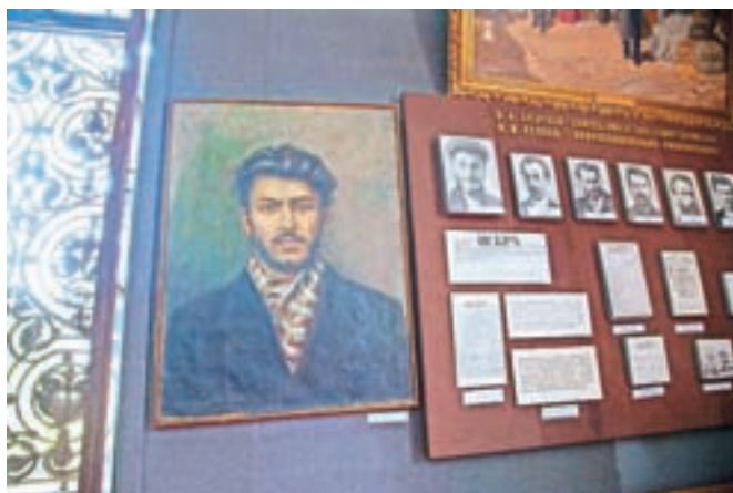
Stalinov mladostni portret