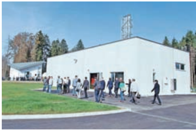
Razdelilna postaja (v ozadju) in centralni energetski objekt na Letališču Jožeta Pučnika

investicijo ocenjujejo na milijon evrov. Objekta je odprla ministrica za infrastrukturo Alenka Bratušek. Kot pravi, sta oba objekta pomembna ne le za brniško letališče in poslovno cono, temveč tudi za širšo okolico, hkrati pa predstavljata korak v smer nizkoogljične družbe. »Želeli bi si hitrejši prehod na nizkoogljično družbo, a slovenska energetika je v odličnem stanju, kar potrjujejo tudi ocene, ko nas primerjajo z drugimi državami. Smo pa v času, ko postavljamo temelje za prihajajoča desetletja, odločitve, ki jih sprejemamo zdaj, bodo morale biti vsaj tako dobre, kot so bile v preteklosti, da bo naša elektrika konkurenčna, cenovno ugodna – in želim si, da tudi čim bolj čista,« je v izjavi za medije povedala ministrica.