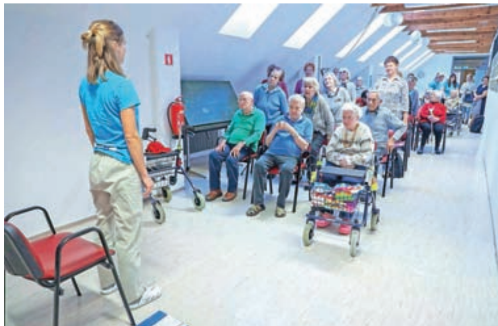
Obiskovalcem delavnice ekipa projekta Gerobus poda uporabne in koristne informacije za aktivno in prijetno staranje.