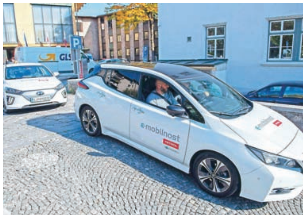
Potem ko so izvedeli vse podrobnosti, so udeleženci predstavitve električne avtomobile lahko tudi preizkusili.

Tako se je četrtkovemu dogodku pridružilo kar precej predstavnikov gorenjskih občin, soorganizator pa je bila tudi Mestna občina Kranj. »V občini veliko vlagamo v trajnostno mobilnost, zato smo veseli, da ste nas obiskali in da imamo možnost slišati najnovejši dosežke na tem področju. V Kranju imamo največjo mrežo elektrificiranih koles v Sloveniji. Pospešeno gradimo kolesarnice, na Planini dokončujemo mobilni center. Po zgledu vseh večjih občin v Kranju vozi električno vozilo Kranvaj,