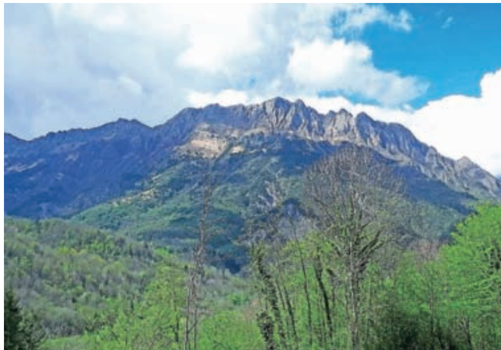
Greben Monte Rossa, poraščen hrib spredaj pa je Monte Dagn

travniku dosežemo markirano pot 820, kjer je tudi informativna tabla. Sledi sestop po poti 820, ponekod je izjemno strmo, do razpotja, ki sicer ni posebej označeno, le napis na skali nam da vedeti, da moramo zaviti desno. Občasno se pojavi tudi kakšna doma narejena smerna tabla. Smo na markirani poti 821, ki nas bo prečno pod mogočnimi stolpi pripeljala nazaj na sedlo Dagn. Ta prečna pot nam pokaže tisto pravo razsežnost gore, ki ima sicer skromno višino, a izjemno divjost in prvinskost. S sedla Dagn se povzpne nazaj