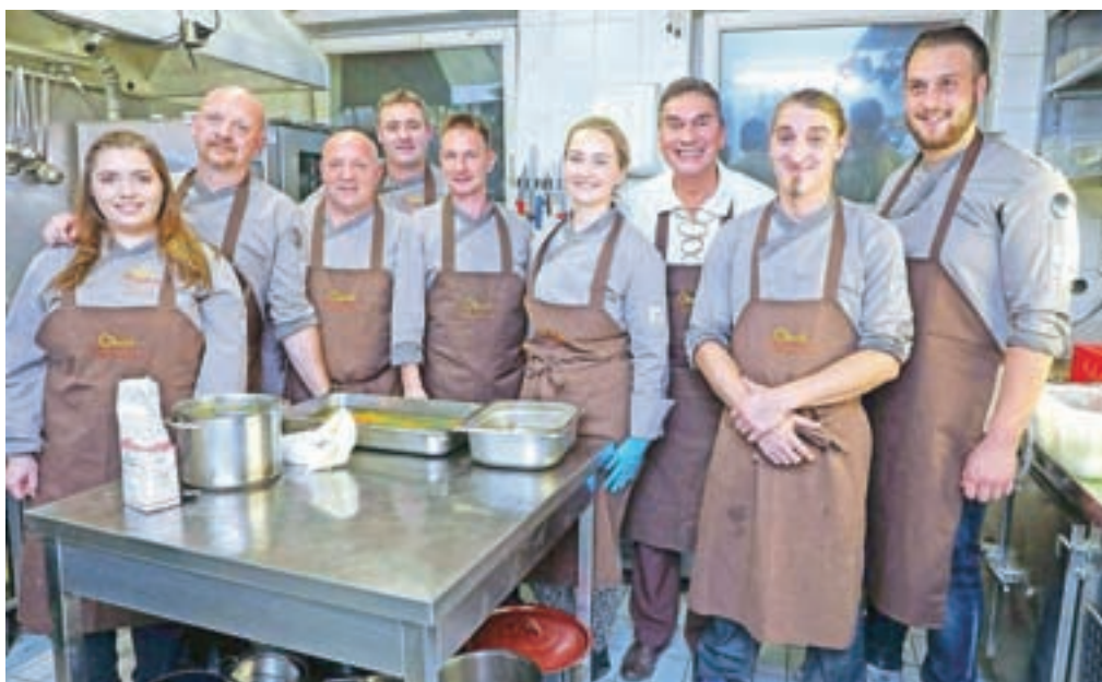
Otvoritveno večerjo so skupaj pripravili kuharski mojstri iz vseh sodelujočih restavracij: Avguštin, Kunstelj, Vila Podvin, Tulipan, Lectar, Tavčar, Draga, Center in Tabor.

Četrtkovo dogajanje v Dragi se je začelo s tržnico lokalnih dobaviteljev. Obiskovalci so lahko na stojnicah pred gostiščem izbirali med pestro ponudbo