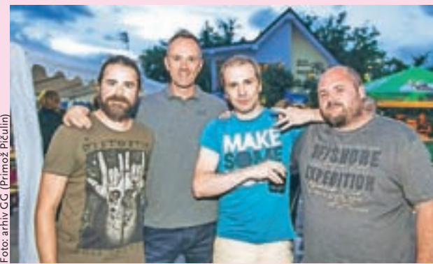
Za noč čarovnic na Bazen prihaja skupina Joške v'n.

Kranj – V četrtek, 31. oktobra, na Bazenu ob noči čarovnic pripravljajo poseben čarovniški večer s koncertom zasedbe Joške v'n od 21. ure.