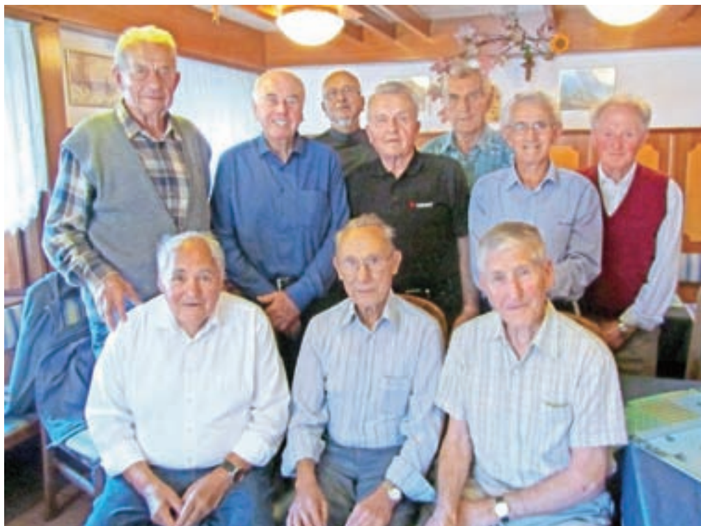
Možje, ki so bili pred šestdesetimi leti vpoklicani v vojsko, so do danes ostali prijatelji. Pretekli teden so se srečali na Laborah.