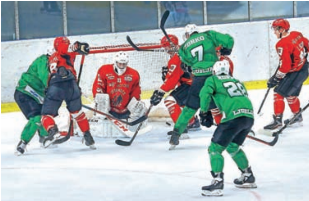
Jeseničani so v zadnjih sekundah rednega dela slavje na jubilejni tekmi prepustili Ljubljancem.