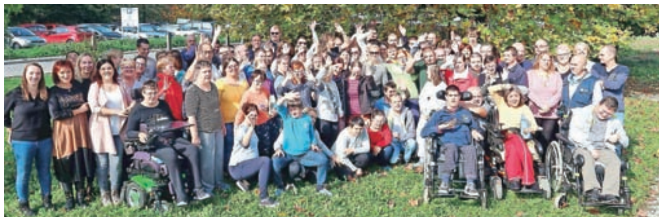
V Varstveno-delovnem centru Kranj so bili veseli druženja z igralci. / Foto: arhiv VDC

Ob koncu druženja je imel marsikdo v očeh solze, ganjeni so bili uporabniki in zaposleni, prav tako pa tudi igralci, saj niso pričakovali tako srčnega in lepega sprejema.