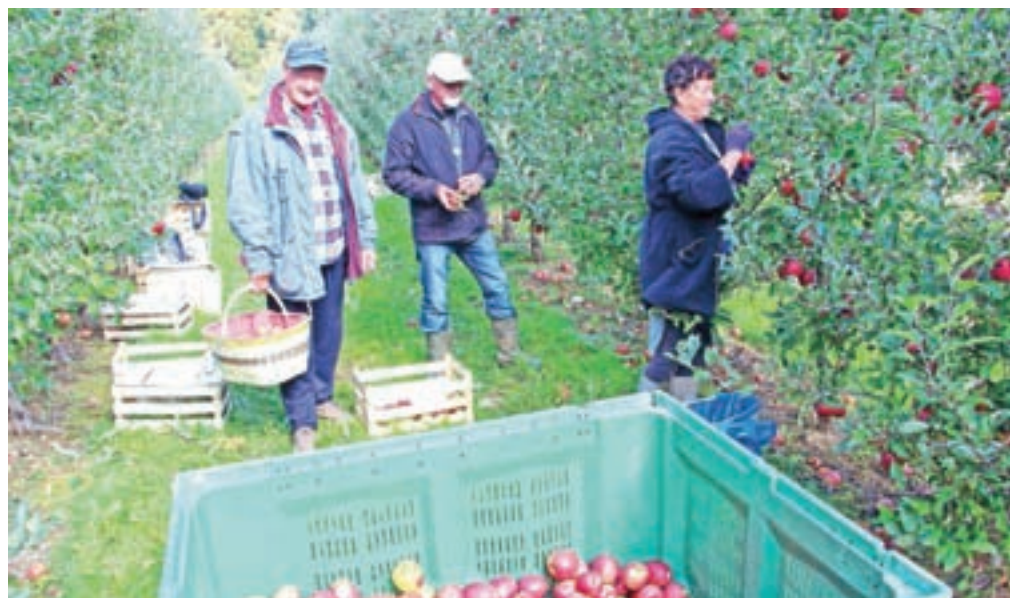
Sadjarjem iz zadruga pomagajo pri obiranju tudi pogodbeni obiralci.

V sadovnjaku Resje je bilo letos v rodnosti 28 hektarjev nasada, od tega 25 hektarjev jablan (poldrugi hektar v ekološki pridelavi), nekaj manj kot pol hektarja hrušk in 2,5 hektarja orehov, ki jih za razliko od jablan pozeba ni prizadela in so dobro obrodili. Jeseni ali čez zimo bodo skrčili en hektar dvajset let starega nasada zlatega delišesa, v poldrugem hektarju nasada jablan, ki so ga posadili lani spomladi, bodo jeseni ali čez zimo poskrbeli za oporo dreves, v prihodnje pa načrtujejo zasaditev še enega hektarja orehov.