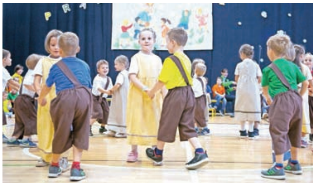
Ob praznovanju obletnice so bili otroci iz vrta glavni ustvarjalci programa.

Med letoma 1981 in 1999 je bil vrtec del Vzgojno-varstvenega zavoda Antona Medveda iz Kamnika, pred dvajsetimi leti, z ustanovitvijo Občine Komenda ter v obdobju