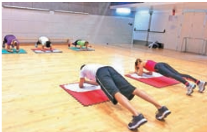
Ena izmed vaj v okviru testiranja je tudi dobro znana deska (t. i. plank), vadbeni položaj za krepitev telesnega jedra.

»Testiranje je namenjeno izključno rekreativnim športnikom. Vključuje sedem različnih vaj za testiranje motoričnih sposobnosti,