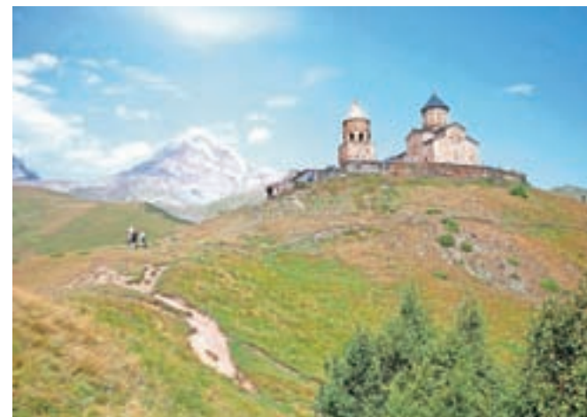
Cerkev sv. Trojice nad Stepantsmindo

Poleg vina pa omamo drugačne vrste ponuja kavkaško gorovje. Hribolazcem zlepa ne bo zmanjkalo