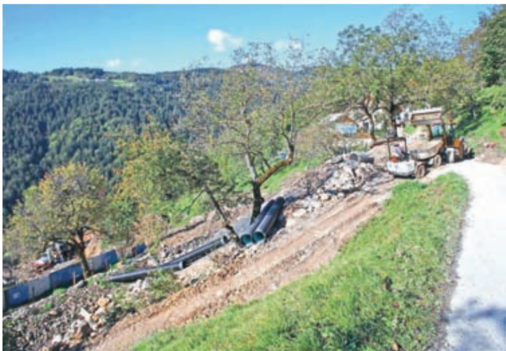
Sanacija plazu v Dražgošah poteka že od maja, glavnina del naj bi bila končana do sredine novembra.