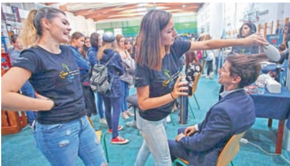
Dijaki so bodočim srednješolcem na praktičen način prikazali poklice, za katere se lahko izobražujejo na Gorenjskem.