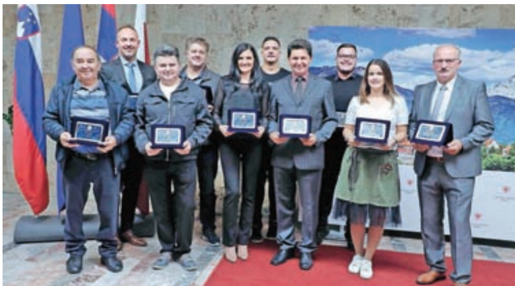
Slavnostna akademija in podelitev priznanj: ustanovni člani KD Brdo in najbolj aktivni mladi člani društva