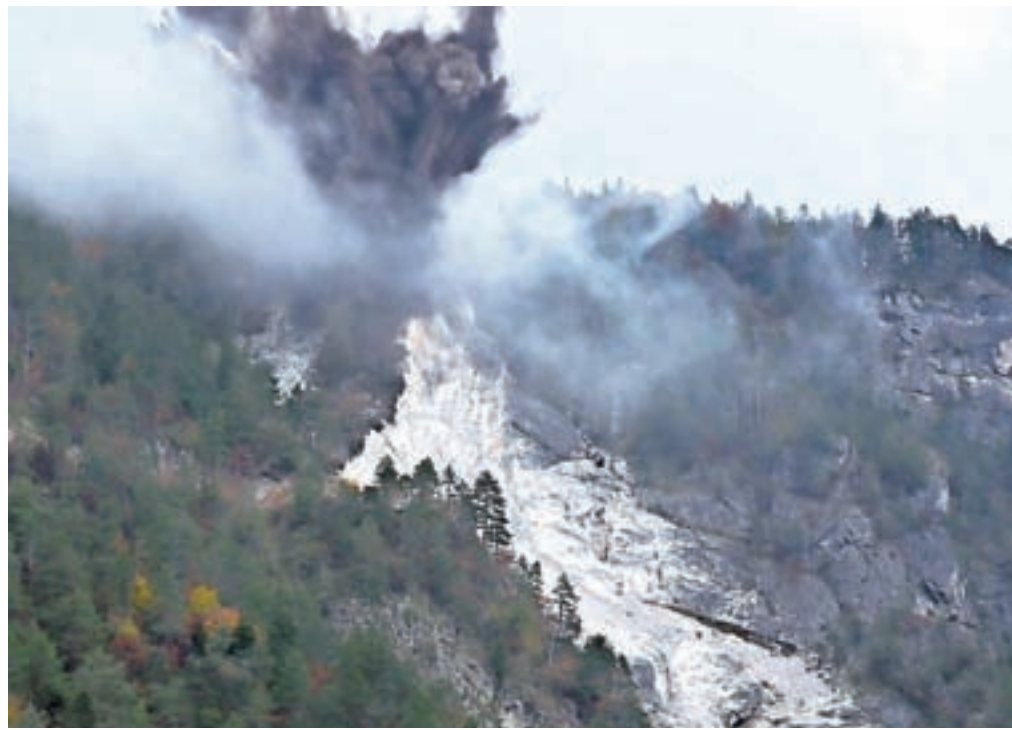
Prejšnji teden so izvedli drugi delni odstrel kamnitega bloka na dveh mestih. Po prvih ocenah so odstrelili od trideset do petintrideset tisoč kubičnih metrov kamnine.