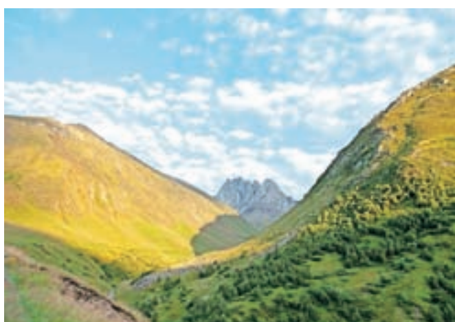
Kazbegi ponujajo številne pohodniške poti