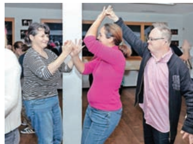
Gibalne delavnice v Barki potekajo že dvajset let in njihova skupina je znana po vsej Sloveniji. Zbrane so navdušili tudi na petkovem praznovanju obletnice.

Spontano, sproščeno, prijetno je bilo tudi na praznovanju obletnice, ko so v Barki skupaj z zbranimi obiskovalci odplesali v novo, že tretje desetletje gibalne delavnice.