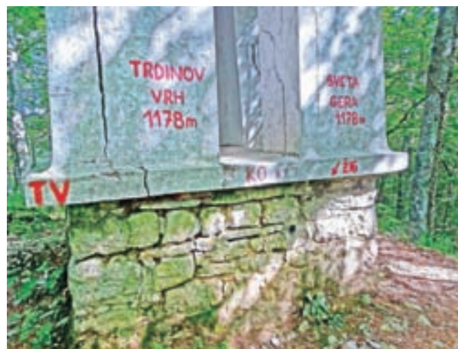
Trdinov vrh ali Sveta Gera, odvisno, na kateri strani meje živimo

so orientacijska tabla, skrinjica in žig. Oglejmo si še obe cerkvi, sv. Jere in sv. Ilije, ter v gozdu poiščimo še visok betonski stolp, kjer je hrvaški žig Sveta Gera.