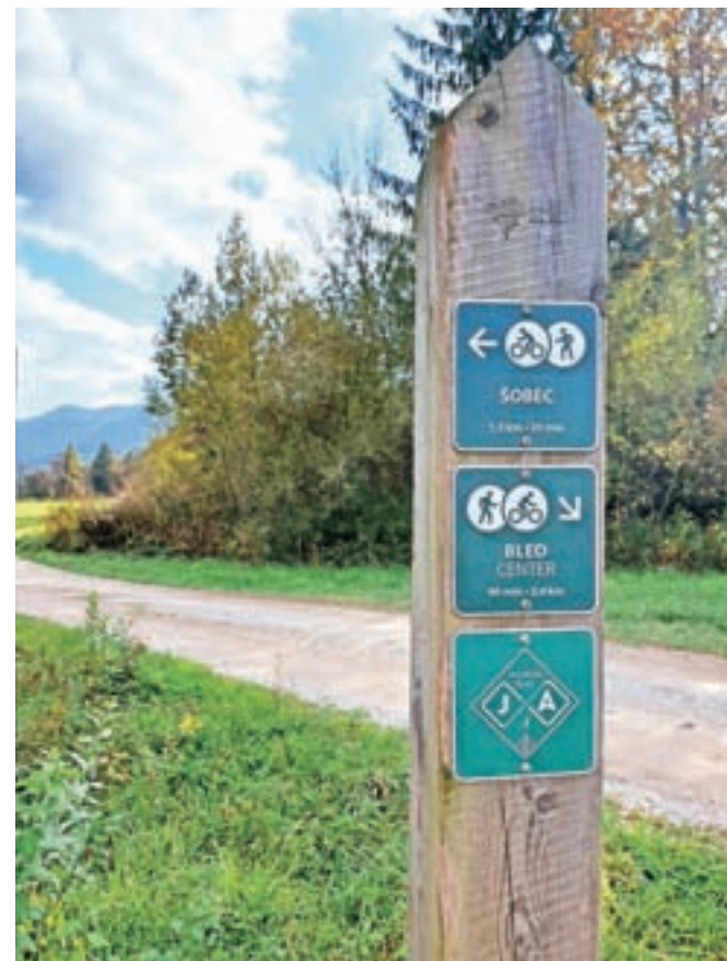
Pohodniška pot Juliana Trail je že označena z oznakami JA. Četrta etapa denimo poteka od Begunj do Bleda.