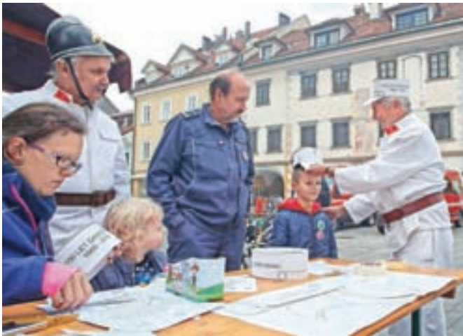
Ob 150-letnici gasilstva na Slovenskem so otroci izdelovali čepice, kakršne so nosili prvi slovenski gasilci.

Kranj – V oktobru, mesecu požarne varnosti, številna gasilska društva po Gorenjskem odpro svoje domove tudi splošni javnosti, da ji predstavijo svoje aktivnosti, razkažejo opremo in ji svetujejo, kako se izogniti nastanku požara oziroma kako ravnati, ko vseeno zagori. V Gasilski zvezi Mestne občine Kranj (GZ MOK) pa so minulo soboto že tradicionalno gasilsko dejavnost občanom predstavili v starem delu Kranja, kjer so za otroke pripravili tudi gasilske igre in delavnice. Letos so izdelovali kartonske gasilske čepice, kakršne so pred 150 leti (tedaj usnjene) nosili gasilci v Metliki, kjer se je sicer začelo organizirano gasilstvo na Slovenskem.