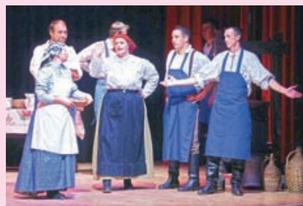
Člani KUD Bled so se predstavili tudi v folklornem muzikalu Ta zgublen desc.