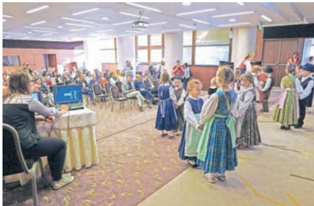
Takole medgeneracijsko se je začela konferenca, ki so jo z nastopom popestrili najmlajši.