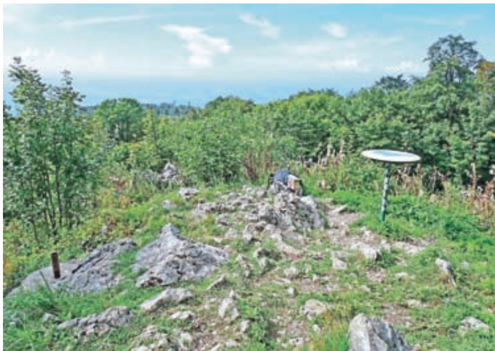
Slovenski vrh in žig Slovenske planinske poti

se velika večina nanj odpravi od Planinskega doma pri Gospodični. Zapeljemo se do Novega mesta, kjer nadaljujemo do vasi Velike Brunsice. Cesti sledimo naprej do vasi Gabrje, na križišču pa zavijemo levo in nadaljujemo proti Gorjancem. Na vseh pomembnih križiščih so oznake za Gospodično. Sledimo makadamski cesti, ki nas vodi globoko v Gorjance in pripelje do Planinskega doma pri Gospodični, kjer tudi parkiramo. S parkirišča se vrnemo nazaj do glavne, makadamske ceste, kjer zavijemo desno, in po nekaj korakih nas smerokaz usmeri levo na gozdno stezo. V spodnjem delu se steza zmerno vzpenja, ko pa zavije levo, nas čaka strm vzpon, ki kar ne pojenja. Ko dosežemo utrjeno makadamsko cesto, jo le prečimo in nadaljujemo vzpon. Ko dosežemo izravnavo v gozdu, pred seboj zagledamo oddajnik na Trdinovem vrhu. Nadaljujemo po izravnavi, nato pa malce izgubimo višino in dosežemo makadamsko cesto. Nekaj korakov gremo po njej, nato pa zavijemo desno, strmo v breg. Naj povem, da je ta del vzpona po dežju zelo blaten in spolzek ter nevaren za zdrse. Strm vzpon nas pripelje direktno na vrh Trdinovega vrha, kjer