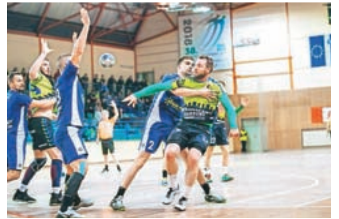
Rokometasi Urbanscape Loke so si v soboto doma priborili zmago.