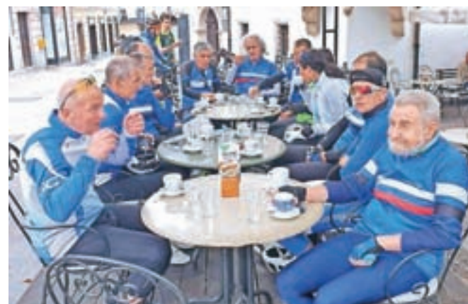
Sproščeno druženje ob kavici je obvezen del kolesarjenja, tokrat pod Homanovo lipo v Škofji Loki.

tekmovalnosti, kot smo jo izžarevali pred desetimi leti, ko smo jeseni skoraj vsak teden organizirali tekmovanje. Še zadnje interno tekmovanje, Ciklokros po besniških Dobravah, smo raje spremenili v sproščeno cestno kolesarjenje, predvideno traso skrajšali in s tem nekaj več časa