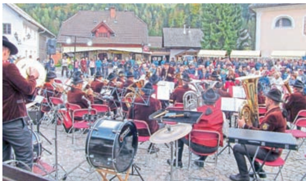
Tokrat so srečanje pihalnih orkestrów treh dežel gostili v Kranjski Gori.