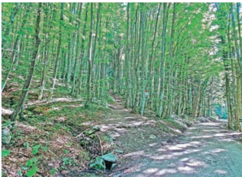
Začetek vzpona proti Trdinovemu vrhu od Planinskega doma pri Gospodični