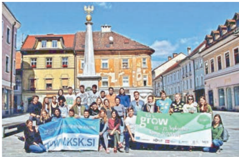
Pri projektu Let's G.R.O.W. je sodelovalo štiriintrideset mladih iz petih držav.