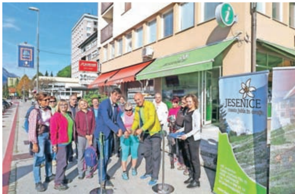
Uradno odprtje poti v petek na Jesenicah. Pohodniki so prehodili del tretje etape po jeseniški občini.

Skupnost Julijske Alpe, v prihodnje poskrbeli tudi za kartončke in zbiranje žigov, izšel pa bo tudi planinski vodnik. Za zdaj so pripravili zemljevid poti po etapah.