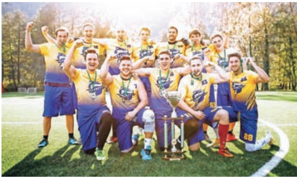
Ekipa Kranjski jazbeci, letošnji državni prvaki v flag footballu