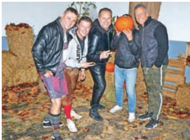
Skupina Victory: brez buče kar ni šlo ...

Gostje na meniju lahko izbirajo med sladkimi, hladnimi in toplimi tapasi, potesijo lakoto z art burgerjem, ki je tudi zelo priljubljen, dame si privoščijo kozareček prosecca, niso pa pozabili tudi na brezglutensko ponudbo in vegansko različico okusnih užitkov.