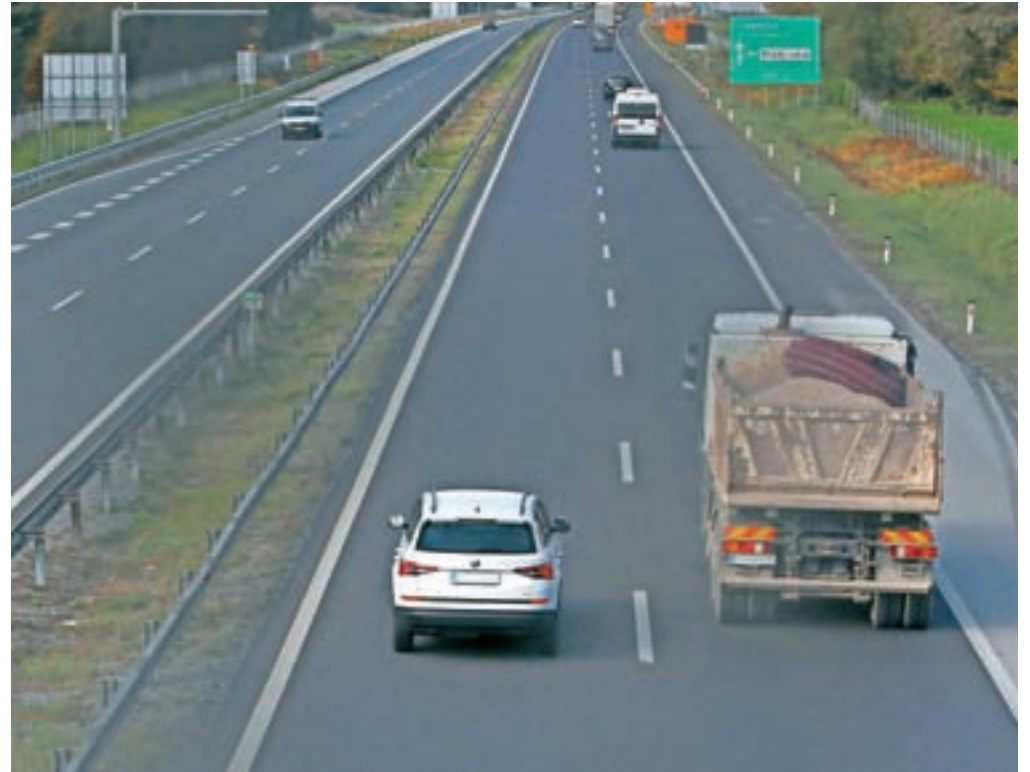
Pred prehitevanjem vozila se mora voznik prepričati, da to lahko stori varno, nato pa prehiteti brez oklevanja. Po končanem prehitevanju se mora čim prej vrniti na desni prometni pas. Vožnja po levem prometnem pasu je lahko nevarna tudi zaradi morebitnega srečanja z vozilom, ki po avtocesti vozi v napačno smer.

stanejo tudi zaradi prekratke varnostne razdalje, stalne menjave pasov, ko so drugi vozniki prisiljeni zmanjšati hitrost, potem tudi zaradi stalne vožnje po levem pasu, poznega zmanjševanja hitrosti pri dohitevanju vozil ... V njih se znajdemo tako med tednom kot tudi ob koncih tedna, ko je prehitvalni pas vedno zaseden z vozili, tudi ko ni tovornih vozil. Vozniki raje vozijo po levem pasu kot z zmanjšano hitrostjo po desnem pasu, z željo po hitrejši vožnji na levem pasu vztrajajo vse do svojega cilja, medtem ko na