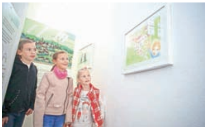
Razstava Kamišibaj skozi slovenske pravljice na stopnišču stolpa Pungert