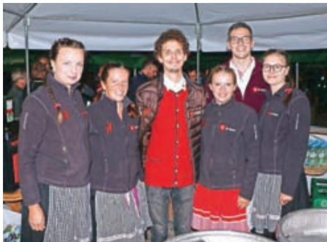
Za strežbo je skrbel ekipa RTC Krvavec.