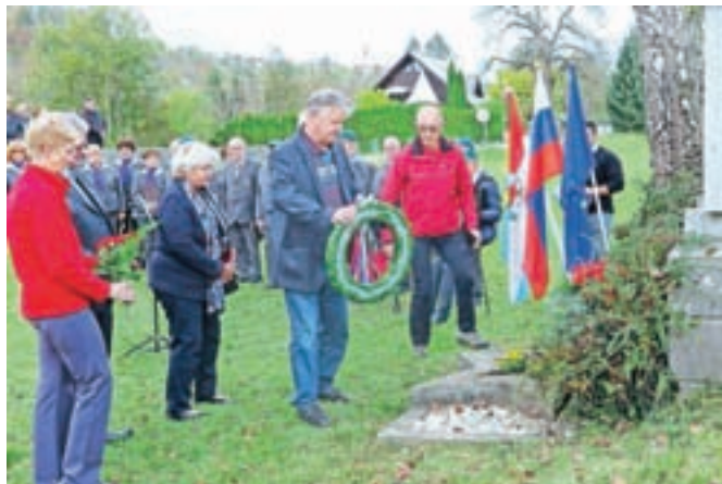
Vence k spominskemu obeležju na mestu, kjer so bili ustreljeni prvi talci na Gorenjskem, sta položili delegaciji združenj borcev za vrednote NOB Radovljica in Črnuče.