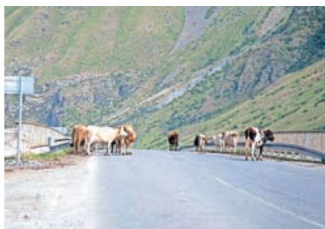
Povsem običajen prizor na gruzijskih cestah