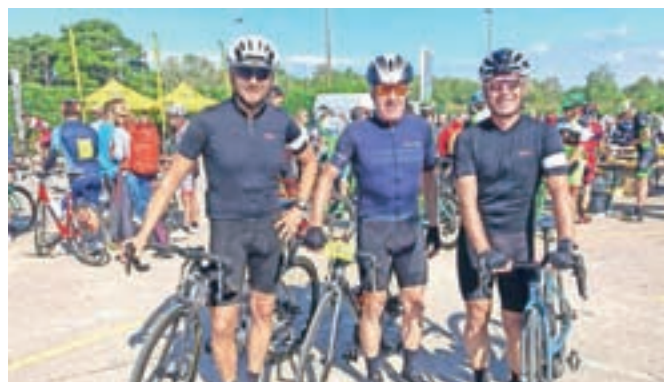
Naši trije na istrskem kolesarskem maratonu