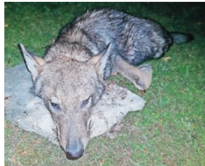
Volk je bil ustreljen, medtem ko je s še dvema volkovoma lovil srno.