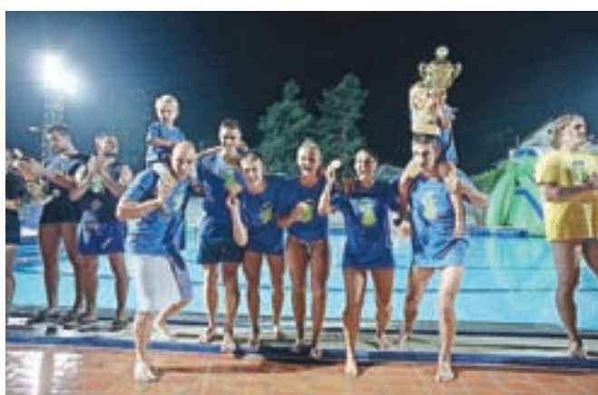
Zmagovalna ekipa iz Velenja z zasluženimi medaljami ter pokalom