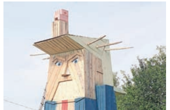
Selski Kip svobode močno spominja na ameriškega predsednika, ki z visoko dvignjeno pestjo gleda v smeri proti Sevnici.