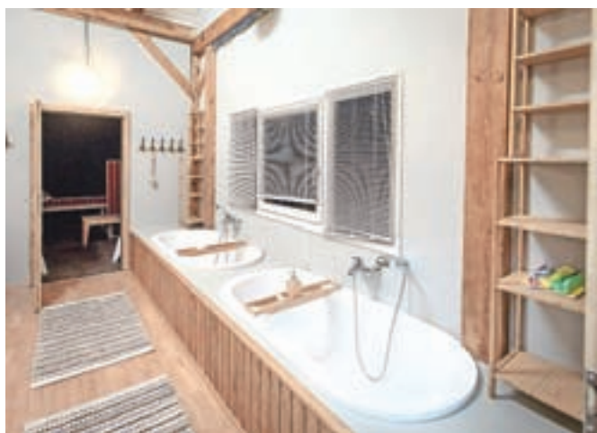
Nihče se v lastnem domu ne bi branil takšnih kopalnih kadi.

opremljena s kar dvema kadema in stilsko dovršenima tušema. Na posestvu je tudi že do zdaj obstoječe poslopje, ki bo namenjeno gostom. Pa še kaj se bo našlo, a vsega, pravijo na POP TV, ne morejo razkriti. Kakšno presenečenje mora ostati za čas po 16. septembru.