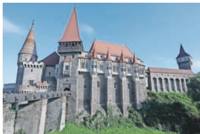
Anatomija mitologije v Korvinovem gradu v Hunedoari