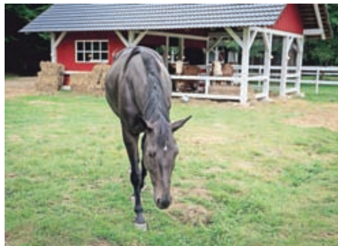
Na kmetiji so letos tudi konji, srnjad, divje svinje, krave in pavi.