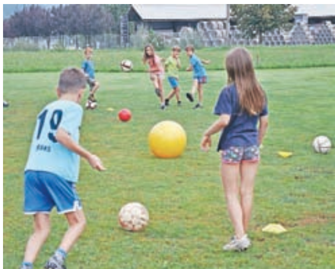
Otroci so med drugim spoznavali osnovne nogometne veščine.