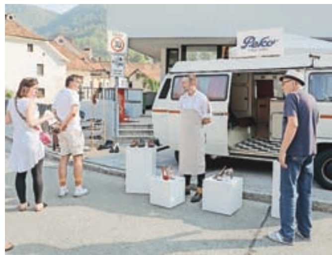
Peko se je vrnil domov.

»Se gremo igrat stare igre, narejene iz lesa?« so prijazno povabili iz tržiške rokodelske delavnice Kosmač. Usnjeni izdelki, čebelji pridelki, ročne pletenine, spletene tudi nekje na Štajerskem, pa grenadirmarš in tržiške flike iz krušne peči za prazne želodčke, za domov pa domače bučno olje, lahko z dodatkom čilija in seveda čevlji iz tržiških delavnic ... »Prva septembrska nedelja, angelska nedelja, je in bo ostala naš praznik, kajti tržiška 'šušarija' živi in dela naprej,« je sklenil župan Sajovic.