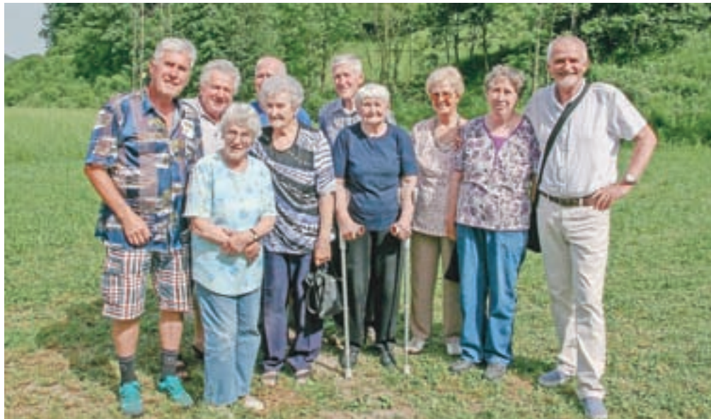
Skromen del od vseh 51 bratrancev in sestričen Šoštar - Nastranovega rodu

Sorodnike je za točilnim pultom najprej čakala pijača dobrodošlice. Nato smo jih spodbudili, da so na velikem panoju, na katerem je bil izobešen rodovnik, poiskali svoje korenine in dopolnili podatke, ki so bili tam zapisani.