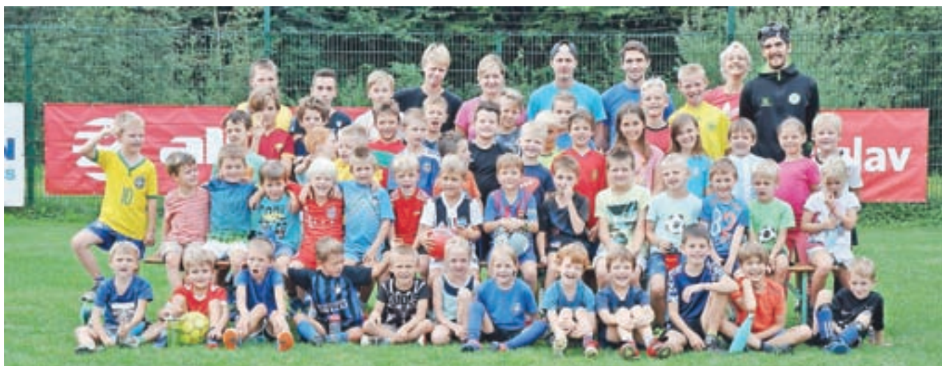
Udeleženci letošnje poletne nogometne šole v Žireh

POTOVANJA • VINO • HRANA • DOGODIVŠČINE • MOŠKI • ŽENSKÉ • POTOVANJA • VINO • HRANA • ŽENSKÉ