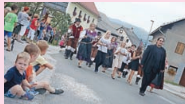
Na slavnostni povorki skozi Žiri je zaigrala tudi domača Pihalna godba.

Žiri – Letošnji Žirifest tudi tokrat ni razočaral. Prvi večer so koncerti skupin Big Foot Mama, Zabljena generacija in Joker privabili množico obiskovalcev, sobota pa je bila v znamenju koncerta priljubljenih Modrijanov ter veličastne povorke članic in članov Prostovoljnega gasilskega društva Žiri, ki praznujejo 130-letnico zelo uspešnega delovanja.