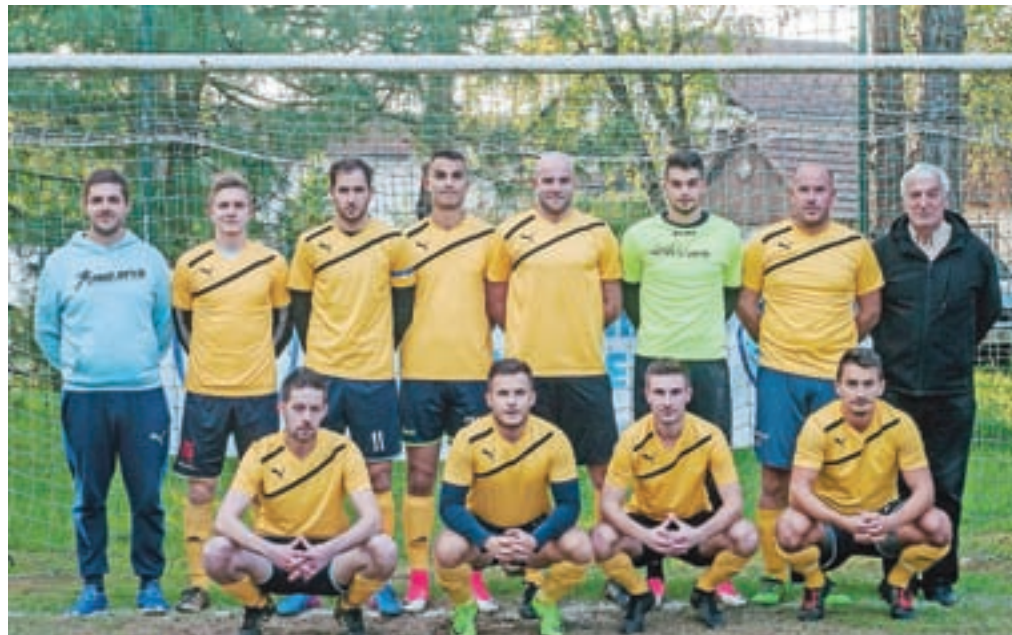
Za naslov državnega prvaka se bo potegovala tudi ekipa NK Begne, ki je lani izpadla v polfinalu proti ŠD Ribno, ki jih letos ni v konkurenci.

»V skupinskem delu se bo igralo po dvokrožnem sistemu, vsaka ekipa bo odigrala štiri tekme. Iz vsake skupine se v izločilne boje uvrstita dve najboljši. Ekipa lahko izbirajo med tremi sistemi igranja (ligaški, domačina, mini turnir) in enega izberejo po medsebojnem dogovoru znotraj posamezne skupine.« je pojasnil vodja Lige ENA Simon Detelbach.