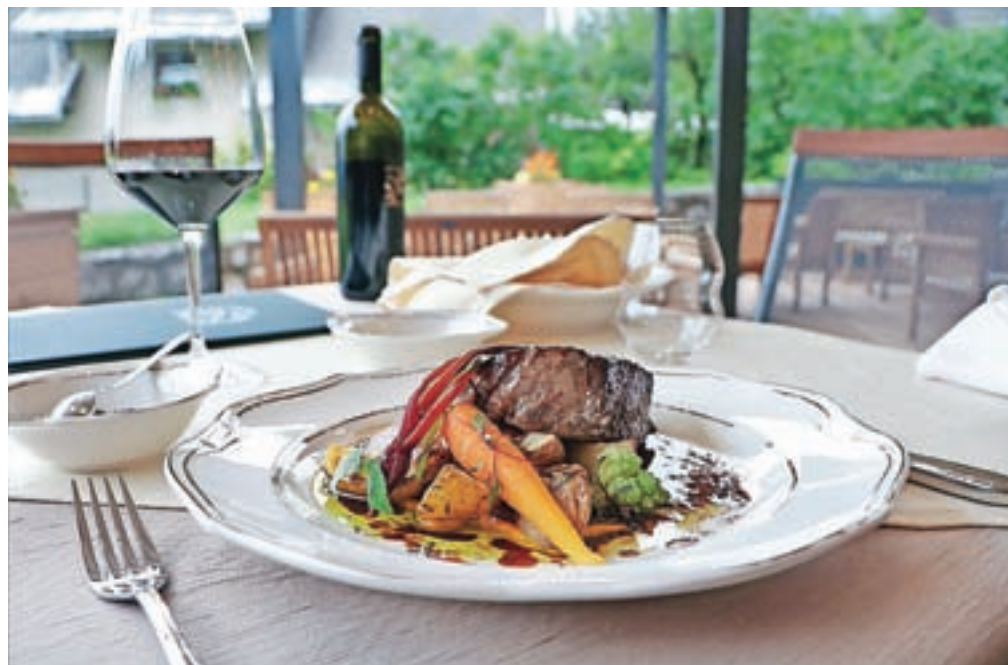
Hrbet bohinjskega goveda, pečen krompirček, zelenjava, čebulna marmelada, omaka

Bil je čas kosila. Pri sosednji mizi so imeli s seboj najstnika, ki je najprej tris postrvi na krožniku pred seboj