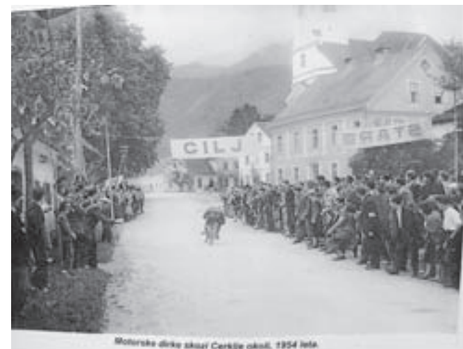
Dirke motoristov skozi Cerklje leta 1954

je fotografija zaloške cerkve iz leta 1902. Na šestih izbranih fotografijah je na ogled odkritje spomenika Davorinu Jenku 17. oktobra 1954. leta v središču Cerklj ter gradnja nadstreška pri glavnem vhodu v župnijsko cerkev iz leta 1952.