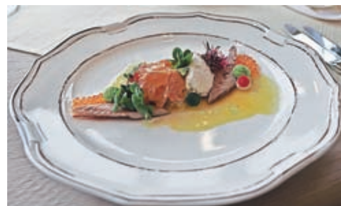
Postrv, pripravljena na različne načine, je lahko predjed ali pa kar glavna jed.

začudeno gledal, potem pa jed po prigovarjanju staršev pokusil in se odločil, da jo bo označil za dobro. Kot predjed sem si ga sicer privoščila sama, a bi bil lahko popolnoma samostojna jed. V trisu je glavni kuhar kombiniral postrvi bakalar, ikre, postrvi karpačo in dimjeno postrv. Strinjala sem se z najstnikom, a osebno me je bolj navdušil kos srednje pečene, dobro uležane bohinjske govedine z domačo čebulno marmelado, krompirčkom, korenčkovo kremo z bučkami, zelenjavo in omako. Prav omaka pa je bila verjetno ena