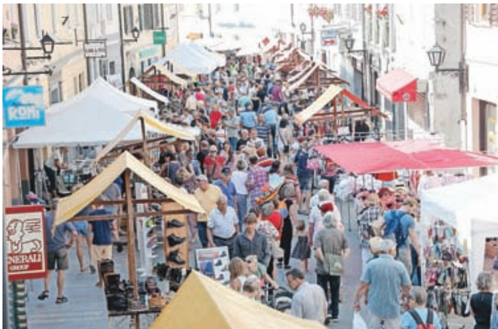
»Šušarski« praznik na prvo septembrsko nedeljo