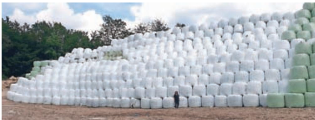
Vsa lahka frakcija na Mali Mežakli je zbalirana.

poročilo o koncesijskem razmerju med občino in koncesionarjem. Revizijo so opravili v podjetju BM Veritas revizija, na naslednji seji pa jo bo obravnaval občinski svet.