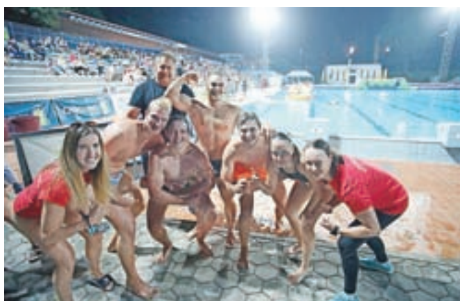
Kranjski orli z borbenimi nastopi tudi letos niso razočarali domačih navijačev.

Pohvaliti je potrebno tudi Kranjske orle, ki so v skleni igri veslo osvojili 12 od možnih 15 točk, ob koncu pa osvojili peto mesto. Bronaste medalje so si nadedli Mariborčani, letošnji zlati šampioni iz Velenja pa bodo predstavljali svoje mesto na mednarodnem finalu naslednje leto.