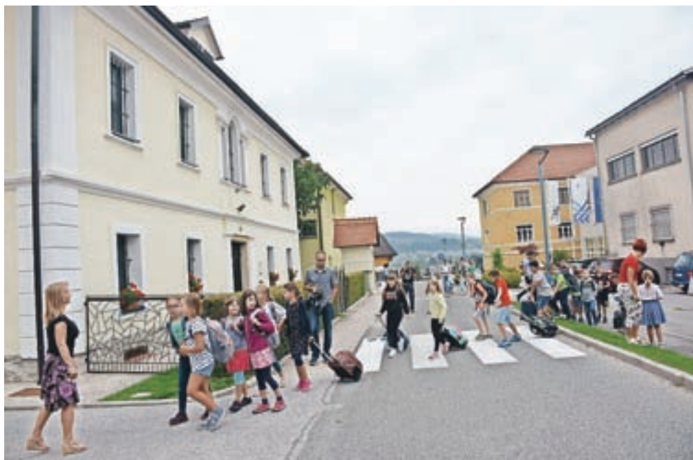
Četrtošolci OŠ Preska včeraj niso sedli v klopi v stavbi matične šole (desno), temveč so se odpravili čez cesto v učilnici v sosednjem Pastoralnem domu.

Več o reševanju problematike je povedal Nejc Smole, župan Občine Medvode: »V preteklih dveh letih smo v Občinskem prostorskem načrtu Občine Medvode zagotovili lokacijo za novo šolo, zemljišča,