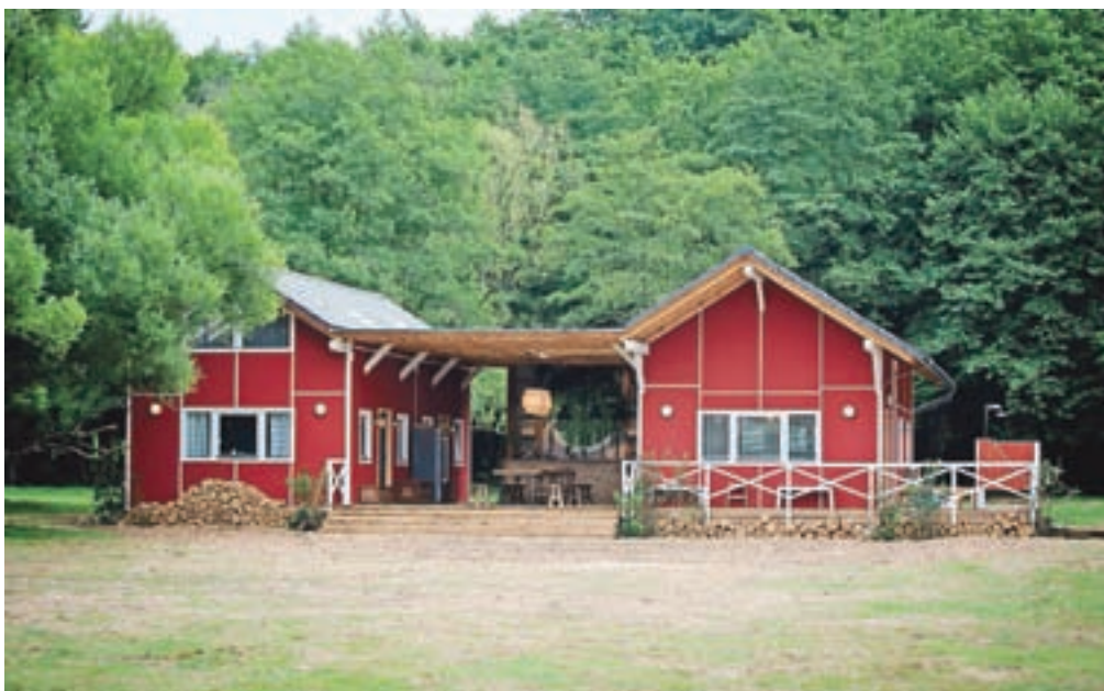
Bodo letošnji kmetje domovali v skandinavski pravljici?

N ova Kmetija se razprostira na kar trideset hektarjev površine, od česar so trije hektarji zgrajeni in se na njih snema nov šov, ki ga boste lahko jeseni gledali na POP TV. Gre za največjo televizijsko Kmetijo do sedaj, saj je na posestvu kar sedem poslopij, od katerih jih je bilo šest zgrajenih na novo. Produkcjska ekipa je podoba kmetije gradila samo dobre tri tedne in ustvarila pravo skandinavsko pravljico. In kaj je bil največji izziv med samo gradnjo? »Telefonski signal,« razloži vodja gradnje. »Na posestvu ni signala in včasih sem si spisal več listov zapisov, se usedel v avto, odpeljal trideset minut stran, da sem imel signal, se o vsem dogovoril in vrnil na gradnjo. To je bil velik manko in je delo zelo upočasnjevalo.«