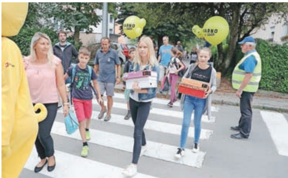
Rumeni baloni opozarjajo na prisotnost šolarjev na cesti.

Kranj – Osrednji simbol akcije Varno v šolo so rumeni biorazgradljivi baloni, ki so jih prejeli vsi prvošolci v Sloveniji – letos jih je prag šole prvič prestopilo 20.840, od tega 642 v Mestni občini Kranj – in voznike opozarjajo na njihovo prisotnost na cesti. Pripravili so tudi novo preventivno gradivo s petimi koraki za večjo varnost udeležencev v prometu, ki je namenjena tako otrokom kot odraslim in se preko Policijske, občinskih svetov za preventivo in vzgojo v cestnem prometu, nevladnih organizacij s področja prometne