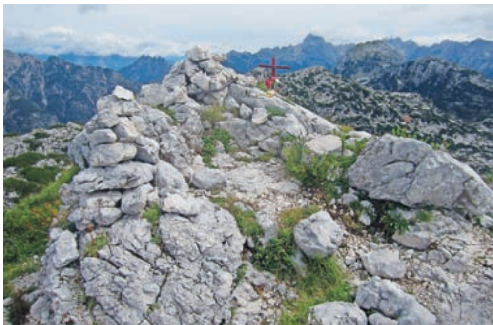
Vrh Velike Bavhe, v ozadju Rabeljske špice in Mangart

Z vrha se odpre lep pogled na Kaninsko pogorje, na osrčje Zahodnih Julijcev, ko pogledamo proti Sloveniji, pa se pogled ustavi na Mangartu, Jalovcu in mogočni Loški steni.