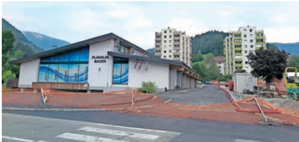
Gradnja nove povezovalne ceste mimo plavalnega bazena je tik pred koncem.

V Železnikih nameravajo v kratkem predati v uporabo novo povezovalno cesto mimo plavalnega bazena do območja Na Kresu.