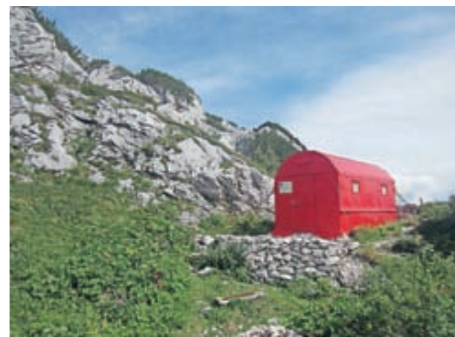
Speleološki bivak Modonutti – Savoii. Od tukaj naprej je pot zahtevna.