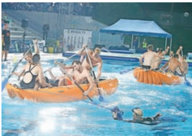
Zabavni spektakel v vodi: obiskovalci so napolnili tribune letnega bazena in uživali v igrah.

Še vedno priljubljene igre so zabavno-športnega značaja, prirejene po vzoru nekdanjih Iger brez meja, v katerih so uživale vse generacije. Tudi letos so obiskovalci, ki so napolnili tribune letnega bazena, spodbujali vse ekipe v tradicionalnih igrah, preoblečenih v moderno različico. Dramatični zaključek desete sezone popularnih iger je potekal v organizaciji Zavoda za šport Kranj in agencije Adria Events. Šest ekip, pet iz slovenskih krajev (Maribor, Koper, Velenje, Ajdovščina in Kranj) ter ekipa iz Skopja, se je pomerilo v različnih zabavnih spretnostnih nalogah v vodi