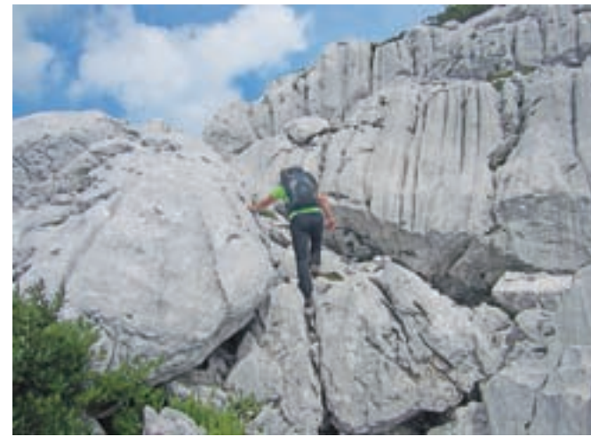
Zahteven vzpon po izrazitem kraškem svetu, polnem globokih brezen

visokogorska krnica. Skozi krnico se sprehodimo malce bolj v desno, kjer se priključimo poti št. 636, po kateri bomo nato sestopili. Sledimo poti, ki se v okljukih vije čez strmino pred nami in nas pripelje na sedlo Vrh Laških brežičev / Sella Robon, kjer je informativna tabla z mizo in dvema stoloma. S sedla nadaljujemo levo po lepo sledljivi, a nemarkirani poti, ki se prečno vzpne čez strmo pobočje, nato pa se položi. Gremo mimo vojaških ostalin po široki umetni polici, nato pa sledi le še kratek vzpon in že smo pri speleološkem bivaku Modonutti – Savoii. Od bivaka nadaljujemo levo, pot je lahko sledljiva. Prečno se povzpemo po izpostavljeni polici, kjer zavijemo desno v škrbino, skozi katero nas vodijo kamnite stopnice. Joj, če bi te skale znale govoriti, kakšno grozo vojnih dni bi lahko povedale! Višje se pot položi, a orientacijsko postane težja, saj je pred nami kraški svet – svet številnih brezen in škrapelj. K sreči nam pomagajo številni možici. Pot se obrača bolj v desno, gre mimo manjših brezen. Tik pod vrhom je veliko brezno, mimo katerega gremo čez ogromno skalo, ki jo je treba preplezati ali obhoditi. Ko smo na drugi strani, nas do vrha loči le še nekaj minut lahkotne hoje.