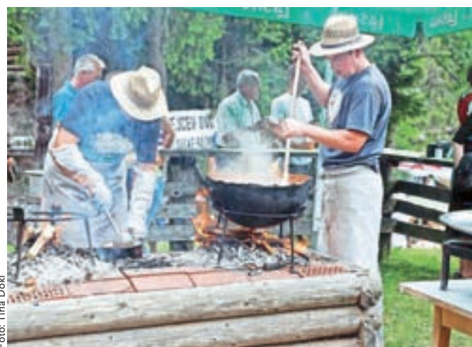
Obiskovalci so lahko okušali planšarske jedi: masovnek, ajdove žgance, kisl mleko, klobaso s kislim zeljem ...

domačine. Imamo srečo, da so ovce v naših koncih še vedno varne in imamo mir pred volkovi, ki trenutno predstavljajo velik družbeni problem in se bomo morali v prihodnosti naučiti sobivati z njimi,« je dejal Smrtnik. Zabavni program 61. Ovčarskega bala, ki ga tradicionalno pripravi Gostišče ob Planšarskem jezeru v sodelovanju z lokalnimi društvi, so letos oblikovali ansambel Veseli svatje, folkloristi z Bleda in ansambel Jutro.