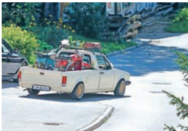
... je bil »arhivski primerek« resnično presenečenje za mlado damo, ki je v soboto dahnila usodni da.