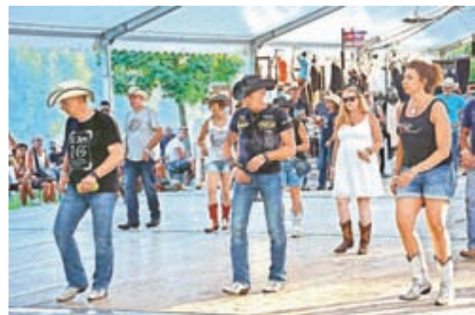
V Zbiljah se je plesalo po ameriških taktih.

Če je na eni strani dišalo iz smokerjev, se je na drugi plesalo. Kantri plesi so zanimivi. David Prestor, plesni uč-