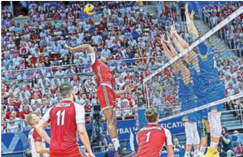
Ob podpori domačih navijačev so na nedeljski tekmi slavili svetovni prvaki Poljaki, ki pa so se jim naši dobro upirali.

»Igrali smo na precej visoki ravni. Rezultat sicer ni najboljši, a vemo, da je bil na drugi strani mreže izjemen tekmelec in da je težko zmagati. Še posebej v prvem nizu smo igrali dobro na servisu, v bloku in obrambi in tudi v protinapadih in to mora biti naš cilj za prihodnje, ohraniti