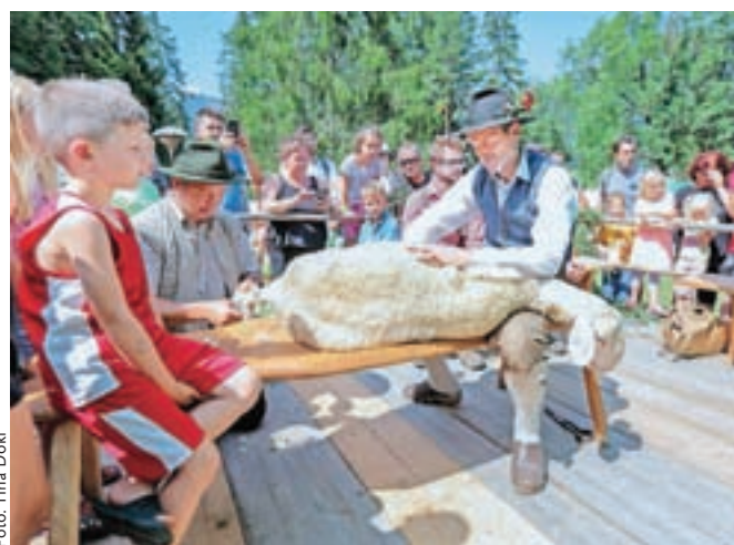
Še vedno največ zanimanja pritegne prikaz predelave ovčje volne, od striženja, predenja, cvirnanja do pletenja nogavic.