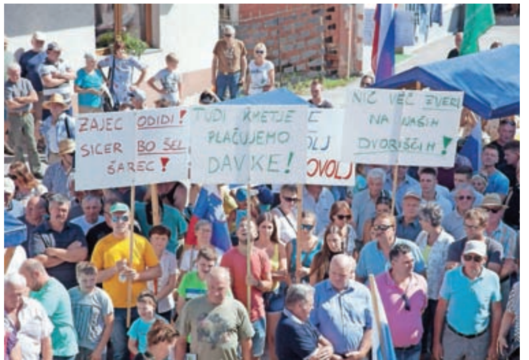
Da je kmetom dovolj, so jasno izrazili tudi s transparenti.