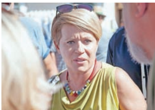
Shoda se je udeležila tudi ministrca Aleksandra Pivec.