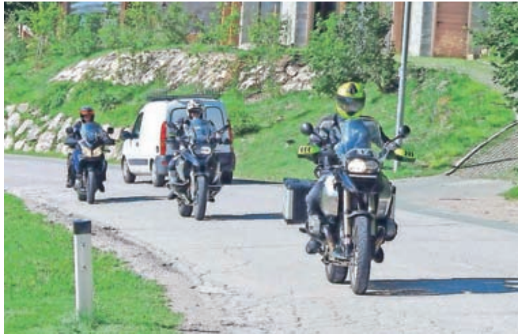
Motoristi naj imajo vedno prižgane luči, uporabljajo naj svetla in odsevna oblačila ter primerno zaščitno obleko in čelado.

Ker je trenutno vrhunec poletne sezone in je na cestah tudi veliko motoristov, na Javni agenciji Republike Slovenije za varnost prometa (AVP) znova opozarja na previdnost tako motoriste kot druge udeležence v prometu. Motoristi so namreč na cesti slabše vidni in pogosto vozijo prehitro, zato jih drugi vozniki hitreje spregledajo ali jim odvzamejo prednost. Na AVP znova opozarjajo, naj se motoristi in drugi udeleženci še zlasti v poletni vročini, ki vpliva na zbranost ter lahko upočasnijo naše reakcije in