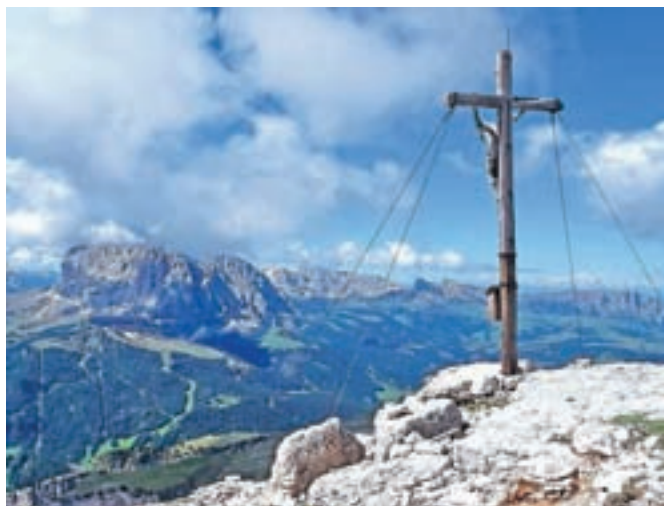
Vrh s križem in razgledom na Sasslong

Nadmorska višina: 2747 m Višinska razlika: 640 m ali 1262 m Trajanje: 6 ur Zahtevnost: ★★★★★