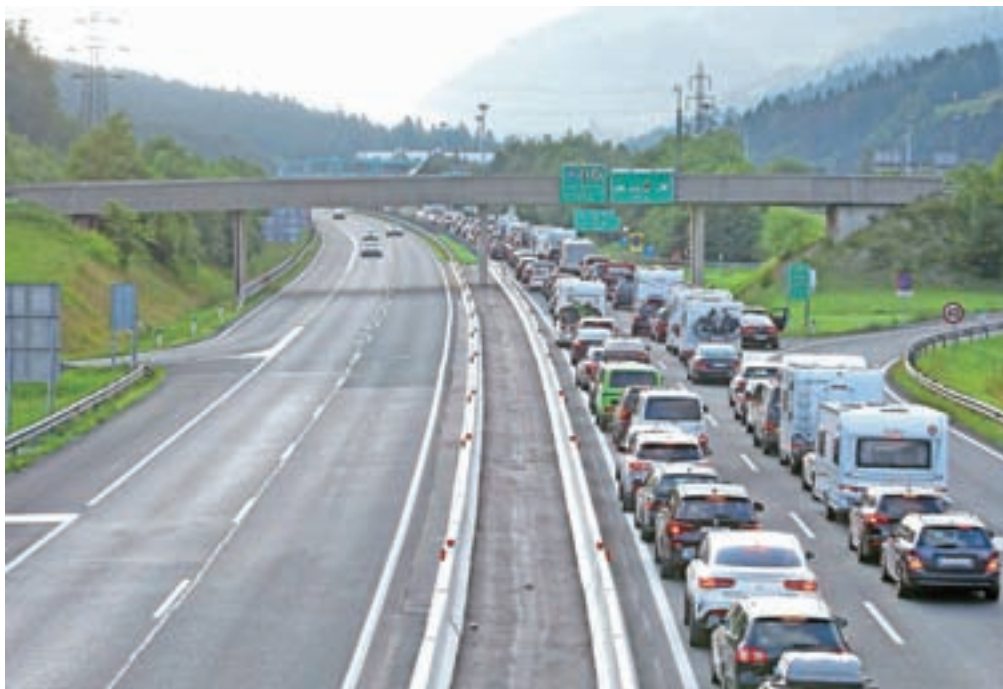
Podoba gorenjske avtoceste pred predorom Karavanke minuli konec tedna

Ob tem je na delu magistralske ceste R2 skozi mesto še vedno gradbišče, saj jo obnavljajo, ta čas potekajo dela na mostu čez reko Jesenica na Plavžu. Na Občini Jesenice so zato pristojne službe v državi pred dnevi ponovno zaprosili, naj prometne informacije voznikom ustrezno prilagodijo in naj voznikov ne pozivajo k obvozu