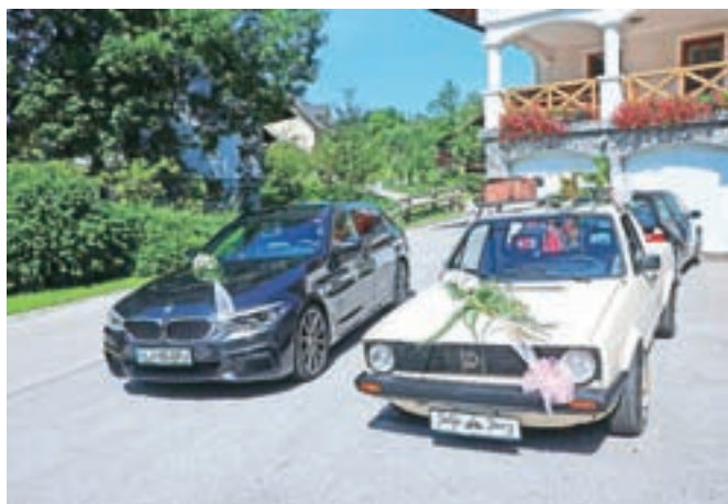
Ko se je ženin odpravil po nevesto s kar dvema avtomobiloma in ...