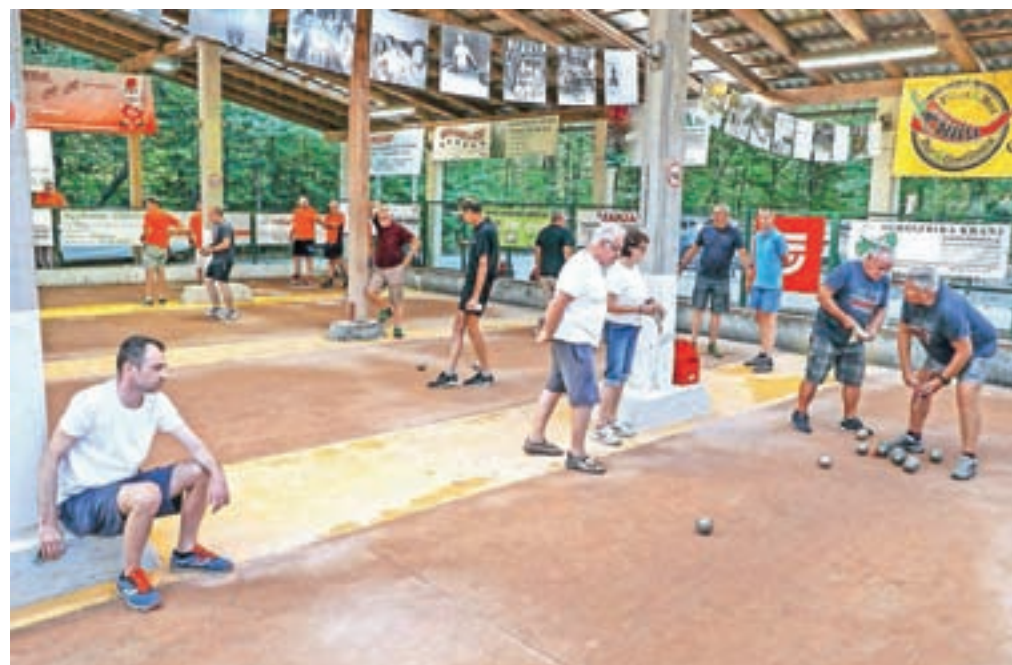
Ob štiridesetletnici delovanja je v Čirčah potekal balinarski turnir.

V Čirčah je bil v soboto pravi balinarski in tudi siceršnji praznik.