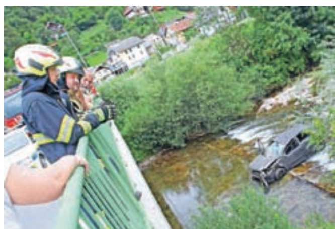
Nedeljska voznja se je končala v Poljanski Sori pod mostom.

Bohinjska Bistrica – V soboto popoldne sta v Bohinjski Bistrici trčila osebno vozilo in motorno kolo. Gasilci Prosto-voljnega gasilskega društva Bled in Bohinjska Bistrica so zavarovali kraj nesreče, odklopili akumulatorja in delavcem avtovleke nudili pomoč pri nalaganju vozila. Prav tako so poskrbeli za pomoč v nesreči poškodovane osebe reševalcem Nujne medicinske pomoči Bohinj in Bled.