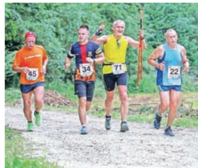
Taležlauf je potekal v osmi izvedbi.

Organizatorji so bili z udeležbo tako na teku kot na pohodu zadovoljni. Prišlo je tudi veliko mladih tekačev, najstarejši pa je bil Franc Hribernik (letnik 1941).