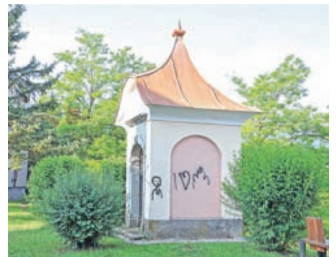
Kapelico so neznanci porisali z razpršilom, občina pa bo poskrbela, da bodo posledice vandalizma odstranili in kapelico prepleskali.

Radovljica – V začetku poletja so neznanci s sprejem porisali kapelico pri sv. Ani na robu Cankarjeve ulice v Radovljici. Gre za spomeniško zaščiten objekt v lasti Občine Radovljica. Kot so pojasnili na radovljiški občinski upravi, bodo objekt prepleskali takoj, ko za poseg pridobijo potrebne kulturno-varstvene pogoje.