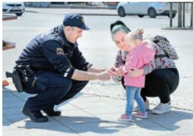
Otrok naj ima pri sebi na primer listek s telefonsko številko enega od staršev in podatki o bivališču. Fotografija je simbolična.