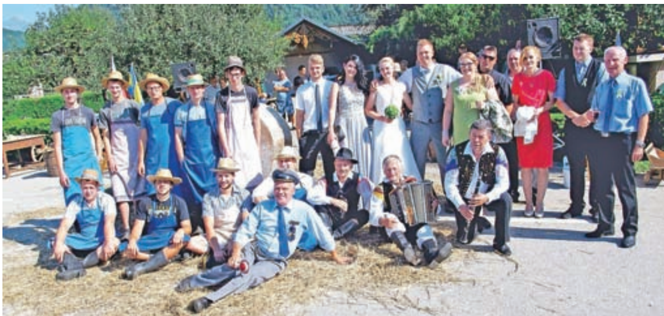
Mladoporočnica z vaščani Poženika, ki so pripravili šrango po starih običajih