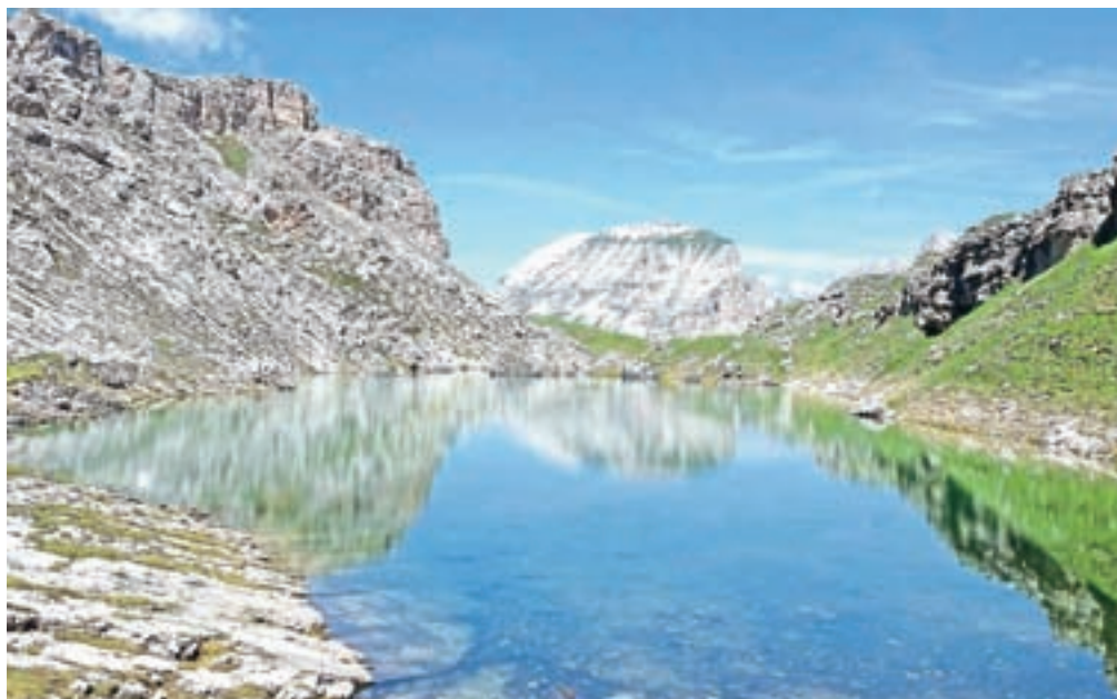
Pogled na Col Dala Pieres izpred jezera Crespeina

Z zgornje postaje kabinске gondole se usmerimo na pot št. 4, ki bo izgubljala višino in nas pripeljala do kočice Regensburger/Firenze, 2037 m n. m. Pri koči zavijemo na pot 2-3. Malce izgubimo višine, nato pa se strmo povzpne do travnate krnice, kjer zavijemo desno in se začnemo vzpenjati proti sedlu, ki ga vidimo nad seboj. Kmalu dosežemo razpetje: leva pot št. 3 gre na škrbino Roa, mi pa zavije desno po poti št. 2 in se povzpne na škrbino Forces de Siëles. Tik pod vrhom je vzpon po zagrščeni, a dobro utrjeni poti, precej strm. Na škrbini se nam odpre pogled na drugo stran proti Piz Puez, Sas Ciampac in Sassongher. Na škrbini zavijemo desno, na pot št. 17, proti koči Stevia.