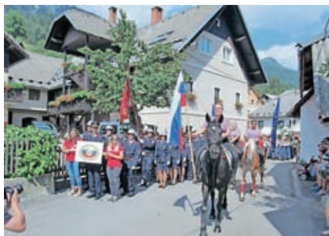
Slavlje ob visokem jubileju dovških gasilcev je trajalo ves konec tedna.