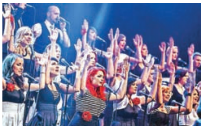
Vokalna ekstaza: Perpetuum Jazzile

Minuli teden je na Gorenjskem na svet prišlo 56 novih prebivalcev. V Kranju se je rodilo 25 dečkov in 11 deklic. Najtežji in najlažji sta bila dečka. Najtežjemu je tehtnica pokazala 4260, najlažjemu pa 2620 gramov. Na Jesenicah se je rodilo po 10 dečkov in deklic. Tudi tu sta mejni teži pripadli dečkoma – najtežji je tehtal 3940, najlažji pa 2370 gramov.