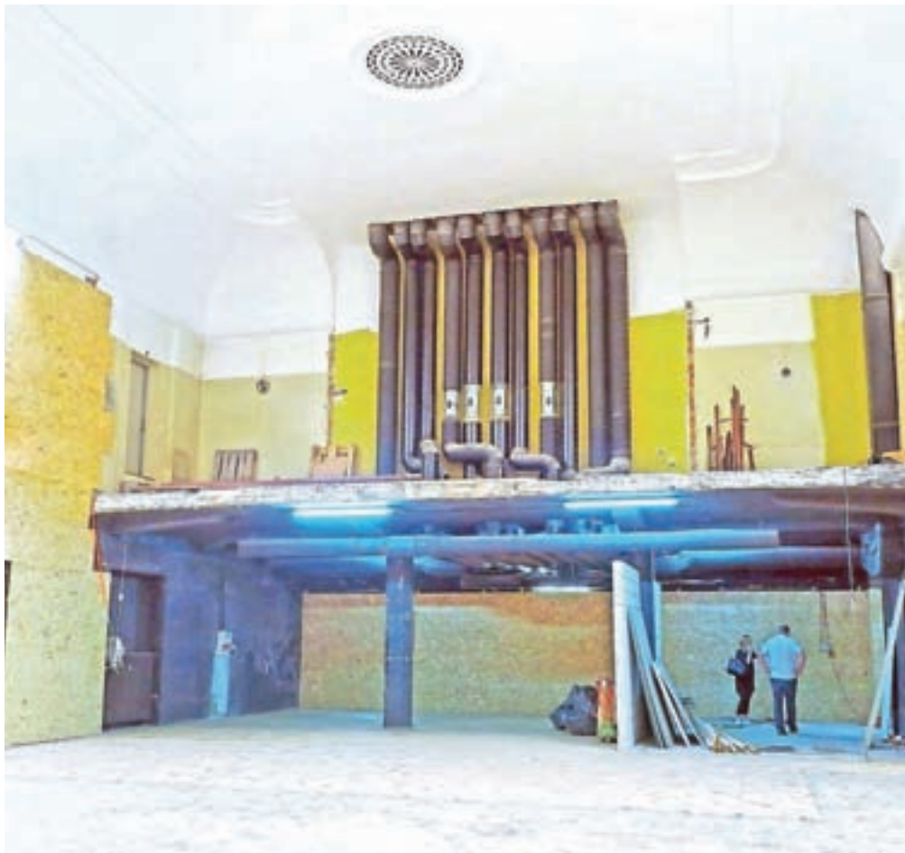
Dvorana nekdanjega kina Storžič že dobiva podobo športnega centra.

Tako so nekdanji prostori kina Storžič ostali prazni. Da ne bodo še naprej propadali, pa so sklenili mladi iz Športnega kluba Dr. Lovka – ter konec letošnjega maja lastnoročno začeli obnovo. »Tukajšnji prostori so bili skoraj 15 let zaprti oziroma se v njih ni nič dogajalo, člani Športnega društva Dr. Lovka iz Drulovke pa smo sklenili, da jih vzamemo v najem in v njih poskrbimo za nove športne programe. Odločili smo se, da