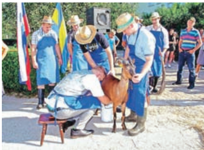
Ženin je hitro pomolzel kozo.