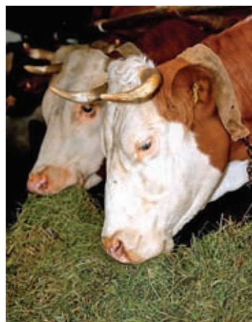
Ekološka kmetija Pr' Demšari

Pripravila: mag. Jerneja Klemenčič Lotrič, Razvojni agencija Sora