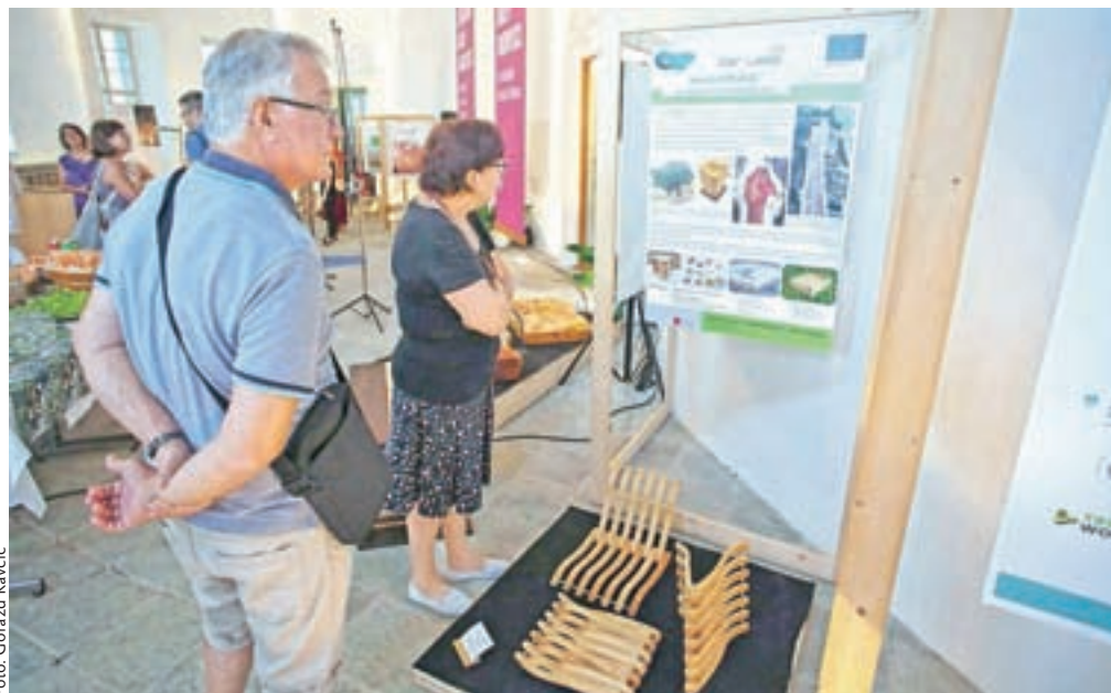
Razstava Čar lesa je v Radovljiški graščini na ogled še do 15. avgusta, vstop je brezplačen.