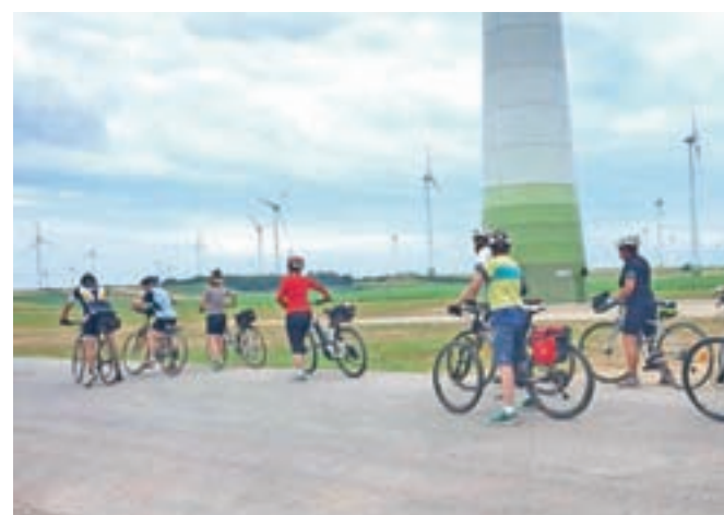
Ob vetrnih elektrarnah

kraju pomagal veliko beguncem, ki so pribežali iz Slovaške v Avstrijo. Naselje je imelo takrat osemsto prebivalcev in šeststo beguncev. Mož je tudi ustanovitelj fundacije Rádda barnen, ki je po drugi svetovni vojni pomagala okrog šestdeset tisoč sirotam, starim od tri do šest let. Žal