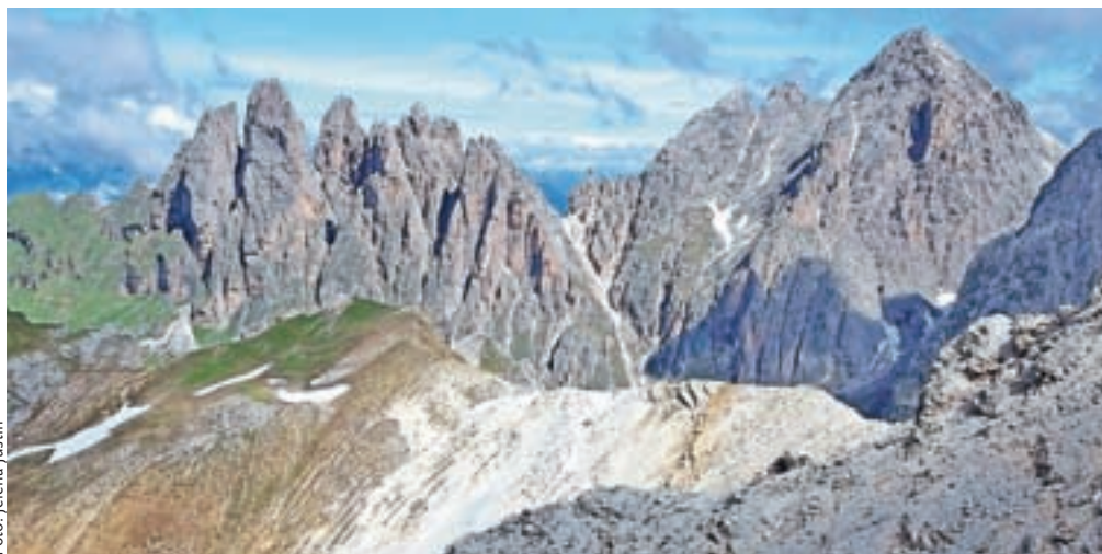
Z vrha se odpre pogled na špice Odle, katerih del je tudi Sas Rigais na desni strani.