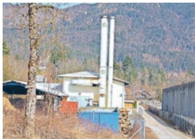
Pred prodajo podjetja Energetika Preddvor so spremenili odlok o gospodarski javni službi upravljanja in vzdrževanja toplovodnega omrežja in oskrbe s toplo vodo.

Na seji občinskega sveta so združili obe fazi sprejemanja sprememb tega dokumenta. Največ razprave je bilo o dveh ključnih spremembah, in sicer glede obveznega priključevanja prebivalcev na toplovodno omrežje in glede zagotavljanja drugega vira ogrevanja v poletnih mesecih, če takrat Energetika ne zagotavlja ogrevanja. Zasebni partnerji bi si želeli, da bi bil priključek na sistem obvezen za vse prebivalce, v spremenjenem odloku bi bil obvezen za novogradnje na območju, kjer toplovodni omrežje, ki energijo zagotavljajo iz drugih virov. Ob tem se je pojavil pomislek, kolikšna je