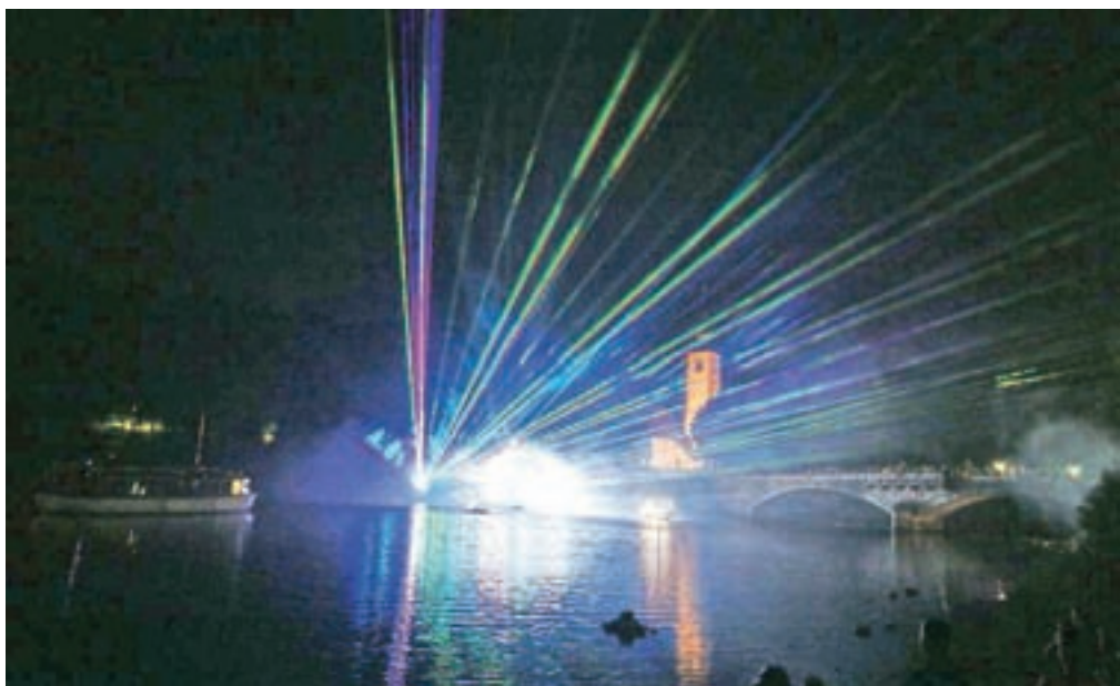
Laserska predstava na vodni zavesi pred mostom pri cerkvi sv. Janeza je dostojno nadomestila okolju neprijazni ognjemet.