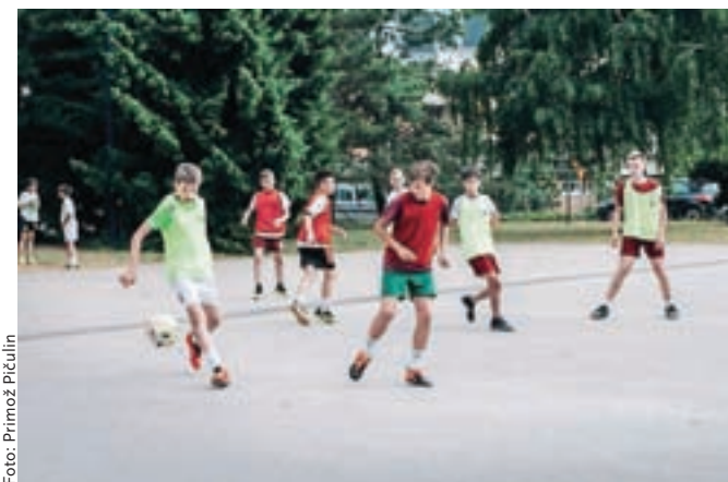
Pripravili so tudi turnirja v nogometu in košarki.