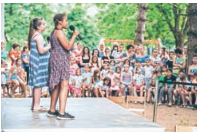
Na odru so učenci predstavili svoje talente.

proti zasvojenosti, s katerim spodbujajo vključevanja otrok in mladostnikov v raznovrstne športne programe, namenjene druženi, spoznavanju in aktivnemu preživljanju prostega časa s športom in ob športu, je razložil Povšin. V okviru projekta, ki ga sofinancirajo ministrstvo za zdravje, Fundacija za šport in Športna unija Slovenije, so pridobili tudi sredstva za nove mreže za gole in koše, s pomočjo sredstev KS Huje pa so pokrpal asfaltne površine zunanjih igrišč, je zadovoljen Povšin.