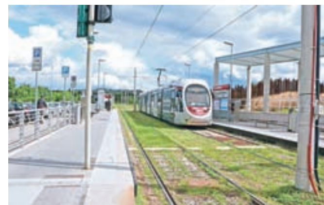
Do središča mesta smo se odpeljali z modernim tramvajem.