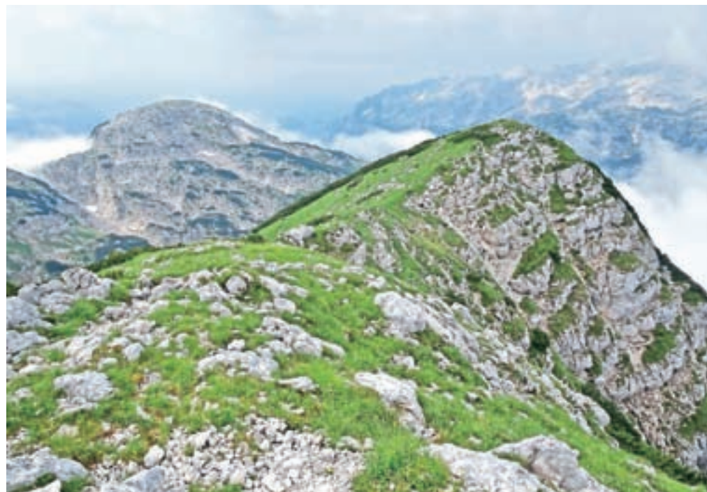
Pogled proti Veliki Monturi z vrha Velike Babe

in pridemo do sedla, kamor bi nas pripeljala tudi mulatjera, ki je predhodno zavijala na Veliko Monturo. Sledimo skromni stezici, ki jo označujejo možici. Pravzaprav hodimo po nekakšni travnati grapi, ki se na svojem izteku priključi markirani poti, ki pelje na Bogatinska vratca. Ko dosežemo markirano pot, zavijemo desno in se začnemo spuščati proti Domu pri Krnskih jezerih. Gremo mimo ogromnih propadajočih poslopj obmejne straže v dolini Za Lepočami, kjer so