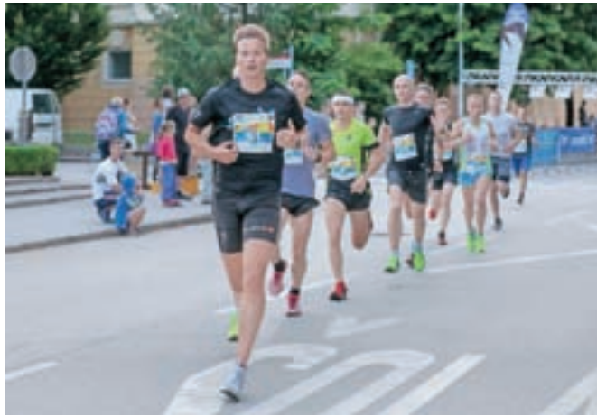
Ola Vigen Hattestad (v ospredju) na poti do svoje prve zmage na teku v Radovljici