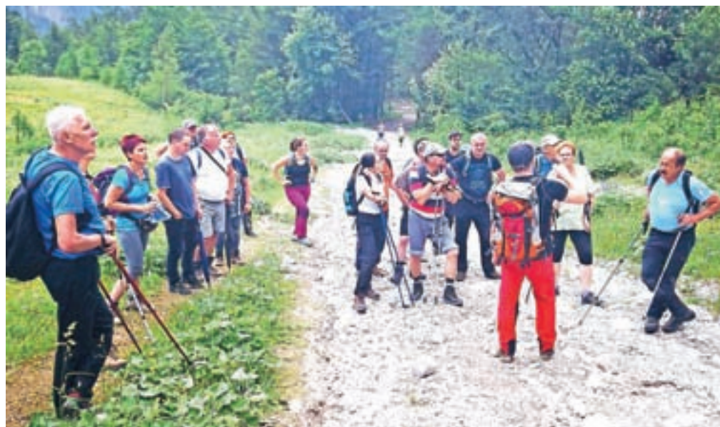
Vreme je med pohodom na Zelenico »zdržalo«.

Podlujbelj – Vseslovenska planinska akcija Gluih strežejo v planinskih kočah, ki jo organizirata odbor Planinstvo za invalide/osebe s posebnimi potrebami pri Planinski zvezi Slovenije (PZS) in Mladinsko društvo za osebe z okvaro sluha je lani v svoji prvi izvedbi doživela odličan odziv, tako med gluhimi in naglušnimi kot med slišječimi. Akcijo so letos ponovili, na Gorenjskem so v soboto in nedeljo gluih in naglušni stregli v planinskem domu na Zelenici. V soboto jo je spremljal poseben dogodek Stopiva skupaj, osvojimo vrh, ko so slepe in slabovidne postregli gluih in naglušni. Akcija Stopiva skupaj, osvojimo vrh je potekala pod okriljem Odbora Planinstvo za invalide/OPP Planinske zveze Slovenije, Zveze društev slepih in slabovidnih Slovenije in Zveze Lions klubov Slovenije. Z združenimi močmi so želeli organizatorji spodbuditi čim več slepih, slabovidnih in oseb z okvaro vida, da se pridružijo akciji, predstaviti planinstvo kot možnost aktivnega preživljanja prostega časa, približati slepoto drugim in družbi z jedilniki