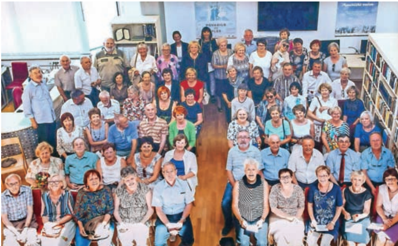
Generacija nekdanjih kranjskih gimnazijcev, ki so maturirali pred petdesetimi leti, se je tokrat srečala prvič.

Pred Gimnazijo Kranj se je prvič zbrala cela generacija dijakov, ki so maturirali pred petdesetimi leti.