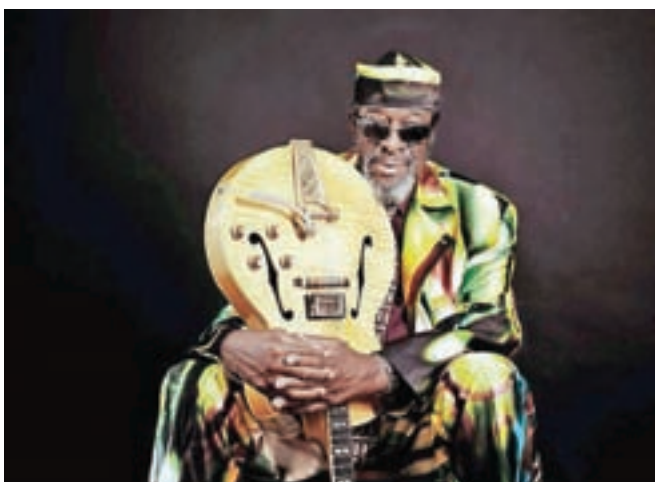
Sreda, 3. julija, bo na festivalu rezervirana za legendarnega Jamesa Blooda Ulmerja.

Train pa ostaja aktiven tudi v organizacijskem smislu – v petek, 28. junija, se bo namreč začel že enajsti SubArt festival, ob pripravi katerega je ekipa Traina moči združila z Mestno občino Kranj, Layerjevo hišo, Zavodom Carnica, KRDM ter B&B. Obeta se pester glasbeni program, vse od otvoritvenega techno partyja pa do sklepne koncerta zasedb Siberian Meat Grinder in Total Chaos, ki bosta oder okupirali 8. julija. SubArt bo znova povezal aktivna kulturna prizorišča Kranja v celoto, v vedno prepoznavnejši mestni festival, ki že nekaj let presega