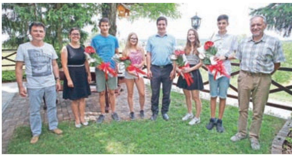
Najboljši v devetih letih šolanja v predvorskoli z razrednikoma, ravnateljem in županom