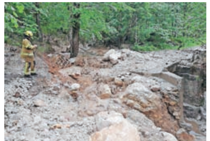
Naplavine v vasi Kokra