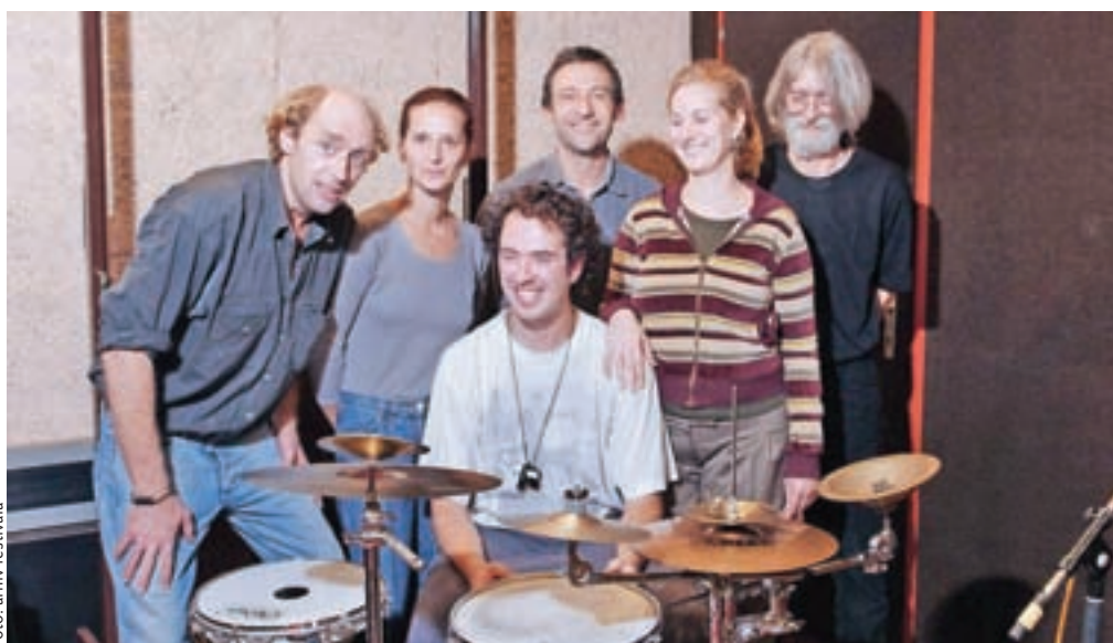
Zasedba Čompe je na sceni že četrto stoletje. V Layerjevi hiši bodo nastopili v torek, 2. julija.

Letošnji festival ponuja novost, in sicer odprto koncertno prizorišče na parkirišču pred Trainom, ki bo prvič zaživelo v četrtek, 4. julija, s svetovno znanimi dobitniki nagrade grammy, puščavskimi blues rokerji Tinariwen, ki bodo kitarsko poezijo z afriškimi transcendentnimi ritmi prinesli kranjski publiki. Festival SubArt res ne bo skoparil niti s svetovnimi glasbenimi legendami niti z domačimi glasbenimi unikati: na festivalu bodo med drugimi nastopili James Blood Ulmer, Čompe, Paraf, Brkovi, Raggalution ... Celoten spored festivala ter vstopnice za posamezne dogodke so na voljo na internetni strani https://subart.si .