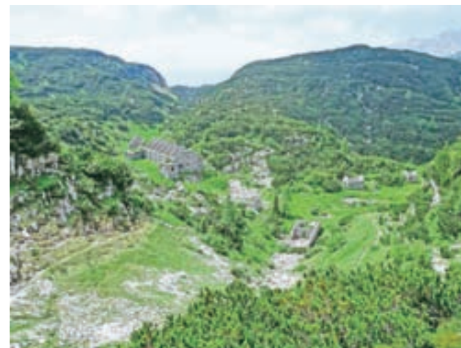
Poslopja nekdanje obmejne straže v dolini Za Lepočami

Kam in kako bi sestopili? Predlagam, da sledimo grebenski poti, ki poteka proti Lanževici, nasproti Velike Monture pa se usmeri na krajši greben, ki nas pripelje pod predvrh Velike Monture. Z rušjem porasli predvrh obidemo po desni strani