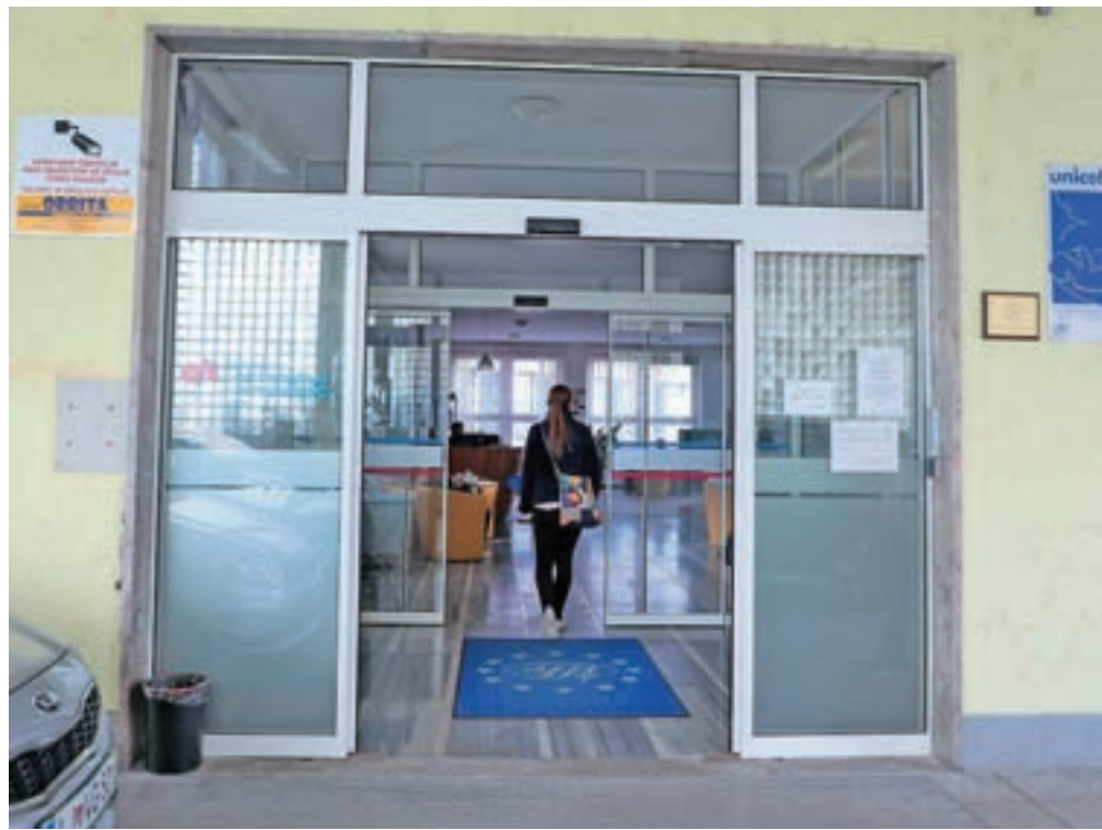
Ministrstvu za zdravje je vlada tudi naročila, naj do konca leta pripravi predlog trajnejše rešitve za zagotovitev vzdržnega poslovanja BGP Kranj.

V BGP Kranj že več let opozarjajo ministrstvo in ZZZS, da je celotno področje