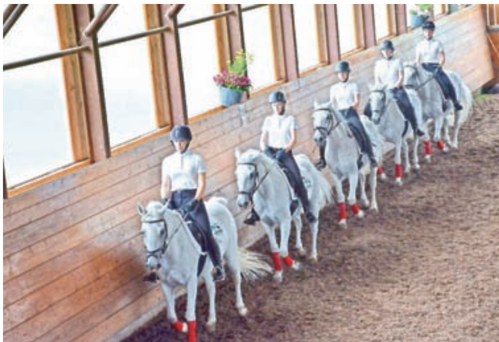
Predstavili so se lipicanci s Kmetije Janhar.