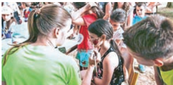
Za poslikavo obraza so bili otroci pripravljani čakati v dolgi vrsti.