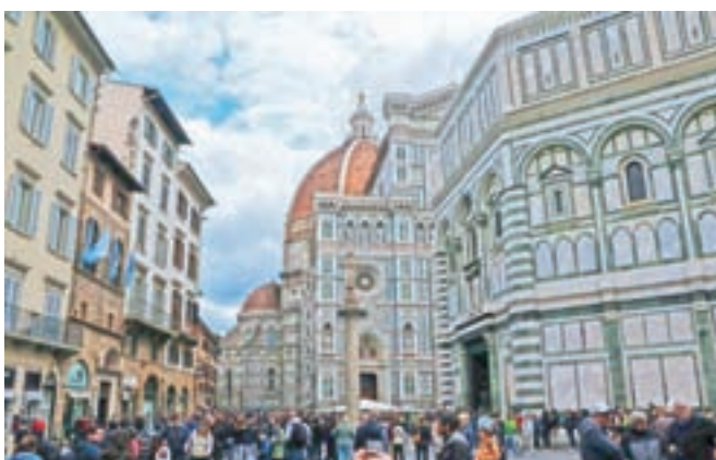
Veličastna firenška stolnica v samem središču Firenc je izjemno oblegana turistična znamenitost Toskane.