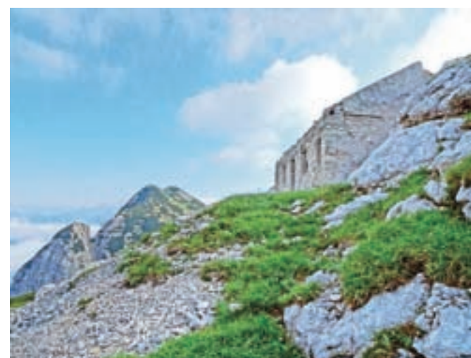
Objekt na Veliki Monturi, zadaj Velika Baba