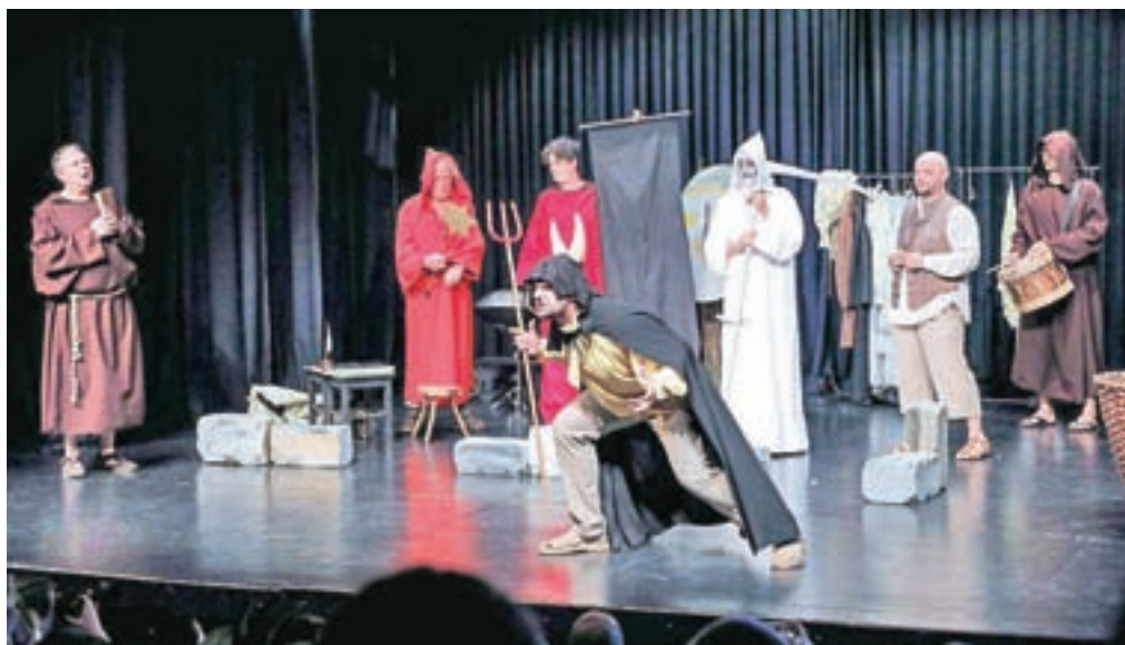
Osrednji dogodek je letos predstavljala dramska igra Romuald – loški kapucin, ki so jo morali zaradi dežja v celoti preseliti na Loški oder.

Za živahen utrip na Mestnem trgu so poskrbeli tudi s srednjeveškim sejmom in prikazi rokodelskih veščin pred Rokodelskim centrom DUO Škofja Loka, rokodelci iz vse Slovenije so se predstavili tudi na Cankarjevem trgu. Spodnji trg pa so ta dan zaprli za promet, saj so dogajanje iz Kreativnic preselili pod bližnjo lipo.