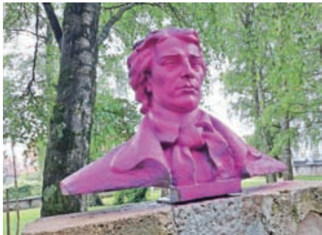
Prešernov kip v Prešernovem gaju v Kranju je bil znova tarča vandalizma.

Prešernov gaj je sicer opuščen staro kranjsko pokopališče, ki so ga leta 1951 preuredili v spominski park. Nagrobni spomenik pesniku dr. Francetu Prešernu so postavili leta 1852. Pobudo zanj je dal dr. Janez Bleiweis, prispevke za njegovo postavitev pa so zbirali po vseh tedanjih slovenskih deželah.