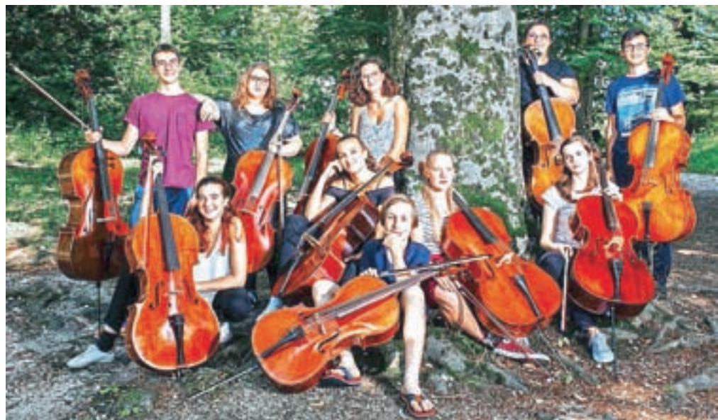
Dolcissimo je naslov koncerta, s katerim bo publiko razvajal ansambel mladih violončelistov Cello attacca!