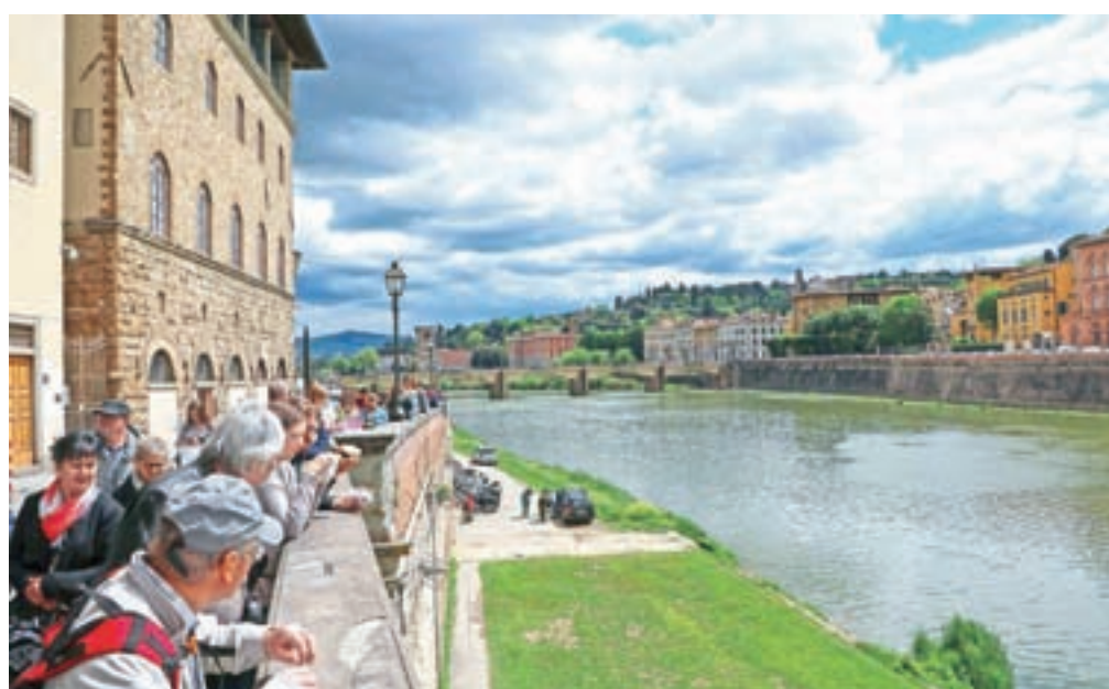
Arno je za Tiberio najpomembnejša reka osrednje Italije. Teče skozi stari del Firenc.