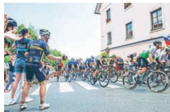
Navijači so v Škofji Loki zaploskali kolesarjem na dirki Po Sloveniji.

Škofja Loka – Včeraj popoldne se je v Novem mestu končala letošnja kolesarska dirka Po Sloveniji. Končni rezultati do zaključka naše redakcije še niso bili objavljeni, smo pa kolesarje minuli petek lahko pozdravili tudi na Gorenjskem. Sredi dneva se je karavana pripeljala tudi v Škofjo Loko ter po Poljanski dolini do Žirov. Cilj tretje etape je bil v Idriji, slavil pa je Italijan Diego Ulissi (UAE Team Emirates). Na sobotni kraljevi etapi je bil nato zmagovalec Giovanni Visconti (Ita/Neri Sottoli-Selle Italia-KTM), ki je bil najmočnejši v sprintu četverice, Diego Ulissi pa je ubranil zeleno majico. V boju za vrh je bil tudi Tadej Pogačar (UAE Team Emirates), ki je na koncu osvojil tretje mesto in je bil tudi najboljši mladi tekmovalac na dirki. Kolesarji se bodo na gorenjskih cestah predstavili spet v nedeljo, ko bo v Radovljici in okolici potekalo državno prvenstvo.