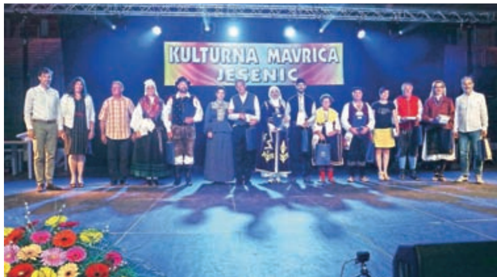
Folklorna skupina Julijana Kulturno-športnega društva Hrušica je navdušila obiskovalce.

Jesenice – Iz šal in statistike je znano, da je jeseniška narodnostna in kulturna sestava zelo pestra. Nekatera velika mesta so postala talilnice kultur, ki jemljejo različne kulture in iz njih ustvarjajo svojo novo kulturo, na Jesenicah pa je iz tega pestrega narodnostnega recepta nastala mavrica, Kulturna mavrica Jesenic, ki že 13 let pripadnikom različnih kultur, predvsem iz nekdanje skupne države, ponuja oder in prostor, da se predstavijo. Tako je bilo tudi letos, ko so se na paradi po ulicah železarskega mesta ter na vrhuncu dogajanja, skoraj dvourni kulturno-kulinarični poslastici v Dvorani Podmežakla predstavili člani folklorne skupine Julijana, Kulturno, prosvetno, športno in humanitarno društvo Vuk Karadžić, Kulturno športno društvo Bošnjakov Biser, KUD Triglav Slovenski Javornik, Makedonsko kulturno društvo Ilinden, pihalni orkester