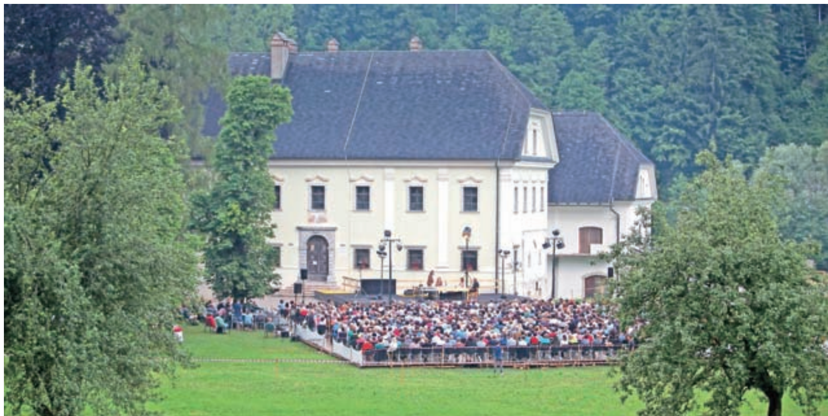
Predstavo Visoška kronika je ob odličnih igralcih SNG Drama Ljubljana zaznamovala tudi prekrasna kulisa visoškega dvorca.

Prvo polovico predstave, lahko bi rekli Polikarpov del, ki se začne z njegovim izvirnim grehom, nadaljuje s s krvjo obarvanim bogastvom ter konča s smrtjo