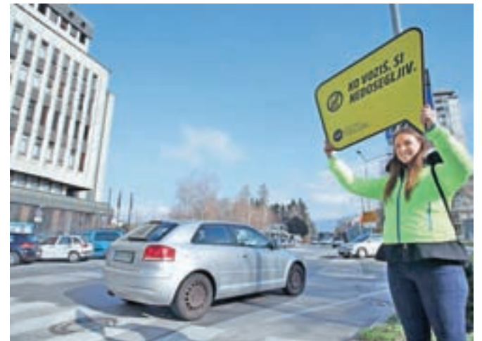
Podobno kot že konec marca vas bodo v naslednjih tednih prostovoljci z različnimi sporočili opozarjali, da telefon in alkohol ne sodita za volan.

Pobudo za skupno akcijo je Agencija za varnost prometa podala zaradi nekaterih kazalnikov, na podlagi katerih je pričakovati, da se stanje varnosti cestnega prometa do konca leta v primerjavi z letom poprej utegne poslabšati. Javnost želijo zato opozoriti, kako usoden je lahko katerikoli od dejavnikov tveganja v prometu, ki nam ali našim bližnjim lahko za vedno spremeni življenje. »Agencija za varnost prometa v sodelovanju s ključnimi deležniki prometne varnosti, ki so naši pomembni partnerji, s skupno akcijo #VarnoVPoletje vse udeležence v prometu proaktivno opozarja na pasti poglobitvenih dejavnikov tveganja na naših cestah: prehitra oziroma neprilagojena vožnja, alkohol v prometu, uporaba mobilnih