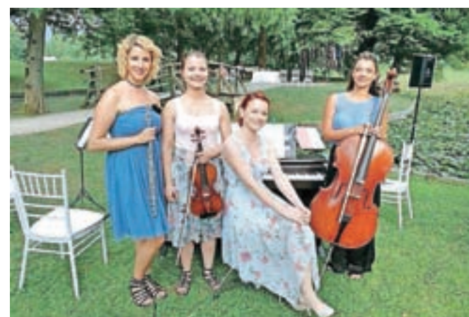
Poletna glasbena srečanja bo v četrtek odprl koncert kvarteta Acoustic Art.