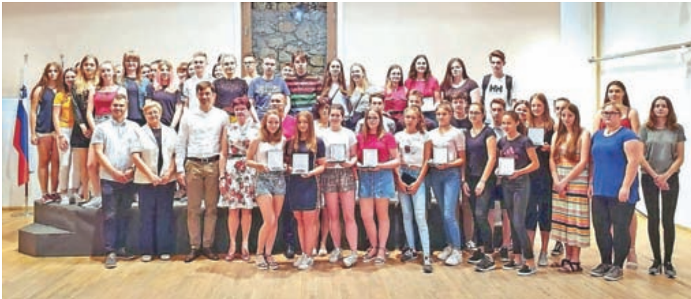
Najboljši jeseniški učenci in dijaki z ravnatelji in županom

je, da bi pridobljeno znanje znali uporabiti tudi v življenju, da bi veliko potovali po svetu, a se z izkušnjami vrnili domov in obogatili domačo skupnost. Poudaril pa je tudi pomen druženja in prostega časa. Na sprejemu so za kulturni program poskrbeli učenci Glasbene šole Jesenice: baletnika in kvartet klarinetov, ki so ga sestavljale štiri odlične učenke, prejemnice županovih petic.