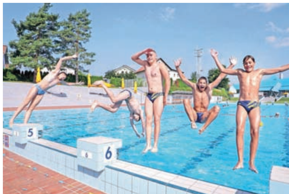
Pred šolarji sta dva brezskrbna počitniška meseca (fotografija je simbolična).

Iztekajoče se šolsko leto so zaznamovale nekatere novosti. V osnovnih šolah so uvedli nov koncept razširjenega programa, s katerim so želeli čim bolj