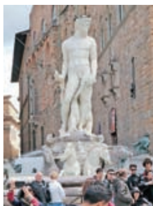
Neptunov vodnjak stoji na trgu Piazza della Signoria.

T retji dan smo se na poti domov ustavili še v Firencah, prestolnici umetnosti in muzejev ter zibelki renesanse. S tramvajem smo se z obrobja odpeljali skoraj do središča mesta in se potem skozenj sprehodili. Vreme se je najprej kisalo, a nam je z dežjem prizaneslo.