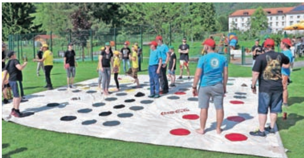
Človek, ne jezi se s človeškimi figuricami