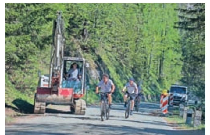
Cesta čez Vršič bo v času obnove delno zaprta, kratkotrajne popolne zapore bodo izvajali ob delavnikih.

Popolne zapore bodo izvajali samo od ponedeljka do petka, ob koncih tedna, ko je promet običajno najgostejši, pa kratkotrajne popolne zapore niso predvidene. Za dokončanje gradbenih del bodo cesto zaprli za en dan, takrat pa bo urejen obvoz čez Italijo oziroma mejni prehod Predel.