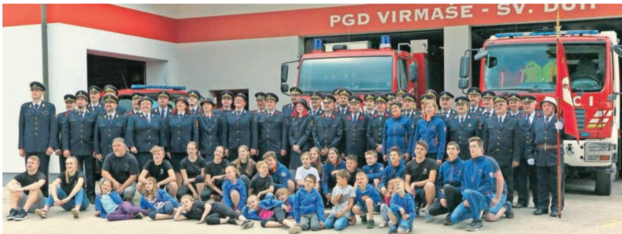
Ob stoletnici je zglebna skrb za podmladek najboljši obet za prihodnost društva.

gasilska društva in podjetja, med njimi je bilo tudi prijateljsko Prostovoljno gasilsko društvo Muč iz okolice Splita na Hrvaškem. Najzaslužnejšim so podelili pet značk, Gasilska zveza Škofja Loka pa je podelila devet priznanj.