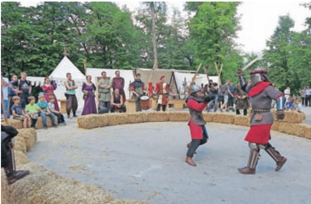
Na srednjeveški tržnici, ki so jo letos združili s srednjeveškim taborom, je bilo mogoče spremljati tudi viteške turnirje in prikaze bojevanja z meči.

Na zgornji terasi gradu so meče večkrat prekržali pogumni vitezi, med katerimi je svoje spretnosti letos prvič prikazal tudi sokolar, član madžarske srednjeveške skupine. Na spodnji grajski terasi pa so se namesto plesu z meči raje posvetili plesom ob srednjeveški glasbi, za katero je med drugim poskrbela domača glasbena skupina