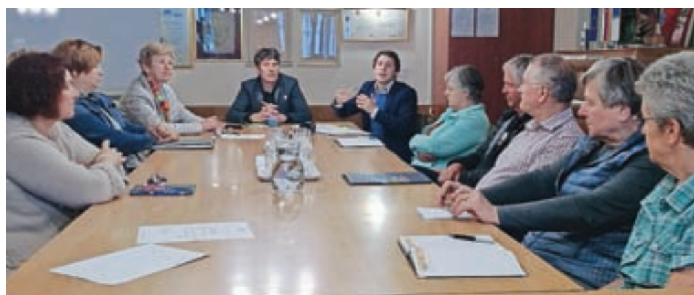
Konstitutivna seja Sosveta starejših občine Tržič