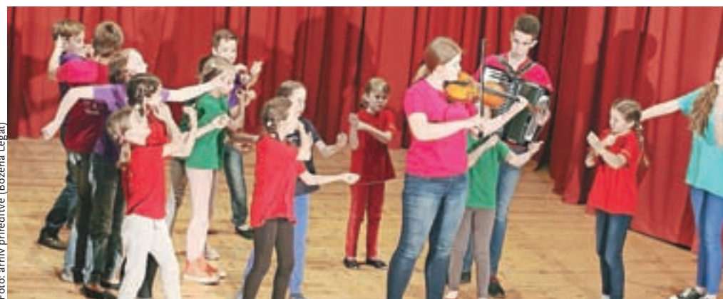
Folklorna skupina Konjički je navdušila občinstvo v dvorani Kulturnega doma Janeza Filipiča.

skupin sta dve skupini dosegle srebrno priznanje, starejša otroška pa se je odlično borila in le za las zgrešila državni nivo, s tem daje treba opozoriti na dejstvo, da so letošnji tekmovalni kriteriji še strožji kot pretekla leta. Starejša otroška skupina je v tem šolskem letu izredno napredovala na plesnem področju – v začetku maja so prikazali odlično plesno znanje, z veseljem pa so se odzvali povabilu otroške in mladinske FS iz Banjaluke in tako bodo sredi junija z združenimi močmi otroške, mladinske in odrasle skupine nastopili v BiH. Aktivni so bili tudi odrasli, ki so nastopili na Prešernovem smenju v Kranju in na paradi Tedna ljubiteljske kulture v sodelovanju s folklorno skupino DU Naklo.