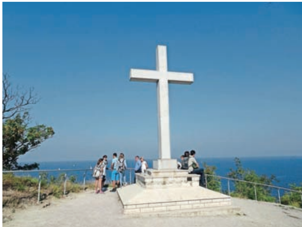
Beli križ nad Strunjanom, razgledna točka