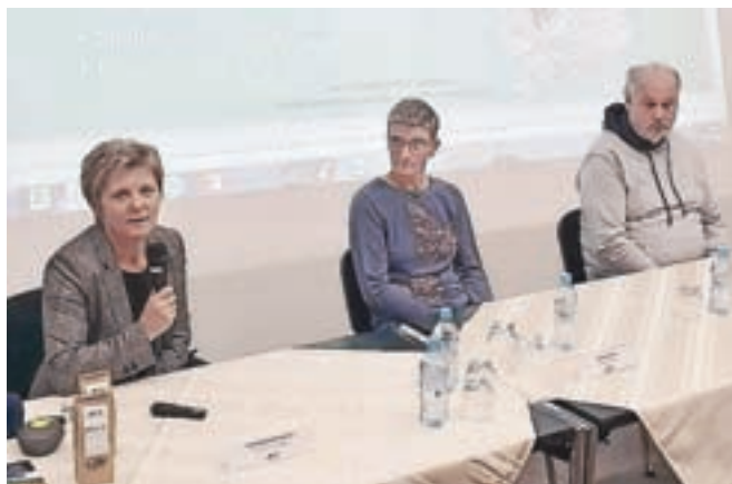
Projekt Neverjetne gore so predstavili v Slovenskem planinskem muzeju v Mojstrani.