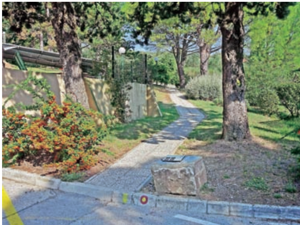
Začetek označene poti pri hotelu / Foto: Jelena Justin

Nadmorska višina: 116 m Višinska razlika: 100 m Trajanje: 2 uri Zahtevnost: ★★★★★