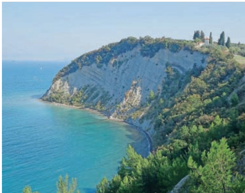
Strunjanski klif je s poti odlično viden. / Foto: Jelena Justin

Od križa nadaljujemo naprej po lepo urejeni stezi nad morjem. Približujemo se Strunjanskemu klifu. To je najvišji flišni klif ob vzhodni jadranski obali. Visok je osemdeset metrov. Fliš je mehka kamnina, za katero je značilno izmenjavanje plasti peščenjaka, laporja in karbonatnega turbidita. Morje ga konstantno izpodjeda, vremenske razmere pa povzročajo erozijo v zgornjih plasteh. Posledica delovanja narave so