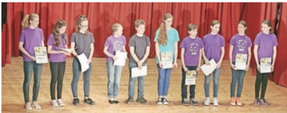
Mladi folkloristi, ki že pet in več let sodelujejo pri folklori, so prejeli posebna priznanja s strani državne institucije Javnega sklada za kulturne dejavnosti.