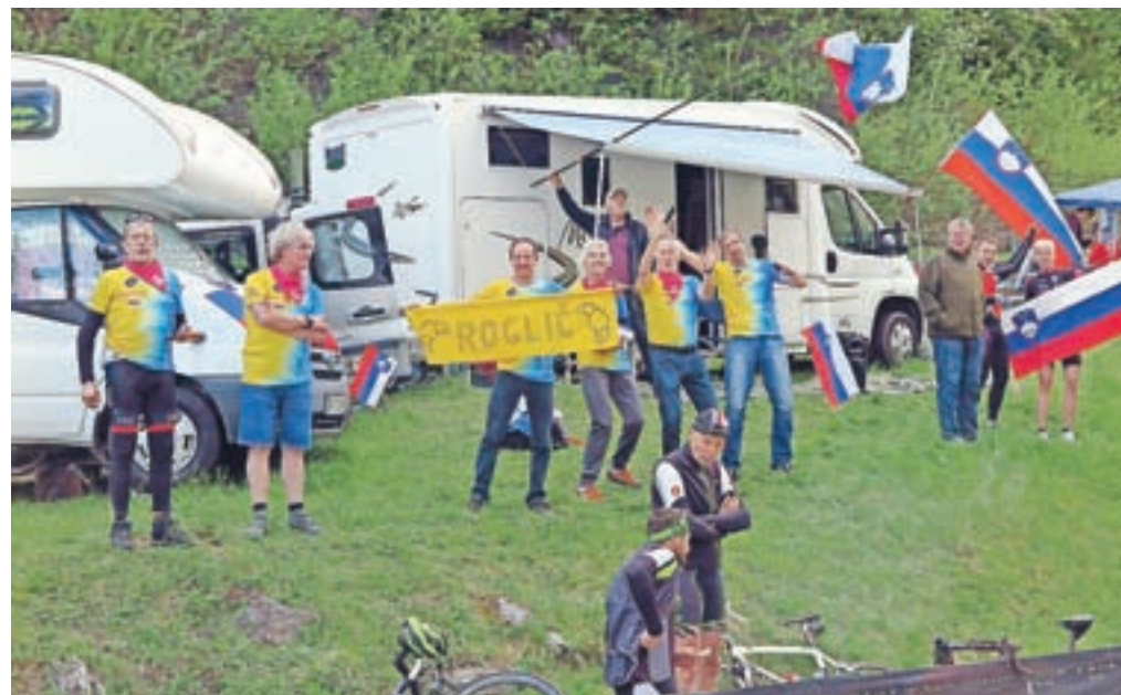
Med številnimi slovenskimi navijači so bili v petek tudi kolesarji ekipe Gorenjskega glasa, ki so dan prej zadnji, ciljni vzpon te zahtevne etape tudi prekosarili.