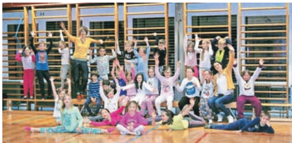
Učenci podružnične šole Kokrica so eno noč v maju preživeli v šoli.

V šolo so učenci prišli že v petek zgodaj popoldne in se peš odpravili proti kranjskemu bazenu, kjer so se v družbi animatorjev Zavoda za šport Kranj zabavali ob igranju mini vaterpola in iskanju obročev na dnu bazena, svoje spretnosti so preskusili v hoji v napihljivi