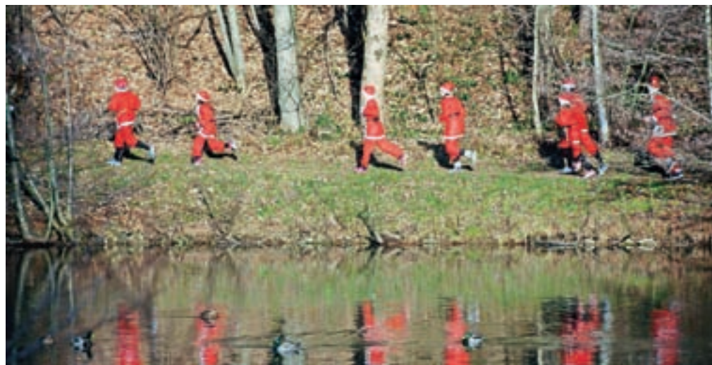
Božički so tekli okrog jezera v Preddvoru.