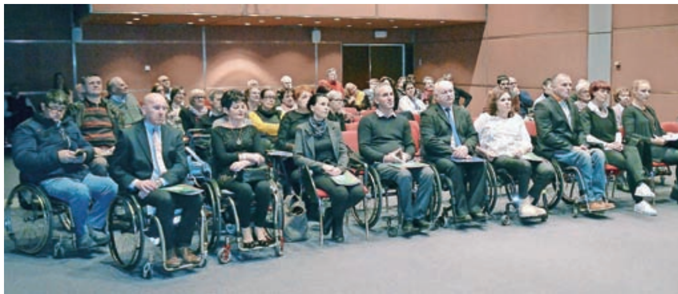
Proslava ob štiridesetletnici društva

in ljudi, ki so v tem času pomembno prispevali k razvoju društva. Ob tej priložnosti pa poteka tudi akcija zbiranja denarja za nakup kombija, ki ga v društvu nujno potrebujejo za varen prevoz članov.