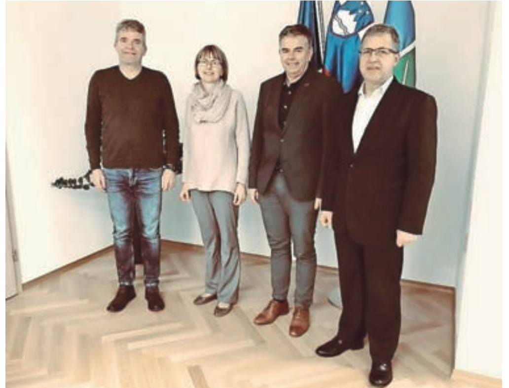
V Gorenji vasi so pred dnevi podpisali koncesijsko pogodbo o širitvi pediatrične dejavnosti v občinah Gorenja vas - Poljane in Žiri.

Širitev pediatrične dejavnosti je plod dolgotrajnega prizadevanja in opozarjanja obeh občin, da prvotno odobreni program zaradi velikega števila otrok ne zadošča za kakovostno zdravstveno oskrbo v obeh lokalnih skupnostih. Kot navajajo na občini, je namreč po podatkih statističnega urada na območju občin Gorenja vas - Poljane in Žiri 3114 otrok starih do 19 let – v gorenjevaško-poljanski občini 2049 in v Žirih 1065. Po prejšnjem programu tako ni bilo mogoče zagotoviti normalnega delovanja ambulante, so opozorili. »Zaradi velikega števila majhnih otrok je bila namreč ambulanta skoraj polovico delovnega časa primarna in izvajati preventivo s sistematskimi pregledi in posvetovalnico, kar ni omogočalo