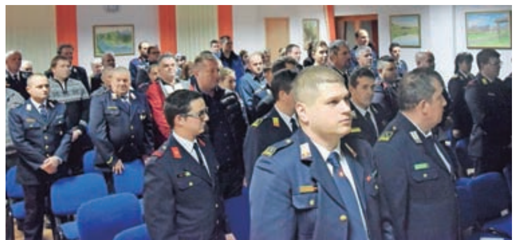
V Mavčičah so praznovali gasilski jubilej.

zahvalami so se mavčiški gasilci zahvalili zaslužnim članom, domačinom in pokroviteljem za nesebično pomoč. Oktet Lipa je večer zaključil s pesmijo Slovenska dežela, po uradnem delu pa je sledilo druženje ob pogovoru in izmenjavi izkušenj.