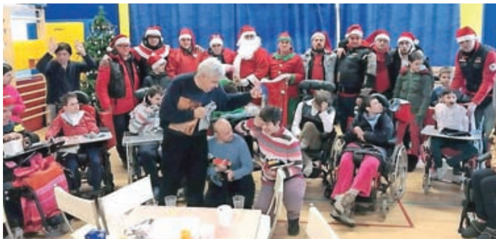
Motoristi MC Hells Angels Steel city Jesenice so pred božičem obiskali in obdarovali otroke v domu Matevža Langusa.

pripeljali dva terapevtska konja, Božička z darili za vse otroke, v CUDV Matevža Langusa so odpeljali didaktične igrače, pripravili obisk klovna Žareta ... »V preteklosti smo že večkrat pripravili takšne dogodke in jih bomo tudi v prihodnje, saj to čutimo kot svojo dolžnost. Kadarkoli bo treba, bomo vedno priskočili na pomoč, radi pa bi tudi sporočili, da se po dejanju posameznikov ne sodi cele skupine,« je še dodal.