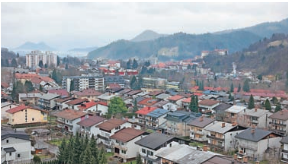
V letošnji akciji je gradbena inšpekcija izvedla več kot devetsto nadzorov (fotografija je simbolična).

Na podlagi izvedenih nadzorov so odprli 593 postopkov, od teh 566 upravnih inšpekcijskih ter 27 prekrškovnih. Skupno so izdali 120 inšpekcijskih odločb. Odkrili so 62 nelegalnih gradenj po zakonu o graditvi objektov, na podlagi gradbenega zakona pa so inšpektorji ugotovili 23 nelegalnih objektov. V obeh primerih je inšpekcija odredila ustavitve gradenj in rok za odstranitev objektov. V primeru štirih objektov so odkrili neskladnosti, 18 pa je bilo nevarnih gradenj. V dveh primerih so prepovedali uporabo objektov zaradi spremembe namembnosti brez gradbenega dovoljenja. Izdali pa so tudi deset odločb za odpravo pomanjklivosti. V 37 primerih so zavezanca opozorili na ugotovljene nepravilnosti in določili rok za njihovo odpravo.