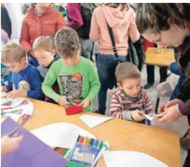
Za otroke so pripravili kopico ustvarjalnih idej.

in se prepustili mojstricam poslikave obraza. Organizatorji delavnic so za obiskovalce pripravili tudi pogostitev, sproti so pekli še palačinke za lačne želodčke. Za presenečenje večera je poskrbel Dedek Mraz, s katerim so otroci lahko poklepetali ali mu zapeli pesmico, za nagrado pa je vsem razdelil bombone.