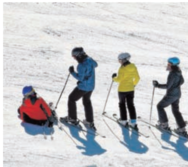
Vsi štirje smučarji, ki so padli zadnji konec tedna, so se huje poškodovali (slika je simbolična).

Vsi smučarji so se huje poškodovali, policisti pa so poročali o zlomih gležnja, stegnenice in kolena. Pri sankanju je en otrok utrpel udarec v