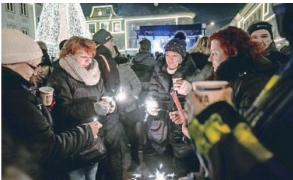
Številni bodo novo leto pričakali tudi na silvestrovanjih na prostem.