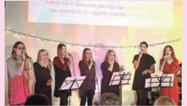
Ginke so navdušile z nastopom v Cerkljah.