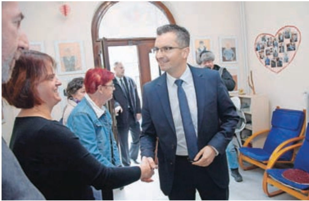
Predsednik vlade Marjan Šarec med obiskom kamniškega Štaciona

»Gre za projekt iz mojega prvega županskega mandata, ki je bil uspešno realiziran, kljub temu da smo od nekaterih kamniških dušebrižnikov takrat poslušali, kaj vse bo narobe, če bo ta ustanova tukaj. Vendar center danes dobro deluje in ima čedalje več