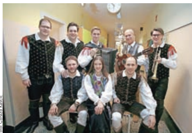
Ansambel Saša Avsenika z Gregorjem Avsenikom. Kljub številnim nastopom so našli čas za igranje na Trsteniku.