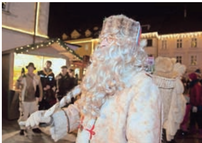
Siva kučma, bela brada, topel kožuh, zvrhan koš ... Dedek Mraz praznuje že sedemdeseti rojstni dan.

Ob prihodu Dedka Mraza so se skozi vso zgodovino odvijale številne kulturne prireditve, na katerih so otroci prejeli darila, propagirali pa so skromno obdarovanje. Prvi spreved Dedka Mraza sega v leto 1950, sedem let kasneje pa je Zvezda prijateljev mladine Slovenije izdala posebno publikacijo z naslovom Dedek Mraz prihaja, ki je bila v pomoč pripravljavcem spre-