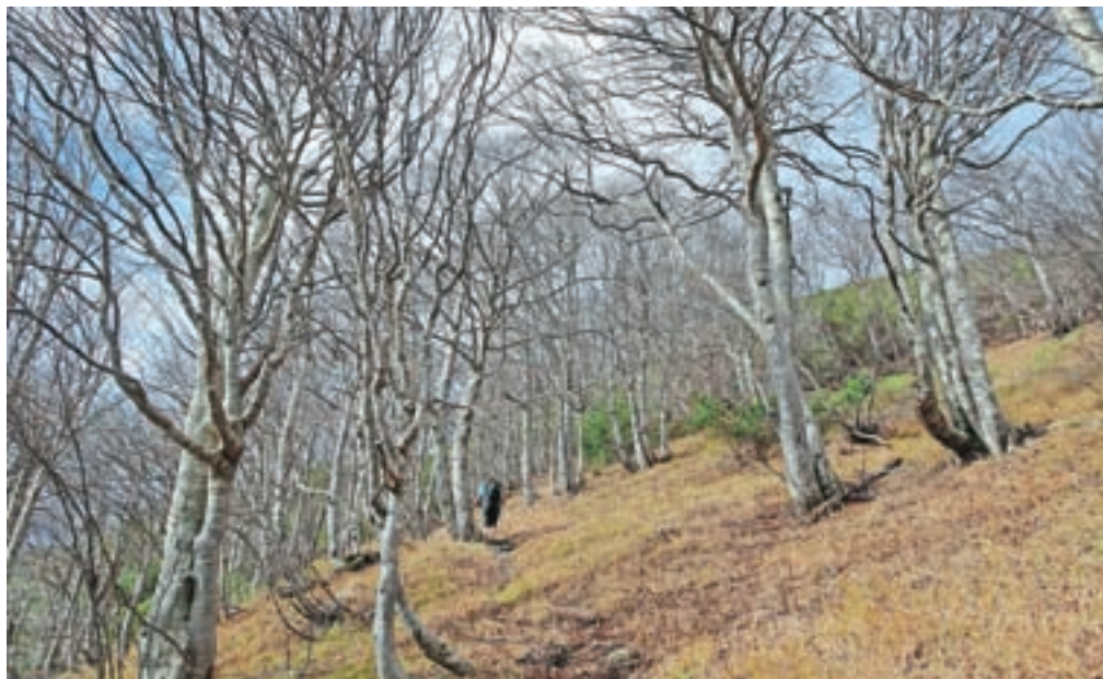
Prečni vzpon skozi bukov gozd tik pod vršnim grebenom

Nadmorska višina: 1639 m Višinska razlika: 800 m Trajanje: 4–5 ur Zahtevnost: ★★★★★