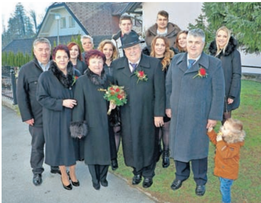
Perčičeva sta se prvič cerkveno poročila na Brezjah, po petdesetih letih zakona pa obnovila zaobljubo na Trsteniku. Na fotografiji sta v družbi najbližjih.

Življenjski poti sta se jima prekrizali v domačem kraju,