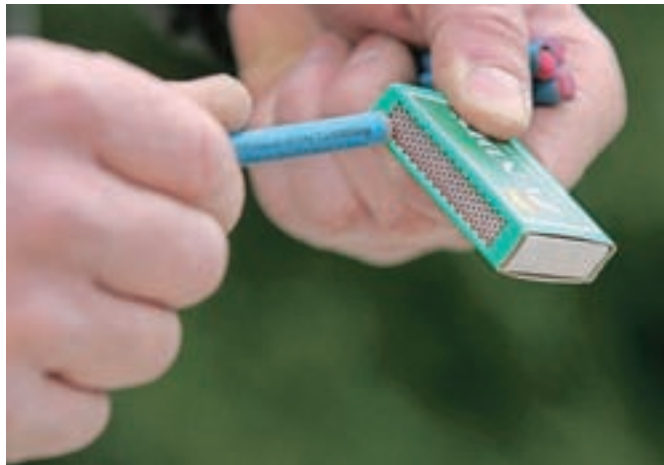
Uporaba kakršnihkoli petard je v Sloveniji prepovedana že vrsto let.

tudi poudarja, da je pirotehnične izdelke prepovedano uporabljati v strnjjenih naseljih, v stanovanjskih zgradbah in zaprtih prostorih, v prevoznih sredstvih potniškega prometa ter na površinah, kjer potekajo javni shodi in javne prireditve. Pirotehnične izdelke uporabljajte previdno in premišljeno, kar zlasti velja za mlade (mlajšim od 14 let je njihova uporaba v celoti prepovedana), ki so najpogostejše žrtve nevarne rabe pirotehnik. Zavedajte se, da je uporaba glasne pirotehnik lahko zelo stresna in celo nevarna tudi za živali, kar dokazuje tudi primer iz Kranjske Gore. Tamkajšnji policisti so namreč v soboto skrbnikom vrnili psa, ki se je v soboto popoldan domnevno prestrašil zaradi poka pirotehnik. Ker ni bil na povodcu, je skrbnikom pes pobegnil.