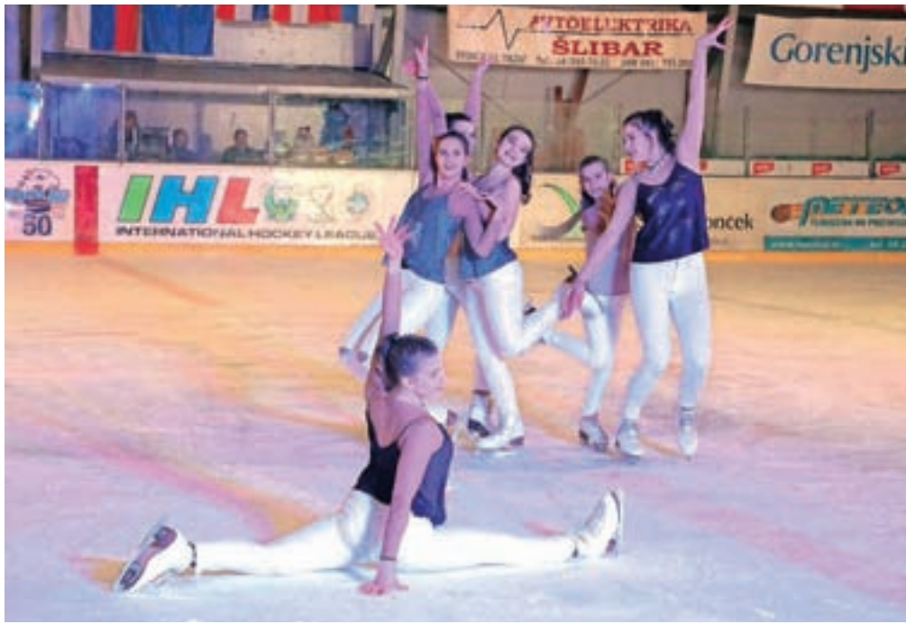
Umetnostni drsalci Drsalnega kluba Kranj so predstavili, kako je na ledeni ploskvi videti zgodovina popularne glasbe.

Živahne drsalne točke je za decembrsko revijo sestavila ekipa trenerjev v tesnem sodelovanju z mladimi drsalci. »Kot je to navada, ob koncu vsakega leta vsi skupaj izberemo temo, ki se kot rdeča nit vleče skozi drsalno revijo. Tokrat