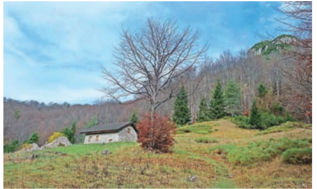
Opuščena planina Cimadors, kjer je neoskrbovan bivač. Desno vidimo vrh, a do njega je še približno 45 minut hoje.

Dal Bor nad dolino Val Alba. Vzpenjamo se po robu, strmo, nato pot preči levo. Strmina ne popusti in kmalu zavije desno skozi bukov gozd. Na vrhu strmine steza zavije levo in preči pobotče. Odpirajo se nam razgledi na Monte Amariano. Sledi strm vzpon skozi bukov gozd, kjer je treba malce oprezati za markacijami. Na vrhu strmine nadaljujemo desno, pot se celo malce položi in nas v zmernem vzponu pripelje do opuščene planine Cimadors, kjer je hiška spremenjena v zasilni bivač. Do sem smo potrebovali približno dve uri. Od hiške sledimo markacijam desno v gozd. V nekaj okljkih pridemo do široke gozdne grape, ki je v jesenskih mesecih polna odpadlega listja. Strmo se povzpemo do sedla,