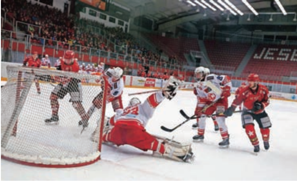
Hokejisti Jesenic so na zadnji domači tekmi visoko zmagali.