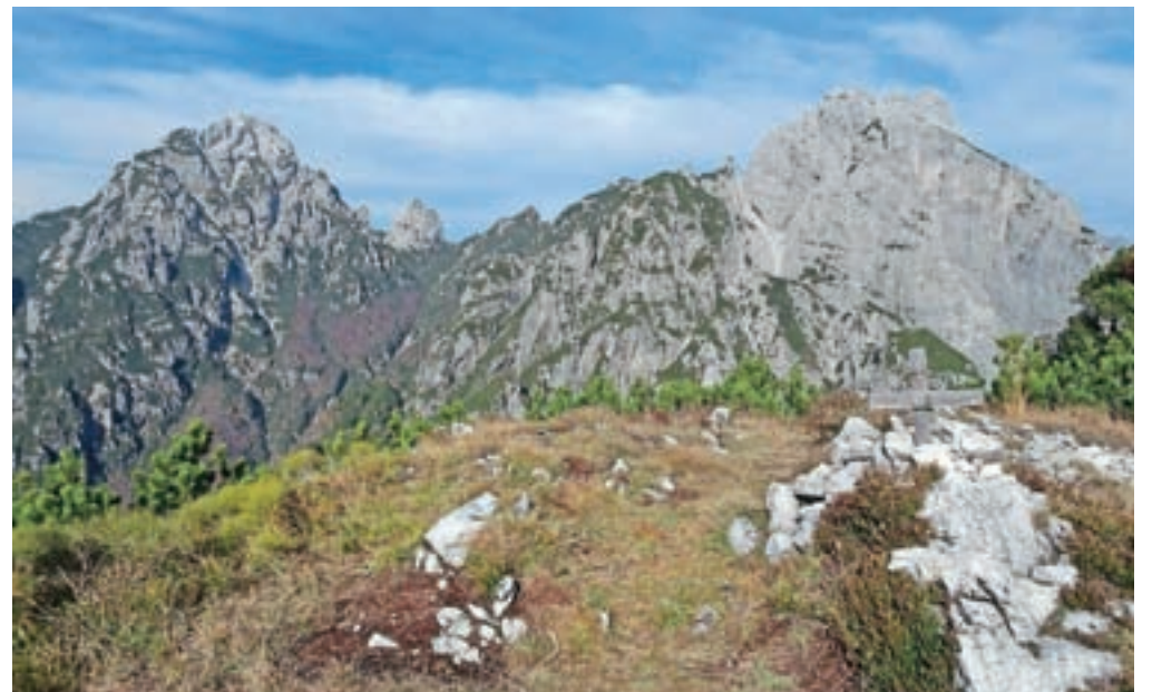
Razgled z vrha na Monte Sernio (levo) in Creta Grauzario (desno)