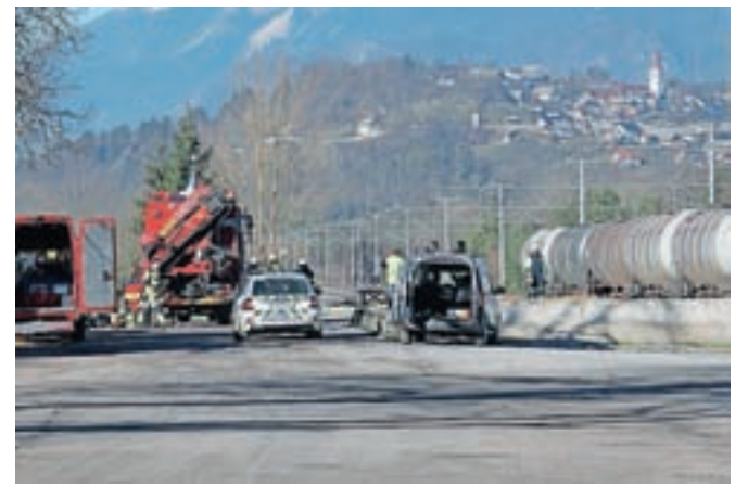
Območje iztekanja vnetljive snovi so sanirali gasilci iz Kranja in Podnarta.

Onesnaženo območje so sanirali kranjski poklicni gasilci in prostovoljni gasilci iz Podnarta. Postavili so požarno varovanje, skupaj z delavci Slovenskih železnic odklopili električno povezavo in ozemljili vlakovno kompozicijo ter s tehničnim posegom preprečili nadaljnje iztekanje nevarne snovi.