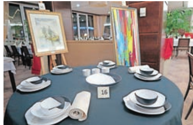
Gostje so se potegovali za nakup izdelkov iz programa Biseri, ki so jih uporabniki CUDV Radovljica s svojimi mentorji prav za ta večer ustvarjali vse leto.