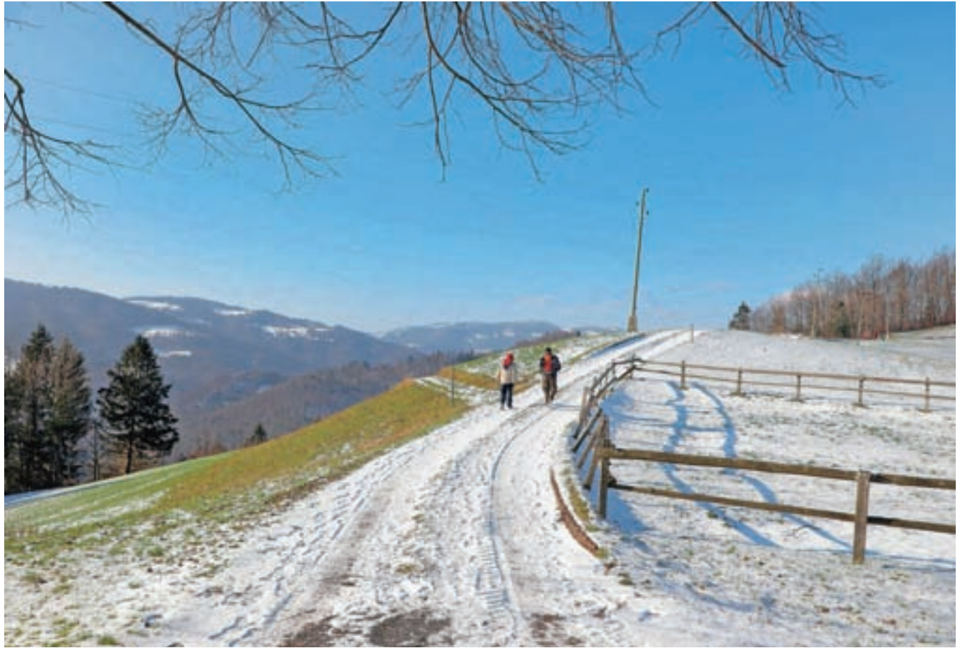
Za vas beležimo čas, ki vse bolj beži, zato si ob koncu leta vzemite polno naročje časa za vesel in sproščen vstop v novo leto.

tisti, ki jih je leta 2008 velika ekonomska kriza presenetila. Stvari so danes vendarle nekoliko drugačne, zato se nam leta 2019 še ni treba bati. Že spomladi pričakujemo burno politično dogajanje, saj je problemov veliko, pravih rešitev pa politiki že dolgo ne uspejo najti. V domači politiki že piha svež veter, kako močan bo, se bo pokazalo v letu 2019. Maja bodo evropske volitve, zato lahko pričakujemo svežino tudi na evropskem političnem odru. Po nedavnih lokalnih volitvah svež veter pričakujemo tudi v nekaterih gorenjskih občinah, najbolj obetaven bo verjetno v Kranjski.