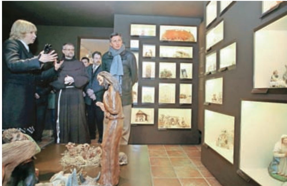
Predsednik Republike Slovenije Borut Pahor med petkovim obiskom Muzeja jaslic na Brezjah

Predsednik Pahor je po obisku izrekel občudovanje