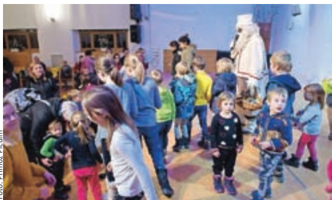
Za presenečenje večera je poskrbel Dedek Mraz.