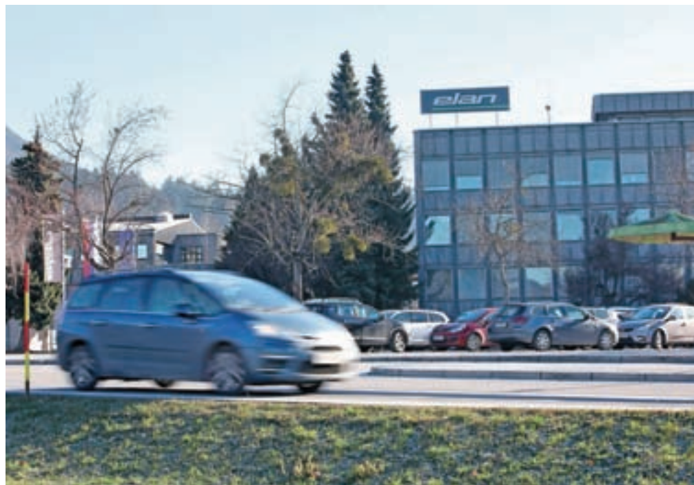
Družba Elan po dobrih treh letih spet menja lastnika.

so za prodajo najeli svetovalno podjetje Freitag & Co. in napovedali, da bi Elan novega lastnika lahko dobil še pred koncem leta. Že spomladi so ob napovedi prodaje zaposleni izrazili pričakovanje, da za novega lastnika dobijo strateškega partnerja in da se jim zdi smiselno, da se Elan proda kot celota. Obstoječi delničarji so sicer Elan od državnih lastnikov kupili julija 2015 in v podjetje investirali skoraj deset milijonov evrov ter povečevali število zaposlenih, ki jih je sedaj okoli osemsto.