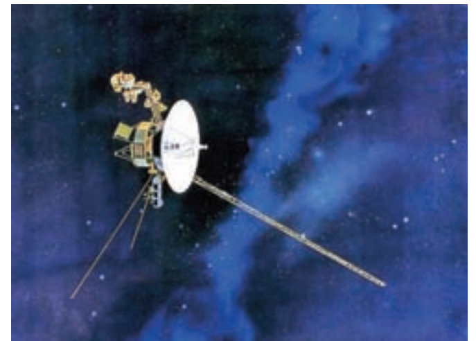
Vesoljska sonda Voyager 2, izstreljena 20. avgusta 1977, je 5. novembra 2018 zapustila osončje in postala drugi predmet človeške izdelave, ki je vstopil v medzvezdni prostor.