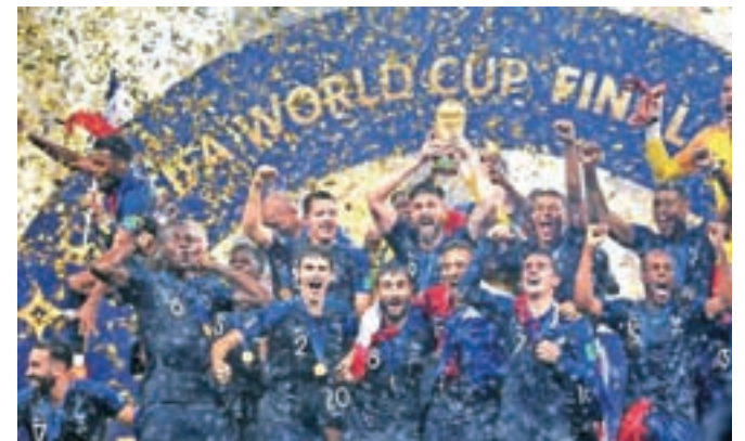
Svetovni pokal v nogometu so na tekmi s Hrvaško v Moskvi osvojili Francozi 15. julija 2018.