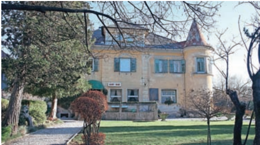
Sto dvajset let stara Ranzingerjeva vila v središču Begunj, kjer imajo prostore in manjši lokal tamkajšnji upokojenci; domačini si želijo, da bi ostala v javni rabi.

Begunje – Tako imenovano Ranzingerjevo vilo, ki poleg graščine Katzenstein in ruševin gradu Kamen spada med znamenitejšo zgodovinske stavbe v Begunjah, je leta 1897 zgradil zdravnik Juraj Catti s hrvaške Reke. Po njegovi smrti je posestvo kupil potomec znamenitih industrialcev in lastnikov glažut, po katerem je Ranzingerjeva vila dobila ime. Po drugi svetovni je bila posest skupaj z vilo nacionalizirana, kasneje pa so bili v njej prostori knjižnice in društva upokojencev.