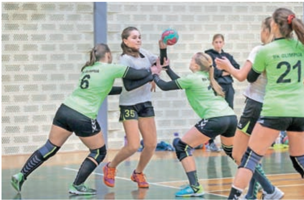
Mlade rokometarice so se družile in tekmovalle na božično-novoletnem turnirju.

Turnir seveda ni bil namenjen zgolj tekmovalnosti, pač pa tudi druženju – in je letos potekal že peto leto zapored. »Še leta 2009 je klub z žensko ekipo igral v prvi