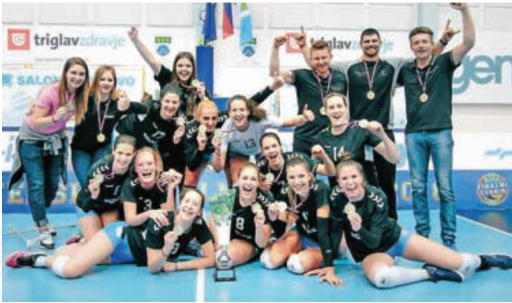
Odbojkarice Calcita Volleya so zmagovale Pokala Slovenije za sezono 2018/2019.

V moškem finalu sta se pomerili ekipi ljubljanskega ACH Volleya in kamniškega Calcita Volleya. Slednji so tokrat morali priznati premoč Ljubljančanom. Izgubili so z 0 : 3 (-21, -19, -22) in ostajajo pri treh pokalnih lovorikah. ACH Volley je prišel do enajste, hkrati so ubranili tudi lanskoletni naslov.