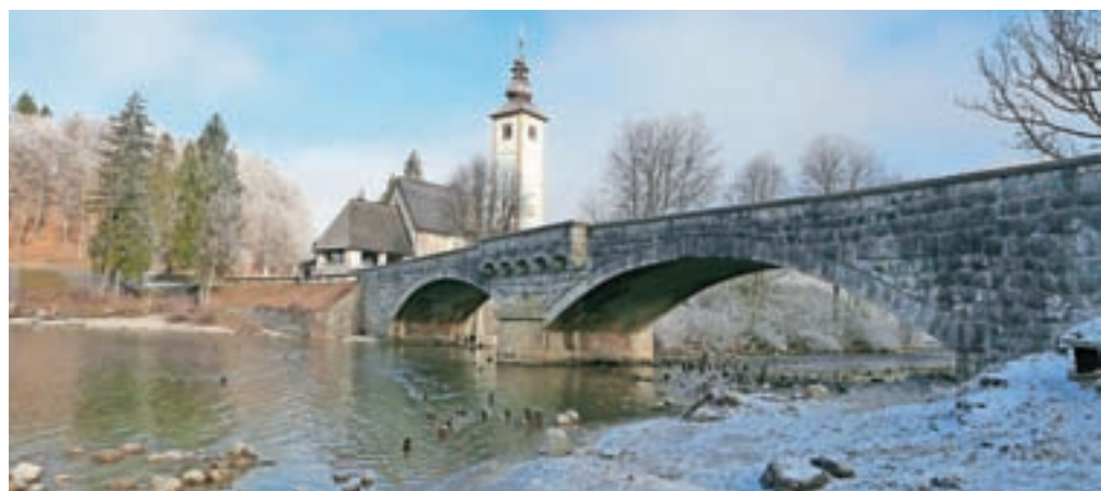
Razpoke med betonsko konstrukcijo mosta in kamnito oblogo

Most s cerkvijo je eden najpogostejše fotografiranih motivov v Sloveniji in tudi motiv grba Občine Bohinj.