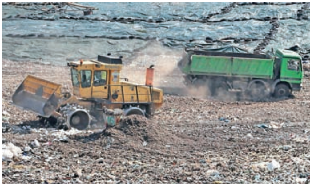
Komunalna podjetja pozdravljajo interventni zakon o odpadni embalaži. Žal jim je le, da je bil sprejet tako pozno (fotografija je simbolična).

Za mnenje o zakonu smo povprašali tudi nekatera komunalna podjetja na Gorenjskem, ki rešitve, ki jih uvaja zakon, pozdravljajo. V Komunalni Kranj menijo, da bo zakon stvari premaknil z mrtve točke, in računajo, da bodo odslej lahko odpadno embalažo sproti oddajali družbam za odpadno embalažo in se jim ta ne bo več kopičila na dvoriščih. »Predvidevamo, da bodo posamezne družbe uporabile vsa sredstva, ko bo prišlo do izterjav države za povračilo stroškov, kar se bo zopet odrazilo pri izvajalcih javnih