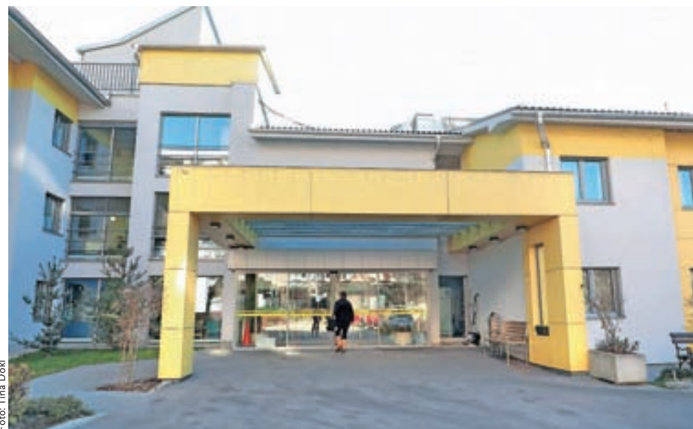
V Domu upokojencev Kranj so razočarani, saj jim zaposleni prek javnih del veliko pomenijo.