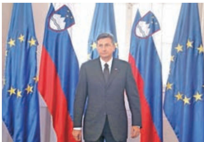
Ob dnevu samostojnosti in enotnosti so v uradu predsednika republike odprli vrata predsedniške palače obiskovalcem.