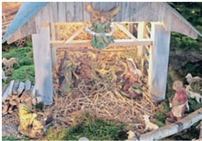
Vernike so ob božiču slovenski škofje nagovorili tudi prek posebnih poslanic (fotografija je simbolična). / Foto: Gorazd Kavčič