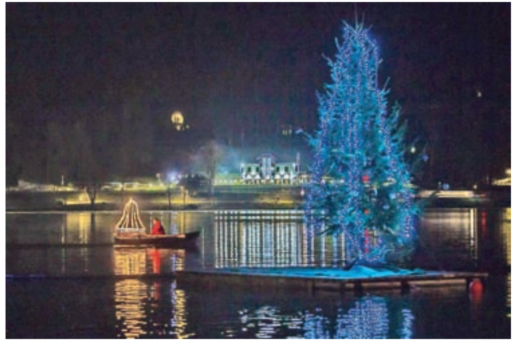
Poslušalci legende o potopljenem zvonu na Bledu so temu zagotovo zaupali številne želje, za katere upajo, da se jim uresničijo v prihajajočem letu.