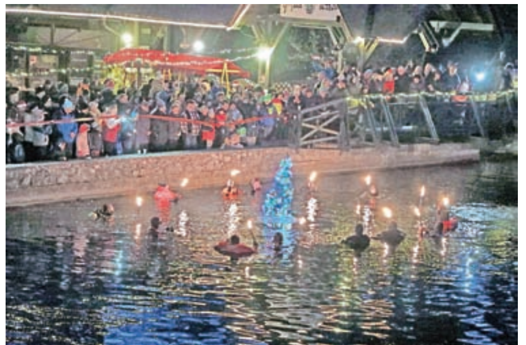
Potapljači so na dno preddvorskega jezera Črnava potopili božično drevo.

je v dolino, da bi ju našel. Prvo je našel sam, drugo pa je izsledil s pomočjo ljudi, saj je to zasvetilo, ko se ga