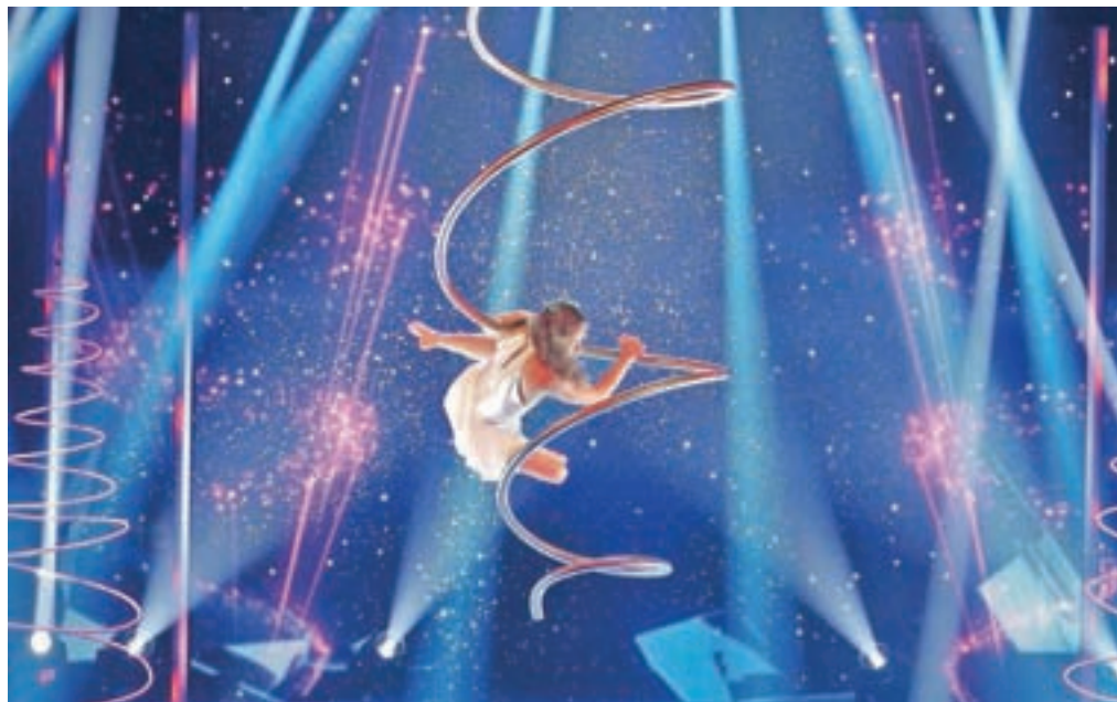
Tjaša Dobravec je navdušila s čutnostjo in akrobatsko lahkotnostjo, s katero se je lotila novega izziva na spiralnem drogu, ki se je vrтел.

Tretji Gorenjec, ki je ponovno stal na odru letošnjega