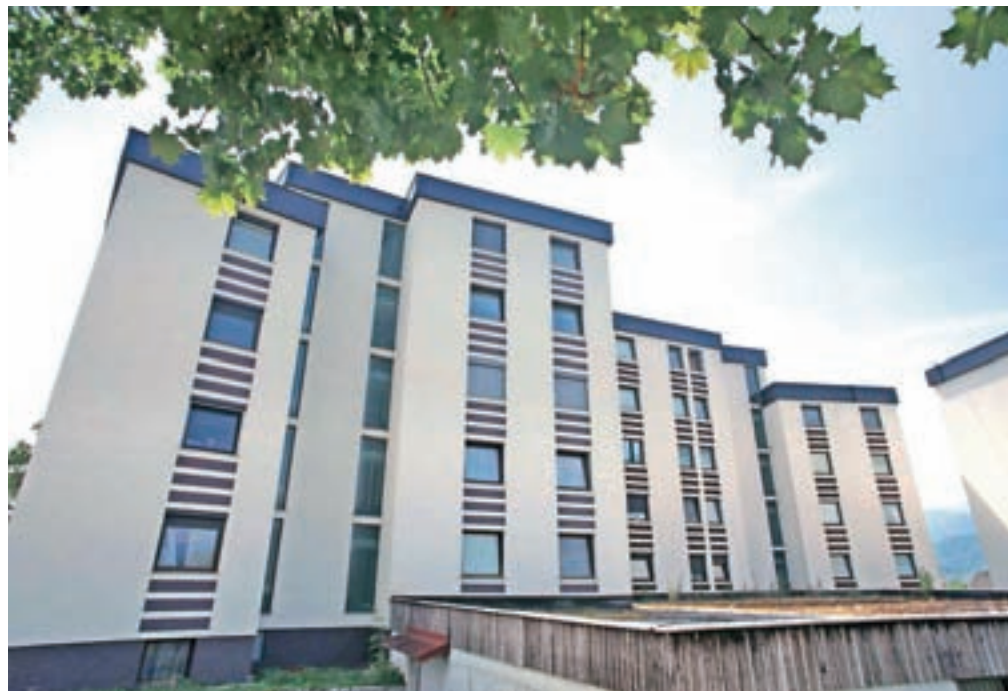
Zaradi pomanjkanja ponudbe se zmanjšuje prodaja novih stanovanj.

Vse bolj se zmanjšuje prodaja novih stanovanj, ta je znašala le štiri odstotke, kar na geodetski upravi