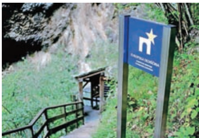
V Partizanski bolnici Franja so pred 75 leti sprejeli prve ranjence.