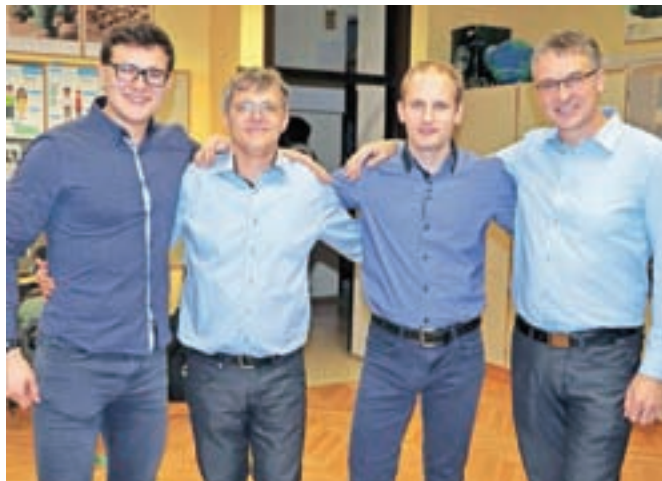
Ansambel Strmina Express