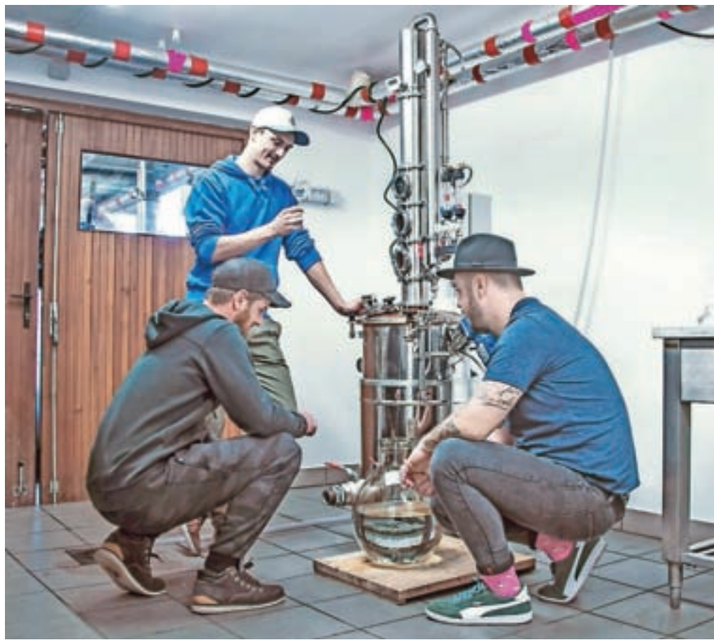
Pravijo, da je narediti gin enostavno, a vseeno ni čisto tako. Fantje so svoj in tisti pravi okus iskali kar nekaj časa.

In kaj bo prinesla prihodnost? Trije Bohinjci ne razmišljajo toliko o njej, nikaor pa se ne želijo omejevati.