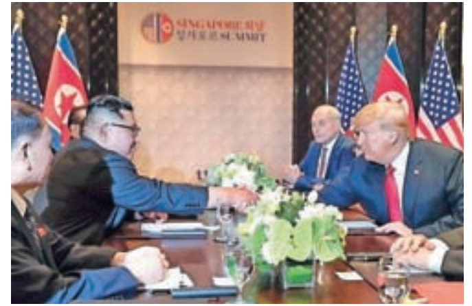
Kim Džong Un in Donald Trump v Singapuru 12. junija 2018; srečanje voditeljev Severne Koreje in ZDA obeta premik v reševanju korejskega problema.

V letu 2018 se je torej zgodilo marsikaj novega in izjemnega, a hkrati nič takega, kar bi usodno spremenilo življenja večine od sedmih milijard Zemljanov. Tretja svetovna vojna še ni izbruhnila, čeprav jo nekateri vztrajno podžigajo. Zaželimo si še mnogo za nas vsaj tako dobrih let, kot je bilo to, in privoščimo več miru in blaginje tudi tistim, ki ju nimajo.