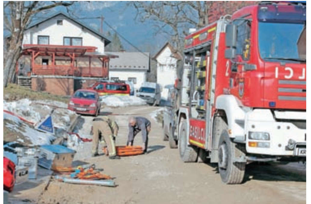
Kadil Bašič je nesrečno umrl med izkopavanjem kanalizacijskega jarka na Zgornji Beli 16. februarja 2015.

Okrožna državna tožilka Nadja Gasser je v končni besedi poudarila, da obdolženca nista odredila predpisanih varnostnih ukrepov pri kopanju jarkov v globini nad enim metrom, kot so zagrabljene stene, razpiranje ali ureditev brežin pod določenim kotom, kar bi preprečilo zrušitev zemeljskih plasti z bočnih strani dvometrskega jarka in osip izkopenega materiala. To je ugotovil tudi izvedenec za varstvo pri delu, ki je v izvedenskem mnenju zapisal, da bi morala obdolžena izkopavanje v takšni globini ustaviti, če sta videla, da se izkopavanje ne izvaja v skladu s predpisi s področja zagotavljanja varnosti in zdravja pri delu na gradbiščih. Upoštevana niso bila niti navodila iz varnostnega načrta, po katerih bi morali jarke v globini 1,5 metra