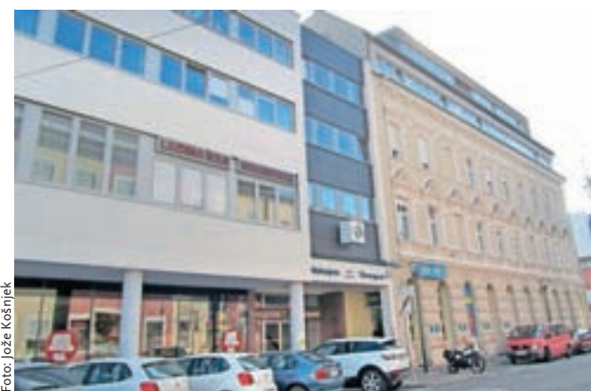
Mohorjeva hiša je eno od slovenskih središč v Celovcu.

V petek, 4. januarja 2019, ob 20. uri se bo v Casineumu Vrba/Velden ob Vrbskem jezeru začel tradicionalni, že 67. Slovenski ples, najstarejša družabna prireditev Slovencev na Koroškem. Več o plesu in nakupu vstopnic vam povedo na elektronskem naslovu spz@slo.at ali po telefonu 0463/51 43 00 – 22.