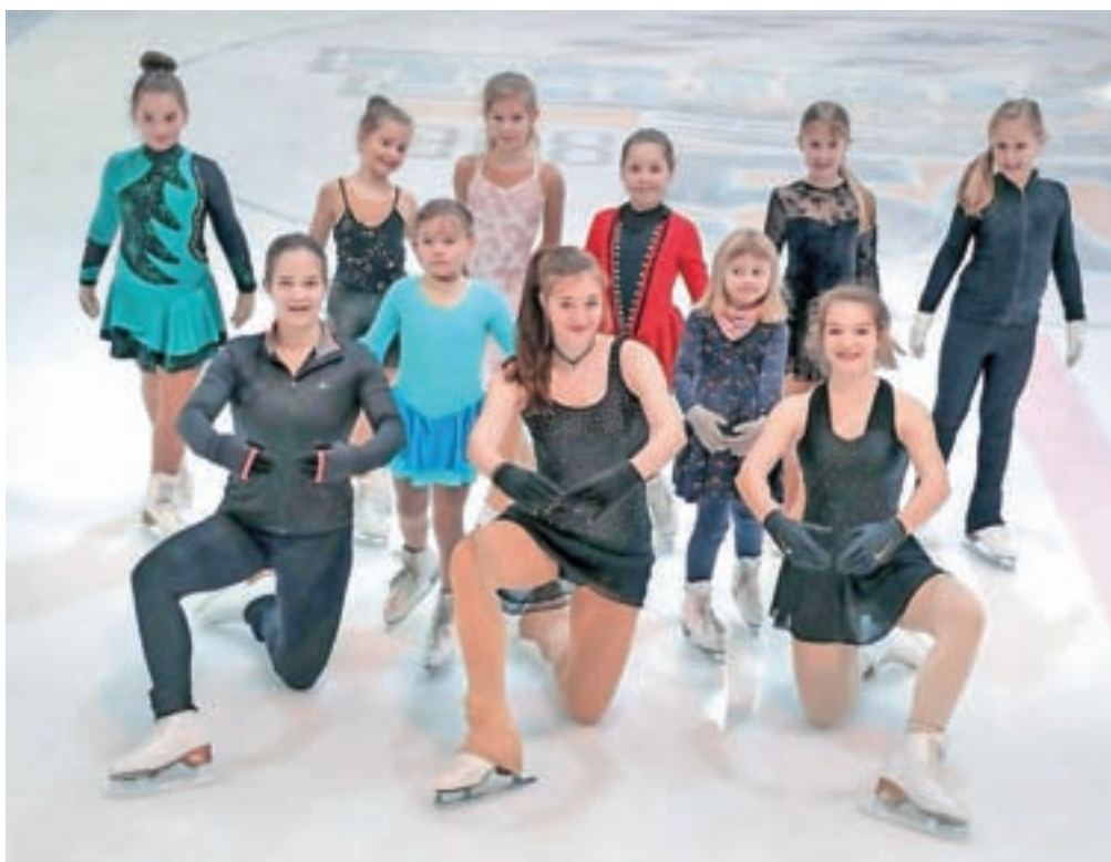
Na današnji reviji bodo mladi drsalci skupaj s trenerji predstavili, kako je na ledeni ploskvi videti zgodovina popularne glasbe.

Revija tako nosi naslov Glasba skozi čas, mladi drsalci pa bodo skupaj s trenerji predstavili, kako je na ledeni ploskvi videti zgodovina popularne glasbe. »Te dni kranjske umetnostne