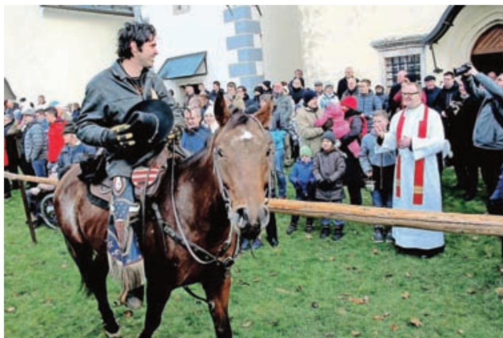
Blagoslova konj v Srednji vasi pri Šenčurju se je udeležilo 78 konjenikov.