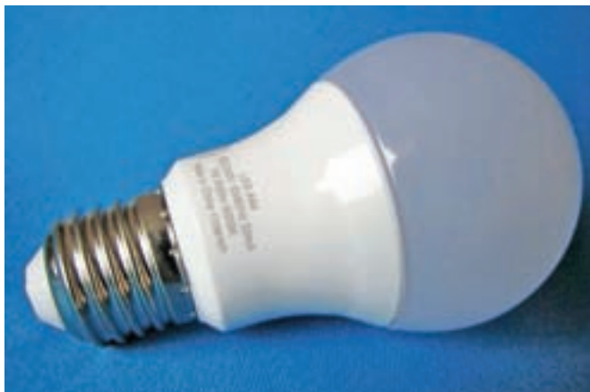
S 1. septembrom naj bi bila v prodaji le še LED-svetila.

Če LED-svetilo preneha delovati, ne moremo preprosto zamenjati žarnice, ampak celo ogrodje, celo luč. Problem je tudi, da se LED-tehnologija hitro spreminja, tako da včasih že v manj kot v enem letu ne najdemo več enakega svetila, kot smo ga imeli prej.