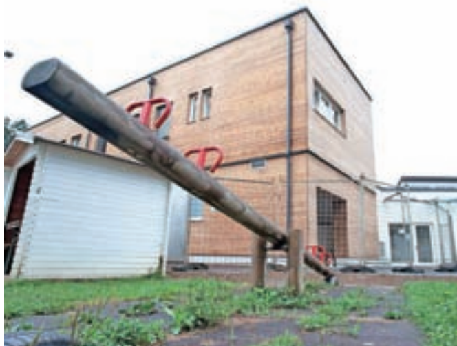
Gradbena dela v vodiškem vrtcu so pri koncu in nove prostore bodo že kmalu napolnili najmlajši.

Poleg velikih projektov pa v občini te dni izvajajo tudi vrsto manjših, a za občane nič manj pomembnih. Avtobusna postajališča opremljajo z nadstrešnicami, zamenjali so dotrajane vodovodne cevi v Repnjah, v Selu pa so zgradili hodnik za pešce.