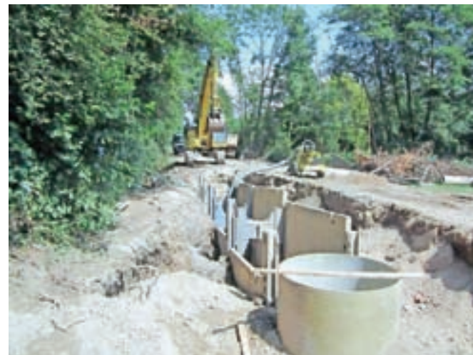
Prvi kilometer od načrtovanih devetih kilometrov kanalizacije v občini Vodice je že zgrajen.

Veliki kohezijski projekt bo potekal v treh fazah, končan pa naj bi bil do leta 2020; v občini Vodice je od skupno devetih kilometrov prvi kilometer že zgrajen. Vrednost projekta za občino Vodice je 5,5 milijona evrov, od tega mora občina sama zagotoviti 1,3 milijona.