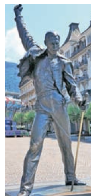
Freddie Mercury v podobi bronastega kipa na obali Ženevskega jezera

Under Pressure. V tem studiu je Freddie maja 1991, pol leta preden je umrl za aidsom, posnel glas za svojo zadnjo pesem Mother Love za album Made in Heaven, ki ga v zadnji verziji ni nikoli slišal. V sobi je mešalna miza, na kateri lahko sami oblikujemo zvok za omenjene pesmi. Album so dve leti