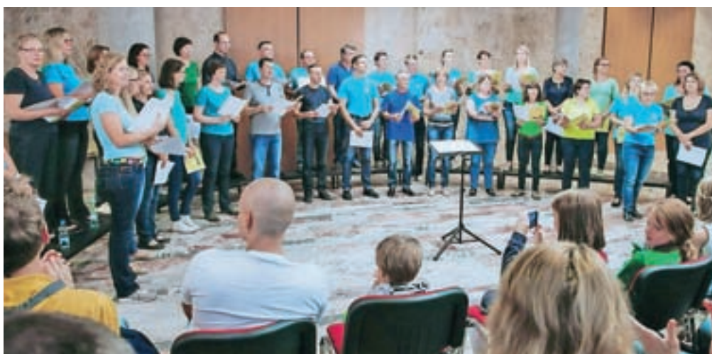
Na sklepnem koncertu so zadonele črnske duhovne pesmi.