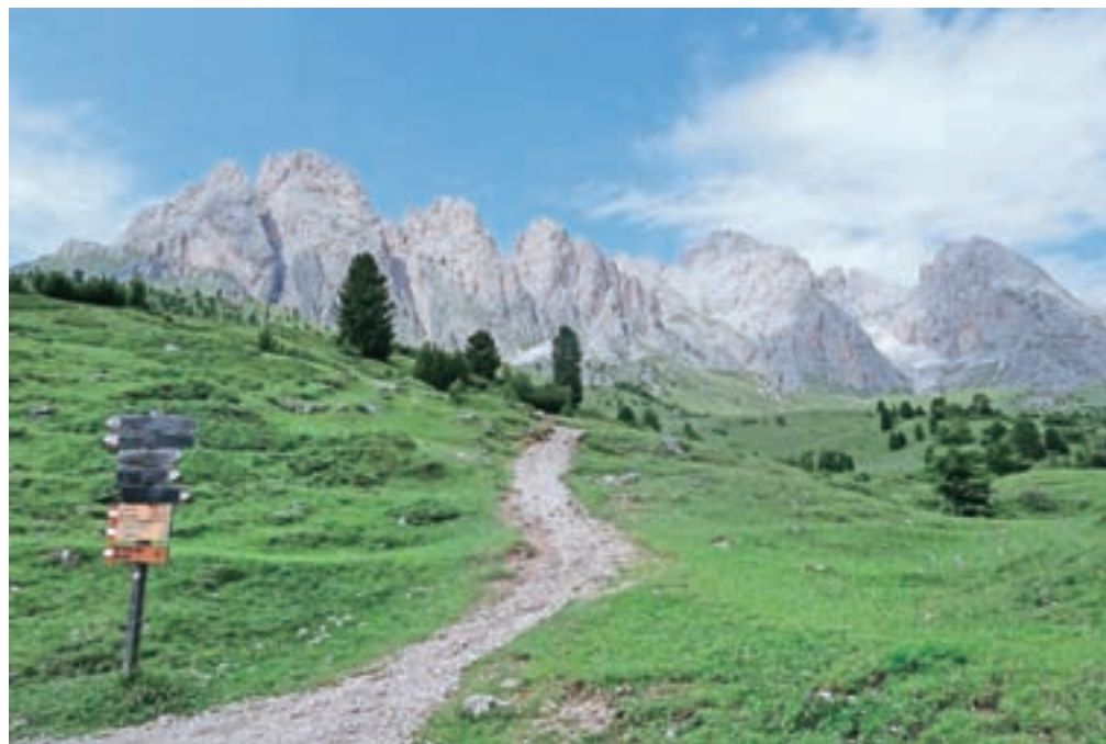
Odle špice, kot jih vidimo ob vzponu. Sass Rigais je desno od sredine fotografije.

Z vrha sestopimo po ozkem in izpostavljenem grebenu, ki je zavarovan, ocena A. Ves vršni del sestopa proti južnemu pobočju ne preseže zahtevnosti A/B, pot je speljana po naravnih prehodih, je pa nekaj kar konkretnih vertikal. Ko dosežemo razpotje, kjer se zavarovani del konča, nas smerokaz opomni, na možnost