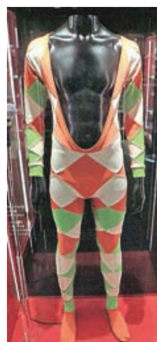
Obleka, ki jo je Freddie nosil na koncertni turneji v letih 1977/78

V nekdanjem studiu je urejen manjši muzej, v katerem je na ogled in v poslušanje zgodovina Queenov v Montreuxu. Na ogled so originalni rokopisi pesmi, ki sta jih večinoma pisala Roger Taylor in Freddie Mercury, nekaj koncertnih oblek slednjega, sedem albumov, ki so jih Queen tu posneli, njihovi instrumenti v studijski postavitvi, prebiramo zanimive anekdote, kot na primer, kako so avgusta 1981 med jam sessionom preko noči Queen in David Bowie napisali in posneli skladbo