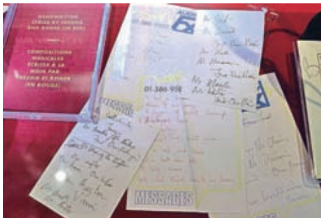
Originalni Freddiejevi zapisi besedila za pesem One Vision