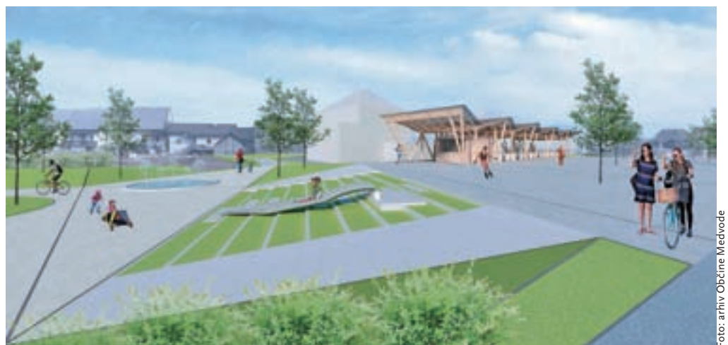
Pogled na prihodnjo novo podobo centra Medvod, ki vključuje tudi ureditev tržnice.

Odprti prostor tržnega prostora bo ureden kot utrjene površine, kjer bodo premične stojnice, in kot zelene površine z avtohtonimi rastlinskimi vrstami. Večnamenska ploščad bo v križišču med Medvoško cesto in Cesto komandanta Stane in bo namenjena občasnim javnim prireditvam, pozimi postavitvi montažnega drsališča, sicer pa rolanju, igranju ... Na zahodnem delu ploščadi bodo stopnice, ki bodo vodile do tržnice in bodo lahko služile tudi za posejanje ali tribune v času prireditve. Med ploščadjo in obstoječim objektom na vzhodni strani se bo