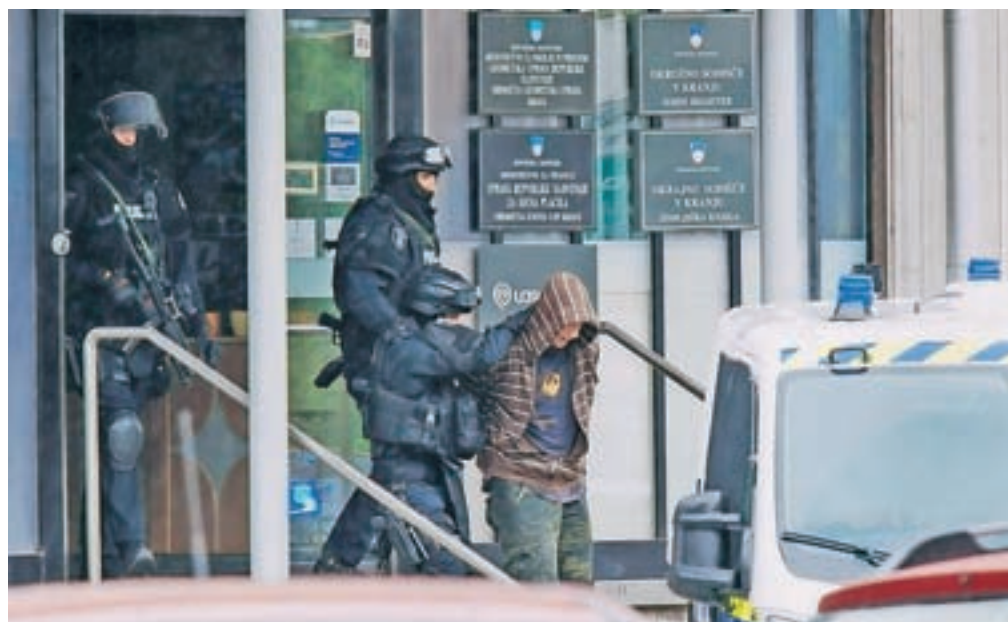
Moški, po naših podatkih naj bi šlo za 48-letnega Kranjčana, se je okoli poldneva predal policijski pogajalki in pripadnikom specialne enote policije.

Kranj – Včeraj okoli pol enajstih dopoldne so policisti bliskovito zaprli širše območje okoli poslovne stavbe na Slovenskem trgu 2 v Kranju, v kateri imata med drugim prostore tudi kranjski izpostavi Ajpesa in Uprave za javna plačila (UJP). Zaradi groznje so stavbo in nekaj bližnjih tudi evakuirali. Po naših informacijah naj bi se 48-letni moški iz okolice Kranja, menda dobro poznan policiji, v četrtem nadstropju, kjer so prostori UJP-a, zaklenil v stranišče in zagrozil z razstrelitvijo.