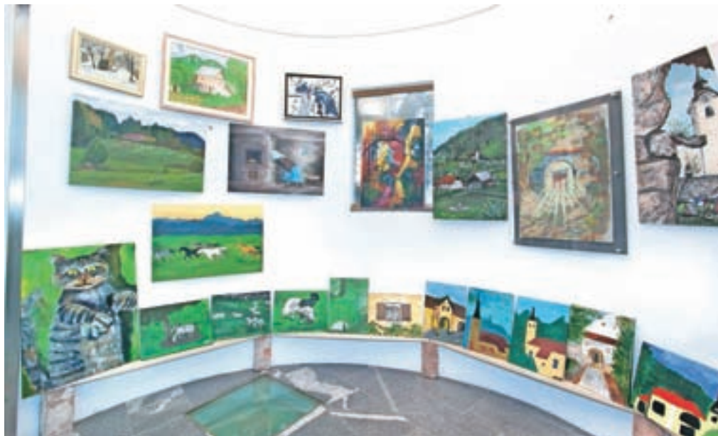
V soboto, 8. septembra, se bo v Kulturnem domu Vodice začel četrti Ex-tempore Vodice, ki letos nosi naslov Dragulji preteklosti.

Osrednja proslava, slavnostna seja s podelitvijo občinskih priznanj, bo v ponedeljek, 10. septembra, ob 19. uri v Kulturnem domu Vodice.