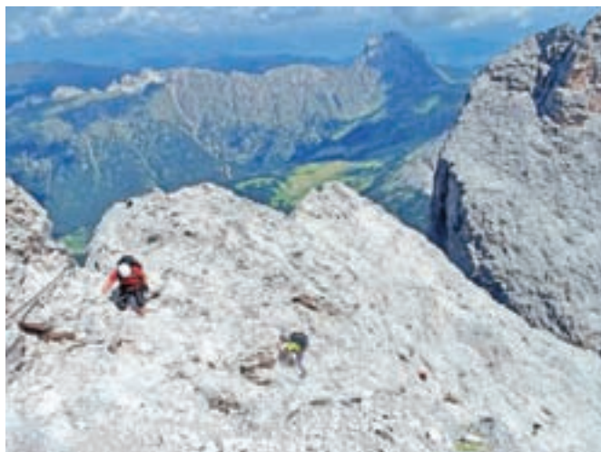
V ferati, ki na vrh pelje po vzhodnem grebenu.

sestopa po srednji poti, t. i. Villnösser ferati, kjer zavijemo desno. A ta pot nas ne zanima. Sestopamo po južnem, zagruščenem pobočju, kjer je ogromno skrota in grušča, zato previdno. Spodnji del sestopa je še zavarovan. Najtežji del je B/C, ko pridemo do lesenega mostička. Prečimo krušljive in zbite grape. Ko dosežemo