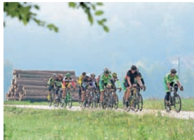
V soboto, 22. septembra, se bodo na sedmi kolesarski dirki Velika nagrada Občine Vodice pomerili najboljši slovenski in tuji kolesarji.

Koala Voice, Red Hot Chili Peppers tribute band Ritam Sex-i-ja in Purple Panic Lady.