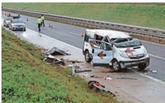
V nesreči kombija pri izvozu Lesce na gorenjski avtocesti je v soboto zjutraj umrl hrvaški državljan.

V nedeljo sta se na gorenjski avtocesti zgodili še dve nesreči, ki sta se k sreči končali brez hujših posledic. Ob 5.20 je pri Vrbi voznik osebnega avtomobila s ceste zapeljal v obcestni jarek, tri ure kasneje pa se je nesreča zgodila še pred galerijo Moste v smeri Karavank. V njej je bilo udeleženo vozilo nemških registrskih oznak z voznico in štiri potniki.