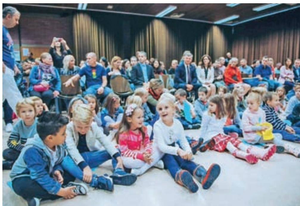
Ob sprejemu prvošolcev je bilo včeraj slovesno tudi v OŠ Franceta Prešerna v Kranju, v katero se je vpisala petdeseta generacija učencev.