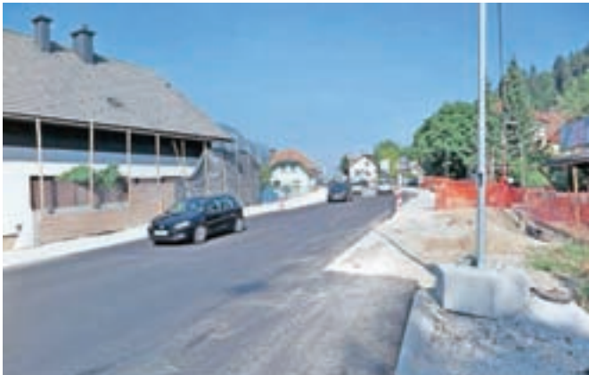
Obnova regionalne ceste skozi Jesenice je zaradi tožbe začasno ustavljena.

Obnova magistralne ceste R2 je ena najpomembnejših investicij v cestno infrastrukturo v občini Jesenice v zadnjem času. Na Občini Jesenice so se za obnovo najbolj kritičnih delov ceste trudili vrsto let. Doslej je država že obnovila odseka Hrušica–Splošna bolnišnica Jesenice in Restavracija Turist–Petrol na Koronški Beli. Zgrajeno je bilo tudi novo križišče na Hrušici.