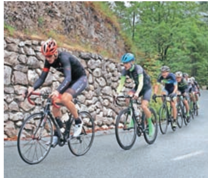
Na Vršič je letos jurišalo 299 kolesarjev, v najboljših letih jih je bilo krepko prek tisoč.

Škrj (Izvir Vipava, 42:43) in Tamara Grm (43:38). Z Vršičem je končan tudi letošnji pokal Schneekoppe (Franja, Alpe, Vršič).