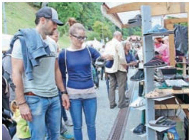
Čevljarstvo dediščino na Tržiškem nadaljujejo večinoma družinska podjetja.

ki so ga ponujali v dobrih tržiških gostilnah,« je tradicijo opisala direktorica tržiške