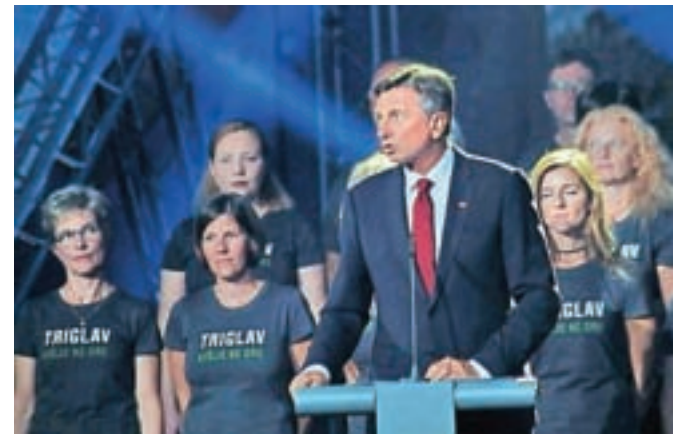
Osrednji govornik na prireditvi je bil predsednik države Borut Pahor.