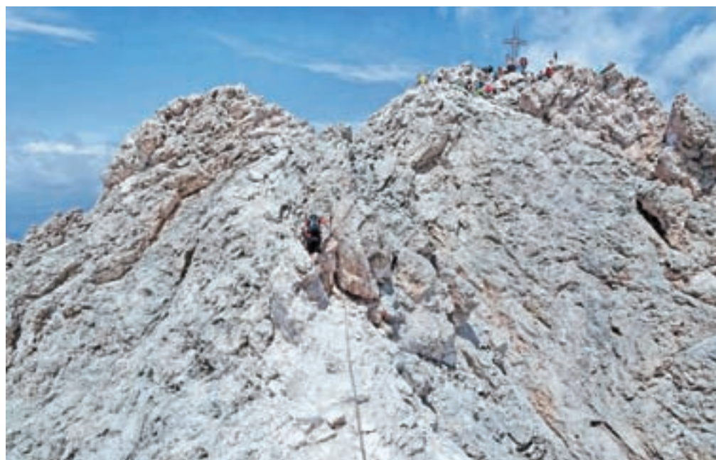
Vrh Sass Rigaisa, kot ga vidimo ob sestopu.