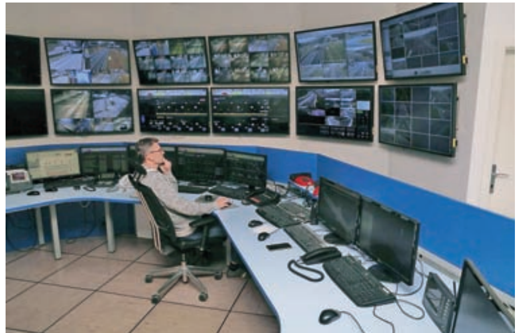
Operaterji pravijo, da je predor Karavanke (pokriva ga več kot dvajset kamer in nadzorni sistem) po prenovi ventilacije in nadzornih sistemov bistveno varnejši.