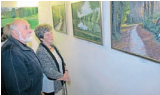
Razstava je deležna številnih pohval.