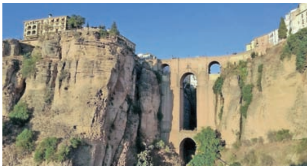
Ronda, mestece s tisočletno zgodovino, eden od biserov barvite Andaluzije. Stari in novi del sta ločena z globoko sotesko in povezana s slikovitim mostom.