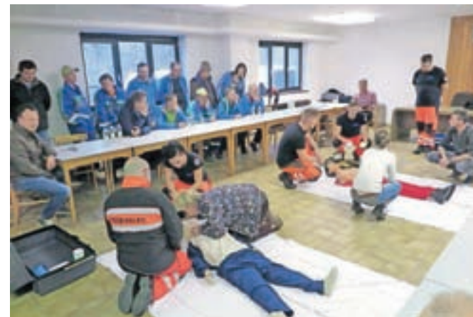
Praktični preizkus oživljanja in uporabe defibrilatorja zaposlenih v Komunalnem podjetju Kamnik

na Cankarjevi cesti in pri tehničnih pregledih v Podgorju. Za zaposlene obeh podjetij so v petek, 10. novembra, pripravili tudi teoretični in praktični prikaz oživljanja in uporabe avtomatskega defibrilatorja, ki so ga pripravili sodelavci Zdravstvenega doma Kamnik.