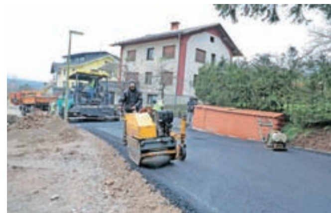
Z asfaltiranjem ceste proti Možjanci so končali drugo fazo gradnje kanalizacije v Tupaličah.