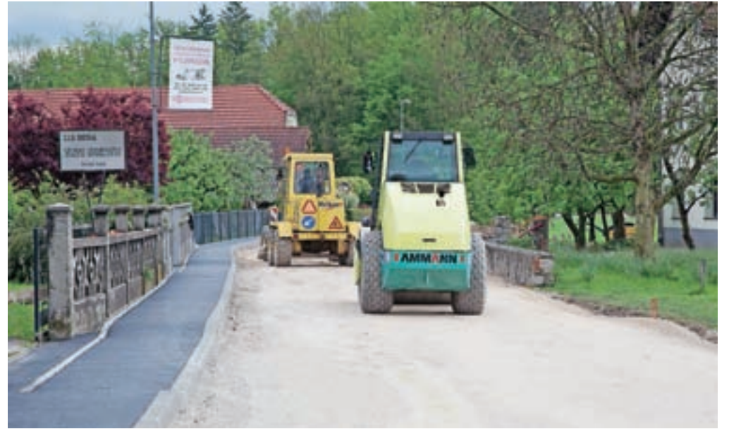
Spomladi so bila dela v občini še v polnem razmahu.

»Prav tako je zaključena sočasna obnova vodovoda in preostale komunalne infrastrukture, ki je potekala ob trasi kanalizacije. Za sočasno izvedbo kableske kanalizacije so bili na nekaterih odsekih tras zainteresirani tudi investitorji optičnega omrežja in TK-omrežja, v manjšem obsegu je