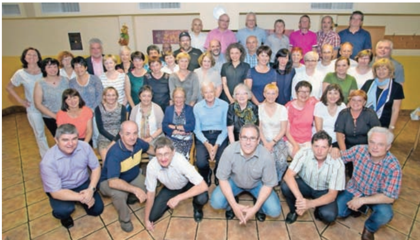
Da spomini ne bodo prehitro zbledeli, bo poskrbela tudi fotografija, ki je ob nastala ob srečanju.

Večer, ki se je prevesil v noč, je minil hitro. Dogovorili so se, da se naslednjič srečajo čez pet let in ne deset, kolikor je minilo od njihovega zadnjega srečanja.