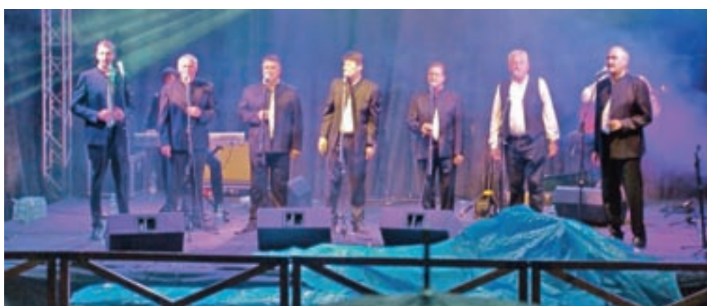
Kljub dežju je več kot tisoč obiskovalcev s klapami vztrajalo do konca.

občinstvu, je povedal, da še nikoli ni bil na koncertu s toliko pozitivne energije, ki je premagala temne dežne oblake, ter dodal, da škofjeloškemu občinstvu ni enakega in da je bil nad njim popolnoma navdušen. Izkazalo se je, da je tudi drugi dalmatinski večer s klapami izredno uspel, tako da organizatorji verjamejo tudi v nadaljnja tovrstna druženja, ki jih povezuje večni dalmatinski melos.