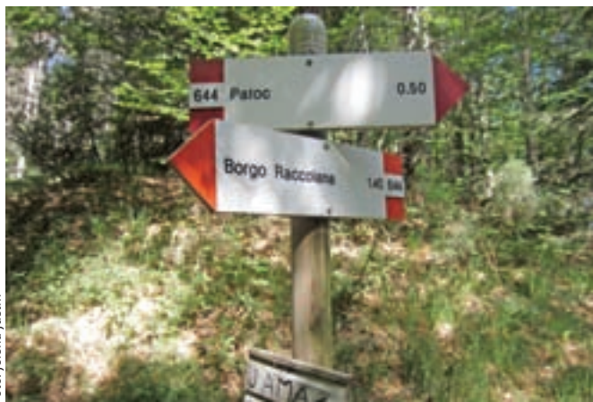
Gozdno sedelce, kjer zavijemo levo na neoznačeno pot.

Z vrha se vrnemo nazaj do gozdnega sedla, kjer nadaljujemo levo proti vasi Patoc, na drugi strani gore, proti skriti gorski vasi, ki je z avtomobilom dosegljiva iz Reklanske doline. Asfaltne ceste dosežemo na zadnjem ovinku pred vasjo in se po cesti sprehodimo do vasi. Hodimo mimo parkirišča po poti št.