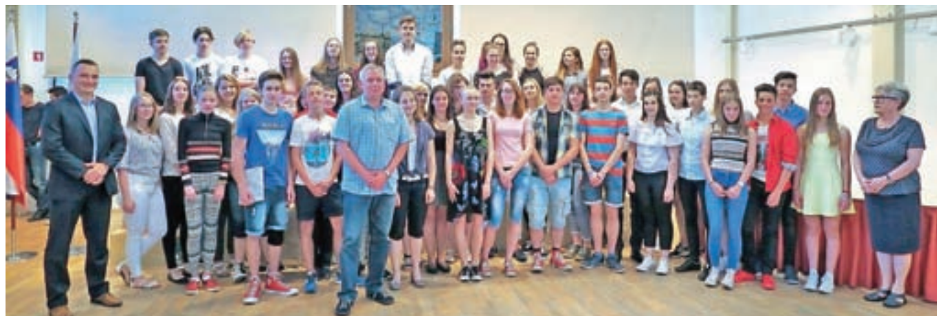
Najboljši jeseniški učenci in dijaki z županom in podžupanoma

Duša slovenska, jim zaželel veliko uspeha in sreče na nadaljnji poti, za kulturni program pa so poskrbeli učenci Glasbene šole Jesenice.