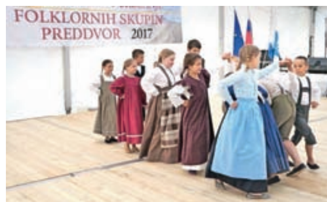
Za uvod v folklorno popoldne so poskrbeli najmlajši: Mlajša otroška skupina Folklornega društva Preddvor.