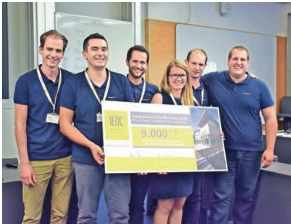
Zmagovalna ekipa iz podjetja Iskraemeco