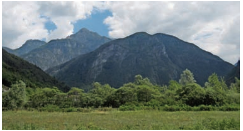
Pogled na poraščeno Monte Jama

nas opomni, da je bila to nekoč verjetno pot, ki so jo uporabljali prebivalci vasi Patoc, ko so v dolino Bele odhajali po opravkih. Ko višina malce popusti in preči pobočje, pridemo do hudourniške grape, ki jo prečimo. Od tu dalje pot postane strma, zares strma. Steza je tudi slabše ohranjena, deloma zaraščena. Vmes na poti so tudi skale, kar zna biti po dežju problematično zaradi nevarnosti zdrsa. Strma pot preči grapo potoka Agadoris. Nato sledijo lepi, zložni okljuki, ki nas pripeljejo na gozdno sedelce, na višini 1089 m. Markirana pot naprej nas vodi do vasi Patoc, mi pa zavijemo levo, strmo navzgor, po sicer neoznačeni poti, z lesenim smerokazom sicer nakazani, ki pa je lahko sledljiva. Vrh je pravzaprav sredi gozda, označuje pa ga velik kovinski križ, v spomin na Marca Solarija. Če od križa nadaljujemo še malce proti zahodu in se spustimo do travnika, smo na vzletišču za jadralne padalce, kjer se nam odpre čudovit razgled. Pod nami se razprostira dolina Bele s Karnijskimi Alpami, med katerimi dominantno izstopita Amariana in Zuc dal Bor.