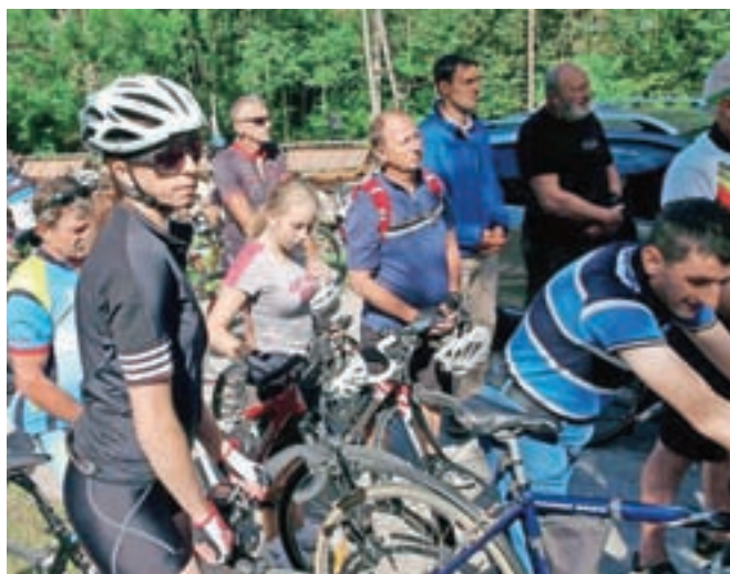
Blagoslov koles v Kokri