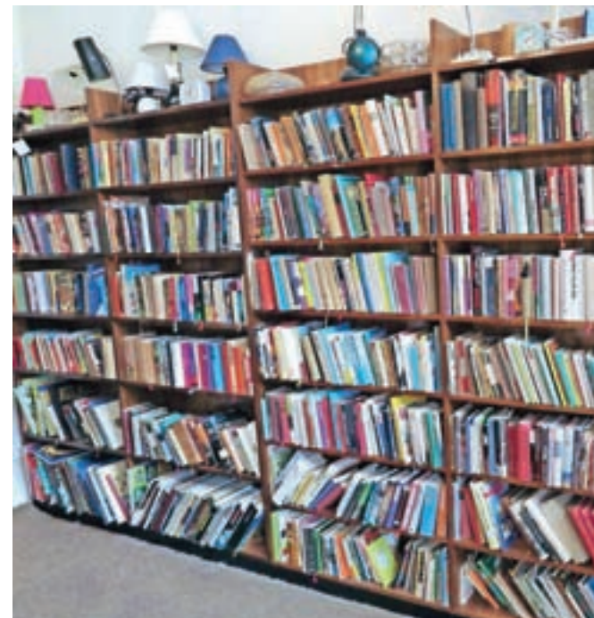
»Knjižnica« s policami, polnimi knjig