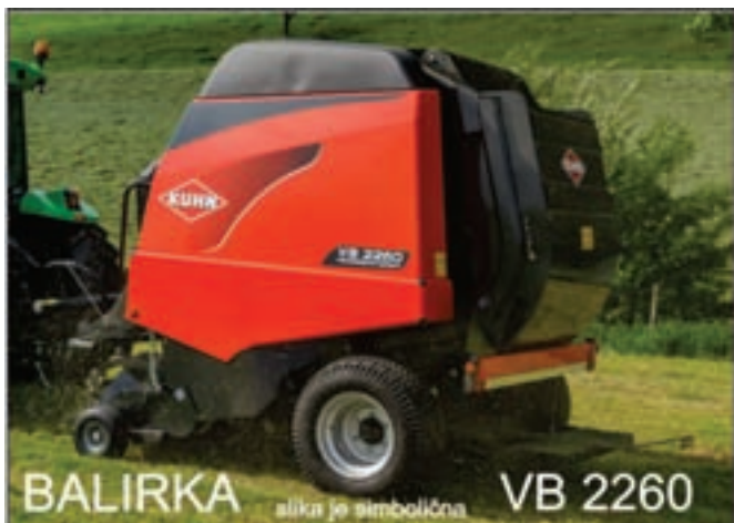
BALIRKA alika je simbolična VB 2260

VT 50 barvni terminal Vežanje z mrežo Neskončni jermeni Centralno mazanje verig Kolesa 19.0/45-17 Hidravlične zavore Pogon valja za silažo Nastavitev tlaka iz kabine akcija balirke, vrtavkaste brane, kosilnice