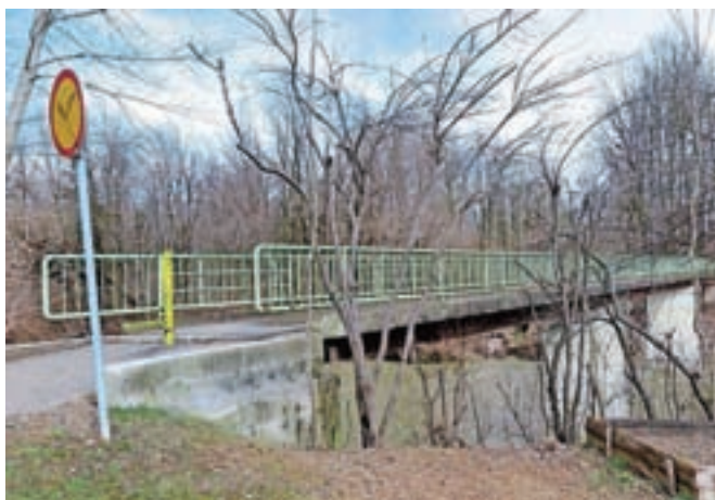
Rekonstrukcija Mlinarske brvi je le še eden v nizu projektov urejanja rekreacijske poti ob Kamniški Bistrici, ki mu Občina Domžale v zadnjih letih posveča veliko pozornosti.