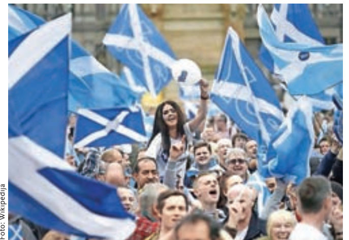
T2 Trainspotting se dogaja v Edinburgu na Škotskem. Škoti pa so povečini proti brexitu in za neodvisno Škotsko v EU.