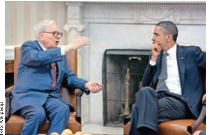
Ameriški milijarder Warren Buffet je kritičen do Donald Trumpa, s predsednikom Obama pa je bil v dobrih odnosih.