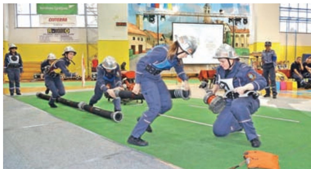
Za gasilstvo se odloča vse več deklet. Na tekmovanju v Cerkljah so našli kar 35 ekip članic.

Dobri rezultati zaloških gasilcev so v veliki meri rezultat dobrega dela z mladimi in trdega treninga, je prepričan predsednik društva, ki se že pripravlja na naslednje projekte, med drugim tudi tradicionalno gasilsko veselico, ki bo med prvomajskimi prazniki v Zalogu.