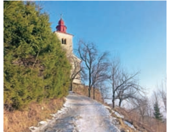
Dobrodelni marec se bo začel s pohodi na Sv. Primoža nad Kamnikom.

Zbrana sredstva bodo tudi letos podarili socialno ogroženim posameznikom, družinam ter tudi živalim iz občine Kamnik in širše. Na zbirnih mesetih bodo namreč ves mesec