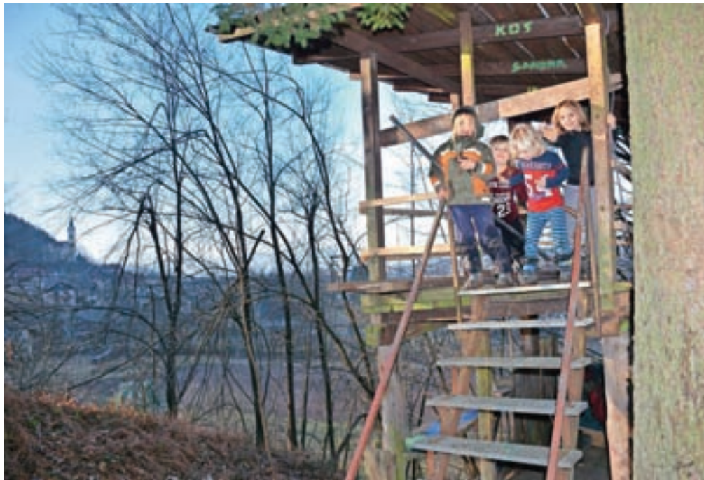
Na območju nastajajočega doživljajskega igrišča je tudi stolp nekdanje skakalnice v Sori, ki ga otroci radi uporabljajo.

Njihova posebnost je tudi v tem, da imajo poleg predšolskih otrok tudi štiri šestletnike, ki so vpisani v šolo, a je ne obiskujejo. Imajo status šolanja na domu. »To so naši Zvedavi zmaji, ki v Središču za naravno učenje Samorog usvajajo potrebna znanja iz šolskega programa na nevsiljiv način, kot stranski produkt igre in raziskovanja. Otroci večino časa preživijo na prostem, v prostorih