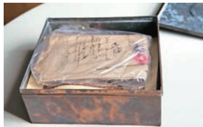
Bakrena škatla z dragoceno vsebino

znanih sredi prihodnjega tedna, ko naj bi gimnazija sklicala novinarsko konferenco.