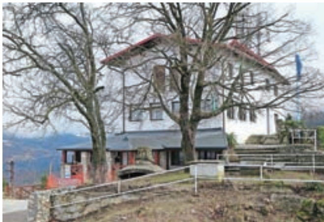
Nekdanje priljubljeni Stari grad že nekaj let sameva; težko pričakovana obnova se je v teh dneh le začela.

Po udarniški čistilni akciji številnih Kamničanov pred dvema letoma so se vprašanja, kdaj bo gostišče znova zaživele, na občini kar vrstila, prav tako je upanje po oživitvi te lokacije zbudila občinska proslava ob prvem maju lansko leto. A gradbena in obnovitvena dela se kar niso začela. »Žal so nas postopki izdelave projekta in druge ovire zadrževali,