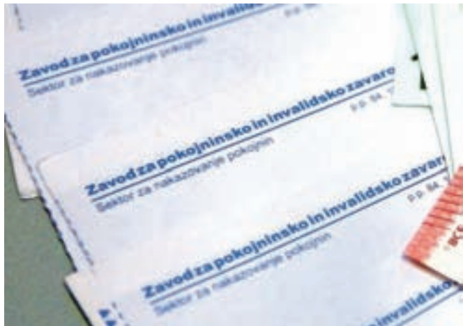
Zavod za pokojninsko in invalidsko zavarovanje bo tudi prihodnja štiri leta vodil Marijan Papež.