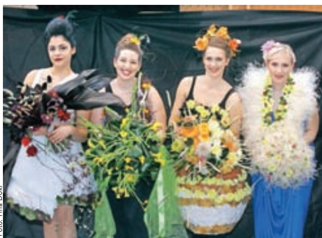
Štirje cvetlični letni časi: zima, pomlad, jesen in poletje