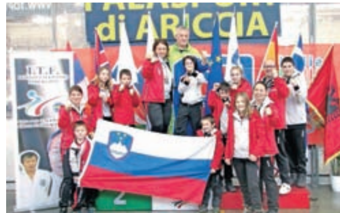
Uspešna ekipa Taekwondo kluba Radovljica v Rimu