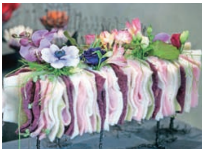
... in materiale na področju oblikovanja cvetja.