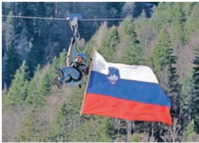
Izbris iz registra stalnih prebivalcev je temen madež nastajanja samostojne države.