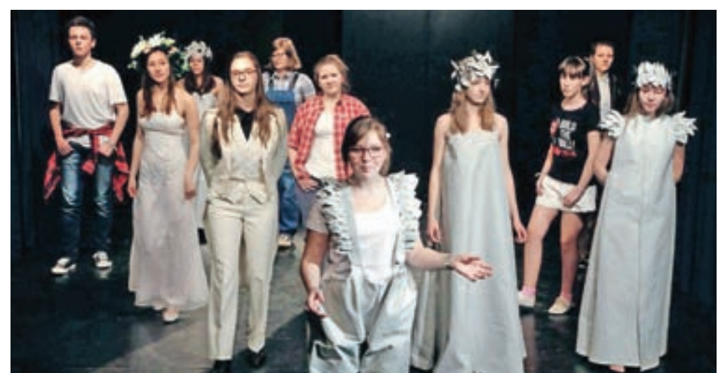
Sen kresne noči na šentjanškem odru