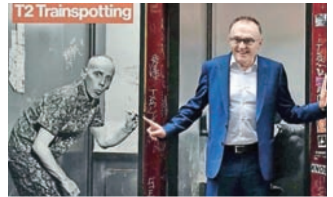
Danny Boyle (1956), režiser kultnega britanskega filma Trainspotting, 1996. V kinodvorane prihaja nadaljevanje: T2 Trainspotting.

»Ameriška ekonomija ima čudežne lastnosti; Amerika združuje človeško iznajdljivost, tržni sistem, plimo nardarjenih priseljencev in vladavino prava in lahko proizvede blaginjo, ki je večja od tiste, o kateri so lahko sanjali naši predniki.« To trdi ameriški milijarder Warren Buffet. Letno poročilo o uspešnem poslovanju družbe Berkshire Hathaway je pospremil s odmevnim pismom, v katerem kaže svetlo podobo ameriškega gospodarstva, nasprotno od temne, ki jo je v svoji kampanji slikal predsednik Donald Trump.