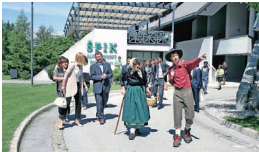
Hotel Špik naj bi postal tako imenovani healthness resort, iz hotela za preživljanje prostega časa ga preusmerjajo v platformo za spreminjanje življenjskih navad, napovedujejo novi lastniki.

Družba Hit Alpinee je v zadnjih dveh letih z doslednim udejanjanjem ukrepov procesa prestrukturiranja bistveno izboljšala poslovne kazalnike in rezultate iz tekočega poslovanja. Po prvih ocenah poslovanja je družba Hit Alpinee v letu 2016 prihodke v primerjavi z letom prej povečala za 14 odstotkov, rezultat iz poslovanja pa izboljšala kar za 28