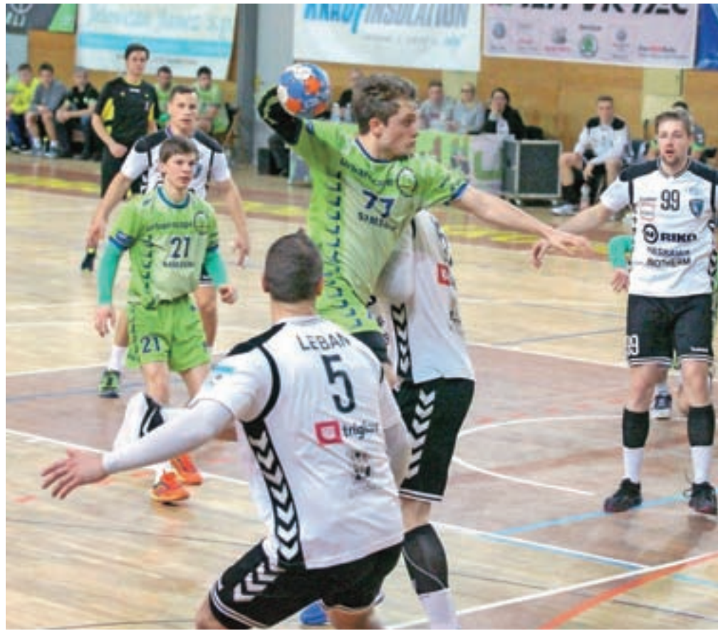
Sredin rokometni obračun v Škofji Loki se je končal z zmago domače ekipe.

V začetku drugega polčasa so Ribniččani izenačili na 17 : 17, nato pa so si domači rokometiški s požrtvovalno igro v 46. minuti priigrali