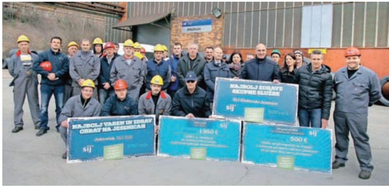
Ob zaključku akcije, s katero spodbujajo varnost in zdravje pri delu, so nagradili zaposlene, del sredstev pa so podarili tudi poklicnim gasilcem GARS Jesenice in SPV Jesenice za vzgojo otrok v prometu.

V največjem jeseniškem podjetju SIJ Acroni so nagradili najbolj varen proizvodni obrat in najbolj zdrave skupne službe. To sta obrat Jeklovlek in uprava SIJ Elektrode Jesenice.