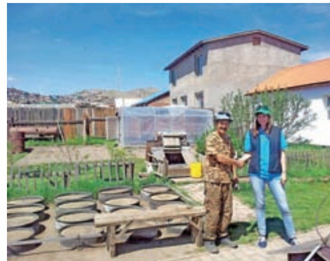
Nadzorni obiski upravičencev projekta ADRA