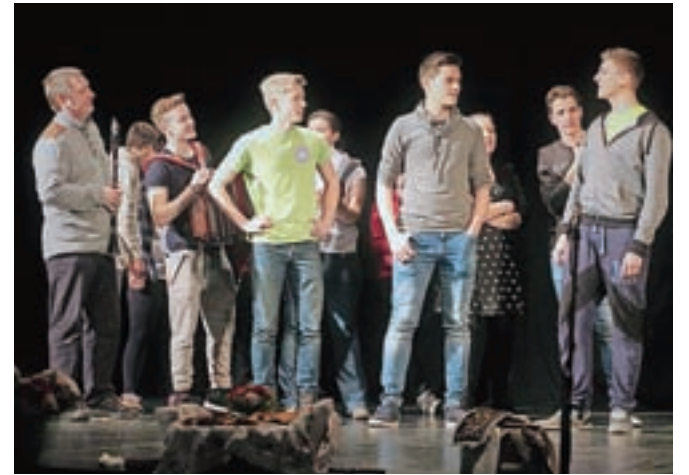
Še generalna vaja pred glavnim nastopom. Na Ohcet so se namreč pripravljali kar nekaj mesecev. Ker je bila pevka plat v društvu zelo »podhranjena«, so se morali petju posvečati intenzivneje.

Lani je KUD Triglav predstavil koncert Bliža se železna cesta, ki je bil namenjen 110. obletnici odprtja Bohinjske proge. Markič smeje pove, da se je prvič zgodilo, da so ga ljudje takoj po koncertu spraševali, kdaj bo ponovitev, kar je bil dokaz, da je bil folklorni večer pri obiskovalcih izjemno dobro sprejet. Na letošnjem folklornem večeru smo slišali še več pesmi. Markič pravi, da na porokah oziroma »ohceti« pogreša petje. Tisto pravo, pristno. »To me je