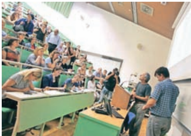
Slovenskim univerzam (fotografija je z ene od ljubljanskih fakultet) se je pridružila še ena – Nova univerza.