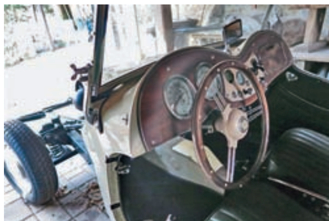
MG je vzbudil njegovo strast do starodobnikov. Enega ima prav ta čas pred hišo v delu.