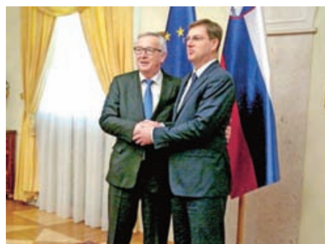
Predsednik Evropske komisije Jean-Claude Juncker in predsednik slovenske vlade Miro Cerar

Predsednika Evropske komisije so včeraj z vojaškimi častmi sprejeli na Brdu. Srečal se je z gostiteljem, predsednikom vlade Miro Cerarjem, predsednikom državnega zbora Milanom Brglezom in s predsednikom republike Borutom Pahorjem. Pomemben del obiska je tudi dialog z mladimi. Danes se šef Evropske komisije v