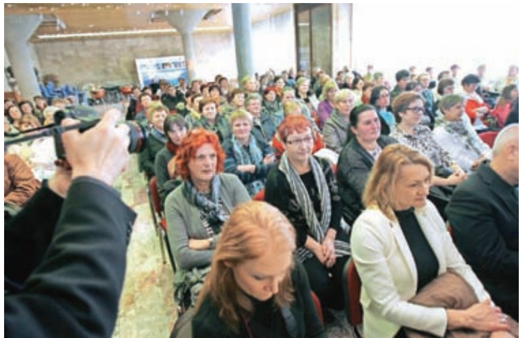
Kmečke žene so lepo proslavile 40-letnico delovanja društva.

Številni gostje, ki so se udeležili slovesnosti ob jubileju društva, so pohvalili društvo in kmečke žene za prostovoljno delo in složnost, iz številnih izrečenih besed pa jim je »godila« misel: »Društvo vam ob vsem delu na kmetiji, v gospodinjstvu in v družini omogoča, da imate vsaj pet minut časa zase.« Kmečke žene so si tudi za praznovanje vzele čas, se zahvalile vsem, ki jim kakorkoli pomagajo, in prisrčno zaploskale sodelujočim v kulturno-zabavnem programu – pevskemu zboru Regine, kurentom ter Andreju Šifrerju in njegovemu prijatelju iz Amerike.