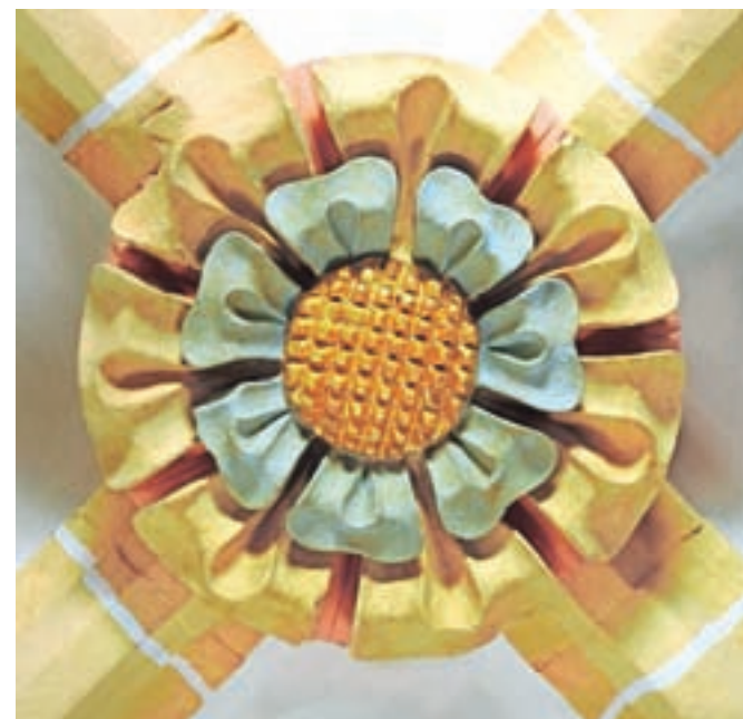
Sklepnik oboka severne pole pevske empore v obliki cveta divje rože

mogoče določiti spodnjo časovno mejo (terminus post quem). Listina namreč posredno govori o pripravah na gradbena dela in njihovem financiranju.«