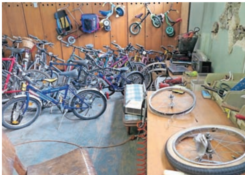
»Kolesarnica« z obnovljenimi kolesi