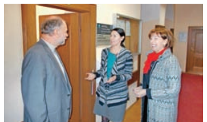
Ob odprtju nove finančne pisarne v prostorih Upravne enote Škofja Loka

Škofja Loka – Od 1. marca Finančna pisarna Škofja Loka deluje na novi lokaciji. Z nekdanje lokacije na Kapucinskem trgu se je preselila v nove prostore na Upravni enoti Škofja Loka, Poljanska cesta, 2. nadstropje, soba 214. Uradne ure ostajajo nespremenjene: odprta je vsako sredo v mesecih januar, februar, april in junij, vsako prvo in tretjo sredo v mesecih marec, maj, september, oktober, november in december, in sicer od 7. do 12. in od 13. do 17. ure, julija in avgusta pa je zaprta. Pisarno so namenu skupaj s sodelavkami predali Jana Ahčin, generalna direktorica Finančne uprave Republike Slovenije, Julijana Povše, direktorica Finančnega urada Kranj, in Miha Ješe, župan občine Škofja Loka. »Finančna pisarna v Škofji Loki v času uradnih ur beleži izjemno visoko število strank, saj pokriva Škofjo Loko z velikim zaledjem v obeh dolinah oziroma območje štirih občin. V prijaznejših in bolj urejenih prostorih bo zavezancem omogočena boljša dostopnost do storitev na enem mestu,« ob odprtju nove pisarne sporočajo z Občine Škofja Loka.