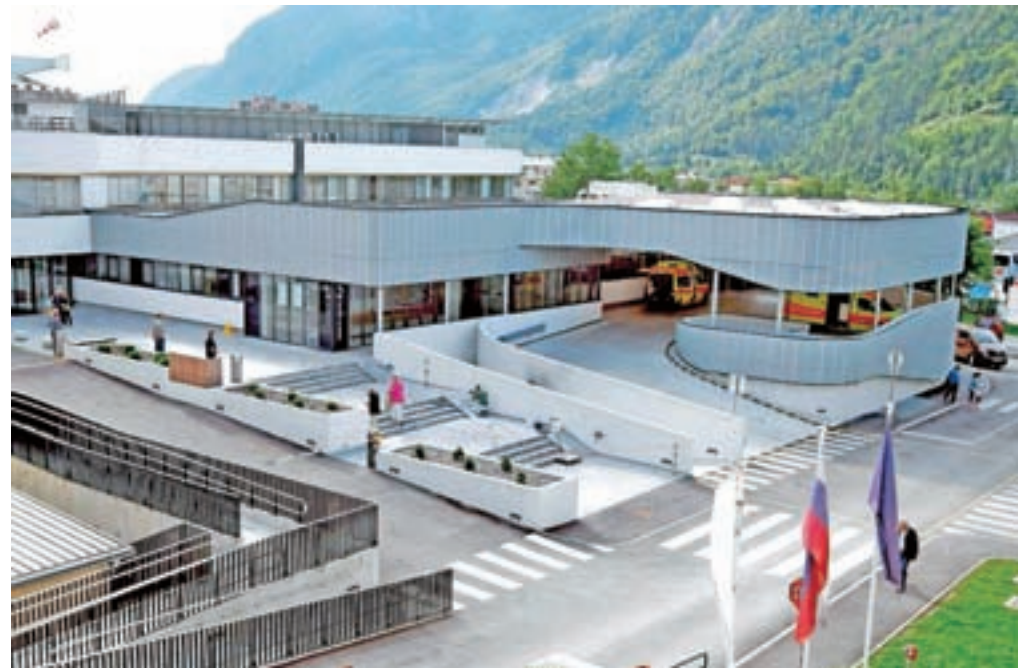
Se bo Splošna bolnišnica Jesenice širila na sedanji lokaciji ali bo država regijsko bolnišnico gradila kje drugje, denimo v Radovljici?