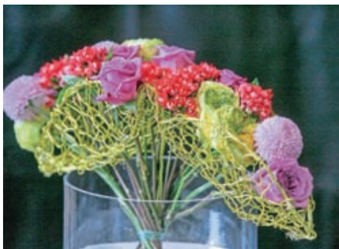
Trendi v floristiki napovedujejo nove smernice ... / Foto: Tina Dokl