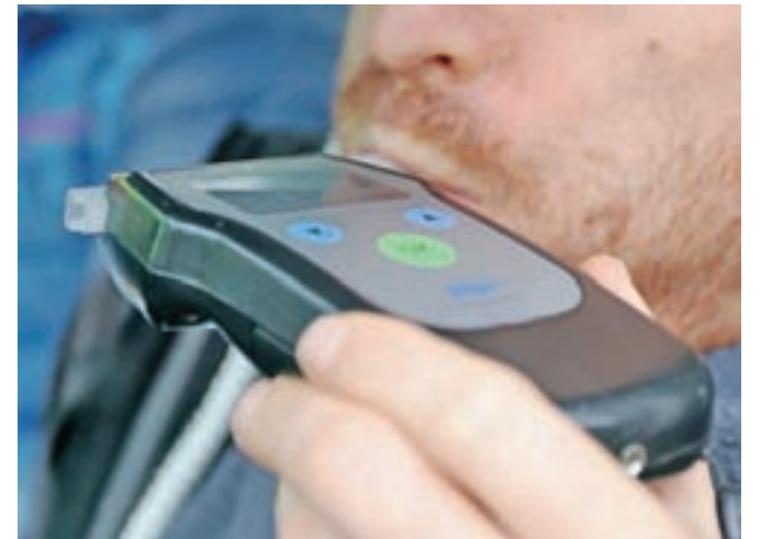
Tveganje zaradi alkohola v prometu je preveliko, zato je sprejemljiva le ničelna toleranca.

Letošnji slogan akcije je »Izberi prav. Bodi z mano.« Z njim organizatorji želijo poudariti predvsem ožje medosebne odnose kot najpomembnejše pri podpori posamezniku, da se odloči za zmanjšano pitje alkohola.