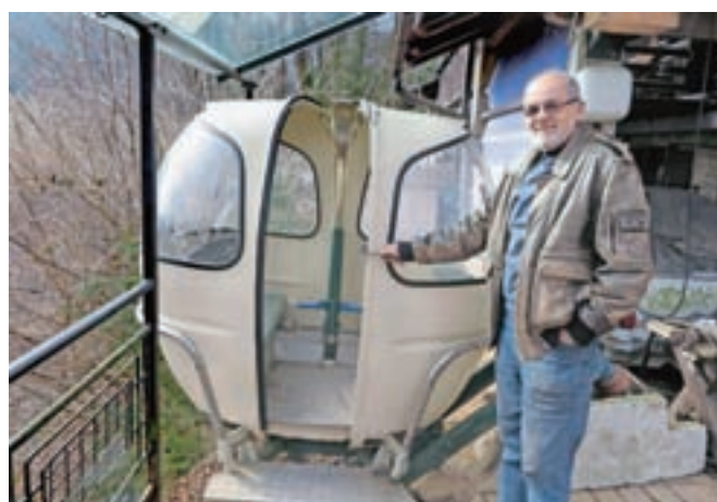
Posebna atrakcija je tudi vzpenjača, ki vodi do garaže.

Tako kot vse druge avtomobile, ki so mu sledili, je tudi tega obnovil povsem sam. Lomax je bil namreč šele začetek, misel na MG pa mu še vedno ni dala miru, zato ga ni nehal iskati in kmalu se mu je nasmehnila sreča. »Najprej sem bil zadovoljen s kopijo, potem pa sem jih tudi po več enkrat naročal iz Anglije,« je pojasnil Kavčič. Uredil si je delavnico in garažo, v kateri hrani svoje jeklene lepote. Za pravo atrakcijo se je izkazal