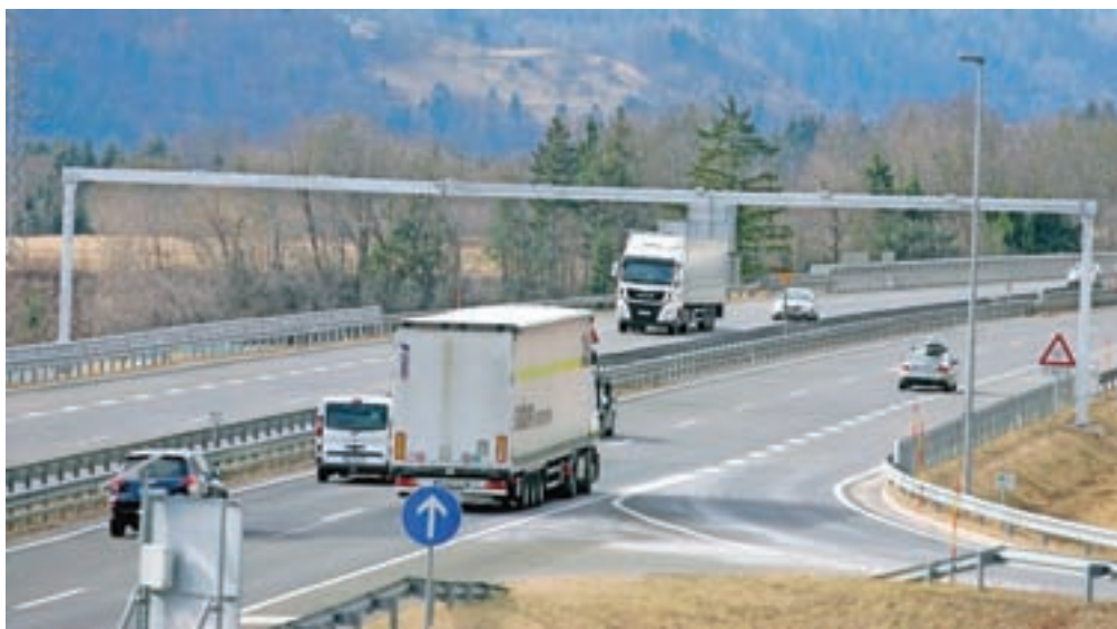
Na gorenjski avtocesti je predvidenih dvanajst cestninskih portalov za težka vozila. Prvega so postavili na Brezjah, nadaljevati pa nameravajo v drugi polovici marca.

V prostem prometnem toku bodo zbirali cestnino od vozil z največjo dovoljeno maso nad 3500 kg (tovornjaki, avtobusi in druga nevinjetna vozila), ki se jim ne bo več treba ustavljati pred zapornicami cestninskih postaj. Te bodo zaradi vzpostavitve elektronskega cestninskega sistema lahko postopoma odstranili. V portale bo vgrajena t. i. DSRC-tehnologija, ki