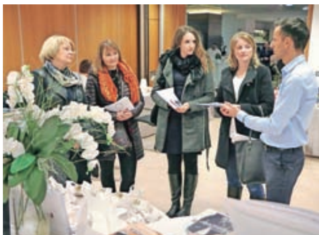
Poročna moda (obleke, nakit, čevlji, dodatki) je zanimala tudi dame iz Radovljice.