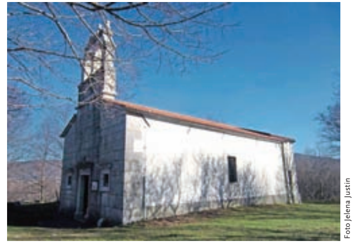
Cerkev Marije Snežne na Gradišču nad vasjo Prapoče

Z vrha sestopimo proti zahodu in ko markirana pot zavije desno proti Črnemu Kalu, mi previdno splezamo čez skalni rob in dosežemo kolovoz. Na njem se usmerimo levo in se vračamo nazaj proti vasi. Ko se kolovoz združi z makadamsko cestoto, se začnemo spuščati po