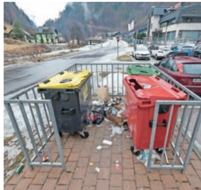
Ekološki otok pri nekdanji Tehtnici bodo zaradi nenehnega pojavljanja nesnage ukiniteli.

način so namreč rešili problematiko odlaganja vreč s smetmi na ekološkem otoku ob lokalni cesti Šurk–Ravne, ki so ga prestavili, da ni bil več viden z glavne ceste. »Če ustrezne lokacije ne bo možno dobiti, bomo zabojnike prestavili na druge ekološke otoke,« je napovedal župan. Težave imajo sicer tudi na ekološkem otoku na začetku naselja Na plavžu, a o njegovem umiku ne razmišljajo, vsekakor pa ga bo treba odstraniti ob izgradnji obvoznice, je povedal župan. Dodal je še, da je sicer lokacija pri Tehtnici bolj na udaru, saj je tam prvi ekološki otok, na katerega naletijo izletniki na poti iz zgornje dela Selške doline.