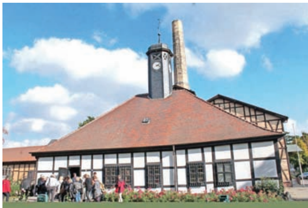
Muzej, posvečen tehniki in soli, v mestu Halle (Saale)

posebna oblačila takratnega solnega bratstva – ljudi, ki so pridelovali sol – slišali tudi zgodbo o ljudeh, proizvodih, oblačilni kulturi in še marsičem. Seveda pa nismo mogli mimo trgovinice s spominki, kjer so danes naprodaj številne vrste soli v različnih embalažah: od običajne kuhinjske soli, grobo ali fino mlete, do kombinacij s česnom, poprom, zelišči, posebej za paradižnikovo solato, ponujajo pa tudi odišavljeno, za »crkljanje« v kopalni kadi. Cene so seveda »muzejske«. Zato pa jeokus na domači mizi potem drugačen, saj je hrana soljena s posebno soljo: naravnost iz halskega solnega muzeja v Nemčiji. (Konec)