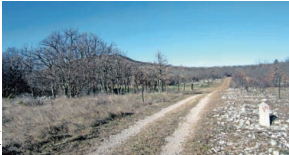
Markacija na kamnitem bloku Rižanskega vodovoda. Gradišče je vzpetina pred nami.

Nadmorska višina: 478 m Višinska razlika: 150 m Trajanje: 3 ure Zahtevnost: ★★★★★ z izjemo sestopa čez Steno