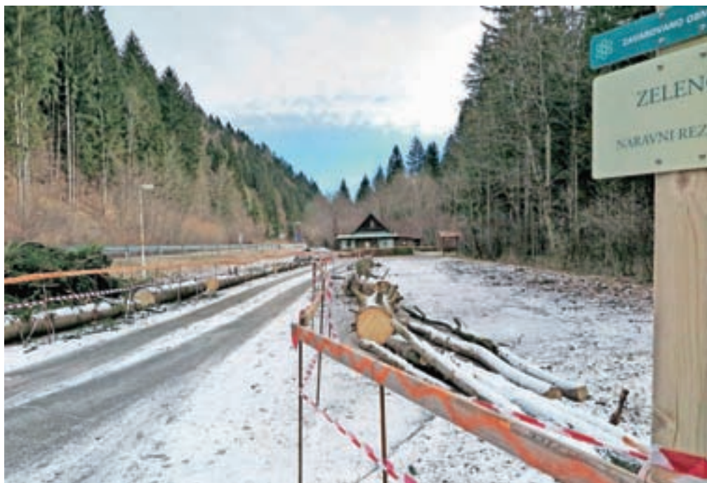
Sporno parkirišče na vstopu v naravni rezervat Zelenci

Parkirišče na drugi parceli, ki ni predmet zakupa in za katerega v AS Podkoren trdijo, da ga je kljub prepovedi uporabljala za svoje potrebe, pa AS Podkoren potrebuje za namen spravlja lesa, ki ga je bilo v Zelenicah in drugih gozdnih