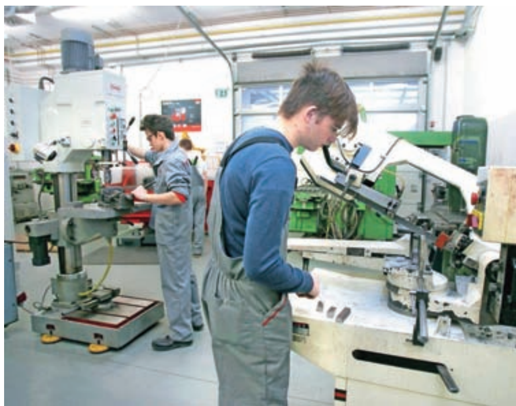
V Šolskem centru Škofja Loka bodo program oblikovalec kovin-orodjar po novem lahko izvajali tudi v vajeniški obliki.

evrov, v drugem letniku 300 evrov in v tretjem letniku 400 evrov. Vajencu pripada tudi povračilo stroškov prehrane in prevoza na delo. Delodajalce, pri katerih so na voljo vajeniška učna mesta, kandidati lahko najdejo na spletni strani ministrstva za izobraževanje, seznam pa sproti dopolnjujejo. Šole, ki bodo izvajale vajeniško obliko izobraževanja, bodo izvajale tudi običajno šolsko obliko izobraževanja, v sklopu katere se praktično usposabljanje z delom pri delodajalcih izvaja na podlagi kolektivne ali individualne učne pogodbe. "Obe obliki izobraževanja, tako vajeniška kot šolska, sta si ena-