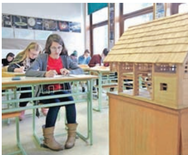
Na Srednji ekonomski, storitveni in gradbeni šoli v Kranju so minulo sredo gostili 14. državno tekmovanje za srednješolce v ekoznanju.