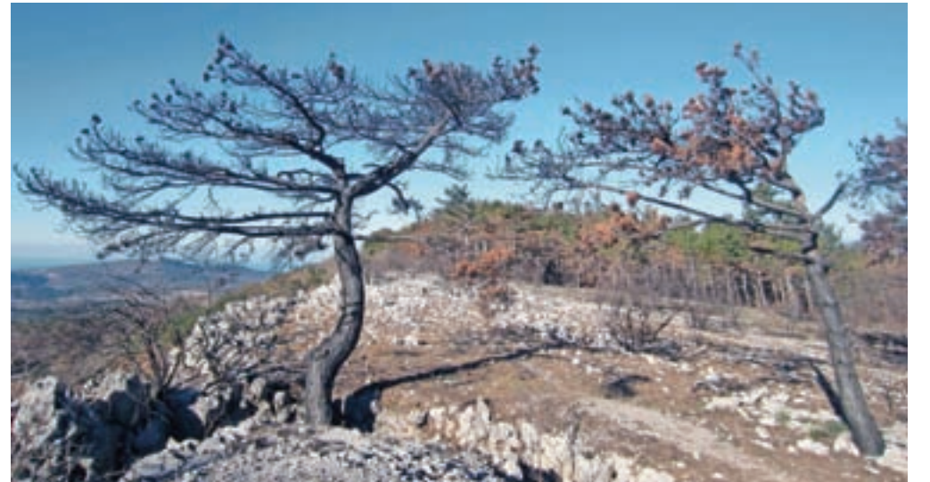
Posledice ognjenih zubljev na poti na Zjat