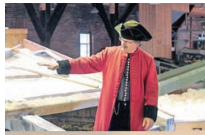
Izvedeli smo marsikaj o tehniki pridobivanja soli.