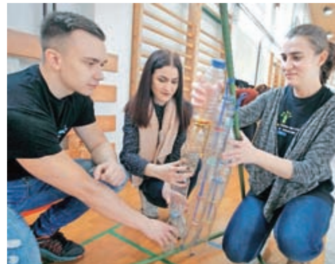
Dijaki so se lotili gradnje "plastenjaka".

re so morali znati odgovoriti dijaki na tokratnem Ekokvizu za srednje šole, ki je eno izmed najbolj razširjenih tekmovanj o okoljskih temah, ki ga v okviru mednarodnega programa Ekošola organizirajo od leta 2003. Dijaki se najprej pomerijo na šolskem tekmovanju, trije z najvišjim številom točk v posamezni kategoriji pa se uvrstijo na državno tekmovanje. Šolsko tekmovanje so organizirali 13. decembra lani, na njem je sodelovalo kar 2620 dijakov. Letos so za Ekokviz za dijake izbrali tri interdisciplinarnе teme, ki zahtevajo povezovanje znanja z različnih področij in ki kažejo na vplive našega delovanja tudi globalno. "Na tak način želimo predvsem ozaveščati mlade, kako velik učinek ima lahko že majhen ukrep. Želimo, da bodo svoje znanje uporabili pri svojem delu in da ga bodo prenesli