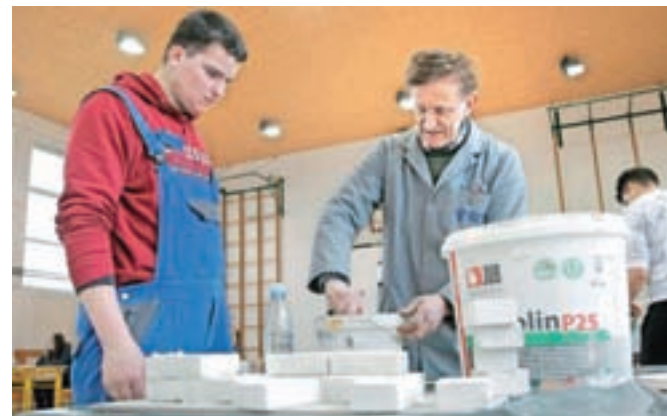
Število vpisnih mest v javnih višjih strokovnih šolah je največje v študijskih programih s področja tehnike, proizvodne tehnologije in gradbeništva (fotografija je simbolična).

Za izobraževanje v skupaj 49 višjih strokovnih šolah, 29 javnih in 20 zasebnih, od tega dveh s koncesijo, je skupaj razpisanih 12.572 mest za 33 različnih študijskih programov. V primerjavi s prejšnjim študijskim letom je za študente višjih šol ponujenih manj vpisnih mest, lani jih je bilo namreč 12.877. Za redne študente je v javnih in šolah s koncesijo razpisanih 4155 mest (lani 4175), za izredne pa 3780 vpisnih mest (lani 3875). Ponudbo vpisnih mest za izredne študente dopolnjujejo zasebne višje strokovne šole, ki razpisujejo še 4637 vpisnih mest. Število vpisnih mest v javnih višjih strokovnih šolah je največje v študijskih programih s področja tehnike, proizvodne tehnologije in gradbeništva in letos znaša 34,28 odstotka razpisanih mest za redni in izredni študij. Kandidati se lahko prijavijo v dveh prijavnih rokih, in sicer od 13. februarja do 8. marca ter od 28. avgusta do 1. septembra. Na višjih strokovnih šolah bodo informativna dneva pripravili v petek, 10. februarja, in v soboto, 11. februarja.