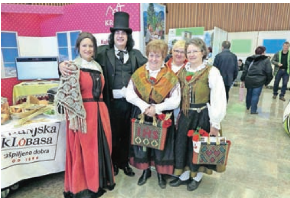
Kranjčani so s svojo Julijo in Prešernom vabili v gorenjsko prestolnico.

Sejem Natour Alpe-Adria pa se je lani specializiral za ponudbo zelenega, aktivnega turizma. Na njem se je predstavilo ogromno ponudnikov iz Slovenije, Bosne in Hercegovine, Vojvodine, Hrvaške, Srbije, Makedonije, Italije, Albanije, Avstrije ... Zanimive so bile stojnice, kjer so se predstavljali Indija, Nepal s svojim Katmandujem, Jordanija s pozabljenim ter izjemnim mestom Petra in Tunizija, kjer se je veliko ljudi ustavilo