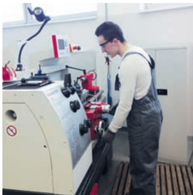
Več kot polovico izobraževanja za poklic oblikovalec kovin-orođjar po sistemu vajeništva, bo vajenec opravil pri delodajalcu z verificiranim učnim mestom v Sloveniji ali v tujini in za to bo prejel tudi vajeniško nagrado.

vsem mladim, ki si bodo želeli pridobiti poklic oblikovalec kovin-orođjar pretežno z delom in usposabljanjem v podjetjih to tudi omogočili. Vajenci bodo sklenili vajeniško pogodbo in se istočasno izobraževali v šoli in usposabljali v podjetju, hkrati pa bodo dobili vajeniško nagrado. S postopnim vključevanjem v delovne procese bodo vajenci prevzemali tudi odgovorne naloge v podjetju.