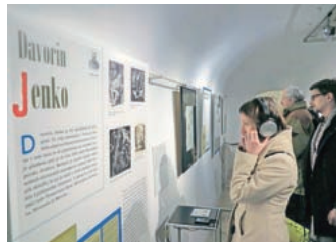
Nekaterim uglasbitvam Prešernovih pesmi je na razstavi moč tudi prisluhniti.