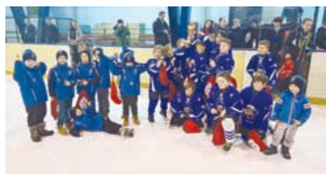
Še en uspešen nastop najmlajših na turnirju v Zagrebu

moštvu, ki je premagalo ekipo Zagreba z rezultatom 5:3. Vsi ti rezultati so več kot