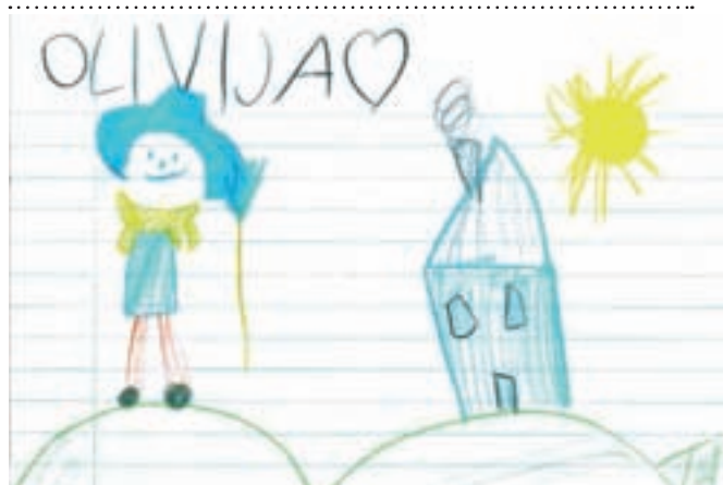
Olivija, sedem let