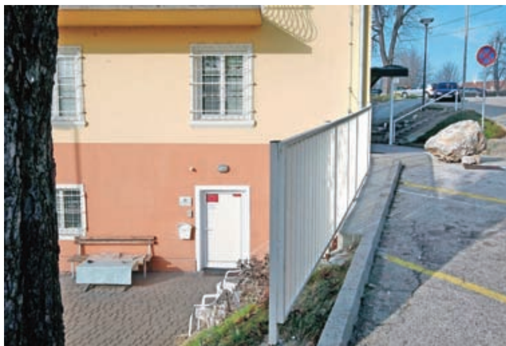
V kranjskem Zavetišču za brezdomce imajo 20 moških postelj in štiri ženske. V prvih januarjskih dneh je bilo zasedenih 15 moških postelj, presenetljiv pa je podatek, da so imeli v zadnjem obdobju večkrat zasedene vse ženske postelje.

290 evri mesečne pomoči mora pokriti najemnino, stroške, hrano.