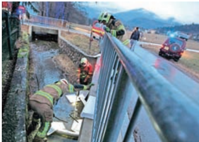
Postavljanje preklad v potok Olševnica

Na Olševku pa je okoli 17. ure prišlo do onesnaženja potoka z nafto. Kranjski in šenčurski gasilci so v potok postavili tri preklade in iskali izvor onesnaženja. Po petih urah so opravili pregled postavljenih preklad v potoku, v katera se je ulovila manjša količina kurilnega olja. Intervencijo so nadaljevali tudi naslednji dan.