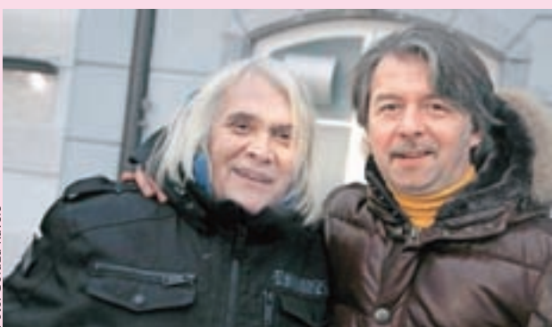
Pevski duo je bil navdušen nad našimi športniki.