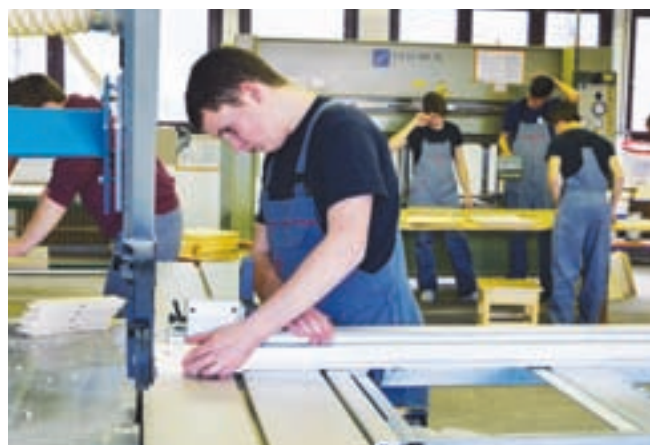
Mizarji in lesarski tehniki s prizadevnostjo in vztrajnostjo razvijajo ročne sposobnosti. Z uporabo znanja in s kreativnostjo na sodobnih strojih izdelajo unikatne in uporabne izdelke.

V letošnjem letu bomo v Šolskem centru Škofja Loka vključeni v pilotni projekt uvajanja vajeništva kot oblike izobraževanja v srednjem poklicnem izobraževanju . Zato bomo