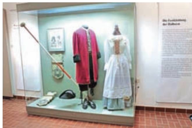
Muzej pripoveduje tudi zgodbo o pretekli oblačilni kulturi.