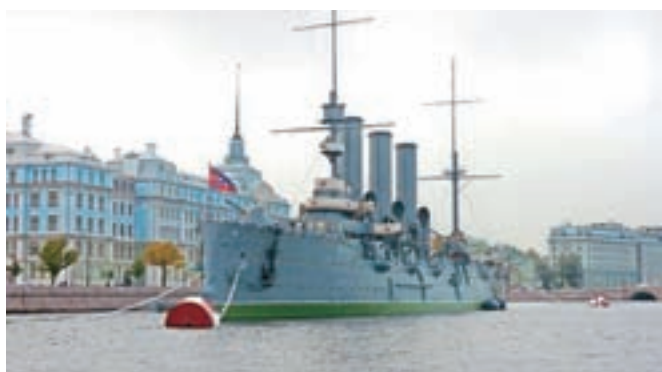
S strelom z Aurore se je leta 1917 začela oktobrski revolucija.

Ob vseh carskih doživetjih si privoščimo še protiutež: le od zunaj in z vodne strani si ogledamo znamenito ladjo Aurora, udeleženko treh vojn, ki je preplula vse oceane, plula je pod zastavo sv. Andreja, kar dokazuje, da je vojna ladja visokega ranga. Z nje je bil leta 1917 izstreljen usodni strel na Zimski дворец, s katerim se je začela ruska revolucija.