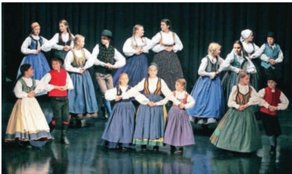
Starejša otroška folklorna skupina je predstavila pripovedko o nastanku Tržiča in zaplesala Suštarsko.