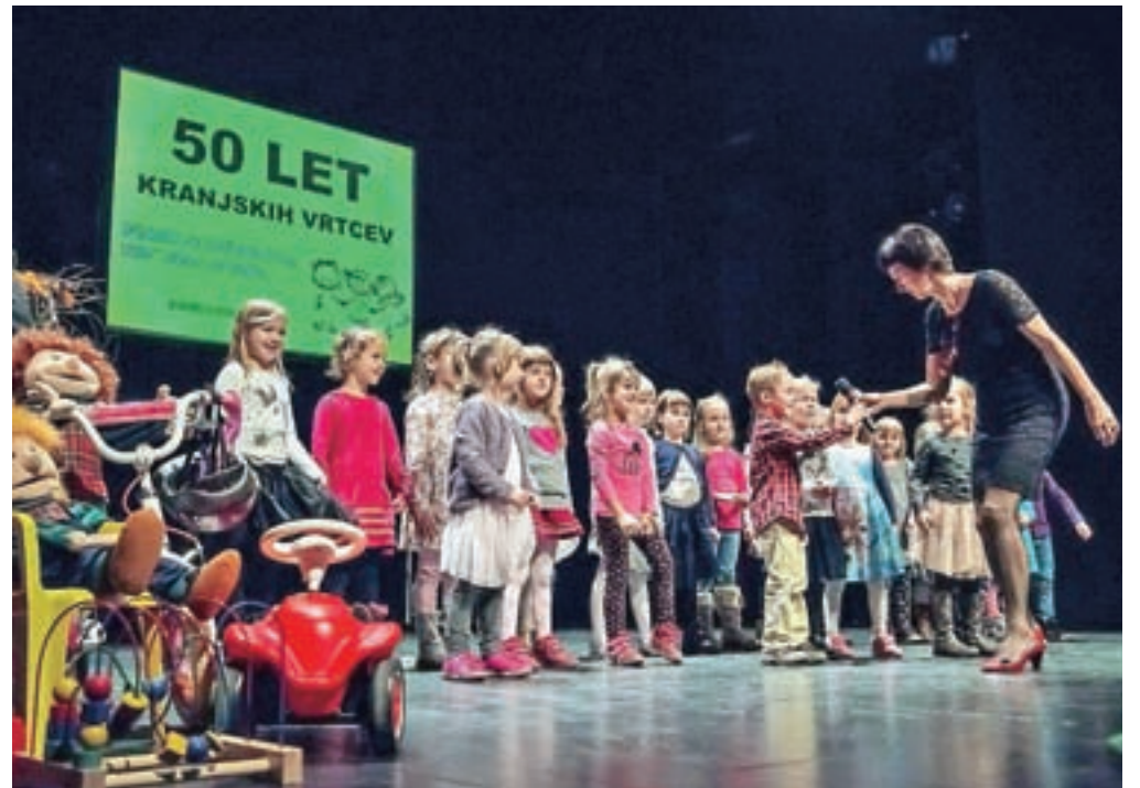
Program slavnostne akademije je obogatil tudi otroški pevski zbor iz enote Živ žav v Stražišču.

Prva oblika organizirane varstva v Kranju in okolici sega v leto 1947 v vrtcu Tugo Vidmar pri avtobusni postaji, ki so ga takrat imenovali Dom igre in dela, leto kasneje pa so v Jurgovi vili pri bolnišnici na Golniku odprli tudi prve otroške jasli. Pet let kasneje so na Golniku zgradili vrtce za predšolske in šolske otroke, ki so ga poimenovali Socialno zdravstveni zavod Golnik. Izgradnji novih stanovanjskih naselij v Kranju med letoma