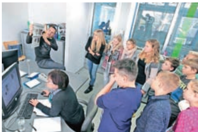
Učenci OŠ Predoslje so spoznali, kako nastane Gorenjski glas.