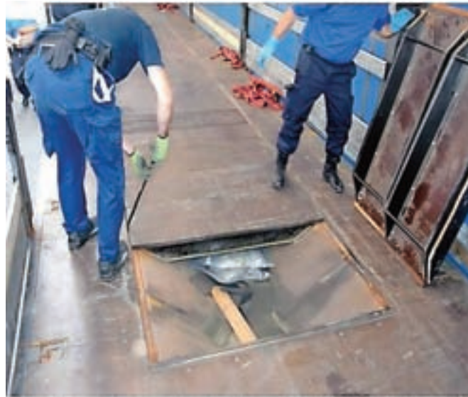
Drogo so v tovornjakih največkrat skrivali v dvojnem dnu, nad njo pa je bil naložen legalen tovor.

Koprski kriminalisti so pred tednom dni izvedli zaključno akcijo v kriminalistični preiskavi,