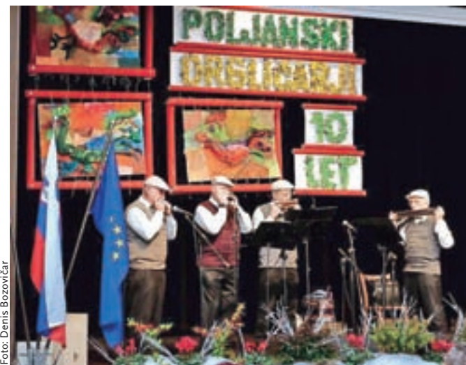
Za Poljanskimi orgličarji je že desetletje nastopov.