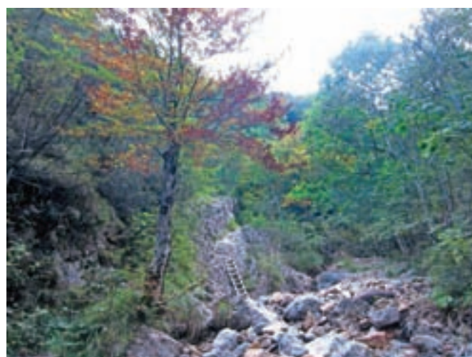
Barve jeseni in lestev / Foto: Jelena Justin