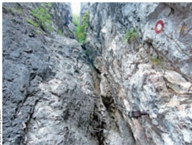
Tehnični detajl zavarovanega dela poti na Preval

Nadmorska višina: 2060 m Višinska razlika: 1002 m Trajanje: 6 ur Zahtevnost: ★★★★★