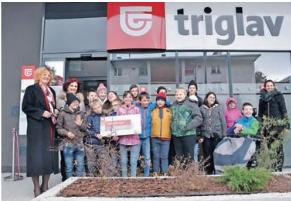
Selitev v nove prostore so v Zavarovalnici Triglav pospremili z donacijo OŠ Antona Janše.