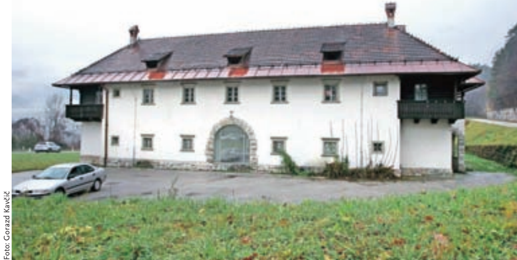
Generalni sekretariat vlade tudi na zadnjem razpisu ni našel kupca za Pristavo Bled.