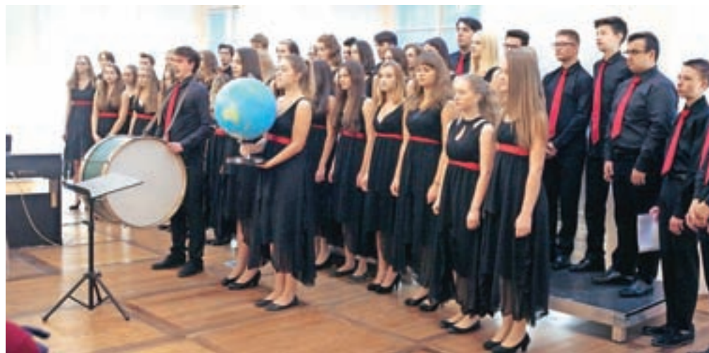
Najbolj obetaven zbor z najbolj vzorno sestavo programa pesmi je bil Mešani mladinski zbor Gimnazije Kranj. Za Gaudemus igitur je šlo.