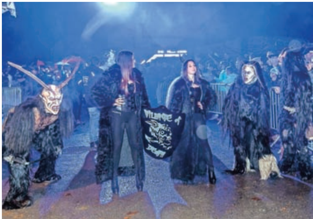
Parkeljni so strašili obiskovalce in pripravili pravi šov.

Gre za etnološko prireditev. »Namen je tudi, da se ohranja tradicija miklavževanja, ki je v naših koncih še prisotna,« je še dejal Knific in že povabil na šesto Noč parkeljnov, ki bo 18. novembra prihodnje leto. Po koncu spreveda najstrašnejše noči v Goričanah še ni bilo konec. Nadaljevala se je z zabavo pod šotorom in Veseli mi svati.