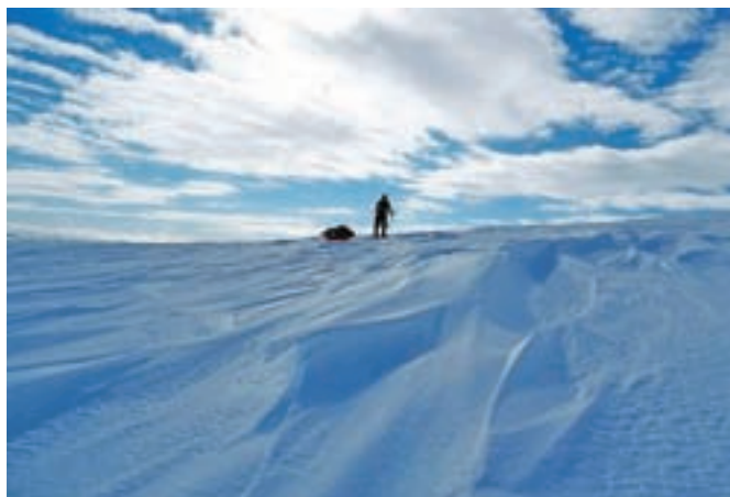
Islandija ponuja neokrnjeno naravo.