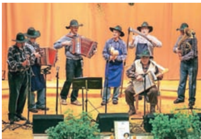
Rokovnjaška muzika, njeni člani pravijo: »Dan je izgubljen, če smeha ni v njem.«