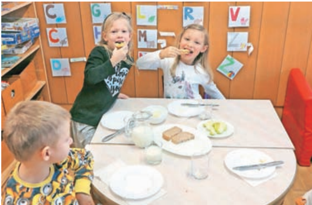
Tradicionalni slovenski zajtrk v vrtcu Živ žav

»Ko opazujejo druge otroke, tudi sami poskusijo. Ko poskusijo, pa navadno tudi pojejo,« se nasmeje. Pri petkovem zajtrku so se nato z otroki pogovarjali o hrani, ki so jo imeli ta dan na mizi. »Maslo in med imajo tudi sicer na jedilniku, tokrat pa smo temu namenili še posebno pozornost. Razložili smo jim, da so