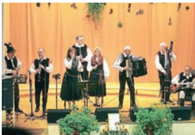
Kako lepo je biti muzikant je na Veseli jeseni v Dupljah zaigral hišni ansambel Avsenik.