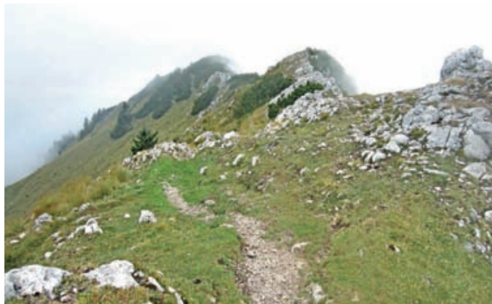
Z vrha sestopimo proti Robleku in včasih se lahko pripodi tudi megla.

Koča je desno, mi pa nadaljujemo do ličnega smerokaza po t. i. gozdni direktissimi. Pot gre namreč skoraj naravnost navzgor, strmo