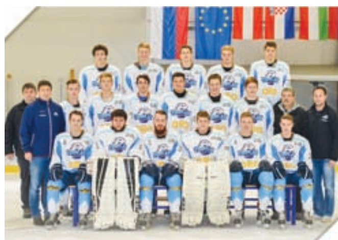
Lanskoletni mladinski državni prvaki uspešno nastopajo v razširjenem avstrijskem prvenstvu do 20 let.