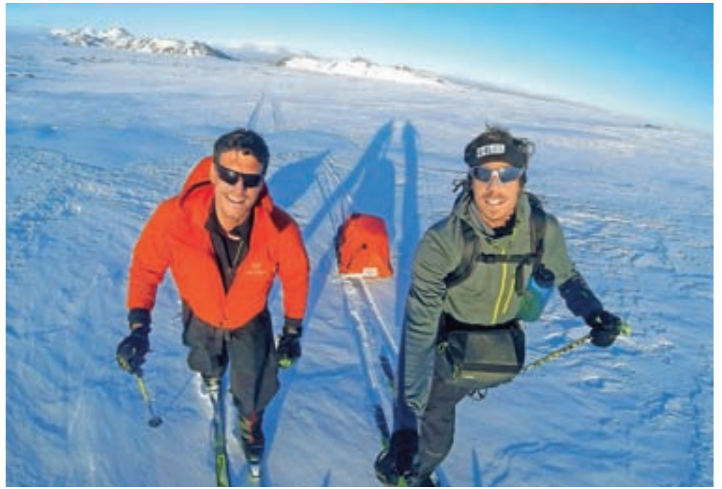
Ivica Kostelić in Miha Podgornik skupaj na smučeh čez Islandijo

Naloga Podgornika je bila torej video in fotografska dokumentacija projekta. Blizu mu je tudi to področje. Spomnimo le na dokumentarni film Krog, ki opisuje njegov nastop na Špartatlonu pred dvema letoma, ki ga je pretekel v spomin na pokojno mamo Ruth Podgornik Reš. Bil je protagonist tega dokumentarnega filma.