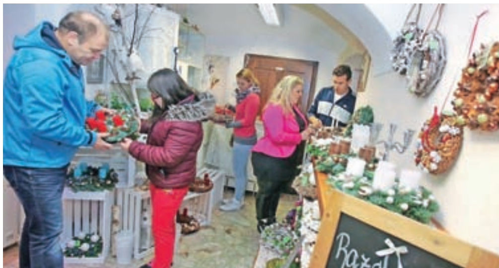
Med prvimi je po svoj adventni venček prišla družina Križaj iz Preddvora.

teh možnosti ni bilo, a ker je druženje pomemben praznični element, so obiskovalcem prodajne razstave Krčevi postregli s čajem, kuhanim vinom in piškoti.