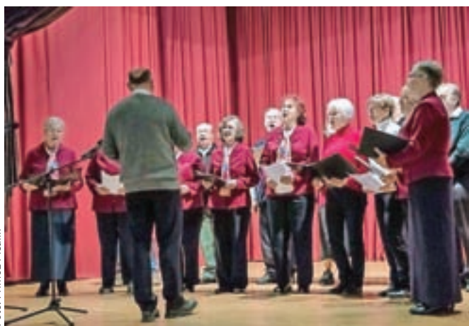
Nastop Mešanega pevskega zbora Dobrava Naklo