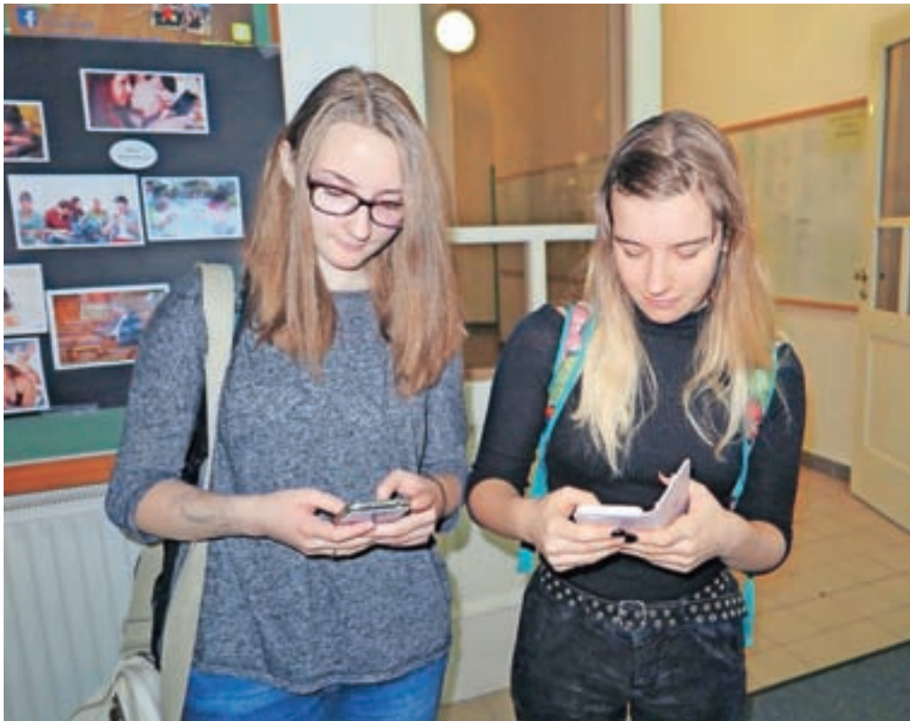
Na Gimnaziji Jesenice brez mobilnih telefonov ne gre, vsaj med odmori ...

In čeprav različne raziskave kažejo, da uporabniki pametne mobilne telefone vzamejo v roke med 110-krat do 150-krat na dan, pogosto brez razloga, zgolj iz navade, zasvojenosti, pa je anketa med jeseniškimi dijaki pokazala, da sami ne mislijo, da so z mobilnimi telefoni zasvojeni. Pa res niso? so se ob tem vprašali v Mladinskem centru Jesenice.