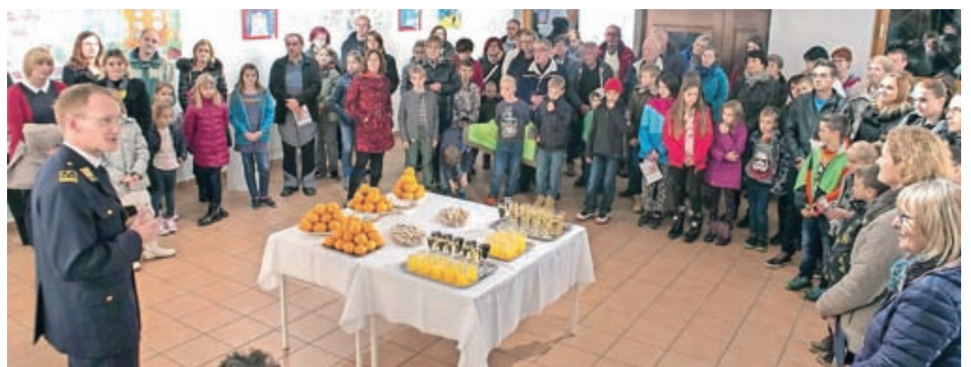
Ob odprtju razstave likovnih del mladih gasilcev se je zbralo več kot devdeset mladih umetnikov in drugih.