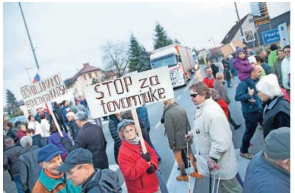
Mengšani so uresničili napovedi in pripravili protestni shod, na katerem so opozarjali na nevarne prometne razmere.