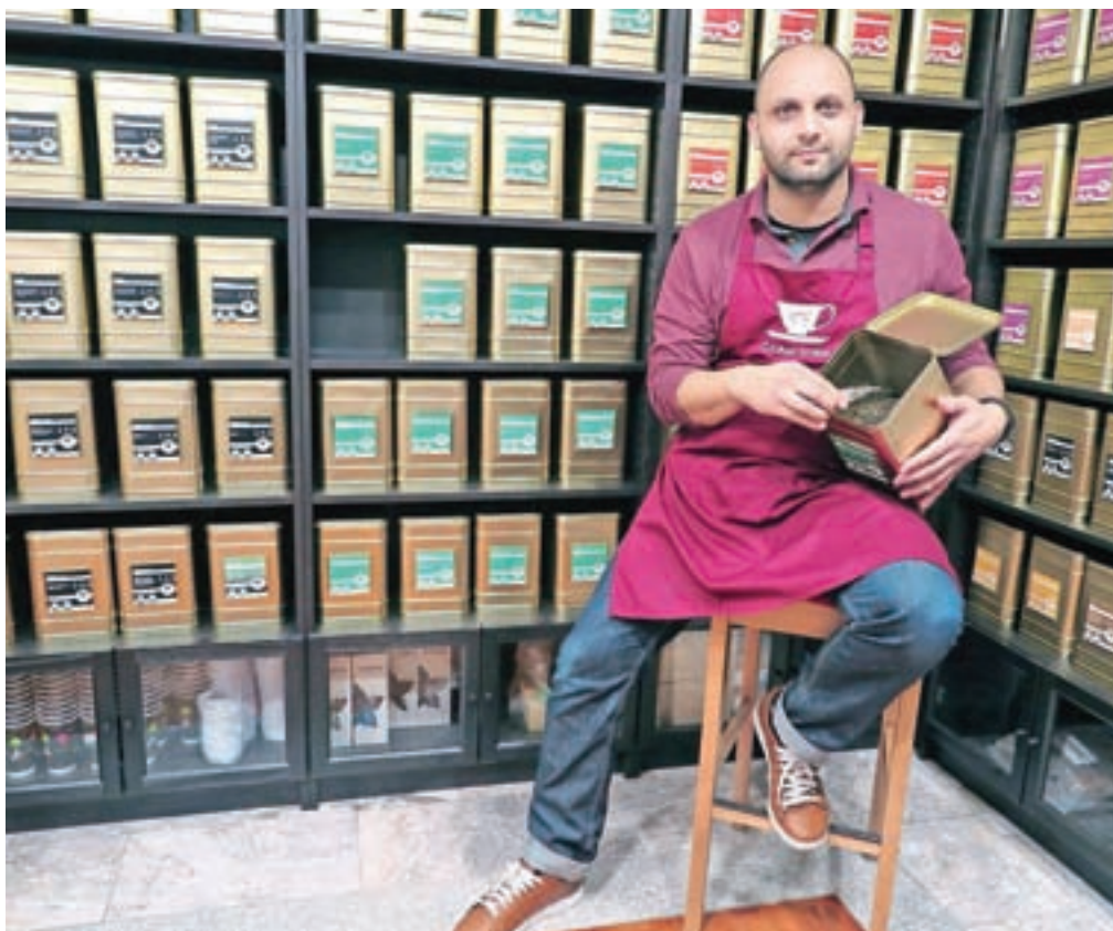
Nizar ima od julija letos na Linhartovem trgu v Radovljici Čajno sobo.