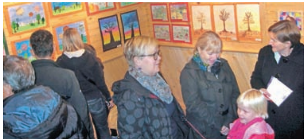
Drugi dogodek po prenovi dela Vogvarjeve hiše je bil ex tempore mladih.