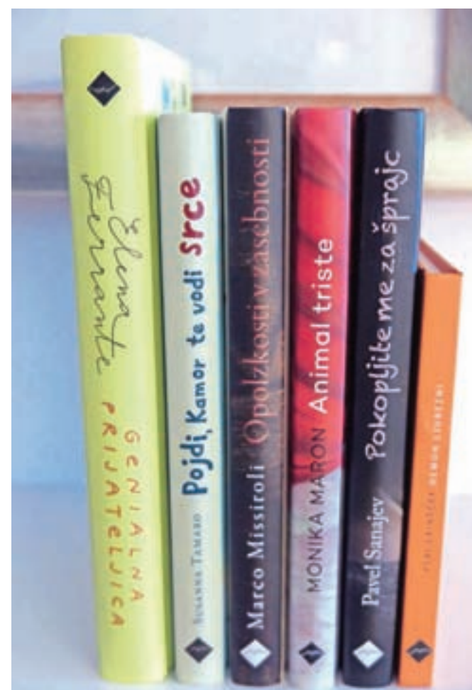
Tokratno branje nas bo popeljalo v prvoosebne zgodbe glavnih junakov romanov.

Ob obisku pisateljice Susanne Tamaro na letošnjem knjižnem sejmu so ponatisnili tudi njeno uspešnico Pojdi, kamor te vodi srce, kate- re prevod v slovenščino je izšel točno pred 20 leti in je bil prvi roman v zbirki Najst. Naj osvežimo. Nekoliko nevsakdanja babica piše pobe- gli vnu- kinji dnevnik v obliki pisem. V njih ne manjka življenjskih spoznanj, tu je razmišljanje o resnični sreči in o tem, da