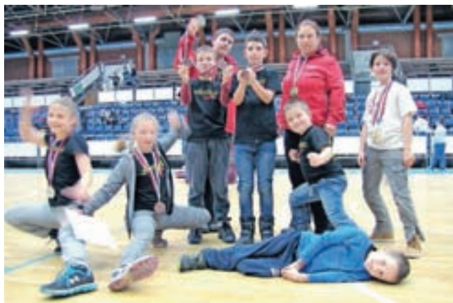
Osem radovljiških tekmovalcev je se udeležilo državnega prvenstva v Celju.