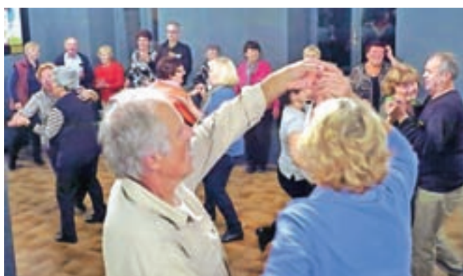
Naši gostje so tudi dobri plesalci.