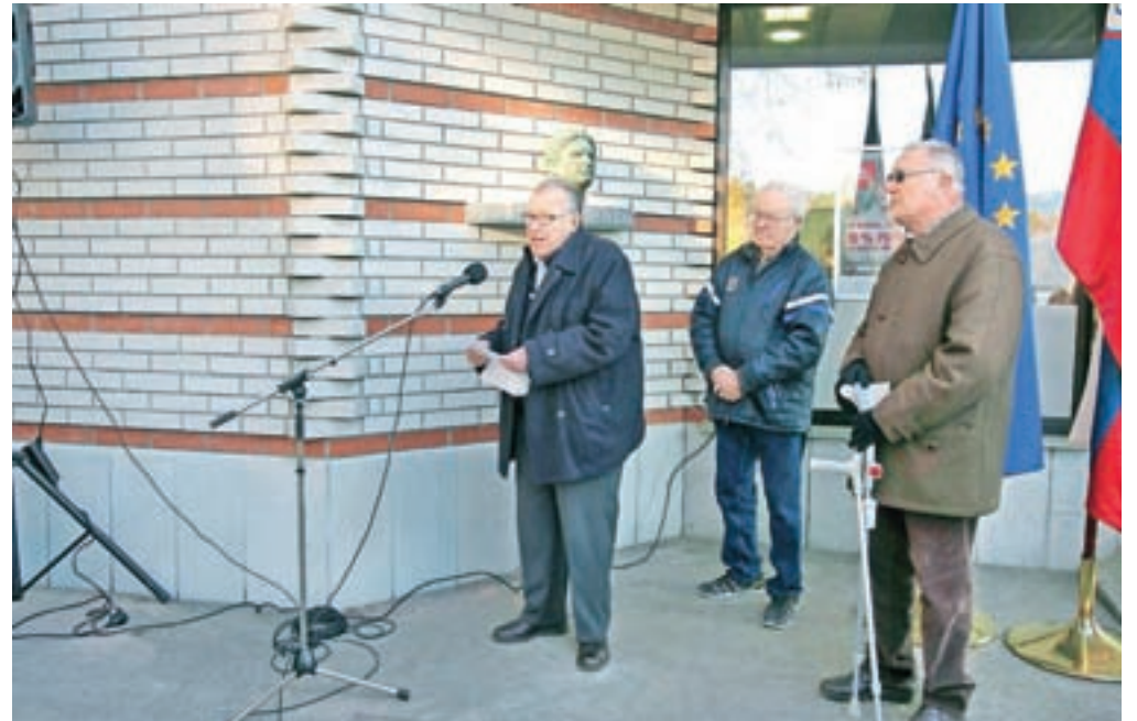
Kip Toneta Svetine, ki je nekaj let pozabljen ležal v skladišču, so v torek ponovno odkrili na Mlinem.