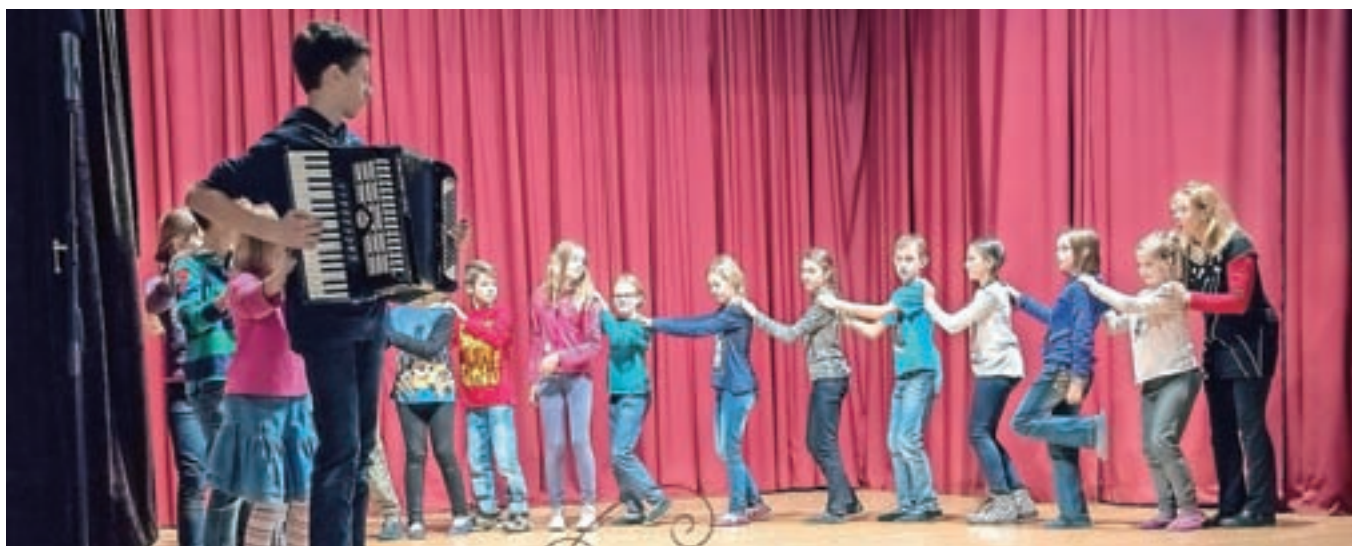
'Vozi nas vlak v daljave': razigran nastop otroške skupine Živčki