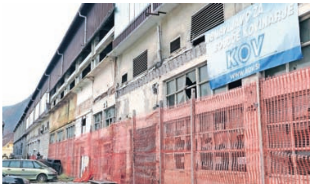
Novi lastnik nekdanje lužilnice je podjetje KOV, objekt pa že obnavljajo.