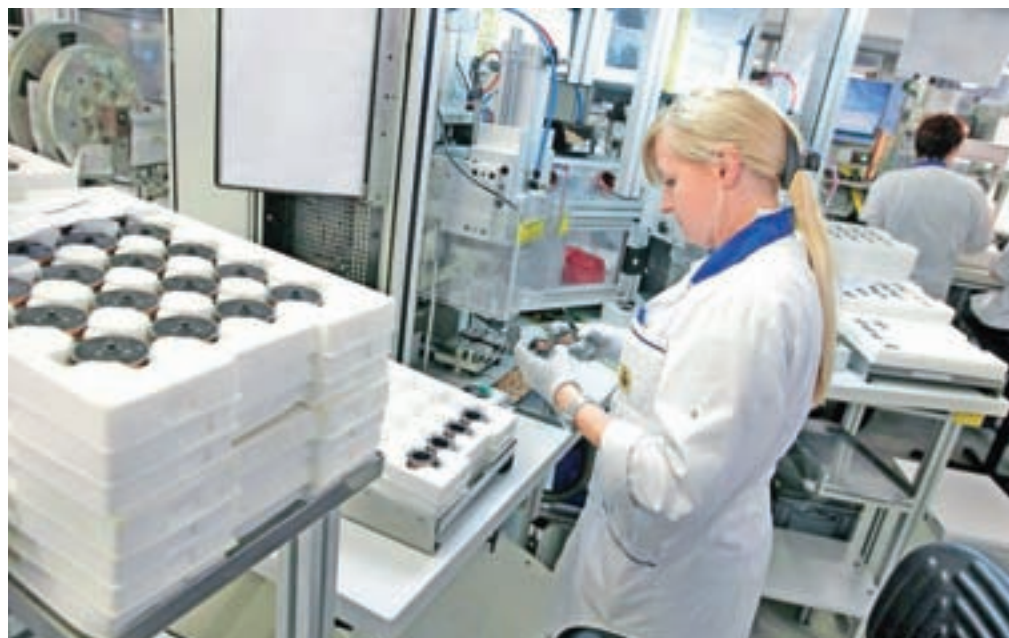
Novi prostori so namenjeni širjenju proizvodnje, ki je bila doslej v obstoječi stavbi. Novo halo so v pičlih nekaj mesecih postavili sredi letošnjega leta.