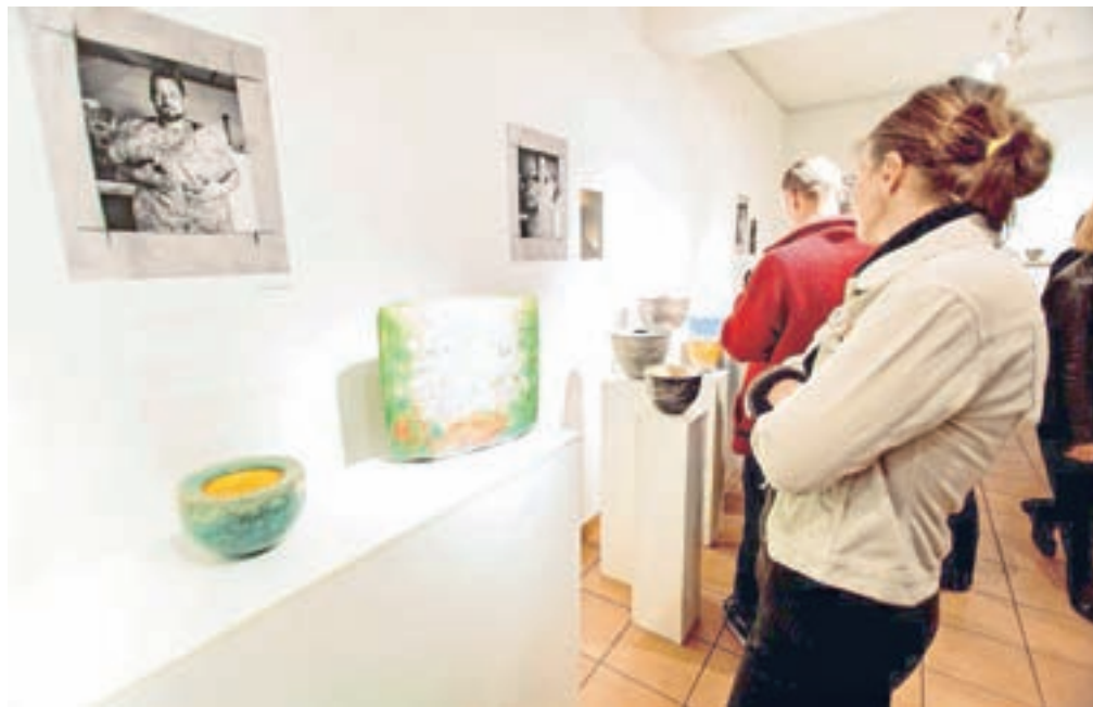
Utrinek z nedavnega vedno dobro obiskanega odprtja razstave del z 11. Mednarodnega simpozija umetniške keramike V-ogljje v Muzeju Občine Šenčur