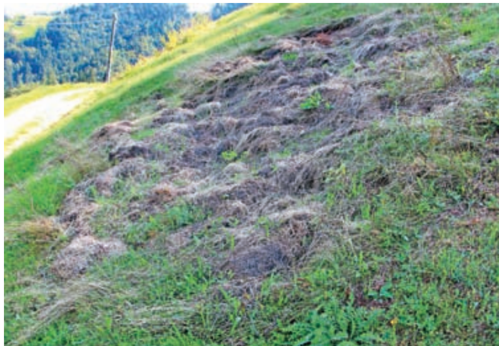
Divji prašiči so letos rili tudi na Svetem Ožboltu.