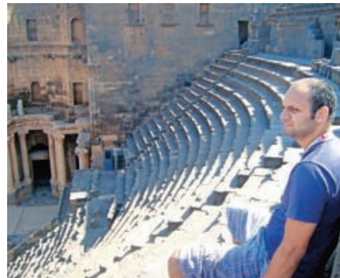
Leta 2007 v Siriji, v mestu Bosra, kjer je najbolje ohranjeno rimsko gledališče na svetu.