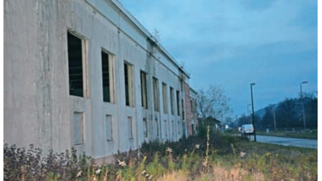
Če bo za Kitajski športni center izbrana Slovenija, so ena izmed možnih lokacij Medvode, območje v bližini železniške postaje, kjer je propadajoča nikoli dokončana športna dvorana.

Projekt so zastavili vsebinsko, ga arhitekturno zasnovali in začeli komunicirati tako v Sloveniji kot na Kitajskem. »Na Kitajskem smo našli zainteresiranega investitorja, poiskali za ta projekt v Sloveniji primerno lokacijo