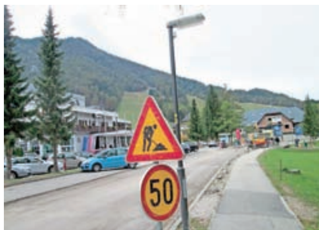
V teh dneh v Kranjski Gori zaključujejo zahtevno obnovo cest v središču kraja.

Precej sredstev so za obnovo cest v Kranjski Gori namenili že letos. Tako prav v teh dneh zaključujejo obnovo Borovške ceste, ki jo morajo le še preplastiti z asfaltom; računajo, da bodo dela končana v desetih dneh.