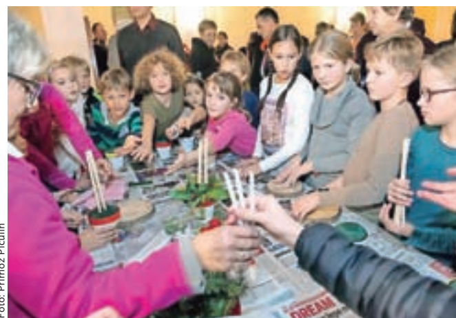
Na delavnicah so se najmlajši tudi marsičesa naučili.