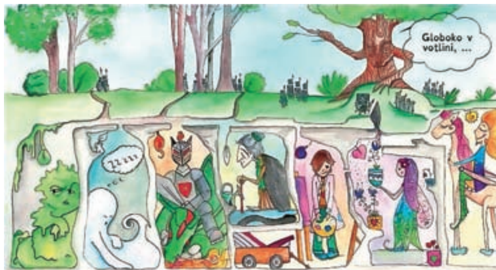
Svet sedmih ujetih junakov za pokušino

Avtorica si je zamislila, da starši in otroci slikanico prebirajo skupaj in se pogovarjajo o čustvih. Pisava in oblika besedila bosta prilagojena tudi disleksikom. Debeljakova je k