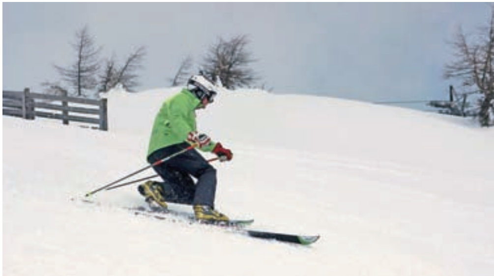
Telemark smučanje je tekmovalni šport, prav tako pa smučanje s prosto peto navdušuje rekreative.

»Avtor knjige Robert Aleš zagotovo sodi med najboljše poznavalce telemark smučanja pri nas. Kot dolgoletni