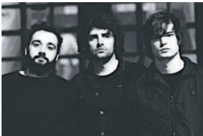
Na YugoRezu bo nastopil tudi rokenrolski trio Straight Mickey And The Boyz.