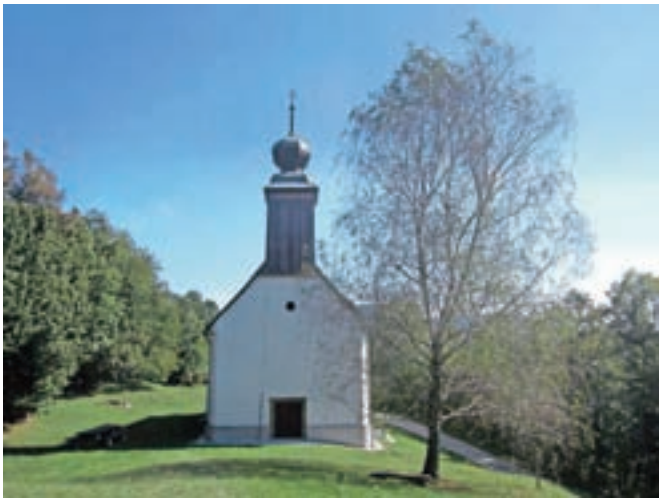
Cerkev sv. Donata

Nadmorska višina: 884 m Višinska razlika: 294 m Trajanje: 1 ura in 30 minut Zahtevnost: ★★★★★