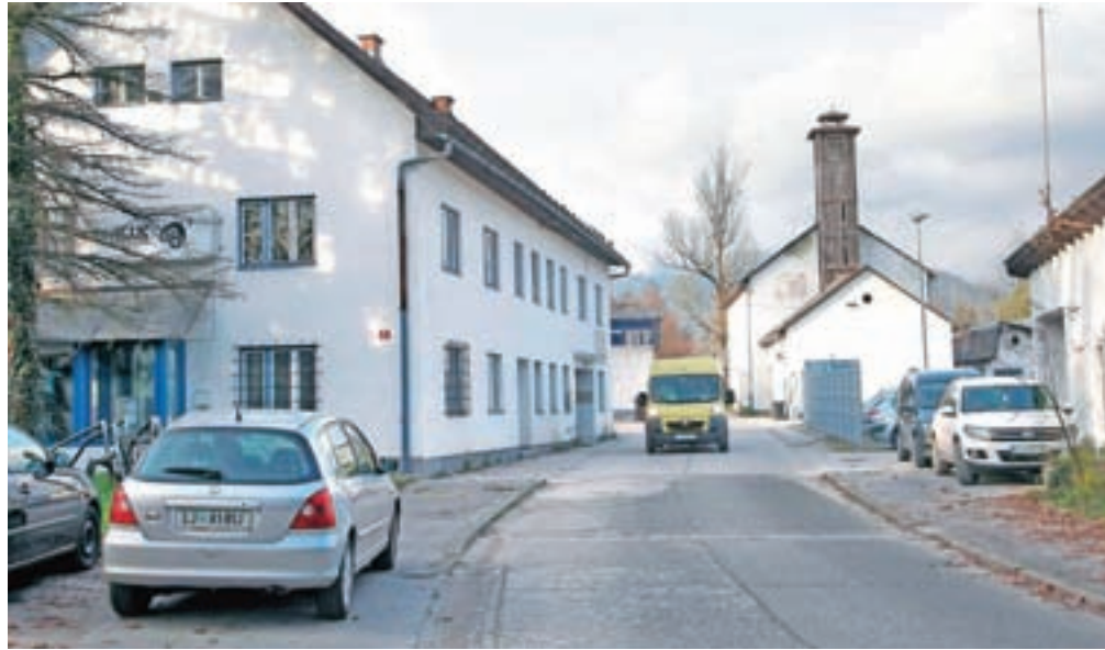
Za vhodom v območje nekdanje smodnišnice se razprostira izredno velik prostor, ki za Kamnik predstavlja neslutene priložnosti.

»V javnosti v zvezi s smodnišnico in možnostmi na tem območju kroži veliko dezinformacij. Tu smo zato, da vam pojasnimo, kakšni so postopki, kaj vse je treba upoštevati in kakšne dejavnosti bodo na tem območju dovoljene. Res je, da bi to predstavitev morali pripraviti pred prodajo zemljišč in tu morajo vsi vpleteni v to zgodbo prevzeti svojo odgovornost. Prehitevati pri prostorski zakonodaji ne gre,