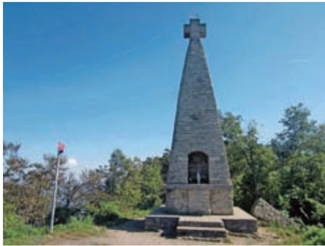
Vrh Donačke gore