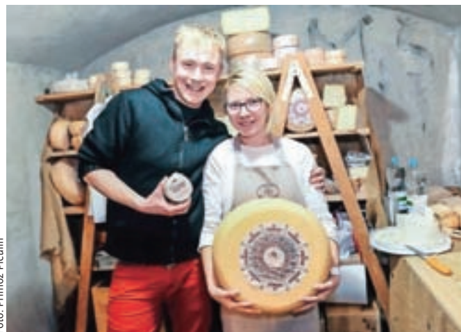
Poleg vina je obiskovalcem na voljo pestra kulinarična ponudba, tudi siri kmetije Pri Pustotniku iz Gorenje vasi.