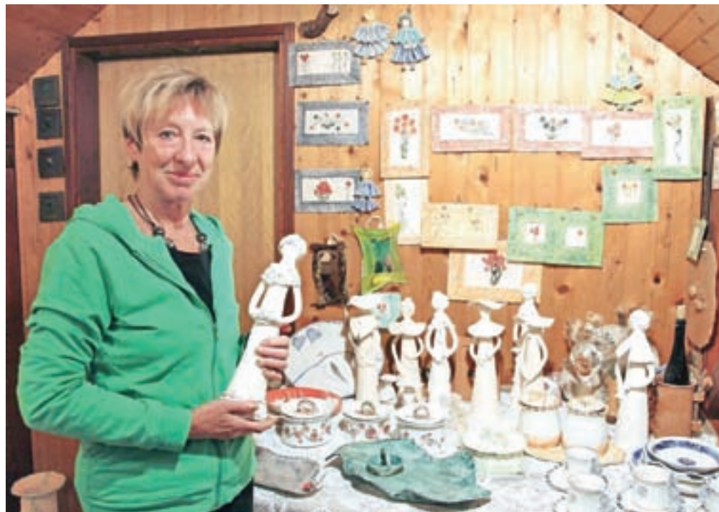
Tilka Purgar v domači delavnici

Pregnetena glina dobiva različne končne oblike. Bili so že čajniki, glinene ure, angelčki, še vedno glinene slike z motivi drobnega