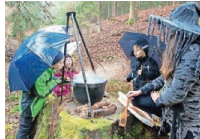
Otroci pri kuhanju čarobnega napoja

POTOVANJA • VINO • HRANA • DOGODIVŠČINE • MOŠKI • ŽENSKO • POTOVANJA • VINO • HRANA • ŽENSKO