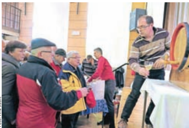
V Stražišču pri Kranju so na martinovo blagoslovili mlado vino iz Goriških brd in ga razdelili med obiskovalce.