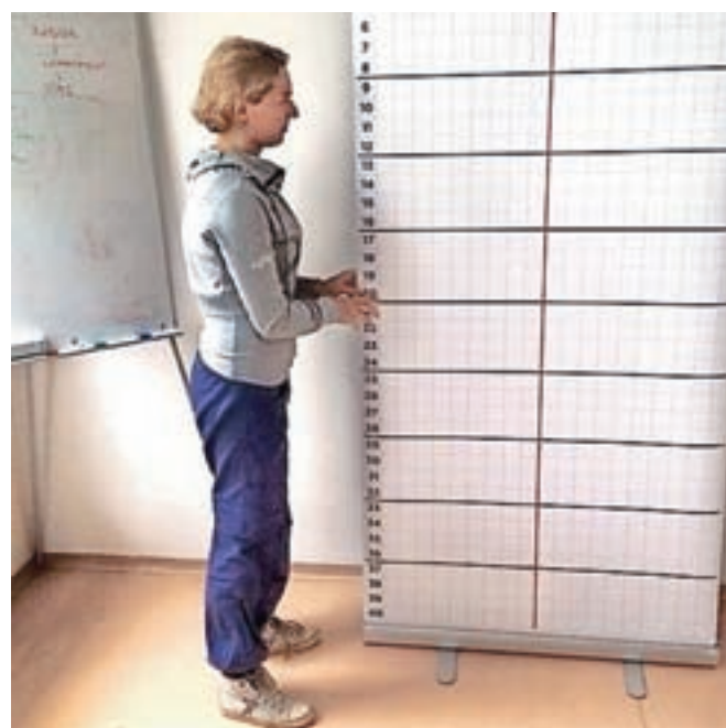
V kolikor imate pri opazovanju telesne drže težave, je eden izmed načinov detektiranja tudi diagnostična mreža

Slabo telesno držo lahko s pravilno vadbo, ozaveščanjem, vajami za moč in gibljivost, povečanjem amplitude kretne in izboljšanjem koordinacije popravimo in izboljšamo. Če v času rasti in razvoja ne vplivamo na slabše člene v gibalni verigi, bo slaba telesna drža prešla na višji nivo – takrat govorimo o deformaciji, kjer se spremeni anatomsko kostna struktura. V tem primeru poti nazaj ni več, največkrat lahko z vadbo vzdržujemo trenutno stanje, le redko pa lahko dosežemo zadovoljivo izboljšanje.