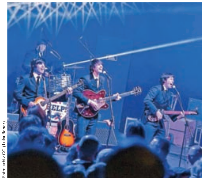
Rumena podmornica: na Bazen prihaja zasedba Help!