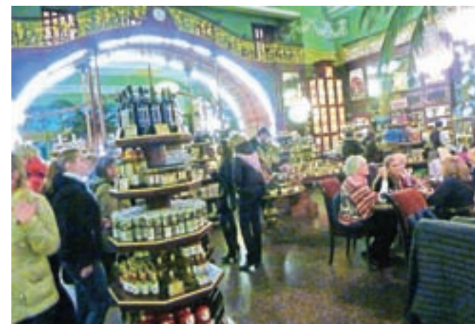
Razkošna notranjost Elizabetinske trgovine

zmagovalcu nad Napoleono vojsko, feldmaršalu Kutuzovu pred Kazansko katedralo. Ob Nevskem prospektu si sledi vrsta knežjih palač, eden med njimi je дворец богате дру́жине Струганов, pa дворец Сингер z največjo knjigarno v mestu, ena najstarejših blagovnih hiš na svetu Gostiny Dvor, v St. Peterburgu pa največja in druga največja v Rusiji. Zgradba s kilometer dolgo fasado ima kar 570 tisoč kvadratnih metrov površin, prodajne galerije s 180 trgovinami pa ponujajo ugledne blagovne znamke. Pritegne nas tudi notranjost Elizabetinske trgovine, kjer v kavarni ob mogočni palmi v osrčju prostora posedajo predvsem turisti, ki so v glavnem tudi kupci prestižnega blaga od kaviarja, vodke in konjaka do umetelno izdelanih slaščic, kajti za domačine (in tudi za nas) je vse to predrago. Običajno tudi veliko neoklasičistično Kazansko katedralo, kjer je danes muzej verstev na območju nekdanje