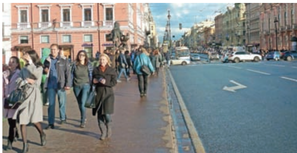
Vedno živahno na nevskem prospektu