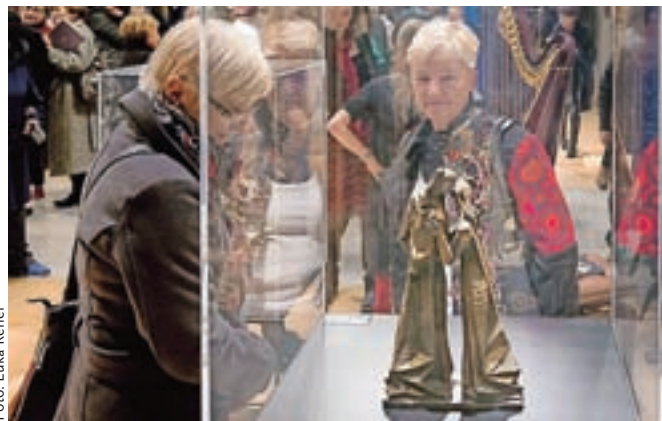
Zanimanje za Mite in legende je bilo že ob odprtju veliko.