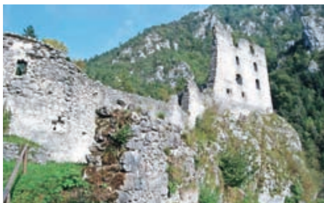
Turistično društvo Begunje je predstavilo svoje vizije za revitalizacijo gradu Kamen.