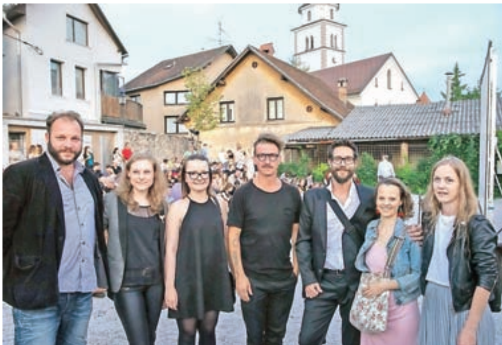
Film Štiri stvari, ki sem jih hotel početi s tabo je minulo poletje že doživel nekaj projekcij na prostem, med drugim v Vovkovem vrtu v Kranju, kjer so gostili tudi ustvarjalce filma.

N a prvem programu Televizije Slovenija bodo jutri, 16. novembra, ob 20.05 premierno predvajali celovečerni igrani film Štiri stvari, ki sem jih hotel početi s tabo. Film, ki je nastal v produkciji igranega programa RTV Slovenija, je režiral Kranjčan Miha Knific. Njegov celovečerni prvenec je minulo poletje že doživel nekaj projekcij na prostem, med drugim tudi v Vovkovem vrtu v Kranju in Češminovem parku v Domžalah. Na lanskem Festivalu slovenskega filma je Mojca Fatur za glavno žensko vlogo v njem dobila vesno. Film so predvajali tudi na mednarodnem filmskem festivalu v Belgiji. »Želel sem narediti film o neokrnjeni ljubezni, neumni, brezglavi, strastni, pravi ljubezni – ljubezni, ki je večja kot življenje, in o generaciji, ki se