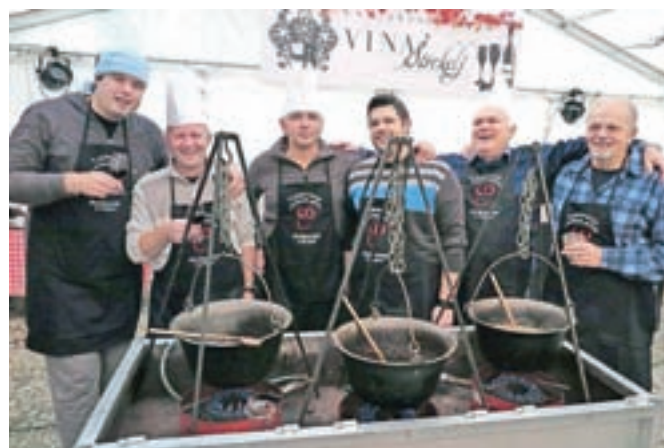
Na Pungertu so pripravili tekmovanje v kuhanju martinovega golaža.