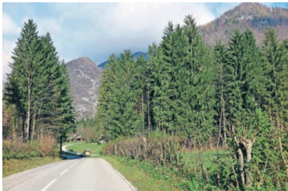
Okoli 2300 hektarov gozdov v kamniški Bistrici je bilo vrnjeno agrarni skupnosti Meščanska korporacija Kamnik.

Z odločbo je bilo vrnjeno okoli 2300 hektarov zemljišč v višjih legah Kamniške Bistrice. Prihodke iz gospodarjenja z gozdovi bodo člani AS MKK po svojem statusu namenjali tudi za revitalizacijo mestnega jedra.