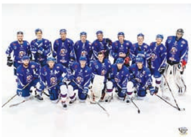
Članska ekipa HKMK Bled v letu 2016 niza odlične predstave. Uvrstili so se tudi v polfinale Pokala Slovenije.