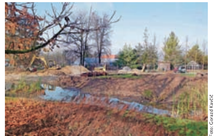
Novi vhod, ki ga že gradijo, bo umeščen med dosedanja vhod in vrtni center ter malenkost zamaknjen v sam park.

Novi vhod bo umeščen med dosedanja vhod (starega bodo po odprtju novega porušili) in vrtni center, v njem pa bodo prostori za prodajo vstopnic, trgovina s spominki in sanitarije. Vodstvo parka si je prizadevalo v novem objektu urediti tudi kavarnico, a za to niso dobili dovoljenja.