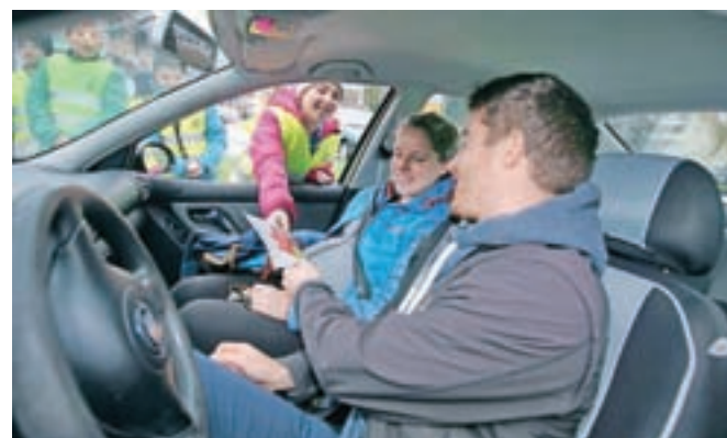
Otroci so voznikom zaželeli srečno in varno vožnjo brez alkohola.