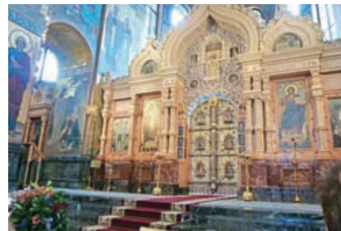
Zlato okrašeni ikonostasi (oltarji) peterburških cerkva

Sovjetske zveze. Oglejmo si še več peterburških cerkva, ki so vse po vrsti bogato okrašene, obnovljene in lepo restavrirane. Ob teh obiskih se nam pridruži restavrador Volodja, ki je sodeloval