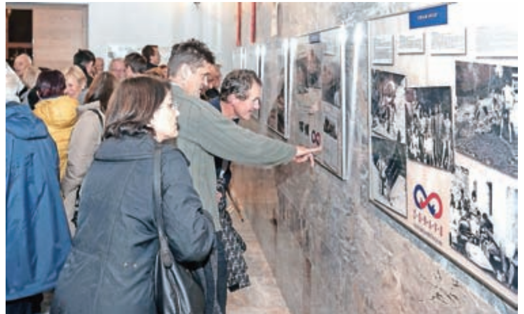
Nekdanji brigadirji so si z zanimanjem ogledali razstavo o svojem sodelovanju na mladinskih delovnih akcijah.