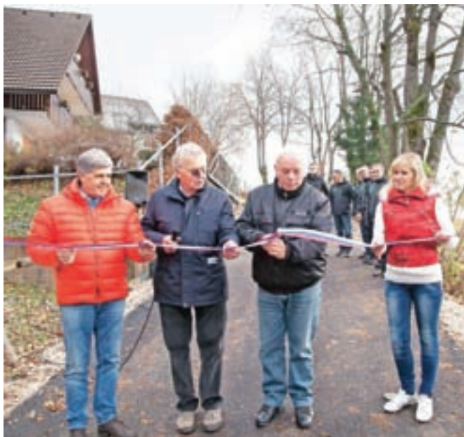
Uradno odprtje 650-metrške Poti na Vižensko ravan