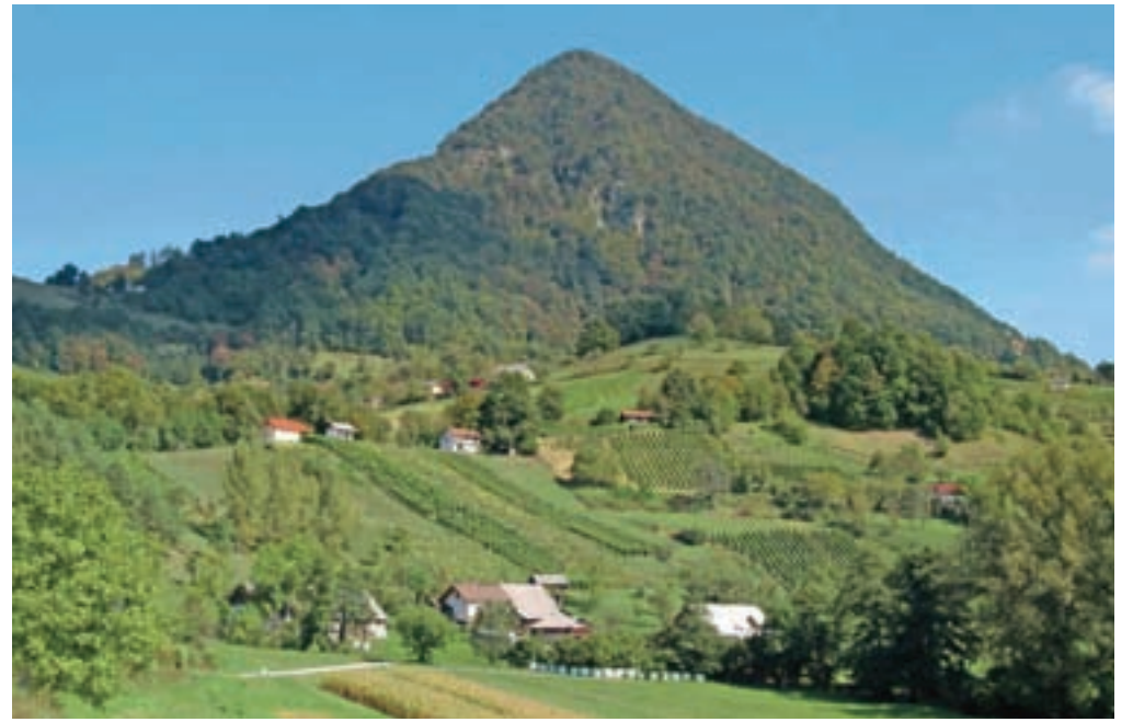
Priostrena piramida: Donačka gora

Avtocesto Ljubljana–Maribor zapustimo v Dramljah in se usmerimo proti Šentjurju in Rogaški Slatini. Nadaljujemo do Rogatca, kjer nas oznake za Donačko goro usmerijo levo. Začnemo se vzpenjati po asfaltirani cesti vse do Rudijevega doma na nadmorski višini 590 metrov, kjer parkiramo. Od doma nadaljujemo po kolo-vozu v gozd, kjer se kmalu pot odcepi desno v breg. Še prej nas tabla opozori, da vstopamo v bukov pragozd,