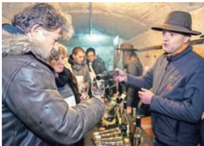
Vinska pot je minuli konec tedna v kranjske rove privabila okoli 1500 obiskovalcev.