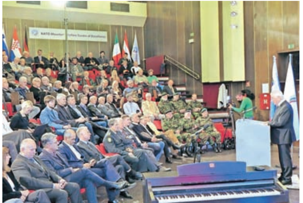
V Poljčah so obeležili 26. obletnico prelomne odločitve za referendum o osamosvojitvi Slovenije.