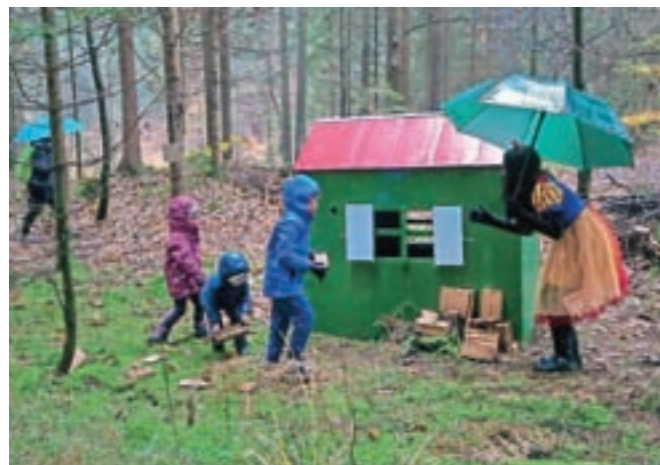
Sneguljčici so morali otroci pomagati zložiti drva ob hiško.

so opazovali sekanje drv in pomagali zakuriti ogenj, za čarovnico pa so morali nabrati lubje za čarobni napoj. Poleg omenjenih pravljničnih junakov so po poti srečali še Smrkce, Piko Noga-vičko, čebelico Majo, Elso in Ano iz Ledenege kraljestva ter simpatične minione. Na cilju so za vse udeležence pripravili čaj in pogostitev, druženje pa so lahko nadaljevali ob ustvarjalnih delavnicah.