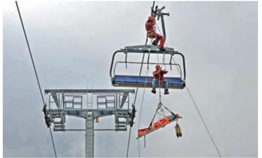
Čeprav redko, a tudi jamarji so na slovenskih smučiščih že sodelovali pri reševanju ujetih z okvarjenih žičniških naprav.

Nesreč na žičniških napravah na slovenskih smučiščih k sreči ni ravno veliko, so pa izredno specifične, saj so močno pogojene z vremenskimi razmerami. Ker se jih večina zgodi pozimi, torej v mrzlem in pogosto slabem vremenu, je potrebna hitra odzivnost reševalcev, da prezeble smučarje čim prej spravijo z žičniških naprav. V takšnih nesrečah se najprej aktivirajo najbližji reševalci – na Krvavcu bodo tako z reševanjem začeli reševalci z žičnic, ki potem ob večjih nesrečah za pomoč zaprosijo še gasilce ter gorske in jamarjske reševalce, ki so vsi usposobljeni za tovrstno reševanje. Do sedaj so sicer jamarjski