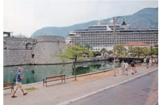
Kotor, njegove obiskovalce in domačine vsak dan obišče vsaj eno velikansko 'plavajoče mesto'.

Lovčen smo tokrat videli od daleč, smo se pa zato ustavili v mestu Cetinje, kjer sem mimogrede zavila