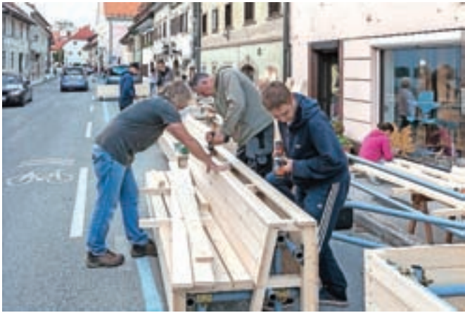
Prebivalci Lontrga so ta teden postavljali urbano opremo, ki jo bodo namenu predali jutri.

Škofja Loka – Jutri, 24. septembra, bodo na Spodnjem trgu ob 11. uri namenu predali skupni prostor, ki so ga ta teden v sodelovanju z občino ustvarjali njegovi prebivalci pod nadzorom projektanta in izbrane izvajalke. Po odprtju obvoznice v Poljansko dolino je cesta skozi Lontrg dobila novo vlogo in lokalni značaj, za umiritev in zmanjšanje prometa pa so bili sprejeti začasni prometnovarnostni ukrepi, te pa so nadgradili še z urbano opremo in rastlinjem, saj lahko te prvine v odprtem javnem prostoru dosežejo enak učinek umirjanja prometa kot prometno-tehnične ureditve. Te zlasti spodbujajo pešce in prebivalce, da se začnejo v tem prostoru tudi zadrževati. In ko bo pešcev več, bodo tudi avtomobili vozili počasneje. Gre začasne ureditve (okoli pet let), končna ureditev je bila izbrana na javnem natečaju za ureditev odprtih površin starega mestnega jedra Škofje Loke in obrežja reke Sore.