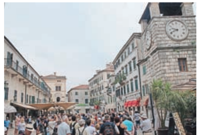
Kotor dnevno obišče ogromno turistov.