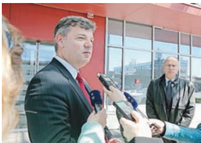
Minister za infrastrukturo Peter Gašperšič je v dnevih pred glasovanjem o interpelaciji obljubil marsikaj.