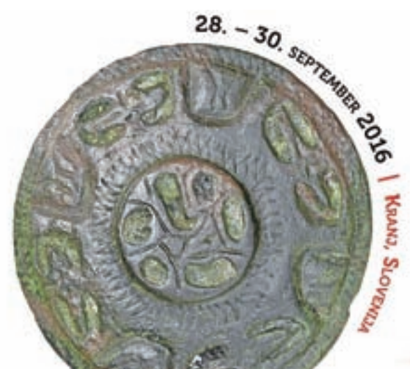
Prepoznavni znak simpozija Slovani, naša dediščina

»S predavanji in plakati bo obravnavan širok razpon tem, kot so politične in družbene strukture, verovanja, poselitev, organizacija prostora in slovanske naselbine ter obrt in umetnost, ne nazadnje pa tudi nedavne arheološke raziskave in projekti v teku. Udeleženci simpozija si bodo ogledali tudi mestno jedro Kranja z izjemnimi spomeniki, poudarek bo seveda na arheologiji. Zadnji dan, v petek, je predviden ogled Bleda, Blejski otok in grad, ter kot zaključni še krajši obisk Preddvora,« program v strnjeni obliki predstavlja Luxova, ki je tudi osrednja koordinatorica