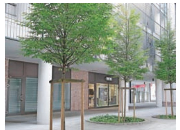
V Dvorcu Jelen je na razpolago še štirinajst poslovnih prostorov.

»Naš prodajni cenik je od začetka prodaje enak. Do sedaj smo v več obdobjih kupcem ponudili različne ugodnosti in naša prodajna politika bo ostala enaka do prodaje vseh enot,« dodaja Hozjan.