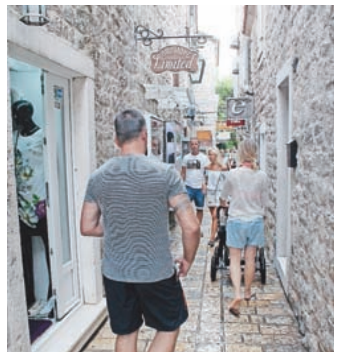
Staro mestno jedro Budve smo si ogledali po dežju. Tudi zanj so značilne številne ozke ulice in uličice.