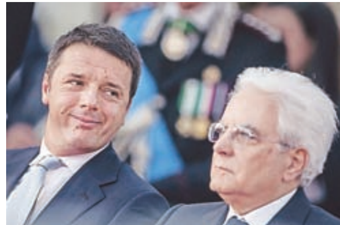
Prva moža Italije: premier Matteo Renzi (1975) in predsednik republike Sergio Mattarella (1941)