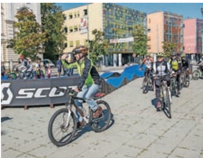
Kolesarji so se s Slovenskega trga v Kranju podali po trasi bodoče kolesarske poti od Gimnazije Kranj čez Sorško polje do Gimnazije Škofja Loka.