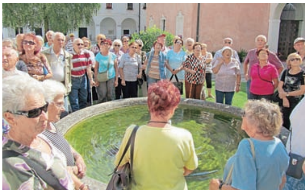
Najstarejši člani Društva upokojencev Naklo na vrtu samostana v Stični

Naklo – Društvo upokojencev Naklo je posebej pozornostno do svojih najstarejših članov. Zanje vsako leto organizira krajši, njihovim letom in moči primeren izlet, na katerega povabi tudi društvene poverjenice, ki poskrbijo, da na poti ni težav. Letošnji izlet je bil prejšnji teden, nanj pa se je z avtobusom in kombijem odpravilo več kot 60 izletnikov in spremljevalcev. Prva postaja je bila Muljava, rojstni kraj pisatelja Josipa Jurčiča, pisca prvega slovenskega romana Deseti brat. Izletniki so po ogledu filma spoznavali Pajžbarjevo hišo, v kateri se je leta 1844 rodil Jurčič, Krjavljevo kolibo, čebelnjak in razstavno orodje, ki so ga nekdanji uporabljali v »deželi Desetega brata«. Druga postaja izletnikov je bila Stična,