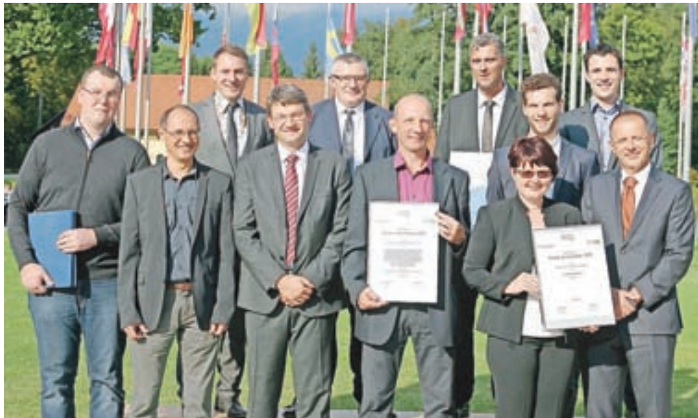
Zlati inovatorji iz Acronija, M Sore ter Domela in Razvojnega centra NELA