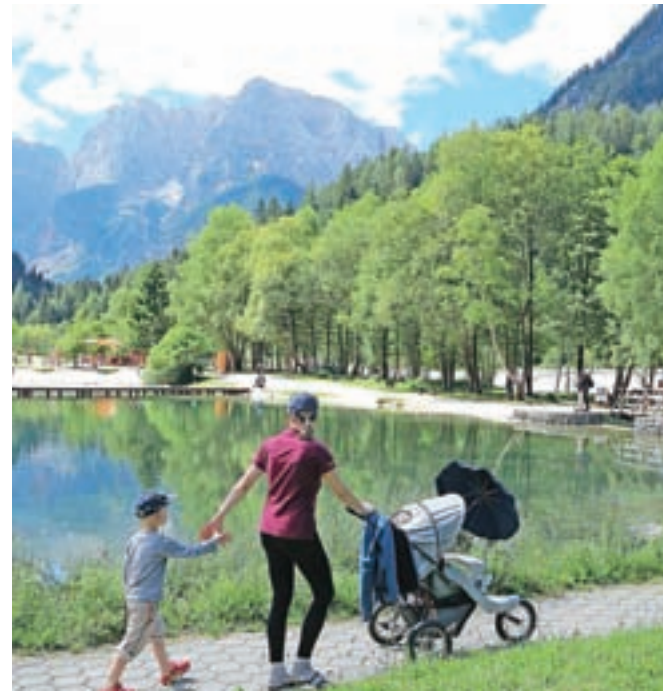
V Kranjski Gori so letos nadaljevali urejanje okolice jezera Jasna, kamor so se v vročih poletnih dneh zgrinjale množice turistov.

V Bohinju so s poletno sezono zadovoljni, čeprav statističnih podatkov za avgust še nimajo. V prvi polovici leta so zabeležili deset odstotkov več nočitev kot v istem obdobju lani, in sicer pet odstotkov več domačih in 14 odstotkov več tujih. Še vedno prednjačijo domači gostje, ki so ustvarili 46 odstotkov vseh nočitev, sledijo hrvaški, nemški, britanski, madžarski in italijanski gostje. Polanski rekordni sezoni pa pričakujejo letos še boljše zasedenost. Podaljšala se je tudi doba bivanja,