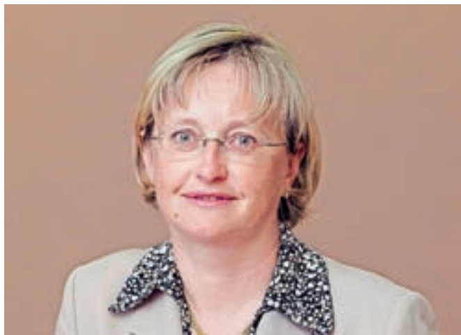
Nova finančna ministrica Mateja Vraničar Erman izhaja iz Škofje Loke.