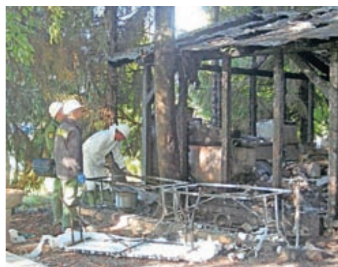
Kriminalistična komisija je včeraj dopoldne preiskovala, kaj je zanetilo požar.

prostovoljnih iz nakelskega gasilskega društva, je bil ogenj ob njihovem prihodu