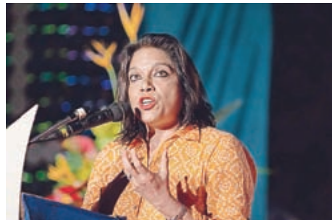
Indijsko-ameriška filmska režiserka Mira Nair (1957) na filmskem festivalu v Zanizabaru, 2013; med njenimi igralci je tudi David Oyelowo.