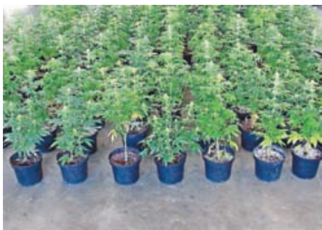
Tudi zdravniki se zavzemajo, da bi bila uporaba konoplje v medicinske namene v Sloveniji dovoljena. / Foto: arhiv GG