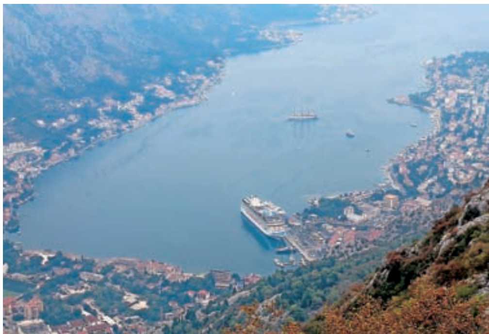
Pogled na Kotorški zaliv