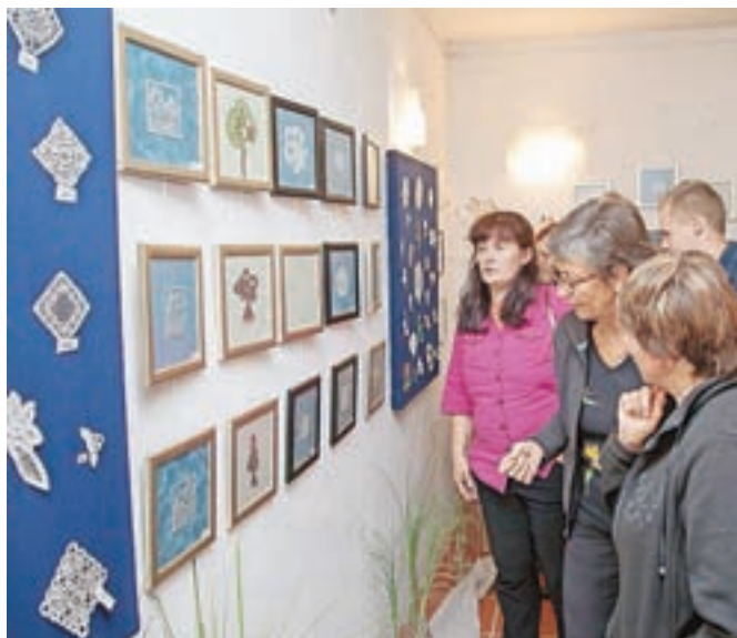
Številne klekljarske mojstrovine so do prihodnje srede razstavljene v Petrovčevi hiši.

izvedbe klekljarskih mojstrov. »Klekljana čipka je eden od prepoznavnih simbolov slovenske identitete, saj je še vedno živa kulturna dediščina,« so povedale na sredinem odprtju razstave, ki bo na ogled le en teden. Številčna skupina cerkljanskih klekljaric pa priznava, da tako velikega števila čipk ne bi bilo, če na svojih srečanjih poleg možnosti učenja klekljarskih spretnosti ne bi imele tudi priložnosti za druženje in sproščen klepet.