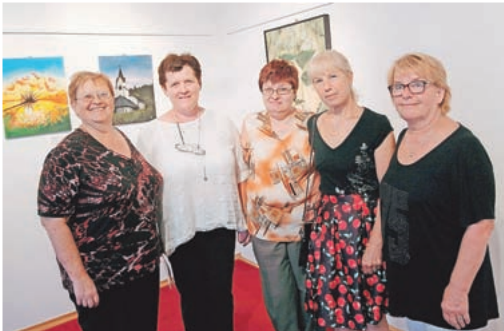
V Atriju razstavljajo članice Medobčinskega društva slepih in slabovidnih Kranj.