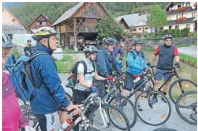
Med kolesarjenjem po Bohinju

v vaseh Ribčev Laz, Stara Fužina in Studor pa je vodnik udeležencem predstavil bogato naravno in kulturno dediščino tega območja. Ob postanku v centru TNP Bohinjka so jim predstavili tudi obsežno tematiko trajnostne mobilnosti na zavarovanih območjih narave. V okviru projekta Parkiraj in doživi naravo so predstavili tudi sistem info točk trajnostne mobilnosti in dve novi izposojevalnici koles – v agenciji Hike & Bike v Bohinjski Bistrici in v centru TNP Bohinjka v Stari Fužini, kjer bo skupno na voljo 14 koles s pripadajočo opremo.