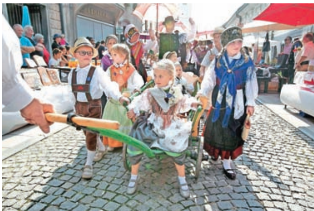
Tudi letošnja nedeljska povorka je bila pravi praznik za ljubitelje noš in paša za oči za številne obiskovalce.