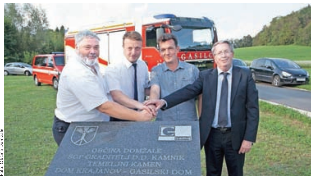
Slovesna postavitev temeljnega kamna za Dom krajanov – gasilski dom Studenc

Projekt je ocenjen na dobrih 410 tisoč evrov, objekt pa bo zgradilo podjetje SGP Graditelj Kamnik.