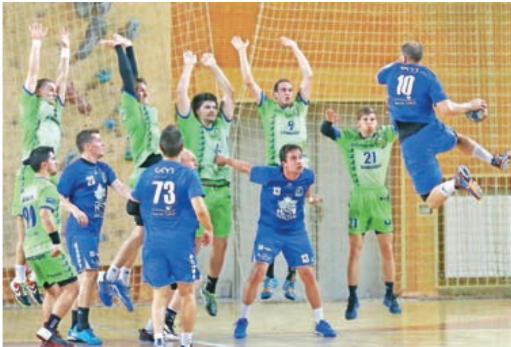
Loški rokometnaši so navijače navdušili s požrtvovalno igro, blesteli pa so zlasti v obrambi.