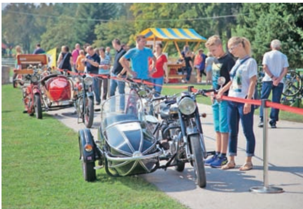
Čudovito okolico gradu so še dodatno popestrili starodobniki.

Dogajanje na gradu so popestrili z otroškimi delavnicami, med katerimi je bil tudi lov na krokodile, demonstracijo golfa in lokostrelstva ter razstavo starih motorjev in avtomobilov, ki so jo pripravili v sodelovanju z Društvom starodobnih