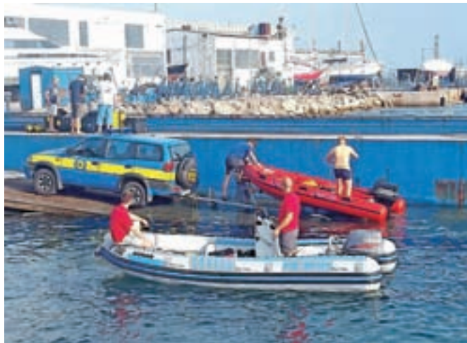
Na reševalni vaji v Izoli je sodelovalo osemdeset reševalcev in podpornih članov iz Slovenije in Avstrije.

V postopkih reševanja na vodi in iz vode, podvodnega reševanja, vključno s skupnim transportiranjem reševalne opreme, namestitvi jo in samozadostnostjo reševalnih enot se je od petka do nedelje urilo okoli 80 reševalcev in podpornih članov iz Slovenije in Avstrije. »Izkazalo se je, da je bila vaja izredno koristna in potrebna, saj se je pokazalo, da je za večji del članov podpornih služb in HNS Celice Gorenjske to prva takšna izkušnja, zato se je v začetni fazi pojavilo kar precej težav pri usklajenem oziroma koordiniranem delovanju različnih reševalnih enot, ki pa so se skozi nadaljnje urjenje odpravile,« je po končani vaji povedal Hudohmet.