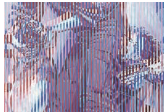
Nagrajeno delo: RingaRosesX_70x100cm_W / Foto: arhiv Kaje Urh

Razvijajo se ne le kot odziv na dosežke predhodnih generacij, ampak tudi kot odziv na sodobno kulturno pokrajino. V dobi instant medijev je slikarstvo s fotografijo (v najširšem pomenu besede) sklenilo pakt ter na novo opredelilo in razširilo svoj konceptualni doseg,« je povedala Urhova, ki v svojem delu še vedno sledi osnovam, ki si jih je zadala ob startu v poklicno prakso. »Tehnološki razvoj me je že davno povozil, sam vpogled v relacije med tradicionalnim in sodobnim pa je vedno na voljo – in v to se usmerjam. Razpoložljivost različnih sredstev za zajem podobe, mediji in splet omogočajo, da se fotografski viri ne razmnožujejo le skokovito, ampak postajajo tudi vse bolj bežni in sestavljeni. Manipulativnost podob in medijev me privlači. Podlaga za moje slike so vedno s spleta vzete podobe. Pri predstavitvi slike (podobe), ki je šla že večkrat skozi spremembe in interpretacije različnih medijev,