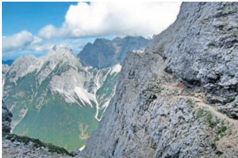
Polica na znameniti Jubilejni poti

Pot se strmo vzpenja, v pomoč so nam brezhibne jeklenice, so pa tudi mesta, kjer ni varoval. Ob rdečkasto-rumenkasti steni se usmerimo levo proti »zloglasnemu« kaminu, ki je včasih, ko pot še ni bila tako dobro opremljena z varovali, predstavljal strah in trepet. Kamin je visok približno 15 metrov, rahlo previsen in povsem navpičen in zračen. Številne