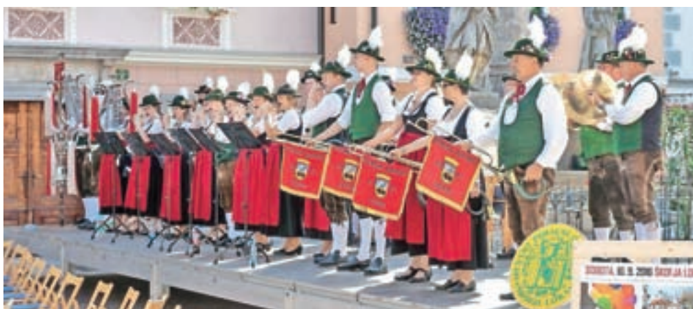
Na loškem Mestnem trgu je zaigrala gasilska godba iz Freisinga.