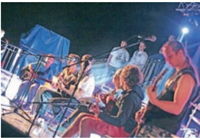
Kitarski orkester je s pestrim glasbenim repertoarjem ogrel in navdušil številno publiko.

koncerte letos preselili iz pokrite dvorane na Stari Savi na osrednji trg pri Kolpernu, kar se je izkazalo za izvrstno odločitev, saj gre za enkraten ambient pod zvezdami z odlično akustiko, ki je navdušila poln trg. Obiskovalci pa so enoglasno poudarjali, da Jesenice potrebujejo več tovrstnih dogodkov. Festeelval se je zaključil v nedeljo z 'drive-in' kinom in gorskim tekom na Lenčkov špik.