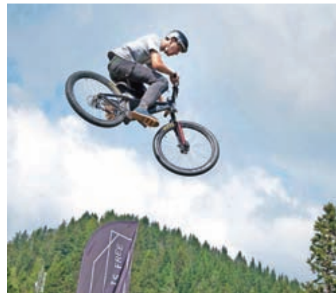
Gledalci so uživali v zanimivih skokih kolesarjev.

Na festivalu, ki je združil tako urbane kot gorske kolesarske zvrsti, so se tekmovalci med drugim lahko preizkusili v enduru, spustu, ciklokrosu, na pumptracku. Gledalci pa so uživali tudi v atraktivnih skokih in akrobatskih veččinah kolesarjev.