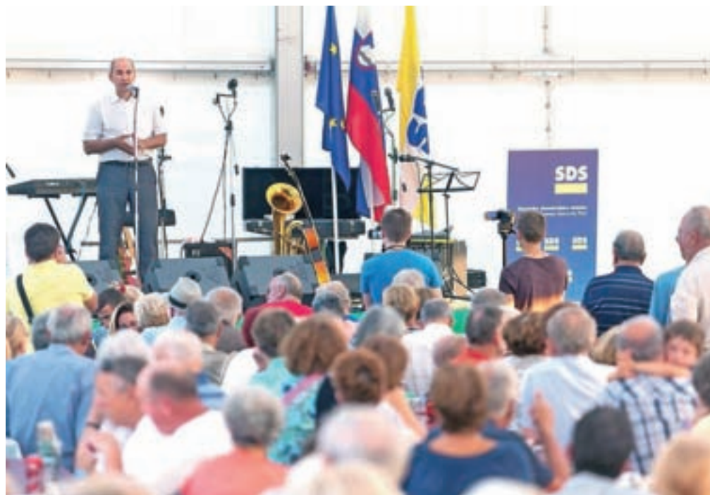
Okoli petsto udeležencev petkovega srečanja članov gorenjskih odborov SDS je nagovoril predsednik stranke Janez Janša.

»Brezposelnost je dejansko deloma padla, a bistveno bolj, kot se je povečala zaposlenost. Zato, ker na deset tisoče naših rojakov, predvsem iz severovzhodne Slovenije, dela v Avstriji. Če ima tukaj kdo velike zasluge, je to avstrijsko gospodarstvo, ki zaposluje na deset tisoče naših rojakov, ki pa jih naša oblast skuša še dodatno obdavčiti,« je bil kritičen Janša. »Na tisoče izšolanih mladih se izseljuje v tujino, na deset tisoče naših rojakov dela v Avstriji, namesto doma,« je dejal Janša, ki meni, da ob tem država bistveno preveč denarja namenja za begunce, migrantska politika je po njegovem mnenju tudi vzrok za številne trenutne težave v Evropski uniji. »Iz EU odhaja Velika Britanija, ki predstavlja dvajset odstotkov evropske ekonomije, ki najmočnejša vojaška sila znotraj EU ... Odšli so zaradi napak pri migrantski politiki,« je prepričan Janša.