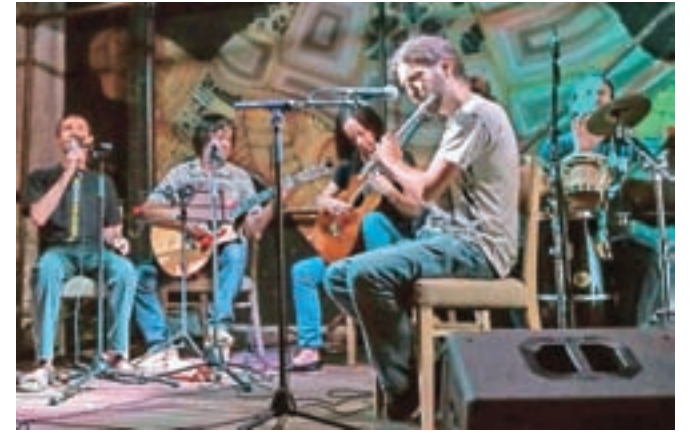
Koncert ob tridesetletnici delovanja: Tantadruj na terasi Layerjeve hiše

Tantadruj na glasbeni sceni že trideset let