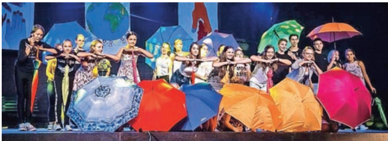
Muzikal Svet je tvoj v izvedbi Mladinskega pevskega zbora Osnovne šole Orehek si je ogledalo že blizu 2500 gledalcev. V nedeljo so ga uprizorili na odru Letnega gledališča Khislstein.