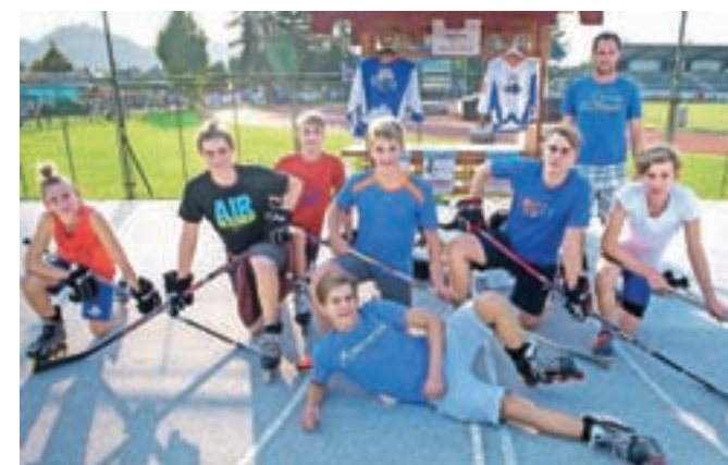
Svoj šport so predstavili tudi hokejisti kranjskega Triglava.