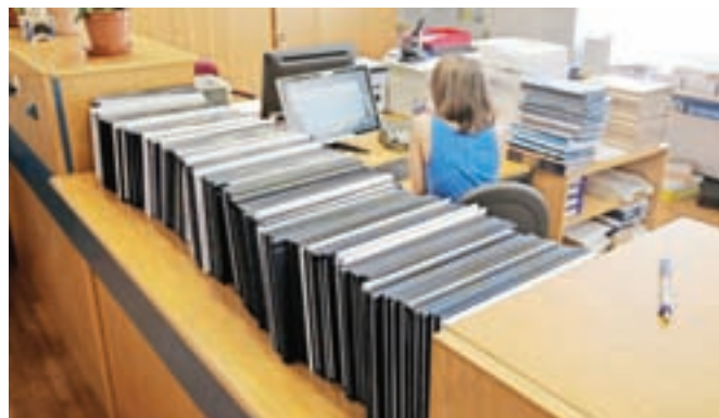
Na kranjski fakulteti za organizacijske vede imajo ta čas odobrenih približno šeststo petdeset tem diplomskih nalog »predbolonjskih« študentov.

Kranj – Čas za dokončanje starih predbolonjskih študijskih programov se počasi izteka, kar je v zadnjem obdobju povzročilo velik pritisk na fakultete. Študentov, ki čakajo za zaključek študija, je po ocenah celo več kot deset tisoč, opozarjajo v Študentski organizaciji Slovenije. Pobude za podaljšanje roka za dokončanje študija ne podpirajo, prizadevajo pa si za spremembo meril za prehode, po katerih bi se lahko ti študenti brez težav prepisali v sorodne nove, bolonjske programe. Prav tako so poudarili