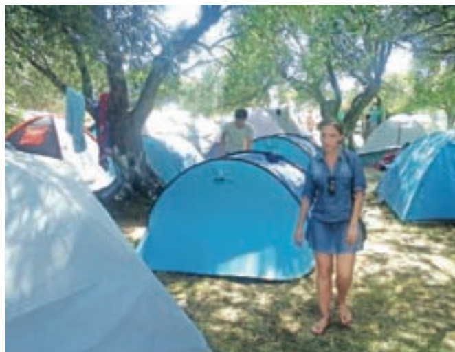
Kampiranje pod oljčnimi drevesi

Kljub temu da Albanija slovi – pretežno tudi zaradi izolacionizma v komunističnem obdobju – kot nekoliko zaprta in turistično dokaj neizkoriščena država, pa je zaradi svoje priobalne lege že od prazgodovine tesno vpeta v prekomorske poti po Sredozemskem in Jadranskem morju. Pristaniško mesto Drač je albansko okno v svet, saj tu poleg tovornih ladij pristajajo tudi trajekti, ki povezujejo Albanijo predvsem z jugom Italije. Drač se lahko pohvali tudi z ohranjenim rimskim amfiteatrom, sodobnim arheološkim