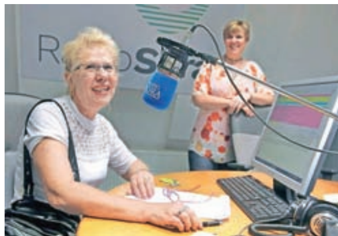
Obiskovalci so si lahko ogledali tudi radijski studio in sedli za mikrofona.