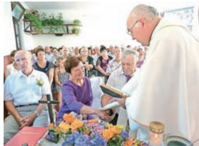
Zlatoporočenca sta ob prisotnosti sorodnikov, prijateljev in sosedov na domači kmetiji obnovila poročne obljube.