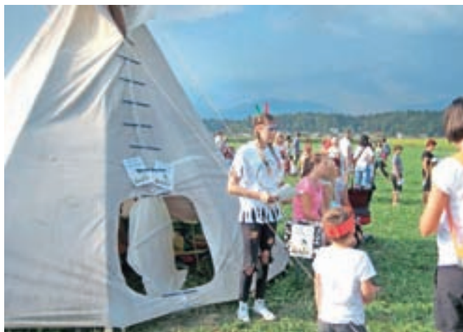
Po opravljenih preizkušnjah so lahko vstopili v poglavarjev šotor in dobili indijansko ime.

Pesmi pošljite na elektronski naslov pesmi.mladih@gmail.com ali pisno na naslov: Gorenjski glas, Bleiweisova cesta 4, 4000 Kranj.