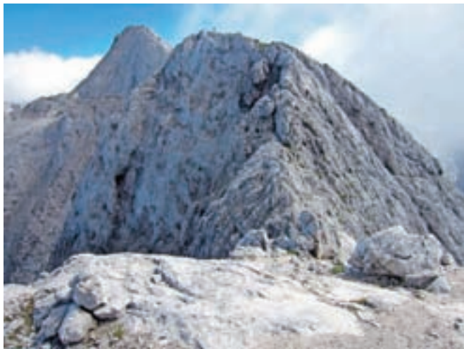
Greben Prisojnika z vrhom v ozadju