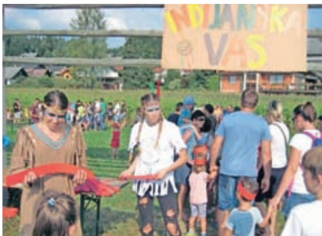
Ob vstopu v indijansko vas je vsak otrok najprej dobil indijanski trak okrog glave.