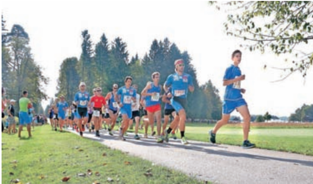
Triglav tek je med tekači zelo priljubljen. Takole so se podali na 10 in 21 kilometrov dolgo progo.

Posebnost so tudi ambasadorji teka – številni znani športniki – in večina se jih je podala na desetkilometrsko progo. V boju za zmago smo videli biatlonski obračun med Jakovom Fakom in Rokom Tršanom, ki ga je v ciljnim sprintu dobil Fak. »Današnja zmaga zame ni velik pokazatelj pripravljenosti. Osredotočen sem bolj na zimo in na svoj šport. Takšna prireditve je za zraven, sem pa vesel, da sem sodeloval. Seveda je vedno lepo zmagati in zmage si tudi vedno želim. Vesel sem, da je na Triglav tek prišlo toliko ljudi, tudi otrok. Upam, da bom v prihodnje tukaj tekel z družino,« je povedal novopečeni očka Jakov Fak, ki je na tem teku tekel prvič. Za biatlonecema je