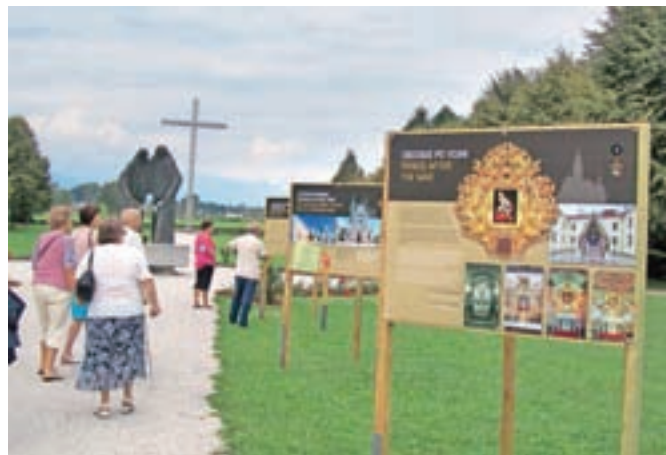
Razstava o nastanku in razvoju Marijinega svetišča na Brezjah v parku miru