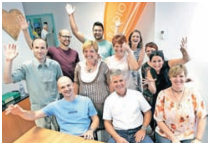
Del ekipe Radia Sora, ki ima sicer več kot petindvajset sodelavcev.