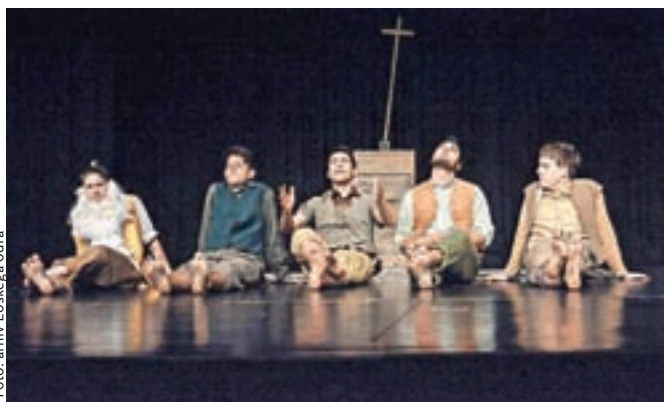
Ko Butalci pridejo v Loko, je takoj vse jasno.