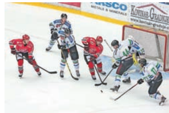
Jeseničanom v domači dvorani ni uspelo premagati Ljubljčanov.

Jeseniški hokejisti so nato v nedeljo gostovali v Celovcu in zabeležili visoko zmago proti mladi ekipi KAC, ki so jo premagali kar z 1 : 9. Do konca pripravljalnega dela Jeseničane čaka le še tekma danes v Tivoliju, v soboto pa bodo ob 18.30 na domačem ledu že nastopili na prvi tekmi novega tekmovanja AHL, ko na Jesenice najprej prihaja ekipa Gardene.