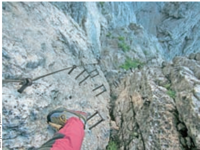
Znameniti kamin v Kopiščarjevi poti na Prisojnik

Nadmorska višina: 2547 m Višinska razlika: 1000 m Trajanje: 7 ur Zahtevnost: ★★★★★