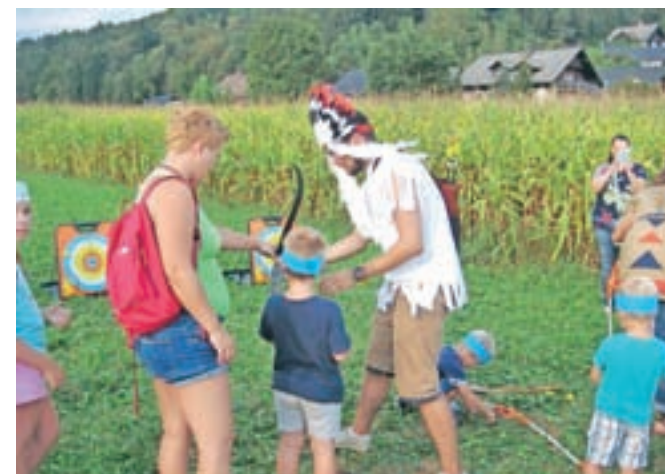
Kot pravi Indijanci so se preizkusili tudi v streljanju z lokom.

POTOVANJA • VINO • HRANA • DOGODIVŠČINE • MOŠKI • ŽENSKÉ • POTOVANJA • VINO • HRANA • ŽENSKÉ