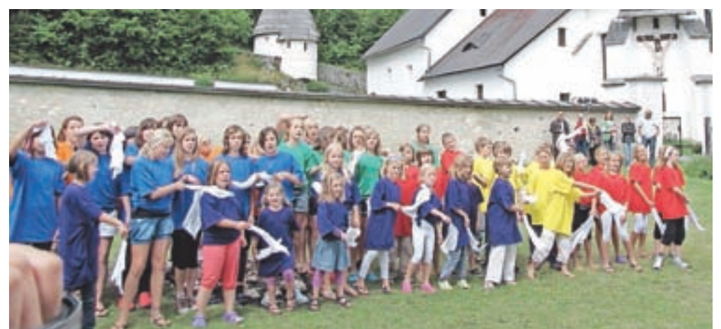
Jutri se končuje prvi del Tedna mladih umetnikov na Rebrci. V ponedeljek ga začne druga skupina. Vsaka konča bivanje na Rebrci s plesnim in pevskim nastopom. Moto letošnjega ustvarjanja je Sen kresne noči.