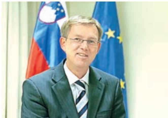
Premier Miro Cerar kljub zaostrenim razmeram v Evropi ugotavlja, da je Slovenija še vedno varna država.