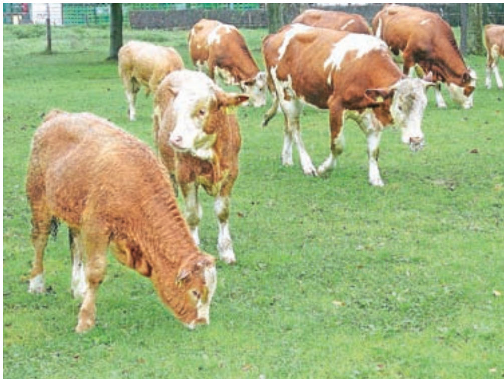
Uprava za varno hrano, veterinarstvo in varstvo rastlin opozarja govedorejce, da so pozorni na izvor živali in da vsak sum na pojav bolezni takoj sporočijo veterinarski organizaciji.

Na republiški upravi za varno hrano, veterinarstvo in varstvo rastlin so povedali, da so glede na razvoj bolezni v regiji takoj začeli z aktivnostmi, s katerimi bi preprečili vnos in širjenje bolezni. Junija so organizirali izobraževanje za rejce in vete-