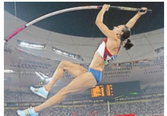
Jelena Isinbajeva (1982), ruska atletinja iz Volgograda, še vedno upa, da bo smela nastopiti na OI v Rio, v skoku v višino s palico je pač najboljša na svetu.