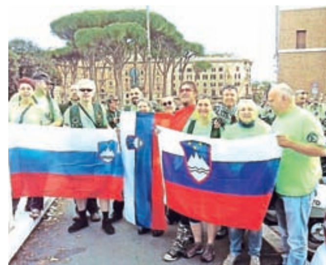
Da se je vedelo, od kod prihajajo, so ob njih povsod plapolale slovenske zastave.

bila lahko del te zgodbe, ki je bila od vseh poti do sedaj najmočnejša in najbolj nabita s čustvi. Res je, človek je tisto,