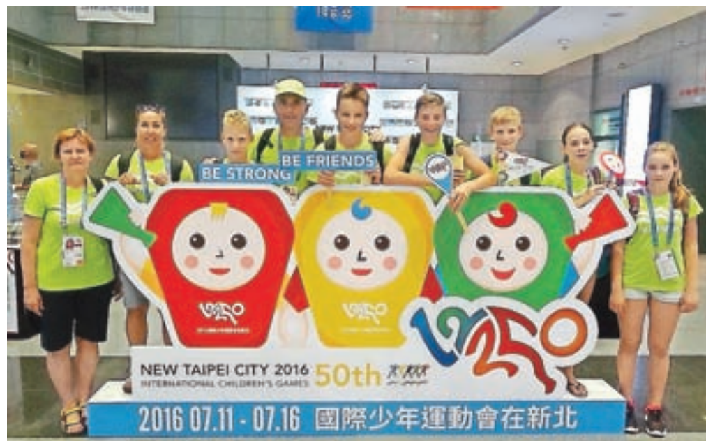
Ekipa iz Gorij, ki se je udeležila Mednarodnih otroških iger na Tajvanu.

»Ganljiv je bil tudi sprejem doma, kjer so nas pred osnovno šolo v Gorjah pozdravili starši, župan, podžupan in ravnatelj. Še enkrat hvala vsem, ki omogočate tovrstne projekte,« je še povedal Nenad Pilipovič.