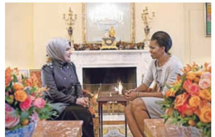
Ena odhaja, druga ostaja: Michelle Obama in Emine Erdogan, prvi dami ZDA in Turčije, ob srečanju v Beli hiši, 8. 12. 2009