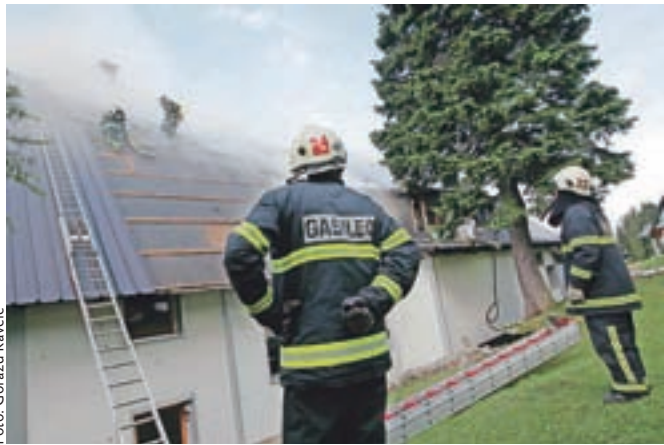
Včeraj zjutraj je bilo na prizorišču požara več kot trideset gasilcev, ki so hiteli reševati, kar je bilo še moč rešiti.

»Ker je bila brunarica že tri dni zaprta in ni bilo v njej nikogar, mislim, da je bila vzrok za požar strela. Seveda to sedaj še ni raziskano in počakati je treba na rezultat preiskave. Dejstvo je, da je škoda ogromna, k sreči pa ni bilo v objektu nikogar in tako tudi ni poškodovanih,« je še povedal Luskovec.