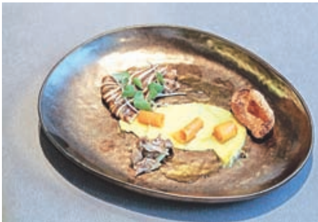
Pujsek od glave do pete