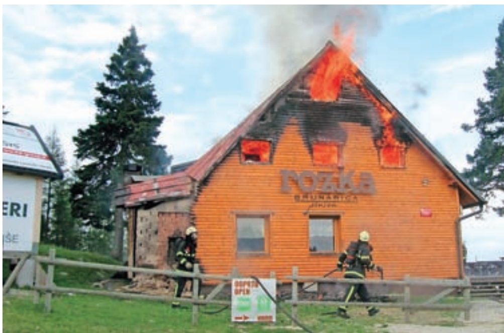
Ob prihodu gasilcev je bila Rozka že v plamenih.