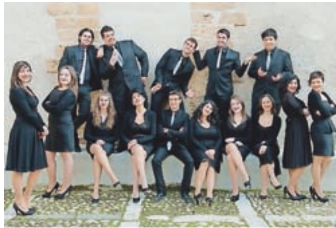
Vokalna skupina Euphoné izvaja a capella renesančno in baročno glasbo.