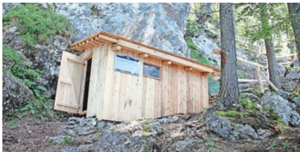
Zgledno prenovljena mala partizanska bolnišnica na Mežakli

zahvaljujejo vsem, ki so pomagali pri obnovi partizanske bolnišnice, zlasti pa Občini Jesenice, markacistom in vodji kranjske enote Zavoda za varstvo kulturne dediščine Milošu Ekarju. Prenovljena bolnišnica bo uradno odprta ob prazniku krajevne skupnosti Podmežakla 13. avgusta.