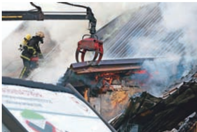
Zgoreli streha, ostrešje in zgornje nadstropje brunarice Rozka, vzrok požara pa včeraj še ni bil znan.