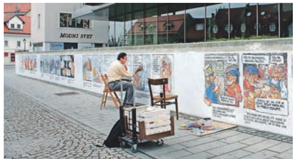
Kranjčani so z odobravanjem spremljali poslikavanje zidu pred knjižnico. Nekateri so celo vsakodnevno spremljali, kako napreduje Pravljica o stolpu in palčku.