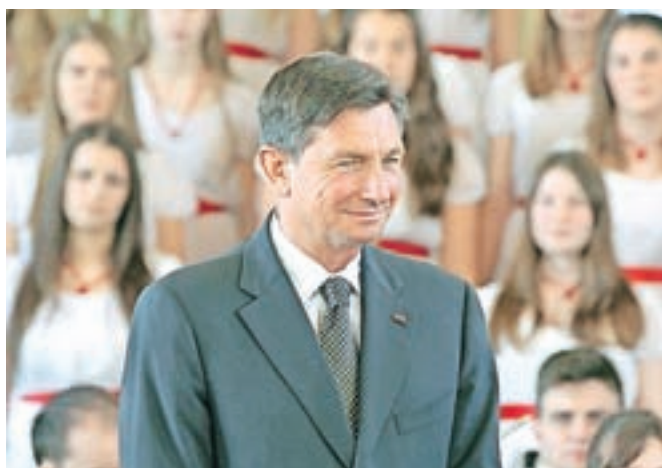
Predsednik Borut Pahor je v začetku tedna gostil predsednika Bolgarije Rosena Plevnelieva.