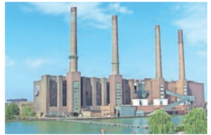
Matična tovarna Volkswagen v Wolfsburgu, po uporabni površini doslej največja na svetu

Jelena Isinbajeva, dvakratna olimpijska prvakinja in svetovna rekorderka v skoku s palico, v letih 2013–2015 ni tekmovala, postala je mama. Tedaj je napovedala: »Vse bom podredila nastopu na olimpijskih igrah v Rio de Janeiru. To je moj cilj.« A se je znašla v veliki skupini 67 ruskih atletov, ki ji je Mednarodna atletska zveza zaradi »sistemskega državnega dopinga« prepovedala olimpijski nastop. Res škoda! Isinbajeva je še veljavni svetovni rekord postavila pred šestimi leti na mitingu Weltklasse v Zürichu. Preskočila je 5,06 metra!