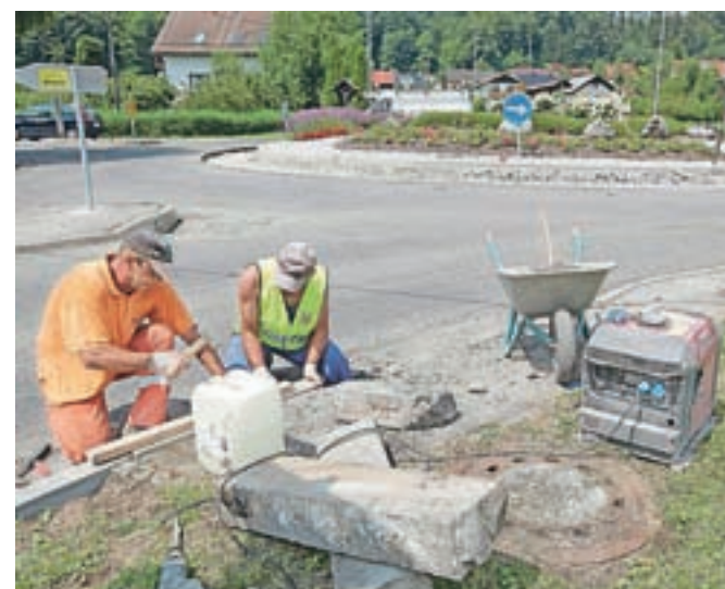
Krožišče v Podgorju bo v celoti prenovljeno.