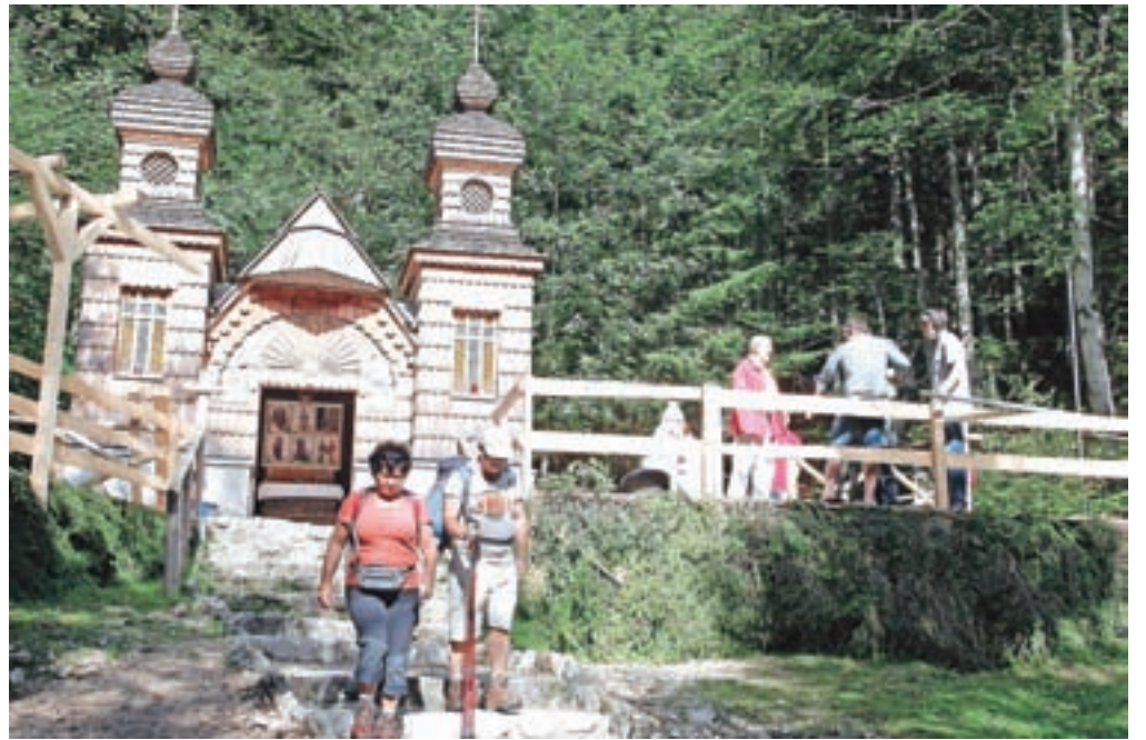
Rusko kapelico so zgradili leta 1916 v spomin na ruske vojne ujetnike, ki jih je pri gradnji ceste na Vršič zasul plaz. Postala je simbol rusko-slovenskega prijateljstva.