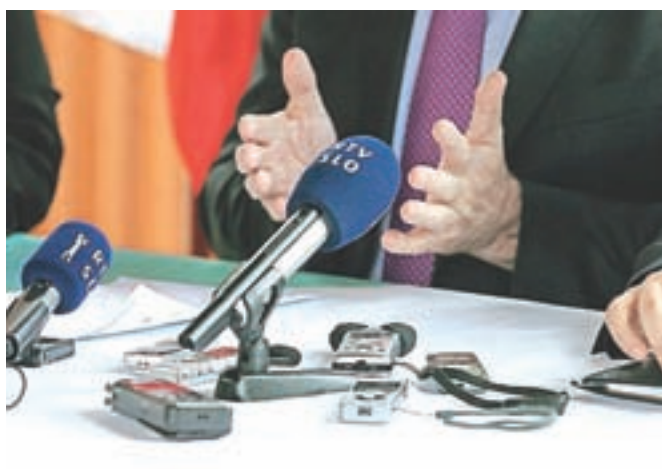
Na RTVS zanikajo, da je vrhovno sodišče pritrdilo Nataši Pirc Musar.