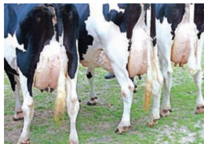
Le kako je ime tem trem kravam, odličnim mlekaricam!?

...), po državah, mestih, rekah, gorah, dolinah (Amerika, Bosna, Indija, Irska, Barcelona, Lizbona, Irska, Nevada, Volga, Golica, Savica, Planica, Kropa ...), po avtomobilskih znamkah (Mazda, Mercedes, Honda ...), glasbenih zvezdah (Ceca, Severina, Sidarta ...). Nekatere imena odražajo nacionalno, etnično, geografsko pripadnost (Belgijka, Tajka, Ciganka, Slovenka, Dolenka, Gorenka, Štajerka, Blejka ...), druga lepe in manj lepe značilnosti, lastnosti in posebnosti žensk (Avša, Bajsa, Trma, Čveka, Zvita, Trapa, Špeca, Tamala, Šefica, Stara, Ritka, Ragla, Packa, Mona, Mis, Joška, Mevža, Luštna, Lumpa, Lepotica, Lajdra, Hopsa, Frajla, Trola, Borka ...). Zanimivo: štiriinštiridesetim kravam je ime Bik.