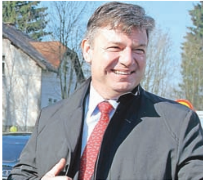
Minister za infrastrukturo Peter Gašperšič

»Danes smo vsi upravičeno nasmejanih obrazov, čeprav je bil čas, ki ga je bilo treba preživeti do izgradnje, nedvomno predolg,« je dejal minister in spomnil, da je bilo na začetku kar nekaj težav, od pomanjkanje sredstev do pritožbe, tako da je bila pogodba z izvajalci podpisana šele konec lanskega leta, nato je sledila zagotovitev potrebnih sredstev in realizacija