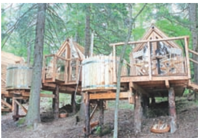
Hiške so del gozda ...