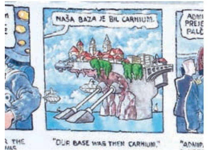
Bo Kranj na pomolu v prihodnosti videti takole?