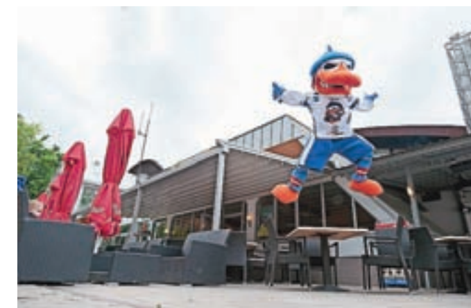
Blejski organizatorji vabijo na zanimiv hokejski turnir na Bled.

tekme proti ekipam s celoga sveta, se udeležijo kulturnih ekskurzij in si pridobijo