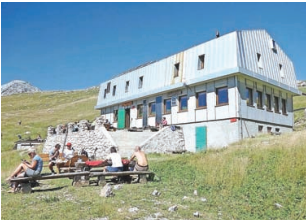
V Kamniški koči na Kamniškem sedlu letos opažajo porast tujih planincev.

Vreme vpliva na obisk tudi na Roblekovem domu na Begunščici. »Minula sobota je bila odlična, nedelja pa zelo slaba, in to le zato, ker so vremenoslovci omenjali nevihte, nato pa nismo imeli niti kaplje dežja. Kak dan imamo dom tako povsem poln, kak dan pa ne prenoči nihče. Cen se preprosto ne da primerjati s tistimi v dolini in pravi planinci razumejo, da moramo do planinskega doma vso hrano in