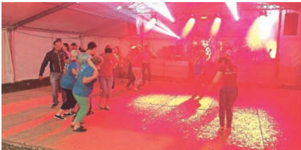
Poletje je tudi čas gasilskih veselic.

»Poskrbeti je bilo treba za šotor, parkirišča, redarstvo, varovanje, strežbo, nabavo, srečelov in kegljanje ter druge podrobnosti. Pri organizaciji in izvedbi veselice je sodelovalo kar okoli sedemdeset vaščank in vaščanov, ki so opravili številne prostovoljne ure, pri tem pa poskrbeli tudi za medsebojno druženje, za katerega