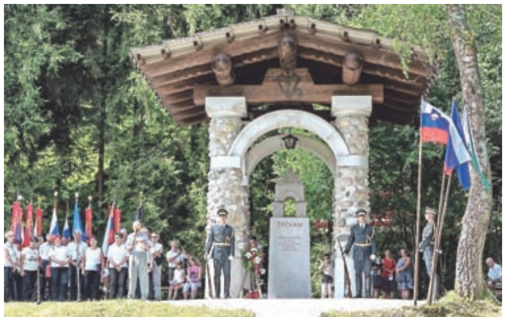
Poklonili so se spomnu padlih za svobodo.

danes lahko mislimo enako, ko družbo obvladuje divji kapitalizem, ko smo zadolženi za 32 milijard evrov, ko se razprodaja premoženje in ko nepošteno elite kopičijo denar na računih v tujini. Ni vse slabo, a manjka nam prodornih in poštenih politikov in gospodarstvenikov, je dejal govornik. Ob letošnji slovesnosti so pohodniki prvič krenili na pohod po poti Prešernove brigade iz Potoka prek Kala, Slemen in Stirpnika do Dolenje vasi, kjer so se pridružili slovesnosti.