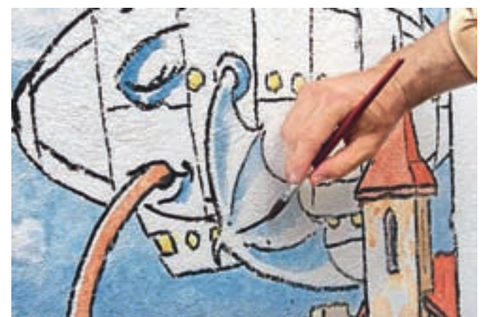
Še nekaj modre zmajevim krilom ...