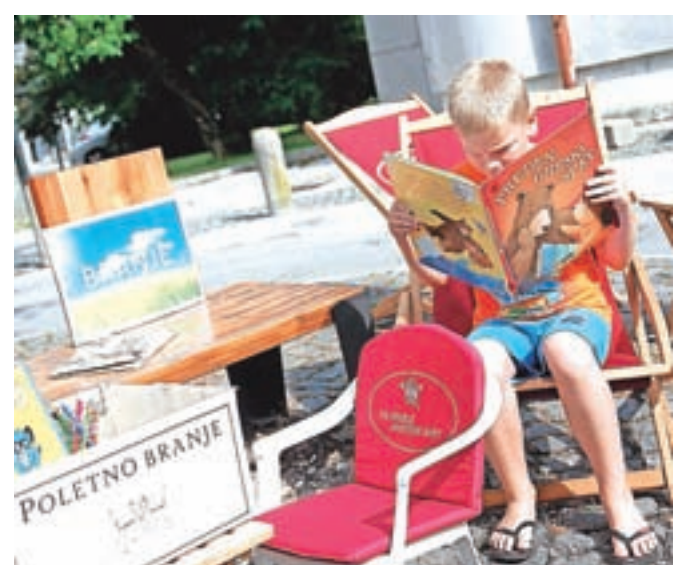
Poletno branje spodbujajo tudi z urejenim bralnim kotičkom pred knjižnico.

V radovljiški knjižnici spodbujajo poletno branje tudi z urejenim bralnim kotičkom v senci dreves pred knjižnico in pa s projektom Knjige na počitnicah. Knjige iz knjižnice so prenesli na lokacije, kjer se ljudje v poletnih dneh radi zadržujejo. Najdemo jih na radovljiškem kopališču, Grajskem kopališču, v kampu Šobec, Zaka in Danica, Kavarni Kino, Vili Podvin ... Bralci si tako knjigo lahko izposodijo brez članske izkaznice, jo preberejo ali samo prelistajo in jo vrnejo na označeno mesto.