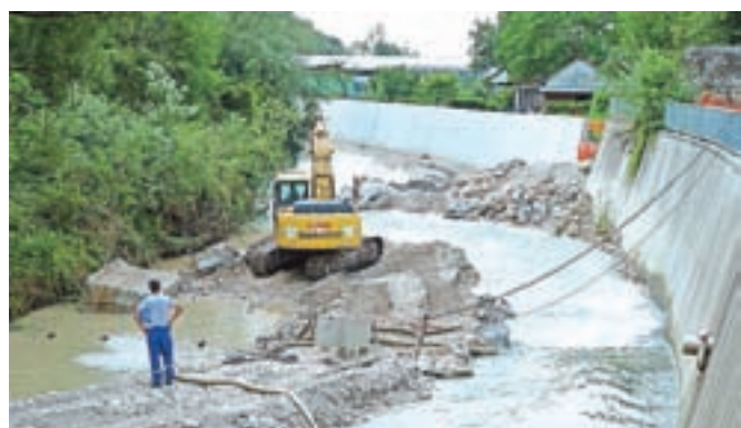
Izvajalec del Nivo Eko je že začel z deli na prvem pragu ob Športni dvorani Kamnik.

dobrih 92 tisočakov, saj so bila za izboljšanje poplavne varnosti nujno potrebna dodatna dela, s katerimi bodo preprečili nadaljnje poglobljanje struge. Ta se je na odseku pri športni dvorani v zadnjih osmih letih povprečno poglobila za meter in pol. Občina Kamnik mora skladno s pogodbo zagotoviti enajst odstotkov denarja, preostalo plača ministrstvo. Rok za izvedbo del je, kljub dodatnim delom, ostal nespremenjen, to je konec avgusta.