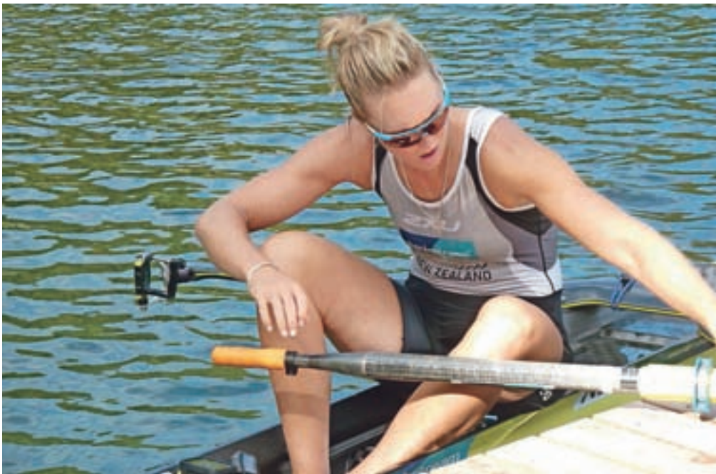
Svetovna prvakinja Emma Twigg sodi med favorite za olimpijsko odličje.