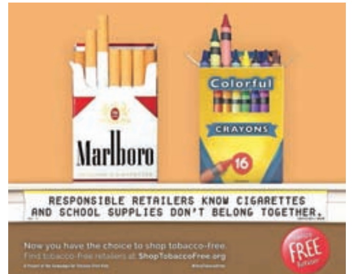
Letak Kampanje za otroke brez tobaka namiguje na pokvarjene prijeme, ki jih v svojih reklamah uporablja tobačna industrija.