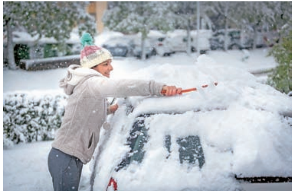
Na Gorenjskem je v sredo in do četrta zjutraj v nižinah zapadlo do dvajset centimetrov snega.