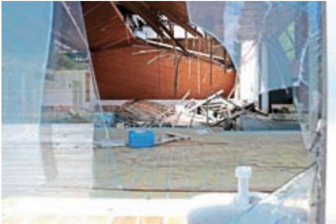
V Bohinju je najbolj problematičen Hotel Zlatorog, na sliki podrt bazen v hotelu.