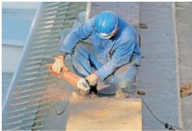
Največ kršitev pri delovnih razmerjih in varnosti pri delu je v gradbeništvu, ugotavlja inšpektorat za delo (slika je simbolična).