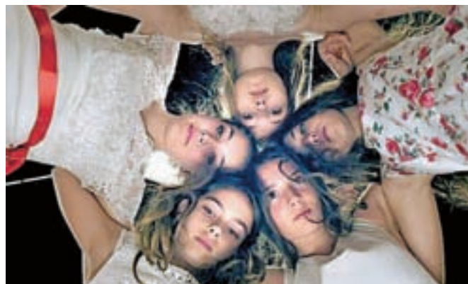
Iz filma Mustang

Prvi bo že v sredo, 4. maja, na dveh projekcijah ob 9. in