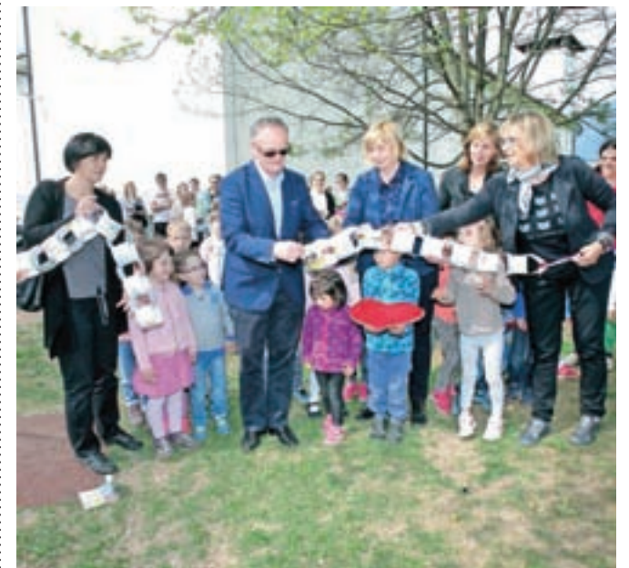
Nova igrala pri vrtcu Janček na Visokem, v katera je občina Šenčur vložila 25 tisoč evrov, so odprli s slovesnim prerezom verige.