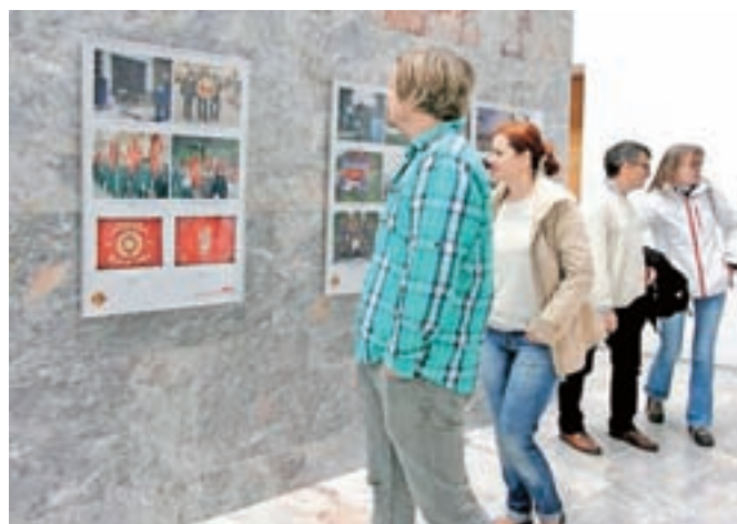
V Sokolskem domu je na ogled razstava ob 140-letnici PGD Škofja Loka