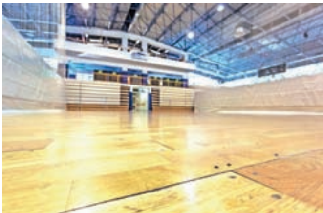
Nadzorni odbor se sprašuje, ali je bil del parketa v Dvorani trziških olimpijcev zamenjan, ker niso prejeli dokazil o opravljenih delih.

NO ni dobil zadovoljivih odgovorov kateri so ključni razlogi za ustanovitev Bios, kaj je glavno poslanstvo podjetja in kakšna so dolgoročna pričakovanja ustanovitelja. Med nepravilnostmi oz. pomanjkljivostmi podjetju očita drobljenje naročil večje vrednosti, plačevanje naročenih storitev pred zapadlostjo faktur, pomanjkljivo dokumentacijo v več primerih ... Iz pregleda tudi niso