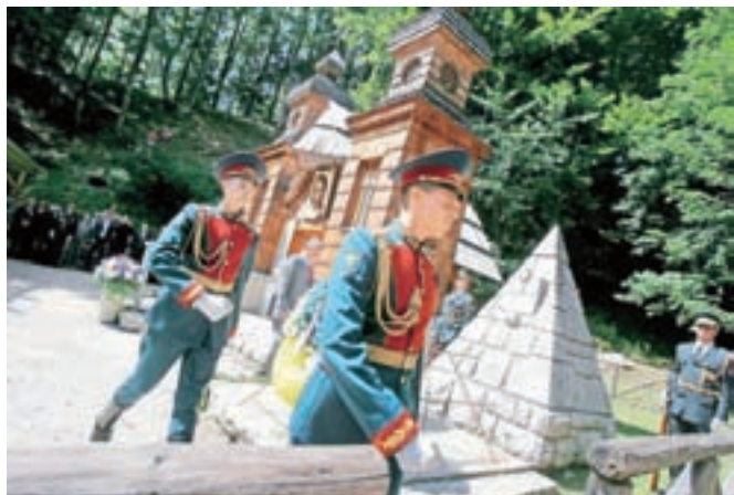
Ruskega predsednika Vladimirja Putina ob obisku slovesnosti pri Ruski kapelici na Vršiču ne bodo sprejeli z državniškimi častmi.