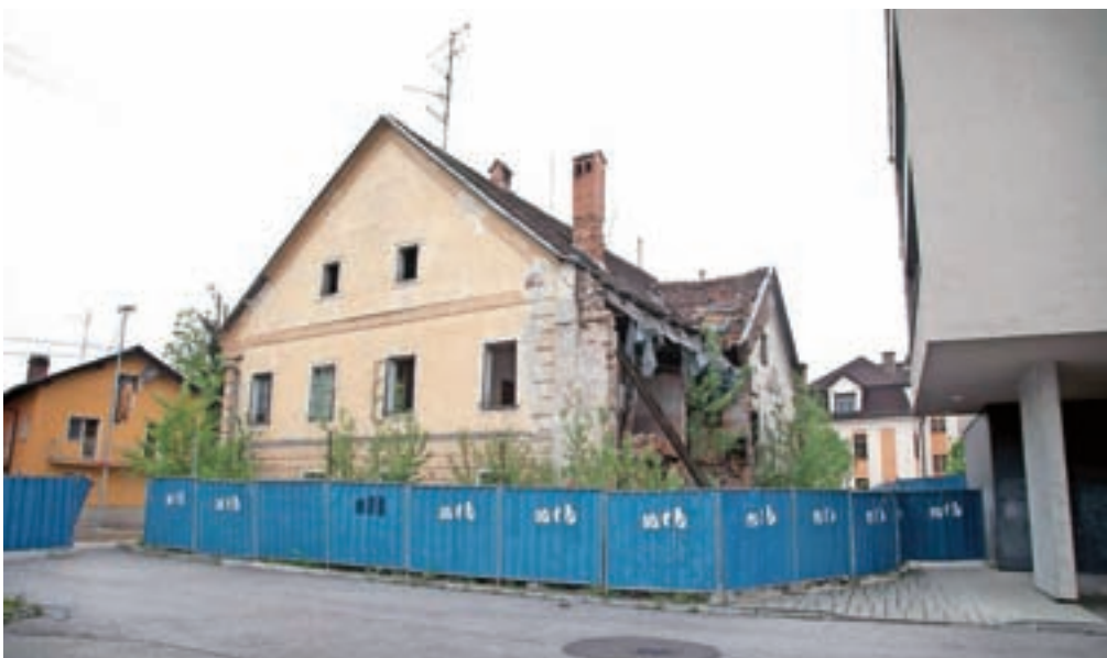
Propadajoča Kančeva hiša v središču Mengša