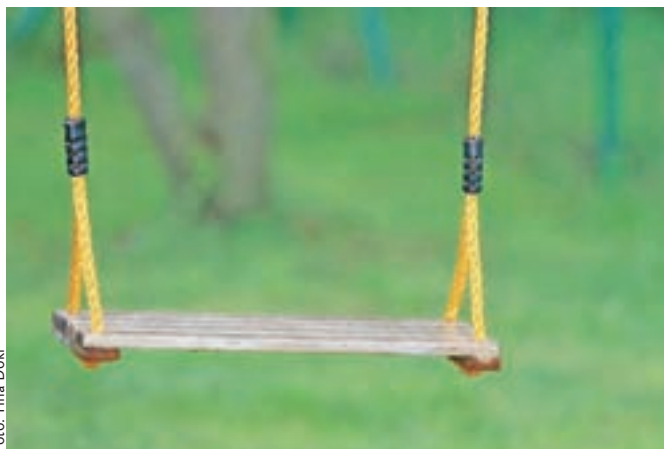
Stara starša dečkov, ki so ju konec marca namestili v rejniško družino, sta vložila dve tožbi zoper državo.