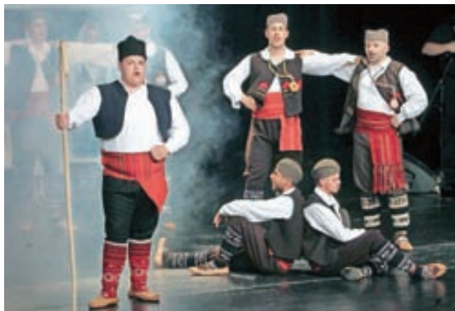
Oder so zavzeli ples, petje in tudi prikaz običajev.