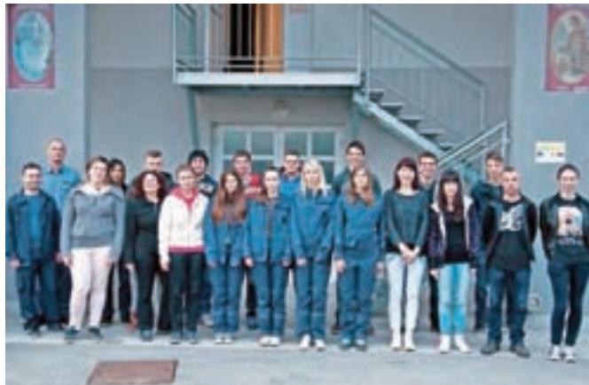
Marljivi udeleženci osnovnega tečaja za gasilce PGD Hotemaže

Gasilci PGD Hotemaže so že prvo četrtino letošnjega leta začeli s polno paro.