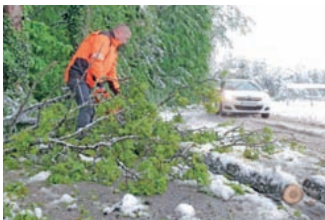
V sredo so imeli cestarji in gasilci največ dela z odstranjevanjem podrtega drevja s cest.

Jeseniški gasilci so na primer posredovali zaradi vej na električnih žicah, dreves, ki so ob Cesti maršala Tita padla na več avtomobilov, in polomljenih vej. Med drugim so odstranili drevo, ki se je podrlo čez cesto v Javnorški Rovt, ter več dreves na Tomšičevi cesti, ki so se podrli čez cesto in daljnovid. V Kamniku je prvo drevo pod težo snega klonilo že ob 15. uri, kmalu zatem je