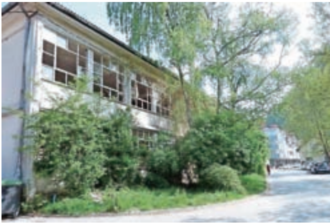
Ena od potencialno nevarnih stavb v Kamniku je zapuščeni objekt nekdanje tovarne Utok.

V Medvodah med propadajočimi objekti izstopata dva: nedokončana športna dvorana in nekdanji Sokolski dom, kjer je bil tudi zdravstveni dom. Nedokončana športna dvorana v neposredni bližini Partizana Medvod ni bila nikoli dokončana. Pred skoraj desetimi leti jo je od Colorja kupilo podjetje AlCu, ki naj bi tam zgradilo Poslovno-rekreacijski center Medvode. Od tega ni bilo nič. Objekt propada in ga že dlje časa prodajajo. »Pred časom se je izpostavil kupec, ki bi tam rad imel skladišča, a je medtem že odstopil od namere. Da bi bila tam skladišča, ni v skladu s strategijo občine. Menimo namreč, da je to območje namenjeno športnemu parku,« je povedal Nejc Smole, župan Medvod. Na javni dražbi pa je bil pred kratkim vendarle prodan nekdanji Sokolski dom ob regionalni cesti na klanecu v centru Medvod. Kupilo ga je isto podjetje kot zemljišče poleg. Gre za podjetje Hermes iz Železnikov. »Na občino so vložili vlogo za rušitev objekta. Z investitorjem smo že imeli sestanek in upam, da bomo na junijski seji občinskega sveta skupaj skušali najti predlog rešitve za ureditev tega, za podobo Medvod zelo pomembnega prostora,« je pojasnil Smole. Razmišljanja so, da bi bila v delu novega objekta lahko tudi neprofitna stanovanja, ki jih v občini manjka.