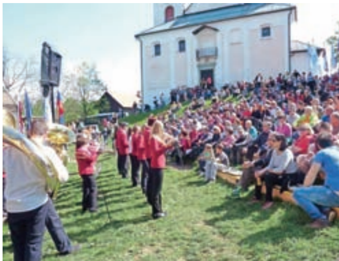
Z enega od preteklih prvomajskih praznovanj na Joštu