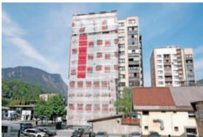
Ta čas poteka energetska sanacija z obnovo fasade še na zadnjih dveh jeseniških stolpnih v Centru II.

Kot so povedali na Občini Jesenice, ocenjujejo, da je bila v času od leta 2005