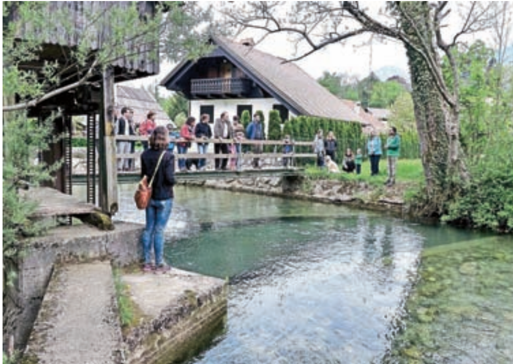
Udeleženci po poteh preddvorskih voda

Udeleženci so lahko spoznali bogastvo in izredno kakovost voda v občini Preddvor. Tako poleg tokrat predstavljenih vodnih točk, vodni izviri oz. zajetja iz občine Preddvor s svojo zelo kvalitetno (podzemno) vodo oskrbujejo pomemben del prebivalcev osrednje Gorenjske. Prav tako je na območju občine še lepo