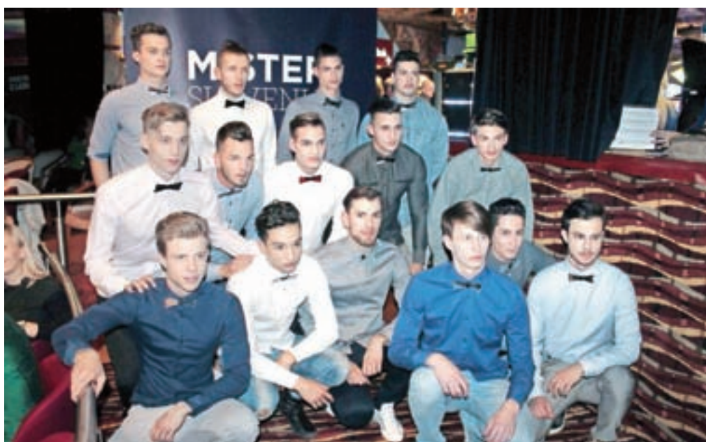
V polfinalnem izboru smo spremljali petnajst postavnih mladeničev, ki so v soboto vsi upali na najboljšo končno uvrstitev.