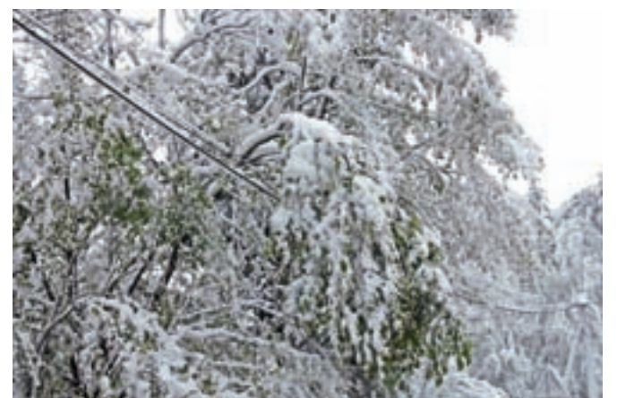
Povešeno in podrto drevje je marsikje po Gorenjskem ogrožalo električne vode.

Aprila po navadi sneži v začetku meseca, do tako poznega sneženja pa pride le redko, po 20. aprilu pa je nazadnje snežilo leta 1988, a ne tako obilno, tri leta prej je sneg padal celo v začetku maja. V preteklosti pa je snežilo tudi šele v juniju. Po podatkih agencije za okolje je tako pod 500 metri nadmorske najpoznejše snežilo 10. junija 1974 v Nomenju v Bohinju.