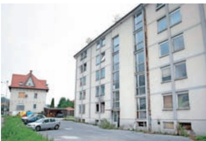
Zapuščen samski dom v Stražišču je ena največjih črnih točk v Mestni občini Kranj.