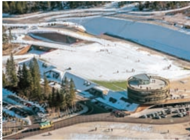
Nordijski center Planica je dosežek svetovnih razsežnosti.