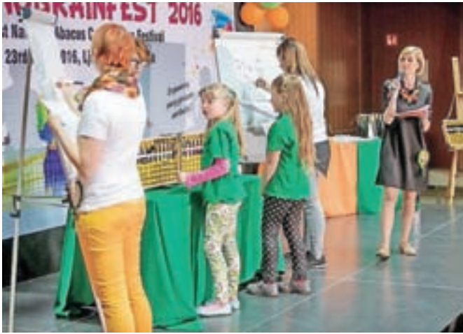
Tekmovalci v hitrostnem računanju