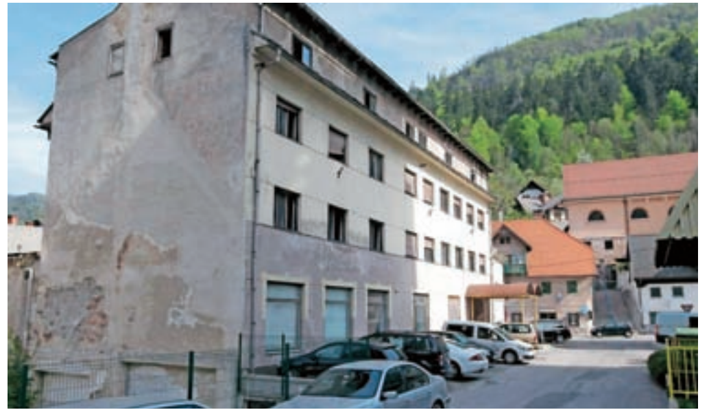
Nekdanji hotel Pošta na Jesenicah že vrsto let propada.

V Mestni občini Kranj zagotovo svojo okolico najbolj kazi in ogroža nekdanji samski dom delavcev Tekstilindusa v Stražišču, ki že slabo desetletje nezadržno propada. Pogosto ga obiščejo tudi nezaželeni gosti, o čemer pričajo razbita stekla, zasilno urejena bivališča, kupi smeti in tudi odvržene igle, v objektu je v preteklosti tudi že večkrat zagorelo. Kranjska občina in Krajevna skupnost Stražišče se že več let prizadevata za ureditev problema, tako so se novembra lani sestali tudi s sedanjim lastnikom ter z njim spregovorili o možnostih ureditve objekta, o načrtih glede nadaljnje usode objekta, pa tudi o nujnem fizičnem zavarovanju samskega doma. »Na tem sestanku je lastniku veljalo posebno opozorilo in poziv k zavarovanju dostopa in vstopa in objekt, kar je bilo po zagotovilih lastnika tudi storjeno, vendar se stanje ne izboljša zaradi vandalizma,« so pojasnili na občini. Podatkov o lastniku nam niso posredovali,