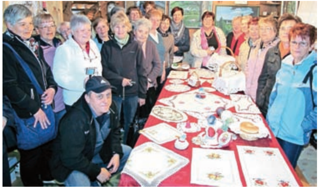
Gostje iz Rečice ob Savinji so si z zanimanjem ogledale izdelke skupine ročnih del Rožce z Zgornjega Brnika.