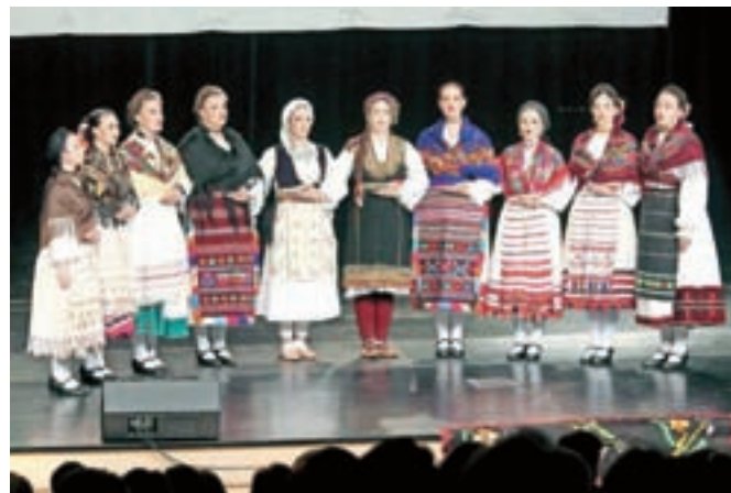
Brđanke so nastopile s Proklet da je jagodo (Bosilegradsko Krajište), Što morava mutna teče (Kosovo) in Ide lola u čarapama beli (Vojvodina).