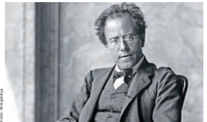
Sloviti avstrijski skladatelj Gustav Mahler je svojo službeno pot začel kot slabo plačan dirigent v Ljubljani, 1881–1882.