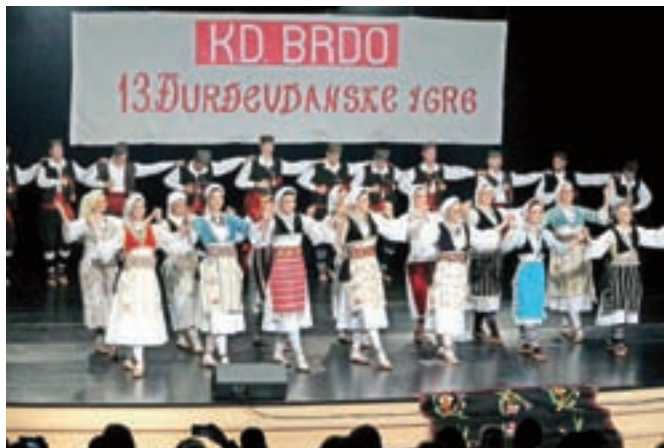
Vriski z odra in topotanje plesnih korakov, energija plesalcev in barvitost zvoka so preplavili prav vsak kotichek v dvorani.