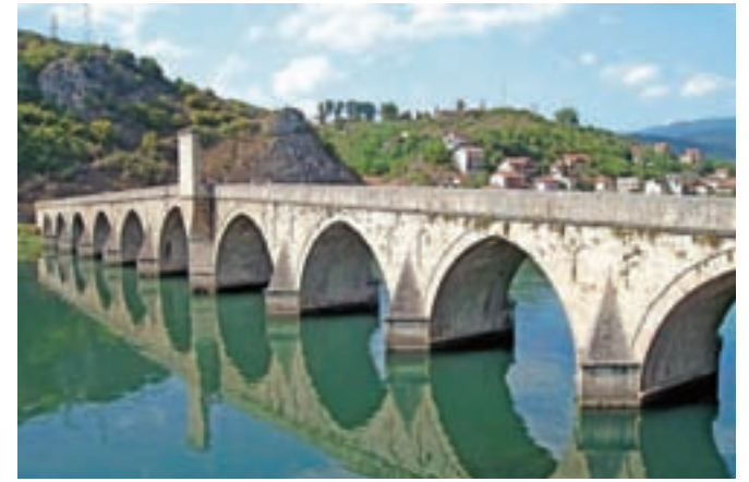
Most Mehmed Paše Sokolovića (zgrajen 1577) v Višegradu, velika stvaritev osmanske arhitekture in glavni junak Andrićevega romana Mosta na Drini (1945)