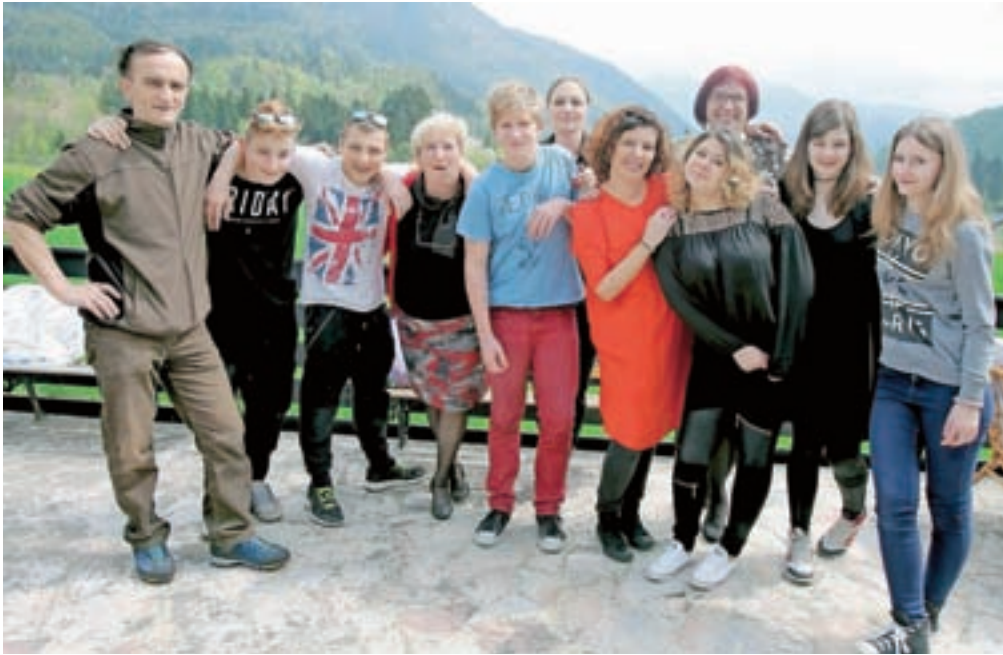
Današnji stanovniki zavodske stanovanjske skupine Črnava

Tako je zadnji dve desetletji, otroke in mladostnike z motnjami vedenja in čustvovanja vzgajajo v stanovanjskih skupinah po sedem ali osem. Pred tem je enako vlogo opravljal Vzgojni zavod Preddvor, pod njegovo