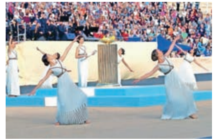
Olimpijski plamen so v sredo v Atenah na posebni slovesnosti predali organizatorjem olimpijskih iger. V Brazilijo bo prispel 3. maja.