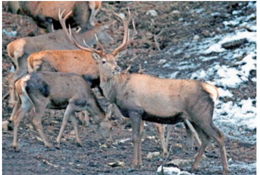
Lovci naj bi letos z odstrelom močnejše posegli v jelenjad.

Kranj – Minister za kmetijstvo, gozdarstvo in prehrano Dejan Židan je pred kratkim sprejel letni lovsko upravljavski načrt za Gorenjsko lovsko upravljavsko območje, ki obsega 40 lovišč in dve lovišči s posebnim namenom – Kozorog Kamnik in Brdo. Načrt so pripravili v kranjski in blejski območni enoti Zavoda za gozdove Slovenije, v postopku sprejemanja sta ga obravnavala strokovni svet in svet kranjske enote, lovcev, kmetom in drugim uporabnikom prostora pa so ga predstavili na javni predstavitvi v Lescah.