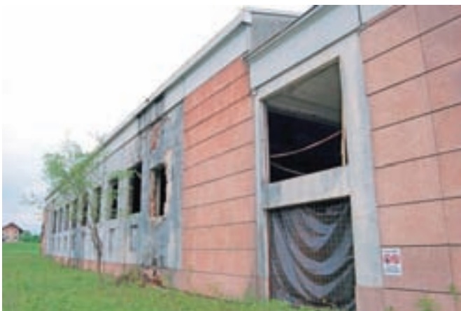
Propadajoča, nikoli dokončana športna dvorana, je ena izmed največjih medvoških sramot.