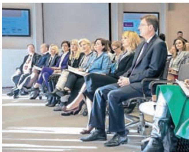
Mednarodno konferenco o ženskih voditeljicah je odprl predsednik vlade Miro Cerar.

Bled – Pretekli teden so že gostili mednarodno konferenco o ženskih voditeljicah kot nosilkah sprememb v Evropi. Konference se je udeležilo več kot sto vplivnih ženskih voditeljic iz 26 držav. Skupaj so ugotovljale, da zastopnost žensk na vodstvenih položajih prinaša številne ugodnosti, ne le za podjetja, temveč tudi za družbo. Zbrane je uvodoma nagovoril predsednik vlade Miro Cerar. Poudaril je, da so ženske pogosto premalo zastopane. Meni, da se morajo