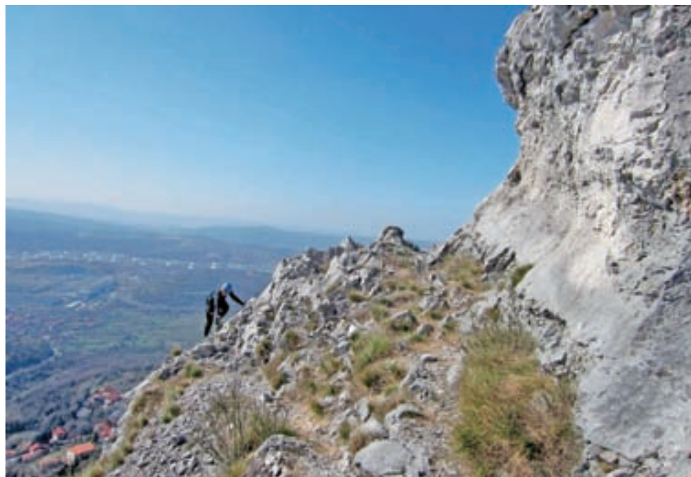
Na vrhu ferate Zimska roža

levi strani zagledamo smerekaz za Val Rosandro/Glinščico, zavijemo ostro levo in nadaljujemo do vasi San Lorenzo/Jezero, kjer lahko parkiramo na enem od parkirišč. Predlagam parkirišče takoj za vasjo, na levi strani, kjer je tudi nekaj metrov oddaljena razgledna točka, s katere je čudovit razgled na Tržaški zaliv. Po cesti se sprehodimo mimo odcepa ferate Bruno Biondi, še približno 500 metrov in smo pri potki, ki nas pripelje pod steno in do vstopa v Zimsko rožo, ki se začne z lestvijo. Možnost je tudi, da se lestvi izognemo, saj desno od nje