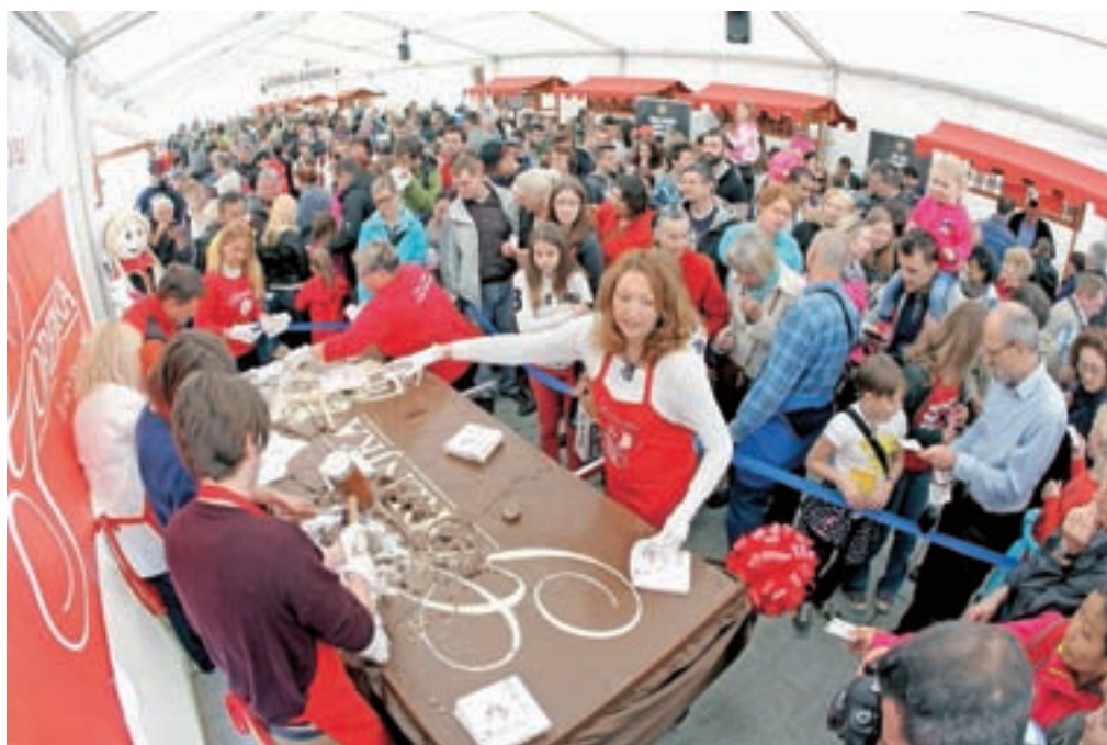
Radovljico je v treh festivalskih dneh obiskalo kar okoli šestdeset tisoč ljubiteljev čokolade. Gorenjino velikanko so tradicionalno razlomili v nedeljo popoldne.