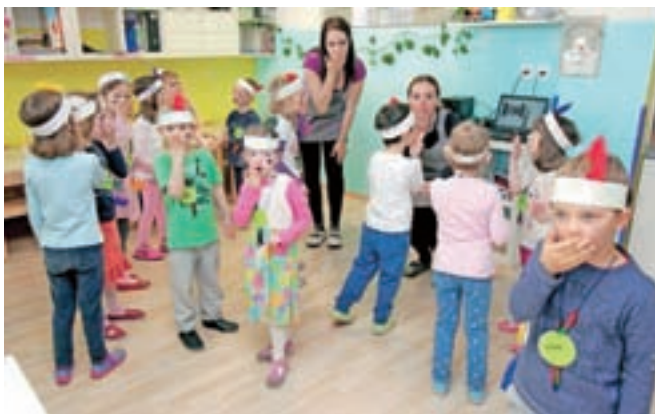
Otroci uživajo v indijanskih plesih.

mu je ples sonca. »Štiri dni so gledali v sonce, in to brez očal,« je dejal. Nika iz plemena Apačev pa nam je zaupala njihov jutranji pozdrav, ki se po indijansko glasi »hej ale ale«. Postavili pa so tudi pravo indijansko vas, ki so jo poimenovali Medvedje šape. Poglavar ima svoj šotor, ostali pa lahko posedijo okrog tabornega ognja ali se igrajo indijanske igre. »Otroci se zelo živijo,« se je ob pogledu na male »Indijance«, ki so se z značilnim indijanskim oglašanjem podili okoli, posmejala Sanja Vojnovič.