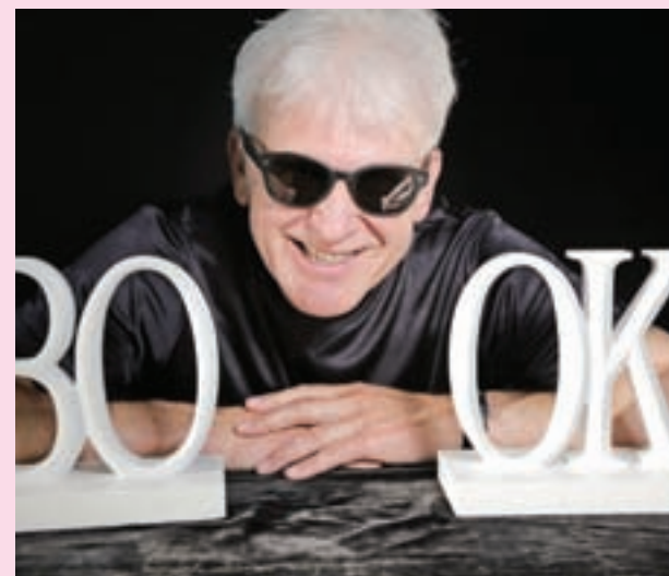
Za prijatelje...: Andrej Šifrer

Škofja Loka – V četrtek, 21. aprila, ob 19.30 bo v Kristalni dvorani Sokolskega doma koncert kantavtorja Andreja Šifrerja. Pevec in avtor pop glasbe bo prihodnje leto beležil 40-let delovanja v slovenskem glasbenem prostoru. Glasbenik je v karieri prodal že več kot pol milijona plošč in se je s svojim dolgim spiskom – zdaj že zimzelenih uspešnic – uvrstil na seznam tistih, ki jih radi kategoriziramo z oznako »legenda«. Za imidžem vedno nasmejanega gospoda iz Gorenjske se skriva tudi resna plat, tista, ki je prinesla diplomu pravne fakultete in piše med množico tudi razmišljujoče pesmi, odlikujejo pa ga bogata besedila, ki se zrcalijo v več kot 170 avtorskih pesmih.