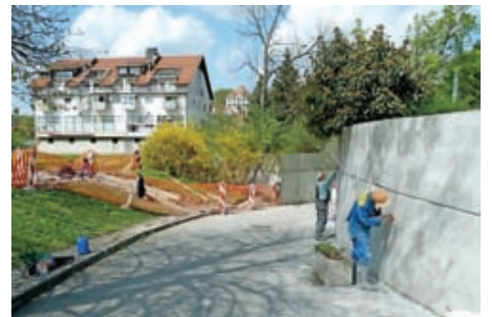
Starih grafitov v podhodu ni več, pešci pa se bodo že kmalu razveselili novih stopnic.