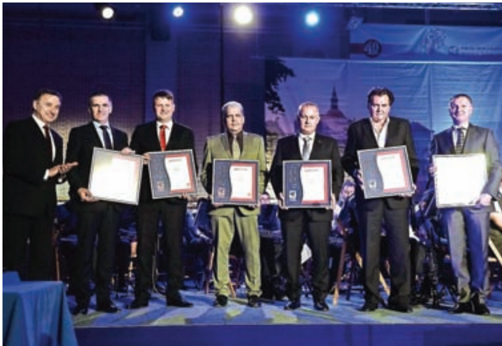
Dobitniki priznanj Obrtno-podjetniške zbornice Slovenije