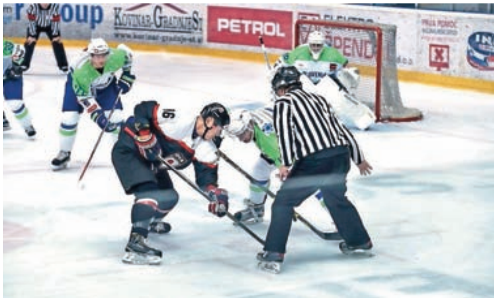
Naša hokejska reprezentanca je na sobotni pripravljalni tekmi v Podmežakli ugnala ekipo Japonske, s katero se bo pomerila tudi na prvi tekmi svetovnega prvenstva. / Foto: Primož Pičulin

»Vsak od nasprotnikov ima svoje kvalitete, in če hočemo zmagati na vseh tekmah, moramo vsak dan igrati na najvišjem nivoju. Ker nimamo prav velike baze igralcev, se nam seveda pozna tudi vsaka poškodba, vseeno pa mislim, da bomo tisti, ki smo zdravi in potujemo na prvenstvo tako dobro pripravljani in si želimo zmag, naredili vse, da znova zaigramo med elito. To je naš cilj, se pa zavedamo, da bo najbrž najtežja tekma s sosedi Avstriji, ki so skupaj z nami favoriti prvenstva. Prav ta tekma je zadnja, dejstvo pa je, da bodo pomembne prav vse tekme, saj želimo imeti vse v svojih rokah, ne pa da bi o nas odločali drugi.«