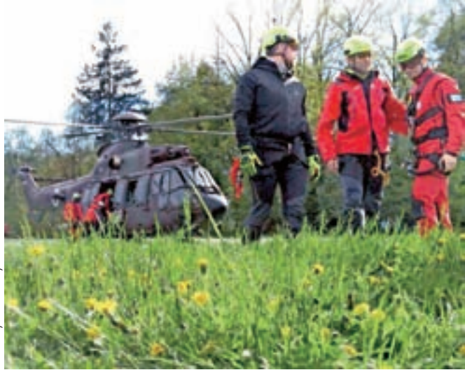
Reševalci GRS Škofja Loka na praktičnem delu usposabljanja – uporabi helikopterja v reševalni akciji