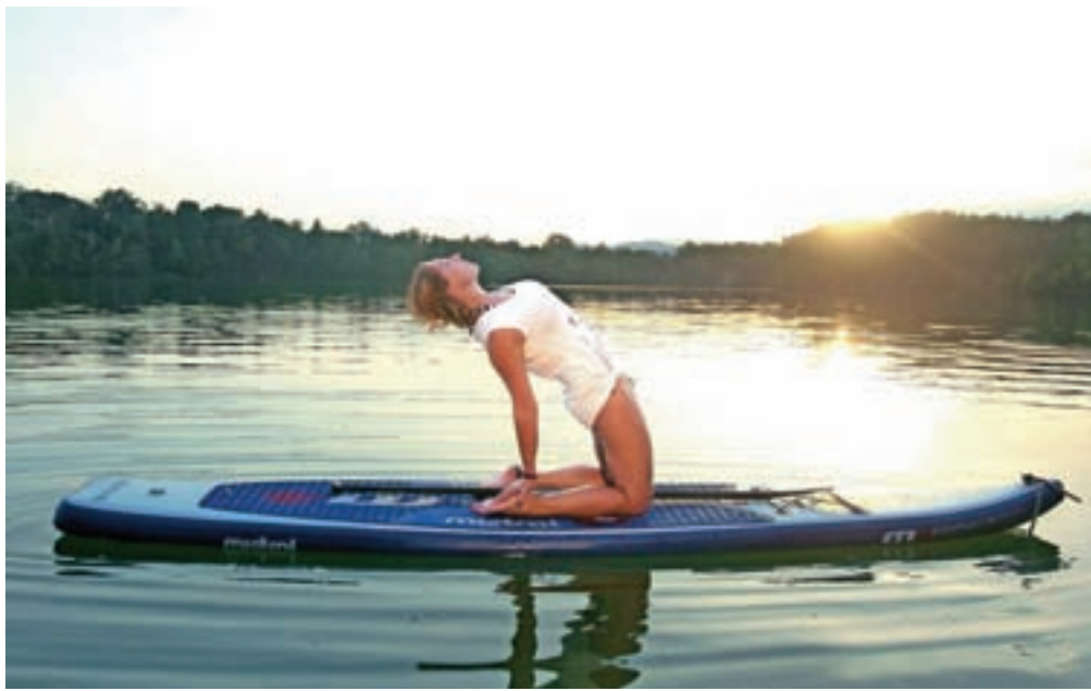
Na javni tribuni bo nekaj besed namenjenih tudi body tehniki, ki jo poleti lahko izvajamo tudi na supu.