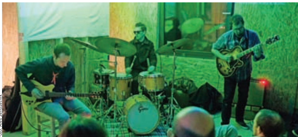
Vrhunski glasbeni večer je minil v intimnem vzdušju in je bil edinstvena priložnost za okoliške prebivalce, da prisluhnejo džezu v izvedbi glasbenikov svetovnega formata.