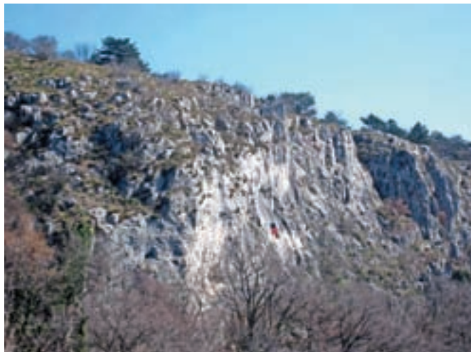
Pogled na prečno ferato Bruno Biondi, kjer se lepo vidi eden izmed plezalcev.