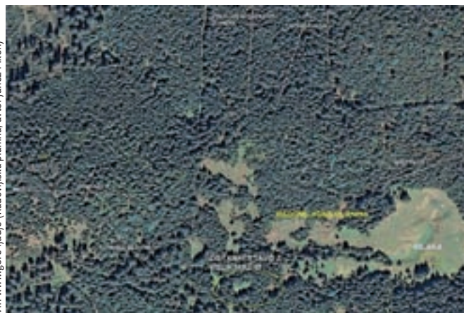
Lokacija ostankov stavb radovljiške kočice