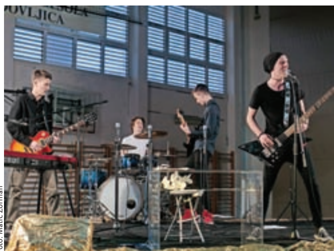
Za živahne ritme so poskrbeli mladi rokerji Dark Heart.