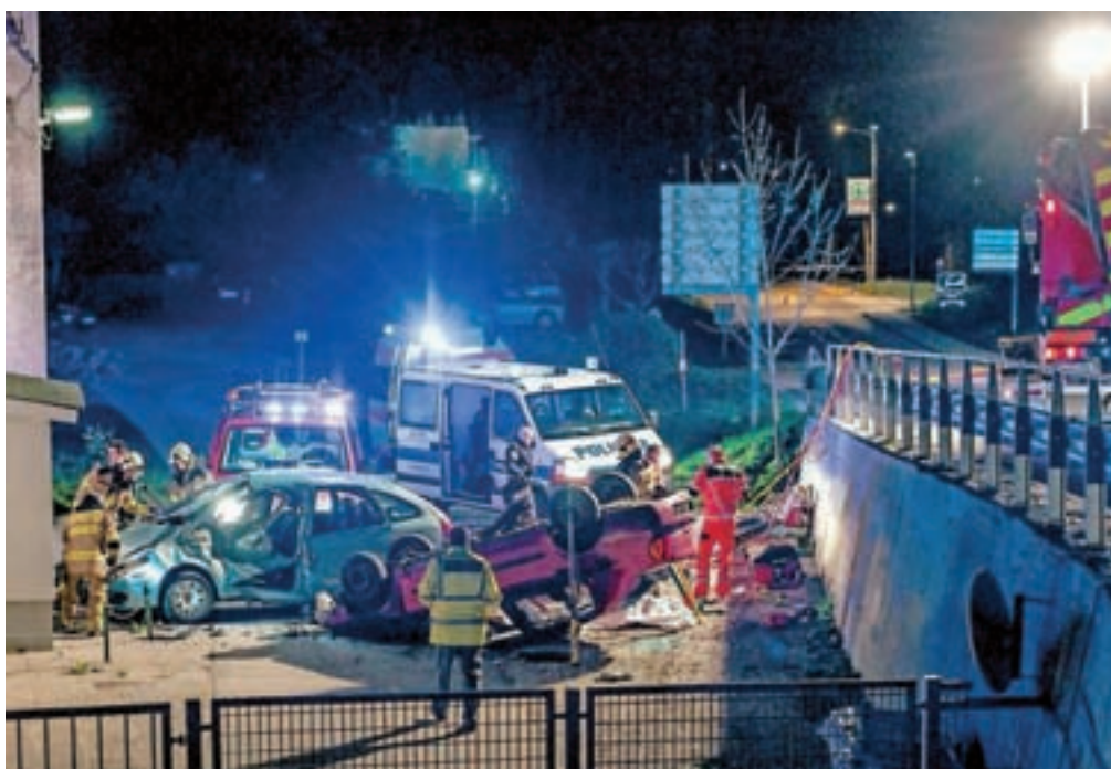
V prometni nesreči v Tržiču je umrl 54-letni voznik.

V noči na soboto pa je v prometni nesreči v Tržiču umrl 54-letni moški, ki je zapeljal s ceste in trčil v parkirano vozilo. Več na 12. strani.