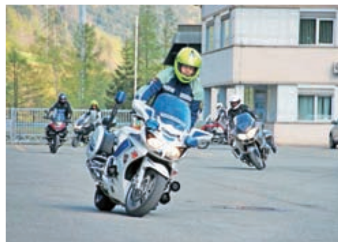
Motoristi so se pod budnim očesom policijskih inštruktorjev varne vožnje preizkusili na poligonu varne vožnje.