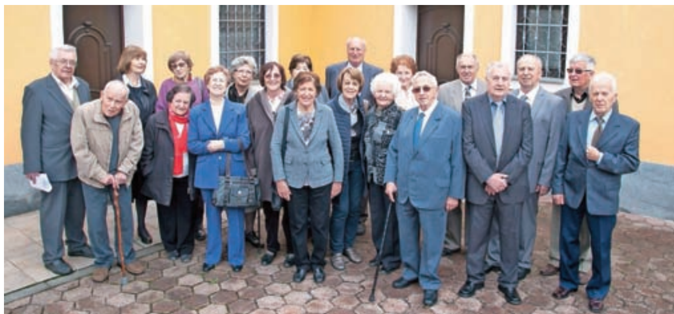
Nekdanji dijaki kamniške gimnazije na 60. obletnici svoje mature

Na obletnici so zapeli Gaudemus Igitur, se spomnili sošolcev, ki jih ni več z njimi, si pogledali film s praznovanja izpred desetih let in nekaj starih fotografij, nato pa pokramljali – tudi o zdravju, ki pri teh letih nagaja že prav vsem.