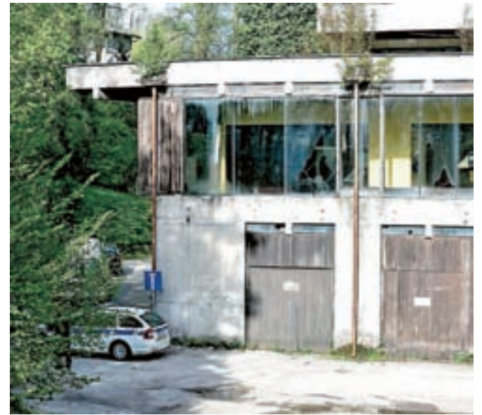
Osemnajstletnik je v petek popoldne na tla omahnil z zadnjega dela opuščene hotela.

Iz Zavarovalnice Triglav so sporočili, da jih je novica o tragični nesreči zelo pretresla. Kot so pojasnili, je opuščeni hotel fizično zaprt in ustrezno zavarovan, vstop v objekt pa je bil in je še vedno prepovedan. »V zadnjem obdobju so bili izvedeni še dodatni varnostni ukrepi, preprečili so se morebitni vstopi skozi odprtine, potekali pa so tudi varnostni obhodi in nadzor zapore nepremičnine. Po nam znanih informacijah kriminalisti za nastalo tragično nesrečo niso odkrili elementov odgovornosti na strani lastnika objekta,« so razložili.