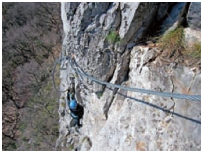
Ohlapne jeklenice pri vertikalnem vzponu zahtevajo še več moči v rokah in pazljivosti, da se ne zaniha.

poteka jeklenica, ki nas prav tako pripelje do vrha lestve. Res pa je, da je treba malce poplezati prosto. Na vrhu smer zavije levo, nato desno, čez gladke stene, kjer je treba malce poplezati na trenje. Smo na prvi polici, kmalu še