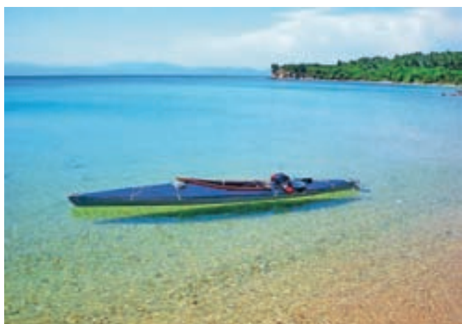
Prvi zaliv v svobodni republiki Atos – in tudi eden najlepših, kar jih je Dejan videl v življenju

Po treh urah bojevanja z valovi je Dejan dosegel zanj najboljši zalivček, kar jih je videl v življenju. »Tristo, štiristo metrov dolg, s turkizno modrim morjem, grobim peskom zlate barve, ki greje v kosti ...« Spominja se, da je prav začutil samoto. »Začutiš, da si prestopil neko mejo. Ne znam opisati. Nekaj je bilo drugače.« (Nadaljevanje prihodnjič)