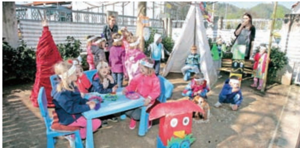
Na vrtu so postavili pravo indijansko vas.