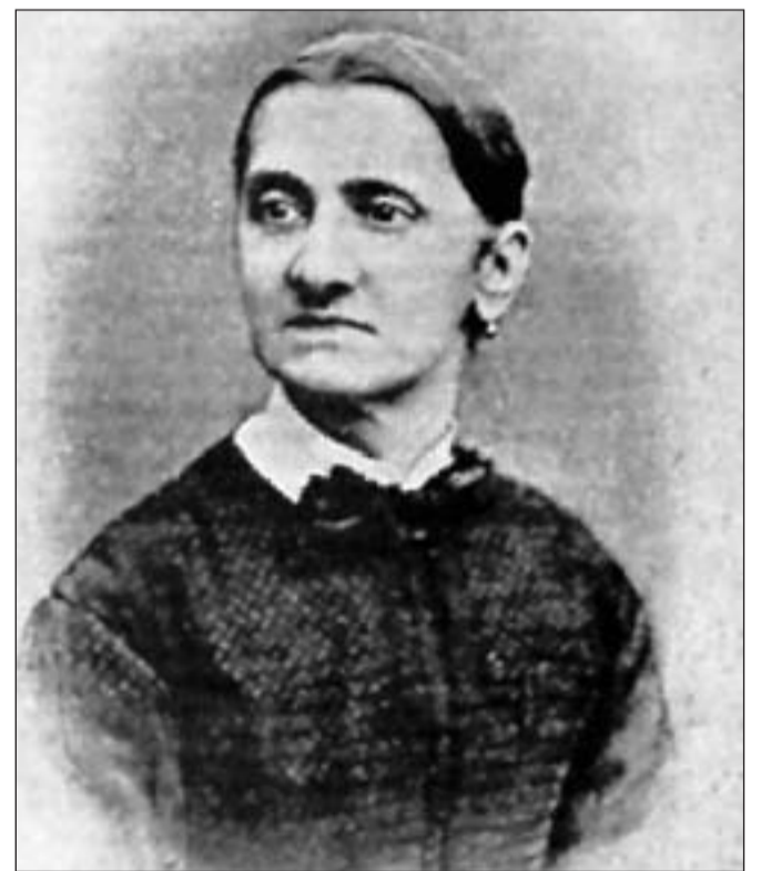
Ana Jelovšek (1823-1875) na fotografiji iz 1874