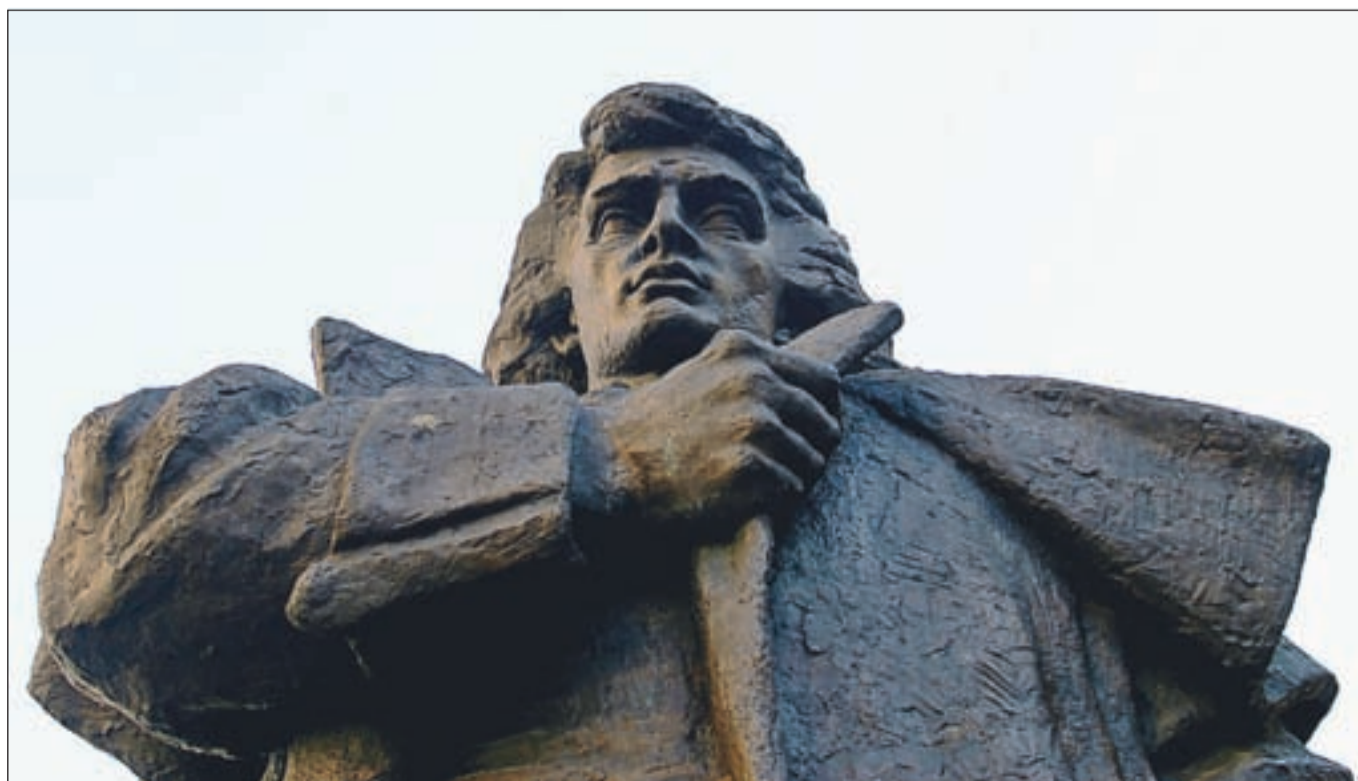
Ko je umiral, Prešeren ni bil tako monumentalen, kot stoji pred gledališčem svojega imena.

Umrl je 8. februarja 1849, malo pred osmo zjutraj. Njegove zadnje besede so bile vzdihujoče: "Vzdignite me, zadušiti me hoče!" Z njimi na ustih je umrl človek, ki je napisal najlepše pesmi v slovenskem jeziku.