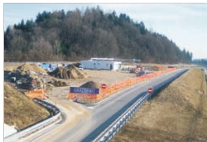
Če bodo vremenske razmere ugodne, bosta oba bencinska servisa odprta že do konca aprila.