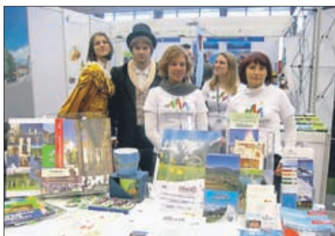
Na stojnici Gorenjska so predstavljali ponudbo vseh, ki jim na Gorenjskem ni vseeno za razvoj turizma.