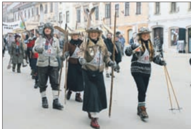
Pohod starodobnih smučarjev skozi Škofjo Loko je vsakokrat paša za oči.