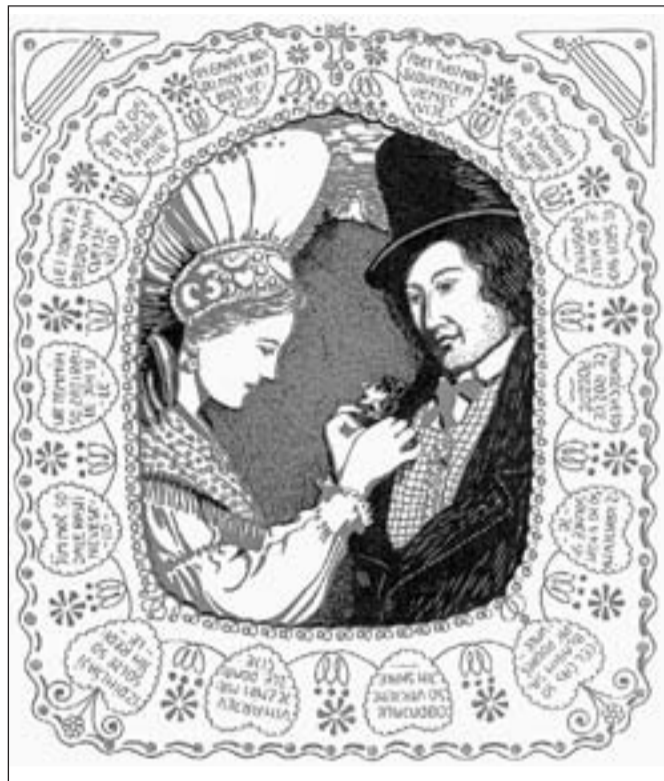
Maksim Gaspari, Sonetni venec, 1905