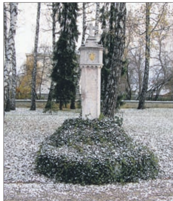
Nagrobni spomenik pesniku dr. Francetu Prešernu iz leta 1852