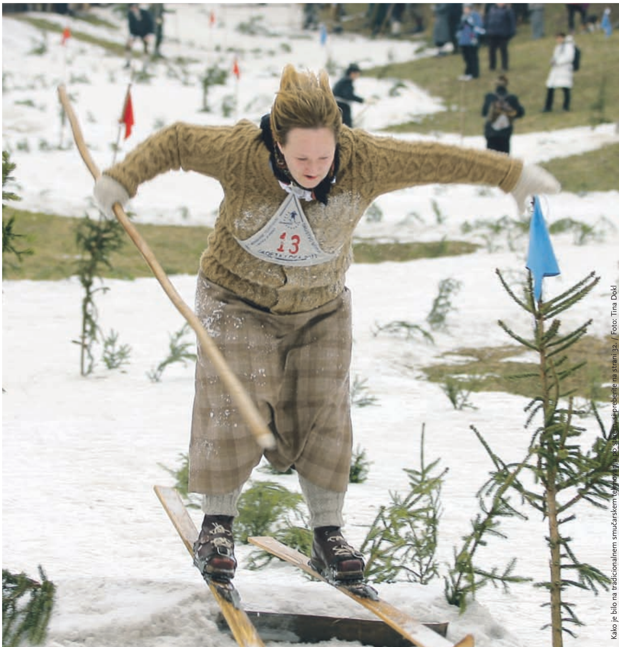
Kako je bilo na tradicionalnem smučarskem tekmovanju po starem, si preberite na strani 32.