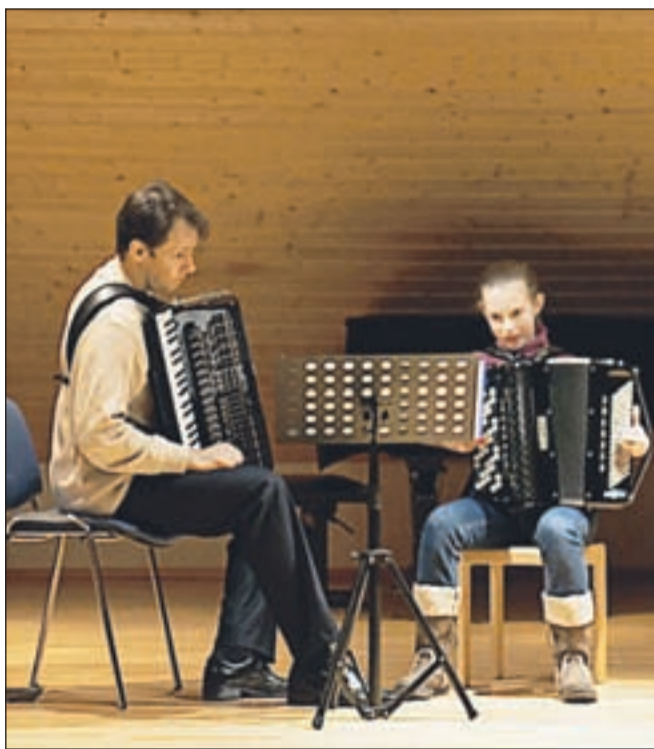
Mladi so z navdušenjem sprejeli dodatno izobraževanje harmonike.