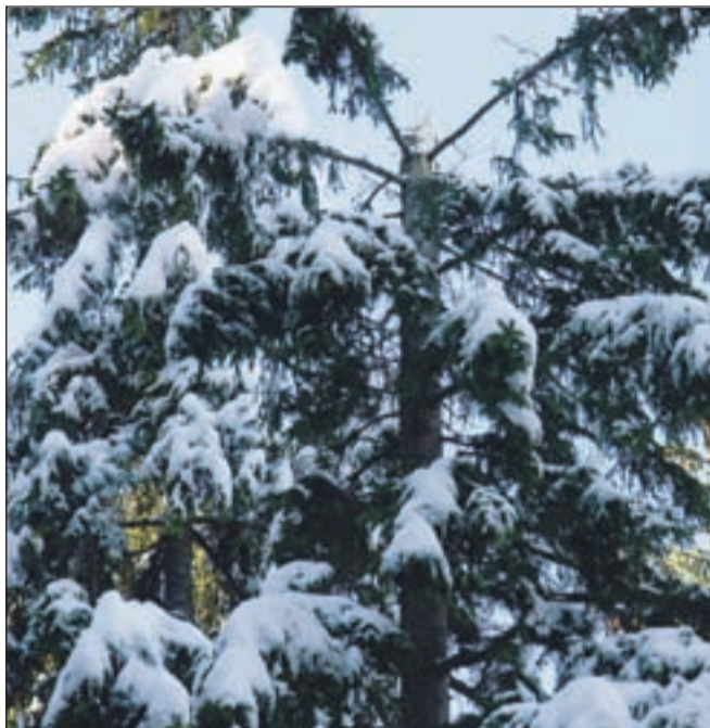
Marsikatero drevo je pod težo snega ostalo brez vrha.

Pod težo snega se je novembra in decembra lomilo tudi drevje v nižinskih gozdovih na območju Udin boršta, Podbrezj, okolice Nakla, Velike gmajne, v bližini brniškega letališča med Vodici in Vogljami, na Sorškem polju, na območju Crngroba ... Kot pojasnjuje