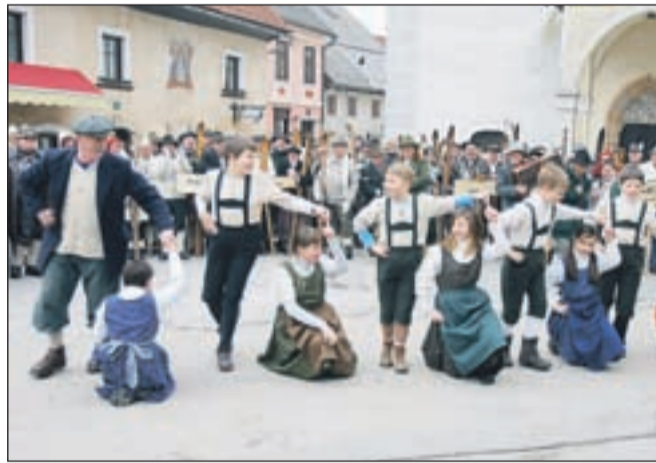
Otroci iz osnovne šole Cvetka Golarja so zaplesali na uvodni slovesnosti pred mednarodnim tekmovanjem smučarjev starodobnikov.