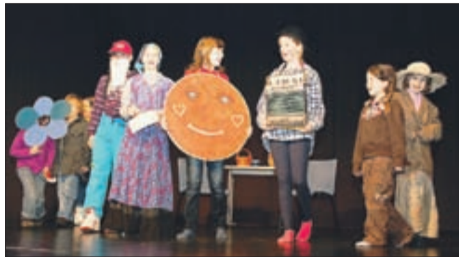
Otroška skupina KUD Leše, ki je nastopila prvič, je zaigrala Žogico Nogico.