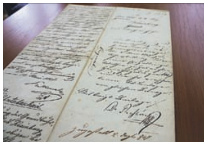
Poročna pogodba s Prešernovim podpisom

"Marsikdo niti ne ve, da ima možnost oddati, podariti ali prodati svoje dokumente javnemu arhivu, pa tudi, da lahko sam določi pogoje uporabe in dostopnosti. S tem najbolje poskrbi za njihovo varnost in trajnost."