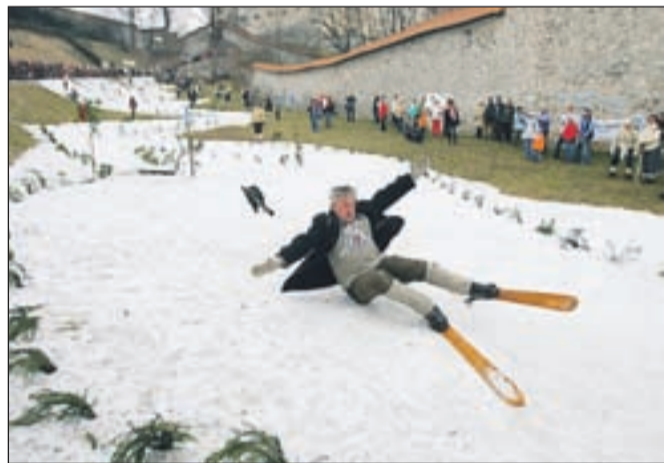
Na tekmovanju na grajskem hribu, kamor so organizatorji navozili sneg iz Kranja, smo videli veliko elegantnih spustov, pa tudi kakšen padec.

so letos prvič podelili mednarodno priznanje jakob za odličnost in kakovost v turizmu, tokrat za področje kulinarike. Priznanje nosi ime po enem od "praturistov", romarju sv. Jakobu. Komisija je 20. januarja pregledala prijave različnih prijaviteljev, ki inovativno vključujejo lokalno in/ali regionalno gastronomijo v turistično ponudbo krajev in območij v regiji Alpe-Jadran, ter izbrala zmagovalca. Tako smo v četrtek ploskali Gorenjcem: Kuharski šoli Uroša Štefelina Hotela Triglav Bled . Hotel z njo poizkuša uresničevati dolgoročno zastavljeni cilj: dvig kulture prehranjevanja in pitja.