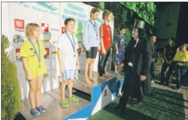
Mladim plavalcem je čestital tudi dr. Fig.