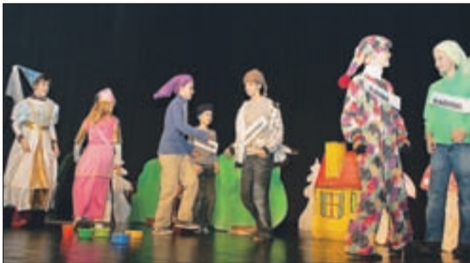
Gozdni škrat Kuzma je zbral okoli sebe še veliko drugih nagajivih škratov.