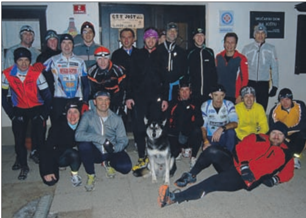
Udeleženci predzadnje Joštove tekaške srede

Tudi preteklo sredo je bilo tako. Predzadnje srečanje je minilo brez idejnega očeta, ki je ravno tisti večer odšel v Maroko, kjer združuje šport in turizem. Prišli pa so večinoma vsi tisti, ki se družijo vsako sredo. To niso le Kranjčani, Gorenjci, pod sv. Jošta se pripeljejo celo iz Ljubljane, Vrhnike in od drugod. S čelnimi svetilkami so se podali na vrh, tokrat po cesti. Zimska tekaška srečanja namreč izmenjaje enkrat potekajo po cesti, drugič po Sodarjevi pešpoti. Jutri bo dvanaesti tek, v