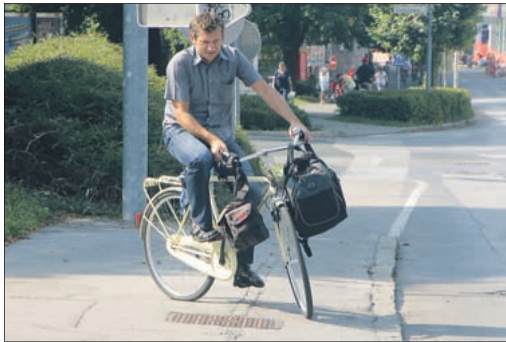
Kolesarji so med vožnjo pogosto premalo previdni, opozarjajo prometni policisti.

"Opažamo, da vedno več kolesarjev ne upošteva cestnoprometnih predpisov, saj predvsem po klanecu navzdol vozijo z neprilagojeno hitrostjo, potem izgubijo oblast nad kolesom in padejo. Padejo lahko tudi zaradi ovir na cesti, kot so luknje, kamni, vozila, pešci," ugotavlja Jazbec, ki še posebej izpostavlja kolesarje na organiziranih treningih. "Ti vozijo na prekratki var-