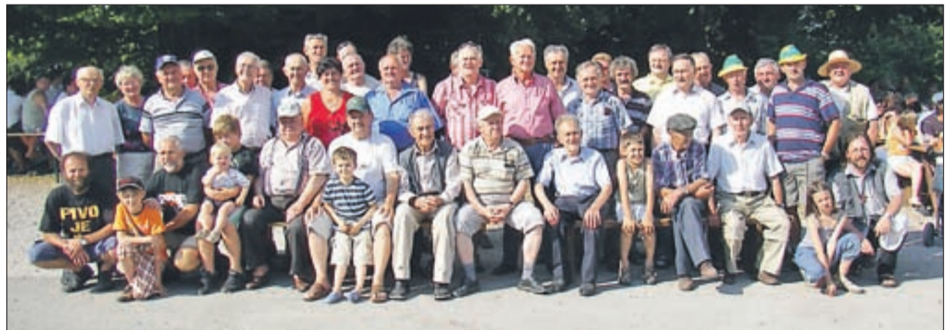
Na letošnjem Srečanju Janezov so organizatorji našli 81 Janezov, Ivank, Ivanov, Žanov ...