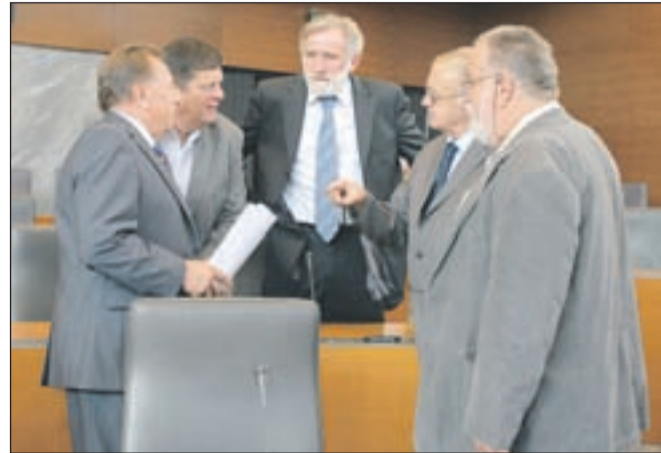
Še zadnji pomenek pred zasedanjem

Ljubljana - Novelo zakona o delovnih razmerjih so poslanci ocenili kot neprimerno in jo umaknile iz obravnave, vlada pa naj pripravi nov predlog, ki bo natančneje uredil problematiko prezaupovanja delavcev v slamnata podjetja. Poslanci so od delovnopravne zakonodaje obravnavali tudi predlog zakona o malem delu, s čimer želi država po besedah ministra za delo Ivana Svetlika povečati prožnost trga dela in tem delavcem zagotoviti socialno varnost, še naprej pa bo omogočalo fleksibilen prvi stik študentov in dijakov s trgom dela. Nasprotniki zakona (najglasnejši so študentje in njihove organiza-