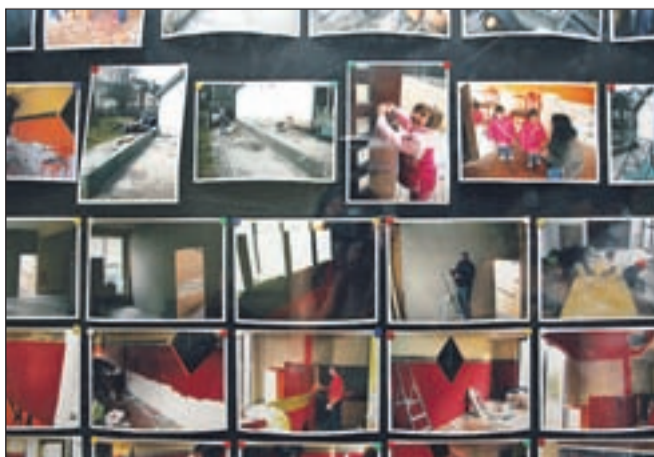
Na poti do toaletnih prostorov si lahko ogledate fotografije, ki govorijo o tem, kako je nastajal novi Borovc.