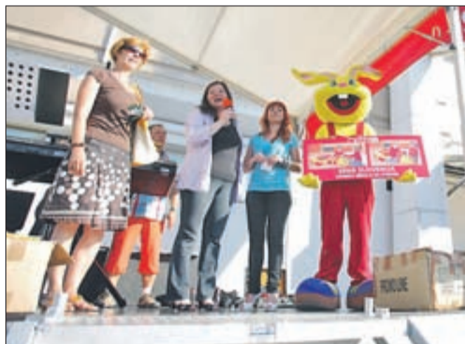
Da je bilo ob enajstem rojstnem dnevu veselo, je poskrbel ansambel Srčev as, veselje pa je z vsemi navzočimi delil tudi kranjski vrtec Čiračara, ki je prejel donacijo.

podjetja. Od sedaj se bodo otroci lahko razgibavali in objemali z veliko žirafa - večnamenskim igralom, svojo kreativnost pa bodo lahko izražali z novim paketom risalnih pripomočkov. V petek popoldne, na dan slavlja trgovine, pa je Spar Slovenija predstavnikom vrta tudi uradno predal donacijo.