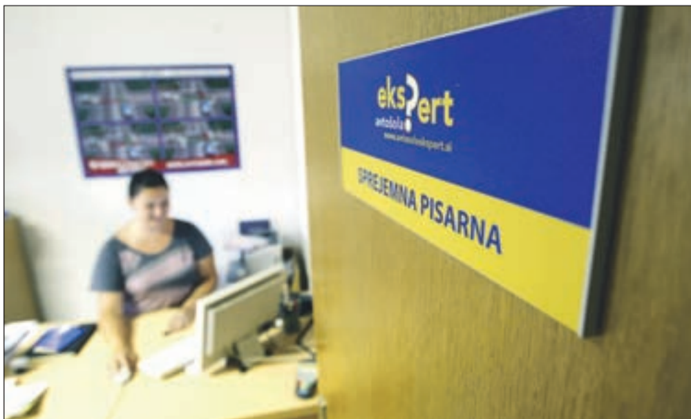
Ropar je iz prostorov avtošole Ekspert pobegnil z 890 evri.