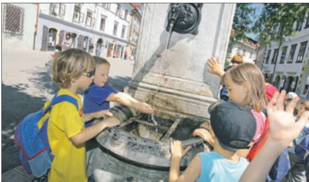
Za najmlajše otroke bodo škofjeloški starši dobili občinsko subvencijo.

Prosilcev za mesta v loških vrtcih je vsako leto več, razlog tiči tako v visoki rodnosti na tem območju kot tudi v zakonski možnosti, da imajo starši drugega otroka in vse nadaljnje v vrtcu brezplačno. Lani so tako v Škofji Loki postavili modularni vrtec, ki pa ni rešil povečanega povpraševanja, zlasti ne za otroke prvega starostnega obdobja. Po ugotovljenih podatkih iz vpisa je brez mesta v vrtcu ostalo 105 otrok, starih od enega do treh let, medtem ko je za otroke drugega starostnega obdobja (starih od štiri do šest let) v loških vrtcih dovolj prostora in je možno sprejeti vse otroke drugega starostnega obdobja, ki prosijo za sprejem v