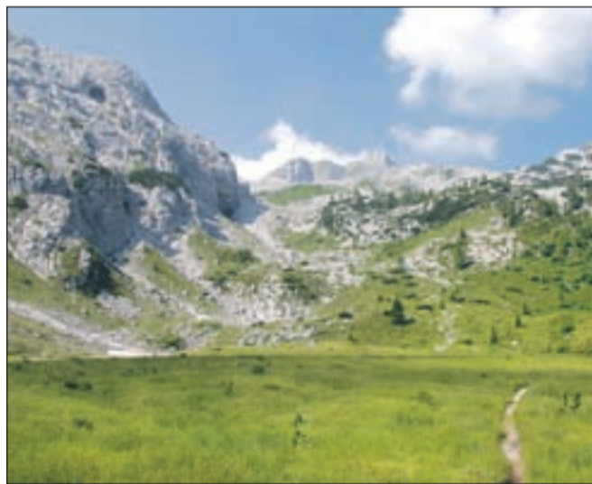
Pogled na Krn s Planine Na polju

Nadmorska višina: 2245 m Višinska razlika: 1545 m Trajanje: 8 ur Zahtevnost: ★★☆☆