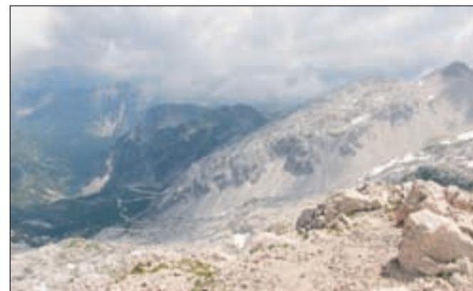
Pogled na Krnsko jezero in Vrh nad Peski