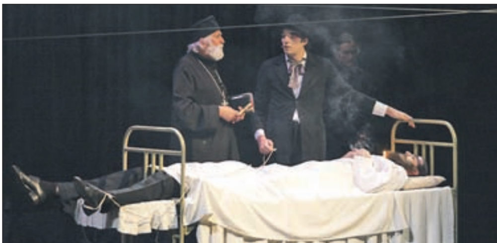
V sklopu festivala ste 12. in 13. julija lahko spremljali muzikal Maratonci tečejo zadnji krog v izvedbi Gledališča na Terazijah iz Beograda.

XIII. mednarodna likovna kolonija , konec julija pa Letni kino na Ljubljanskem gradu .