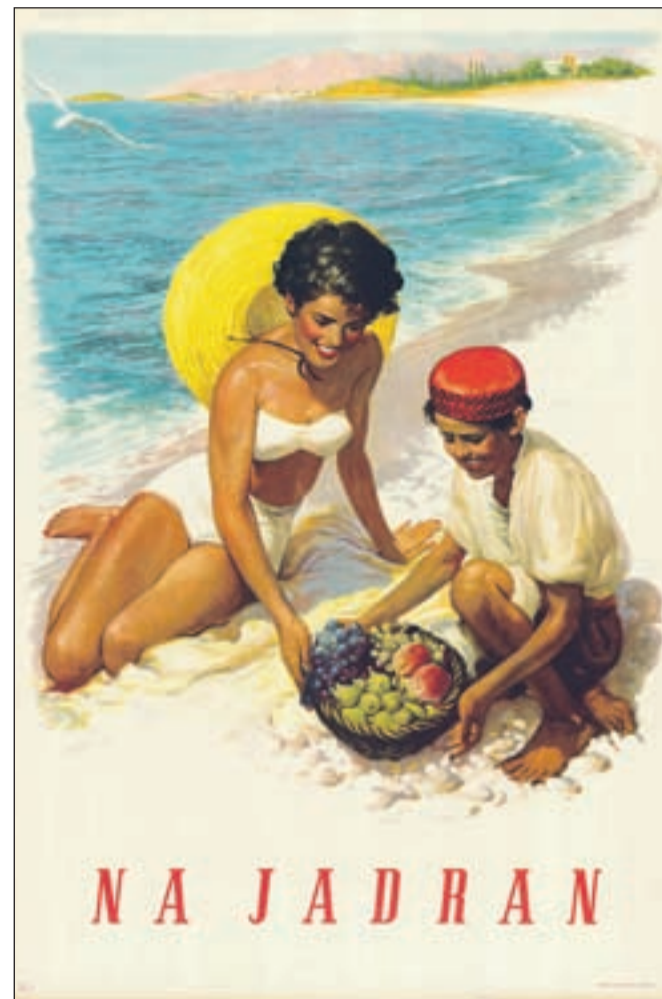
Nadvse aktualno: Na Jadran, plakat, natisnila Ljudska pravica, hrani NUK, 1952

denimo, vpišite ime Gorenjska, se vam prikaže za tri strani zadetkov po dvajset na stran. Pri vpisu Kranja pa se vam jih prikaže kar 68 strani, se pravi več kot 1300 zadetkov. Prešeren jih premore 35, Finžgar 13, Ivan Tavčar 8, Janez Bleiweis pet ... Gorenjski prvak so verjetno Loški razgledi, saj je v celoti digitaliziranih njihovih prvih petdeset letnikov, kar zneso 109 strani oziroma več kot dva tisoč enot. Meni je bilo v največji užitek ogledovanje starih plakatov. Kaj mislite, kakšnih in kolikih? Med njimi so cirkuški (9), festivalni (12), filmski (1474), glasbeni (5), gledališki (38), koncertni (18), kongresni (4), drugi (2610), politični (121), politično propagandni (210), prireditveni (11), promocijski (1), propagandni (171), razstavni (125), reklamni (832), športni (157), turistični (243), volilni (46) ... Pa ne mislite, da sem si ogledal vse.