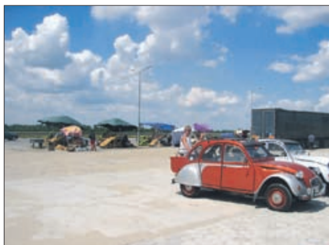
Na obcestnem postajališču je na voljo sadje, predvsem razne vrste buč in lubenic, breskve, marelice ..., pa tudi štanti s kavo, koruzo, slaščicami.