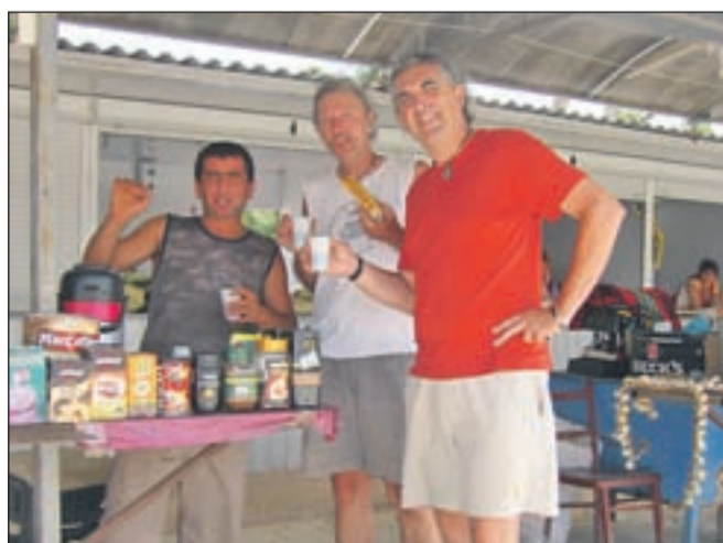
Da je Armenec (levo) je povedal z velikim ponosom. V Ukrajini je s trebuhom za kruhom, saj je njegova domovina še bolj revna.