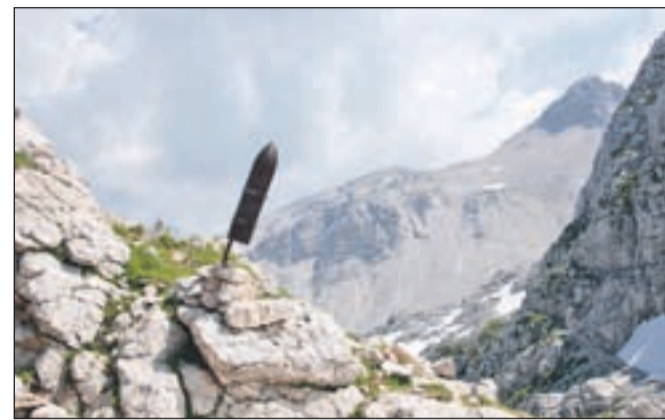
Ostanki vojne vihere pričajo o njeni nesmiselnosti.