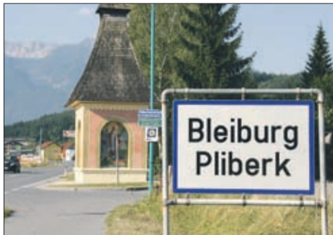
Nova dvojezična krajevna tabla v Pliberku

Na Koroškem se je v torek zjutraj zgodilo presenečenje: deželni glavar Gerhard Doerfler je ukazal pred vasmi Pliberk/Bleiburg , Drvešo vasjo/Ebersdorf in Žvabek/Schwabegg postaviti nove dvojezične krajevne table, na katerih so slovenska in nemška imena krajev enako velika in zapisana drugo poleg drugega! Tako je v petek, 9. julija, odločilo avstrijsko ustavno sodišče in s tem potrdilo tudi svojo razsodbo iz leta 2005, da mora dobiti tudi nad deset drugih krajev na južnem delu Koroške, kjer živijo Slovenci, takšne dvojezične krajevne napise. Takrat sta deželni glavar Joerg Haider in njegov naslednik Gerhard Doerfler , ki je bil tedaj na Koroškem odgovoren za promet, izigrala od-