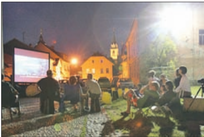
Na premieri projekta Solarni kino

nih filmov (igrani, dokumentarci, animacije) z enakim skupnim sporočilom: človek na vse možne načine onesnažuje planet Zemljo in je tako odgovoren za ekološke katastrofe, ki so že tu - treba bo hitro ukrepati, kjer je to sploh še mogoče.