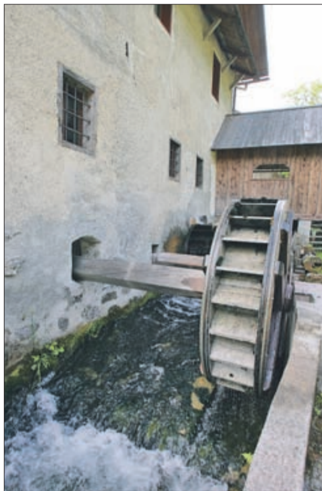
Grajski mlin v Grabčah