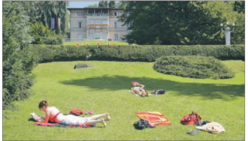
Za poležavanje na travi v parku je predvidena kazen 150 evrov.

"Ljudje lahko kjerkoli dostopajo do obale, da kar povsod poležavajo, pa ne gre," je odločen Boris Malej. Edino urejeno kopalnišče je ta čas Grajsko kopalnišče, svoja kopalnišča imajo tudi hoteli, kopanje na lastno odgovornost