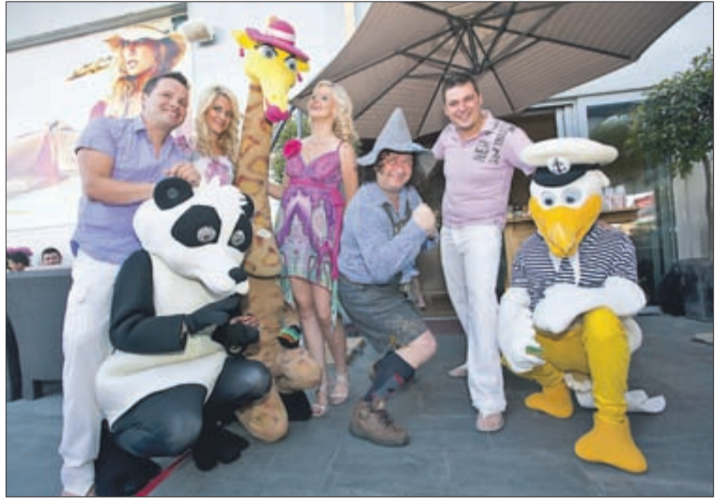
V videospotu Lep sončen dan nastopajo tudi krokodil, žirafa in galeb.

Pred kratkim so Atomiki z Gozdnim Jožem videospot predstavili povabljenim v ljubljanski Playi, kjer so poskrbeli tudi za najmlajše in predvsem sladkosnede navihance.