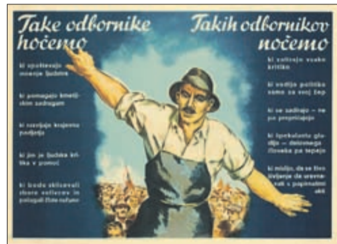
Nič več aktualno: Take odbornike hočemo/nočemo, plakat, hrani NUK, 1949