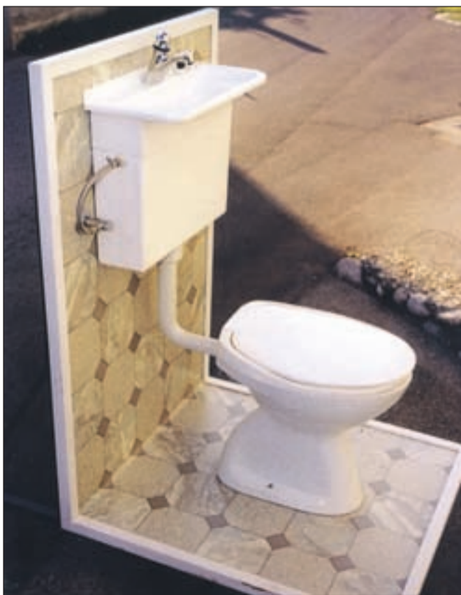
Janez Kuralt je trkal na vrata slovenskih podjetnikov, da bi naredili prototip sanitarne splakovalne naprave in jo dali na trg. Žal neuspešno ... / Foto: osebni arhiv Janeza Kuralta

Kranj - Janez Kuralt iz Britofa pri Kranju se je pod zaporedno številko 9800233 pri Uradu RS za intelektualno lastnino maja leta 1999 vpisal med inovatorje. Izumil je sanitarno splakovalno napravo, s katero naj bi štiričlanska družina mesečno privarčevala petsto litrov vode. Sistem varčevanja z napravo je preprost; voda, ki jo uporabimo za umivanje rok v umivalniku, se zbira v WC kotličku in se vnovič uporabi za splakovanje stranišča. Umivalnik je nameščen nad straniščno školjko in dodatni ni potreben, zato je prihranek tudi pri prostoru. Septembra 2000 je Janez Kuralt za inovacijo prejel bronasto medaljo slovenskega Pospeševalnega centra za malo gospodarstvo, novembra istega leta je za inovacijo prejel tudi bronasto medaljo na razstavi inovacij v Nürnbergu v Nem-