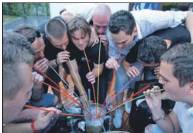
V Borovcu bodo stregli tudi z znamenitimi velikimi koktajli.