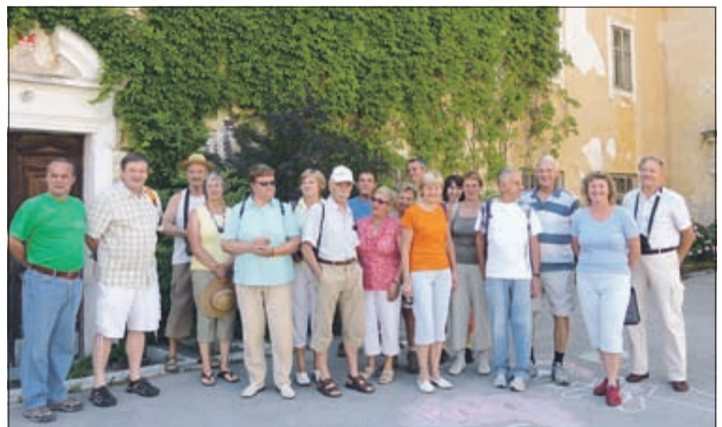
Grad Dvor sredi Preddvora je bil prvi, ki so ga spoznali obiskovalci.