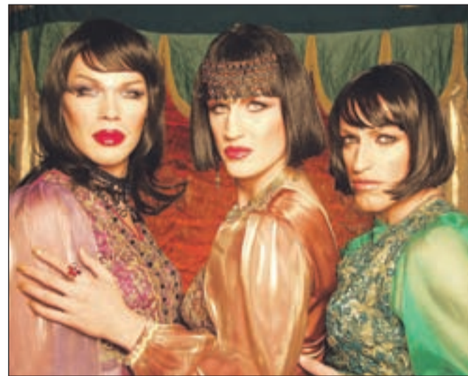
Sestre pripravljajo nove projekte, vročo jesen, začele pa bodo na Magnificovem odru - kot gostje. / Foto: arhiv benda