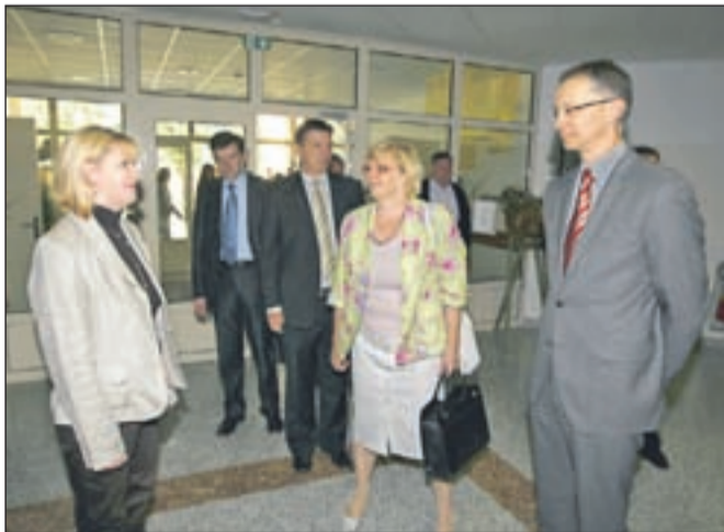
Minister Igor Lukšič in državna sekretarka Alenka Kovšca na regijskem posvetu z ravnatelji v Strahinju.

Kranj - Regijski posvet z ravnatelji v biotehniškem centru v Strahinju je med drugim nakazal tudi problem neplačevanja v šolah, kjer se tudi že čuti kriza. Minister Igor Lukšič je ob tem dejal, da bo njegovo ministrstvo s kolegi v vladi skušalo najti primerne rešitve. Minister se je srečal tudi z dijaki, ki so potrdili, da je vprašanje njihovega socialnega položaja povezano z možnostjo nadaljevanja njihovega šolanja. Sicer pa so na posvetu predstavili predlog novih šolskih zakonov, se pogovarjali o nacionalnih preizkusih znanja in o financiranju srednjih šol, kamor se vsako leto vpiše manj dijakov. Kot je dejala Alenka Kovšca , se bo v petih letih populacija zmanjšala za dvajset tisoč, srednje šole pa se bodo morale ustrezno prilagoditi, tudi z združeva-