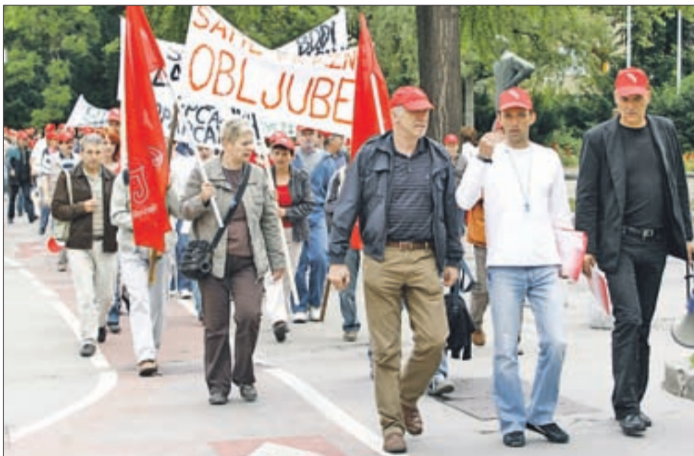
Delavci LTH-ja med protestom v Ljubljani

Škofja Loka, Ljubljana - V sredo je Okrožno sodišče v Kranju ugodilo predlogu Občine Škofja Loka, da se začne stečajni postopek v Loških tovarnah hladilnikov (LTH). Za stečajnega upravitelja je sodišče imenovalo Dušana Taljata. V času od vložitve občinskega predloga za stečaj 13. maja je bilo precej ugibanj o tem, ali je resnično uprava LTH vložila ugovor oziroma zahtevo za odložitev odločanja, vendar se je na koncu izkazalo, da ni bilo tako. Zlasti razumljivo nestrpnosti so delavci LTH.