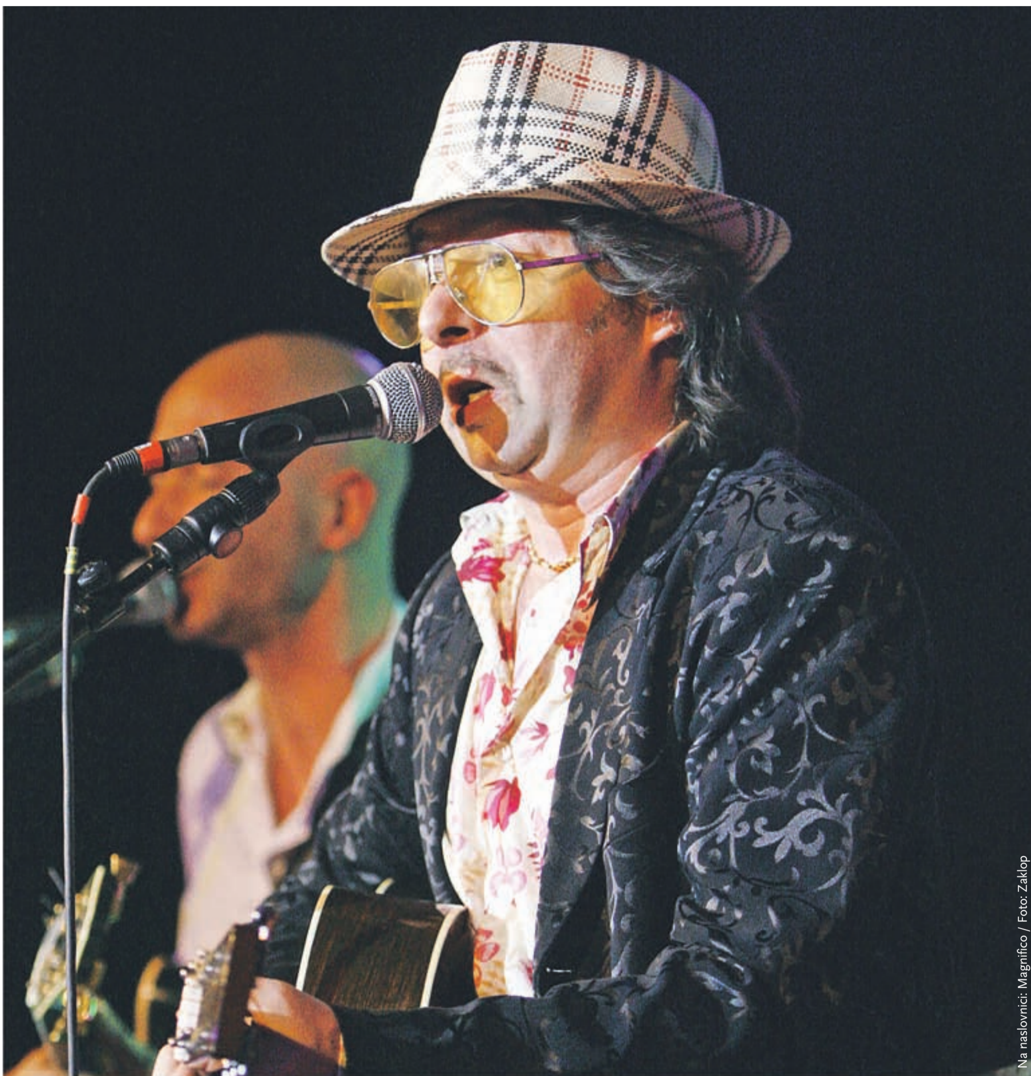
Na naslovnici: Magnifico