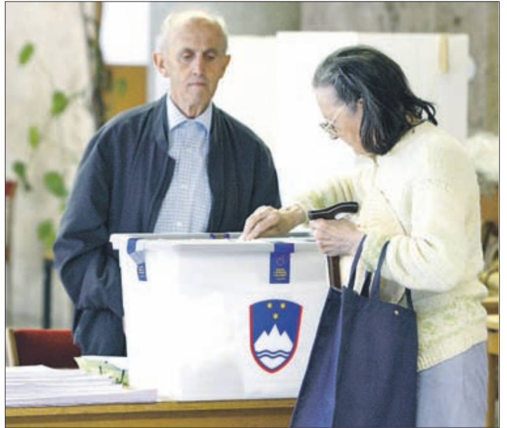
Ta teden so prvi volili Britanci, Slovenci pa nad predčasnih volitvah že v torek.