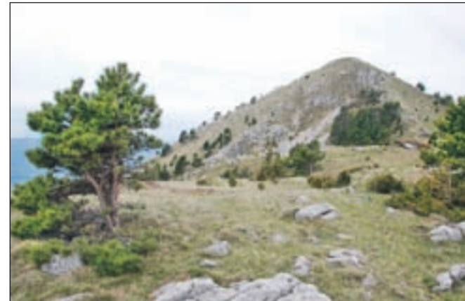
Tamle gor je vrh Kucelja.