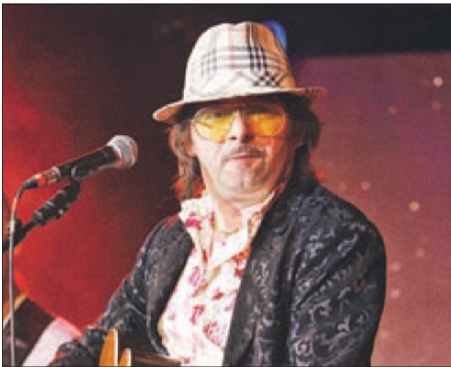
Magnifico bo v Križankah nastopil prihodnji teden. Letos je že osvojil Španijo, Moskvo in Monako.

Teren za divji večer v Križankah pa bosta z gramofonsko uverturo pripravila didžeja Borka in Bakto iz kolektiva Code.EP.