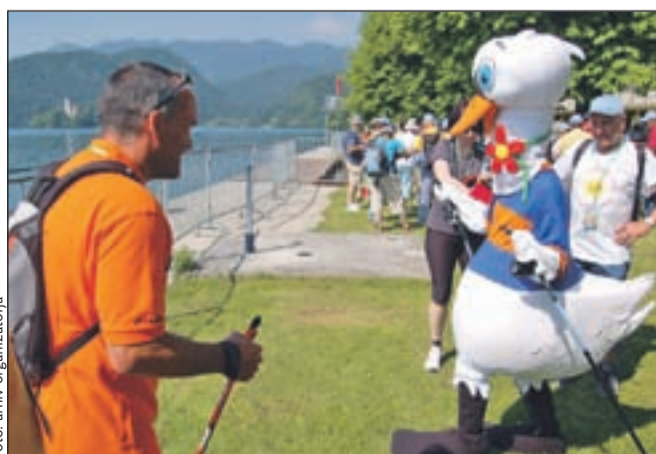
Nordijska hoja je privabila na Bled številne navdušence. Zanimala je tudi Zakija iz družinskega Hotela Savica na Bledu.