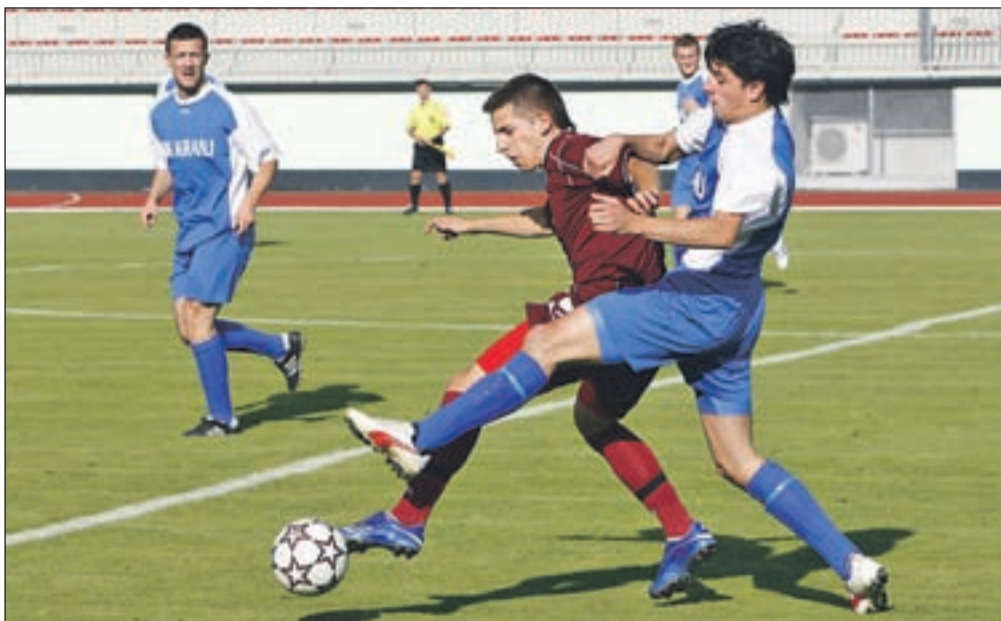
Nogometaši Triglava Gorenjske (v rdečih dresih) so šele po enajstmetrovkah premagali ekipo Kranja in osvojili naslov pokalnih prvakov Gorenjske.

Kranj - V kranjskem športnem parku je bila minulo sredo finalna tekma članskega gorenjskega nogometnega pokala. Potem, ko so se pred tekmo predstavili letošnji slovenski mladinski pokalni prvaki, mladi Triglavovi upi, sta na zelnico stopili moštvi domačega drugoligaša Triglava Gorenjske in kranjski tretjeligaš Kranj. Tekma, ki sicer nogometnih sladokuscev ni navdušila, se