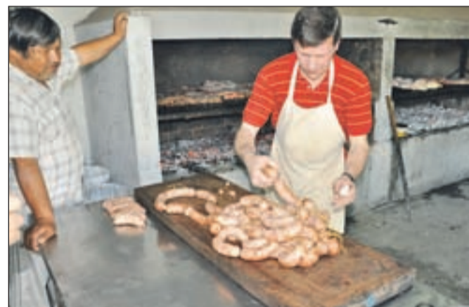
Naši rojaki so ohranili domačo hrano, celo koline.