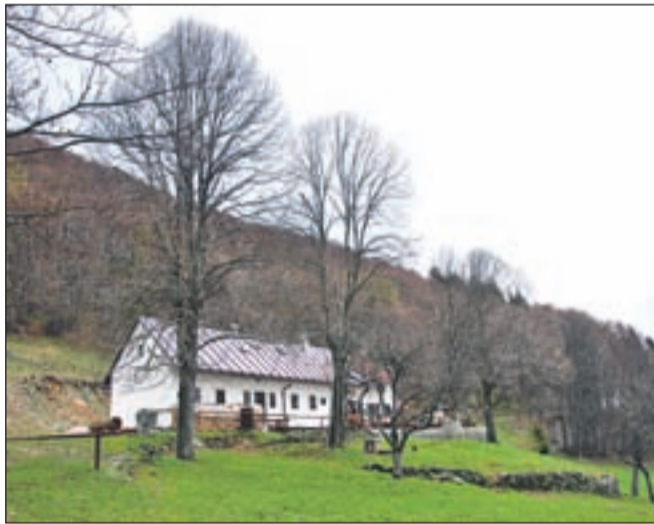
Koča Antona Bavčarja na Čavnu