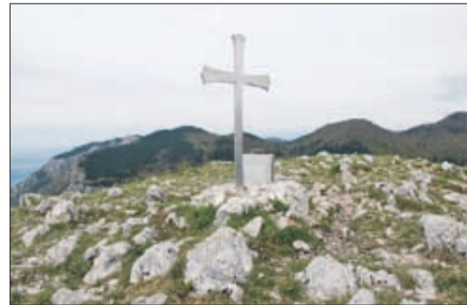
Vrh Kucelja, odkoder je v lepem vremenu čudovit razgled.