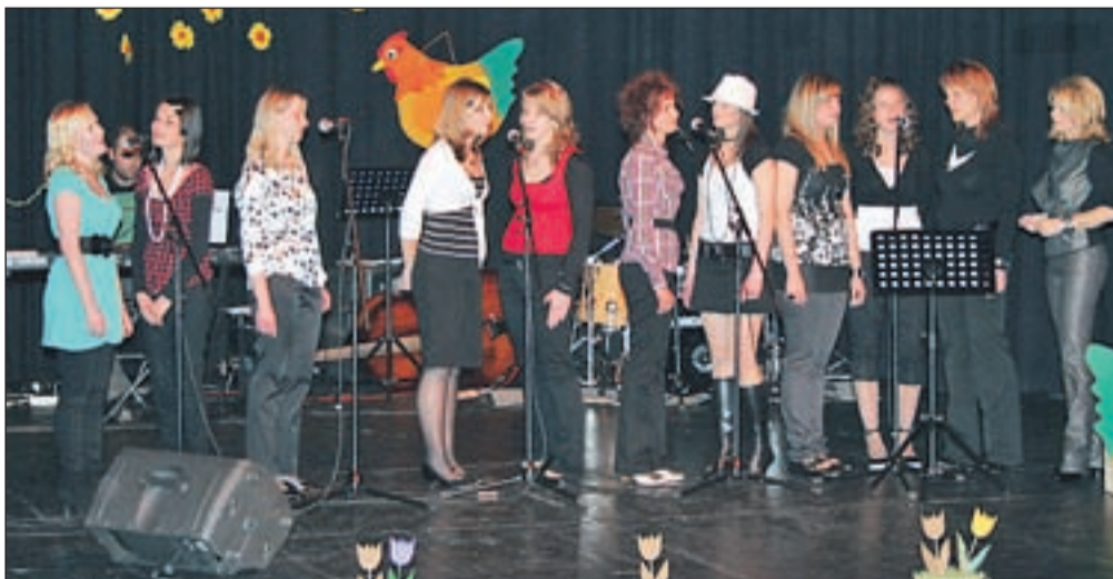
Na velikem spomladanskem koncertu delavnice Musike se je na odru radovljiške Linhartove dvorane predstavilo sedemdeset nastopajočih.