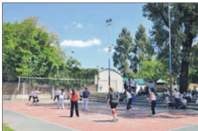
Ob domovih so danes športna igrišča.