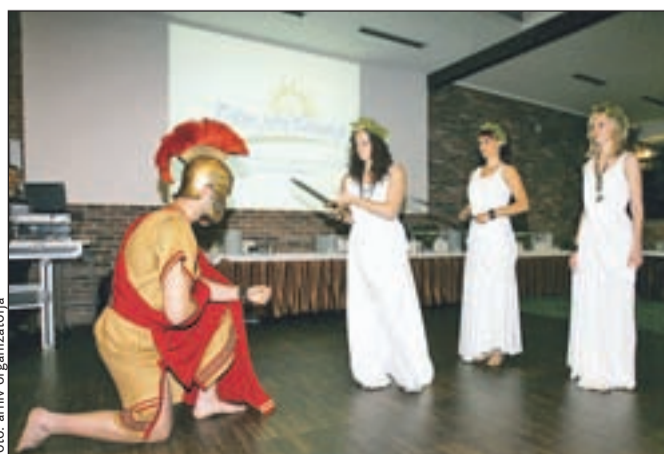
V Klubu Gemina XIII v Termah Ptuj smo videli tudi prikaz plesa vestalk ob zaključku gladiatorskih iger.