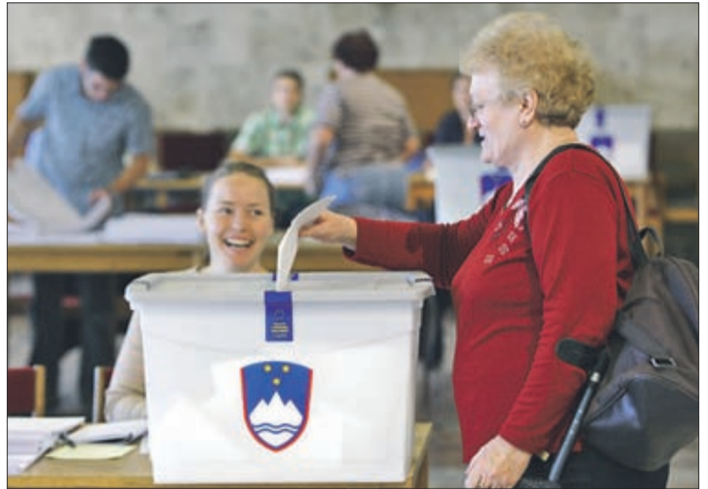
S predčasnega glasovanja za poslance v Evropskem parlamentu

vajeni pred parlamentarnimi ali lokalnimi volitvami, in tudi ne posebno domiselna, kandidati pa so se trudili vsak po svojih močeh. Kdo bodo tisti, ki bodo zasedli vabljive poslanske stolčke v Bruslju (in Strasbourgu), kjer jih po novem čakajo plače, izenačene za vse evropske poslance, bomo sicer neuradno vedeli že v nedeljo. Nato bo treba počakati do 15. junija, da bodo okrajne volilne komisije preštele še glasovnice, ki bodo prispele po pošti iz tujine. Dokončne uradne izide evropskih volitev pa bo državna volilna komisija razglasila 19. junija.