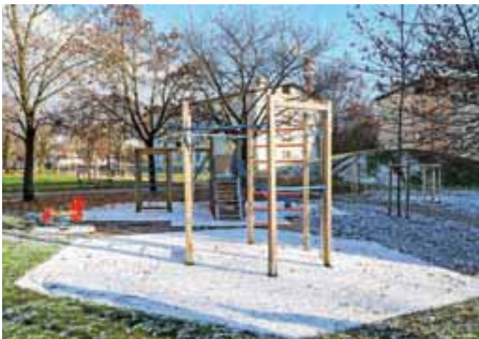
Novo otroško igralo v Ulici Gorenjskega odreda