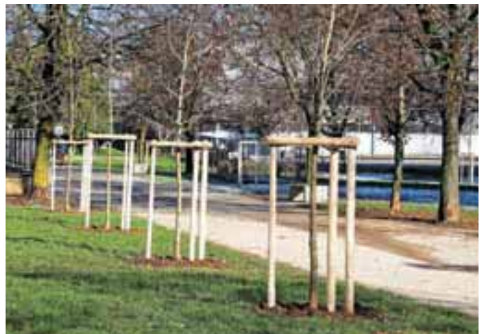
Nova zasaditev v drevoredu v Ulici Gorenjskega odreda