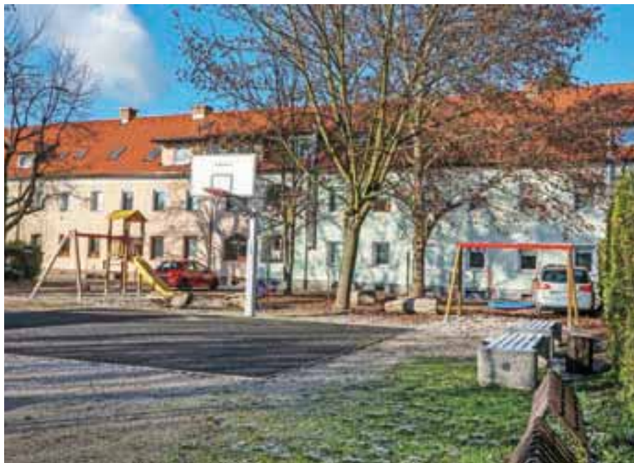
Med pomembnimi pridobitvami so tudi novo otroško igralo, igrišče za košarko in klopi na Hujah.