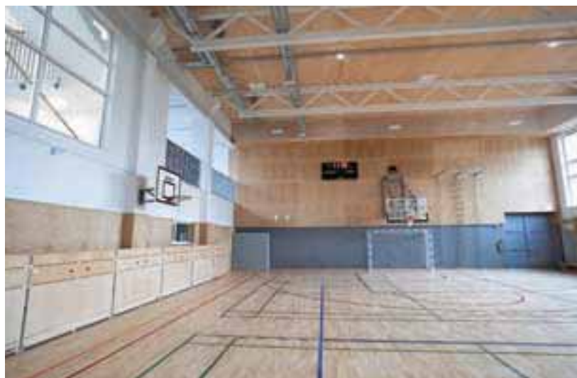
Nova telovadnica v OŠ Staneta Žagarja Kranj

čjo evropskih sredstev. Prizidek je tako stal nekaj več kot 3,1 milijona evrov. Občina je zanj pridobila približno dva milijona evrov nepovratnih evropskih sredstev in sredstev Eko sklada, saj gre za sodoben, energetske varčen objekt. Celotni projekt je občino stal 1,1 milijona evrov.