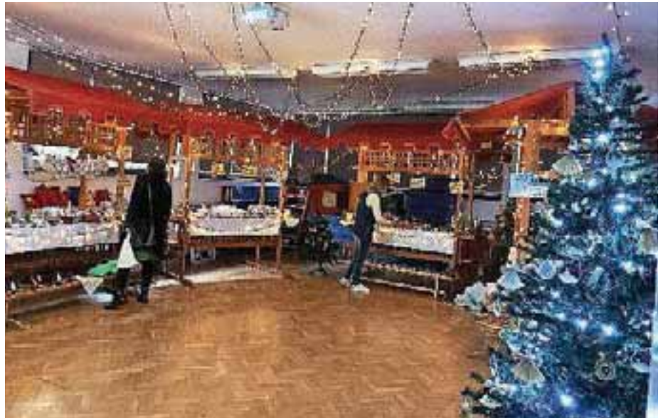
Utrinek s prazničnega bazarja v enoti Mojca

Po vrtcu je zadišalo po cimetu, sveže pečenih piškotih, postavili pa so tudi smrečice. Te so unikatne, okrašene pa z okraski, ki so jih ustvarili malčki. Vsako leto si pričarajo prav posebno in čarobno predpraznično čajanko. Na njej so se jim v vrtcu Sonček pridružili tudi babice in dedki.