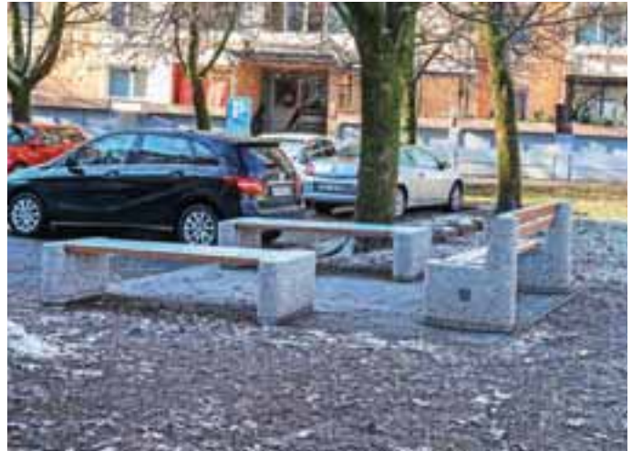
Novo klopi v Ulici Janeza Puharja