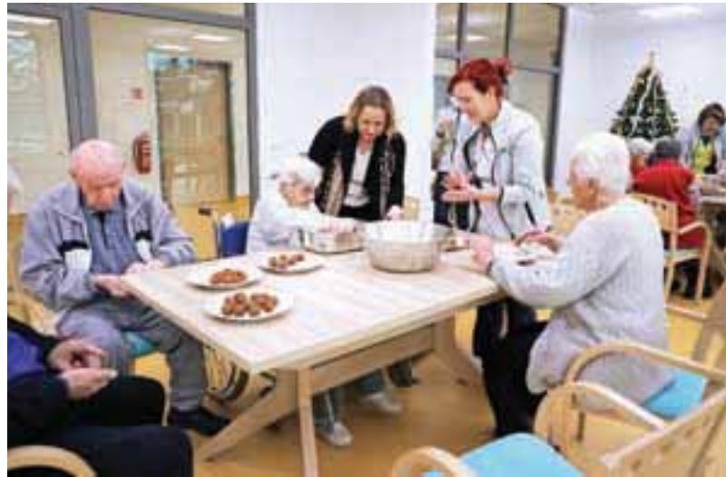
Peka piškotov v kranjskem dnevnem centru za starejše

Kot je še pojasnila Gantarjeva, so cilji doma izvajanje kakovostne oskrbe za starejše, nudenje dodatnih in že obstoječih storitev, kot so dnevno varstvo, začasno varstvo in razvoz kosil. »Še naprej želimo razvijati storitve v domačem okolju, saj je pred nami izvajanje zakona o dolgotrajni oskrbi, ki predvideva ravno prenos storitev v domače okolje,« je dodala, ob tem pa še pojasnila, da z lokalno skupnostjo dobro sodelujejo. Dom namreč obiščejo člani različnih društev, ki s svojimi