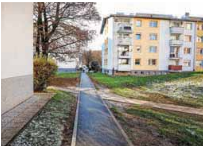
Novoasfaltirana pot v Ulici Gorenjskega odreda