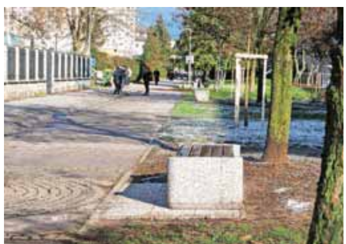
Še več novih klopi / Foto: Tina Dokl, tekst Suzana P. Kovačič