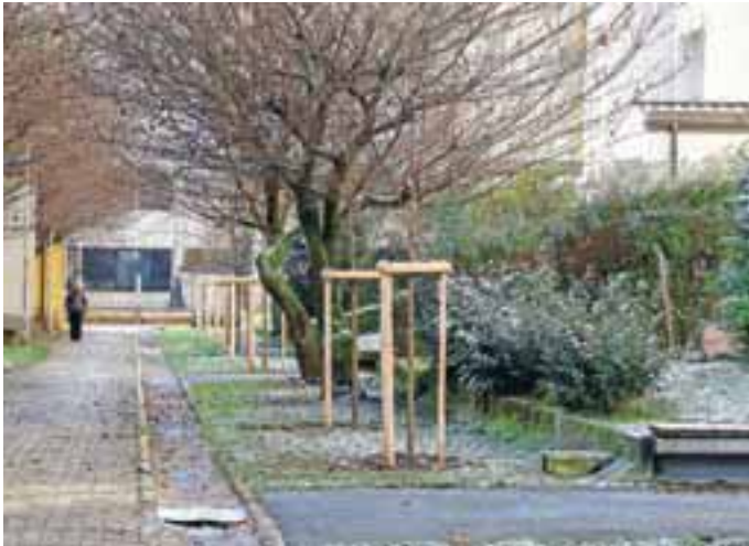
Novo zasaditve v drevoredu v Gogalovi ulici

Del sredstev iz letošnjega proračuna Mestne občine Kranj je bil namenjen investicijam, investicijskemu vzdrževanju, ki se na osnovi sklepa Sveta krajevne skupnosti zagotovijo v posebnem delu proračuna in načrtu razvojnih programov. H kakovosti življenja v KS Planina in KS Huje prispevajo tudi zadnje pridobitve.