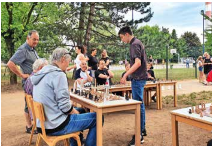
Šahovski izziv za stare in mlade

Prireditev je tudi letos zelo lepo uspela, za prihodnje leto pa upajmo, da se znova vrne točka Aljažkov talent – in mladi imajo številne talente –, ki je letos ni bilo.