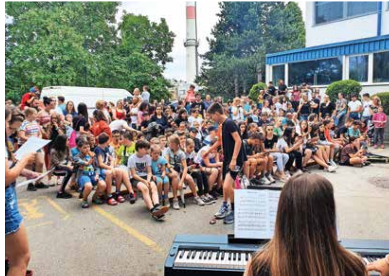
Živahen utrip na Aljažkovem dnevu tudi s številnimi nastopi

Tudi tokrat pa je imela prireditev dobrodelni namen. Vsa sredstva, ki so jih zbrali na ta dan s srečelovom, bazarjem in iz prodaje okusnih dobrot iz šolske kuhinje, so namenili ureditvi prijetnih koticov za sproščanje na šoli.