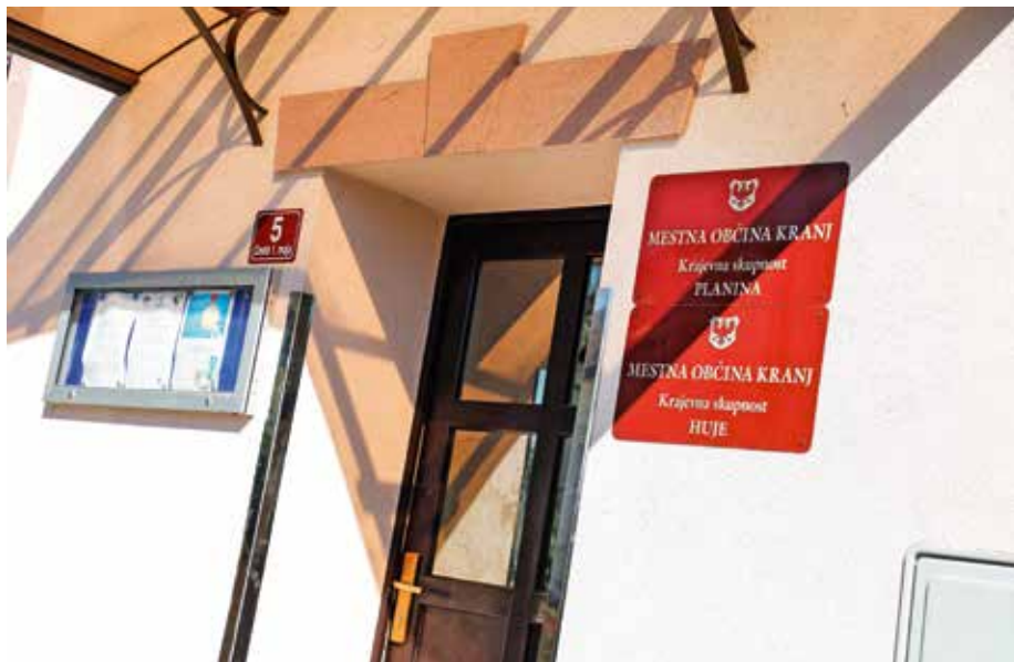
Krajevni skupnosti Planina in Huje že zdaj delujeta v istih prostorih.

Mestni svetniki so soglasje k razpisu posvetovalnega referenduma sprejeli že maja letos. Predlagala sta ga sveta krajevnih skupnosti Planina in Huje, ki menita, da je zaradi uresničevanja skupnih interesov in ciljev smiselno in rentabilno pristopiti k združitvi krajevnih skupnosti. Krajevni skupnosti sicer že zdaj delujeta v istih prostorih, skupaj praznujeta krajevni praznik, med