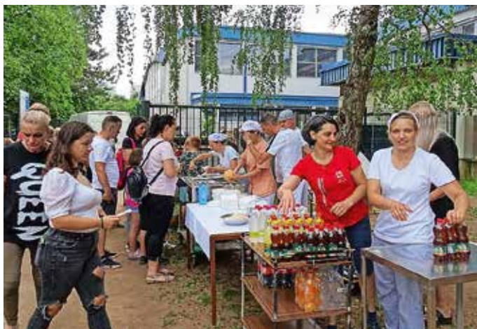
Dobrote iz Aljažkove kuhinje