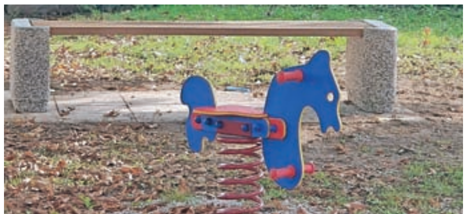
Novo igralo za otroke in klopi za starše