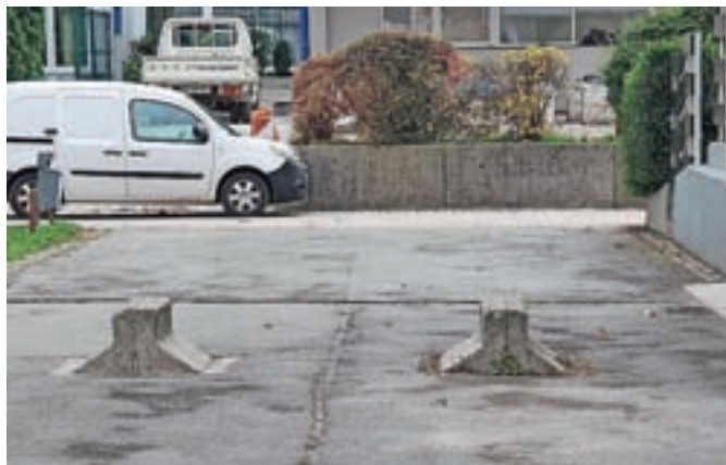
V načrtu je, da bo Komunala Kranj betonski oviri zamenjala z odsevnimi količki.