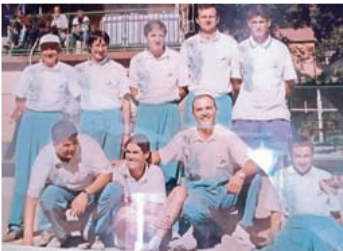
Ekipa Balinarskega kluba Huje je leta 1995 osvojila slovenski pokal Republike Slovenije.

Ob obnovi otroškega igrišča na Hujah je bila zgrajena tudi balinarska steza, ki je takoj postala priljubljena pri stanovalcih Novega doma. Ti so 18. junija leta 1972 ustanovili Balinarski klub Huje. Trinajst let zatem so zaradi sprememb tekmo-