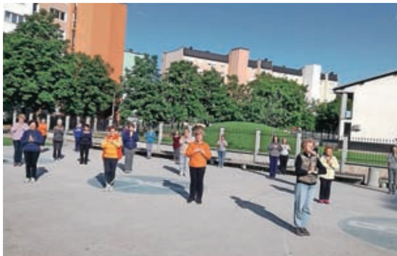
Jutranjo telovadbo zaključijo s t. i. pozdravom soncu.

Društvo Šola zdravja združuje ljudi z namenom izvajanja jutranje vadbe na prostem v vseh letnih časih. Z redno vadbo 1000 gibov krepijo telo in duha, širijo krog znancev, pridobivajo nove prijatelje in se v okviru društva vključujejo v lokalne dogodke. Vadba poteka tudi na igrišču med vrtčevskima enotama Mojca in Najdihojca na Planini, in sicer vsak dan ob 7.30, razen ob nedeljah in praznikih. Izvaja se pol ure na prostem in je namenjen tako starejšim kot mlajšim. »Vadba vključuje vaje za raztegovanje mišic, od prstov na nogah do prstov na rokah, s čimer razgibamo celo telo. Obenem pripomore k fizičnemu in psihičnemu zdravju posameznika in socializaciji, ki je pomemben dejavnik za kakovost življenja. Večinoma se jih udeležujejo starejši, vsak pa lahko telovadi po svojih sposobnostih. Vaje niso težke in so primerne za vsakogar. Trenutno skrbimo tudi za upoštevanje vseh zaščitnih ukrepov, od varnostne razdalje do nošenja mask,« je pojasnila ena izmed vaditeljic Beba Noe in dodala: »Udeležba na vadbi je sicer brezplačna, če pa se posameznik želi včlaniti v društvo, je članarina dvajset