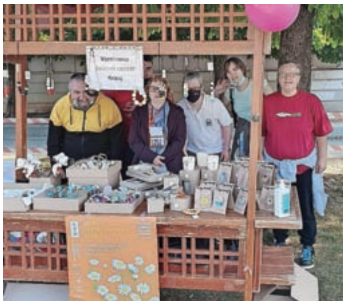
Na stojnici so se predstavili tudi uporabniki Varstveno-delovnega centra Kranj.

Pred dvema letoma so na občini pred športno dvorano na Planini na predlog ravnatelja in Zavoda za šport Kranj na delu parkirišča uvedli kratkotrajno obiskovalcem športne dvorane, šole in vrtca.