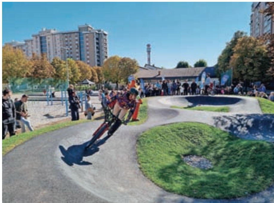
Grbinasti poligoni so v zadnjem obdobju postali zelo priljubljena športna igrišča.

»Grbinasti poligoni so danes zelo atraktivna in priljubljena športna igrišča. Namenjena so tako otrokom in mladim kot odraslim, za rekreacijo ali tekmova-