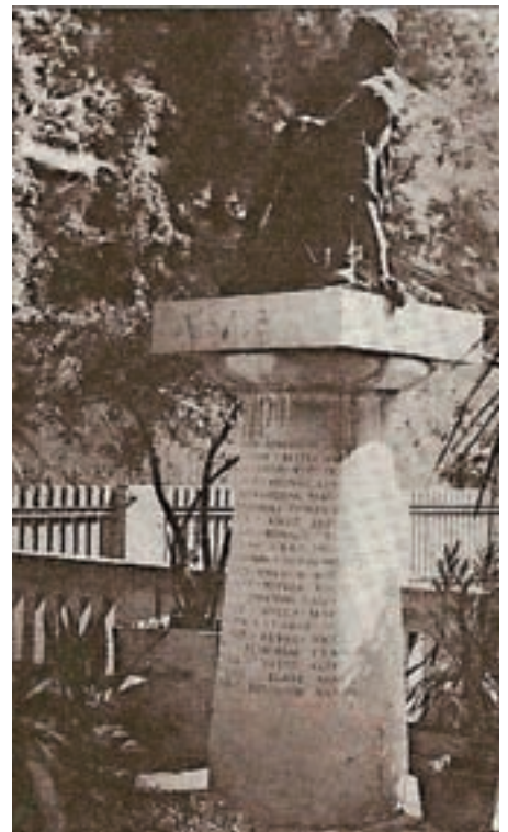
Spomenik padlim delavcem je bil pred tovarno Inteks do leta 2003.