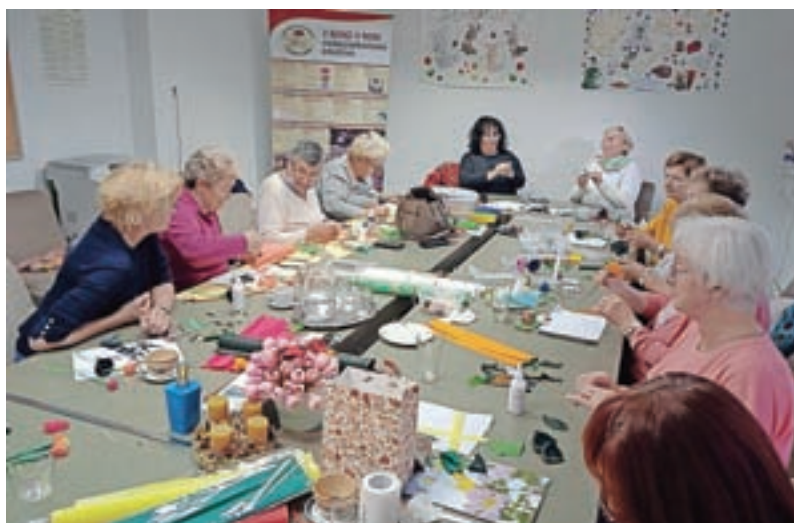
Jeseni so znova lahko organizirali delavnice, na katerih tudi dobre volje ni manjkalo.

V septembru so po skoraj enoletnem premoru začeli pripravljati tombolo, ki jo izvajajo v Medgeneracijskem centru (MC) Kranj. »Tombola je za vse prebivalce Kranja, ne samo za naše člane. Žal je zaradi pogoja PCT število mest omejeno, zato so potrebne predhodne prijave. Vsak mesec poskrbimo za veliko dobre volje in skupaj z MC Kranj tudi za praktične nagra-