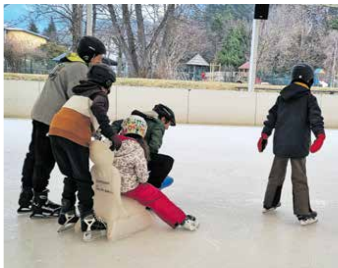
Otroci so uživali na drsanju v radovljiškem športnem parku in plavanju v Vodnem parku Bohinj.

»Otroški smeh ter zadovoljni, veseli in nasmejani obrazi so največja nagrada in spodbuda, da bomo zimske aktivnosti organizirali tudi prihodnje leto.«