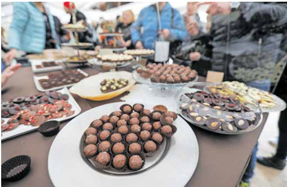
Tudi na letošnjem Festivalu čokolade organizator, Zavod Turizem in kultura Radovljica, obljublja veliko kulinarčnih užitkov in obilo zabave.