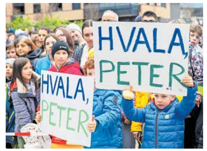
Posebej navdušeni nad športnim junakom so bili najmlajši, ki so ga v velikem številu prišli pozdravit na Vurnikov trg.