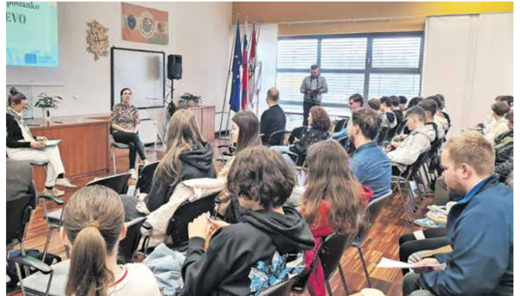
Mladi iz Ekonomske gimnazije in srednje šole Radovljica ter udeleženci Pumo+ / v pogovoru s poslanko Evropskega parlamenta Ireno Jovevo

Joveva, ki je otroštvo in mladost preživela na Jesenicah, pred študijem politologije pa zaključila ekonomsko gimnazijo v Radovljici, jim je povedala, da so jo politična in družbena vprašanja zelo zanimala že v otroštvu. Ogovorila je, da je v Evropskem parlamentu med mlajšimi, da pa je najmlajša poslanka