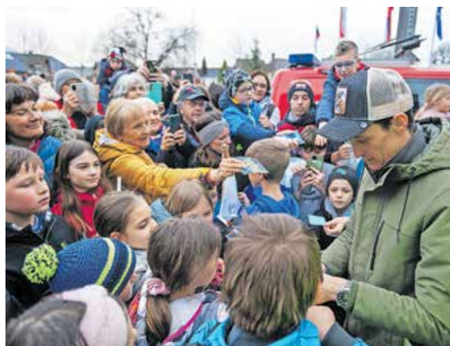
Tako mladi kot starejši so z veseljem izkoristili priložnost, da so legendi smučarskih skokov čestitali in ga poprosili za avtogram.

ga obiska ob slovesu od smučarskih skokov. Po sprejemu pa je dodal, da se je vedno lepo sprehajati po Radovljici, kjer so lepi tudi odnosi, ki jih imajo ljudje drug do drugega.