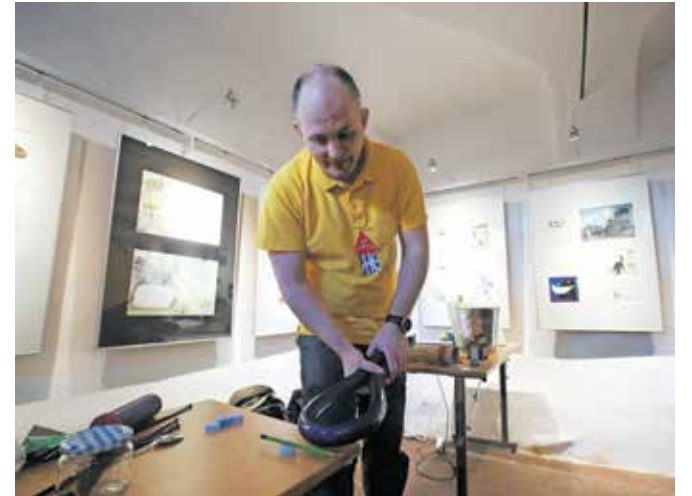
Na odprtju razstave so mladi obiskovalci z navdušenjem sodelovali na delavnici o električki, s katero je v Radovljici sodelovala Hiša eksperimentov.