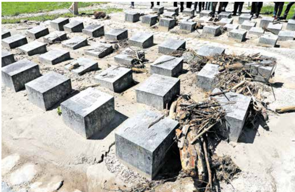
V proračun so z rebalansom vključena tudi sredstva, ki jih je občina pridobila za obnovo v vodni ujmi poškodovanega grobišča talcev na vrtu graščine Katzenstein v Begunjah.

Spremembe pri odhodkih so posledica prilagajanja dinamiki izvajanja investicij, pridobljenim nepovratnim sredstvom ter višjim materialnim stroškom, stroškom energentov in plač. »Med večjimi spremembami je vključitev sredstev za prenos zgrajene komunalne opreme zemljišč za stanovanjsko gradnjo. Povečujejo se sredstva za dozidavo Vrtca Radovljica z razvojno ambulanto ter dozidavo in prenovo kuhinje vrtca, za šolske prevoze in investicijsko vzdrževanje šol. Povečujejo se tudi sredstva za dokončanje obnove kulturnega doma v Kropi, v proračun je na novo vključena obnova grobišča talcev v Begunjah. Več bo sredstev za odpravo posledic škode na gospodarski javni infrastrukturi zaradi naravne nesreče v preteklem letu. Dodatna sredstva bodo namenjena dokončanju prve faze projekta komunalne infrastrukture v Kamni Gorici, to je izgradnji kanalizacije, vodovoda in obnovi javnih površin, ter pripravi projektno dokumentacije za drugo