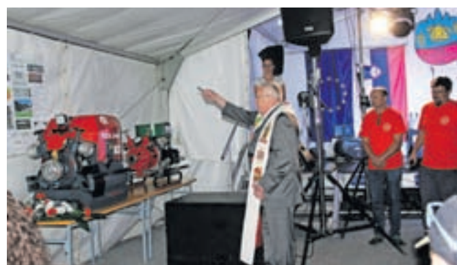
Na veselici so tudi simbolično prevzeli novo motorno črpalko in jo blagoslovili.

njem, uspelo z donacijami pomagati PGD Črna na Koroškem, ki je denar namenilo za urejanje poplavljenega gasilskega doma, gasilcu iz PGD Črna na Koroškem za sanacijo poplavljenega stanovanja ter gasilcu iz PGD Prevalje, prav tako za sanacijo poplavljenega stanovanja. »Donacije smo simbolično predali ob obisku novembra lani, vse skupaj ovekovečili na fotografijah in te vključili v redni letni koledar društva.«