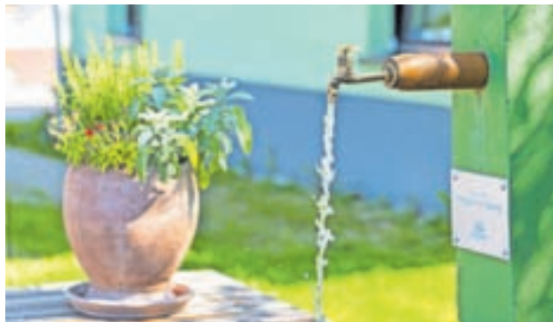
Na območju občine Radovljica pijemo zdravo in kakovostno vodo.

Število odvzetih vzorcev in obseg preiskav sta odvisna od količine distribuirane pitne vode ter od njene pričakovane kvalitete. V letu 2023 sta bila na vodovodnih sistemih v okviru notranjega nadzora odvzeta 302 mikrobiološka in kemijska vzorca pitne vode, od katerih je večina ustrezala zahtevam Pravilnika o pitni vodi oz. Uredbe o pitni vodi.