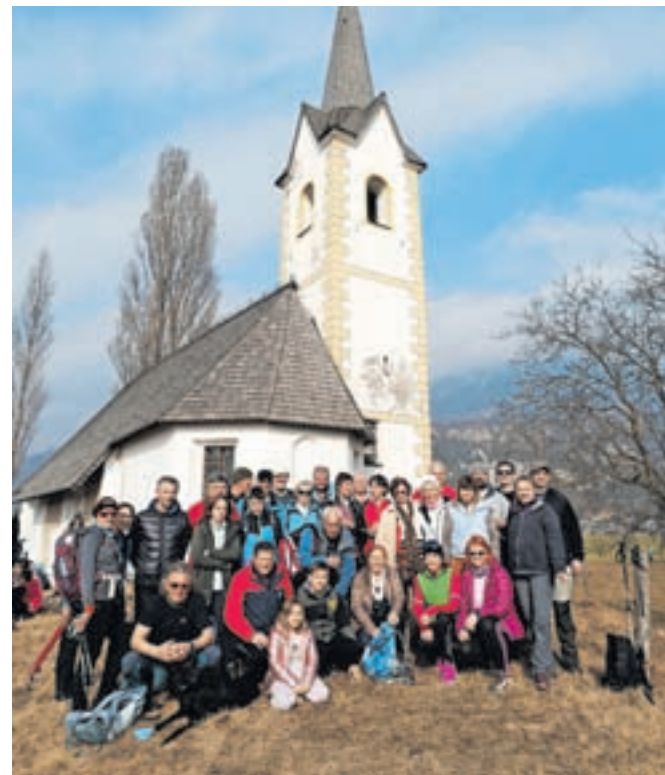
Pohodniki pred cerkvijo sv. Marka

Na koncu poti, pri cerkvi sv. Marka v Vrbi, se vsako leto srečajo s prijatelji pohodniki iz Podnarta, Dobrave, Kamne Gorice in Lancovega. »Malo poklepeta, si