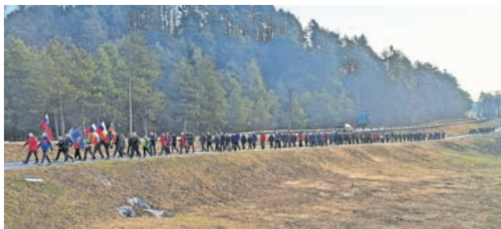
Pohodniki se približujejo Vrbi.

Po proslavi v Vrbi sta jih na izhodišču, v srednji gostinski in turistični šoli, čakala zaslužena malica in klepet z znanci, s katerimi se nekateri srečujejo le na tem pohodu, je še povedala Ana Miler. »Da tako preživeti dan kulture udeležence bogati in osrečuje, potrjujejo premnogi, ki se vedno znova in znova, vsako leto 8. februarja, vračajo na to pot.«