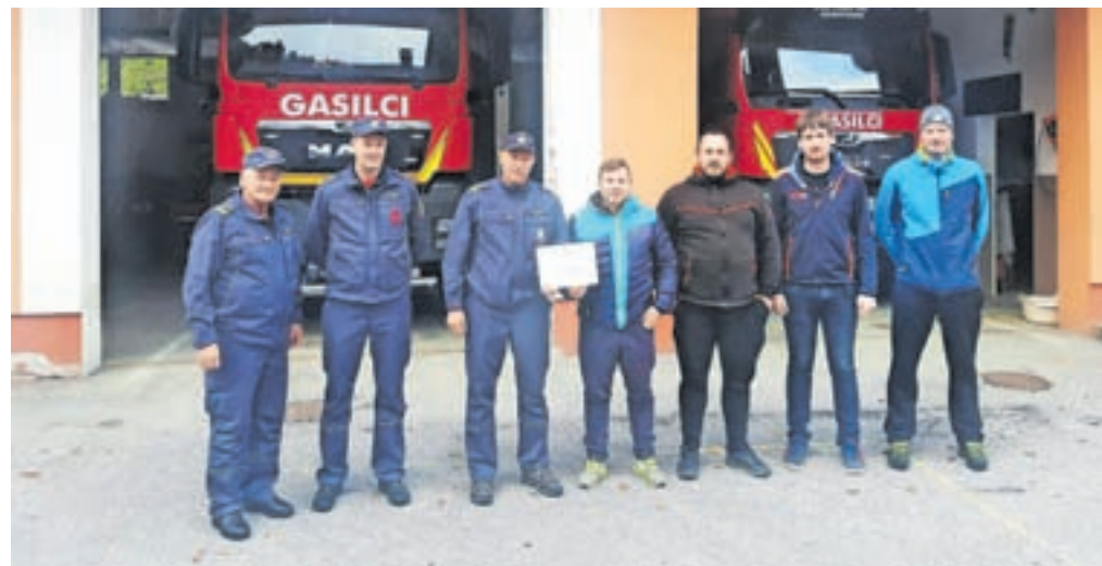
Predstavniki PGD Sr. Dobrava in prejemniki donacije iz PGD Črna na Koroškem