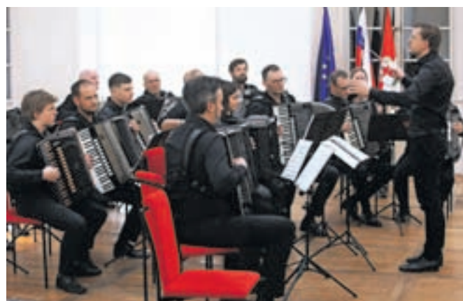
Harmonikarski orkester Glasbene šole Radovljica