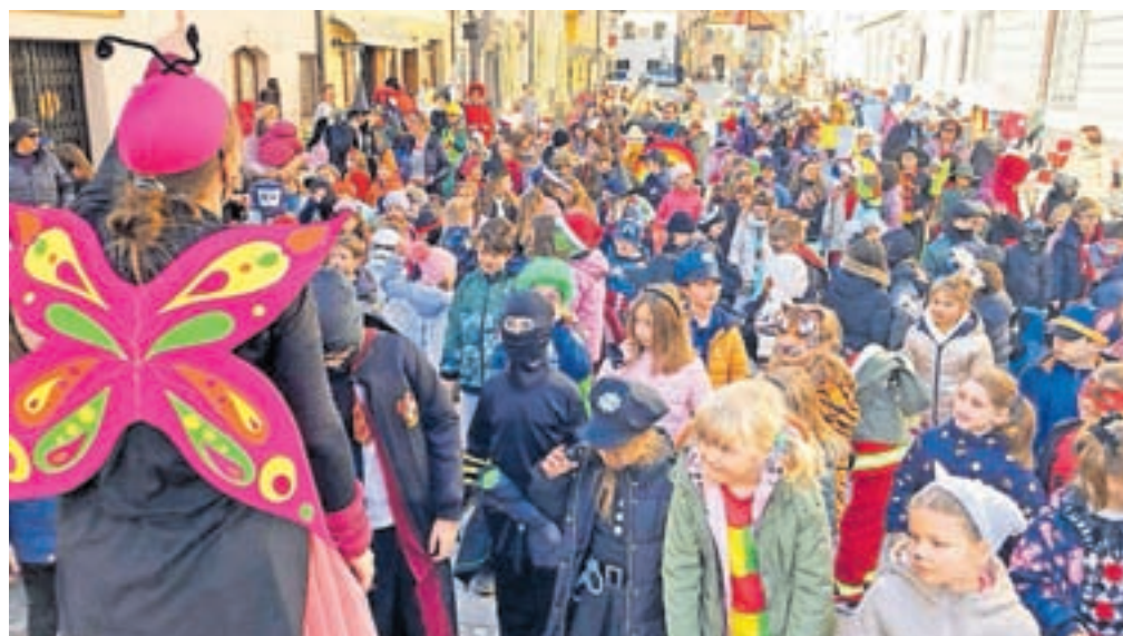
Torkovo pustno rajanje je privabilo številne najmlajše.

Prava pustna povorka pa je bila rezervirana za sobotno popoldne. Vse od Cankarjeve ulice po Gorenjski cesti do Linhartovega trga se je