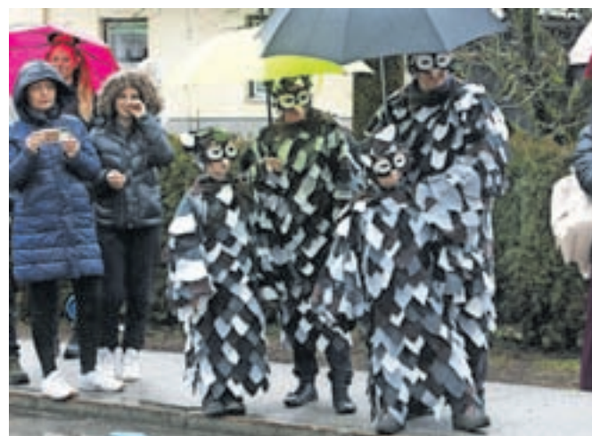
Sovja družina Urbas iz Podnarta je kostume za pustni sprevod izdelovala kar štiri dni.