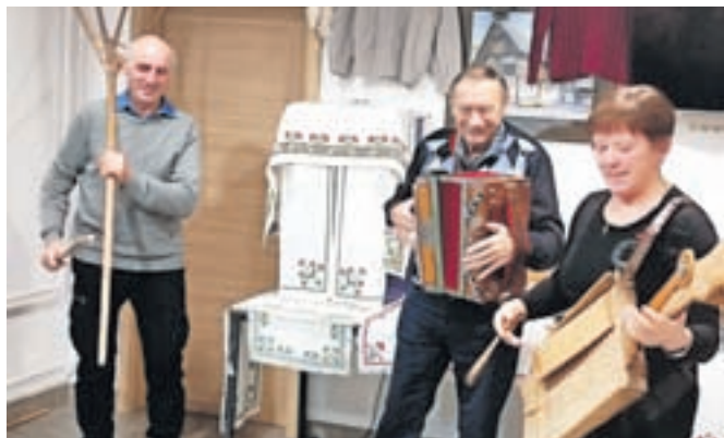
Prireditev ob slovenskem kulturnem prazniku so članice društva pripravile v domu ŠD Ljubno.