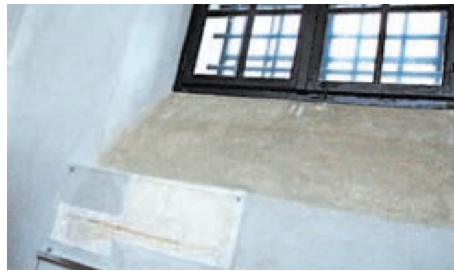
Muzej talcev v Begunjah je bil zadnjič prenovljen leta 2010.

graščine, kjer so bile celice na smrt obsojenih, je danes urejen muzej, ki spominja in opominja na trpljenje, strah, negotovost in nečloveška mučenja v preiskovalnih postopkih med drugo svetovno vojno, pojasnjujejo v Muzejih radovljiške občine (MRO),