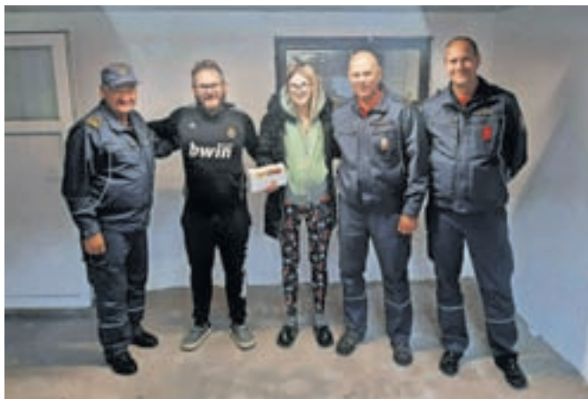
Predstavniki PGD Sr. Dobrava in prejemnik donacije iz PGD Prevalje s partnerico

Le dober teden pred okroglo obletnico PGD Srednja Dobrava so Slovenijo prizadele močne padavine in posledično velike poplave. Sicer jih na območju društva k sreči ni bilo, so pa bili gasilci napoteni na pomoč drugim društvom v zvezi, in sicer v Begunje, na Zgošo, v Globoko in Novo vas. Na pomoč so priskočili tudi pri polnjenju protipoplavnih vreč. Glede na veliko obremenjenost gasilcev v tistem obdobju in potrebo po pomoči tudi v drugih delih države pa so se