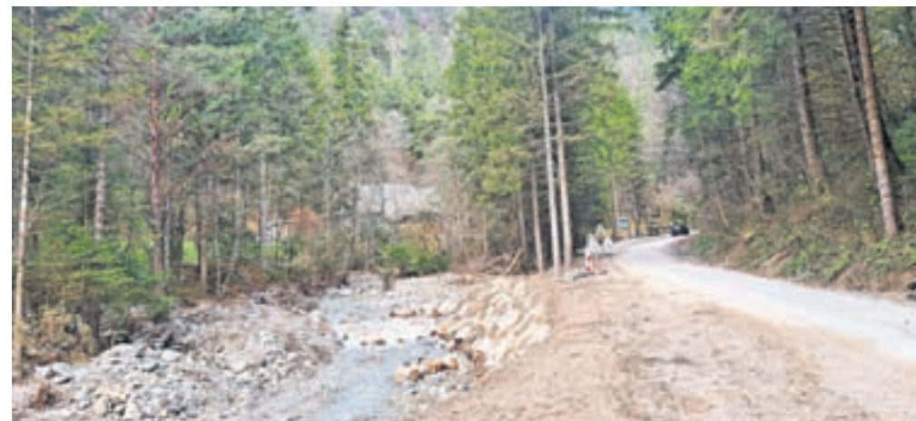
Sredstva so namenjena obnovi v ujmi poškodovanih občinskih cest, med njimi tudi ceste v dolini Draga.

Zaradi nejasnosti glede izračunov pri določitvi cene storitve pomoči na domu pa svetniki niso potrdili predlaganega enajstodstotnega povišanja cen storitve, ki jo izvaja Dom dr. Janka Benedika Radovljica.