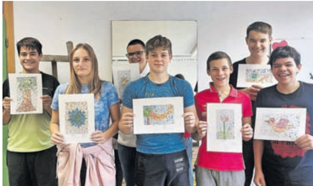
Skupno je nastalo dvajset risb, ki že krasijo stene prijaznih ljudi, ki so sodelovali na dobrodelni dražbi.