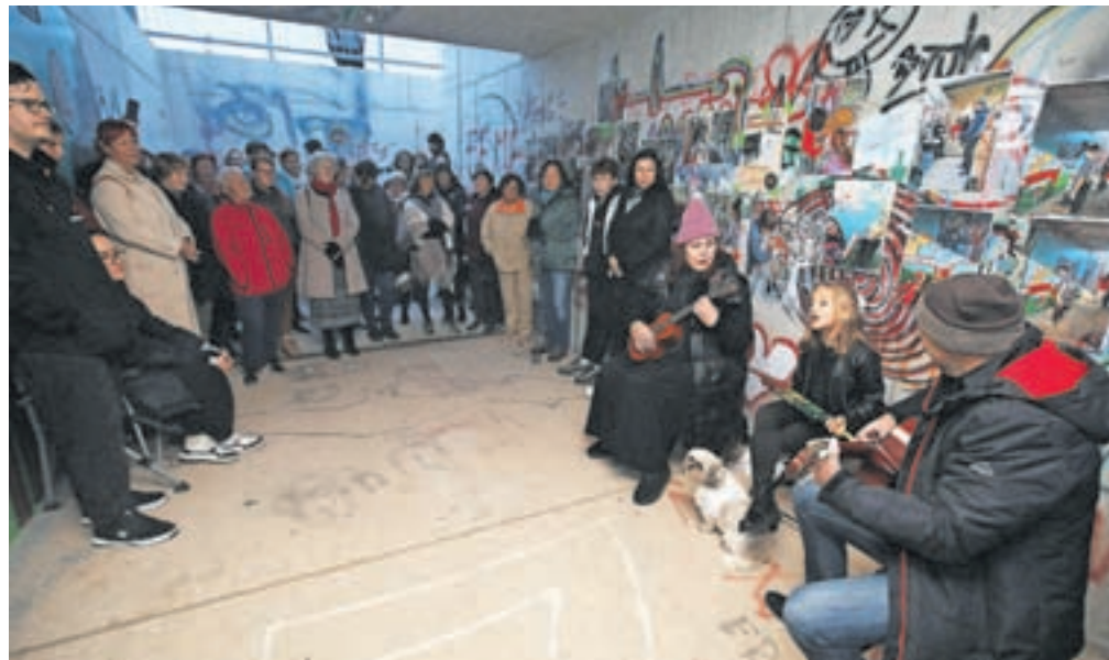
Tudi odprtje poslikanega podhoda je bil pravi umetniški dogodek v malem. Popestril ga je imeniten nastop glasbeno-gledališke družine Vester-Trseglav iz Radovljice.

Izrazil pa je tudi pričakovanje, da bodo vsi tisti, ki podhod uporabljajo, znali ceniti opravljeno delo in da bodo nove poslikave tudi v prihodnje ostale takšne, kot so v osnovi – iskreno in zanimivo umetniško delo.