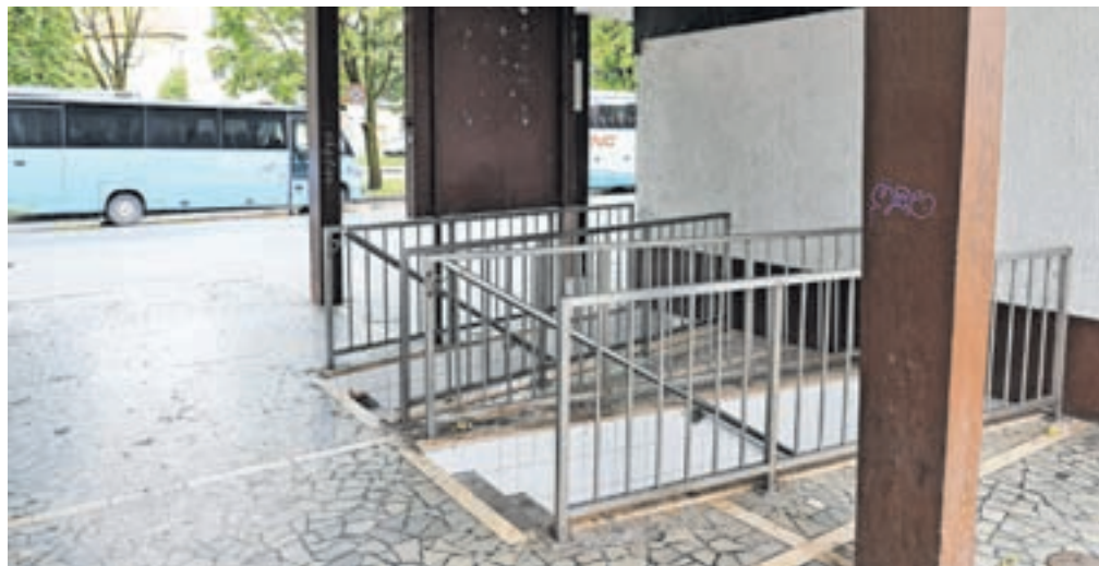
Javno stranišče na radovljiški avtobusni postaji je že dolgo zanemarjeno in zaprto.

ga objekta, podjetja Arriva, spomladi pridobila brezplačno stavbno pravico za obdobje 25 let.