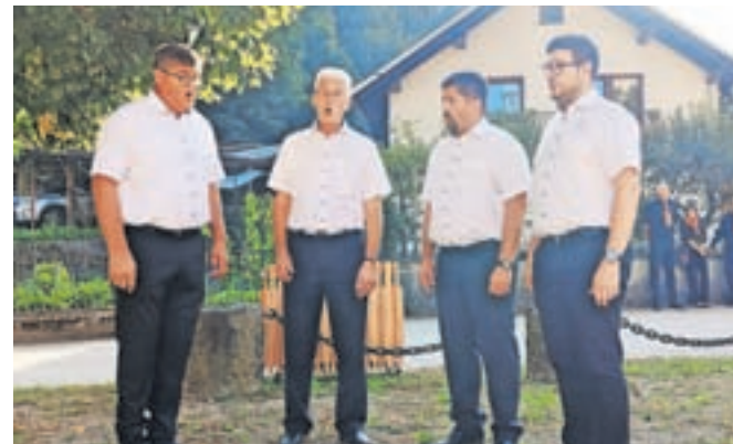
Z izborom pesmi je nastopila tudi vokalna skupina Lipa.