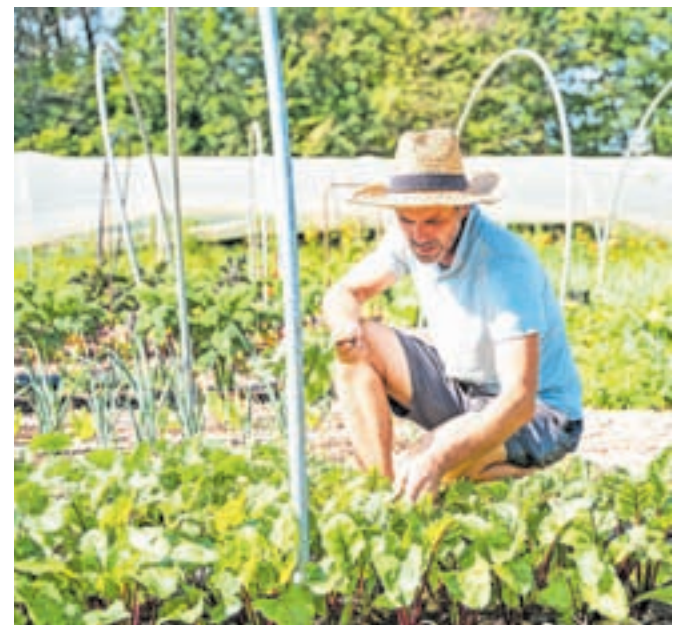
V oktobru se bodo zvrstili še dnevi odprtih vrat na kmetijah Vegerila, Brinšek in Dolenc.