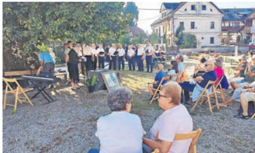
Praznovanja krajevnega praznika se je udeležilo lepo število krajanov.