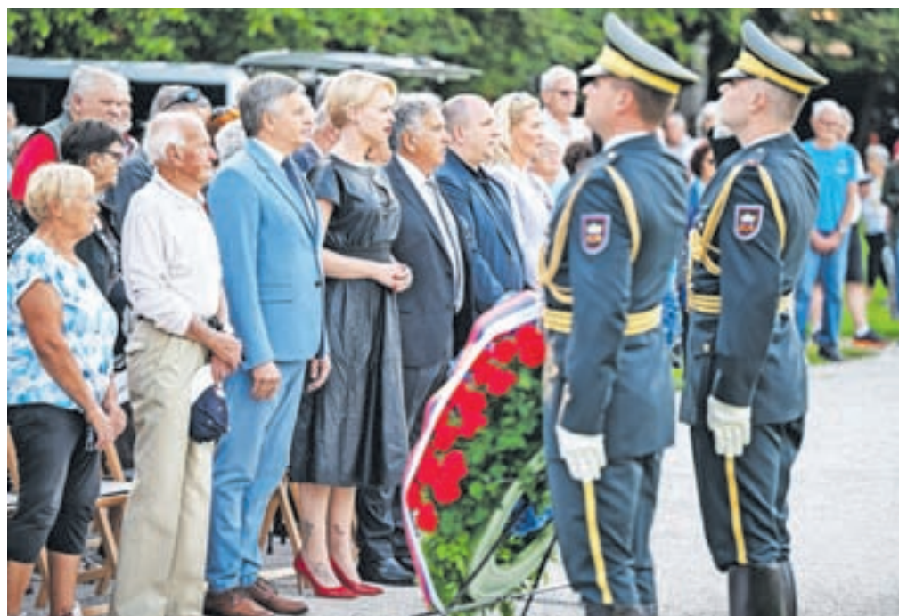
Ponovno so se spomnili borcev, ki so življenja izgubili na Jelovici.

Tisti, ki so pokopani tukaj, so želeli spremeniti svet na bolje. Bili so samo ženske in moški, ki so se zaradi želje po svobodi in preživetju slovenskega naroda hrabro bojevali. Ampak bili so junaki.