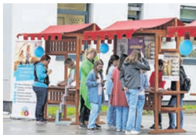
Center za krepitev zdravja, ki deluje v okviru Zdravstvenega doma Radovljica, je tudi letos organiziral Dan zdravja.

»V svetu, v katerem nam trgovci ponujajo skoraj neomejeno število izdelkov, ki nam obljublajo zdravje, izgubo telesne mase ter dobro počutje, je res težko med vsemi informacijami razbrati relevantne in strokovne podatke. Diplomirana diete-