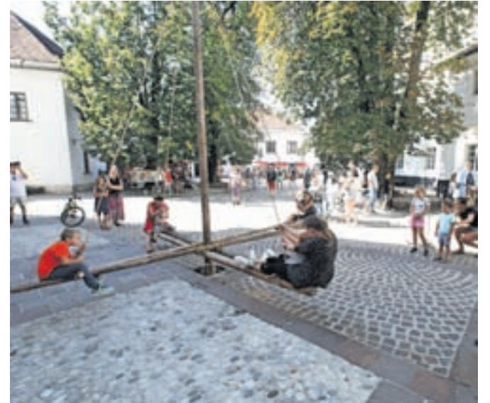
Srednjeveški vrtljak je pritegnil veliko pozornosti predvsem najmlajših obiskovalcev.