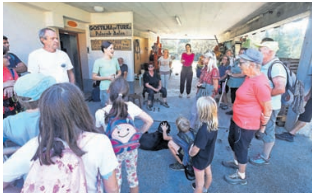
Sobotno dogajanje se je začelo s pohodom po krajevni skupnosti.