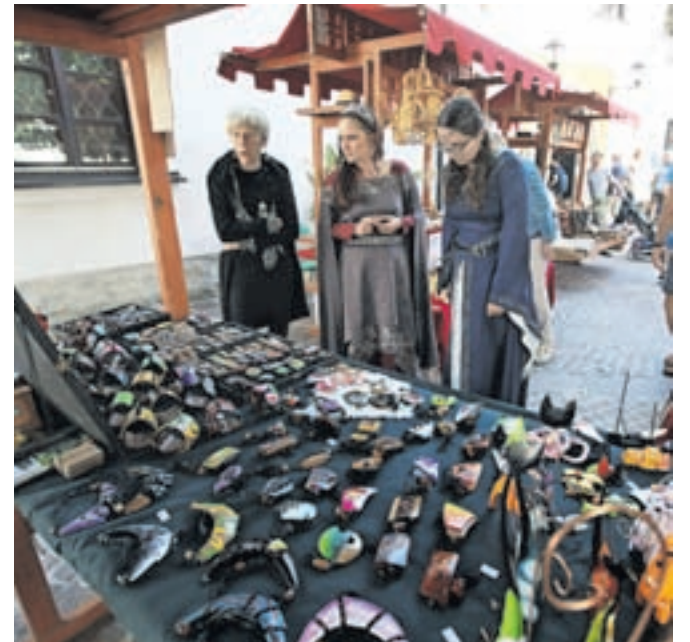
Grajske gospe so se sprehodile med stojnicami – mogoče pa bodo snubci radodarni.