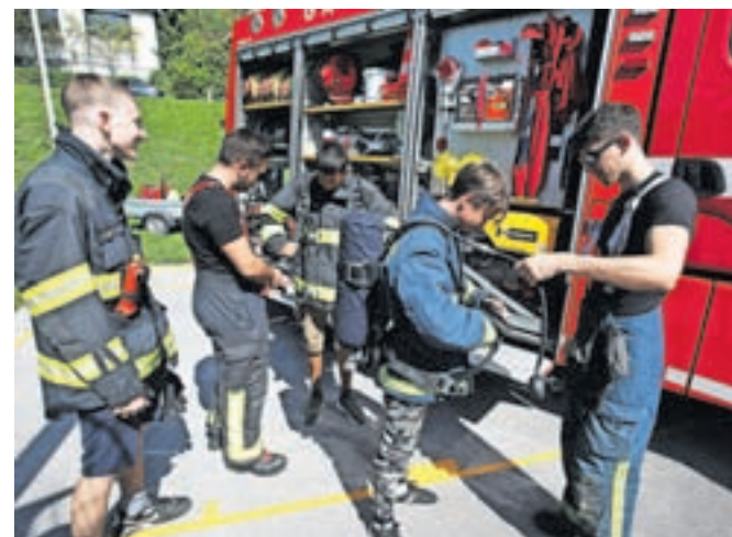
Seveda se je Dneva in pol krajanov udeležilo tudi gasilsko društvo, ki je z veseljem pokazalo svojo opremo.

dogajanje všečno, saj so ponudili veliko aktivnosti za otroke. »Všeč nam je, ker se lahko preizkusijo v različnih stvareh. Naša dva se navdušujeta nad Tomosi, ogledali smo si gobarsko razstavo in super bi nam bilo, da bi to ponovili tudi drugo leto.«