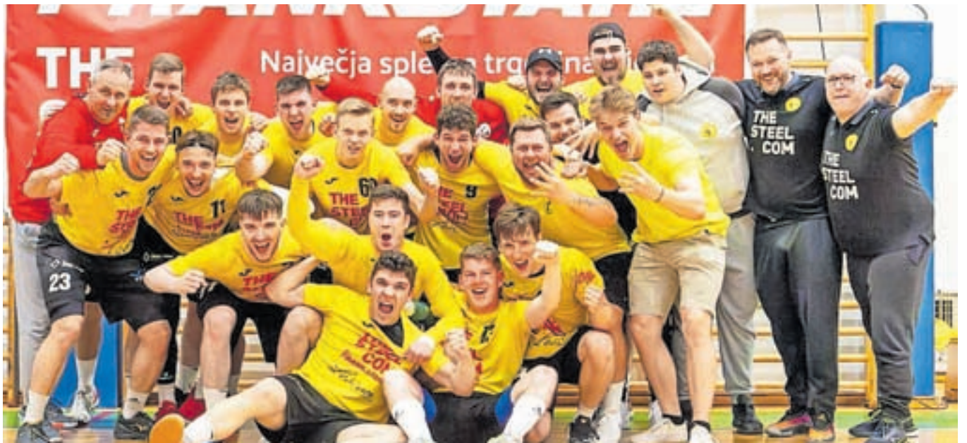
Članska ekipa Rokometnega kluba Frankstahl Radovljica

Poletje je Radovljičanom prineslo še več uspehov. Kadeti so se avgusta udeležili mednarodnega turnirja v Bijeljini (BiH) in domov prinesli pokal za prvo mesto. Konec avgusta se je v Ivančni Gorici odvijal tudi tradicionalni rokometni turnir, ki ga mlajše selekcije vsako leto izkoristijo kot