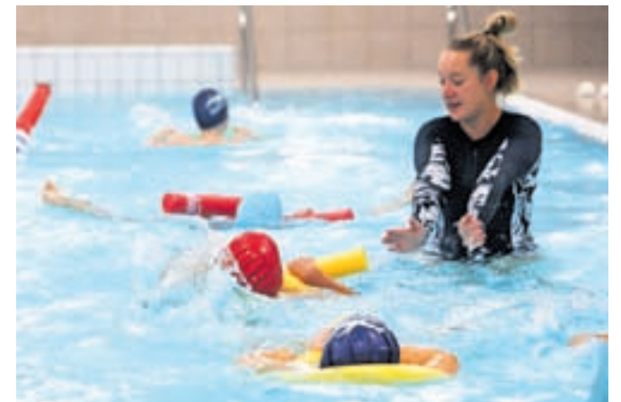
Novi bazen za učenje plavanja že pridno uporabljajo najmlajši.

Iz Plavalnega kluba Radovljica so sporočili, da sta od sredi septembra odprta pokriti olimpijski bazen in tudi novi terapevtski bazen na radovljiškem kopališču. Olimpijski bazen, v katerem je temperatura vode 27 °C, je odprt od ponedeljka do petka med 9. in 12. uro ter od 20. ure do 21.30, ob sobotah in nedeljah pa od 9. do 12. ure in popoldan od 16. do 19. ure. Terapevtski bazen čez dan uporabljajo organizirane skupine iz šol, vrtcev in zdravstvenega doma, med tednom večer pa je od 19. ure do 21.30 na voljo za posamezne uporabnike. Ob sobotah in nedeljah je tako kot veliki pokriti olimpijski bazen na razpolago od 9. do 12. ure ter od 16. do 19. ure. Temperatura vode v terapevtskem bazenu je 30 °C. Plavalni klub Radovljica ima sicer razpisana tudi dva programa za odrasle – vadba v vodi za odrasle v terapevtskem bazenu in vodeno rekreacijsko plavanje v olimpijskem bazenu.