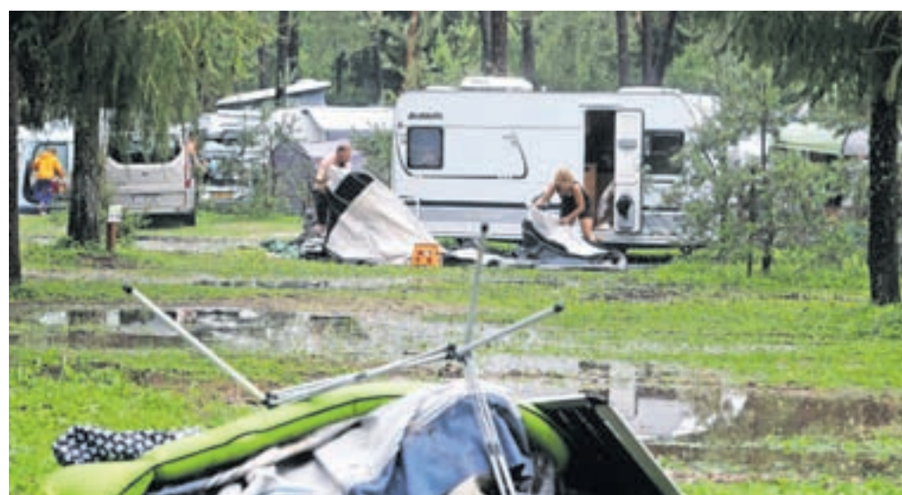
Zjutraj so gostje, ki so noč preživali na suhem v restavraciji kampa, prišli pogledat razdejanje, ki ga je povzročila narasla reka.

Strajnar pravi, da so bili vsi zelo hvaležni za skrb in pomoč. »Ko so odhajali, so se nam iskreno zahvaljevali in nam nato od doma pošljali pisma z izrazi hvaležnosti. Bila je res huda, a po drugi strani tudi lepa izkušnja.« Kot pravi, so se vsi skupaj šele v naslednjih dneh zavedeli, kako dobro so jo odnesli v primerjavi z mnogimi drugod po državi. »Res dobro, da so pristojni še pravočasno sprejeli odločitev za evakuacijo, tako da se ni nikomur nič zgodilo. In komaj teden dni po ujmi tam, kjer je bilo poplavljenno, že stojijo novi šotori.«