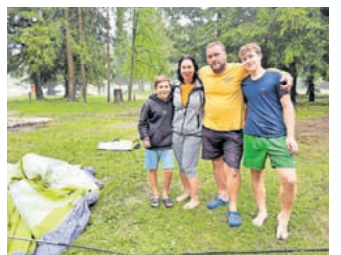
»Bili smo v šotoru in voda je bila vsepovsod. Bilo je grozno,« so dogajanje opisali člani družine Voracek iz Češke.