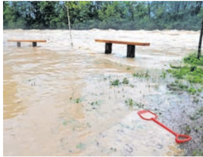
Sava Dolinka je prestopila bregove in poplavlila spodnji del kampa Šobec.

»Bilo je grozno, bilo nas je strah. Bili smo v šotoru in voda je bila vsepovsod. Najprej smo z lopato skopali jarek okoli šotora. Potem smo šli v avto, ker je voda v šotoru še vedno naraščala.