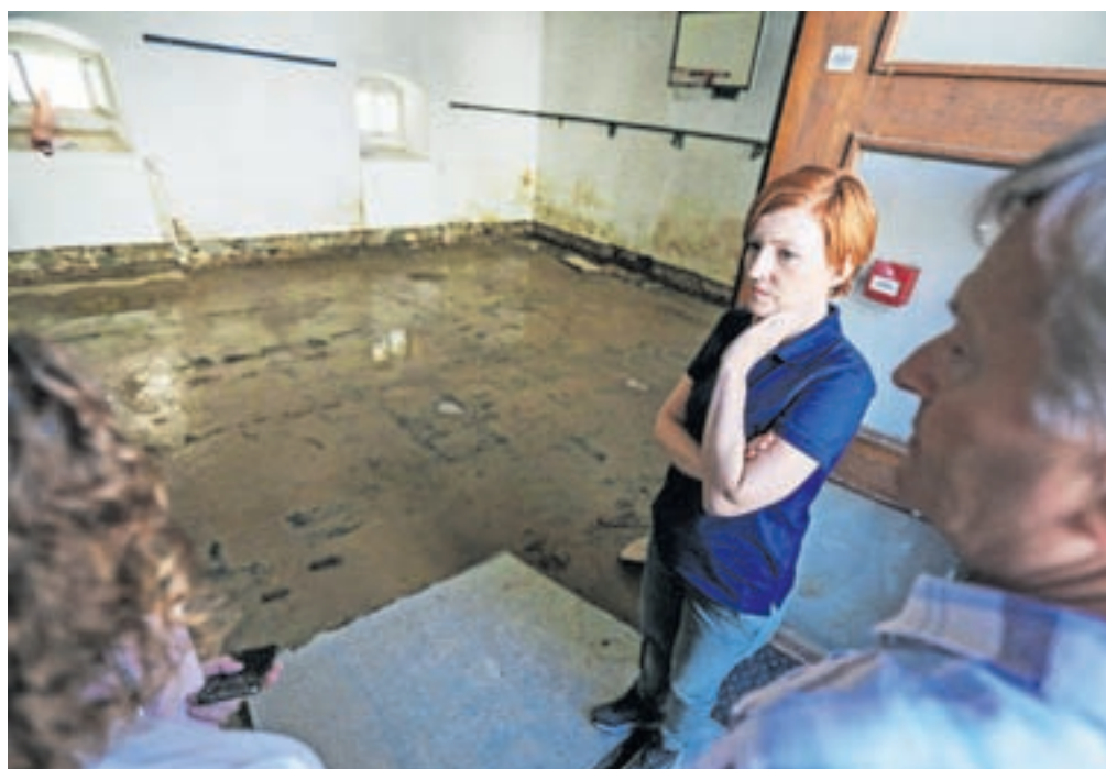
Škodo, ki je nastala v vodni ujmi, si je v petek v graščini Katzenstein ogledala tudi ministrica za kulturo Asta Vrečko.