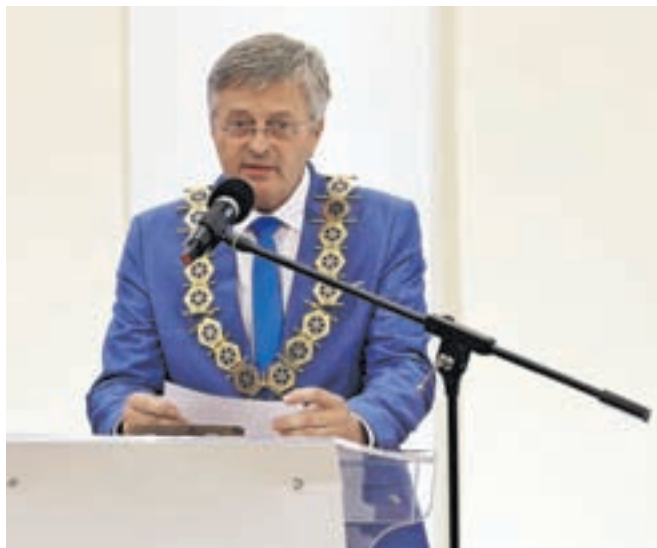
Župan je v svojem nagovoru spomnil na trenutno največje projekte v občini.

V PGD Radovljica se je včlanil pred več kot petdesetimi