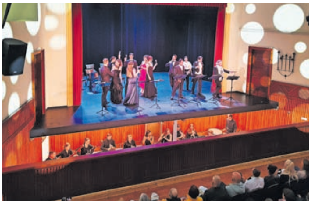
Z operno predstavo Traviata so v Kulturnem domu v Kropi po več desetletjih ponovno obudili orkestrsko jamo.

»S koncertno izvedbo opere Traviata smo zadovoljni, v prvi vrsti tudi zato, da se je kroparska dvorana ponovno izkazala kot zelo dober koncertni prostor. To je lahko spoznala javnost, navdušeni