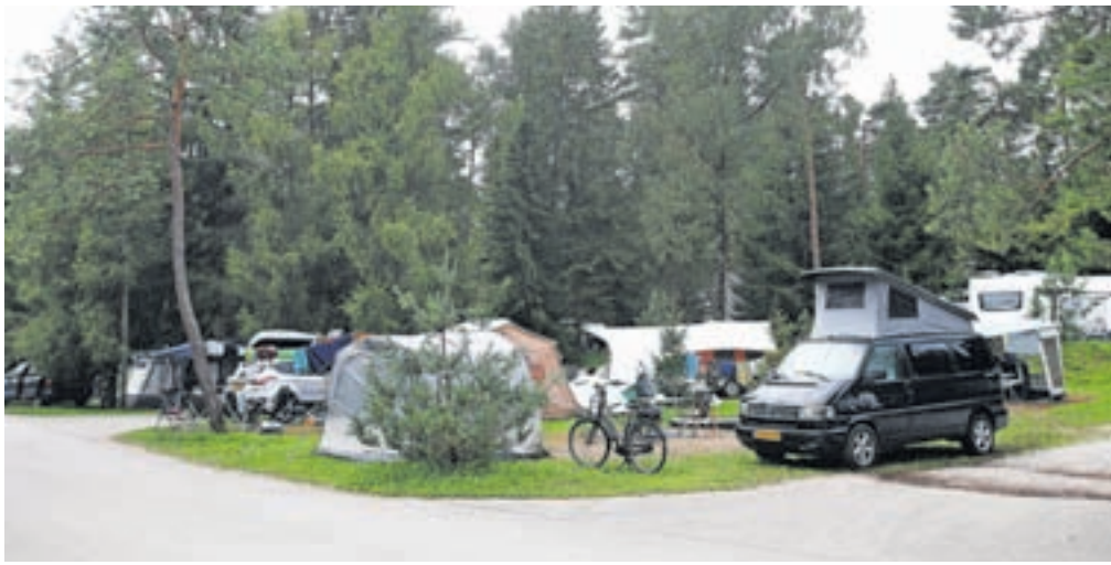
Turistični delavci upajo, da bo sezona odslej vendarle normalno potekala naprej in da bo turizem lahko izkoristil še teh nekaj tednov poletja.

V začetku meseca je bila zaradi slabega vremena že drugič odpovedana tudi priljubljena prireditev Srečanje mest na Venerini poti, ki jo pripravljata Turistično društvo Radovljica. Organizatorji so sporočili, da bodo prireditev, s katero se staro mestno jedro vrača v srednjeveški čas, poskusili organizirati drugo nedeljo v septembru. Zavod za turizem pa bo enega od odpovedanih julijskih koncertov na Linhartovem trgu organiziral v torek, 29. avgusta; nastopil bo glasbenik Pedro Makay, načrtujejo pa tudi vsej še eno kino predstavo na prostem. Kdaj in kje bodo predvajali film, je odvisno od vremena.