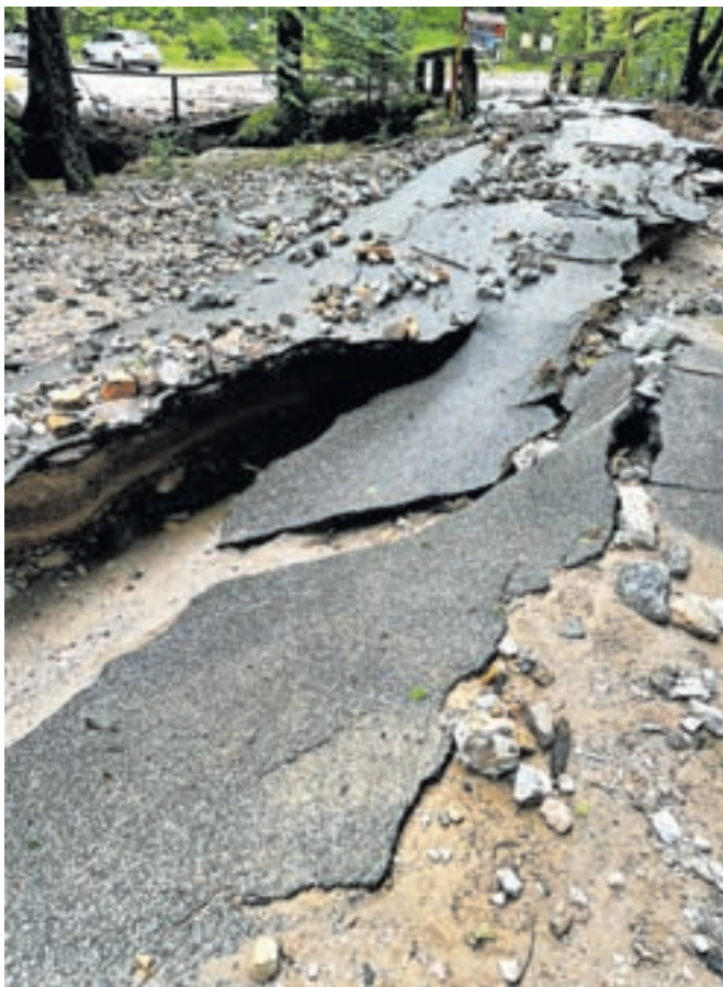
Popolnoma uničeno cesto v dolino Draga so do začetka tedna sanirali v tolikšni meri, da je spet prevozna.