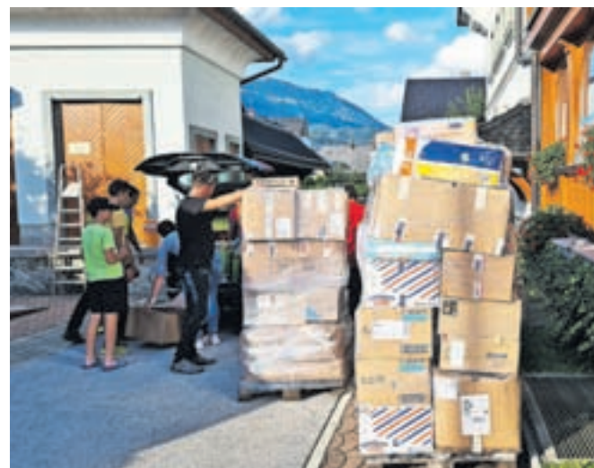
Razvrščene in zapakirane potrebščine so naložili v kombije in na tovornjake, ki so zbrano odpeljali na Koroško.

bi na Koroško odpeljal nekaj najnujnejših potrebščin, so namreč v dveh dneh zbrali