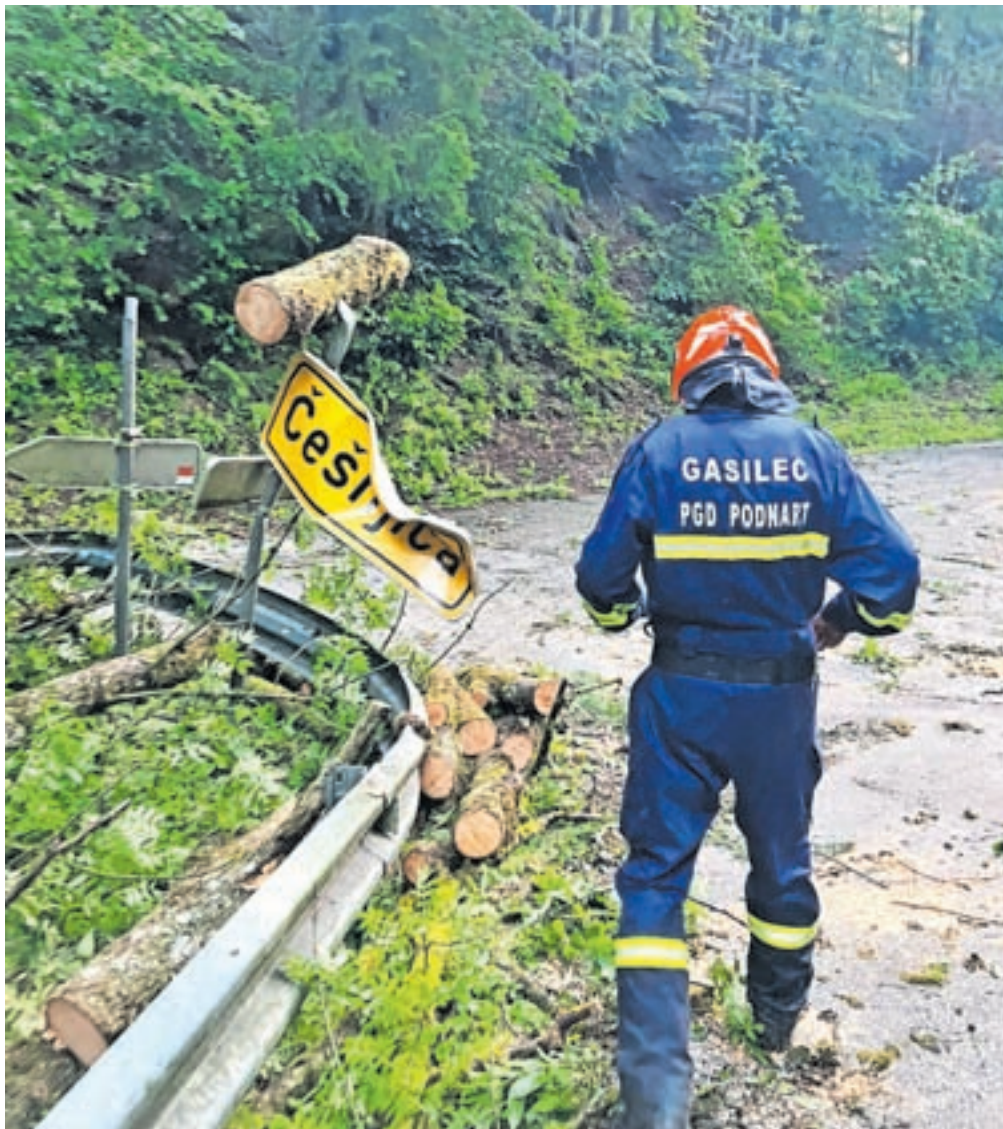
Najbolj je neurje prizadelo območje vasi okoli Podnarta.