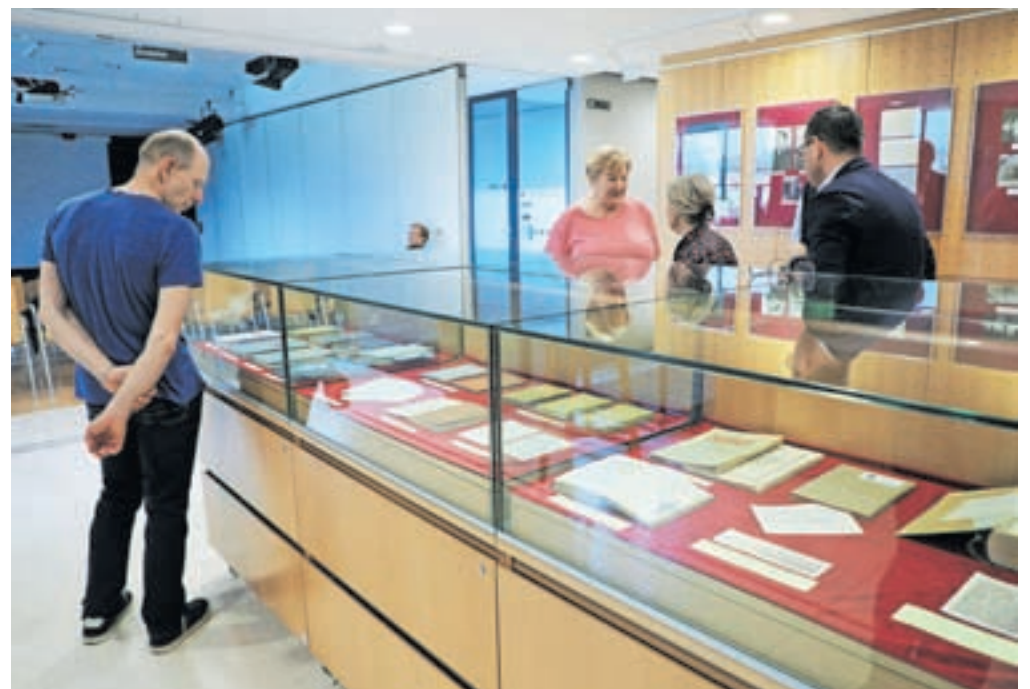
Do sredine avgusta je v radovljiški knjižnici na ogled dokumentarna razstava z naslovom Povedat pridem, ko jo bom obudil avtorjev Franceta Pibernika in Janeza Zaletela, pregled knjižnega gradiva iz Hribovškove knjižnice je pripravil Jure Sinobad.

gimnaziji, kjer je kot komaj 15-leten objavil svoji prvi dve pesmi. Šolanje je nadaljeval na ljubljanski klasični gimnaziji. Tudi tam je bil po učnih dosežkih izstopajoč. Še najstnik je bil, ko se je lotil prevoda Sofoklejeve Antigone in ga leta 1941 dokon-