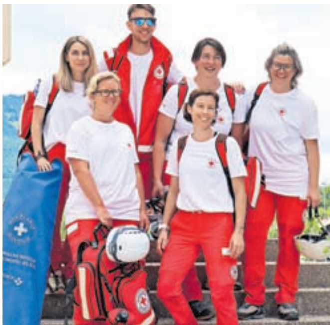
Na srečanju je sodelovala tudi ekipa Območnega združenja RKS Radovljica.

Preverjanja in ocenjevanja so se lahko udeležile ekipe prve pomoči Civilne zaščite lokalnih skupnosti, gospodarskih družb, zavodov, organizacij in društev. Tokratnega preverjanja in ocenjevanja se je udeležilo devet ekip prve pomoči: ekipe območnih združenj RKS Jesenice, Kranj, Tržič in Radovljica, Prostovoljno