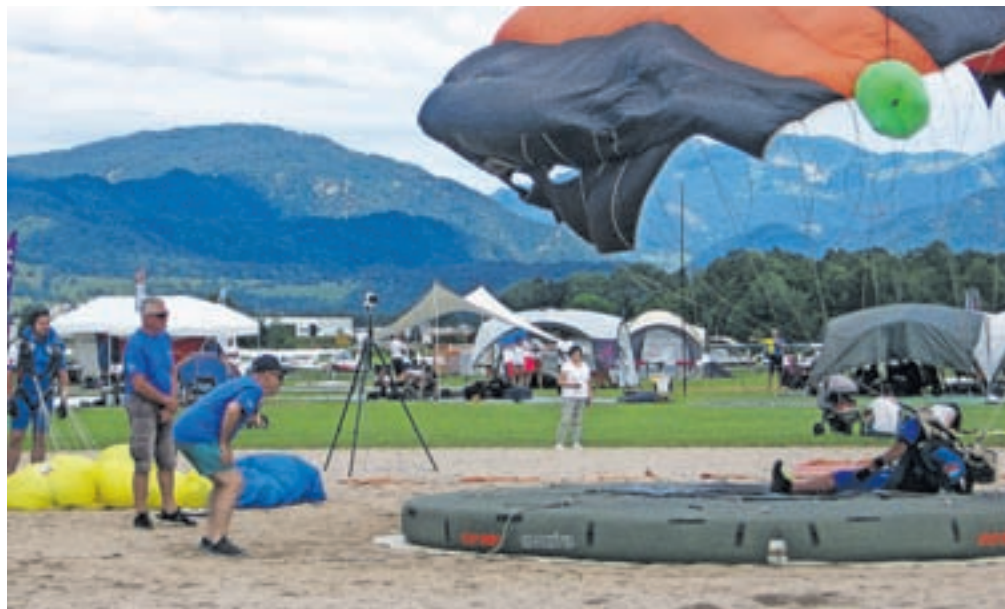
Leško letališče je gostilo drugo tekmo padalcev in padalk v skokih na cilj za svetovni pokal.

nekje med najboljšimi petimi ekipami. Vsaka medalja ima velik pomen in ob odlični konkurenci najboljših padalcev in padalk iz vsega sveta medalje niso sa-