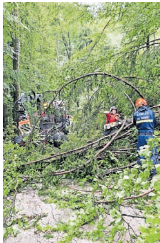
Neurje je prejšnji teden največ škode povzročilo v Lipniški dolini.

Tudi Koselj posebej opozarja, da je podrtih dreves po gozdovih še veliko in da vseh zagotovo še niso niti našli niti odstranili, zato poudarja, da se je treba v gozd tudi v prihodnjih tednih odpraviti zelo previdno. Posebej previdni naj bodo pohodniki in kolesarji.