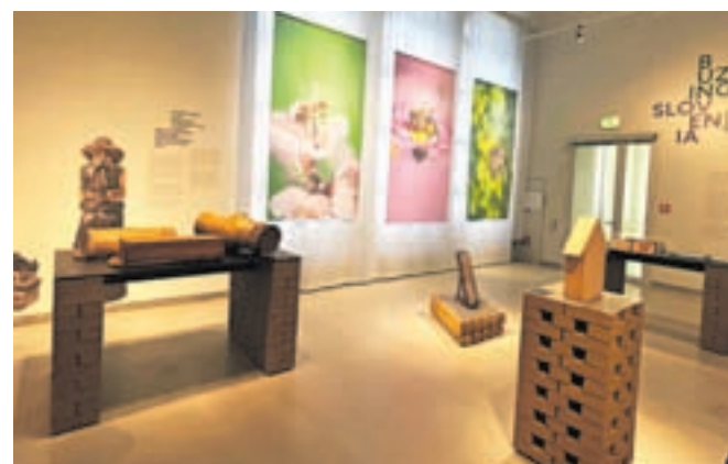
Razstava Buzzying Slovenia v Muzeju evropskih kultur v Berlinu prikazuje tako tradicijo slovenskega čebelarstva kot inovacije s področja urbanega čebelarjenja in trajnostnega oblikovanja.