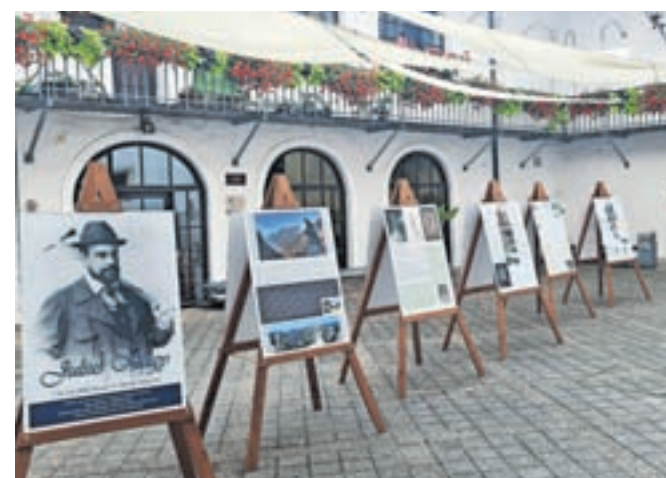
Razstava, posvečena obletnici rojstva Juliusa Kugyja, bo v atriju radovljjskega župnišča na ogled še do sredine avgusta.

Film je bil na ogled v treh delih, prva dva prejšnji teden, zadnji pa v atriju župnišča na Linhartovem trgu danes, 25. julija, ob 20.30. Pri organizaciji sodeluje KUD LIK Naklo.