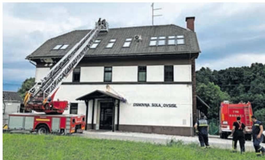
Z gasilsko lestvijo so si pomagali tudi pri prekrivanju podružnične šole Ovsiške

najzgodnejših jutranjih ur reševali probleme. Najbolj pa sem zadovoljen, da so vsi, ki so bili sposobni, takoj pristopili k prekrivanju streh, tako da je bilo delo že od vsega začetka opravljeno dobro in temeljito. V najkrajšem možnem času je bilo opravljenega res veliko dela.«