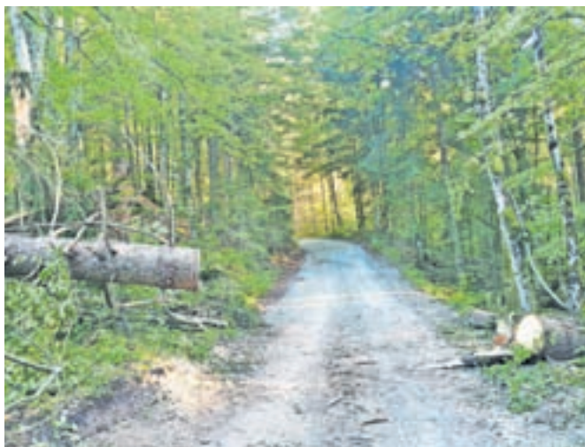
Kljub takojšnjemu začetku odstranjevanja polomljenega drevja je v gozdu še zmeraj zelo nevarno.

S povezovalnih cest je bilo do jutra odstranjena večina