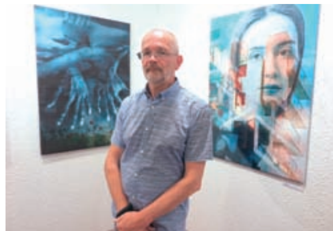
Brut Carniollus med svojimi izbranimi podobami

Digitalizirane podobe Brut odtiskuje na različne podlage, v zadnjem času najpogosteje na slikarsko platno, saj se mu to zdi tudi najbolj vzdržljiv in obstojen material. Kdo bi vedel, morda podoba včasih izbere tudi njega in z njim vse nas, ali kot zapiše kustosinja razstave Saša Bučan: »Ko se obrnemo proč, ko zapustimo prostor galerije, podobe ostajajo v naši zavesti in se neprestano vračajo vanjo.«