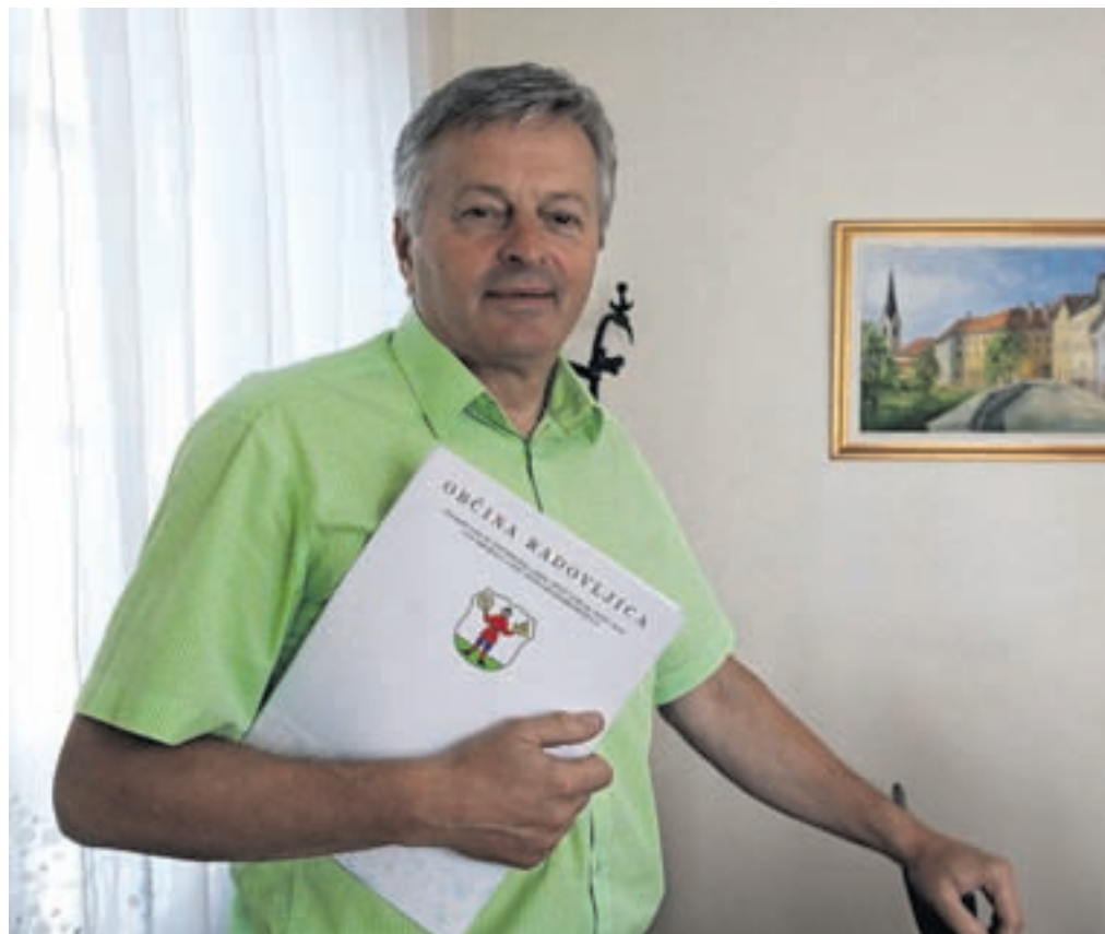
Župan Ciril Globočnik

Projekti za nadaljevanje in dokončno rekonstrukcijo