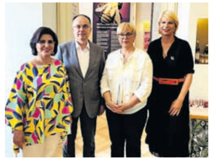
Čebelarški muzej si je ob obisku Slovenije, kjer ga je gostila predsednica države Nataša Pirc Musar, sredi julija ogledal albanski predsednik Bajram Begaj z delegacijo.