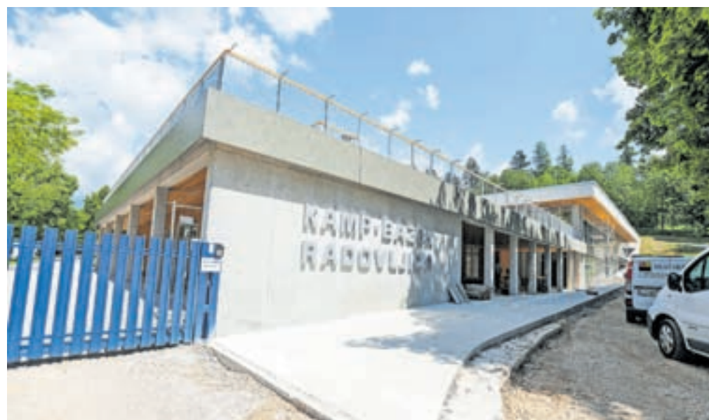
Odprtje prenovljenega kopališča bo v prihodnji petek, 16. junija.