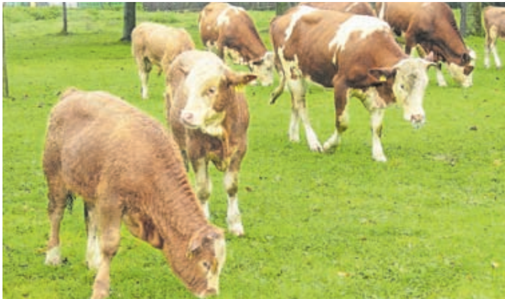
Po podatkih iz zbirnih vlog je v radovljiški občini lani redilo živino samo še 207 kmetij. Slika je simbolična.

Radovljica – »Spremembe nas silijo k nenehnemu prilagajanju. Tudi v kmetijstvu nam ne prizanašajo – od podnebnih in tržnih do ekonomskih. Na Občini Radovljica bi kmetijam radi pomagali pri prilagajanju na te spremembe,« so v vabilo na delavnice zapisali v Ragorju – Razvojni agenciji Zgornje Gorenjske, ki v skladu s predlani sprejetim razvojnim programom Občine Radovljica do leta 2030 v sodelovanju z občino, kmetijsko-gozdarsko zbornico in drugimi deležniki pripravljata strategijo razvoja kmetijstva v občini. V njej bodo prikazali sedanje stanje kmetijstva v občini, opredelili izzive, s katerimi se bodo v prihodnosti morale spoprijeti kmetije, in določili ukrepe in aktivnosti, ki bodo prispevali k ohranjanju in razvoju kmetijstva. Da bi bila strategija čim bolj realna in da bi pomagala reševati težave kmetov, so ob koncu maja na treh lokacijah v občini – v Radovljici, na Brezjah in na Lancovem – pripravili delavnice, na katere so povabili kmete. Na delavnicah so jim najprej predstavili podatke o stanju kmetijstva v občini, rezultate ankete med kmeti in novoustanovljeno lokalno akcijsko skupino BOJA – Zgor-