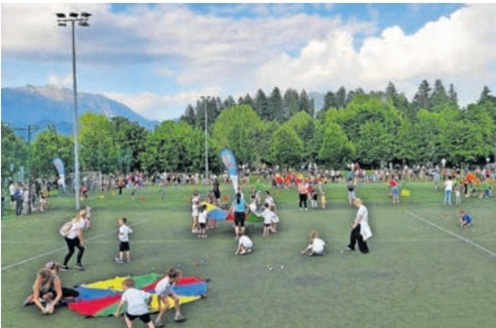
Približno 180 otrok je sodelovalo v različnih športnih panogah, prilagojenih njihovi starosti in sposobnostim.