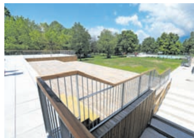
Na mestu nekdanjega vhoda v kopališče je zdaj nova restavracija s teraso.

nega kluba Radovljica Aleš Klement in upravnica kopališča, prav tako nekdanja plavalka Polona Rob. Bobinac je napovedal, da si bo OKS, ki je tudi združenje