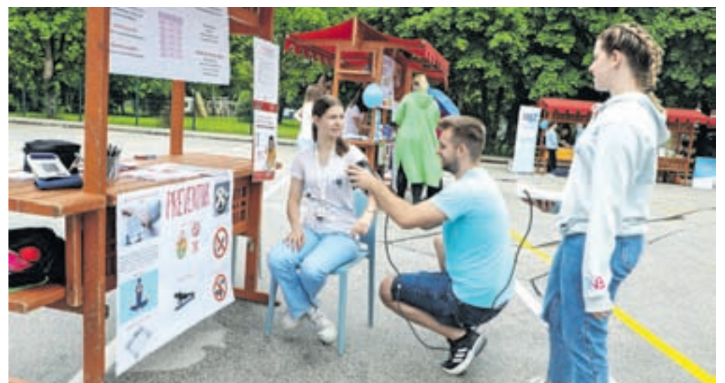
Študentje so skupaj z referenčnimi sestrami pripravili stojnico na temo visok krvni tlak.

kaže notranjost človekovega črevesa. Predstavili so tudi nove preventivne programe, ki jih bodo od jeseni izvajali pod novim imenom Center za krepitev zdravja.