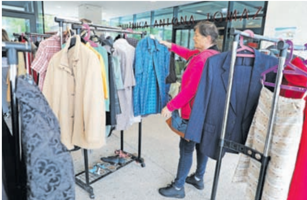
Pestra ponudba lepo ohranjenih oblačil na spomladanski izmenjevalnici, ki so jo tokrat pripravili pred vhodom v radovljiško knjižnico.

Tudi tokrat je bila izmenjevalnica odlično organizirana. Vsi, ki so prinesli oblačila, so jih ob prihodu oddali