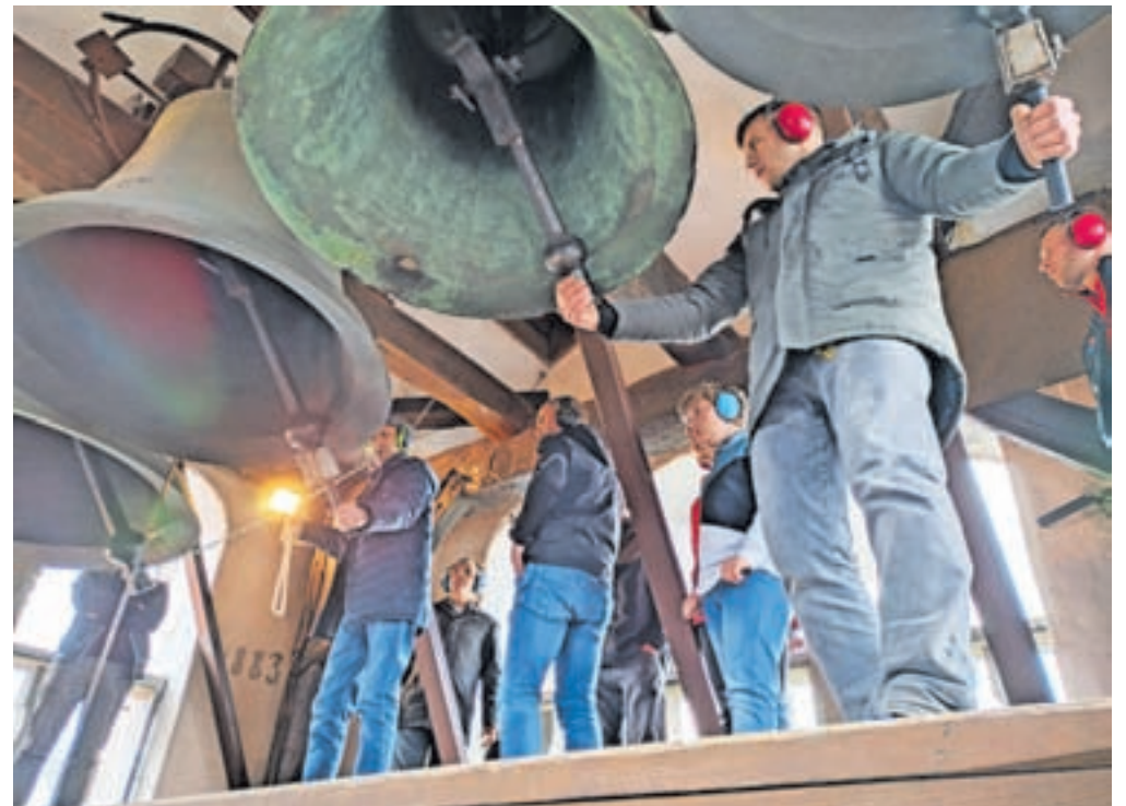
Pitrkovalci so igrali na štiri bronaste zvonove v leškem zvoniku.

Na zvonovih so tudi reliefne podobe svetniških zavetnikov in napisi. Najstarejši od zvonov je srednjemali, ki ga je leta 1758 v Kranju ulil zvonolivar Iohan Christian Rieser, preostale štiri je leta 1997 ulila livarna Perner v nemškem mestu Passau.