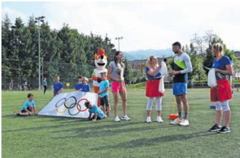
Otroke sta posebej navdušila dva vrhunska športnika, ki sta se jim pridružila, oba nosilca olimpijskih kolajn: plavalka Sara Isaković in biatlonec Jakov Fak.