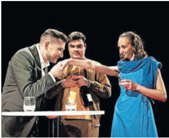
V predstavi Seksualna perverzija iz Šentjakobskega gledališča Ljubljana