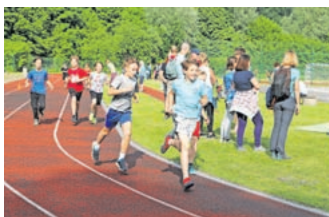
Tek za nekatere velja za pravo muko, ampak tega ni bilo mogoče opaziti v športnem parku ob šoli.