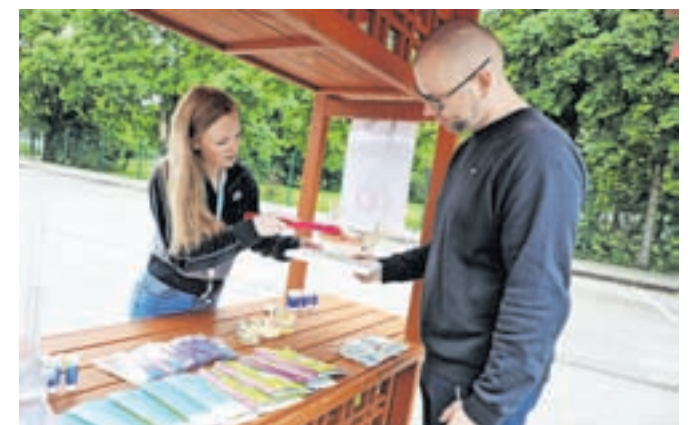
Letos so posebno pozornost posvetili tudi skrbi za ustno zdravje.

Obiskovalce so seznanili z različnimi temami s področja ohranjanja zdravja, npr. s pomenom zaščite kože pred soncem, kar so predstavile dijakinje Srednje šole Jesenice. Študentje so skupaj z referenčnimi sestrami pripravili stojnico na temo visok krvni tlak, predstavilo se je Združenje bolnikov po možganski kapi, Klub Bled. Pozornost so posvetili tudi skrbi za ustno zdravje ter promociji programa Svit za preprečevanje in zgodnje