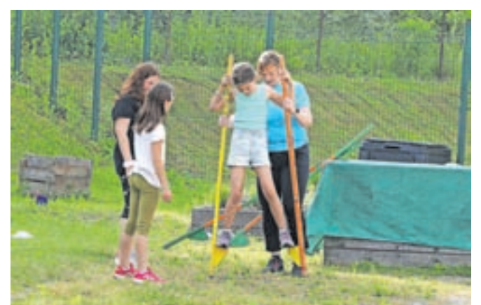
Hoja s hoduljami se je izkazala za precejšen zalogaj, vendar je ob pomoči učiteljic uspelo vsakemu.