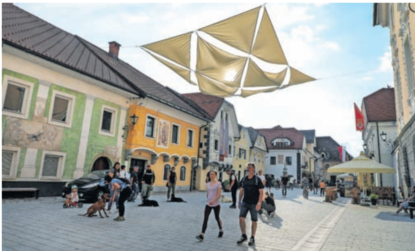
Radovljica bo še ves junij v znamenju Vurnikovih dni.