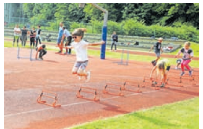
Otroci so izredno uživali v športnih aktivnostih in izrazili, da bi si tovrstnih dogodkov želeli še več.