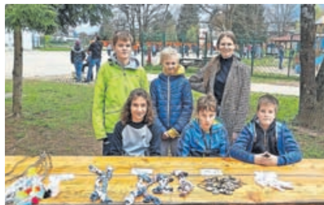
Izdelke, ki so nastali v okviru podjetniškega krožka, so prodajali na nedavni šolski dobrodelni prireditvi Radovljica otrokom.

»Letos smo izdelovali štiri različne produkte, igračke za