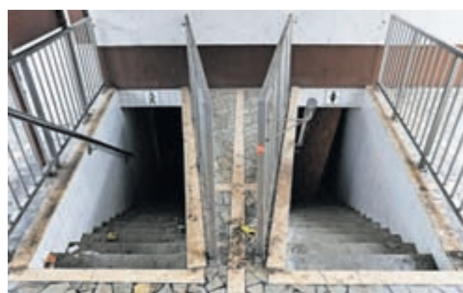
Zanemarjeno zaprto javno stranišče na radovljiški avtobusni postaji bodo zdaj vendarle prenovili.

Kot pojasnjujejo na občinski upravi, so potrebna soglasja za gradnjo že pridobili, zaključuje se izdelava projektno dokumentacije. Nove javne sanitarije naj bi začeli