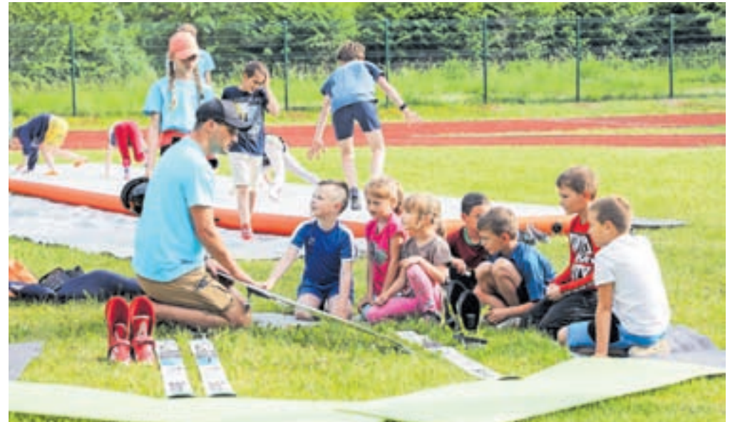
Smučarski skoki so poželi veliko zanimanja, sploh pri najmlajših.

sproščanje, učenje prve pomoči in drugo. Pri sami organizaciji dejavnosti so veliko vlogo igrali tudi zunanji izvajalci, zaradi katerih je šola lahko ponudila tako pester nabor. Sodelovali so: Atletski klub Radovljica, Skakalni klub Triglav Kranj,