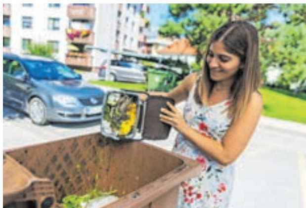
Ne pozabite – v zaboju ne mečete samo hrane, ampak tudi denar!

13. Kaj pa v lokalni? Če v gostilni ne morete pojedti naročenega, prosite natakarja, naj vam hrano zavije za domov. Z okoljskega in finančnega vidika je nedopustno, da hrano zavržemo. Ni sramotno, če meso, rižoto, kos sladice – karkoli, česar niste mogli pojedti, odnesete s seboj in pojedte, ko boste spet lačni.