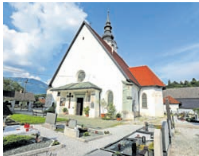
Cerkev sv. Andreja v Mošnjah je občinski svet z odlokom razglasil za spomenik lokalnega pomena.

mi največ desetih dogodkov, za vsak dogodek z največ štirimi fotografijami. Letošnja dodatna tema natečaja je Kulturno-zgodovinske znamenitosti v občini Radovljica. Na to temo avtorji lahko sodelujejo s po šestimi fotografijami. Društvo fotografije za razpis sprejema do konca januarja prihodnje leto. Najboljše fotografije bodo tako kot običajno nagrajene in razstavljene v Galeriji Avla Občine Radovljica.