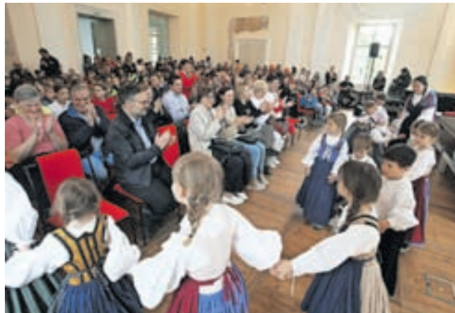
V Baročni dvorani so pripravili bogat spremljevalni program.

zavedanja lastnih korenin do raziskovanja drugih kultur po Evropi, raznolikosti in podobnosti, vse skupaj pa krepi spoštovanje svoje in drugih kultur ter sprejemanje drugačnosti.