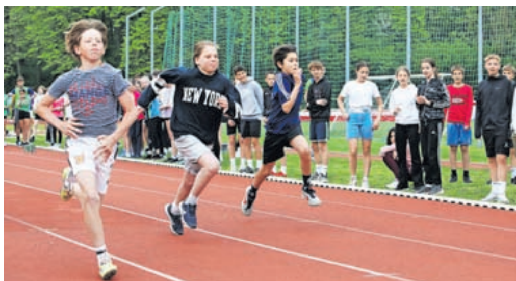
Mlajši učenci in učenke so tekmovali v teku na 60, 300 in 600 metrov, starejši pa še v teku na 1000 metrov. V štafetnem teku so lahko tekmovali skupaj.