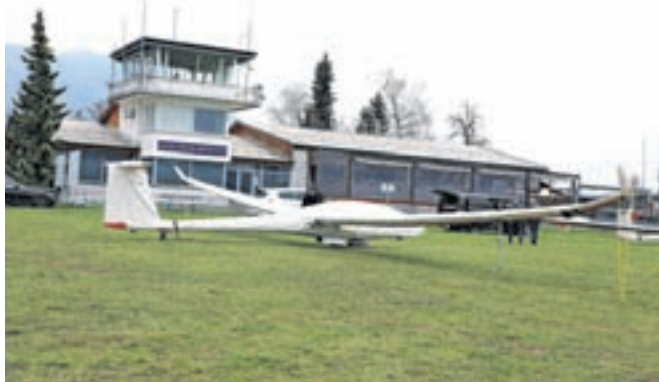
Razvoj Alpskega letalskega centra Lesce bo tudi v prihodnje enakomeren in trajnosten.

Občina Radovljica je lastnica in upraviteljica letališča oziroma Alpskega letalskega centra Lesce. »Gre za lokalno športno letališče z dolgoletno tradicijo, na katero so