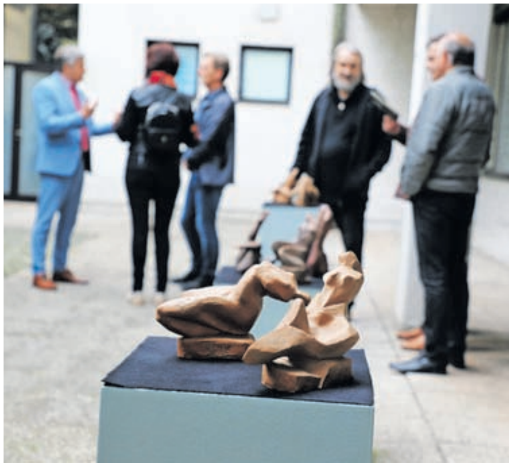
Odprtje razstave v atriju Izobraževalnega centra Radovljica prejšnji četrtek