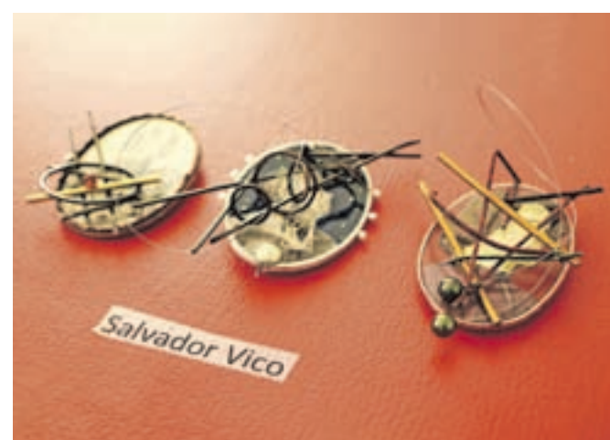
V nakit so ujete zanimive zgodbe ustvarjalcev.