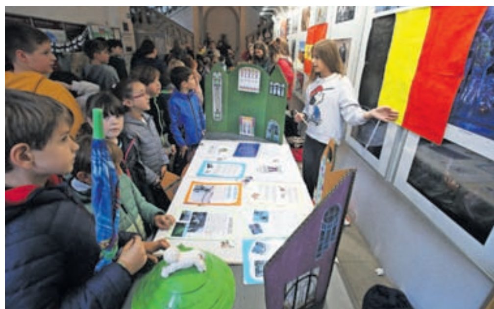
Živahno evropsko vrvenje je bilo letos zaradi dežja z Linhartovega trga predstavljeno v Radovljiško graščino.

Ob šoli gostiteljici so na prireditvi poleg vseh šol iz radovljiške občine sodelovale še OŠ dr. Josipa Plemlja Bled, OŠ Koroška Bela, OŠ Žirovnica in OŠ Franceta Prešerna Kranj, pa tudi radovljiški vrtec, knjižnica in