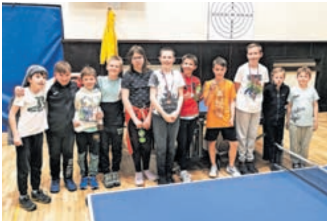
Krajani se posebej radi udeležujejo športnih tekmovanj, letos sta bili to tekmovanja v namiznem tenisu in streljanju z zračno puško.