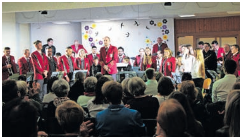
Pihalni orkester Lesce na spomladanskem koncertu

Veselijo se poslušalcev in vabijo v zabaven, sproščen in čaroben svet glasbe na pragu poletja.