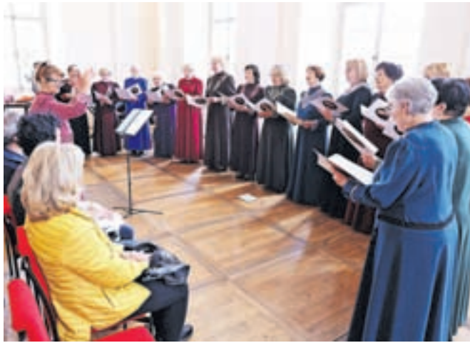
Srečanje gorenjskih upokojskih pevskih zborov je letos gostila Radovljica.

O reviji je povedala: »Bila sem počaščena, da so me povabili na funkcijo selektorice, ker resnično gojim veliko spoštovanje do ljudi, ki zavzeto in vestno pojejo tudi v obdobju, ko niso več službeno aktivni. Nekateri pojejo že vse življenje, nekateri