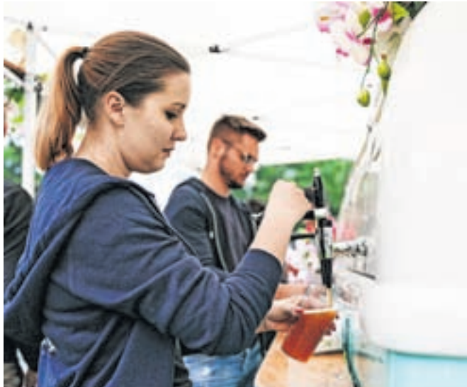
Tudi letos bo pivo točeno v kozarce za večkratno uporabo. Kozarci bodo proti plačilu na voljo na prizorišču, lahko pa uporabite tudi kozarce z lanskega festivala ali s Festivala čokolade.

V glasbenem programu se bodo zvrstile štiri zasedbe. Znani imeni s preteklih festivalov sta King Foo in Kilderface, prvič pa se bodo v Radovljici predstavili Kočev-