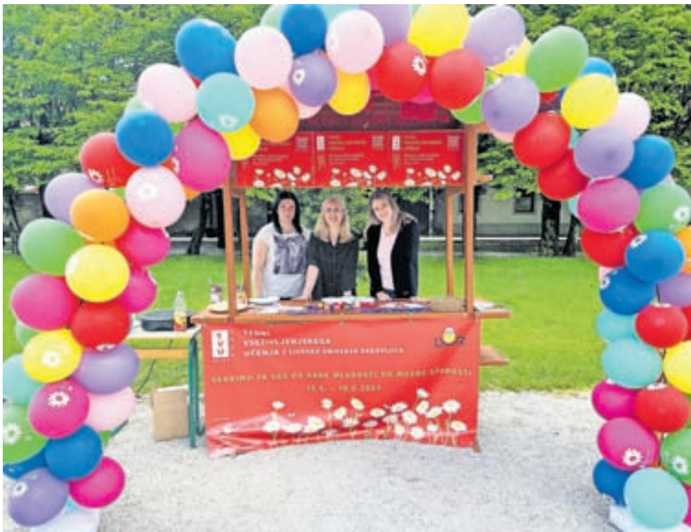
Med koordinatorji letošnjega Tedna vseživljenjskega učenja je tudi Ljudska univerza Radovljica.

Tedni vseživljenjskega učenja potekajo od sredine maja do sredine junija in so najvidnejša kampanja na področju izobraževanja in učenja v Sloveniji. Projekt usklajujejo v Andragoškem centru Slovenije in ga prirejajo v so-