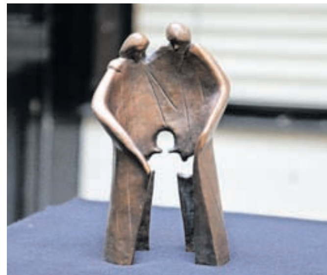
Sveta družina, ena najbolj znanih Kolmanovih skulptur, v originalni velikosti stoji v neposredni bližini Bazilike Marije Pomagaj na Brezjah.

Slovesnosti sta se poleg številnih ljubiteljev Kolmanovega ustvarjanja udeležila tudi njegova soproga in sin.