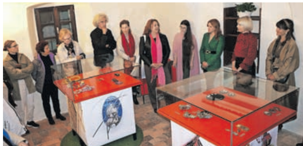
V Šivčevi hiši je svoj nakit razstavilo deset umetnikov, oblikovalcev nakita. Tematsko so izbrali tradicijo v nakitu v sedanjosti in preteklosti.