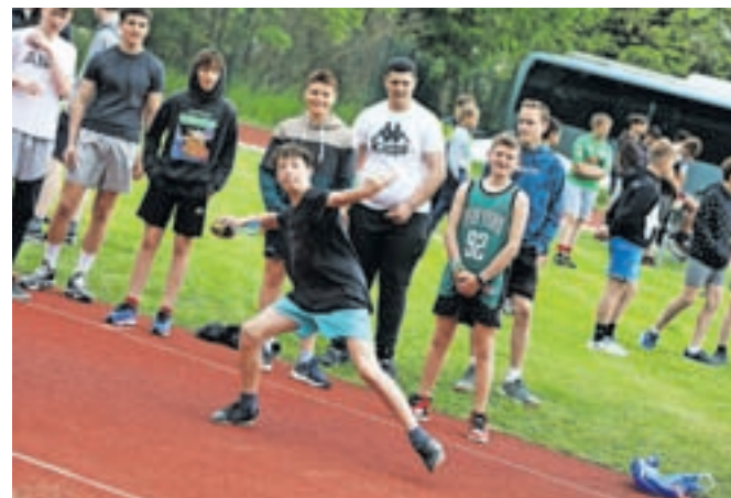
Učenci so se pomerili v različnih disciplinah, med drugim v metu vorteksa.