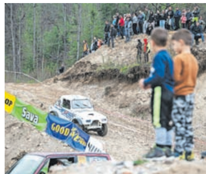
Petnajsta izvedba dogodka Slovenija OffRoad letos pod organizacijo Off Road Cluba White Tiger