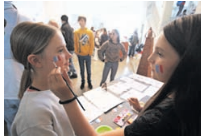
Prav vse šole so se potrudile, da so države predstavile na privlačen in zanimiv način.