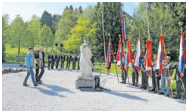
Žrtvam so se poklonili s polaganjem venca.